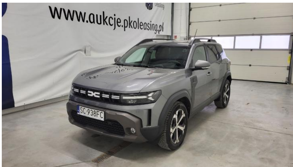
Photo 1. Przekątna przednia lewa