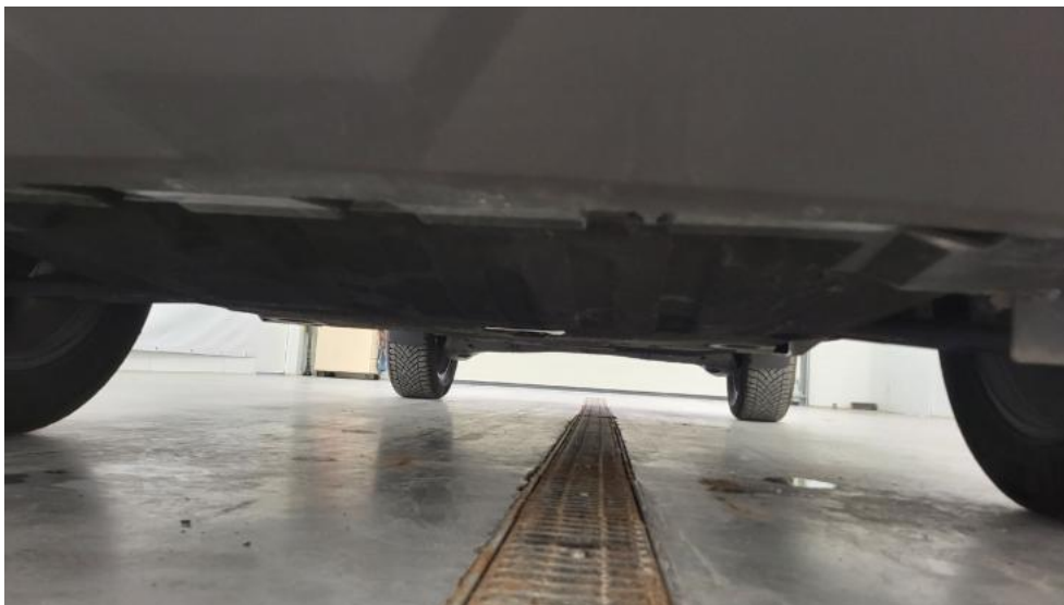
Photo 13. Spód pojazdu przód