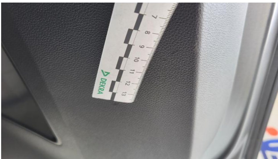
Photo 48. Wykładzina pokrywy tylnej - Rysa/odprysk 1