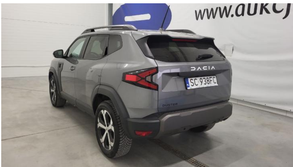
Photo 8. Przekątna tylna lewa