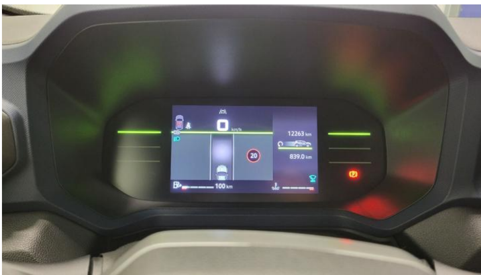
Photo 23. Zestaw wskaźników - przebieg