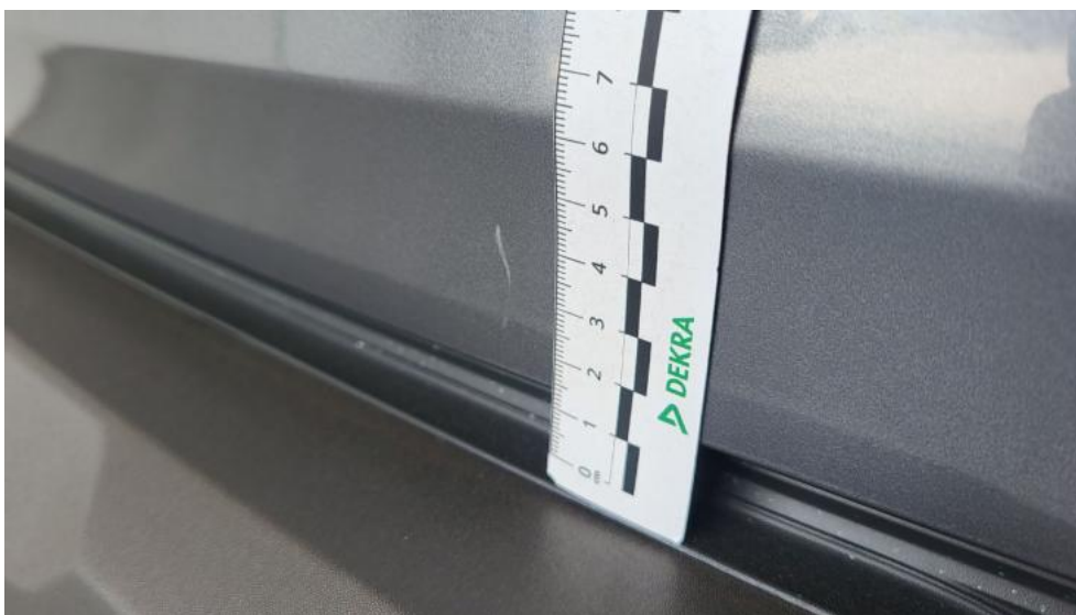
Photo 45. Pokrywy bagażnika - Rysa/odprysk 1