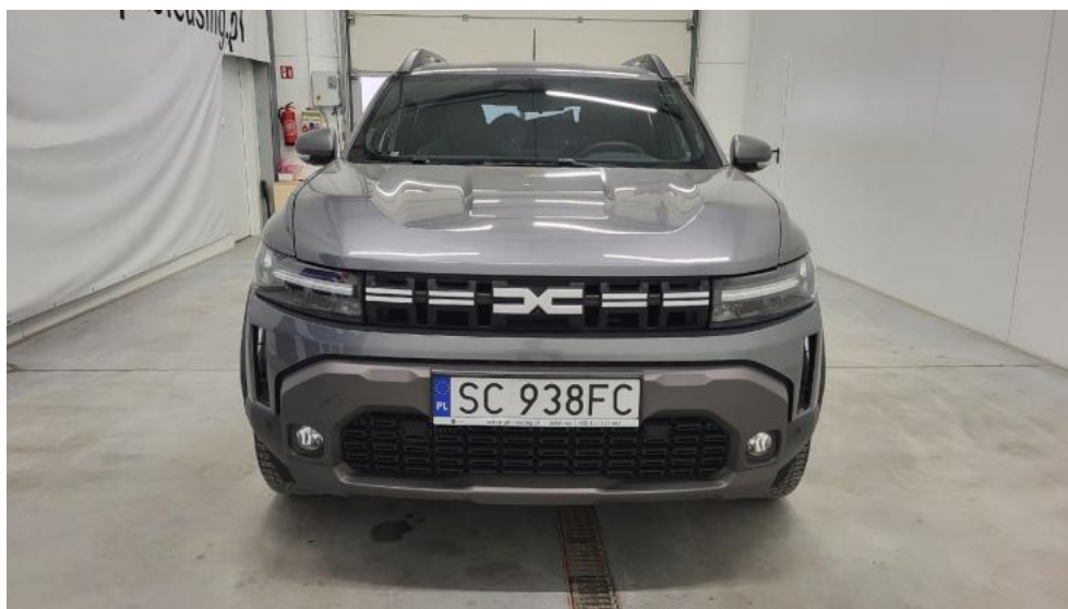
Photo 2. Przód