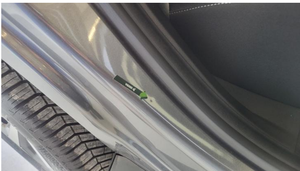
Photo 44. Błotnik tylny P / Ściana boczna P - Wgniecenie/odkształcenie 1