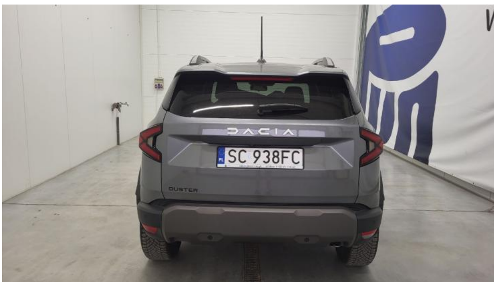
Photo 7. Tyl