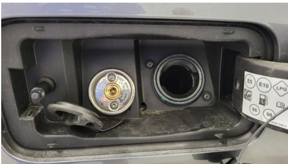
Photo 36. Gniazdo ładowania / tankowania