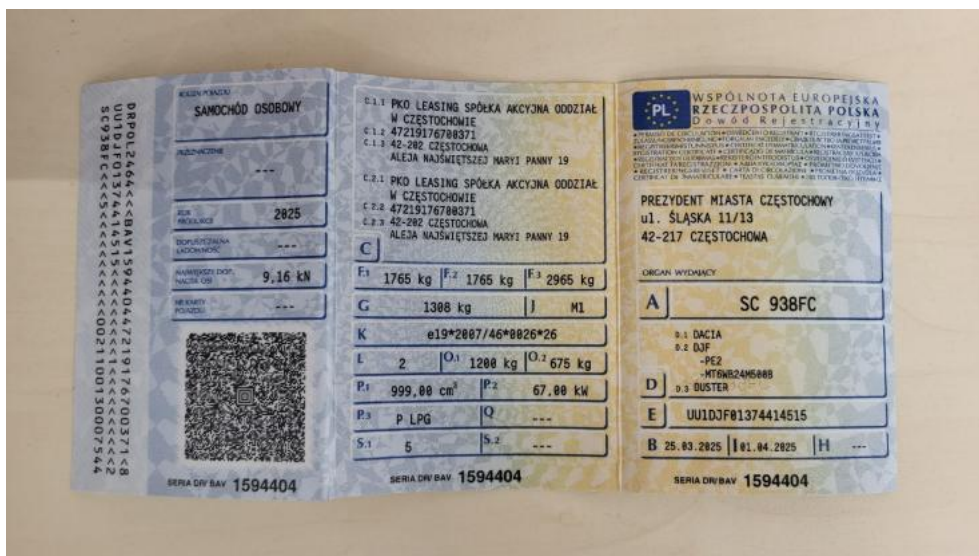
Photo 32. Dowód rej. Str. 1