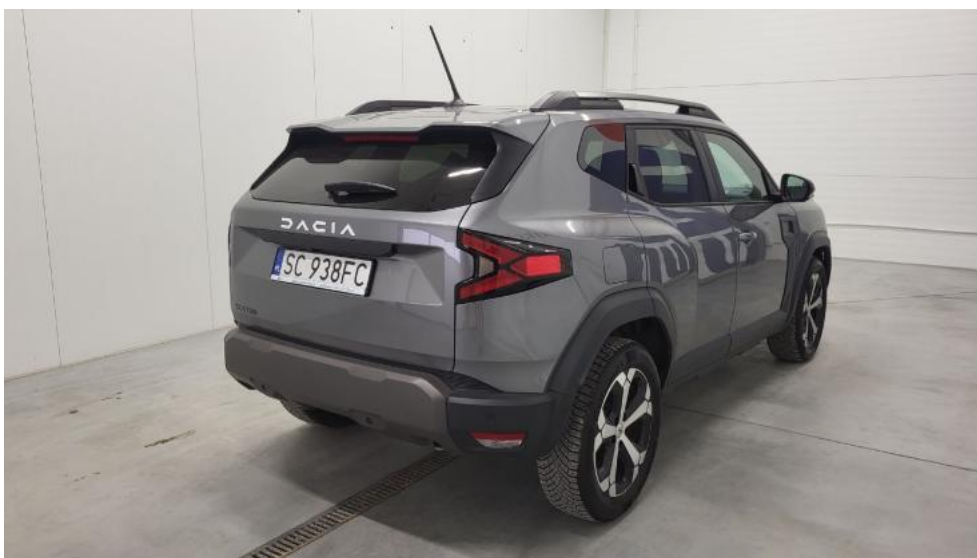
Photo 6. Przekątna tylna prawa