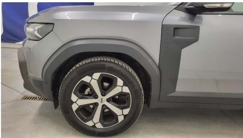
Photo 10. Bok lewy z przodu