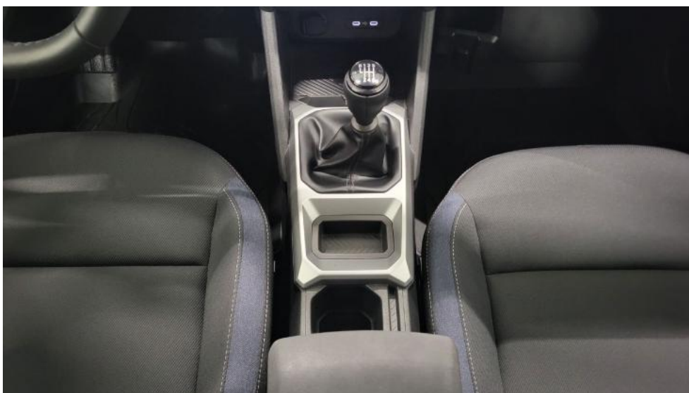
Photo 30. Tunel środkowy