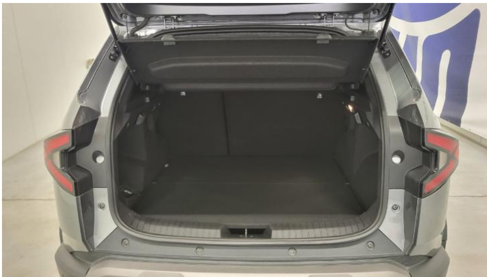
Photo 19. Bagażnik