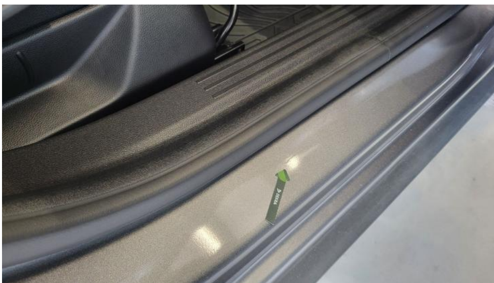
Photo 43. Próg P - Wgniecenie/odkształcenie 1