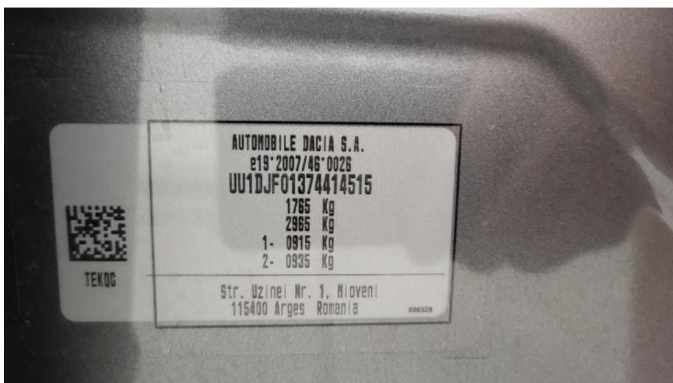
Photo 22. Tabliczka znamionowa