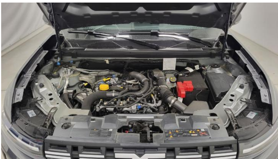
Photo 20. Komora silnika