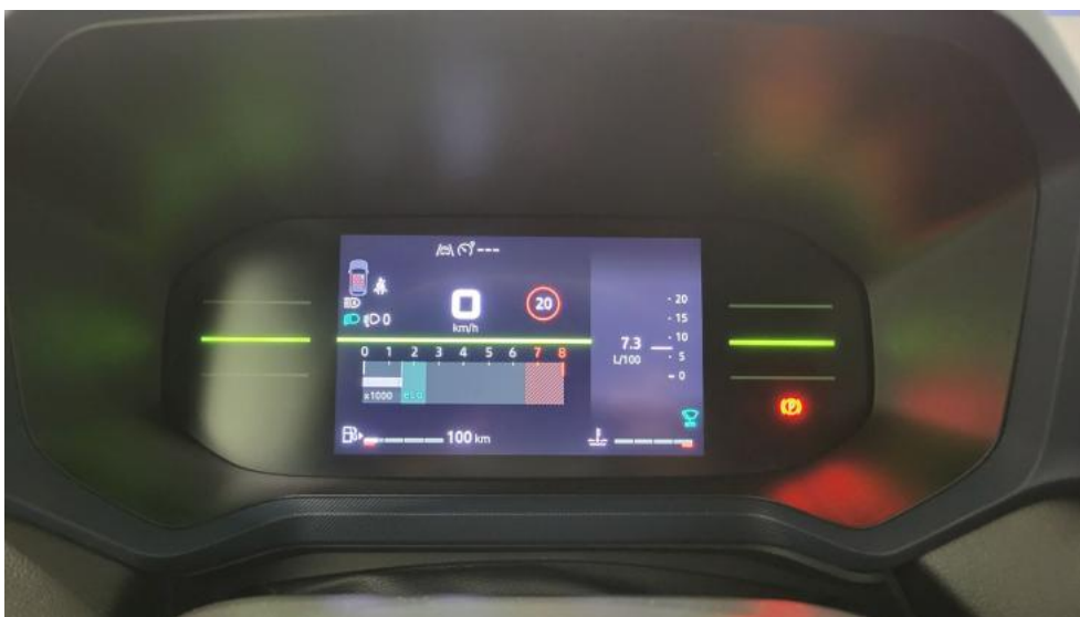
Photo 24. Zestaw wskaźników - serwis