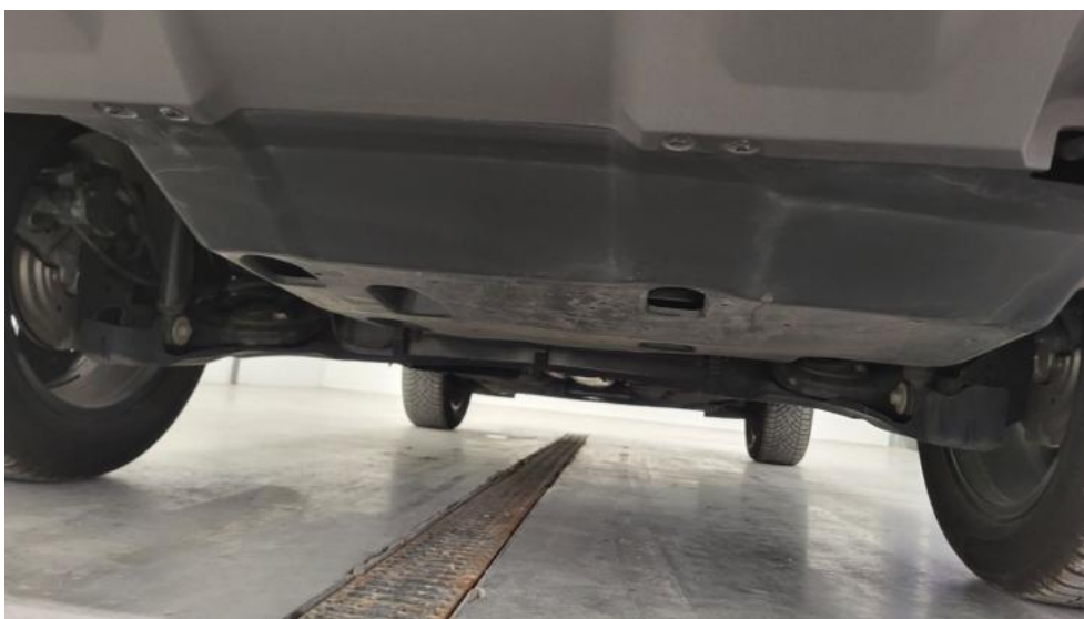
Photo 14. Spód pojazdu tył