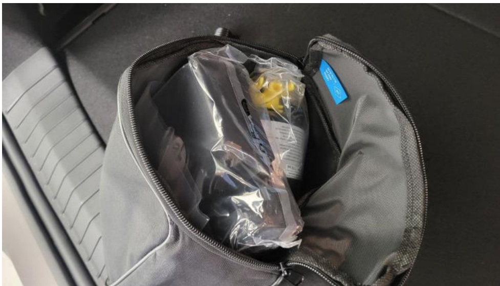
Photo 35. Zestaw naprawczy koła