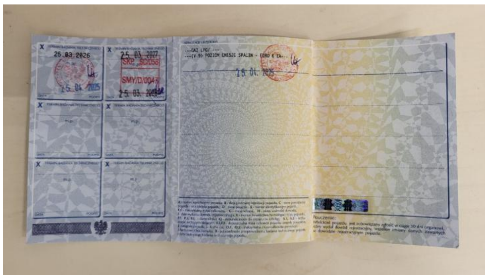
Photo 34. Dowód rej. str. 2