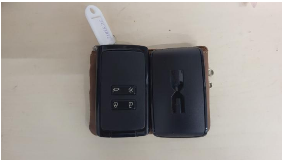
Photo 37. Kluczyki