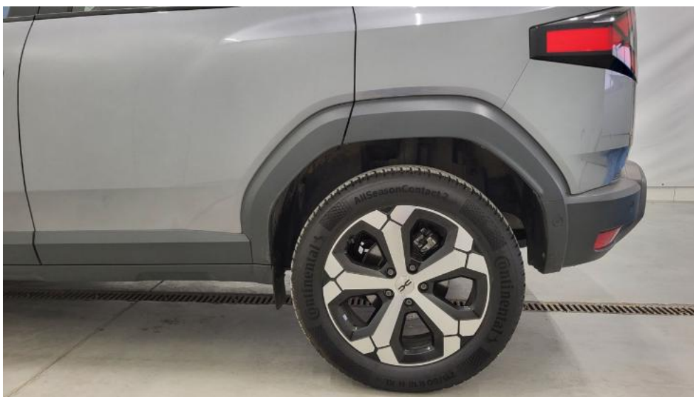
Photo 9. Bok lewy z tyłu