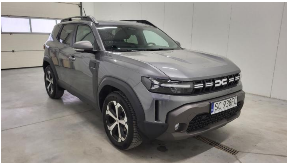
Photo 3. Przekątna przednia prawa