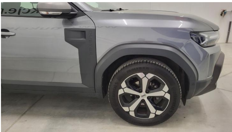
Photo 4. Bok prawy z przodu