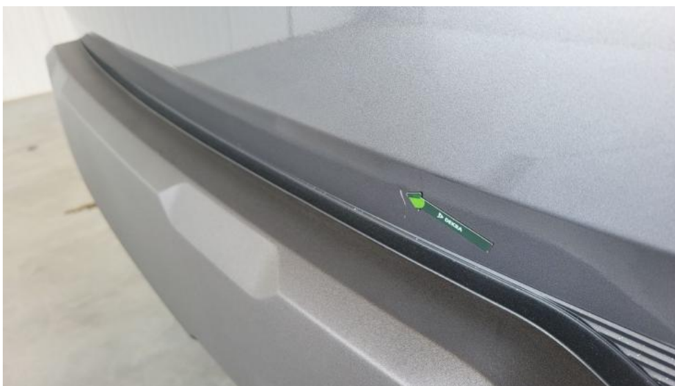
Photo 46. Pokrywy bagażnika - Wgniecenie/odkształcenie 1