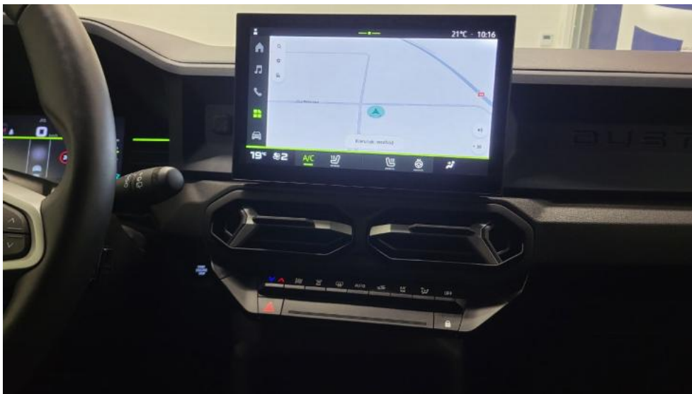
Photo 29. Konsola środkowa