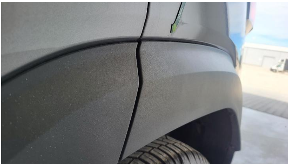
Photo 47. Błotnik tylny L / Ściana boczna L - Wgniecenie/odkształcenie 1