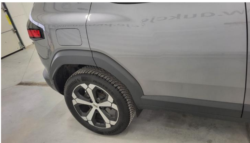
Photo 5. Bok prawy z tyłu