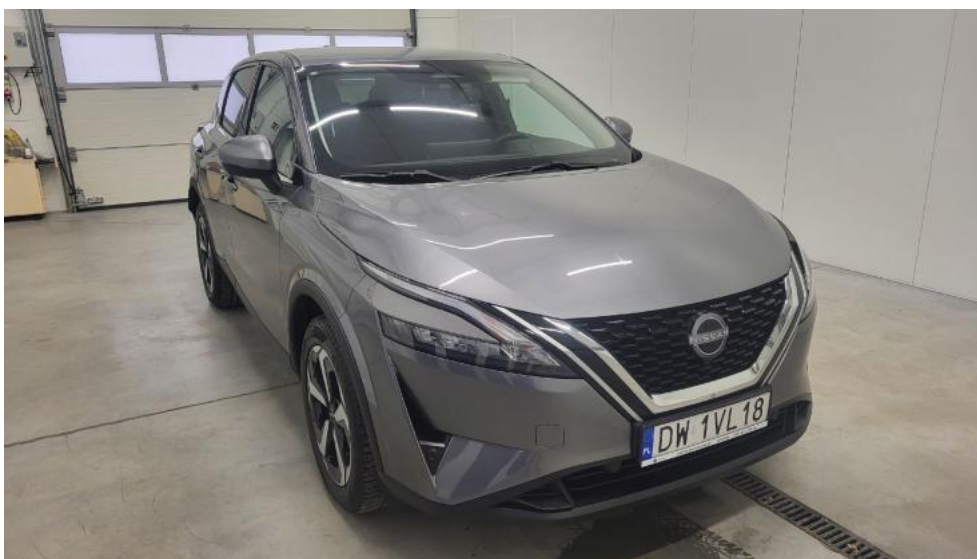
Photo 3. Przekątna przednia prawa