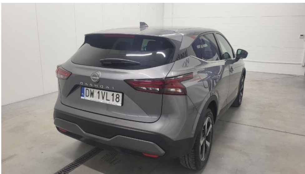
Photo 6. Przekątna tylna prawa