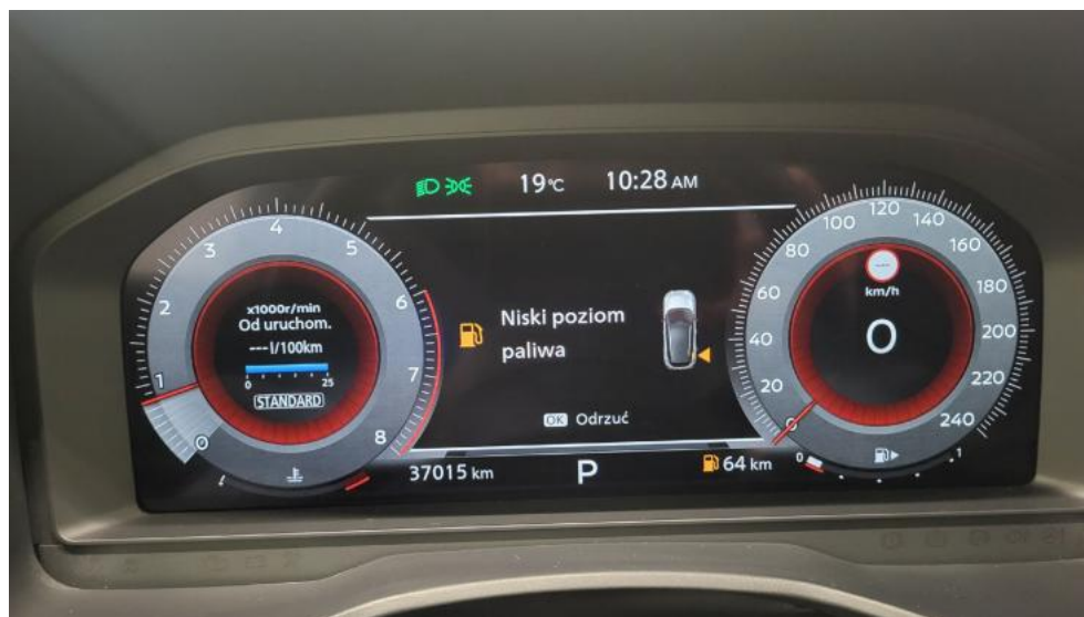
Photo 24. Zestaw wskaźników - przebieg