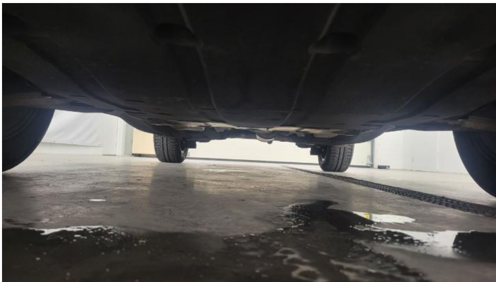
Photo 13. Spód pojazdu przód