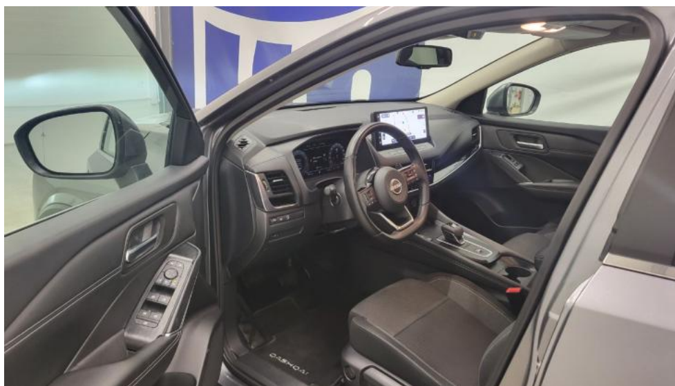
Photo 26. Widok przez otwarte drzwi przednie lewe