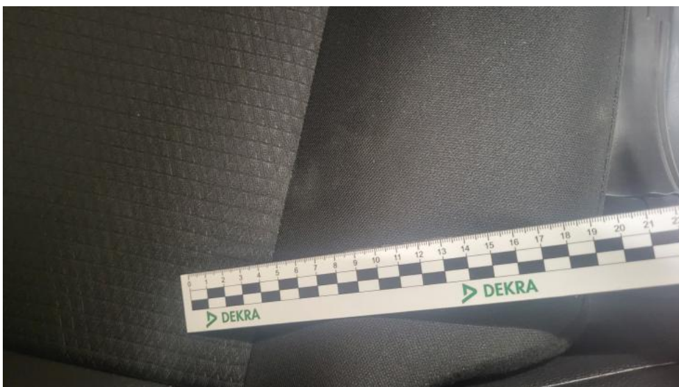
Photo 38. Kanapa tyl. - Inne 1