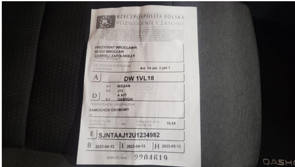
Photo 33. Dow. rej. ksero Str. 1