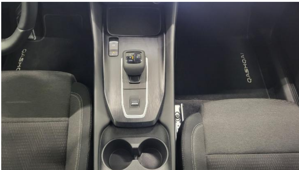
Photo 31. Tunel środkowy