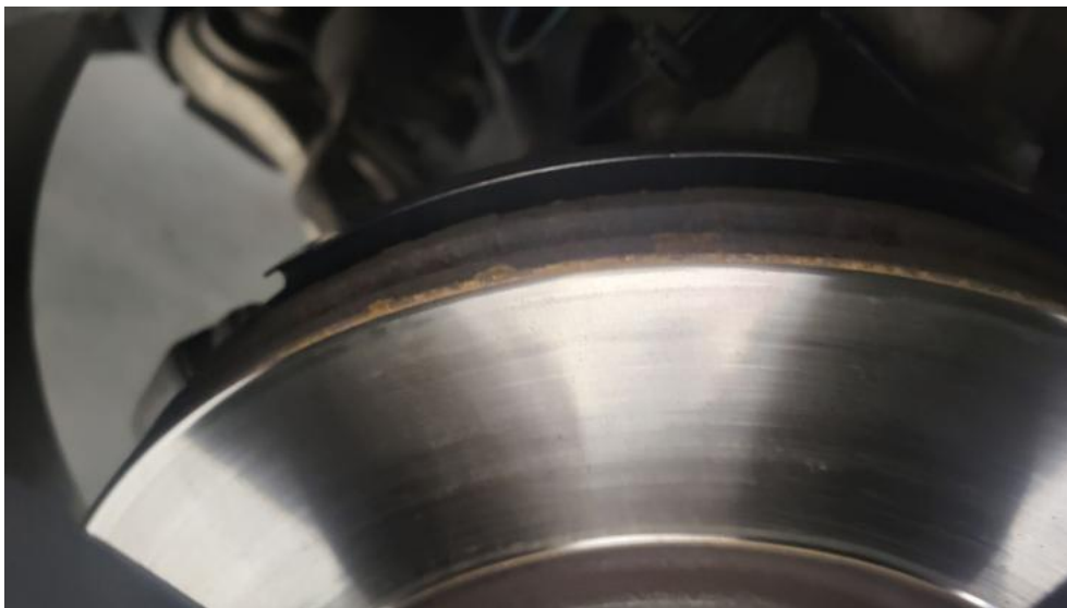
Photo 15. Tarcza hamulcowa przednia prawa