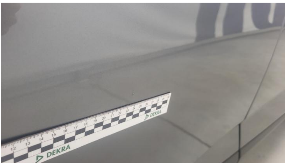
Photo 36. Drzwi tylne P - Rysa/odprysk 1