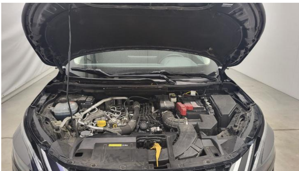
Photo 21. Komora silnika