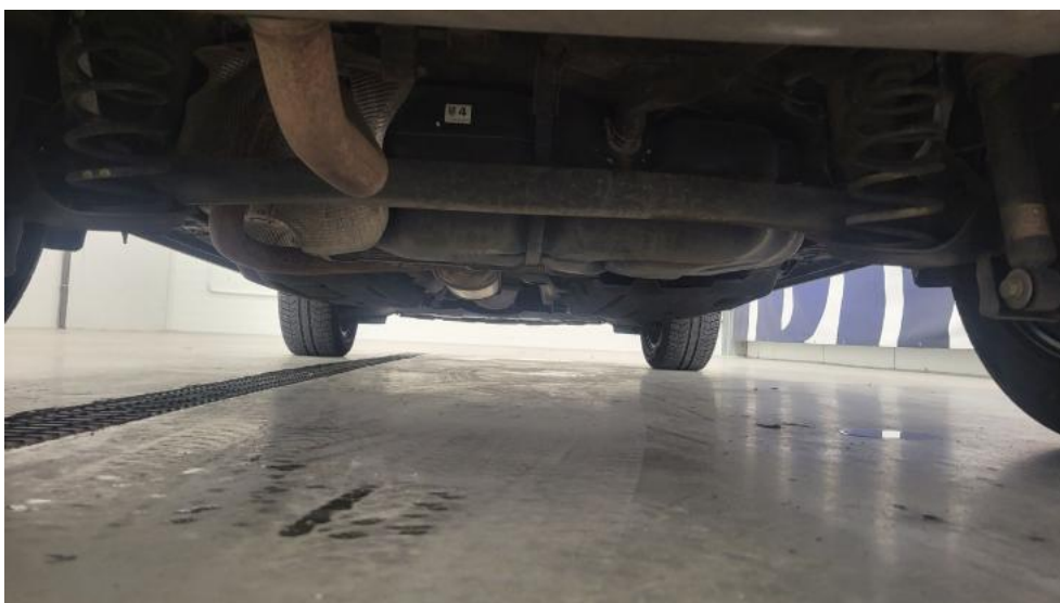
Photo 14. Spód pojazdu tył