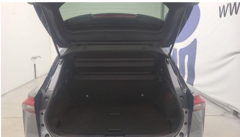
Photo 19. Bagażnik