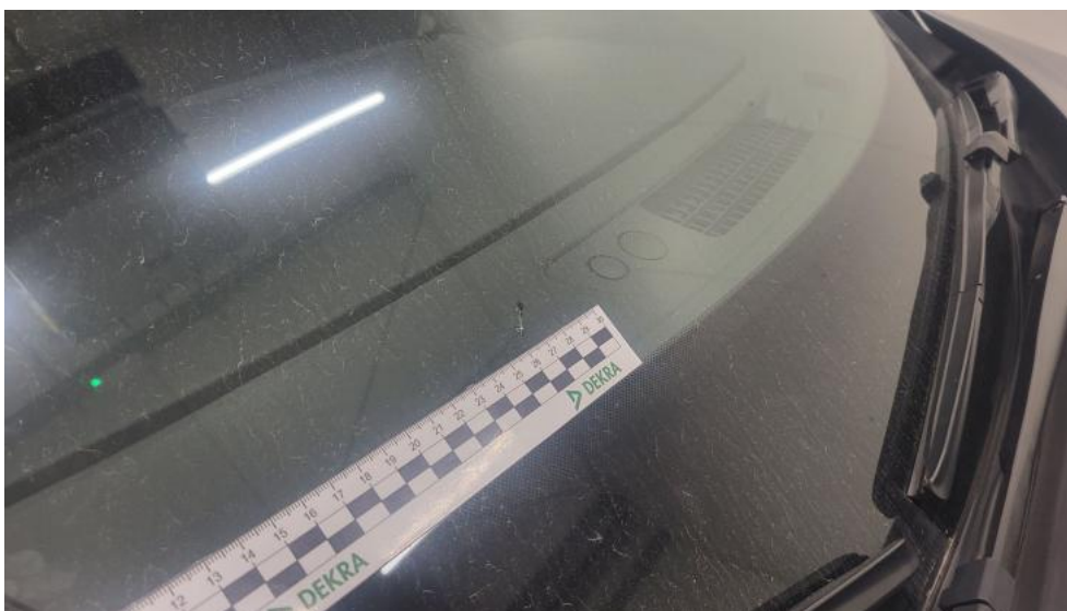
Photo 35. Szyba czołowa - Pęknięcie/rozerwanie 1