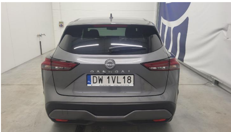
Photo 7. Tyl