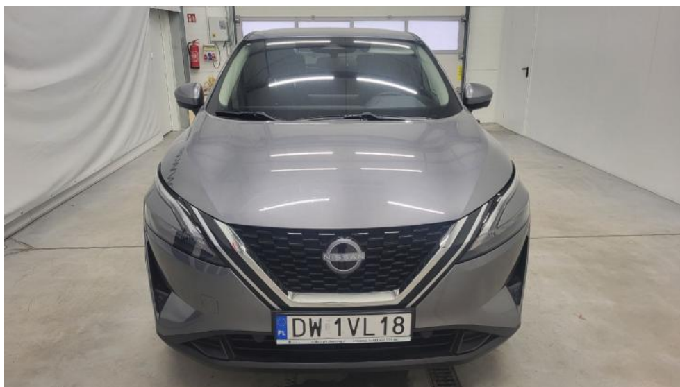
Photo 2. Przód