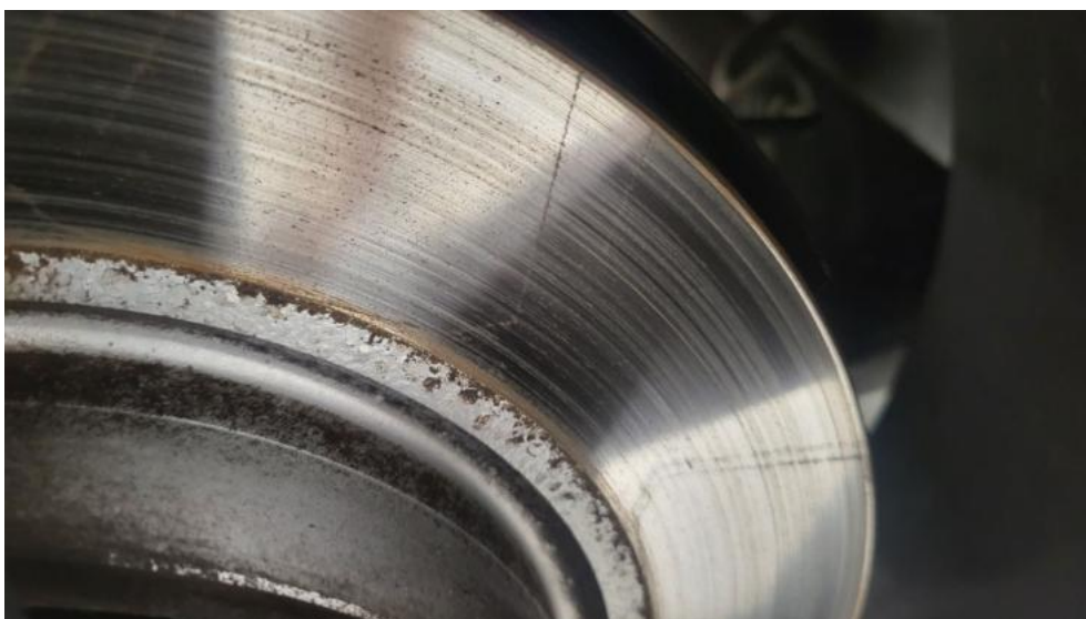
Photo 16. Tarcza hamulcowa tylna prawa