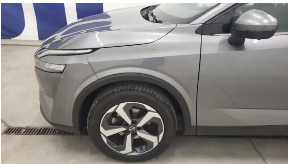
Photo 10. Bok lewy z przodu