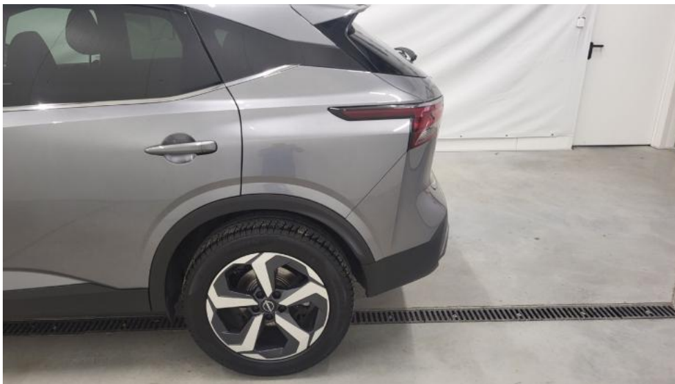
Photo 9. Bok lewy z tyłu