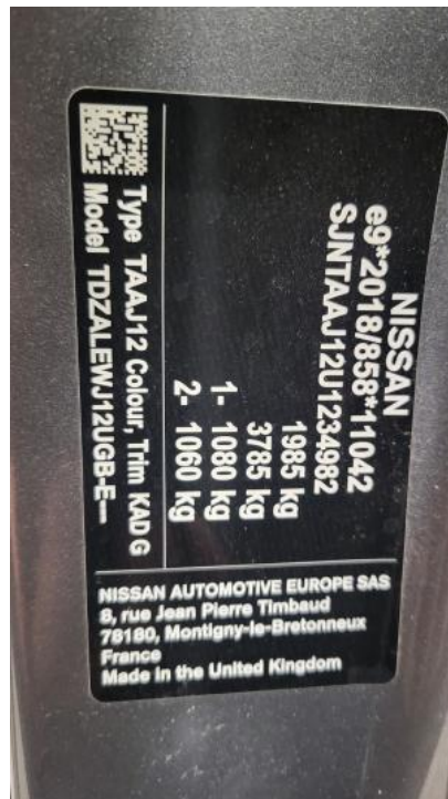
Photo 23. Tabliczka znamionowa