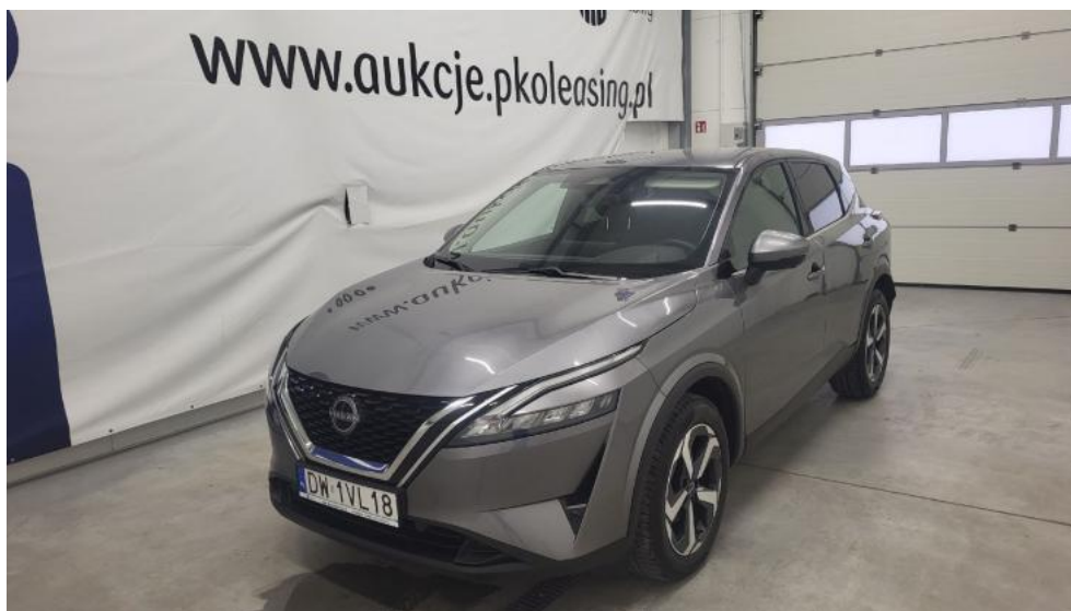
Photo 1. Przekątna przednia lewa