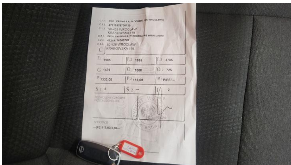
Photo 34. Dow. Rej. ksero Str.2 i klucze