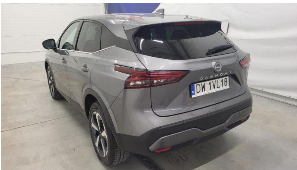
Photo 8. Przekątna tylna lewa