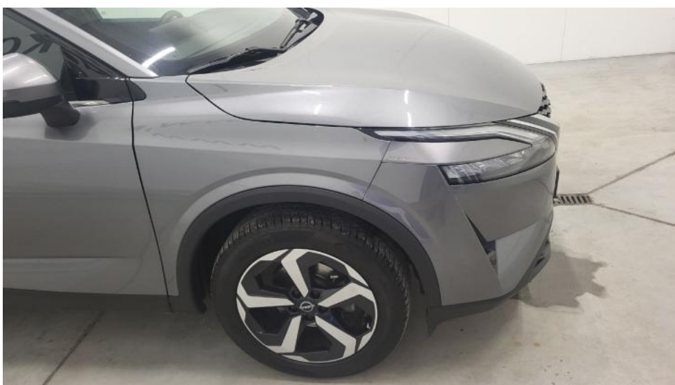
Photo 4. Bok prawy z przodu