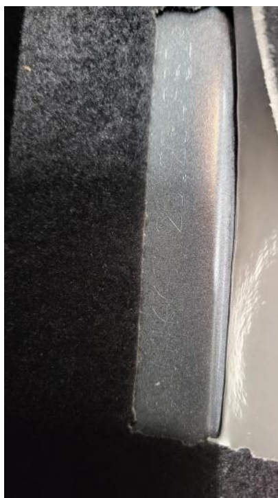
Photo 22. Numer identyfikacyjny