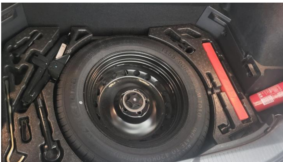
Photo 20. Koło zapasowe