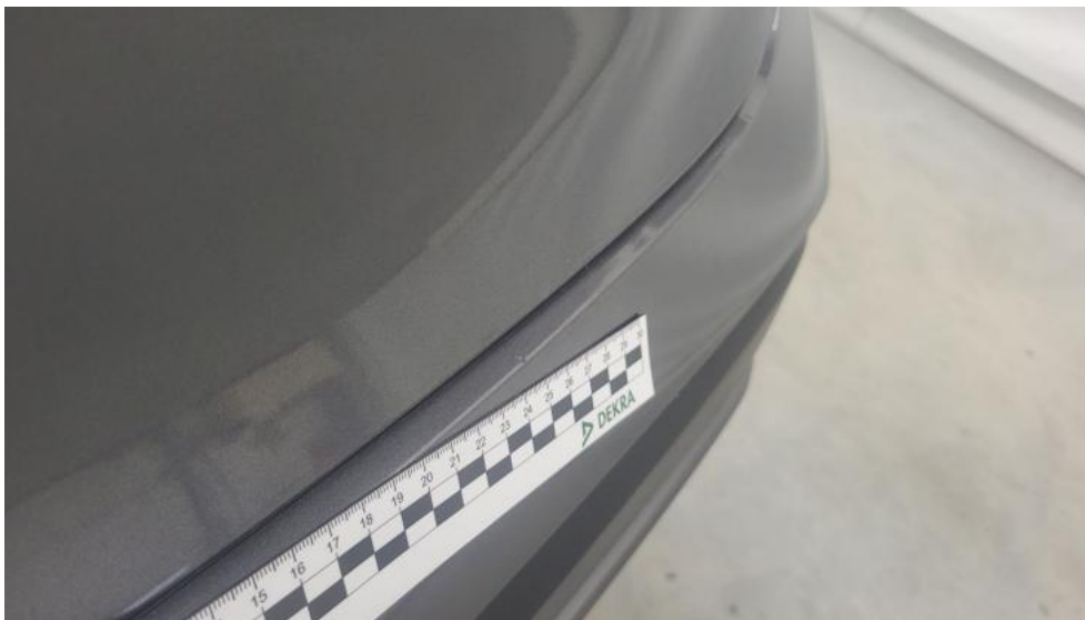
Photo 37. Zderzak tylny - Rysa/odprysk 1