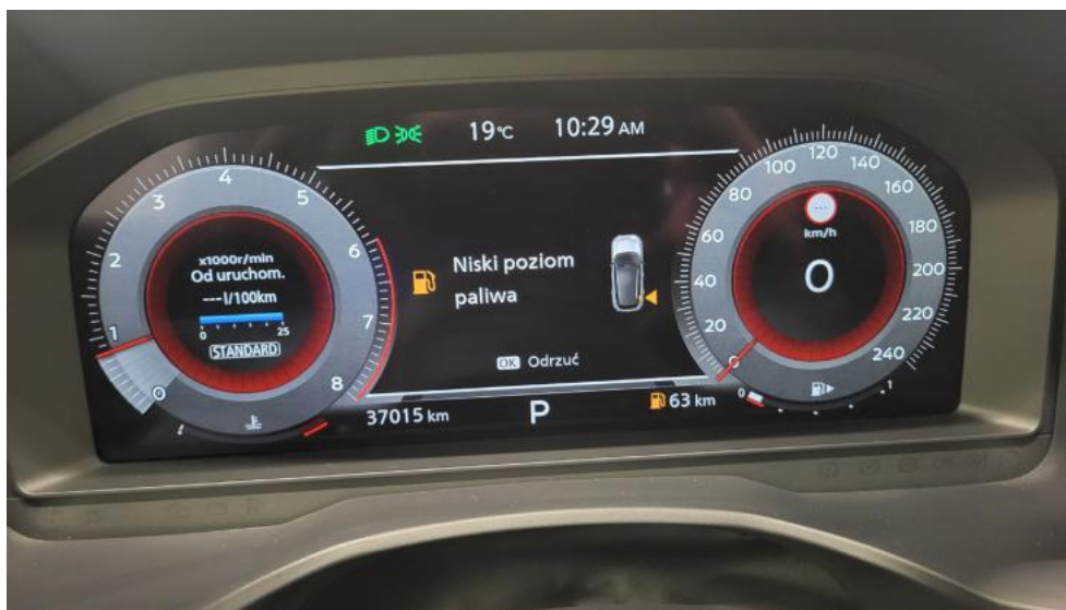
Photo 25. Zestaw wskaźników - serwis