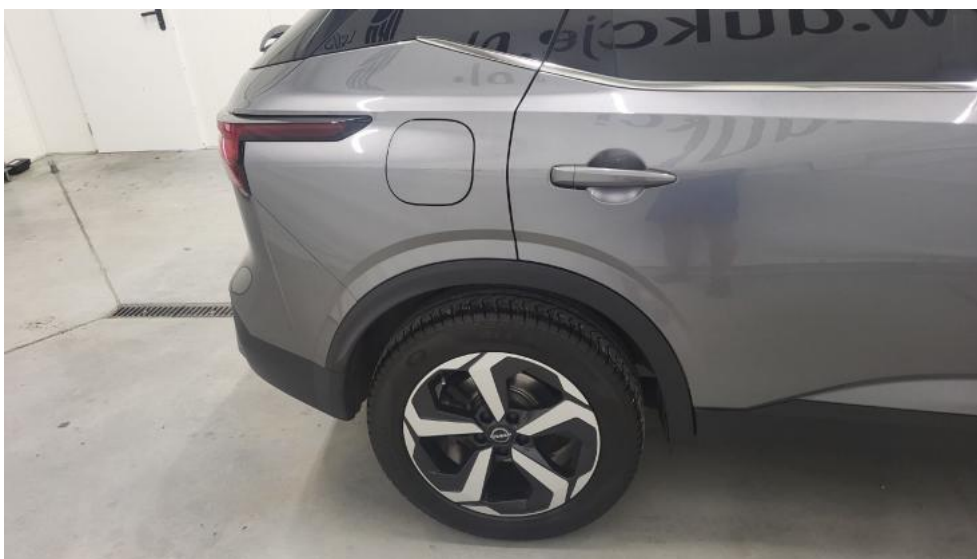
Photo 5. Bok prawy z tyłu