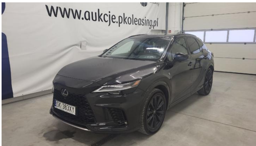
Fot. 1. Przekątna przednia lewa