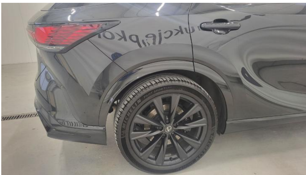
Fot. 5. Bok prawy z tyłu