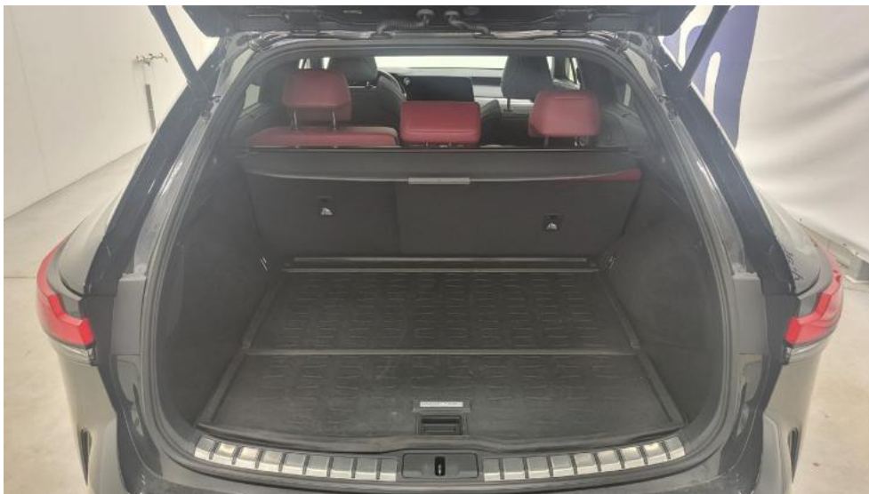
Fot. 19. Bagażnik