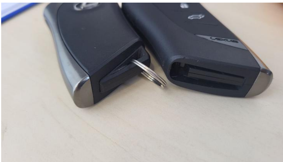
Fot. 39. Zdjęcie do protokołu