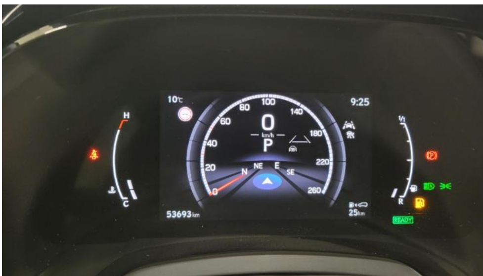
Fot. 24. Zestaw wskaźników - przebieg