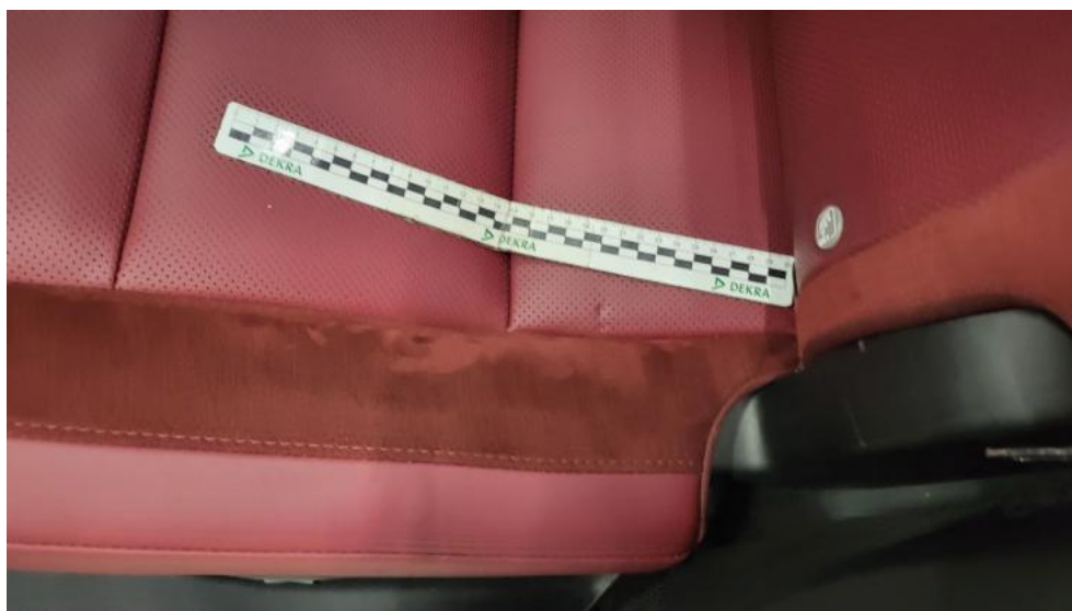
Fot. 54. Kanapa tyl. - Wgniecenie/odkształcenie 1