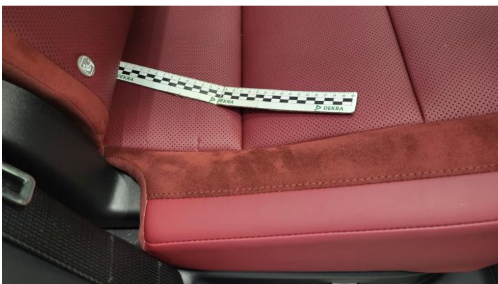
Fot. 56. Kanapa tyl. - Inne 2