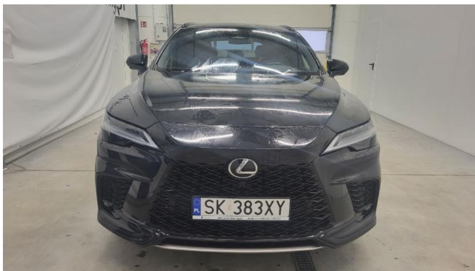
Fot. 2. Przód