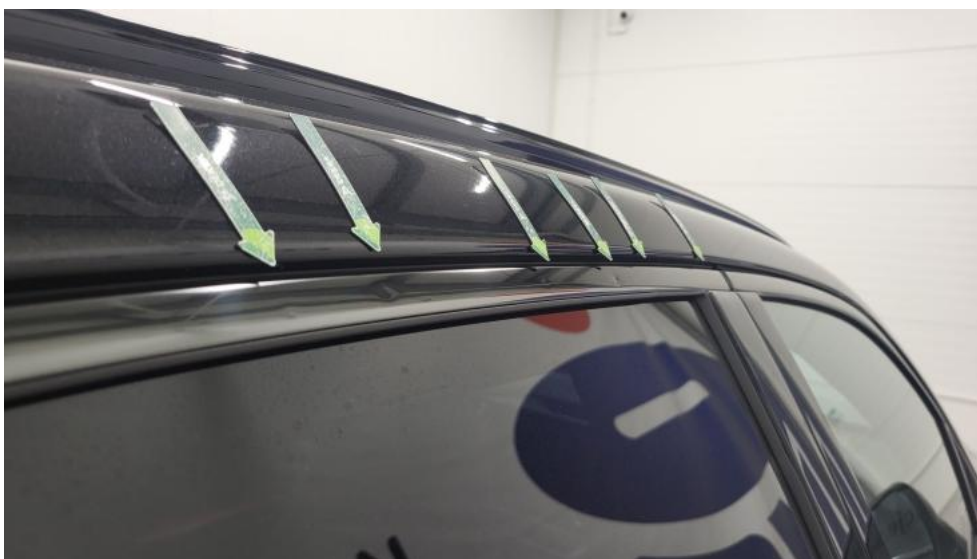
Fot. 49. Drzwi tylne P - Wgniecenie/odkształcenie 1