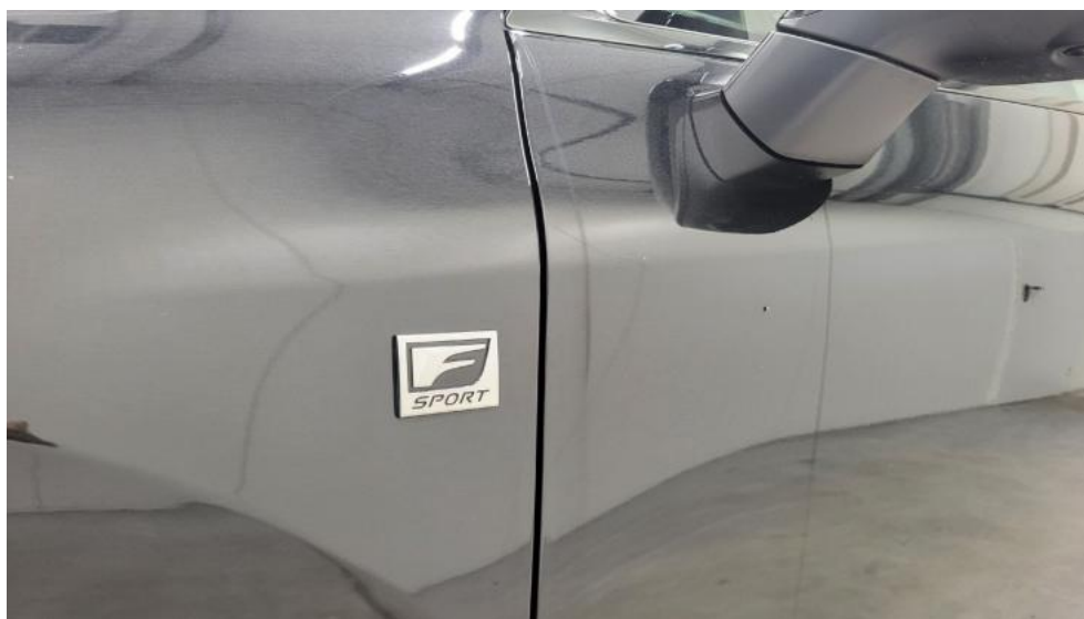
Fot. 37. Zdjęcie do protokołu