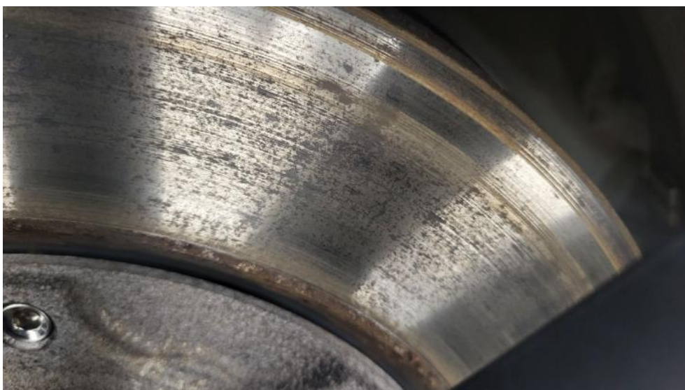
Fot. 18. Tarcza hamulcowa przednia lewa