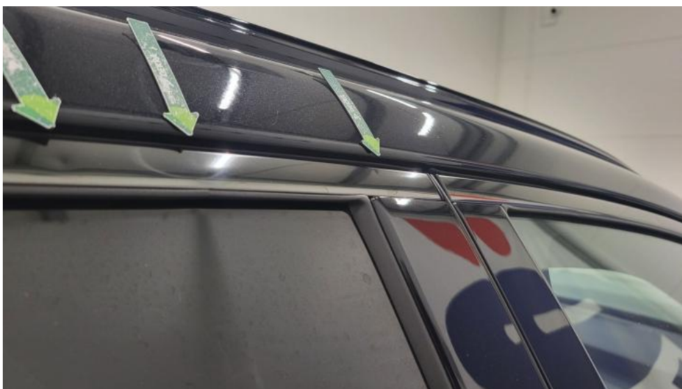
Fot. 51. Drzwi tylne P() - Wgniecenie/odkształcenie 3