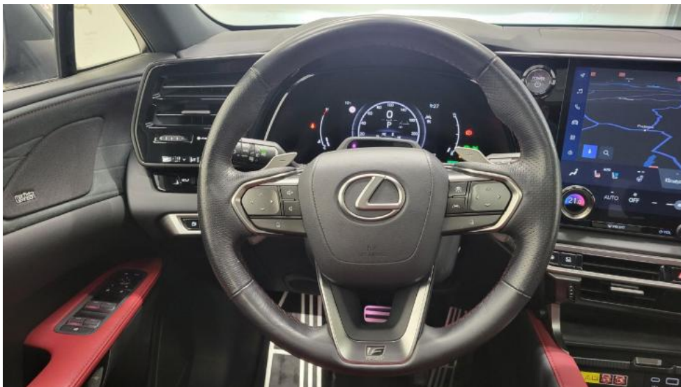
Fot. 31. Kierownica (na wprost)