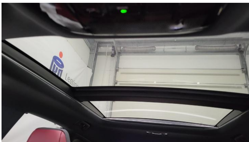
Fot. 38. Zdjęcie do protokołu