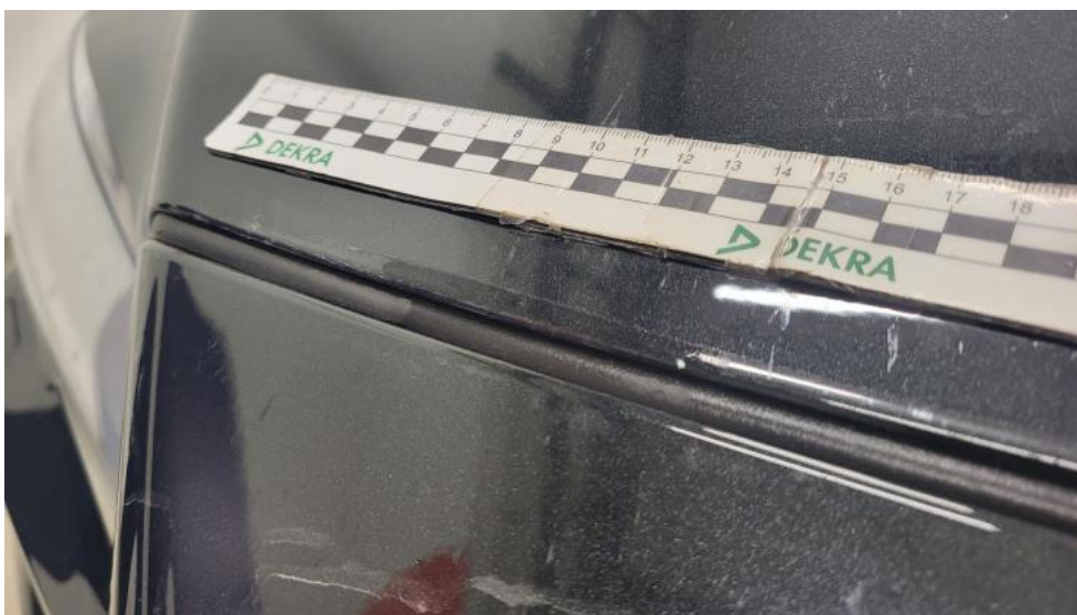
Fot. 40. Pokrywa komory silnika - Rysa/odprysk 1