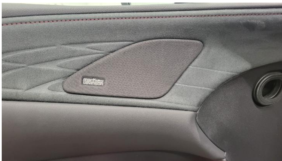
Fot. 36. Zdjęcie do protokołu