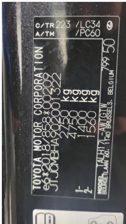
Fot. 23. Tabliczka znamionowa