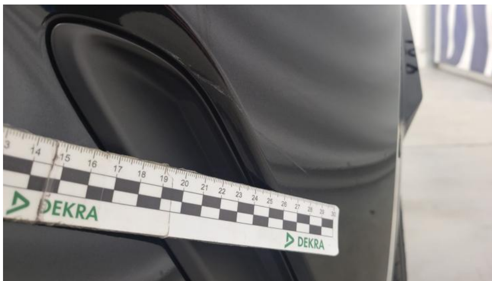
Fot. 53. Zderzak tylny - Rysa/odprysk 2