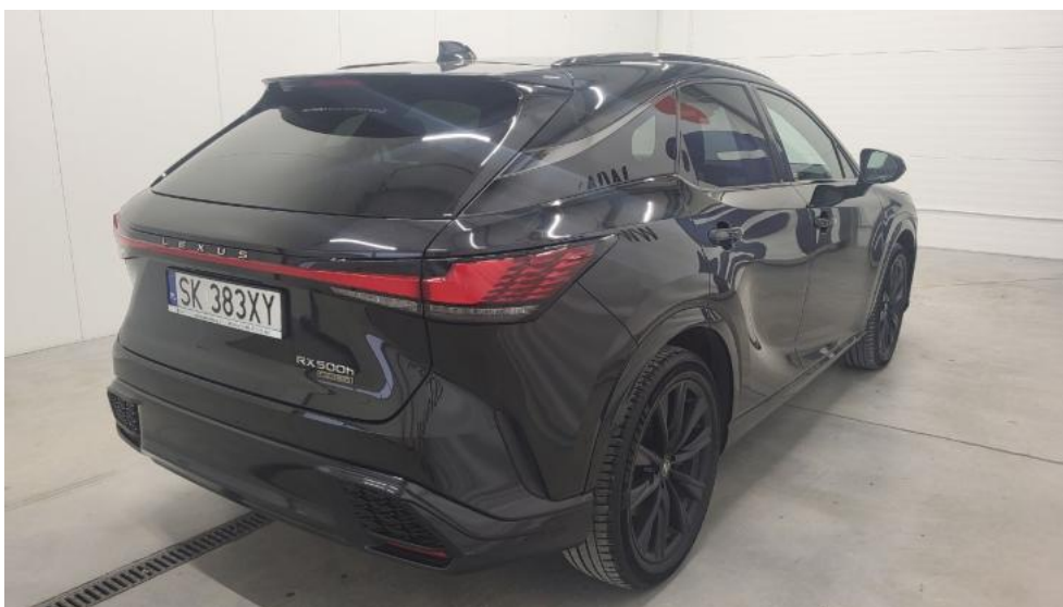
Fot. 6. Przekątna tylna prawa