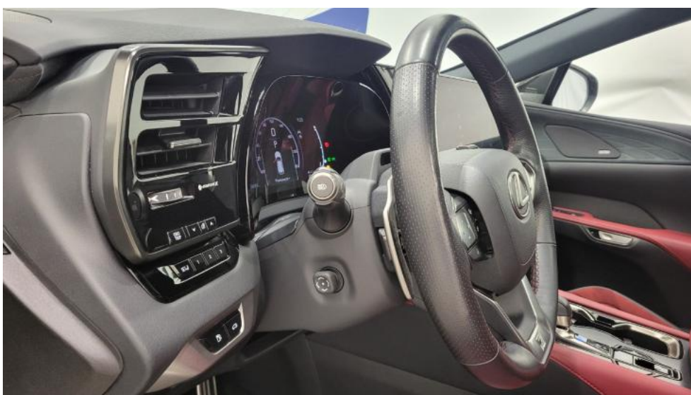
Fot. 26. Kierownica z lewej strony