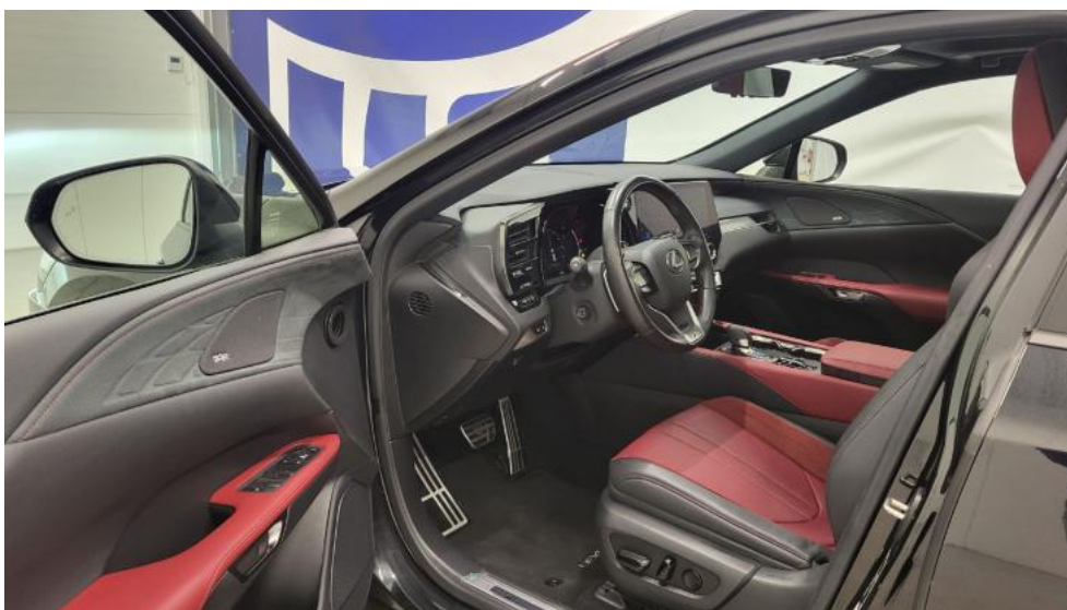
Fot. 25. Widok przez otwarte drzwi przednie lewe