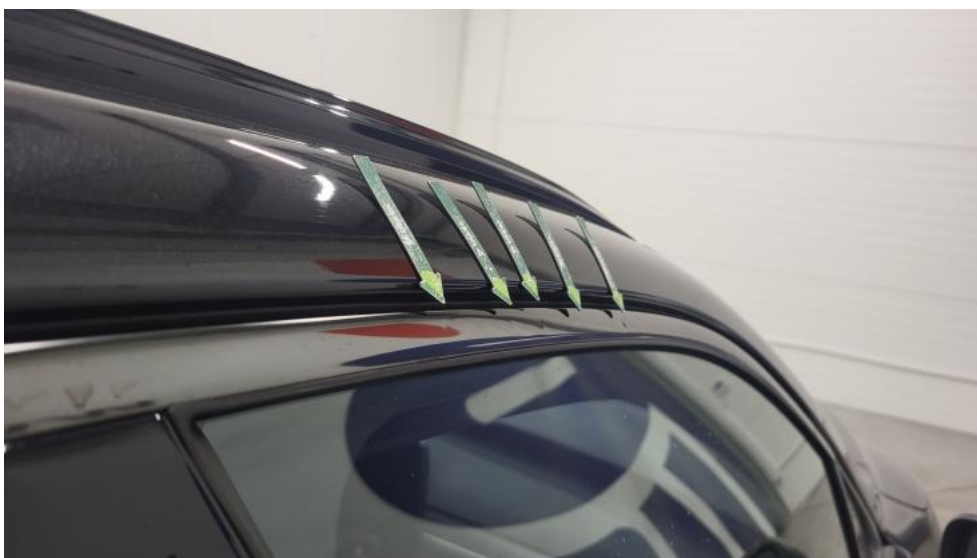
Fot. 48. Drzwi przednie P() - Wgniecenie/odkształcenie 3