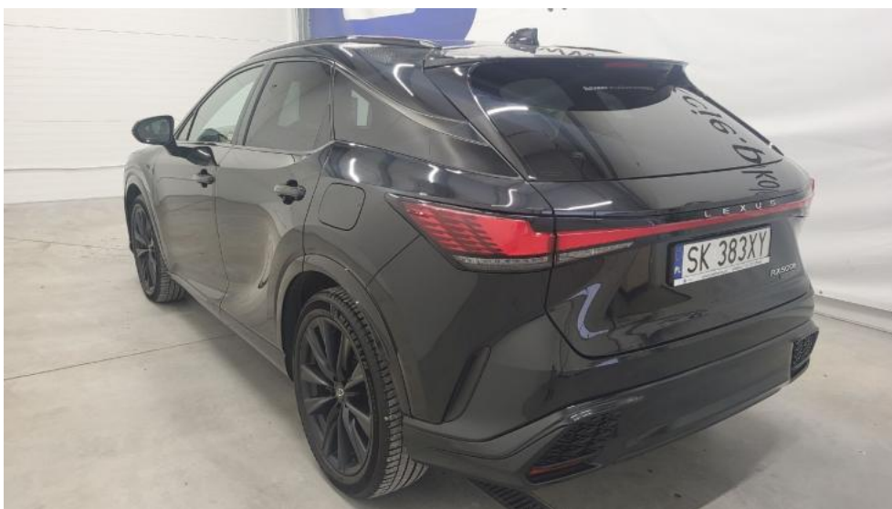
Fot. 8. Przekątna tylna lewa