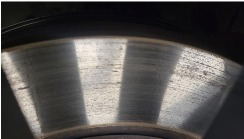
Fot. 15. Tarcza hamulcowa przednia prawa