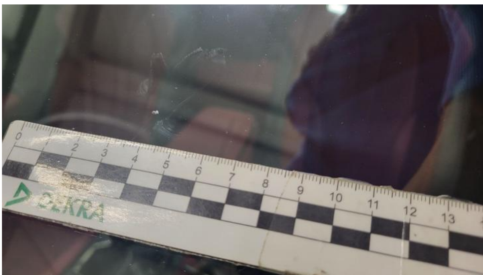
Fot. 42. Szyba czołowa - Rysa/odprysk 1