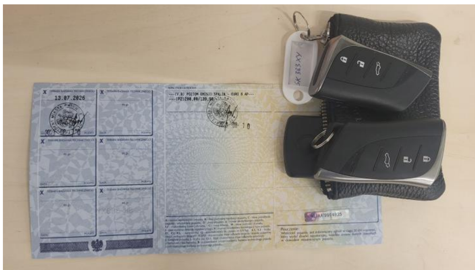
Fot. 33. Dow. Rej. Str.2 i klucze