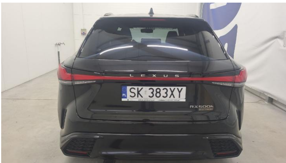
Fot. 7. Tyl