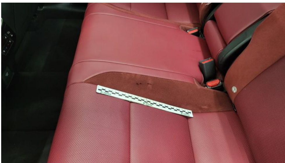
Fot. 55. Kanapa tyl. - Inne 1