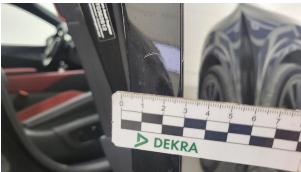
Fot. 45. Drzwi przednie P - Rysa/odprysk 1