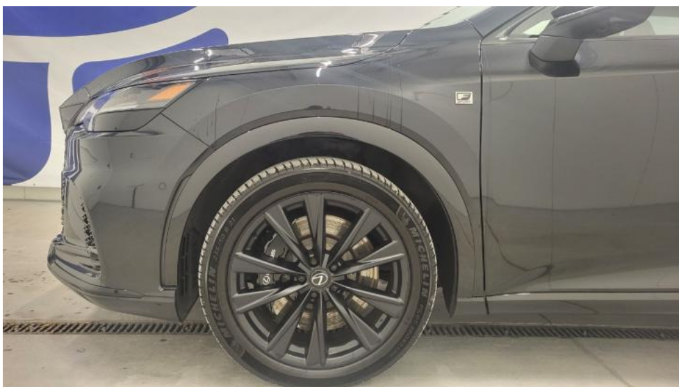
Fot. 10. Bok lewy z przodu