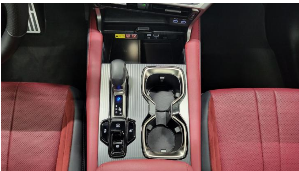
Fot. 30. Tunel środkowy