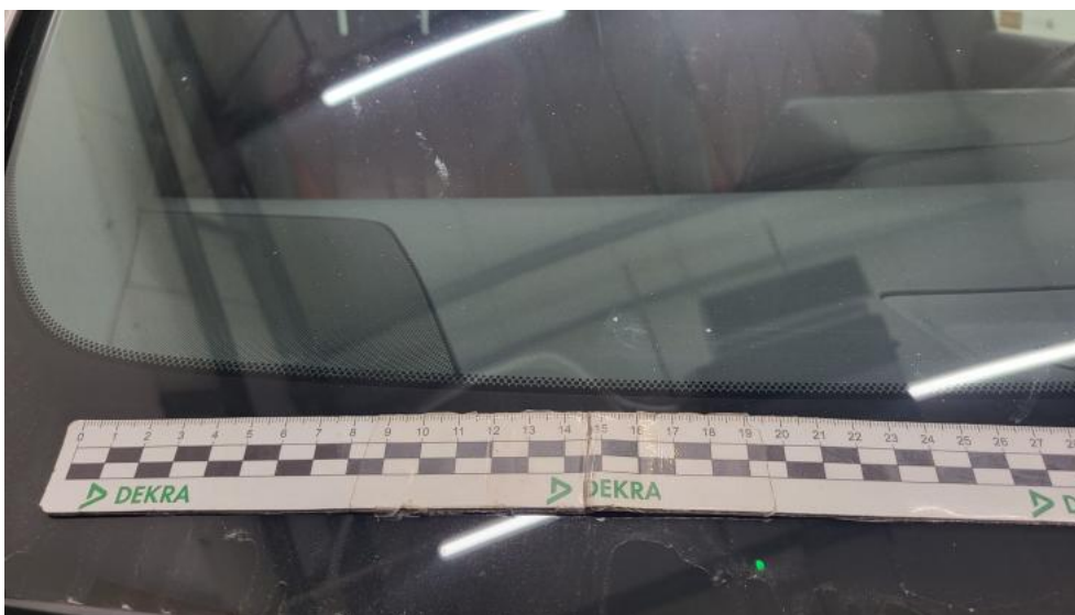
Fot. 43. Szyba czołowa - Rysa/odprysk 2