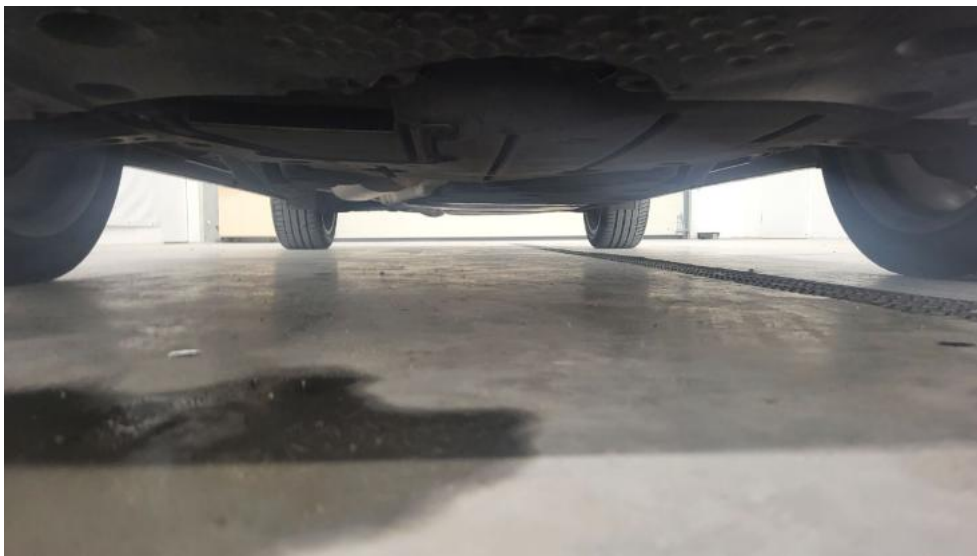
Fot. 13. Spód pojazdu przód