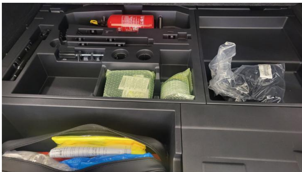
Fot. 34. Zestaw naprawy koła