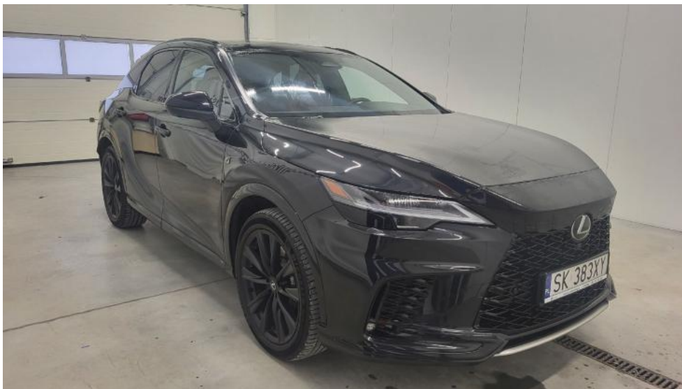
Fot. 3. Przekątna przednia prawa