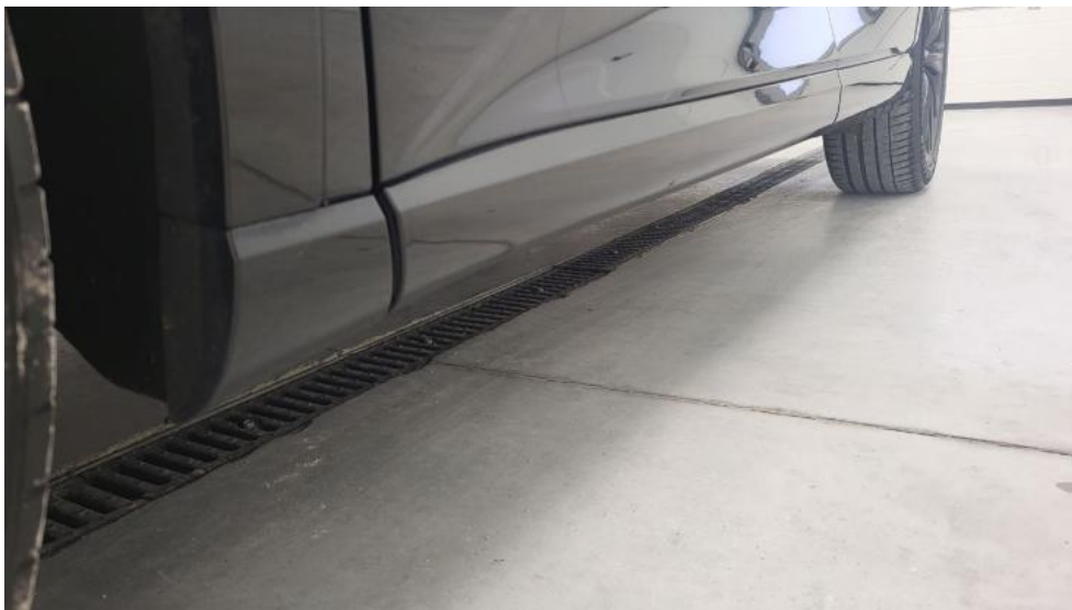
Fot. 11. Próg lewy (widok od przodu)