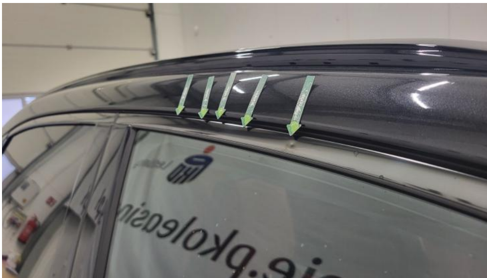
Fot. 47. Drzwi przednie P - Wgniecenie/odkształcenie 2