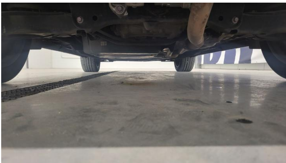
Fot. 14. Spód pojazdu tył