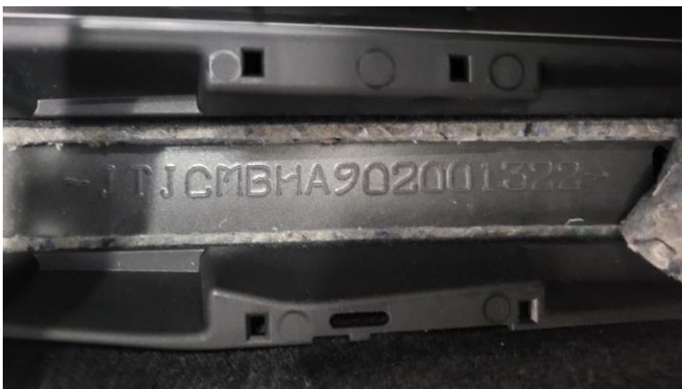
Fot. 22. Numer identyfikacyjny