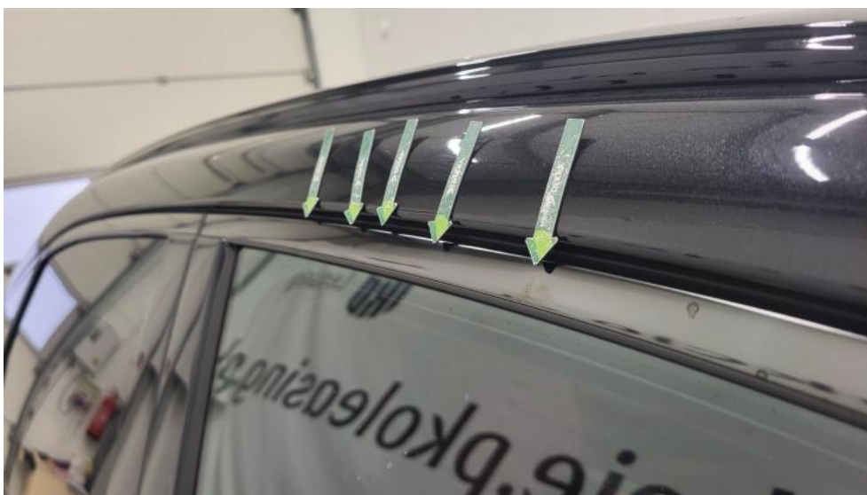
Fot. 46. Drzwi przednie P - Wgniecenie/odkształcenie 1