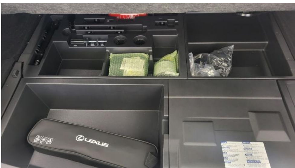
Fot. 20. Koło zapasowe