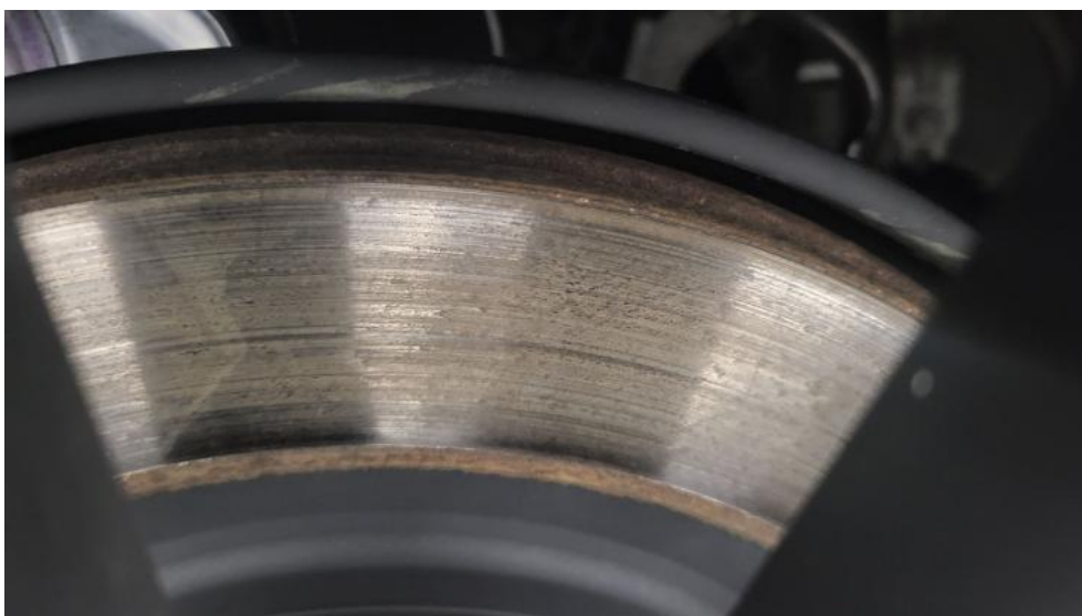
Fot. 16. Tarcza hamulcowa tylna prawa