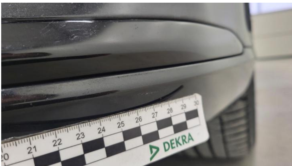
Fot. 44. Zderzak - Rysa/odprysk 1