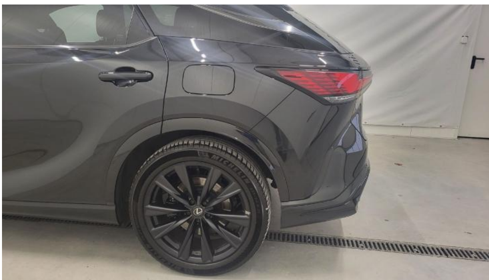
Fot. 9. Bok lewy z tyłu