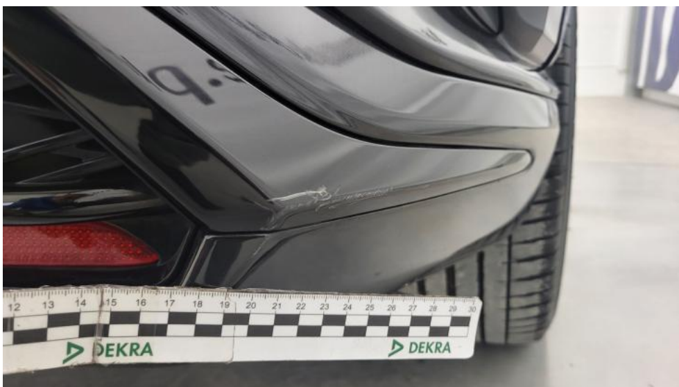
Fot. 52. Zderzak tylny - Rysa/odprysk 1