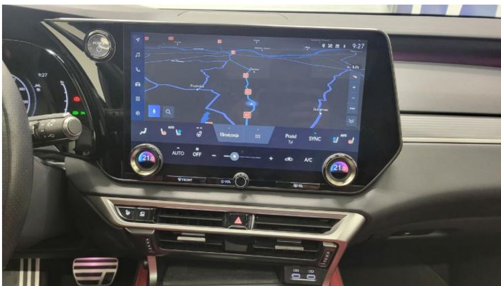
Fot. 29. Konsola środkowa