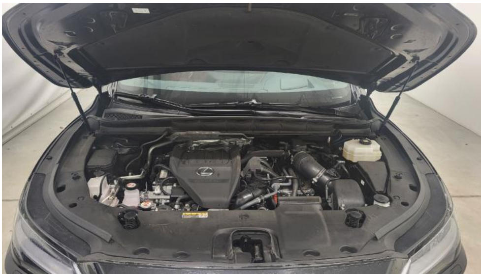
Fot. 21. Komora silnika