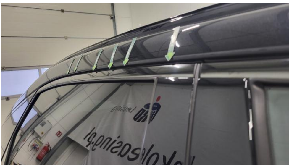
Fot. 50. Drzwi tylne P - Wgniecenie/odkształcenie 2