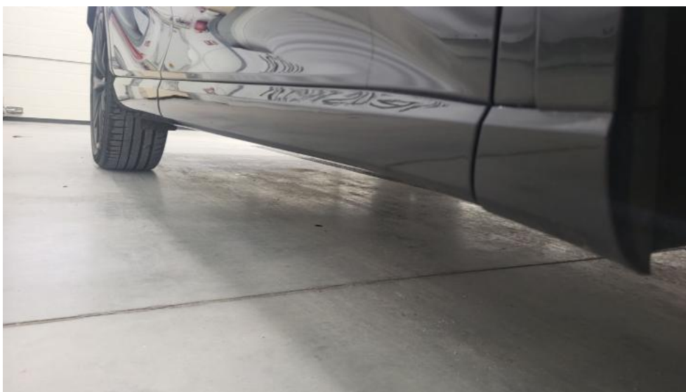
Fot. 12. Próg prawy (widok od przodu)