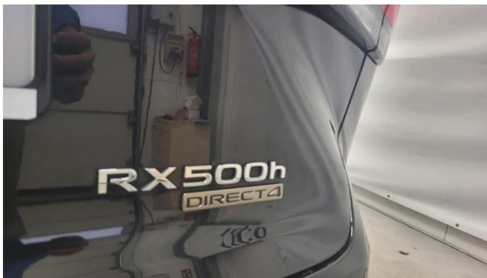
Fot. 35. Zdjęcie do protokołu