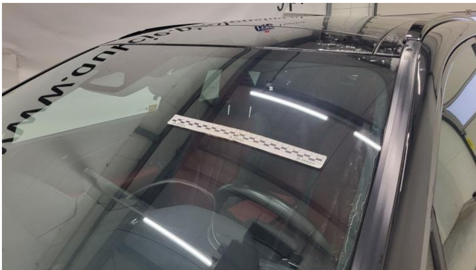
Fot. 41. Szyba czołowa - zdjęcie pogładowe 1