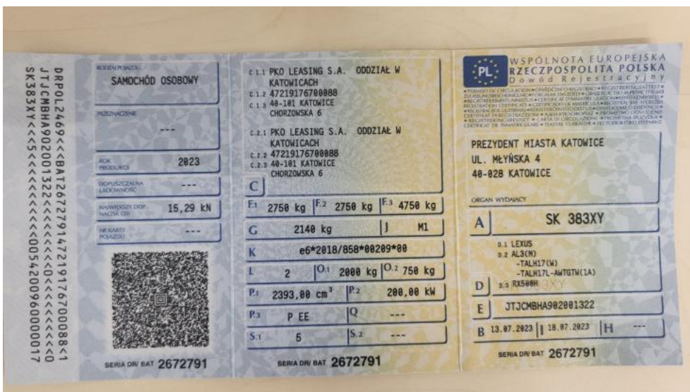
Fot. 32. Dowód rej. Str. 1