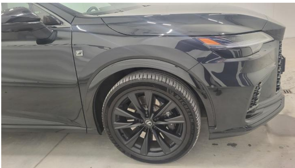
Fot. 4. Bok prawy z przodu