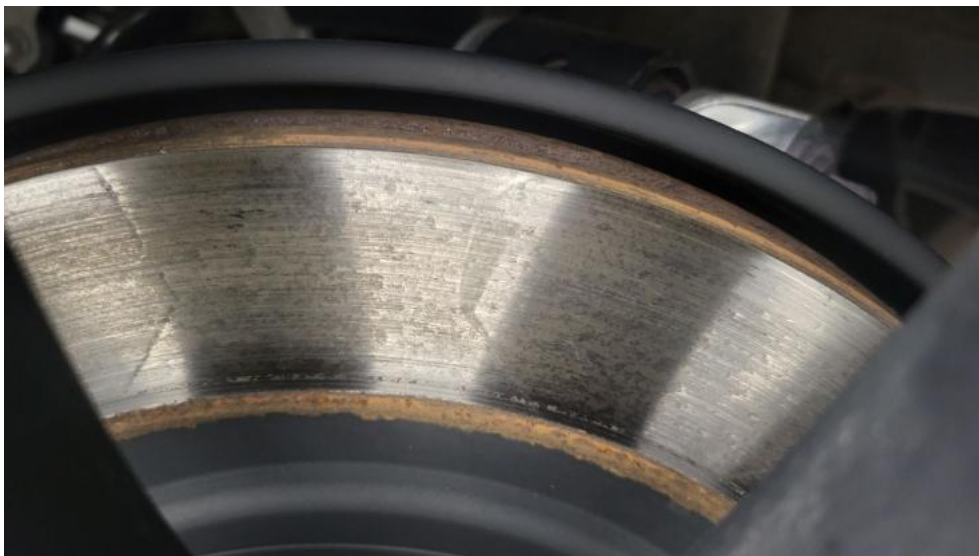
Fot. 17. Tarcza hamulcowa tylna lewa