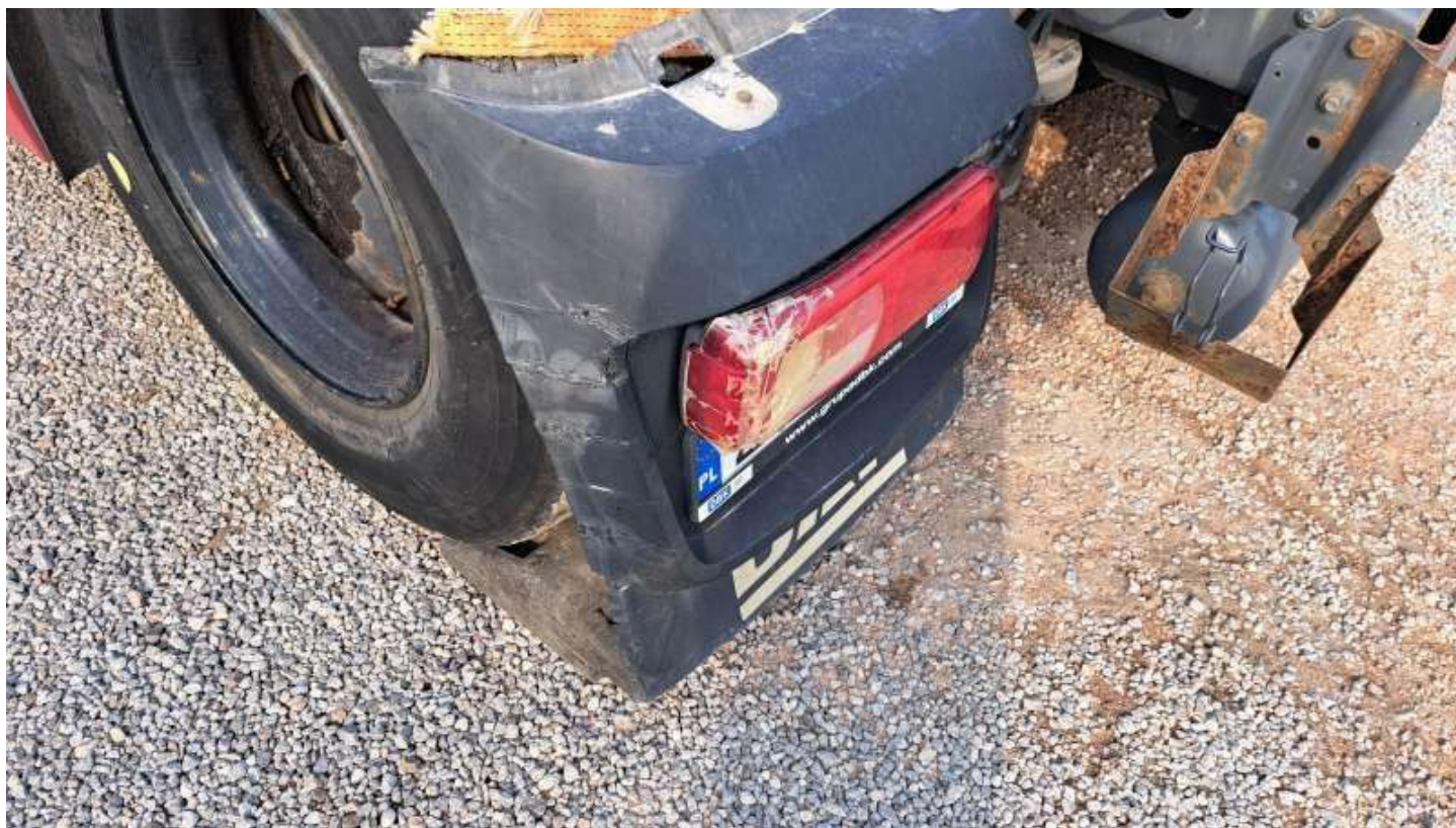
Fot. nr 72