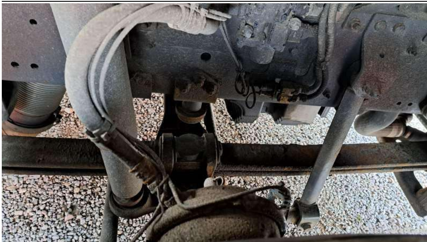
Fot. nr 93