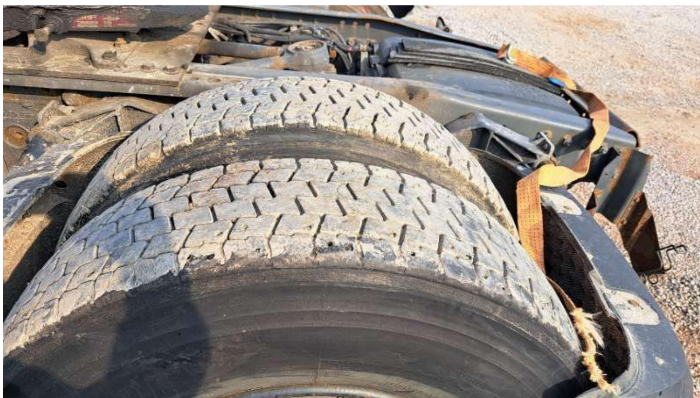
Fot. nr 98