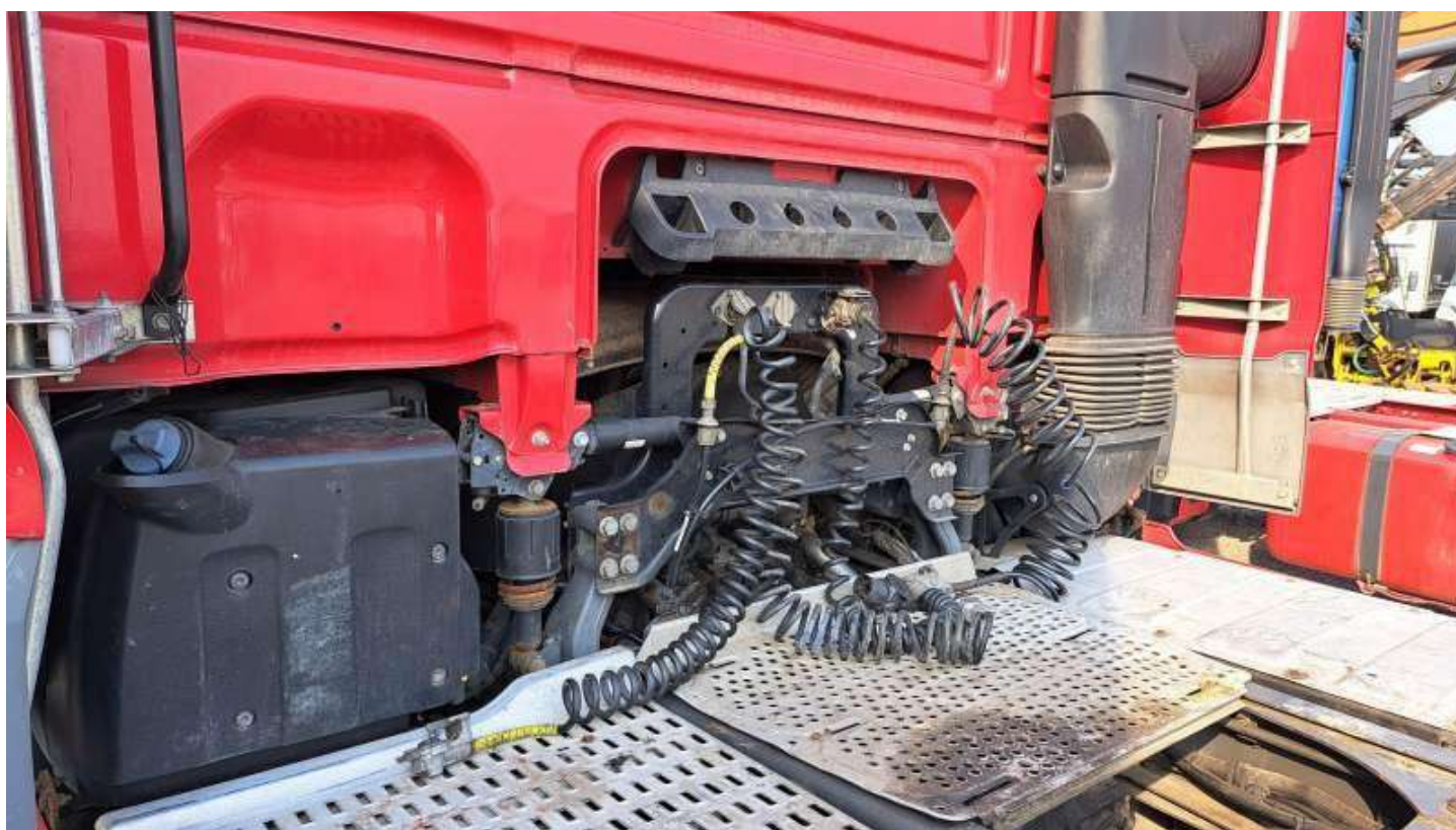
Fot. nr 62