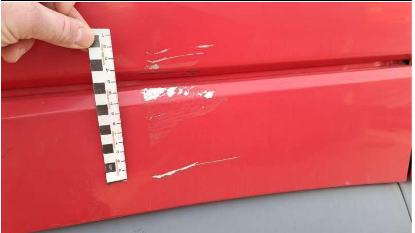
Fot. nr 85