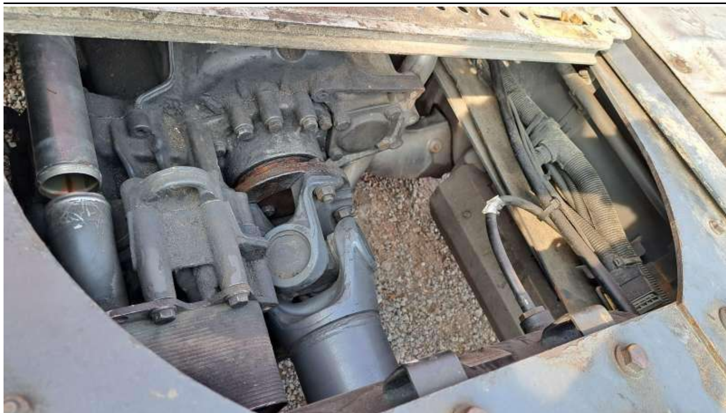
Fot. nr 63