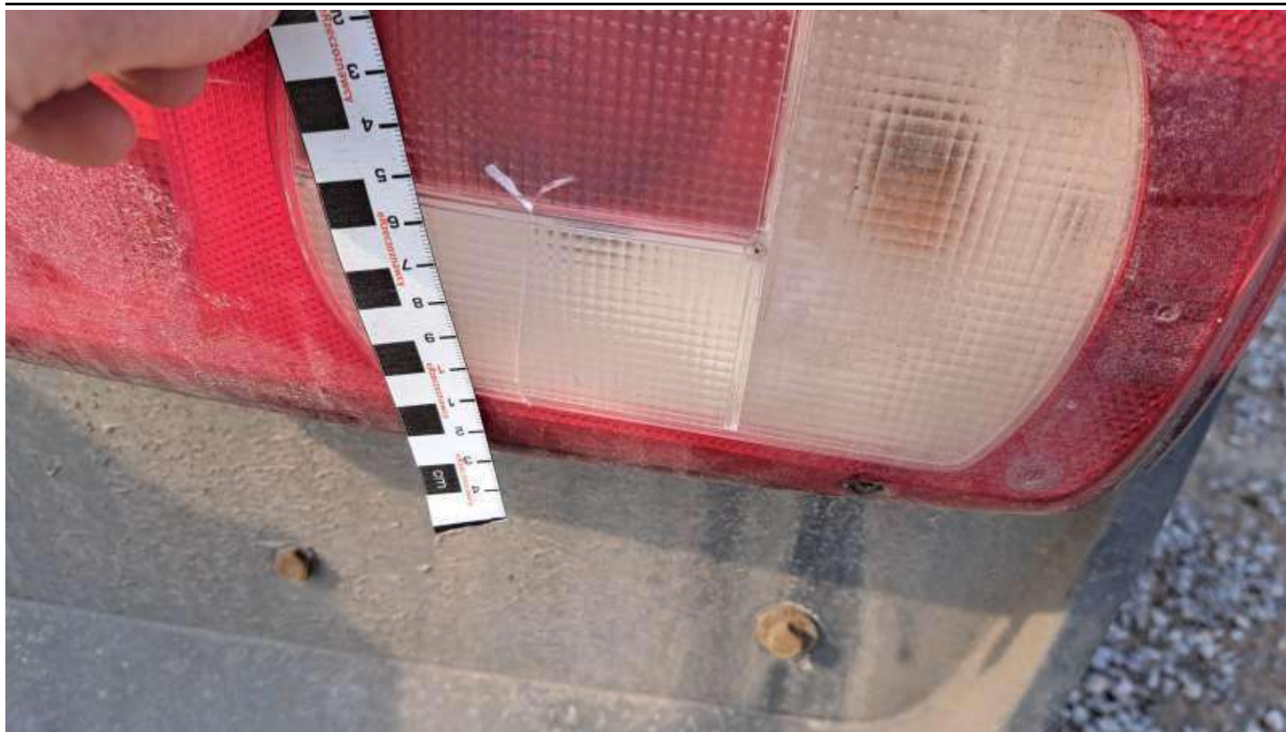
Fot. nr 79