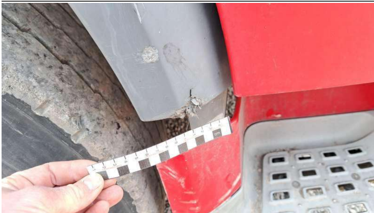
Fot. nr 89