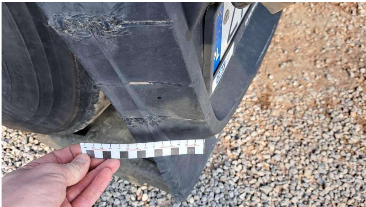
Fot. nr 74