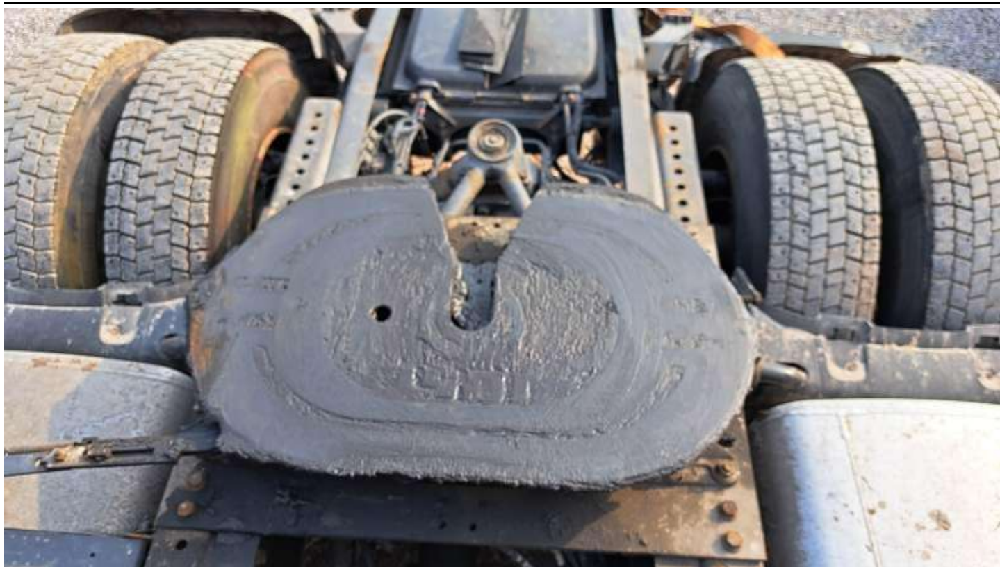
Fot. nr 69