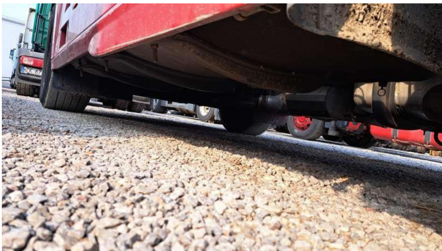
Fot. nr 96