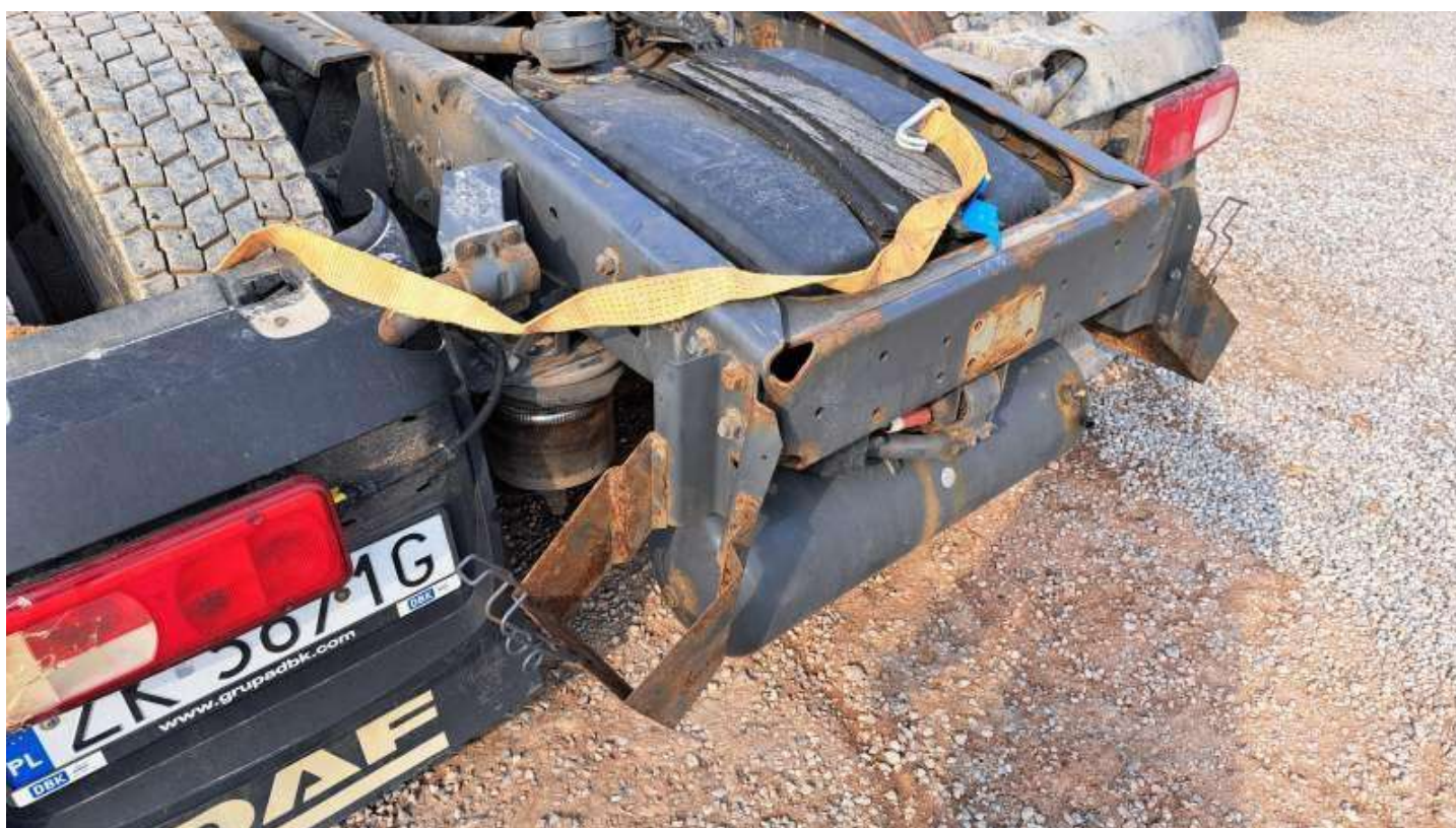
Fot. nr 76