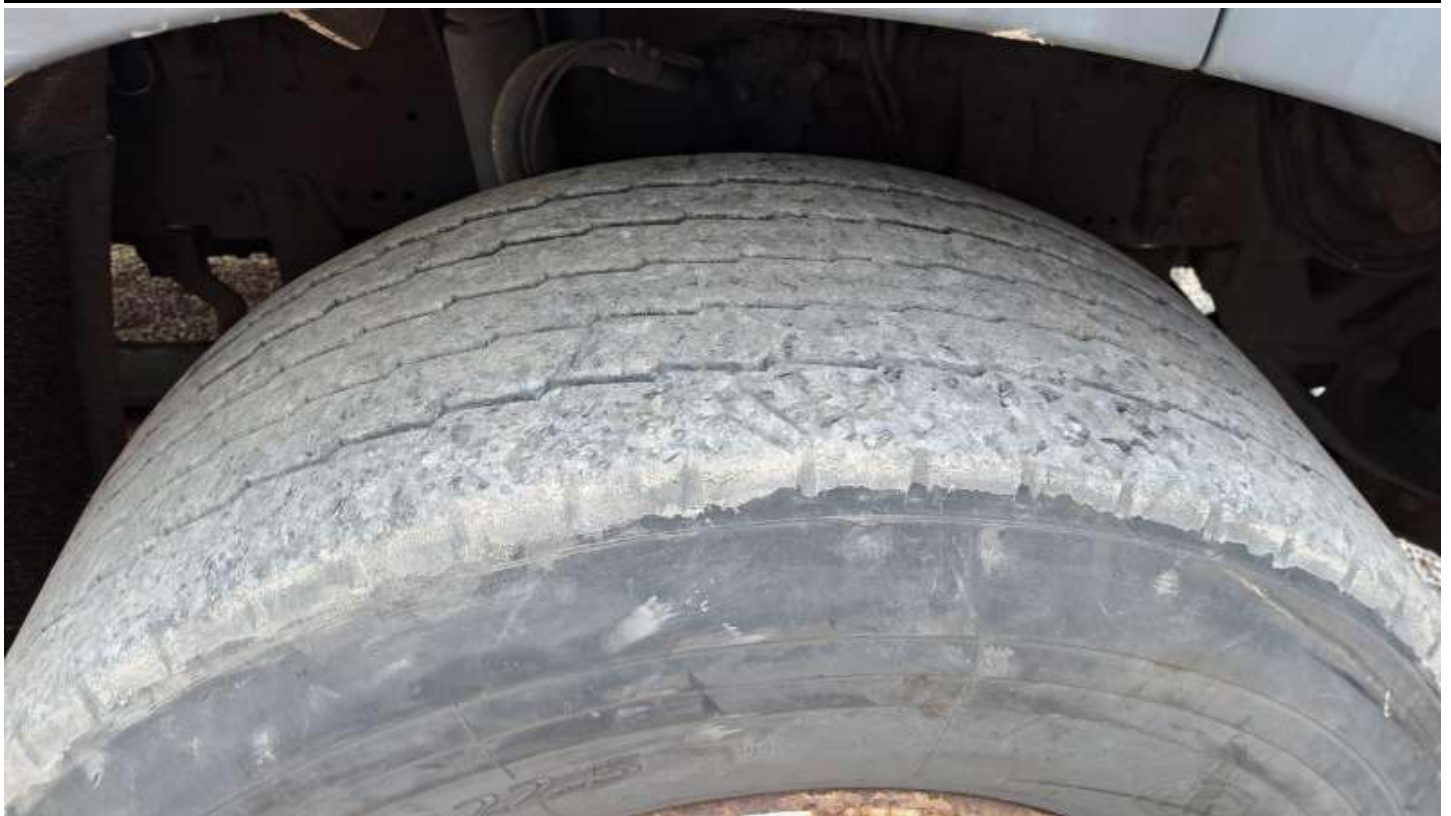
Fot. nr 99