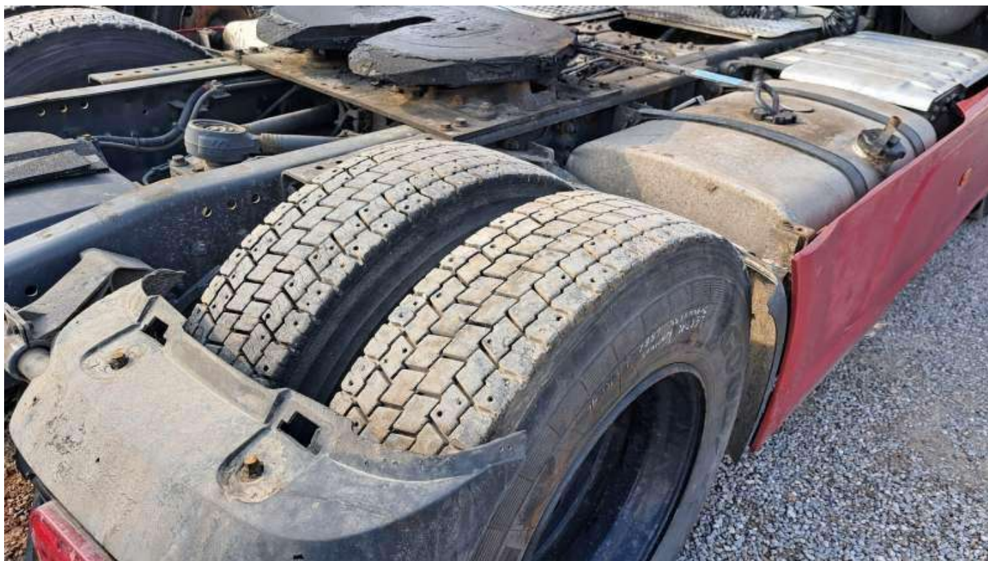
Fot. nr 80