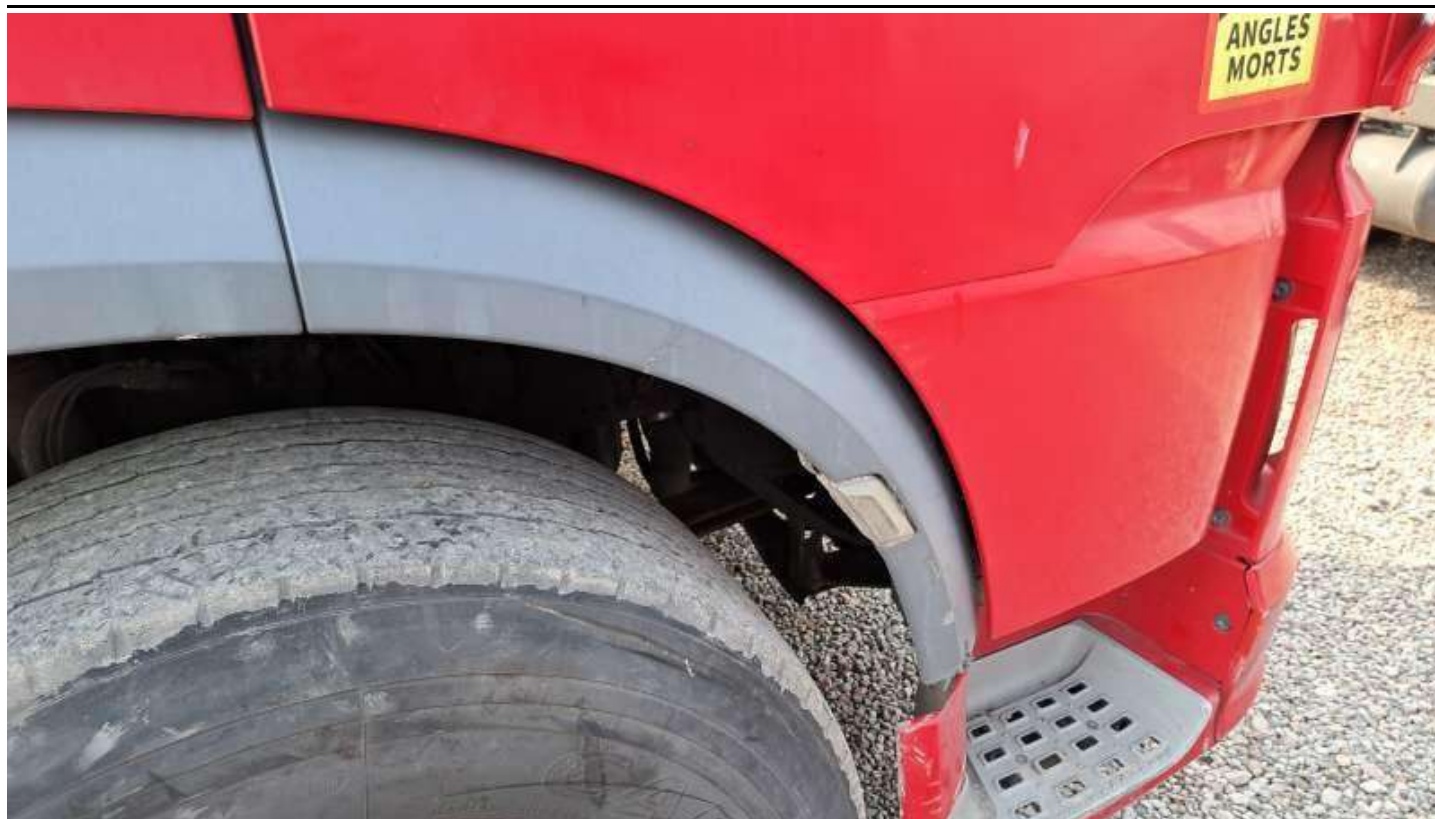
Fot. nr 87