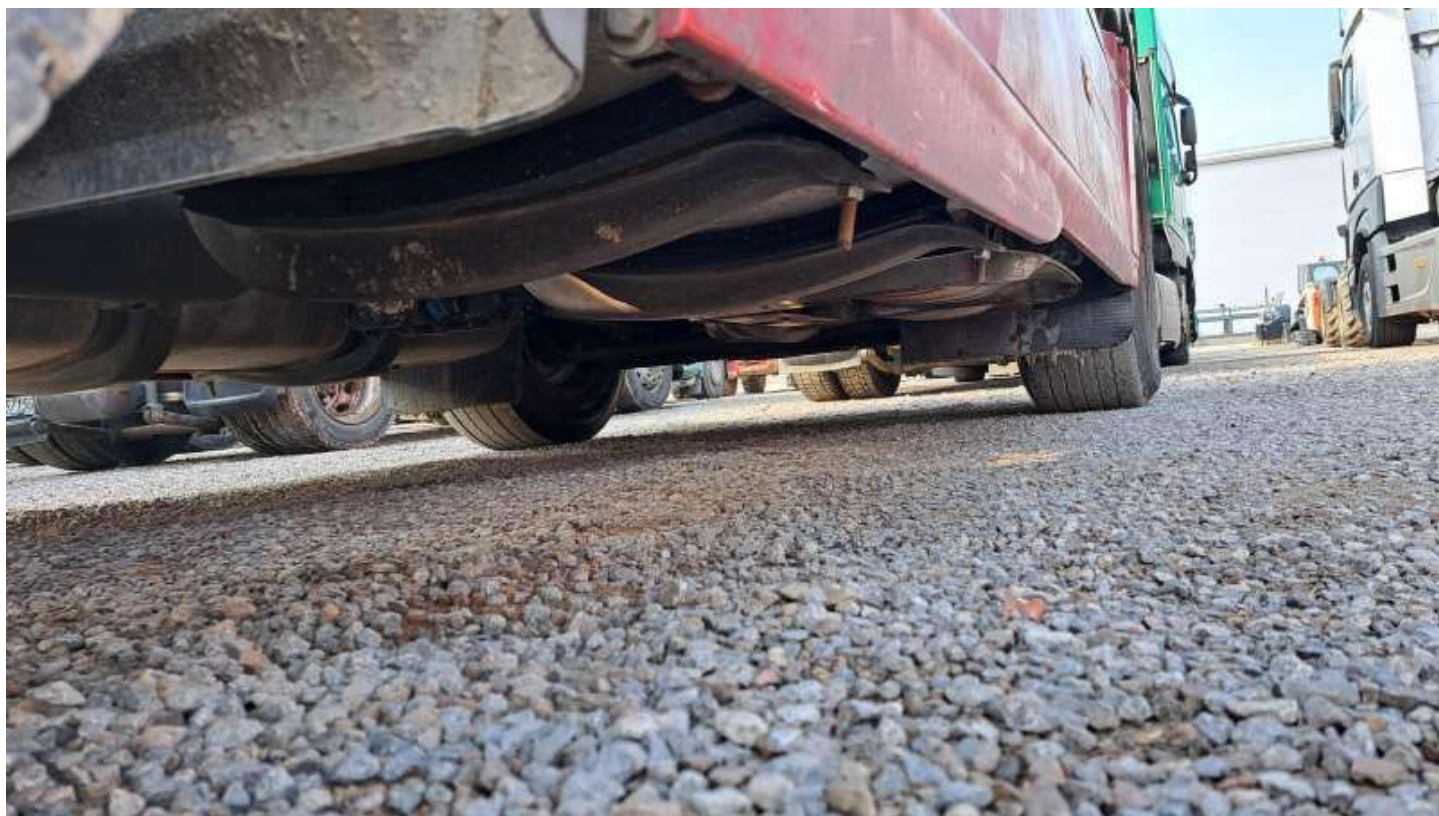
Fot. nr 94