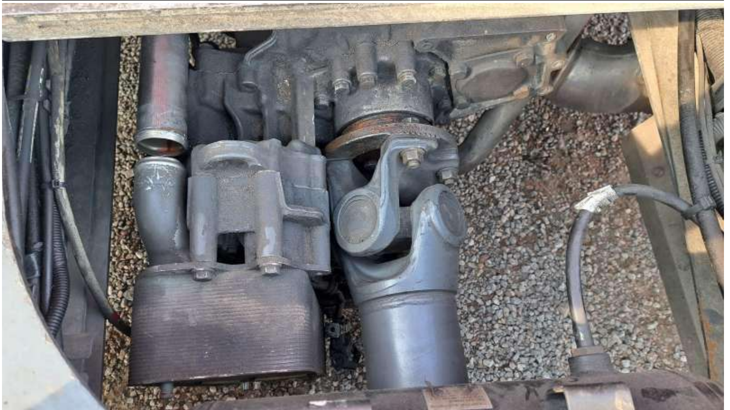
Fot. nr 67