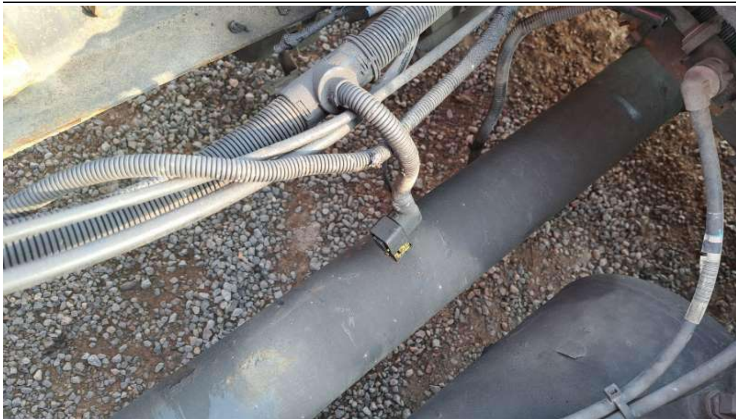
Fot. nr 65