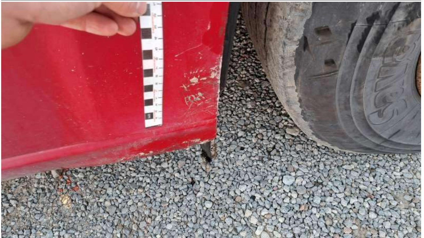
Fot. nr 83