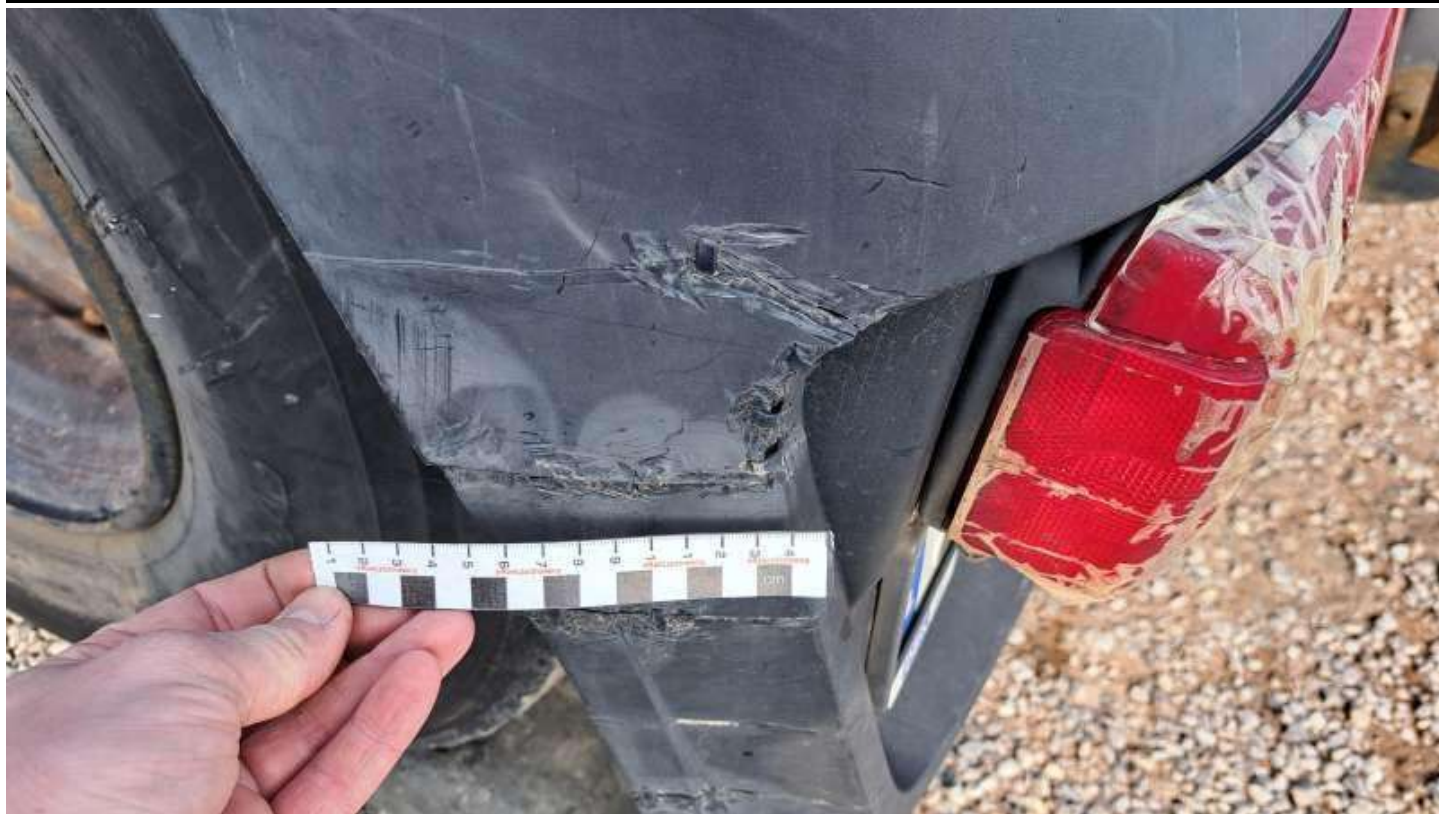
Fot. nr 73