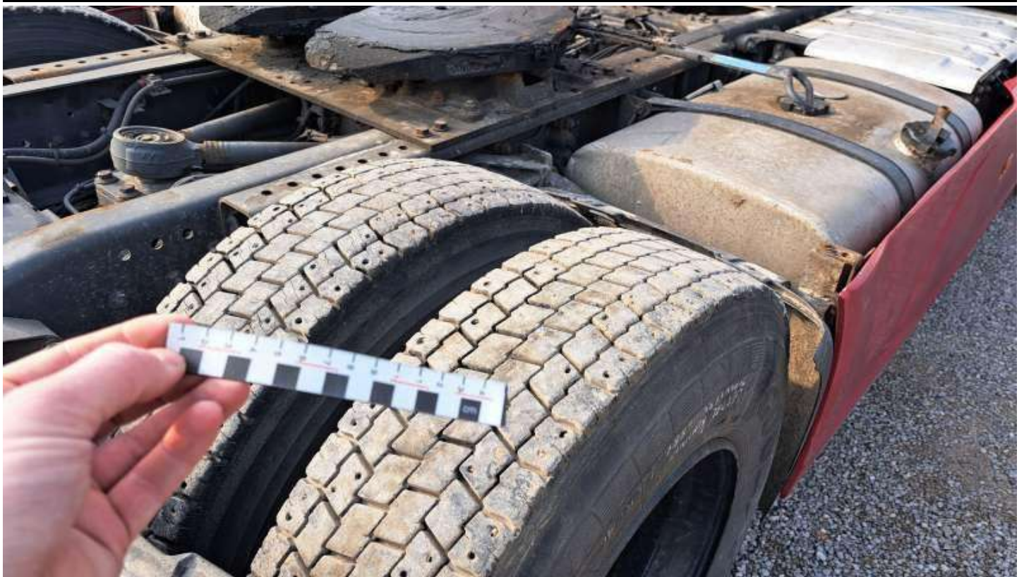
Fot. nr 81