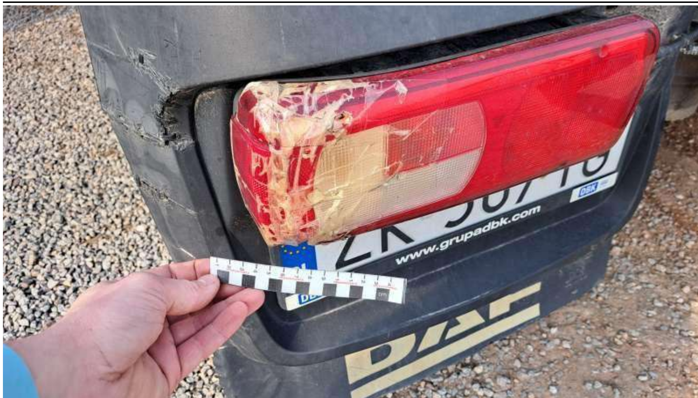
Fot. nr 75