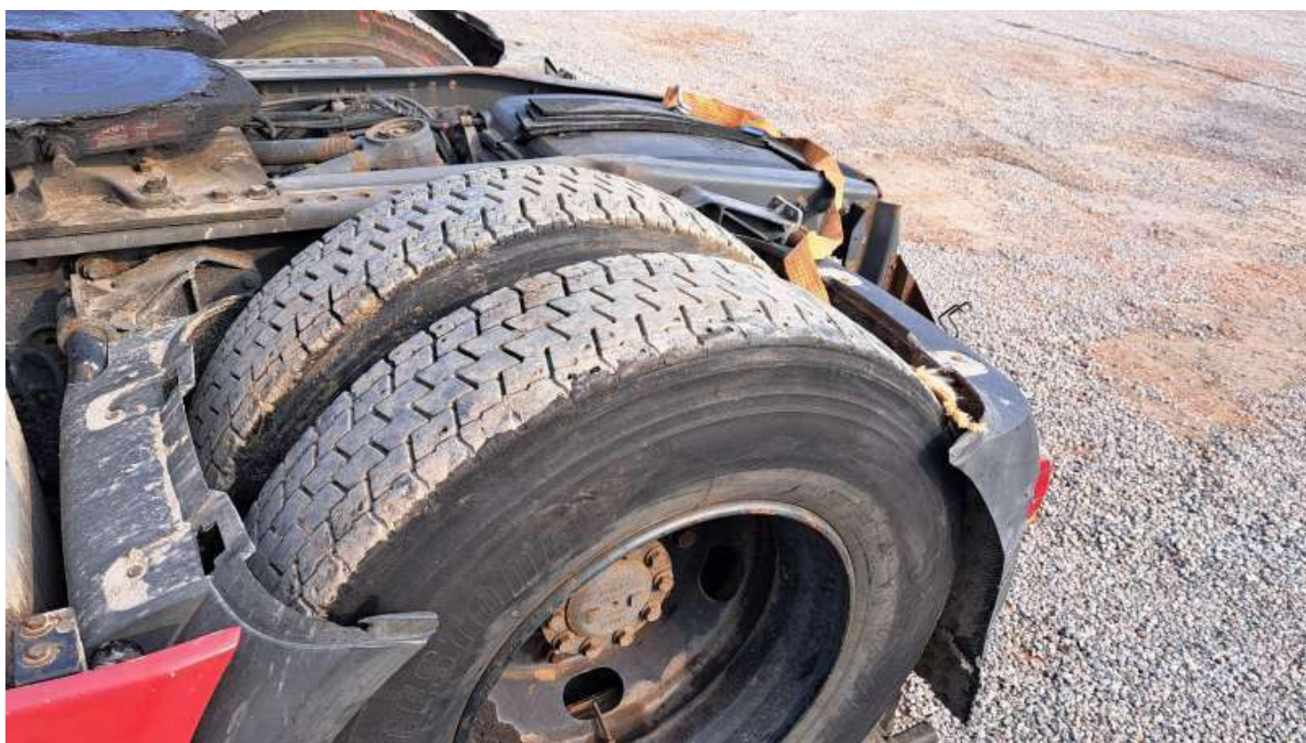
Fot. nr 70