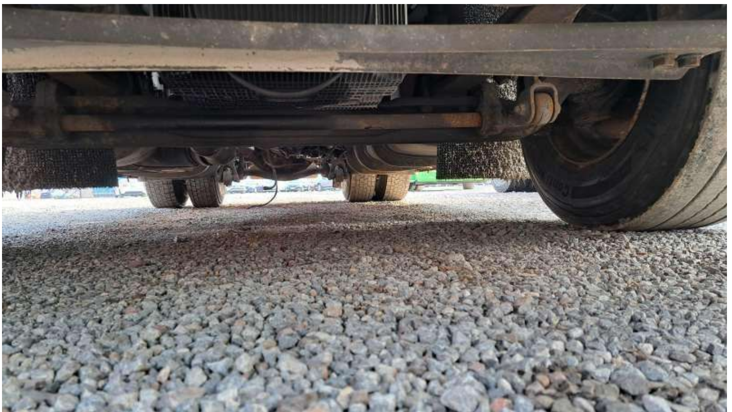
Fot. nr 92