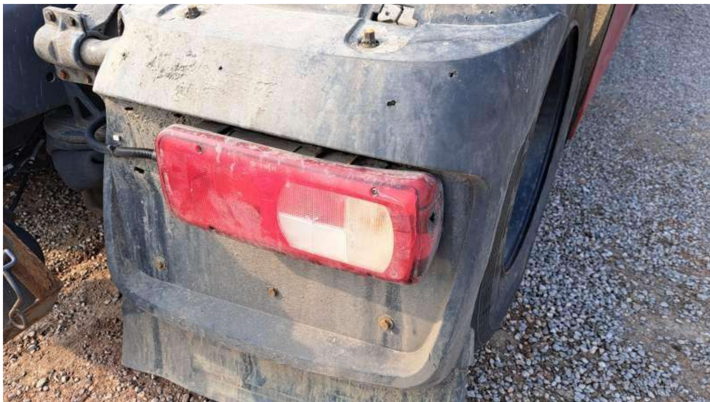
Fot. nr 78