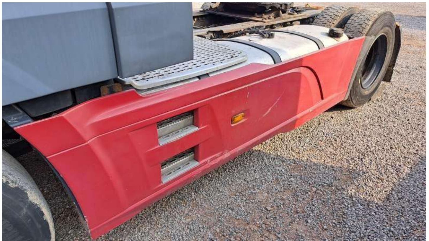
Fot. nr 60