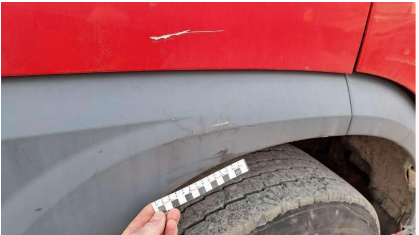
Fot. nr 86