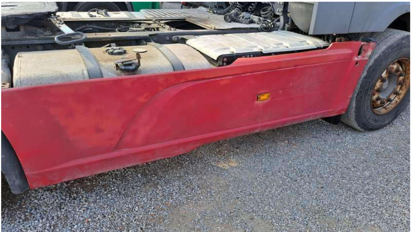
Fot. nr 82