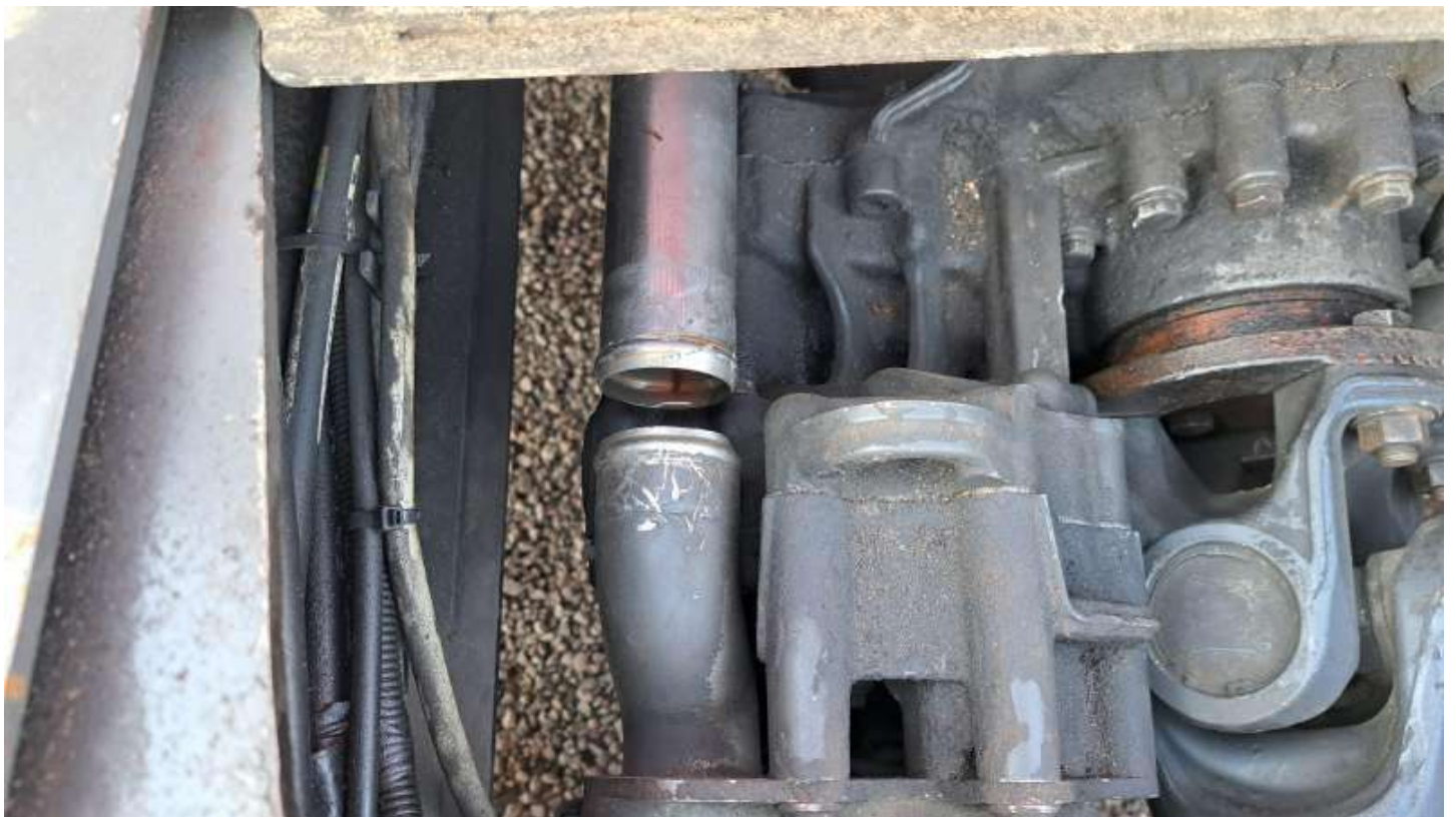
Fot. nr 68