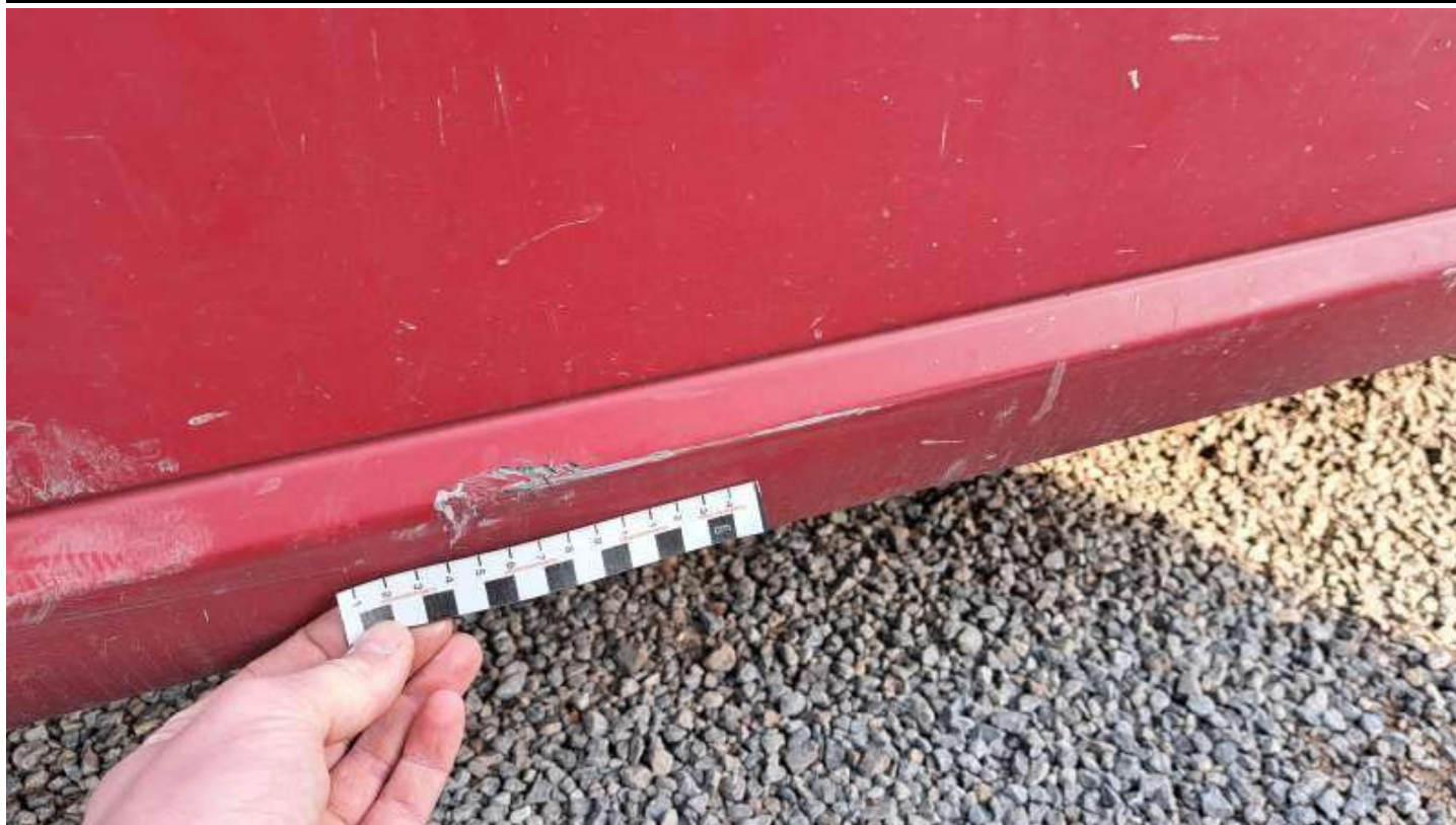
Fot. nr 61