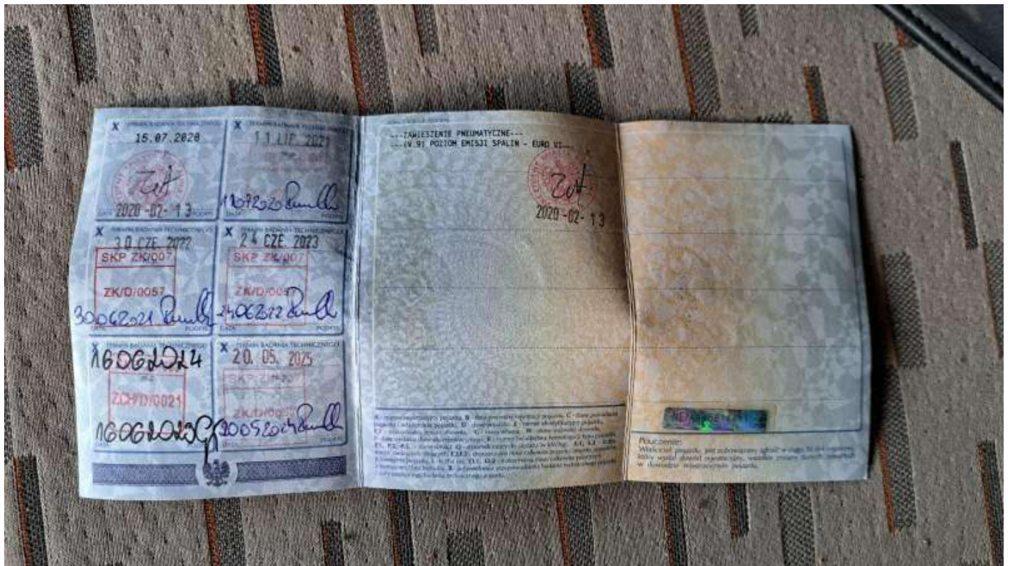
Fot. nr 102