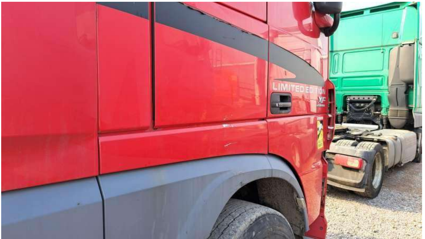
Fot. nr 84