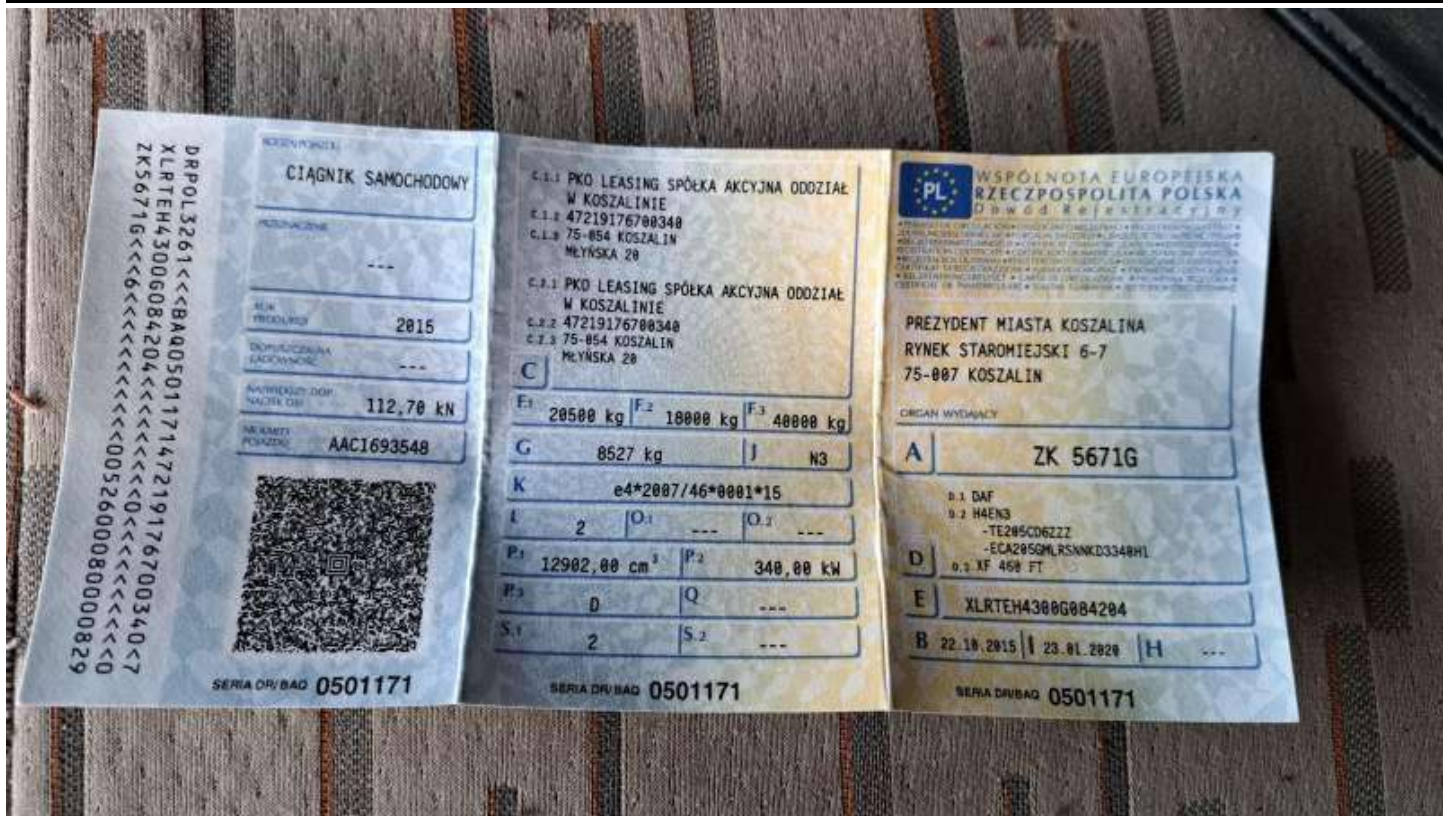
Fot. nr 101