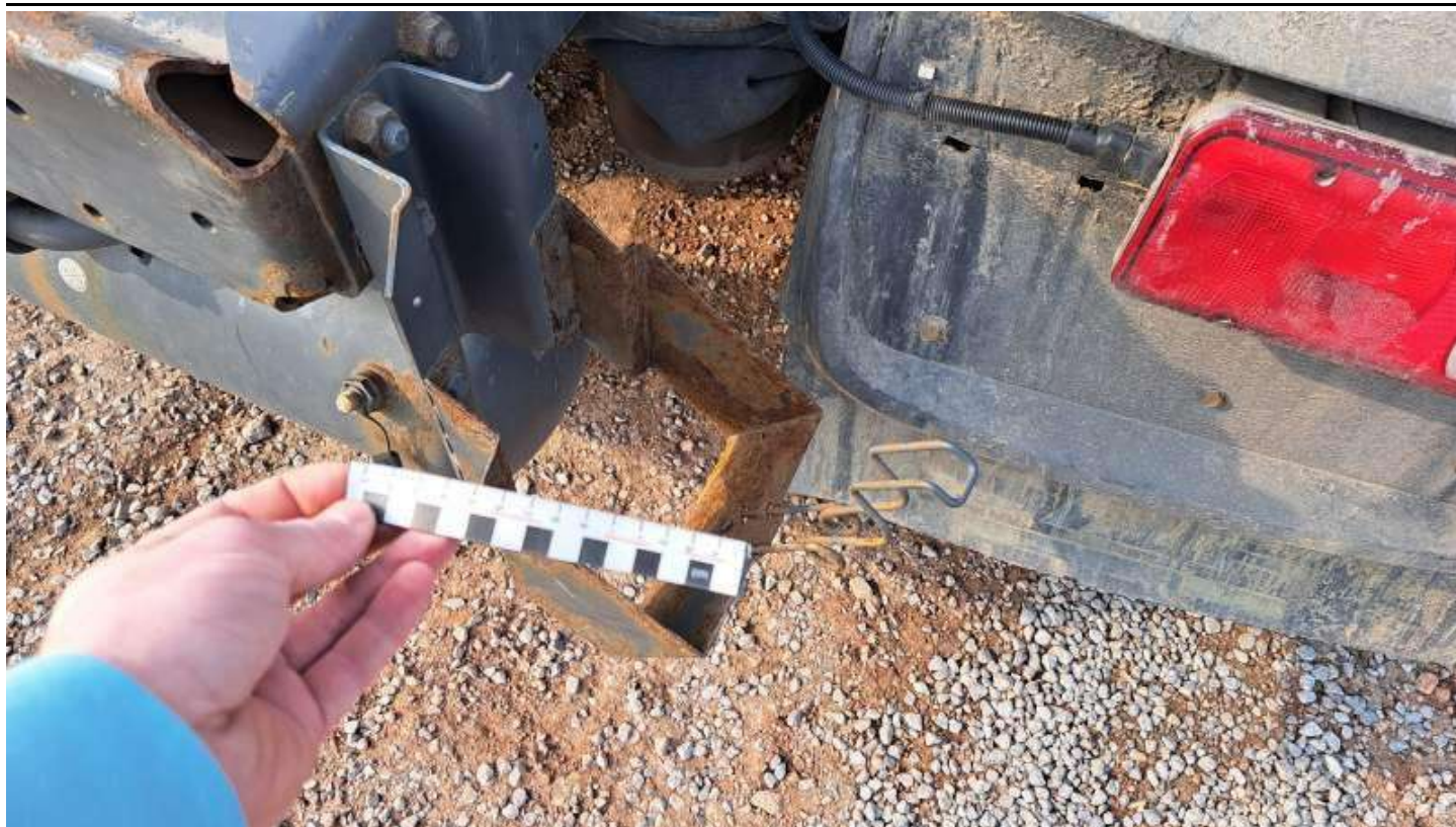
Fot. nr 77