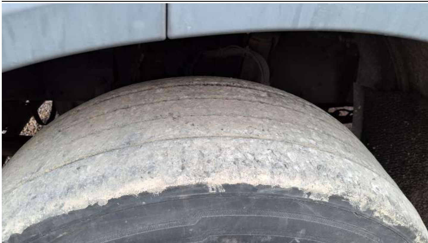
Fot. nr 97