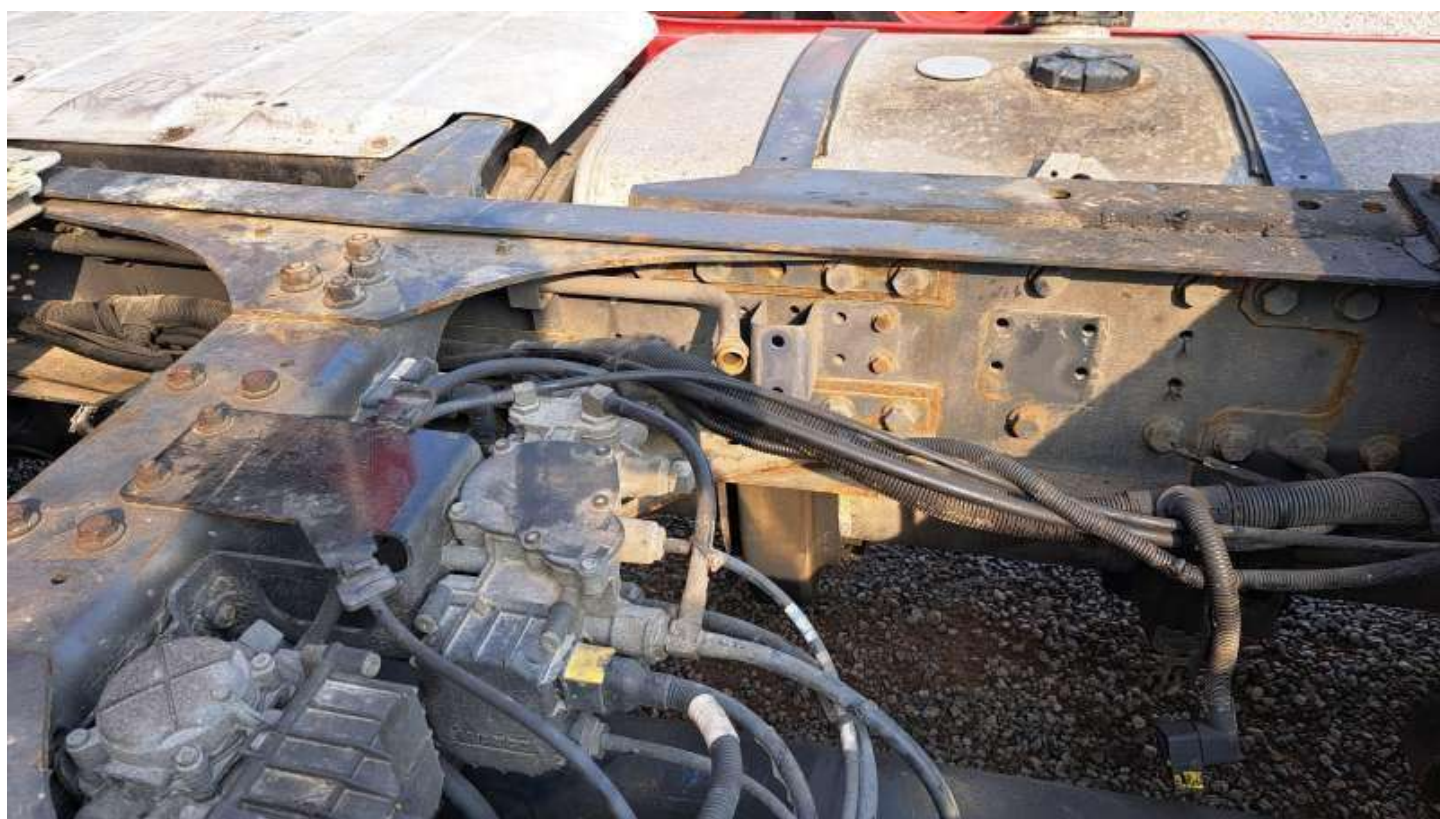
Fot. nr 64