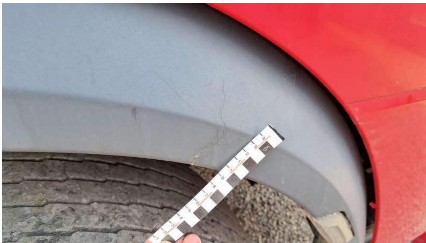
Fot. nr 88