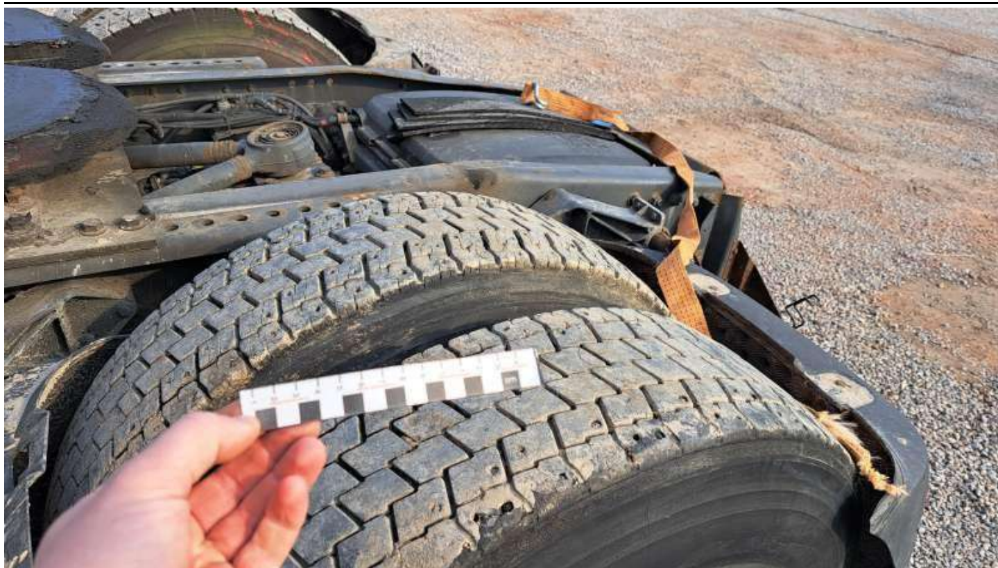
Fot. nr 71