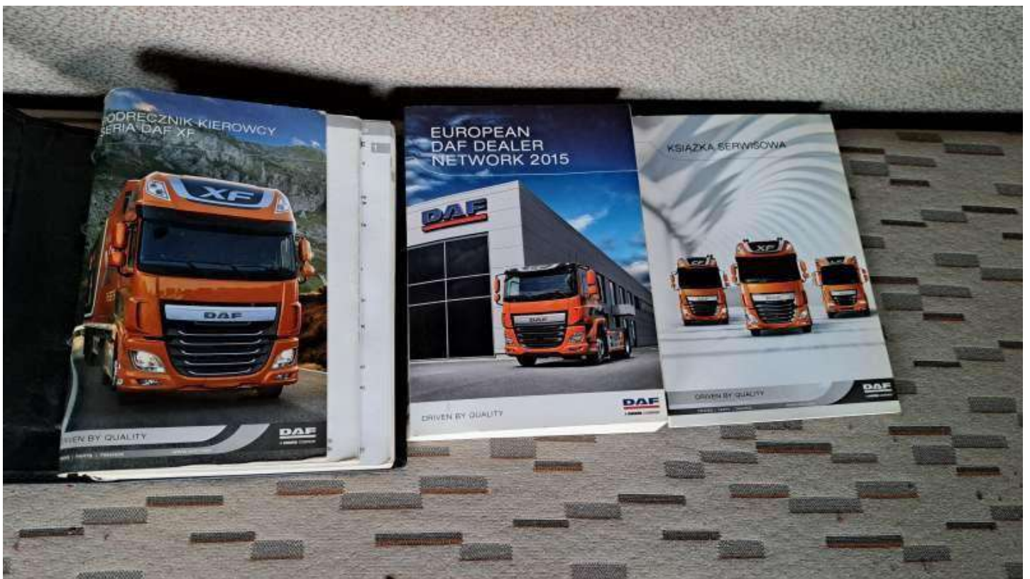
Fot. nr 100