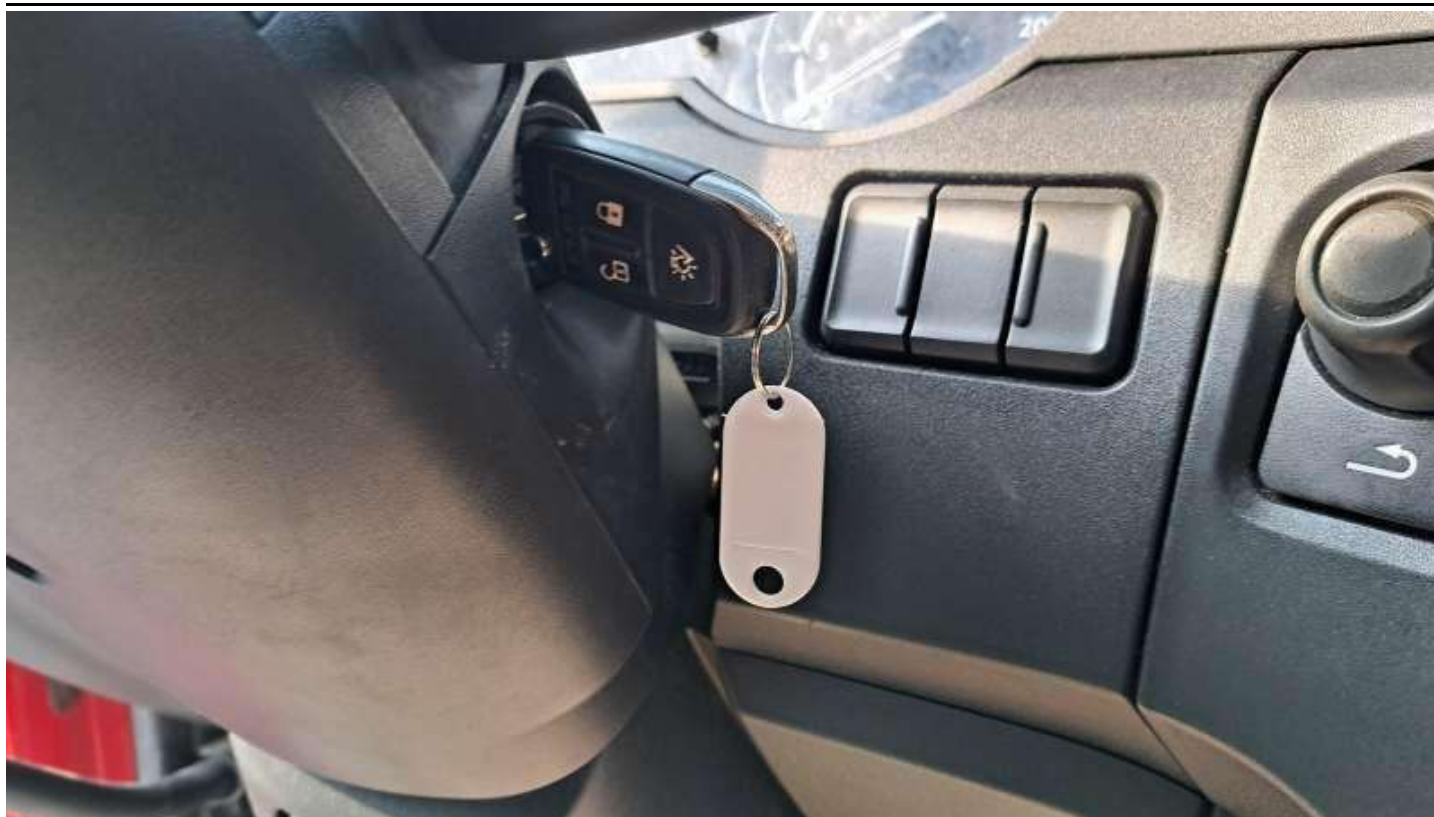
Fot. nr 103

Dokument wystawiony elektronicznie, w a ny bez podpisu