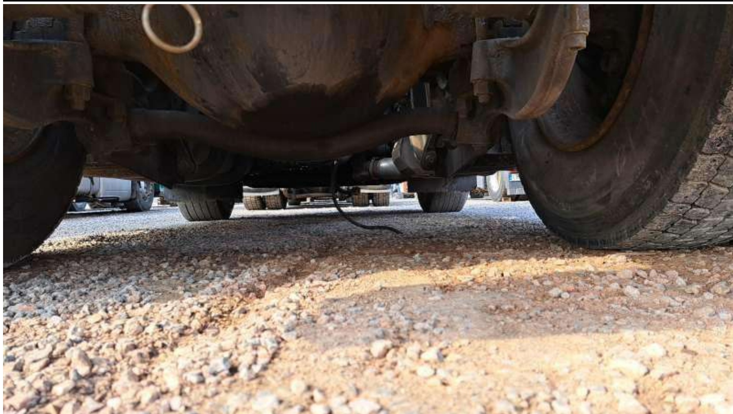
Fot. nr 95