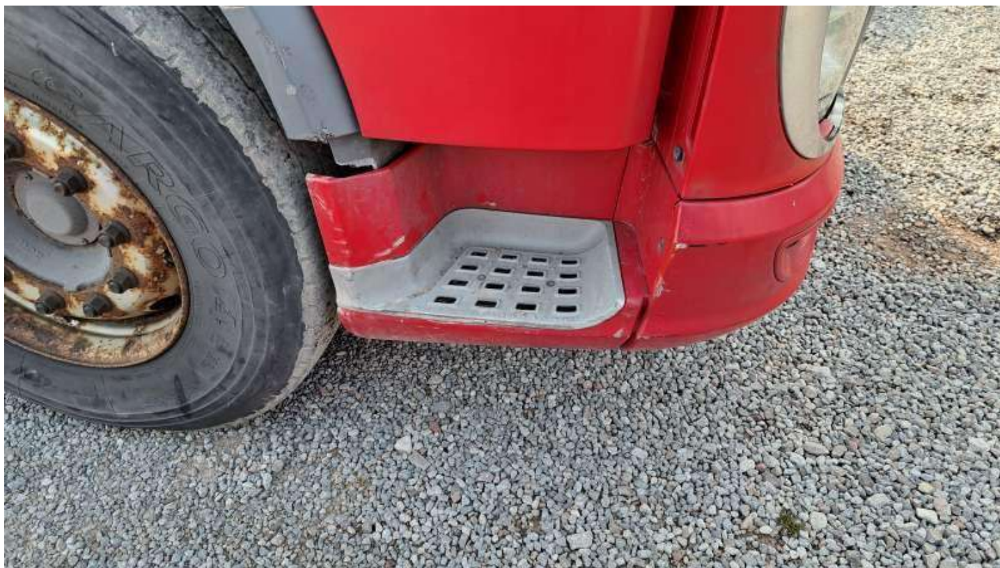
Fot. nr 90