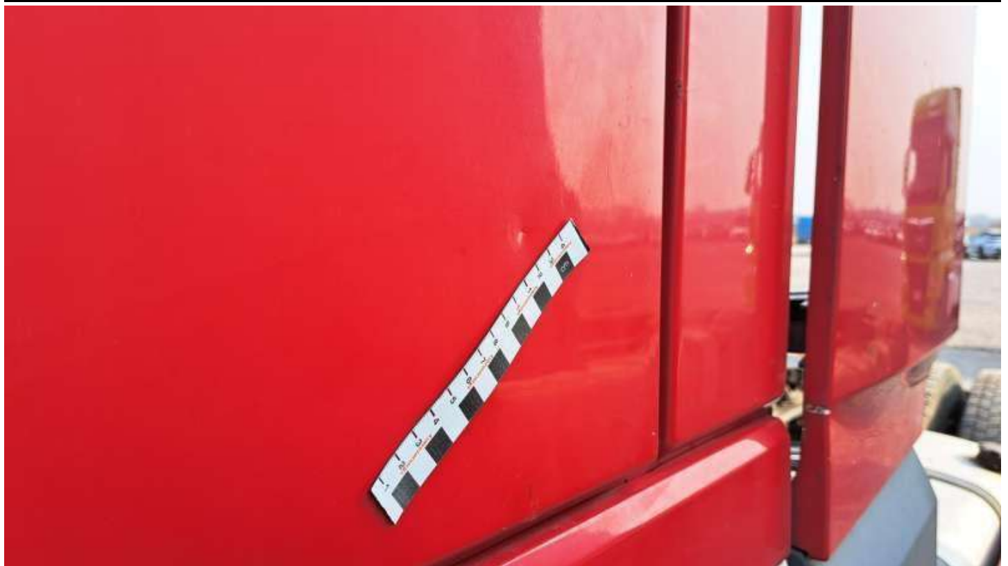
Fot. nr 59