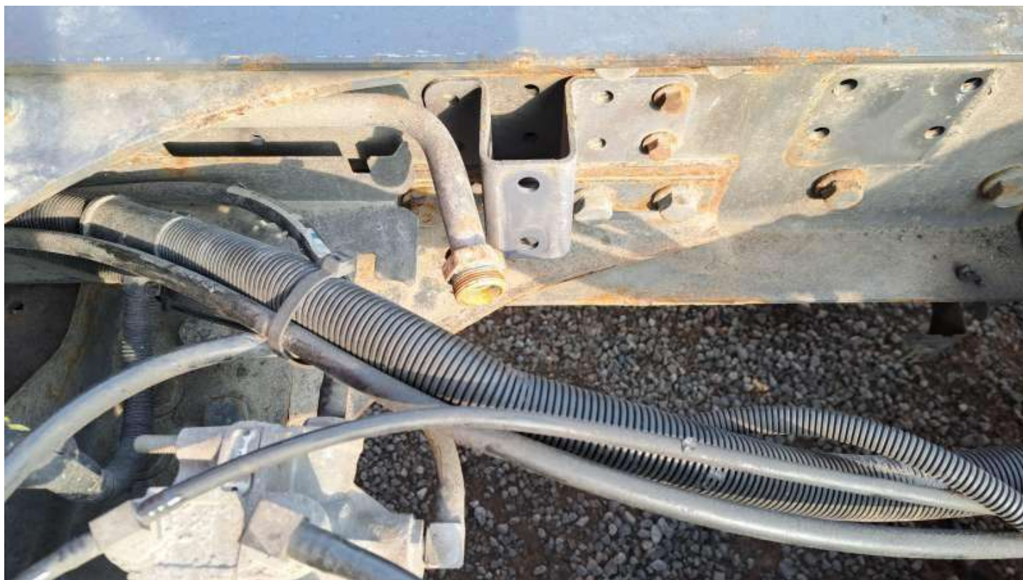
Fot. nr 66