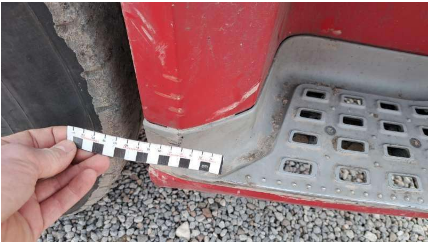
Fot. nr 91