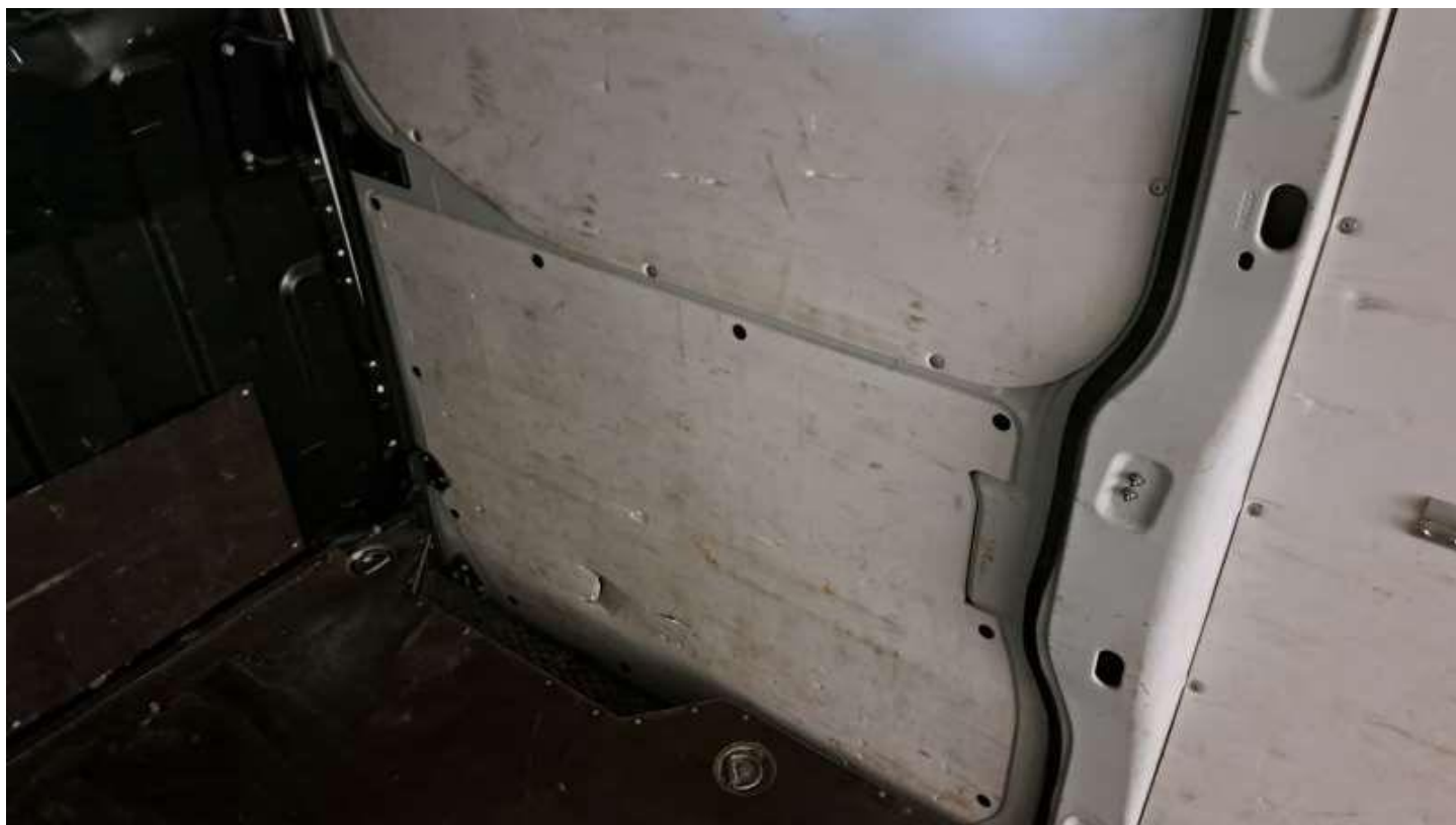
Fot. nr 32