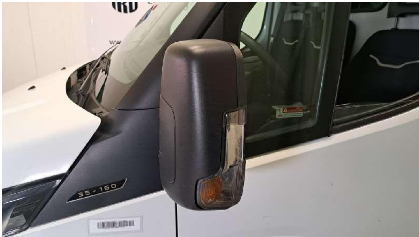
Fot. nr 50