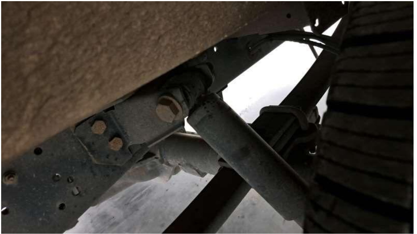
Fot. nr 71