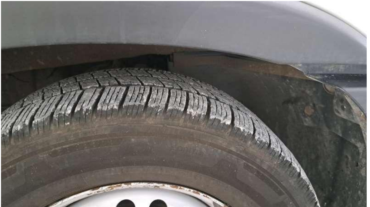
Fot. nr 76