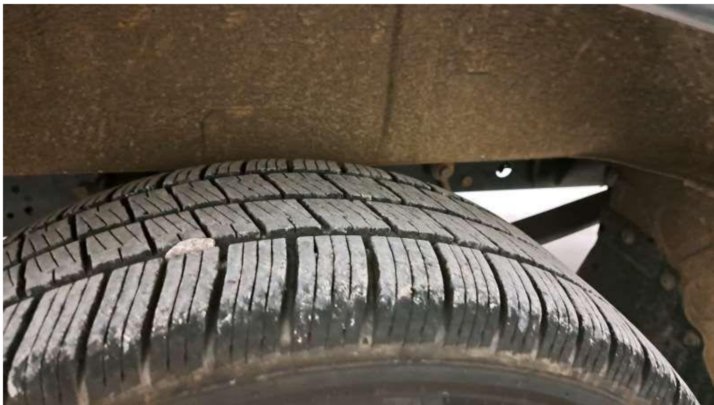
Fot. nr 74