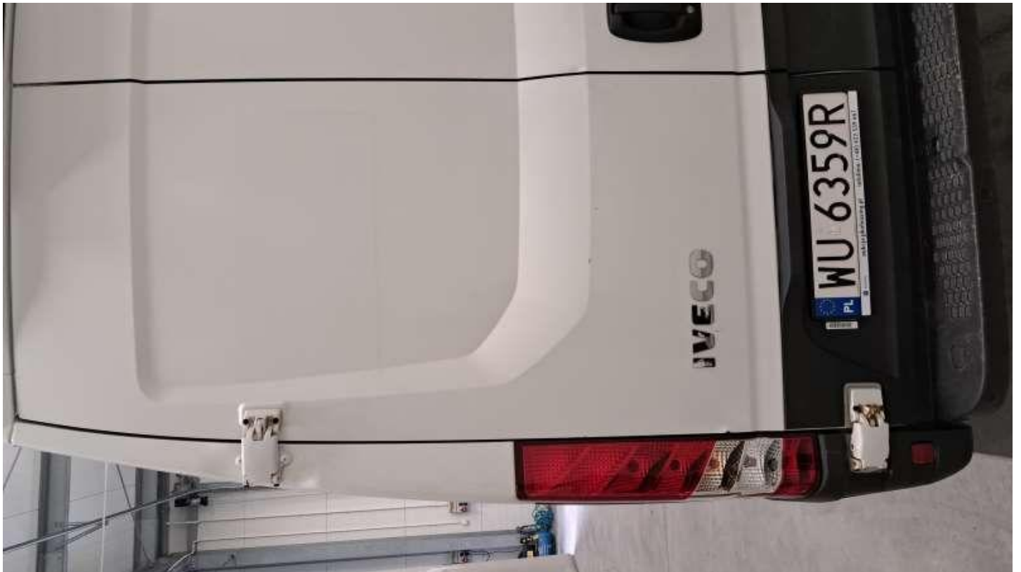
Fot. nr 58