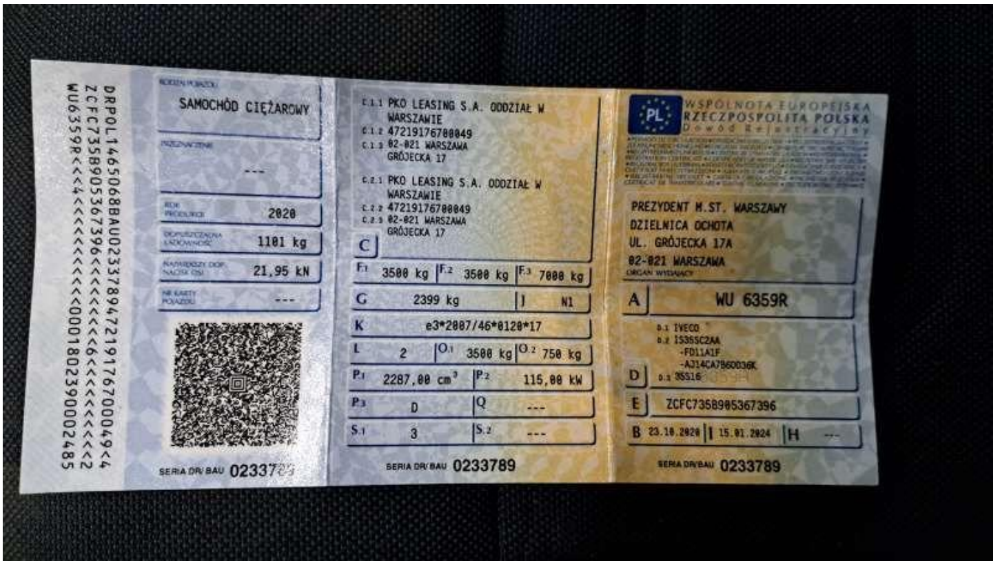
Fot. nr 78