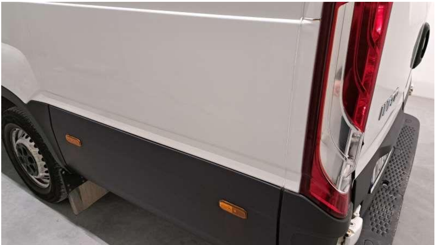
Fot. nr 56