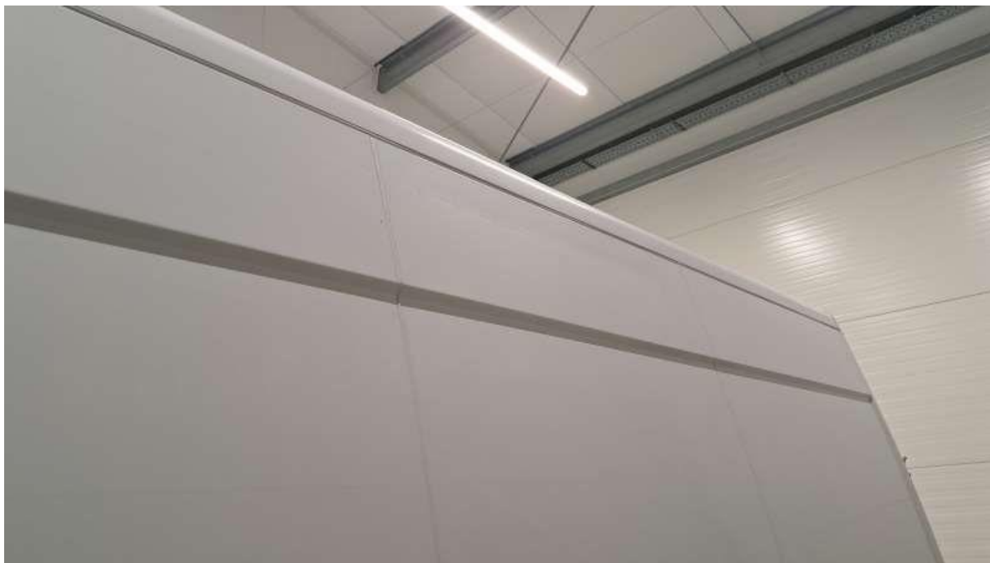
Fot. nr 54