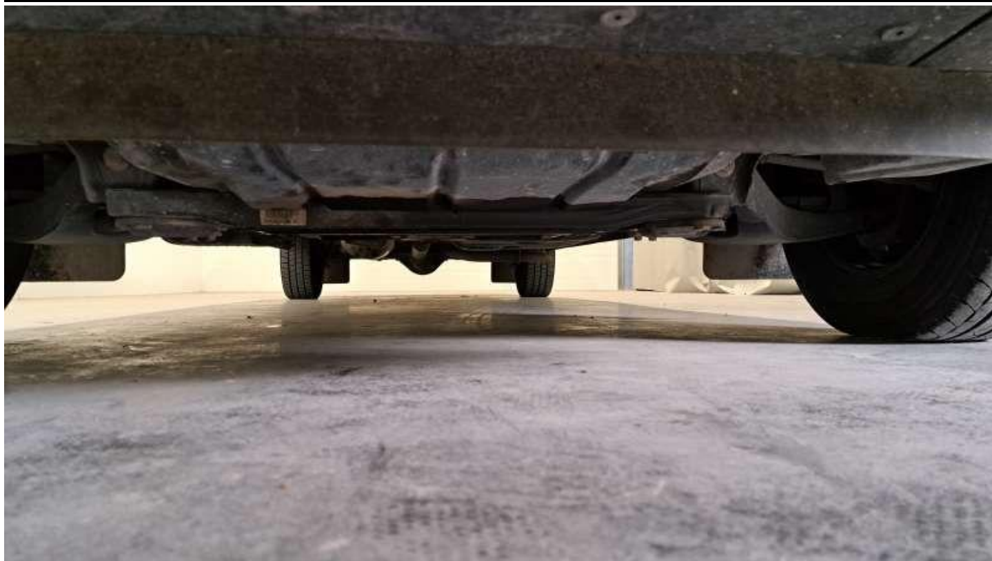
Fot. nr 69