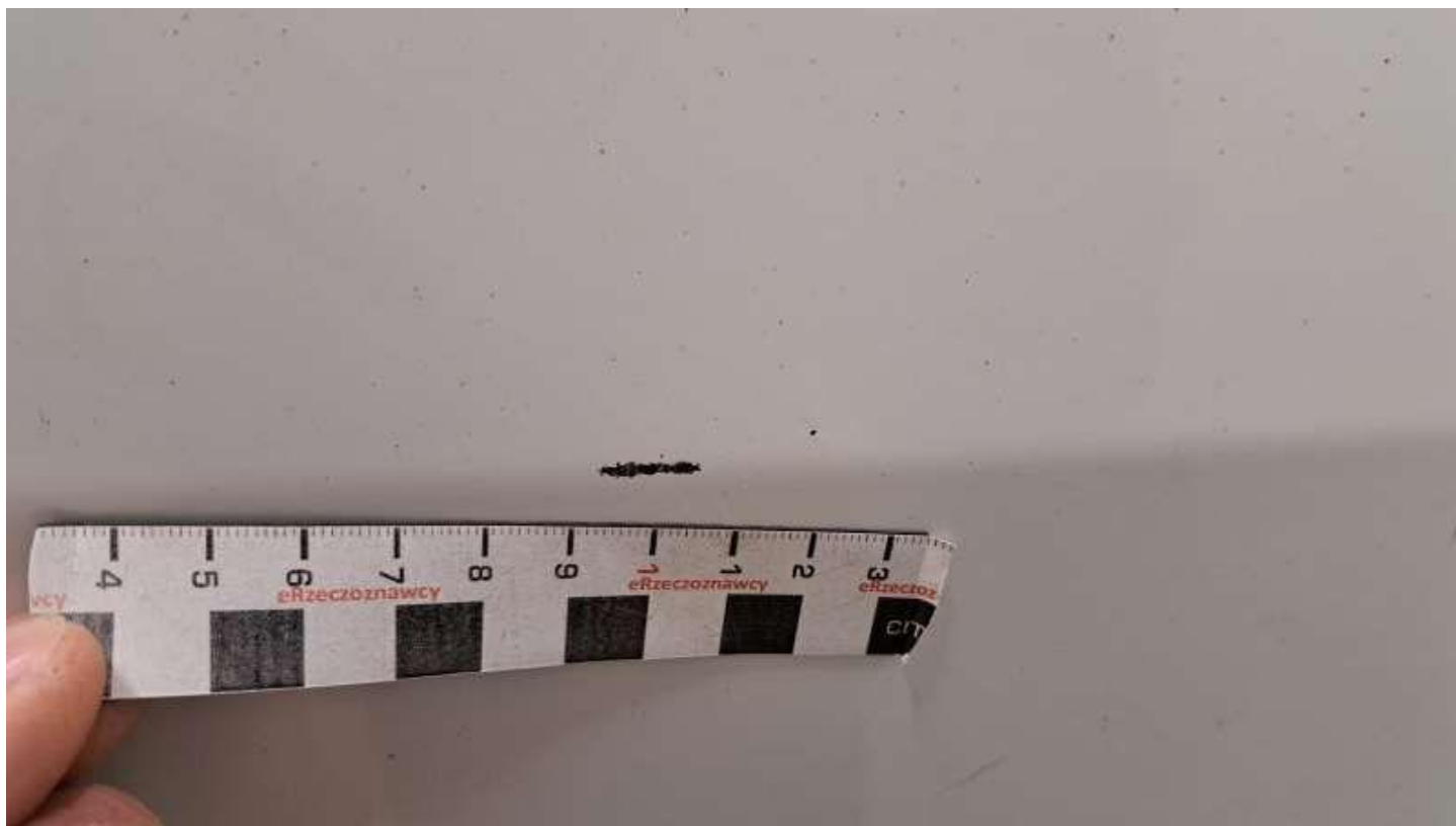
Fot. nr 60