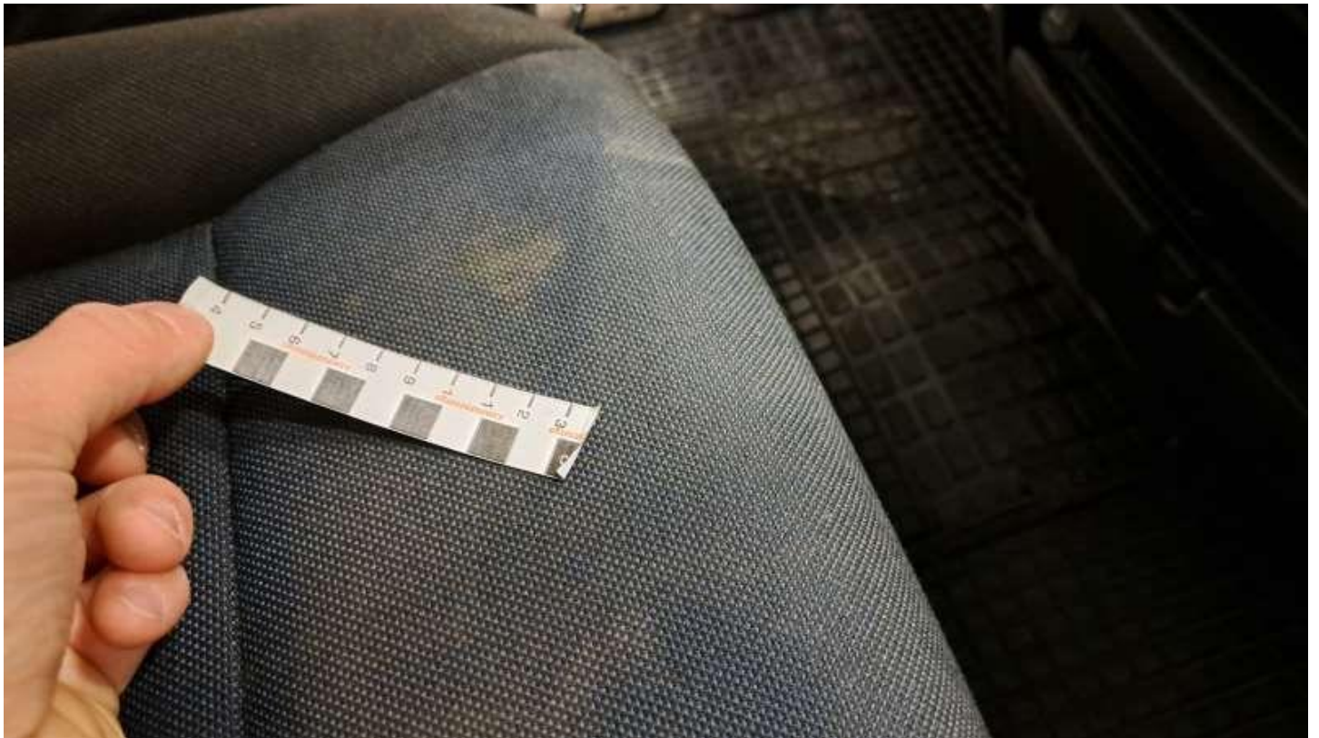
Fot. nr 44