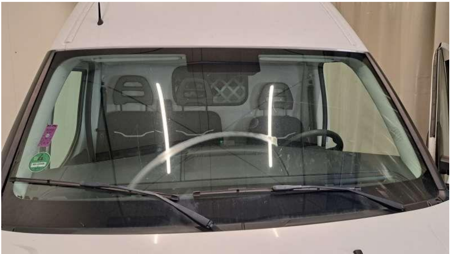
Fot. nr 46