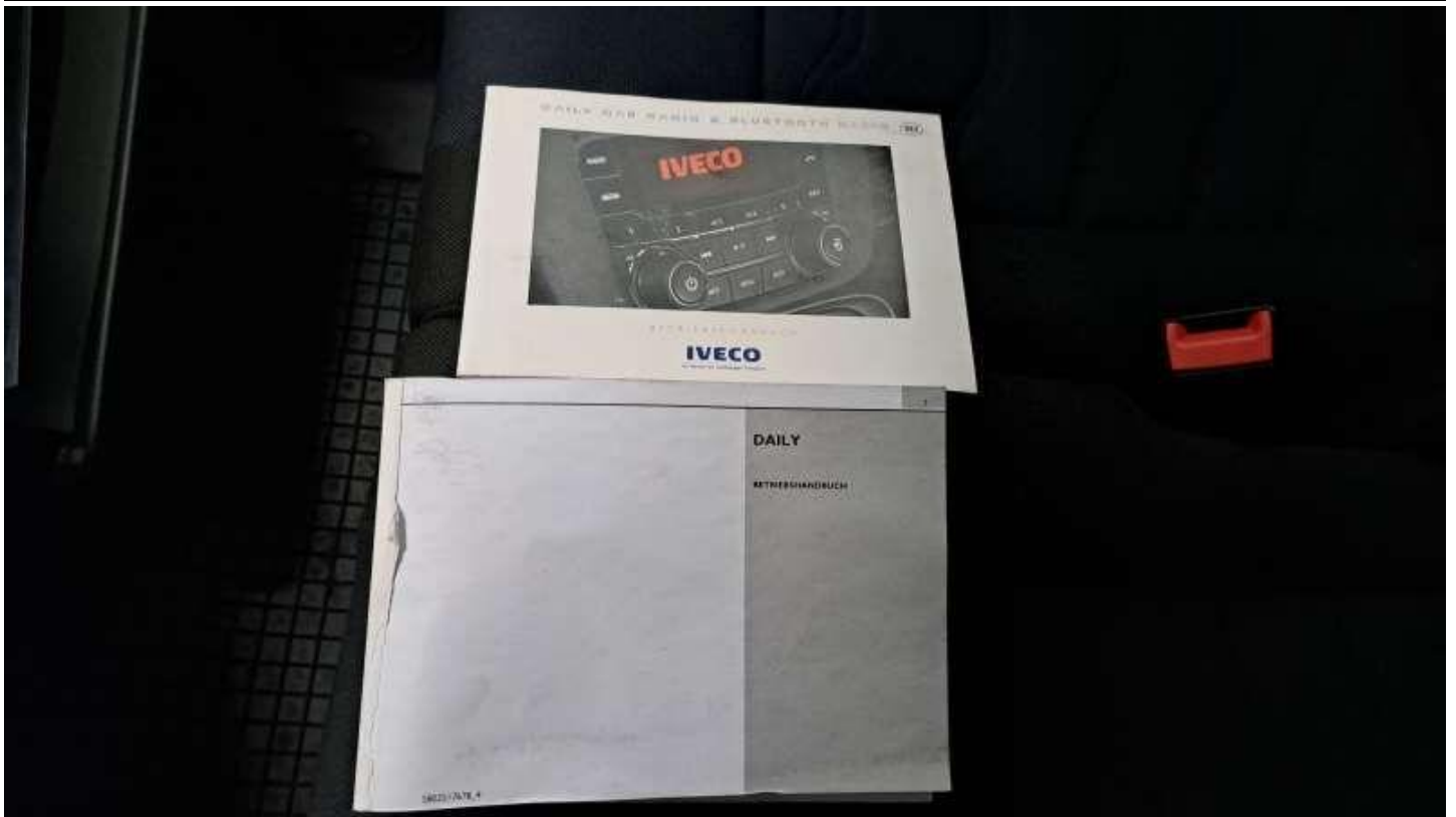
Fot. nr 77