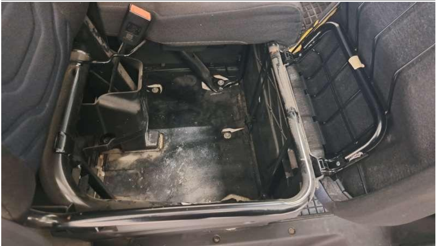
Fot. nr 45