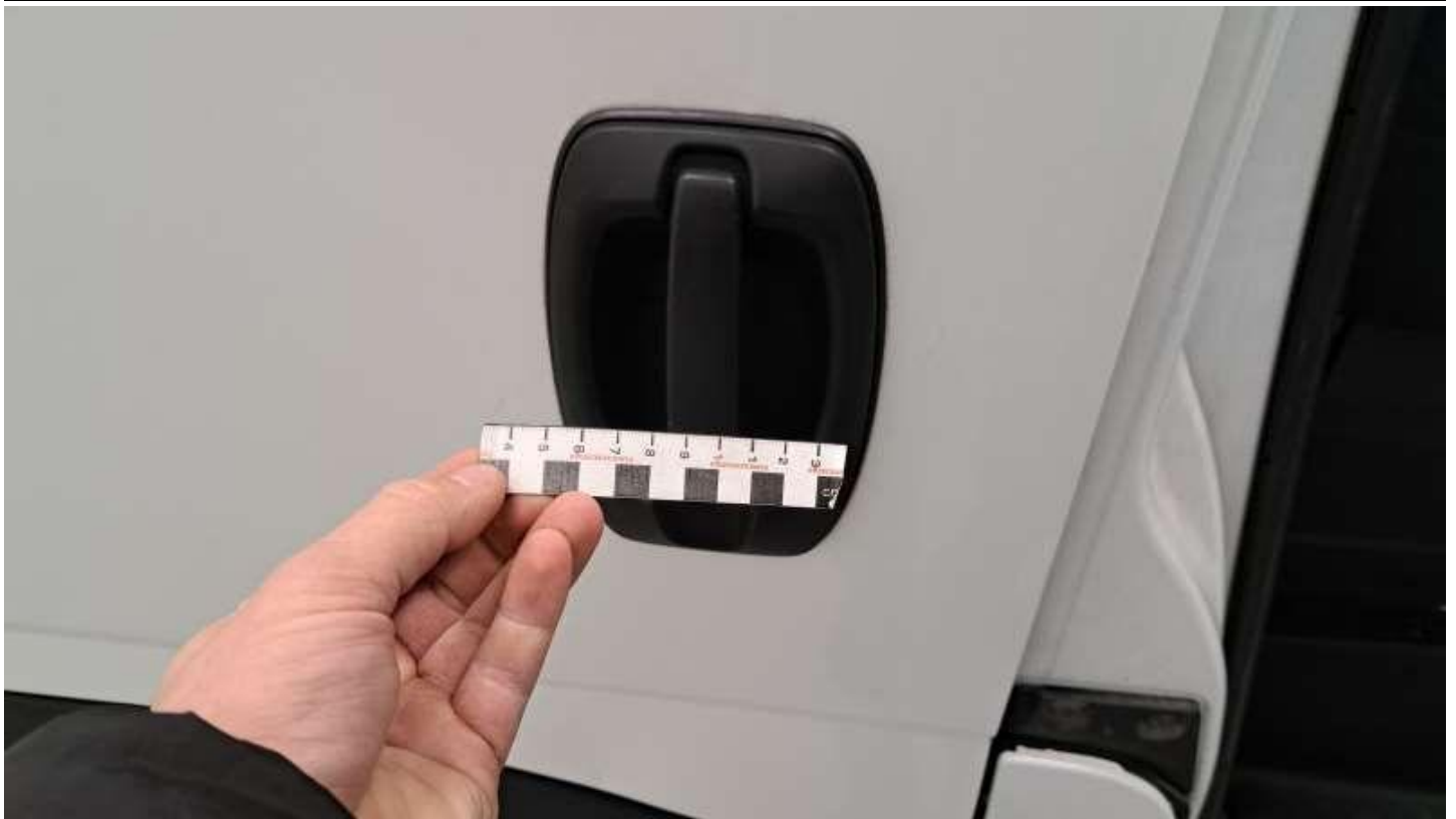
Fot. nr 37