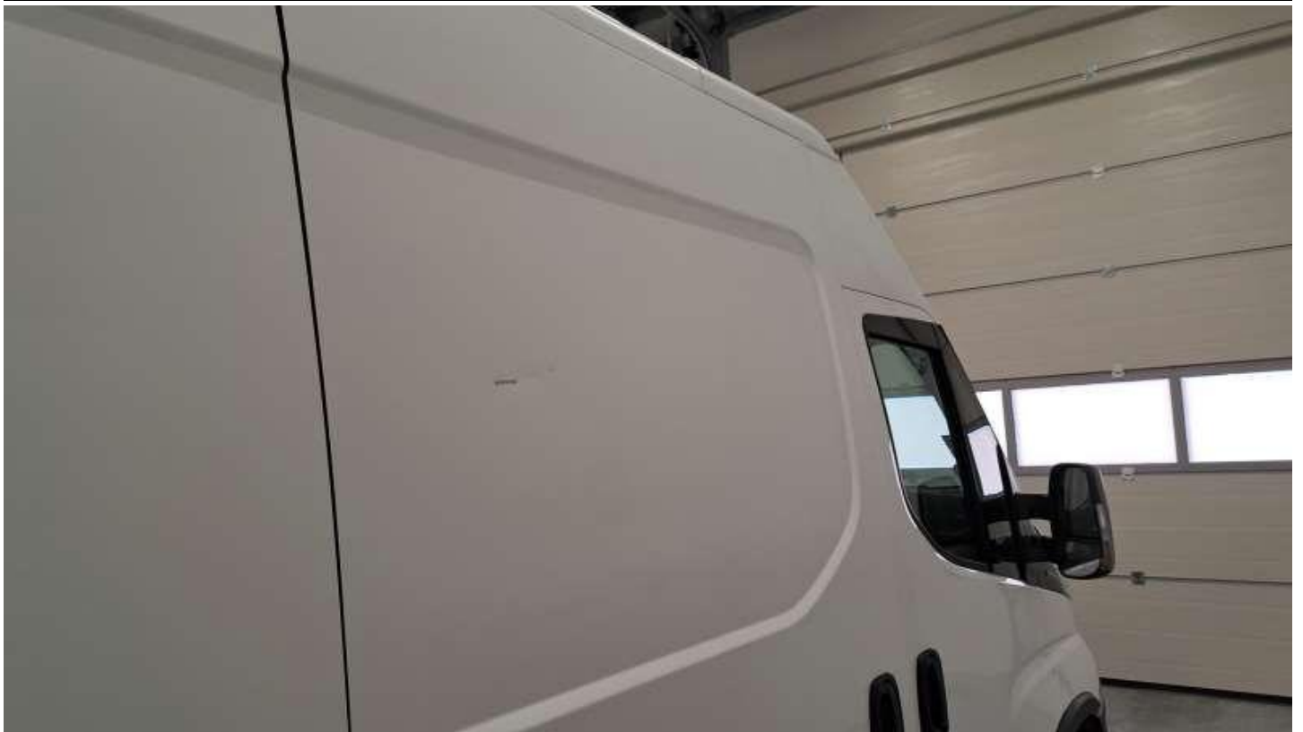
Fot. nr 65