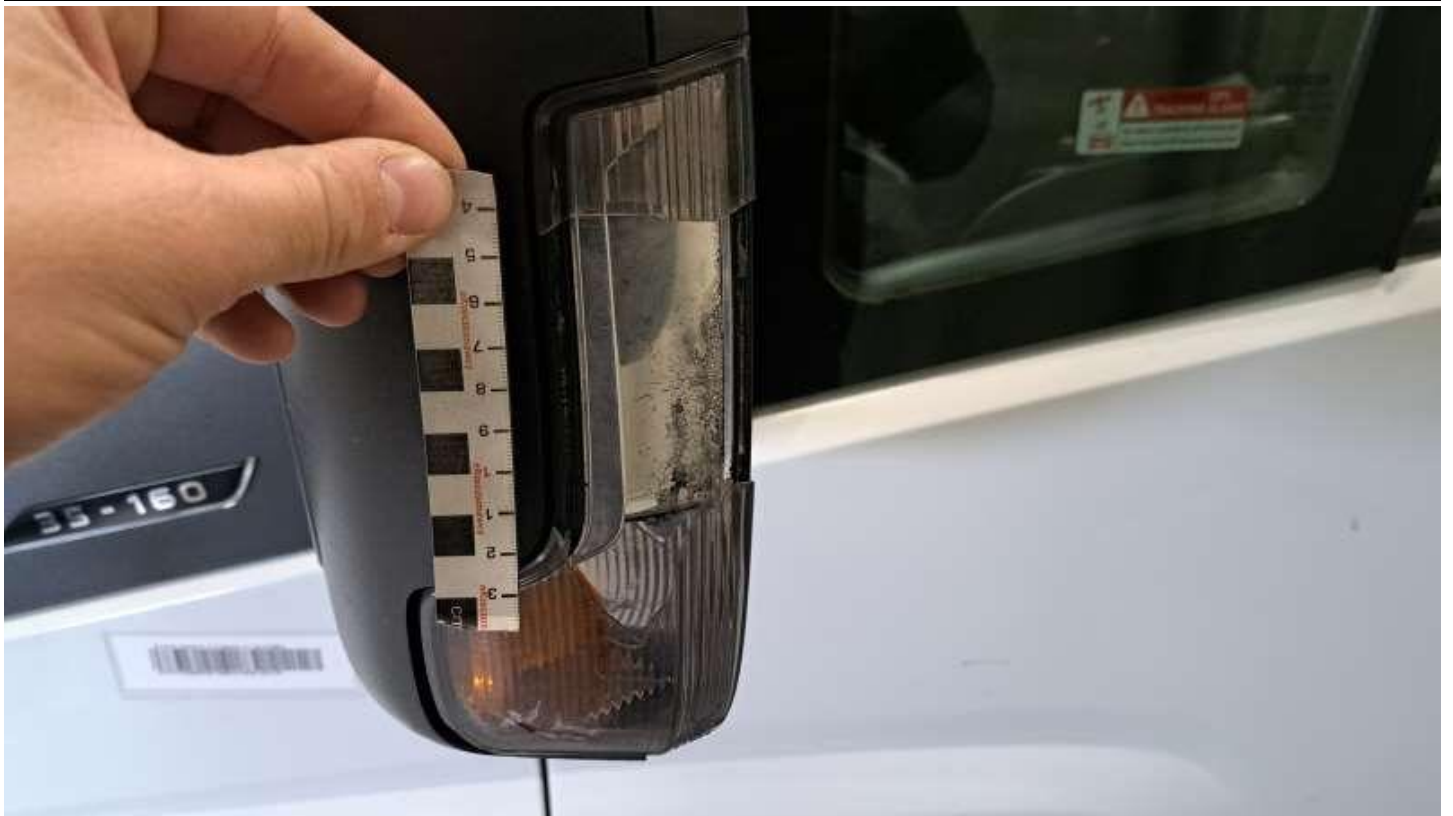
Fot. nr 51