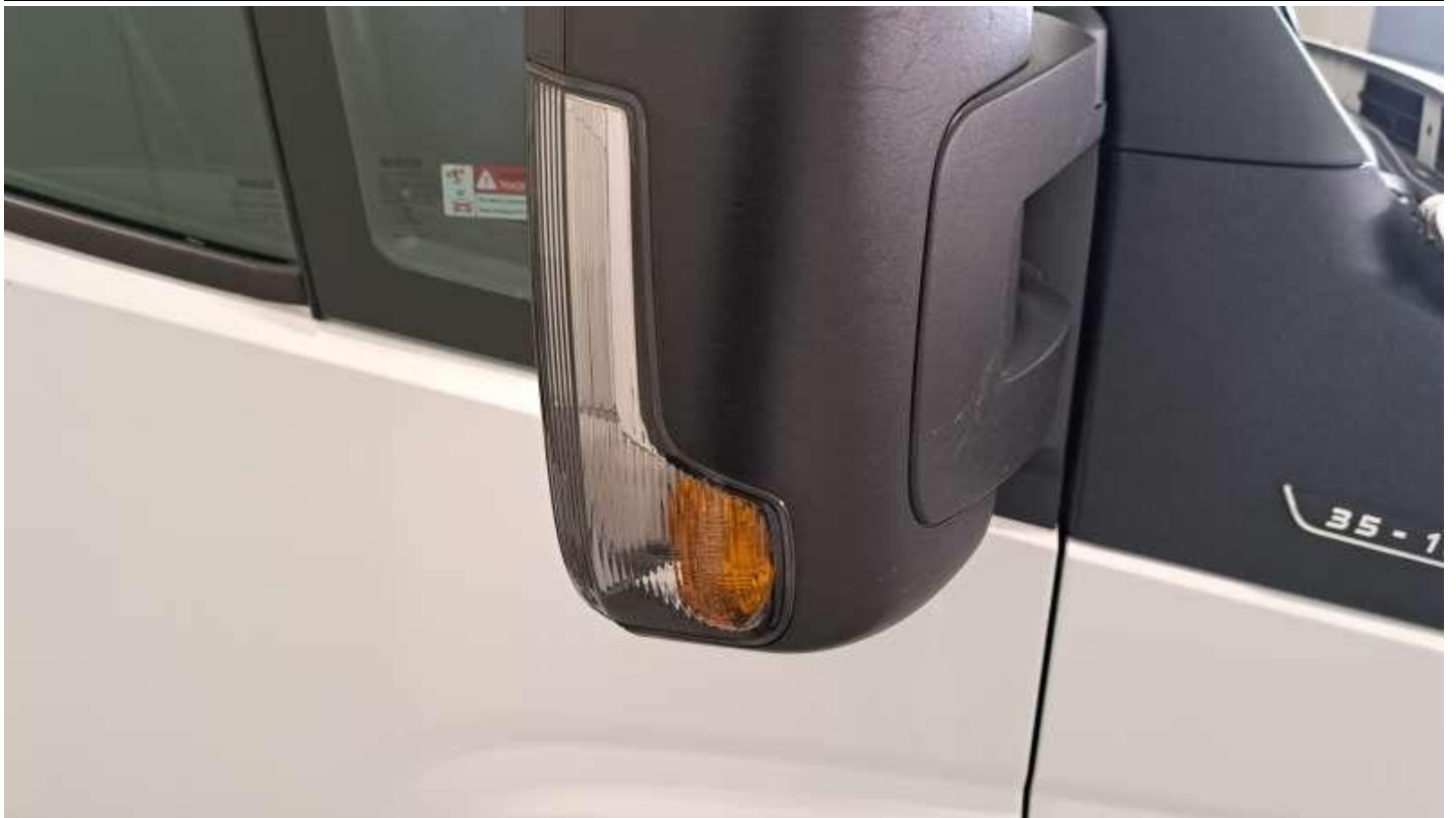
Fot. nr 67