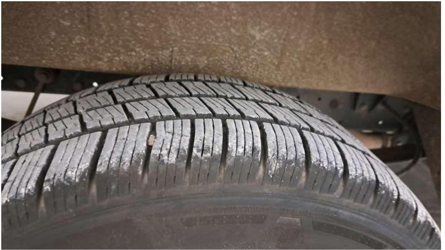
Fot. nr 75