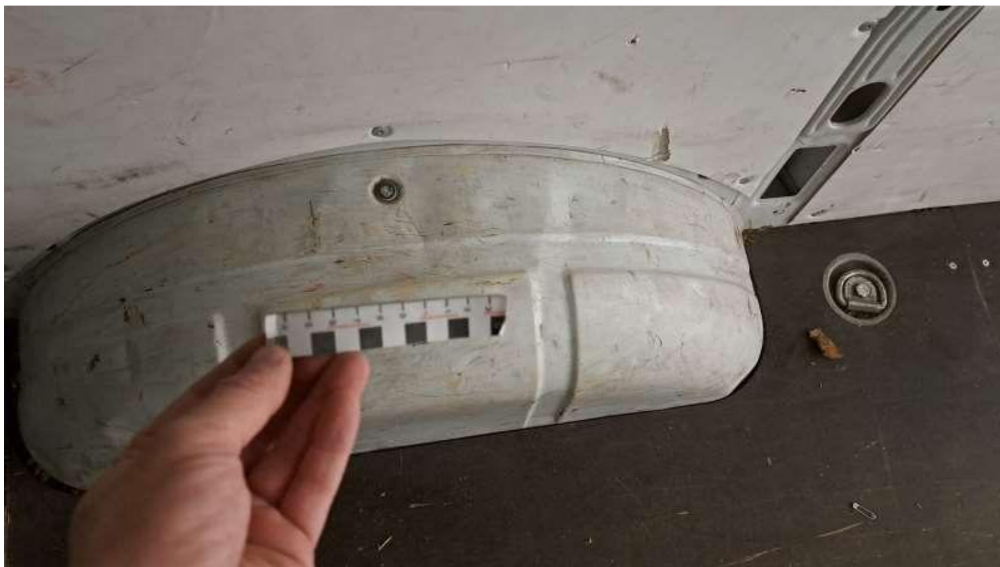
Fot. nr 28