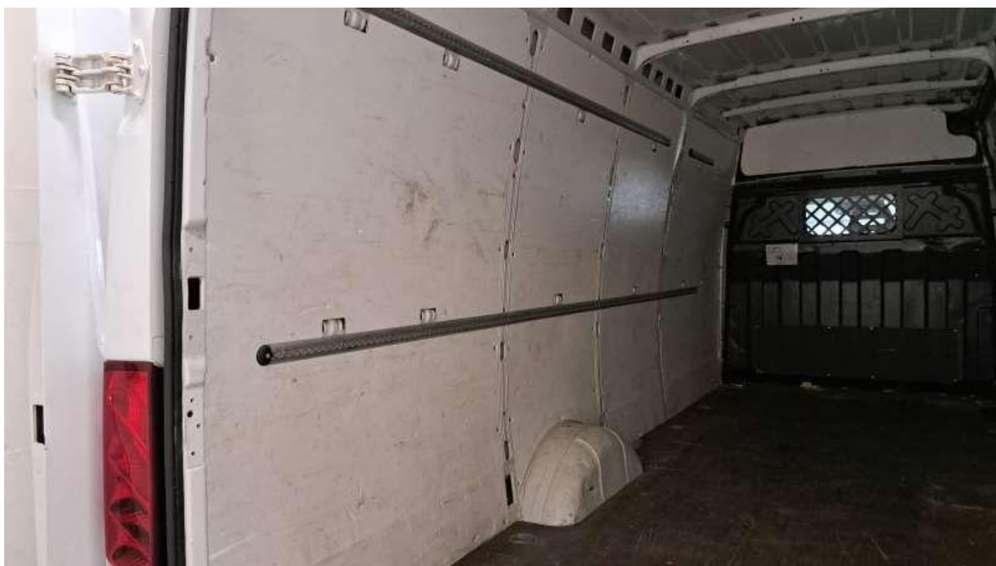
Fot. nr 34