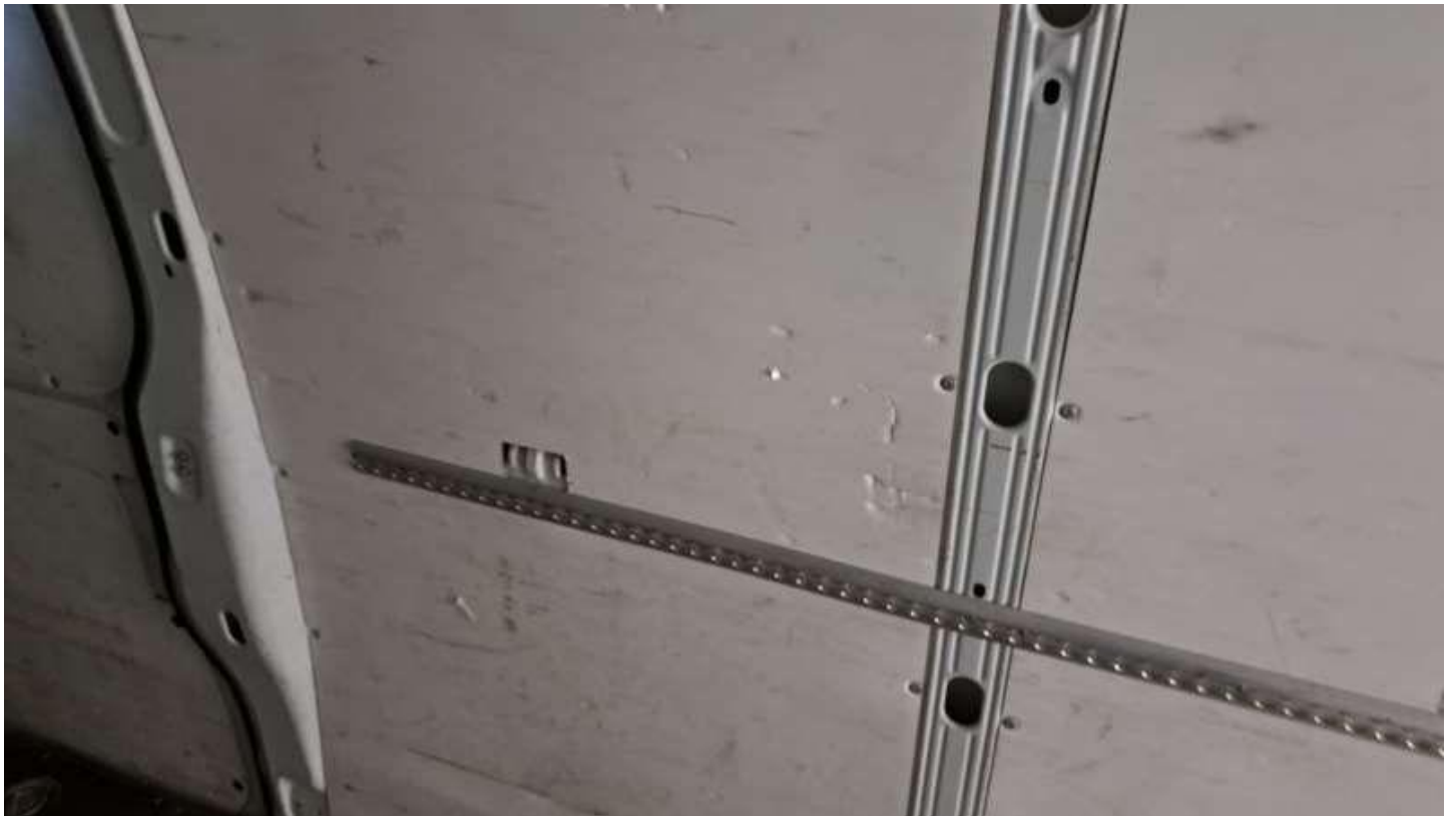
Fot. nr 30