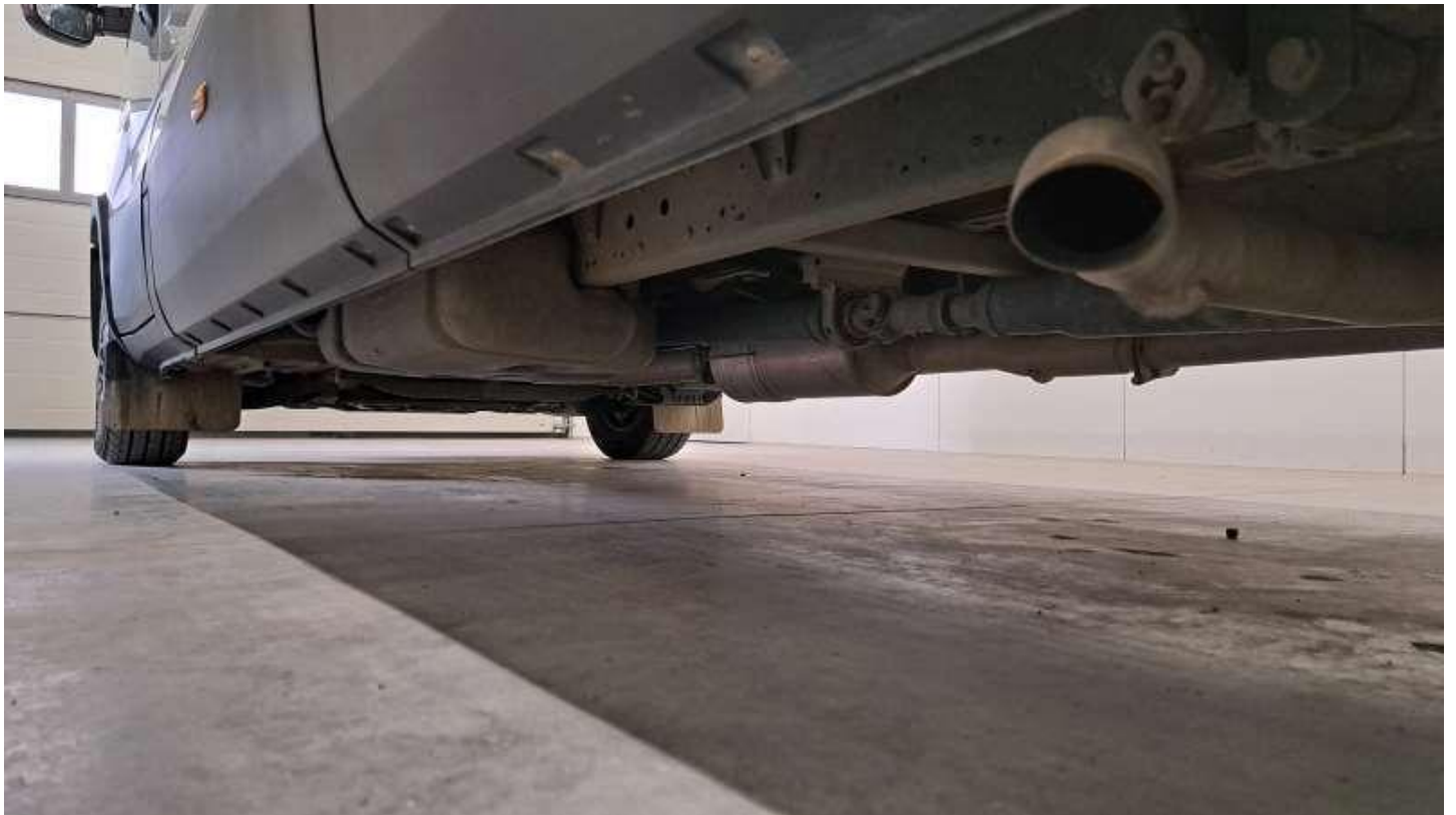
Fot. nr 72