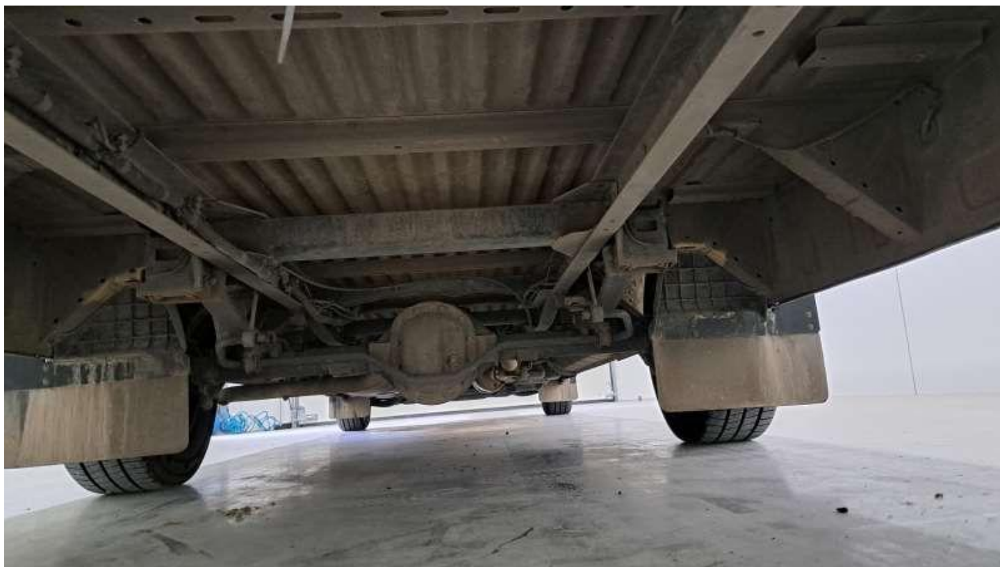
Fot. nr 70