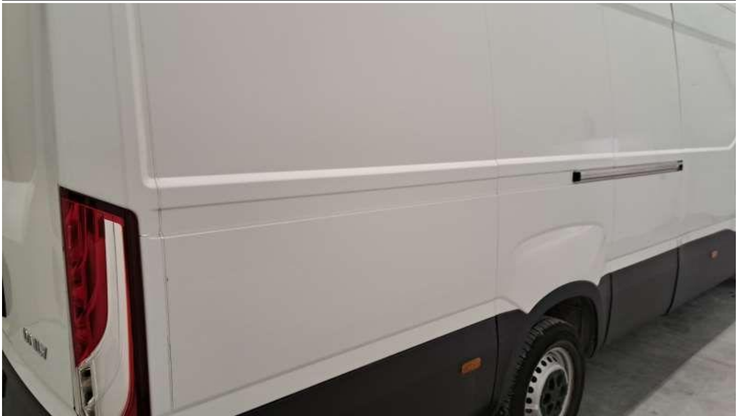
Fot. nr 63