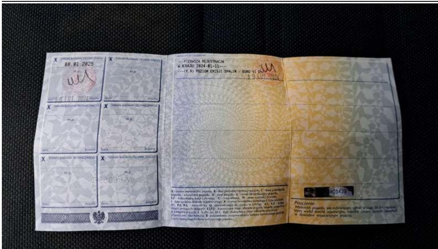
Fot. nr 79