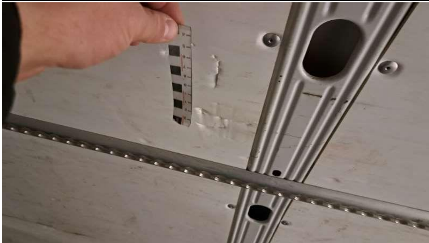
Fot. nr 31