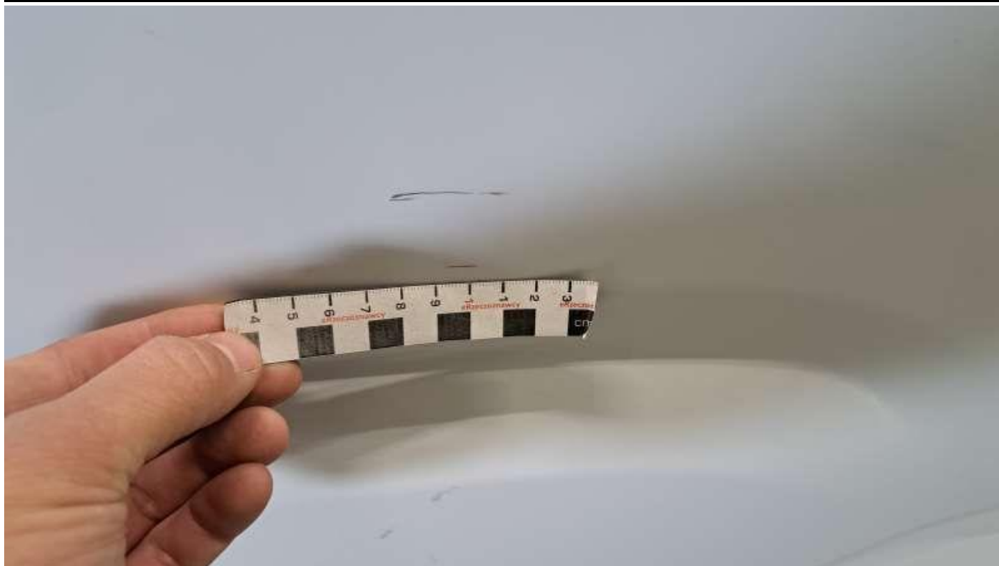
Fot. nr 53