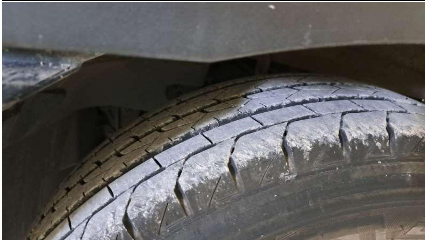
Fot. nr 73