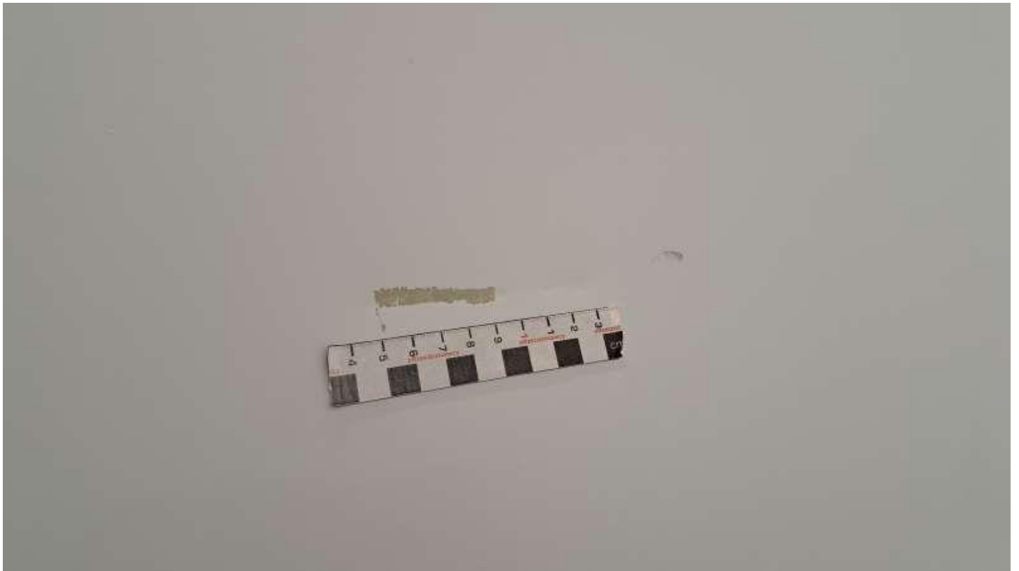
Fot. nr 66