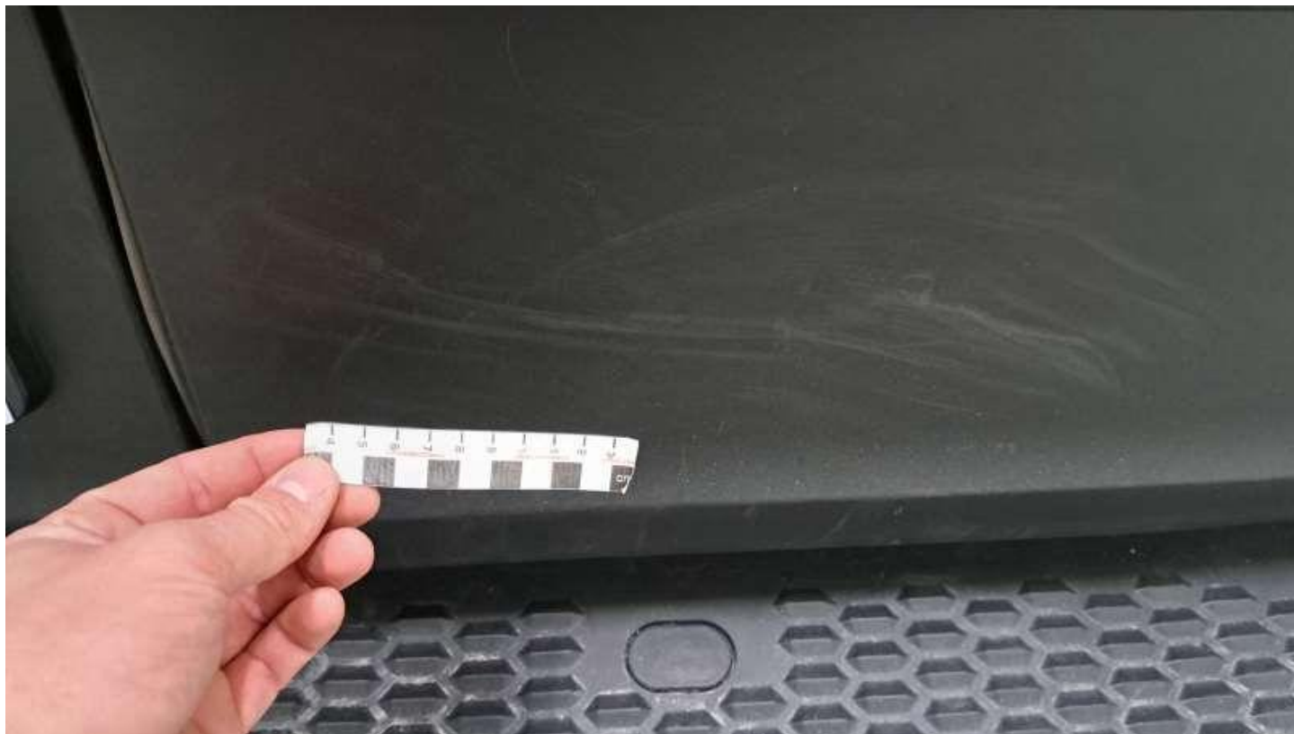
Fot. nr 62