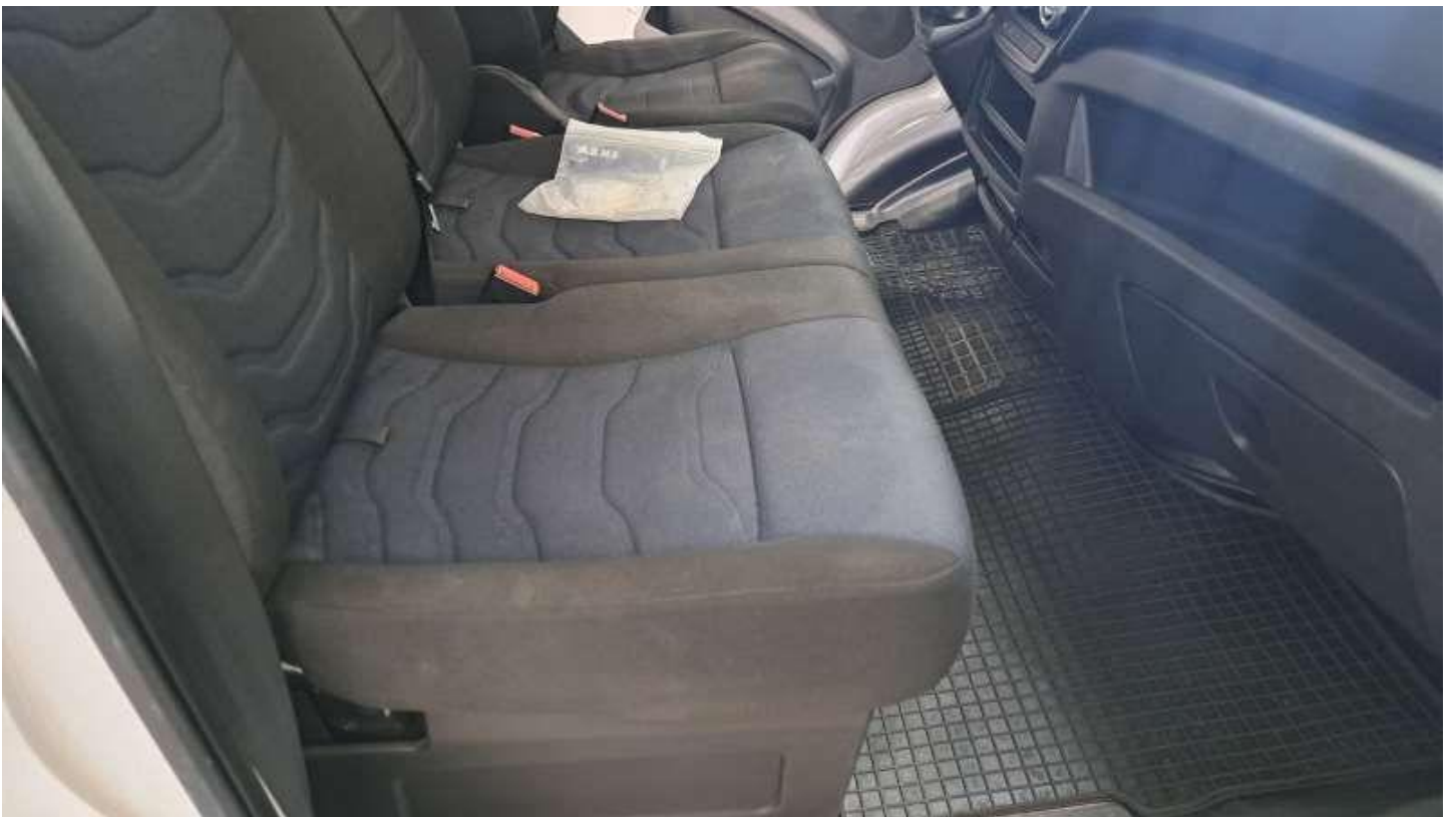
Fot. nr 42