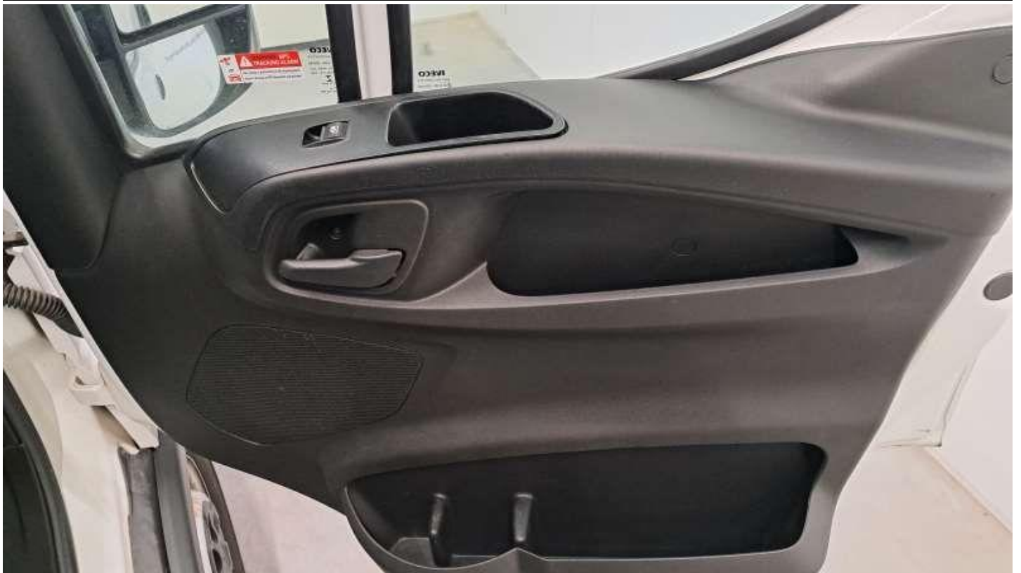
Fot. nr 39