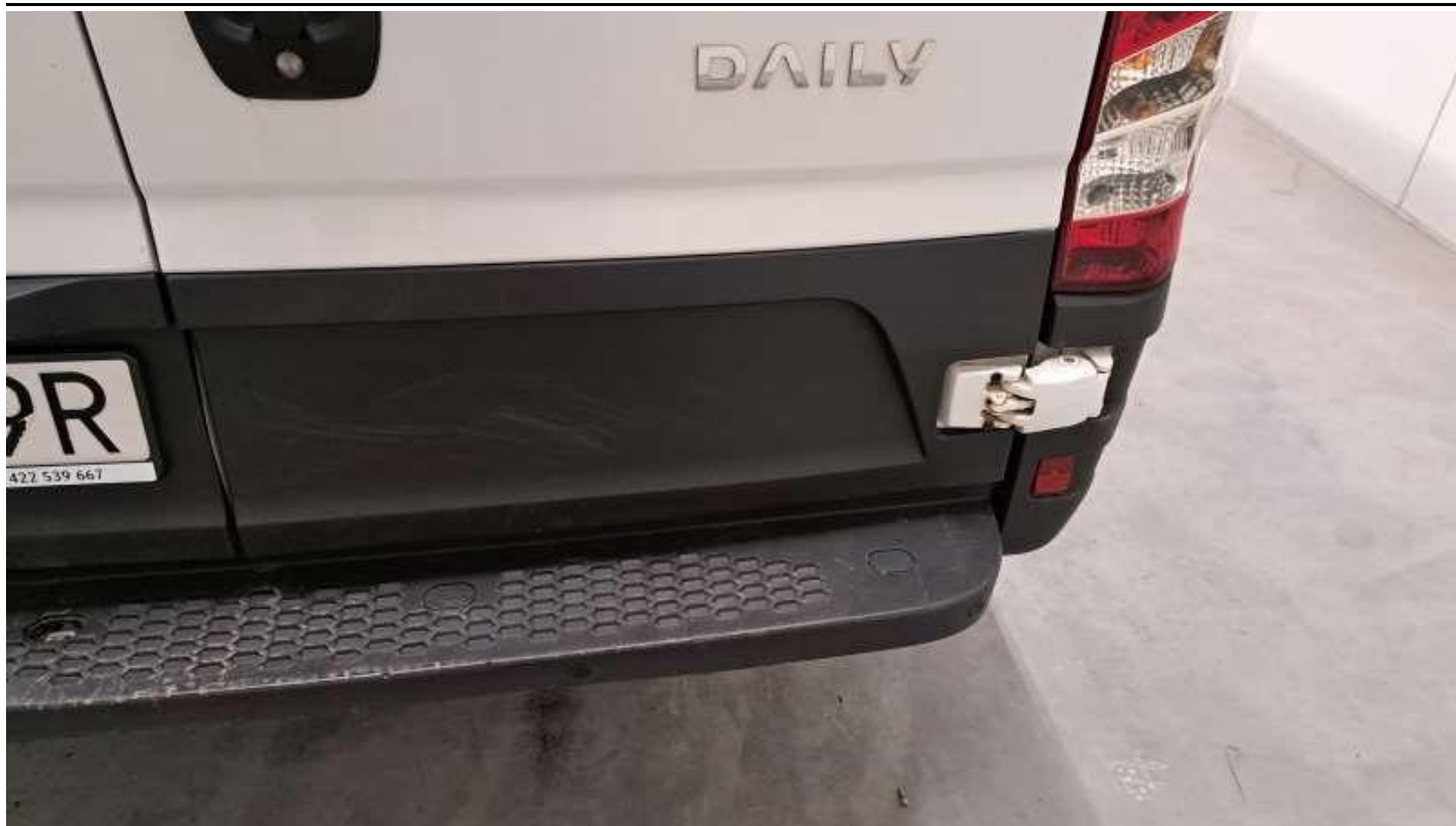
Fot. nr 61