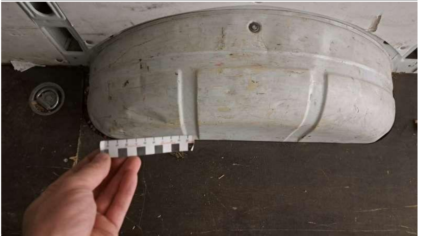
Fot. nr 29