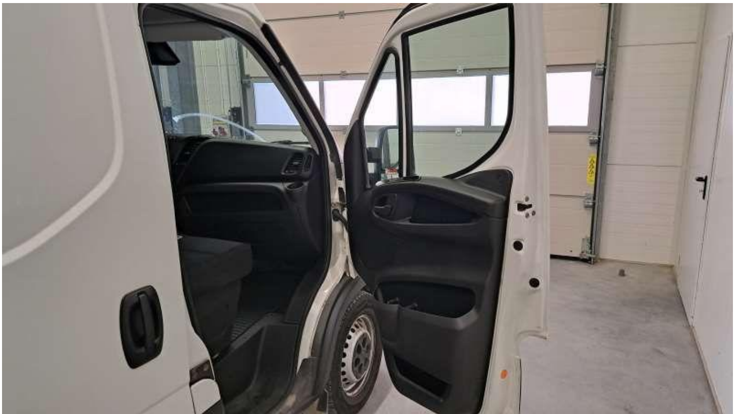
Fot. nr 38