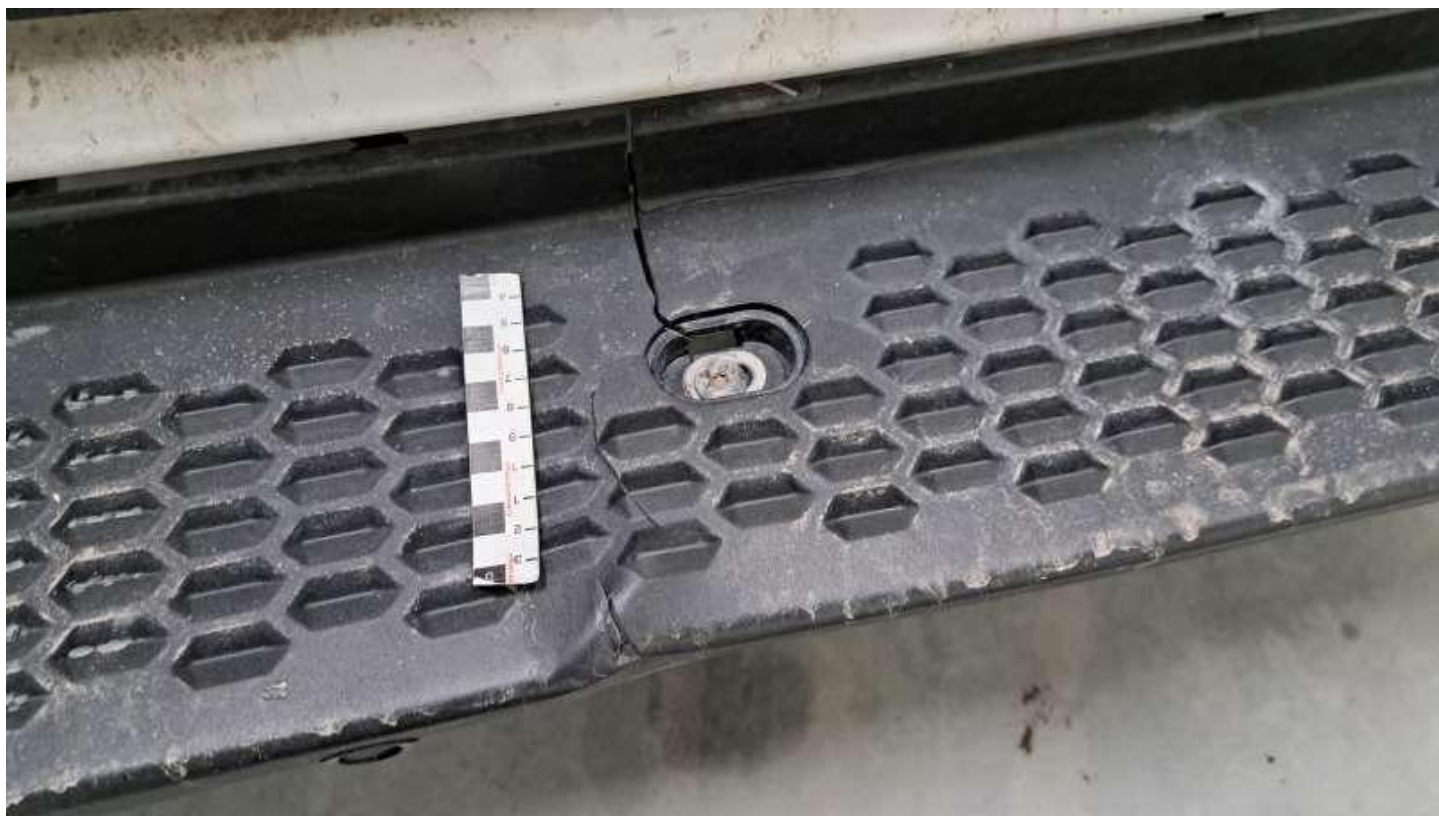
Fot. nr 36