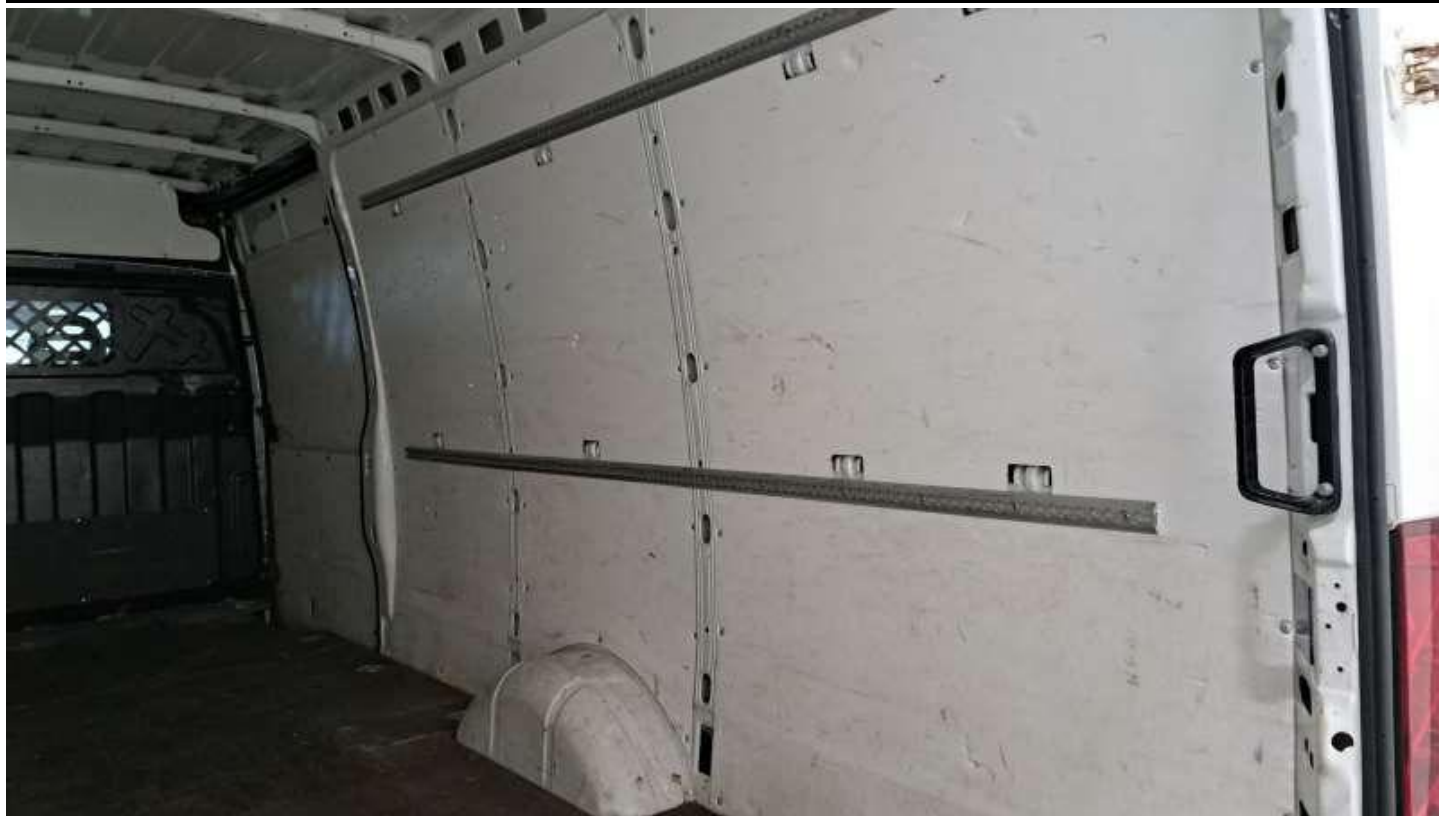
Fot. nr 27