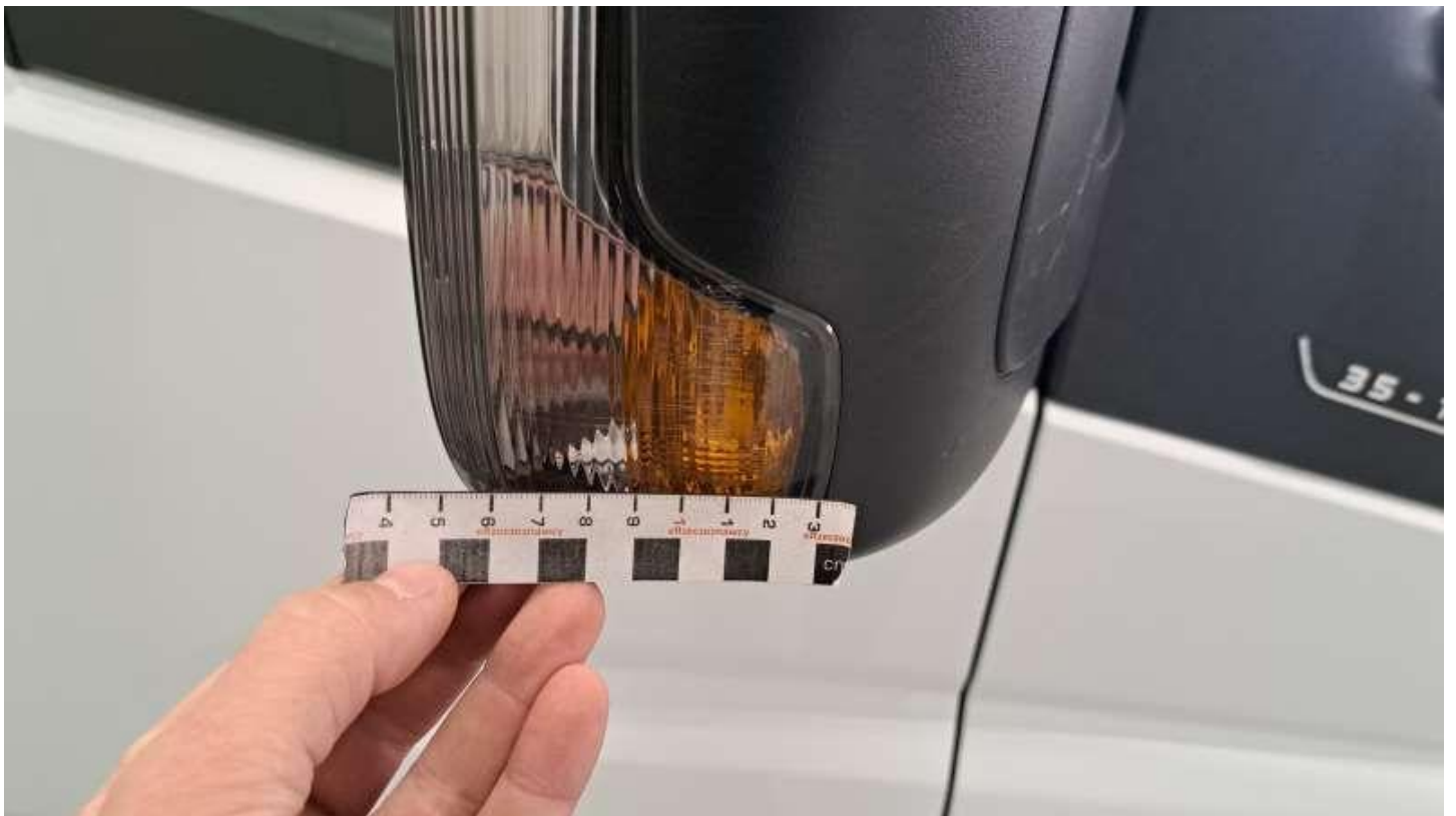
Fot. nr 68