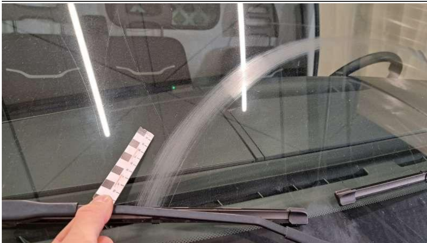
Fot. nr 47