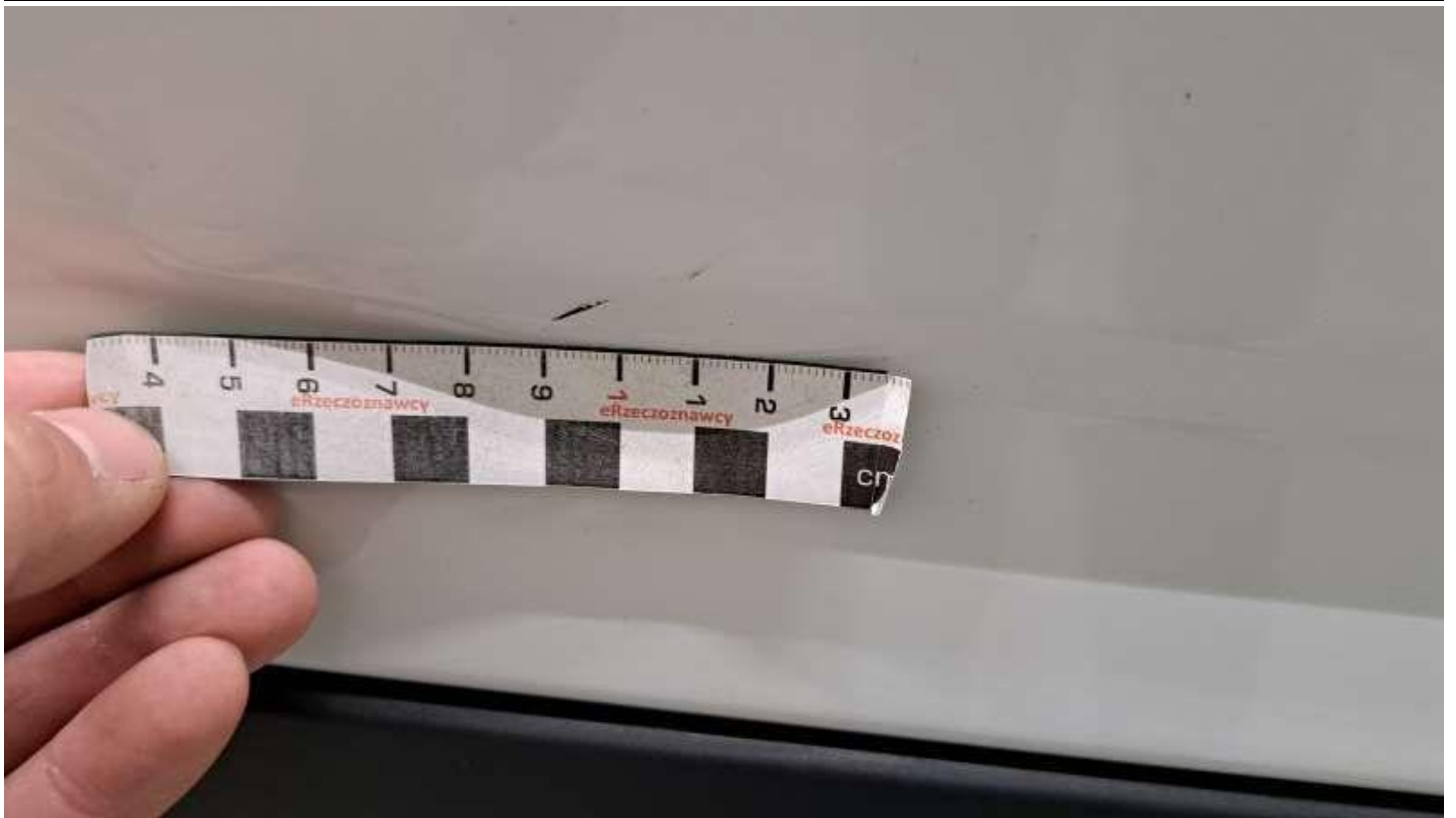
Fot. nr 57