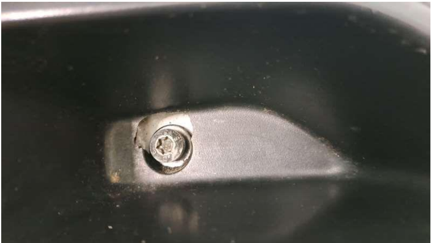
Fot. nr 40