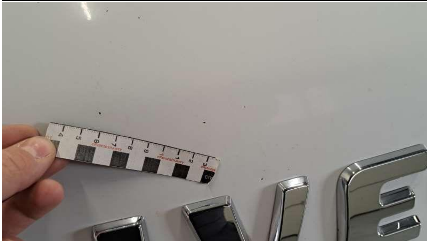
Fot. nr 49