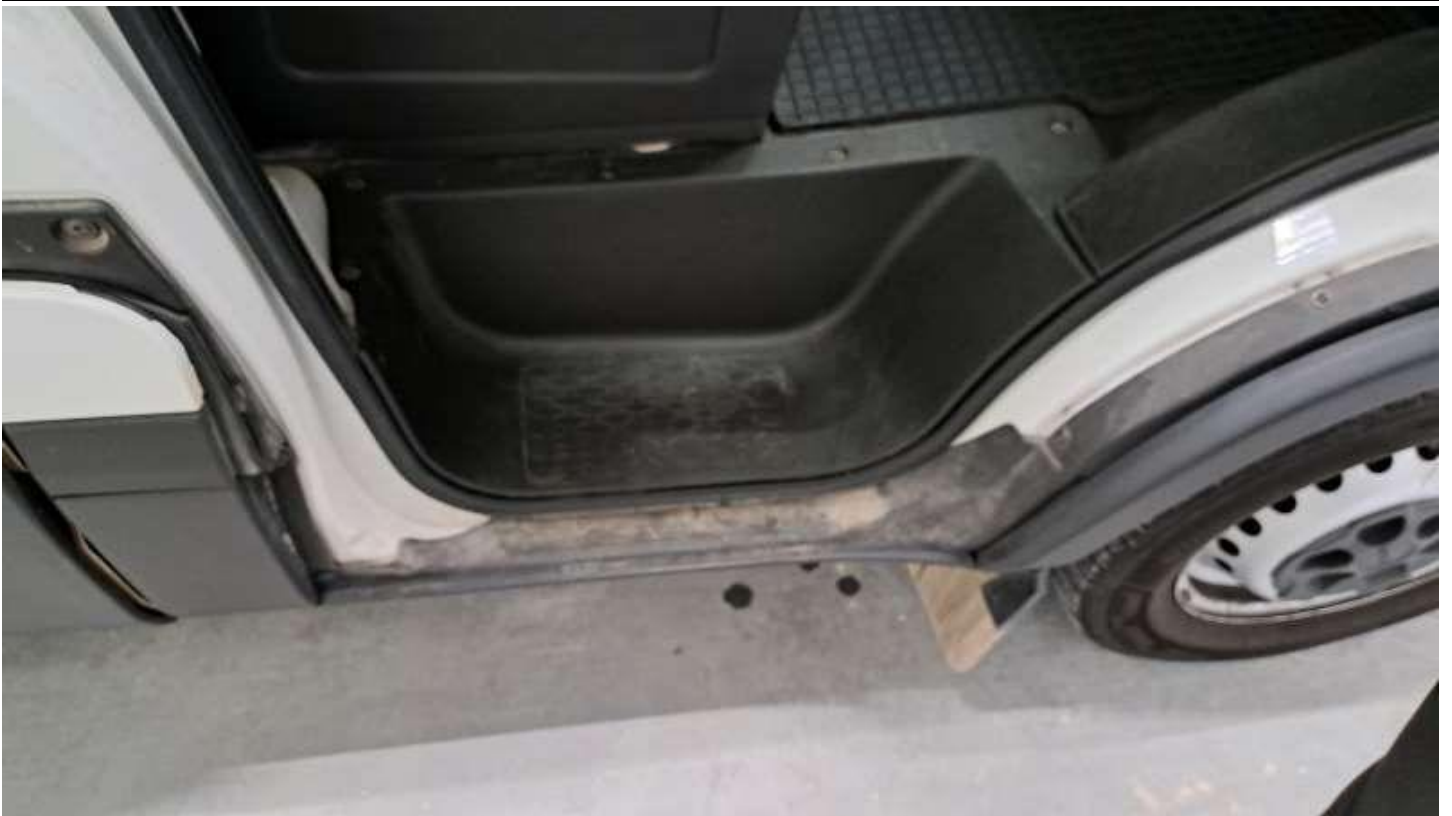
Fot. nr 41