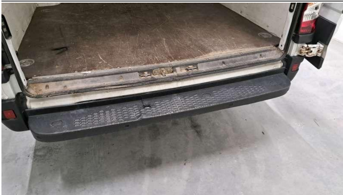
Fot. nr 35