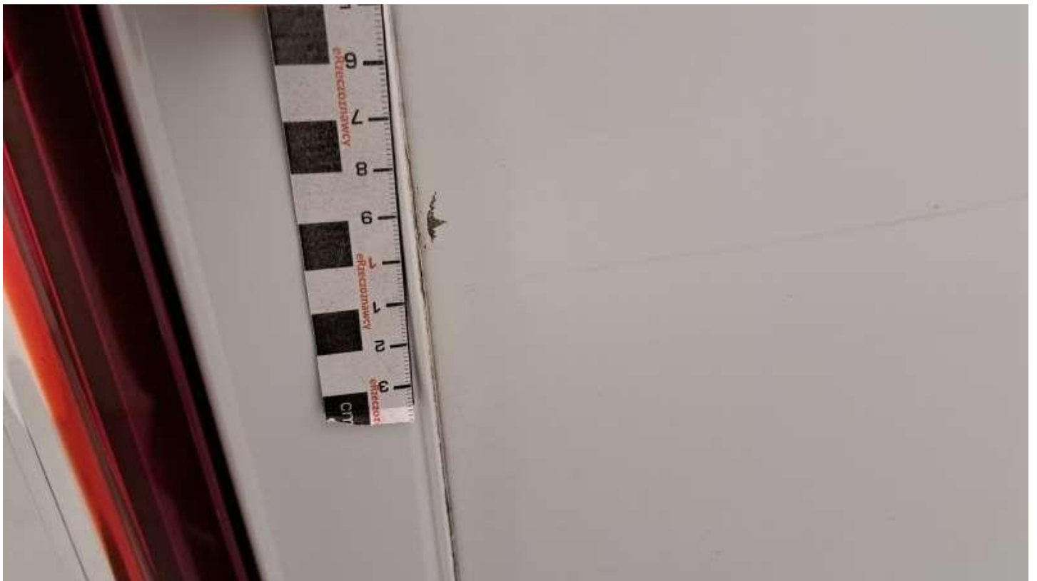
Fot. nr 64