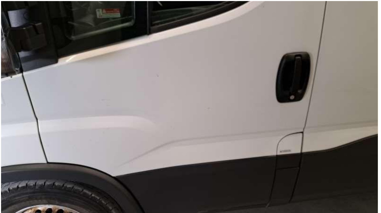
Fot. nr 52