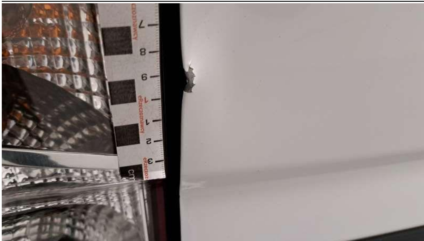
Fot. nr 59