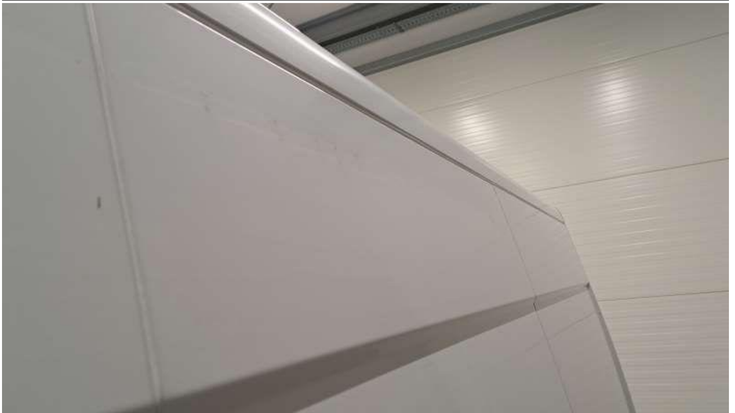
Fot. nr 55