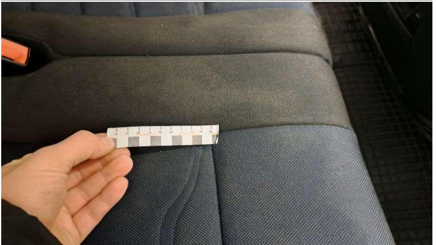
Fot. nr 43