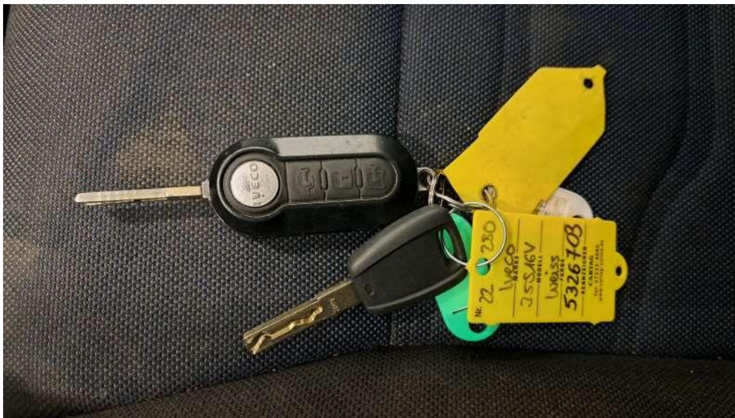
Fot. nr 80

Dokument wystawiony elektronicznie, wa ny bez podpisu