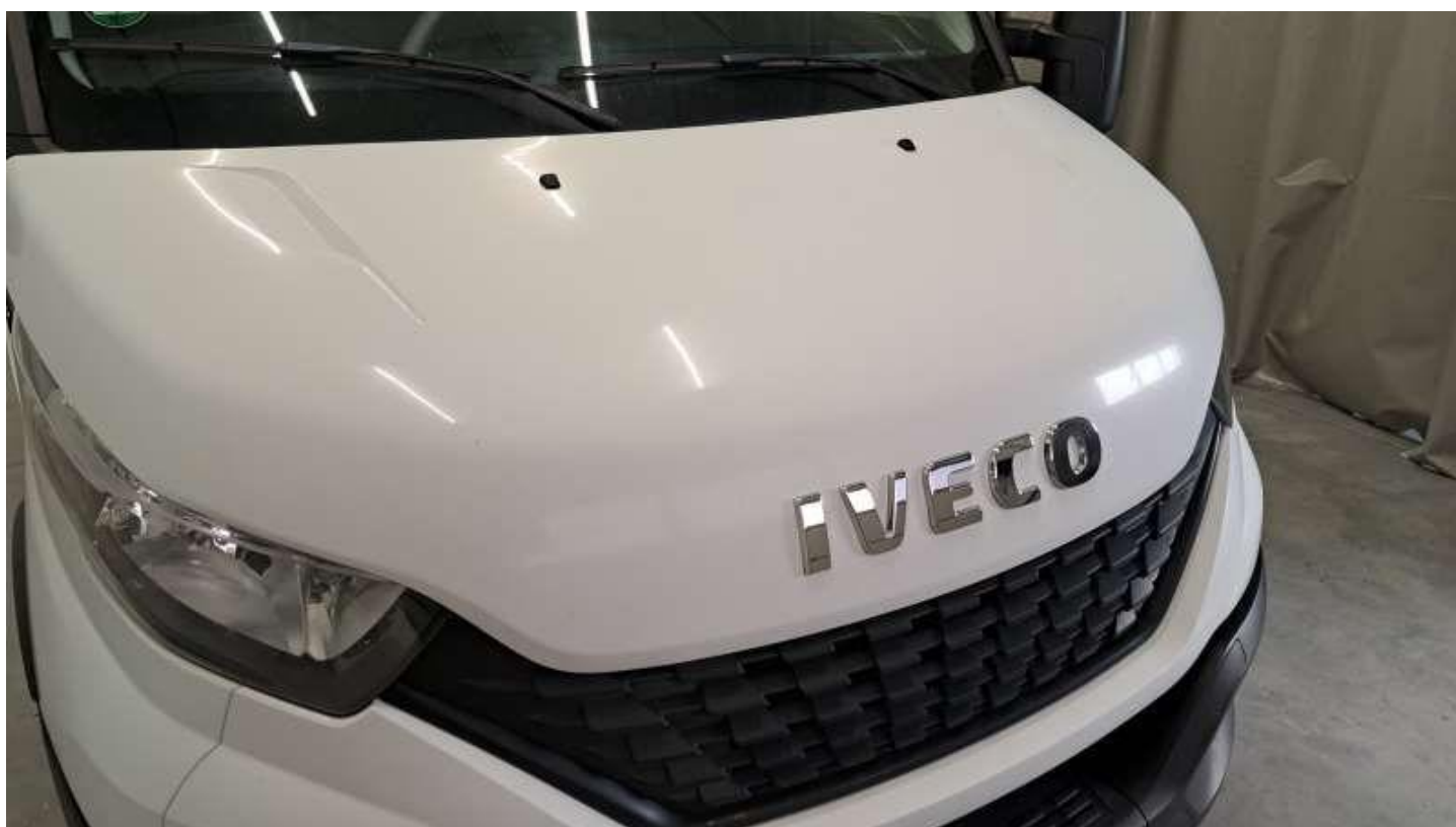
Fot. nr 48