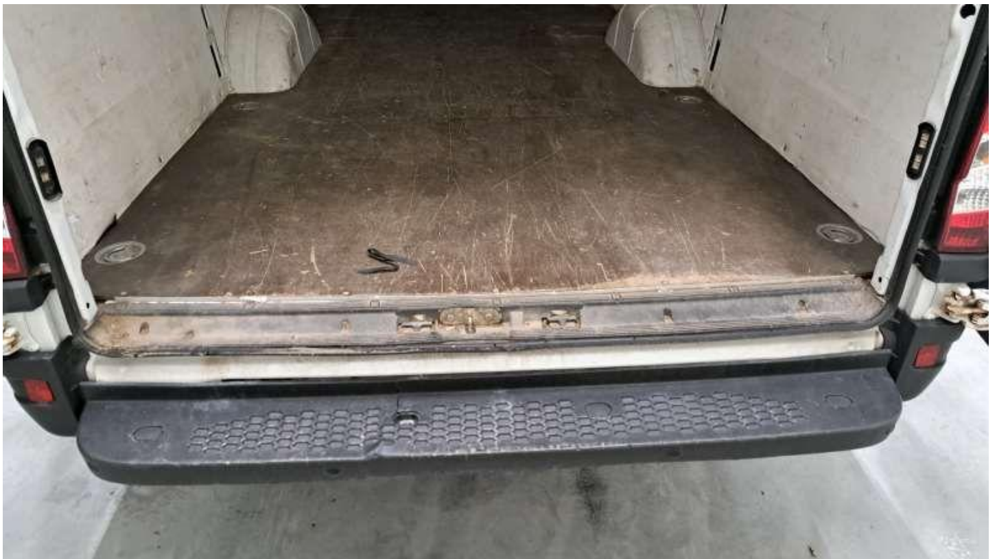
Fot. nr 26