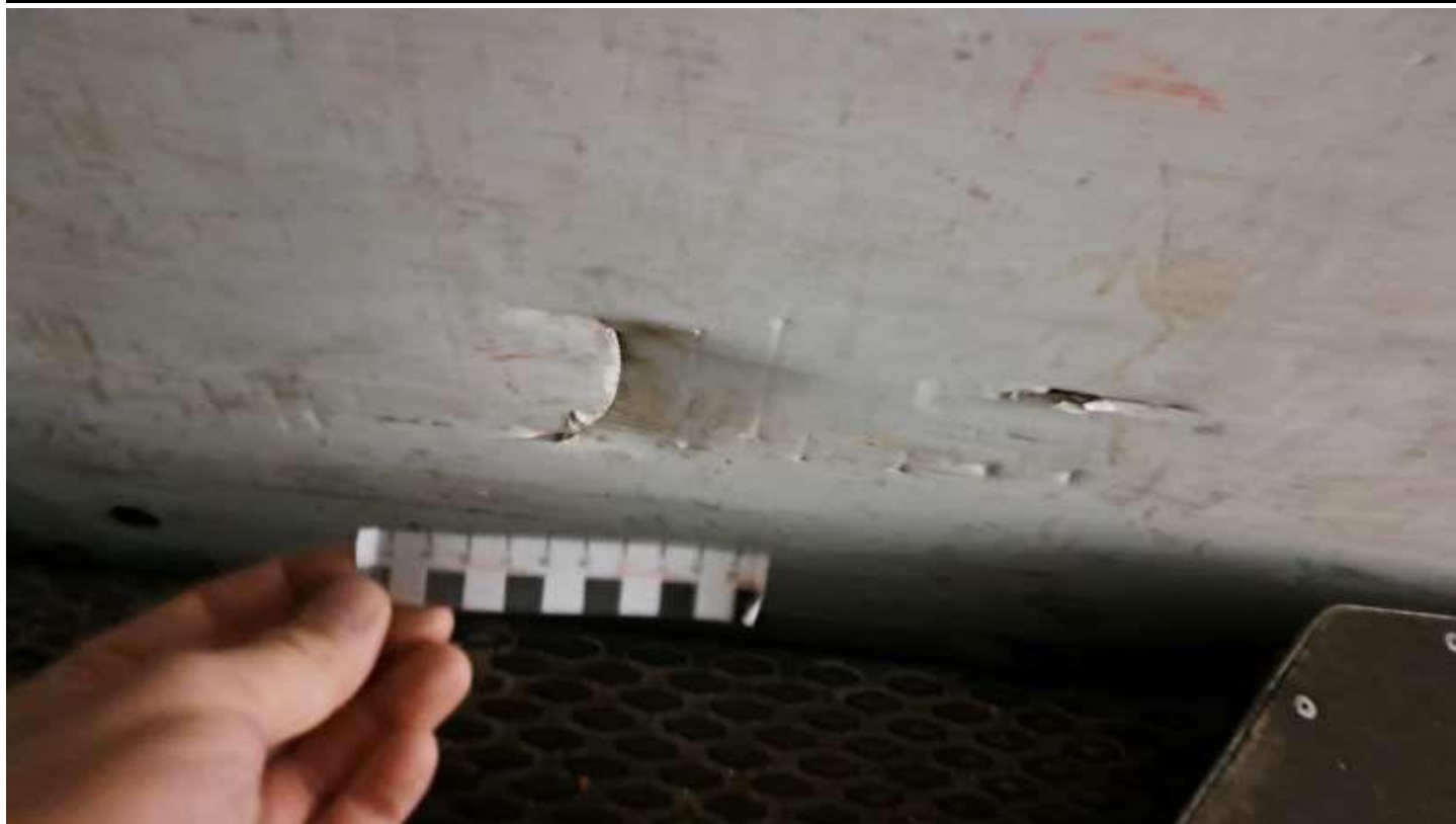
Fot. nr 33