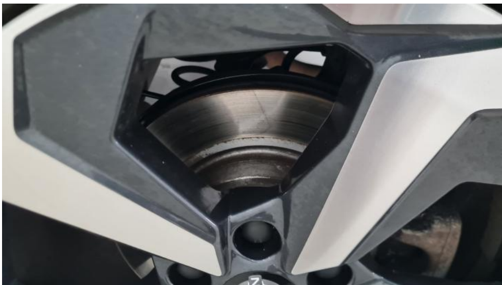
Photo 17. Tarcza hamulcowa tylna lewa