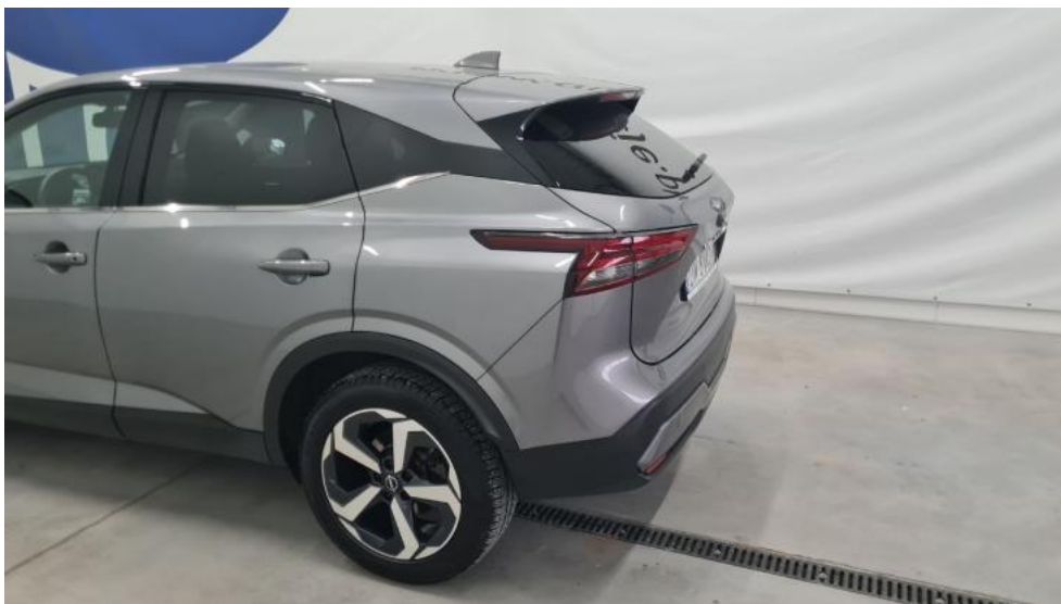
Photo 9. Bok lewy z tyłu