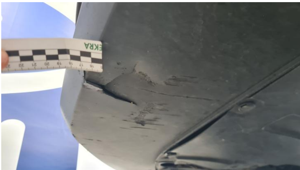
Photo 35. Spoiler zderzaka przedniego - Pęknięcie/rozerwanie 1