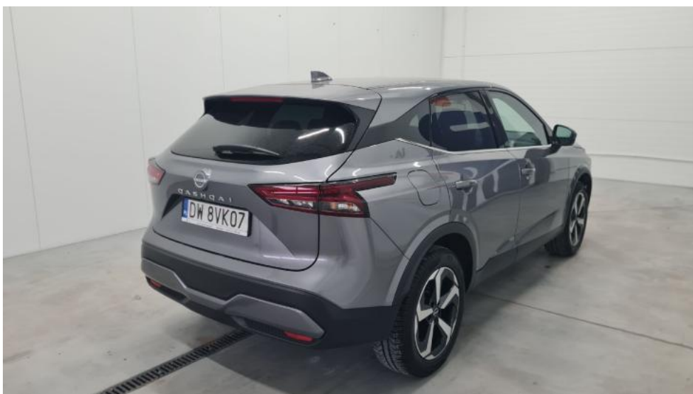
Photo 6. Przekątna tylna prawa