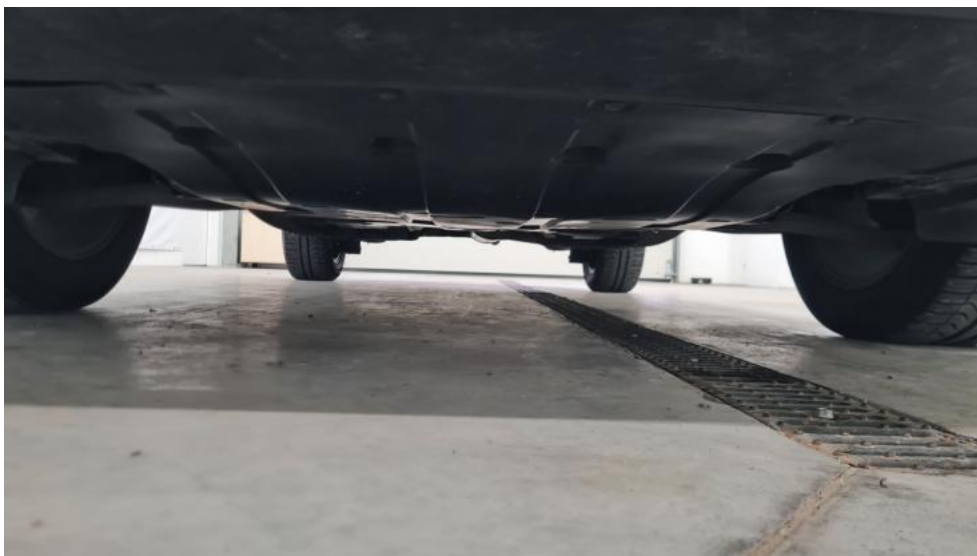
Photo 13. Spód pojazdu przód