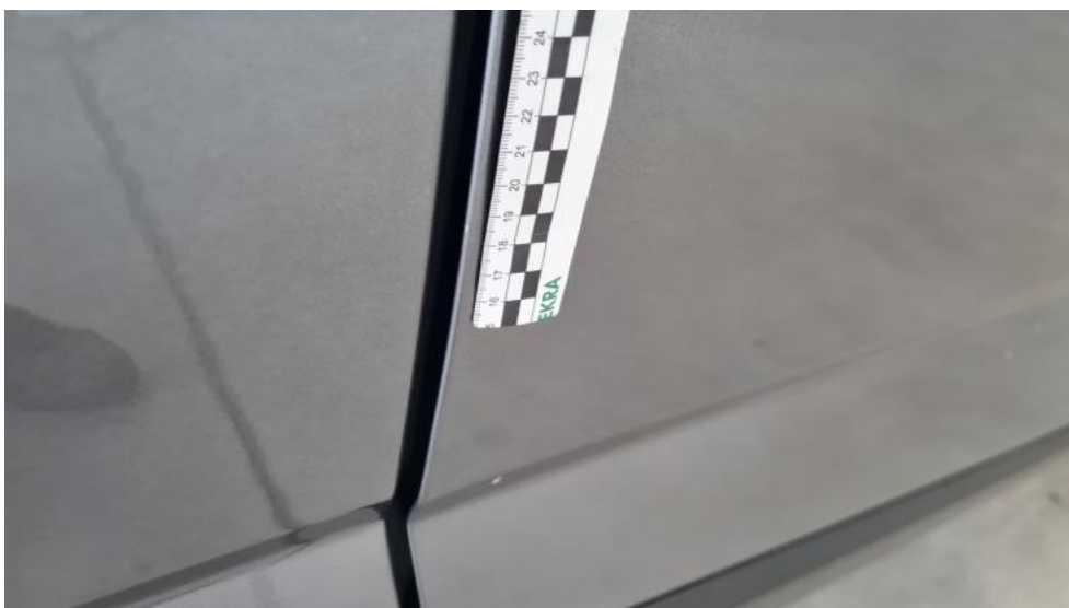
Photo 36. Drzwi przednie P - Rysa/odprysk 1