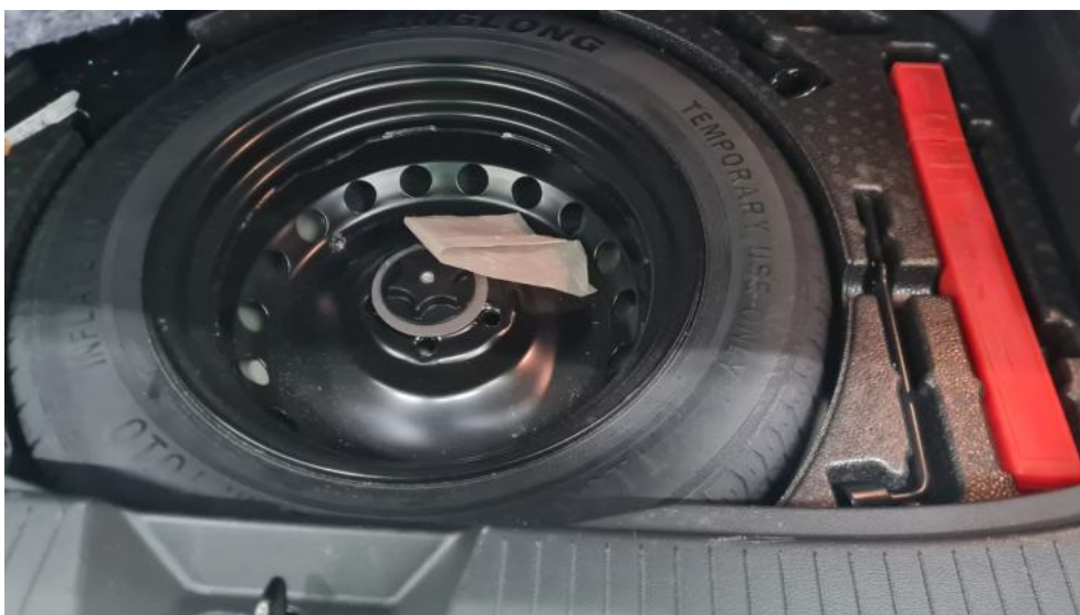
Photo 20. Koło zapasowe