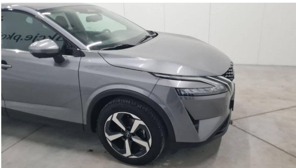
Photo 4. Bok prawy z przodu