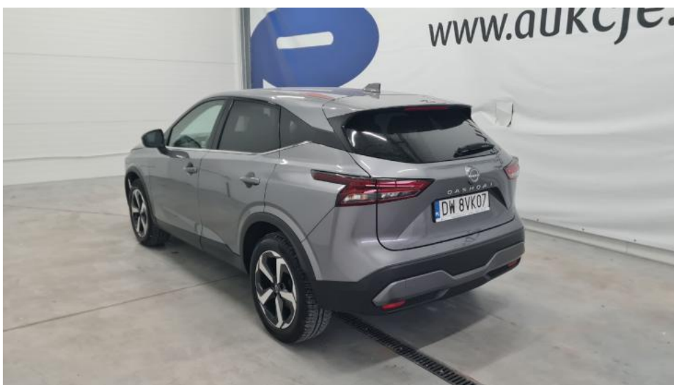
Photo 8. Przekątna tylna lewa