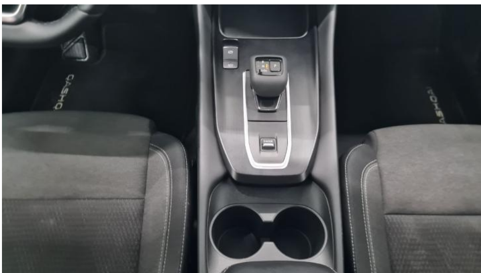
Photo 30. Tunel środkowy