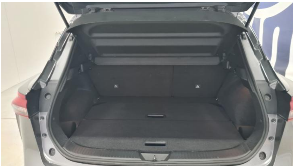
Photo 19. Bagażnik