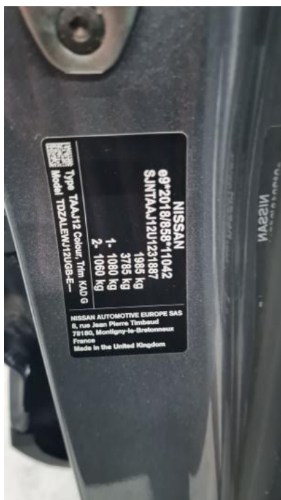
Photo 23. Tabliczka znamionowa