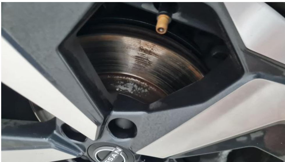
Photo 15. Tarcza hamulcowa przednia prawa