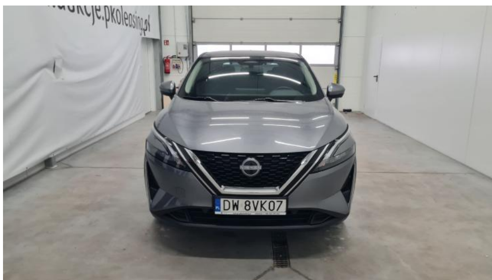
Photo 2. Przód