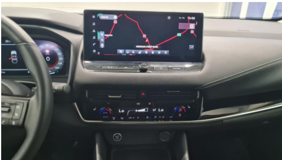
Photo 29. Konsola środkowa