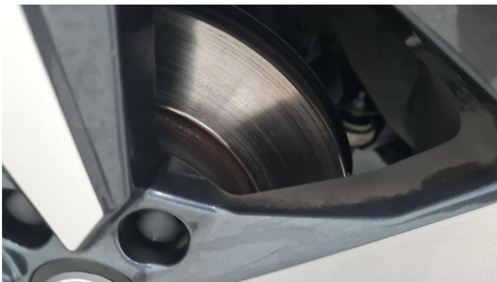
Photo 18. Tarcza hamulcowa przednia lewa