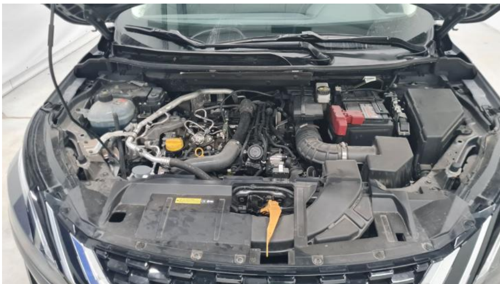
Photo 21. Komora silnika