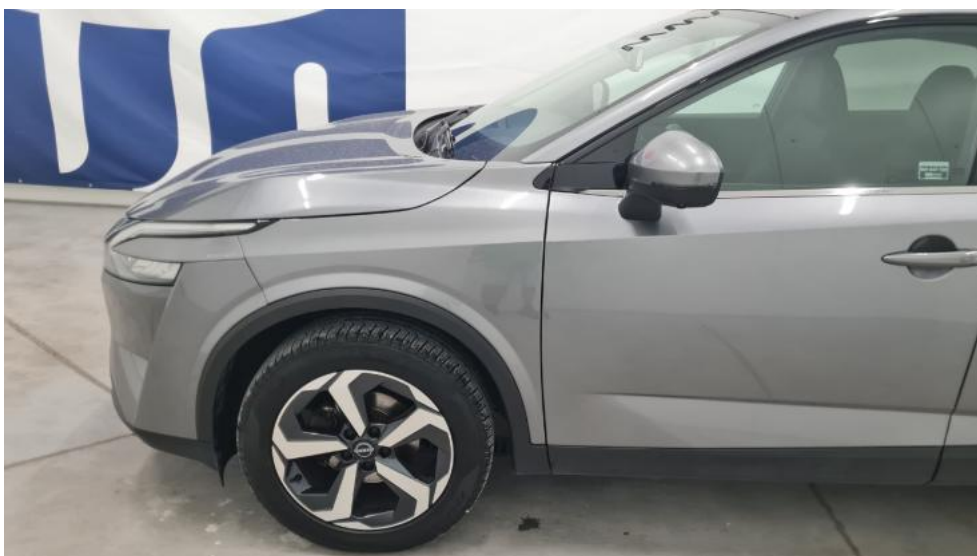
Photo 10. Bok lewy z przodu