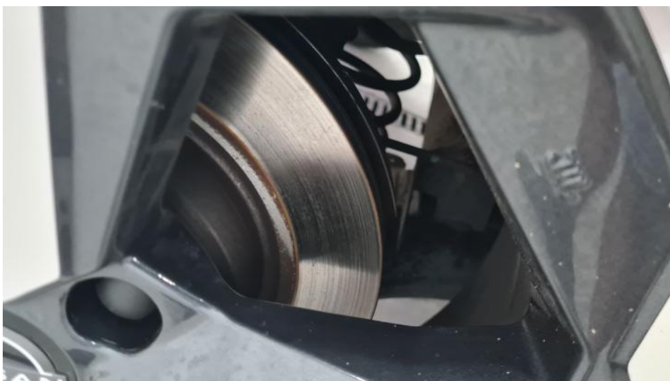
Photo 16. Tarcza hamulcowa tylna prawa