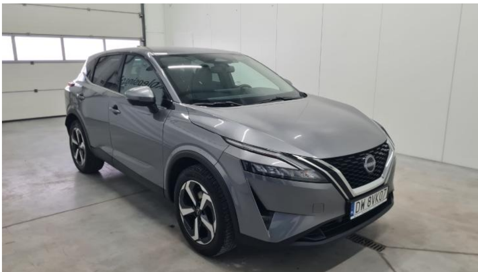
Photo 3. Przekątna przednia prawa