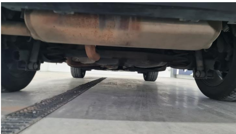
Photo 14. Spód pojazdu tył