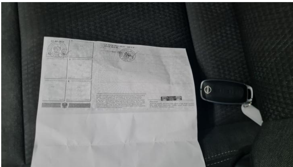
Photo 33. Dow. Rej. ksero Str.2 i klucze