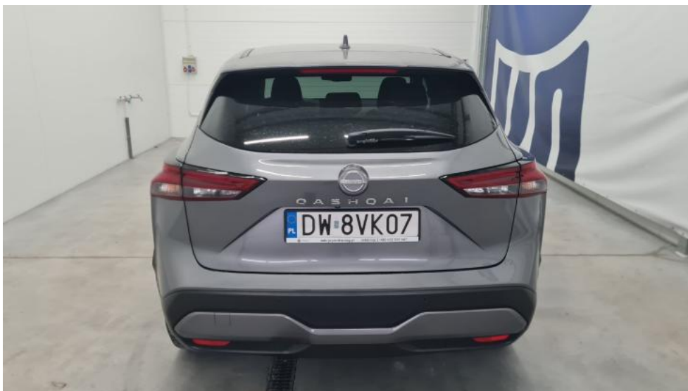
Photo 7. Tył