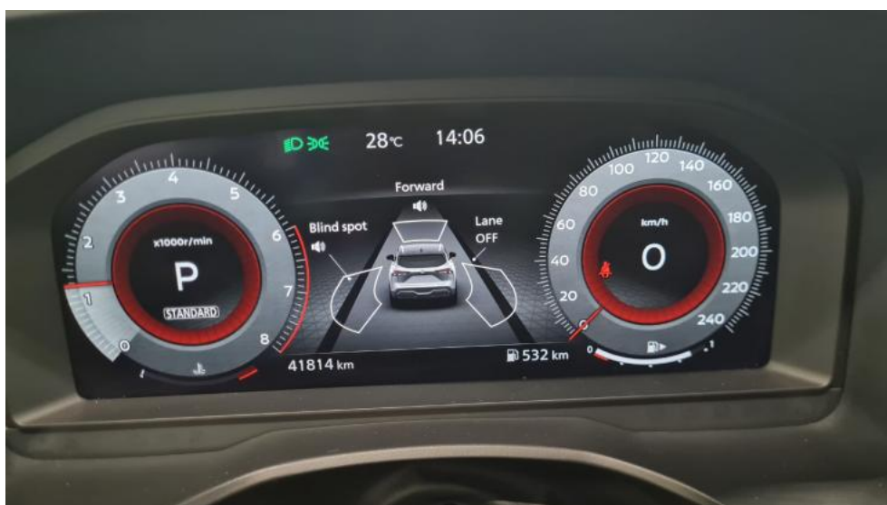
Photo 24. Zestaw wskaźników - przebieg