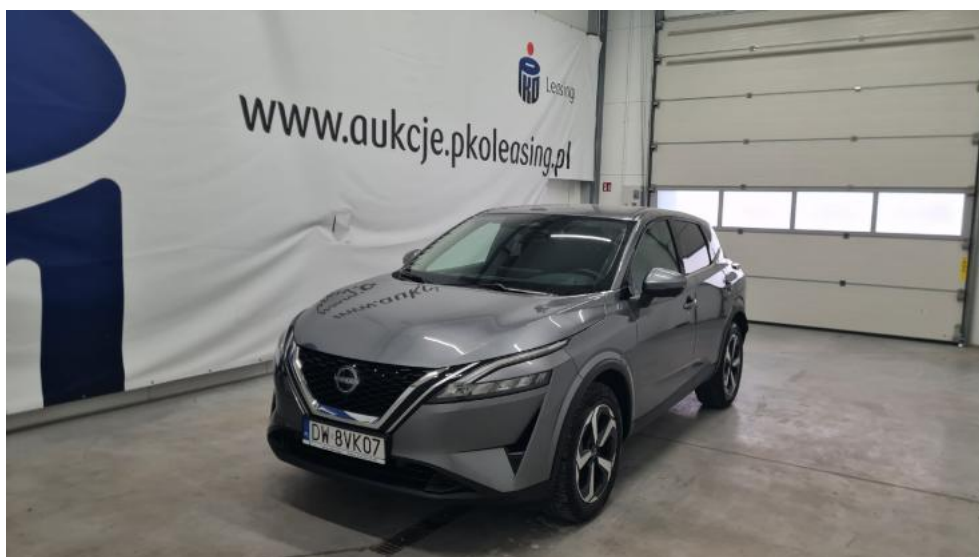
Photo 1. Przekątna przednia lewa