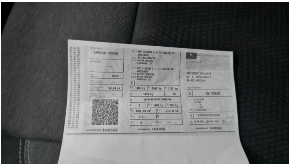
Photo 32. Dow. rej. ksero Str. 1