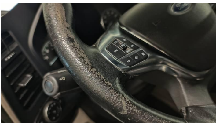
Fot. nr 82