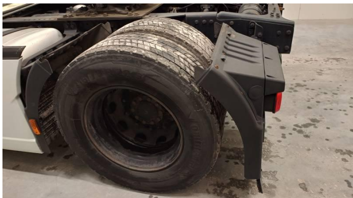
Fot. nr 85