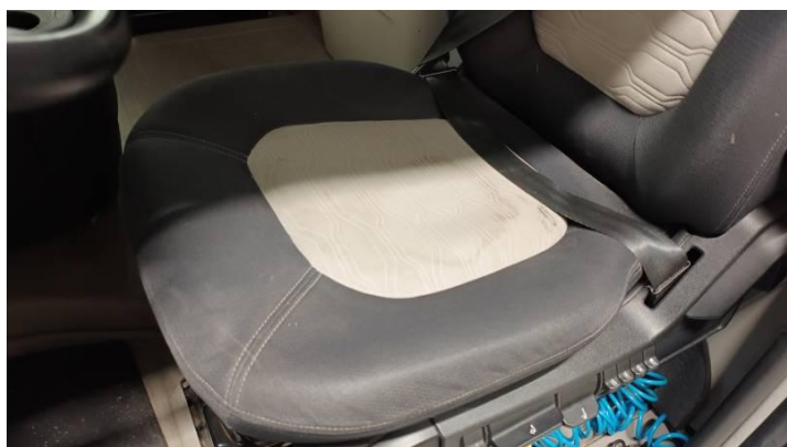
Fot. nr 81