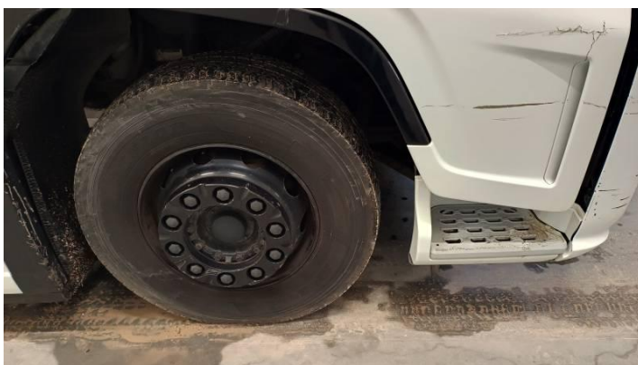
Fot. nr 84