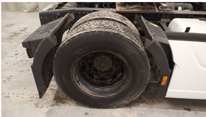
Fot. nr 86