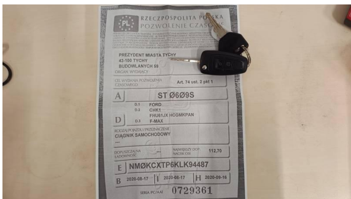
Fot. nr 87

Dokument wystawiony elektronicznie, wady bez podpisu