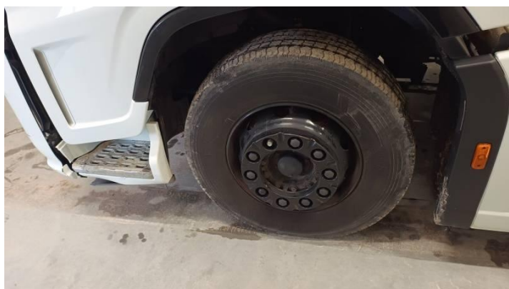
Fot. nr 83