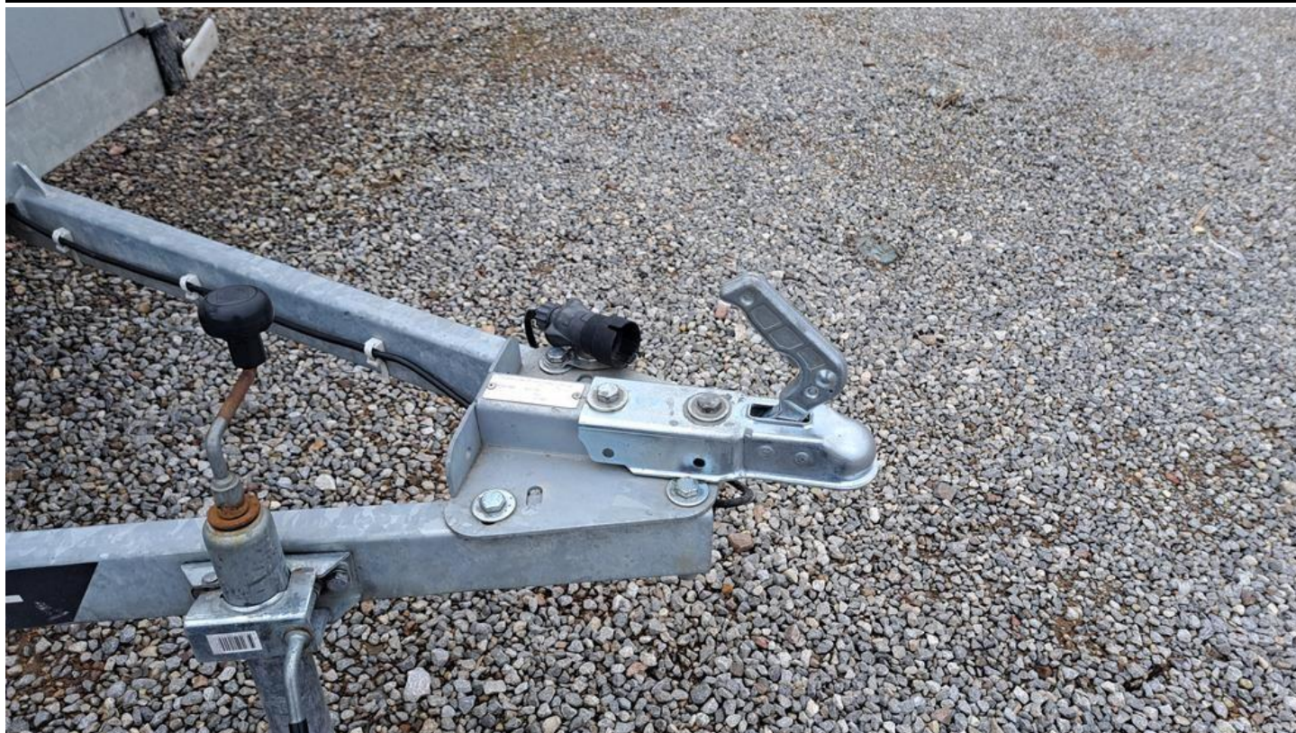
Fot. nr 7