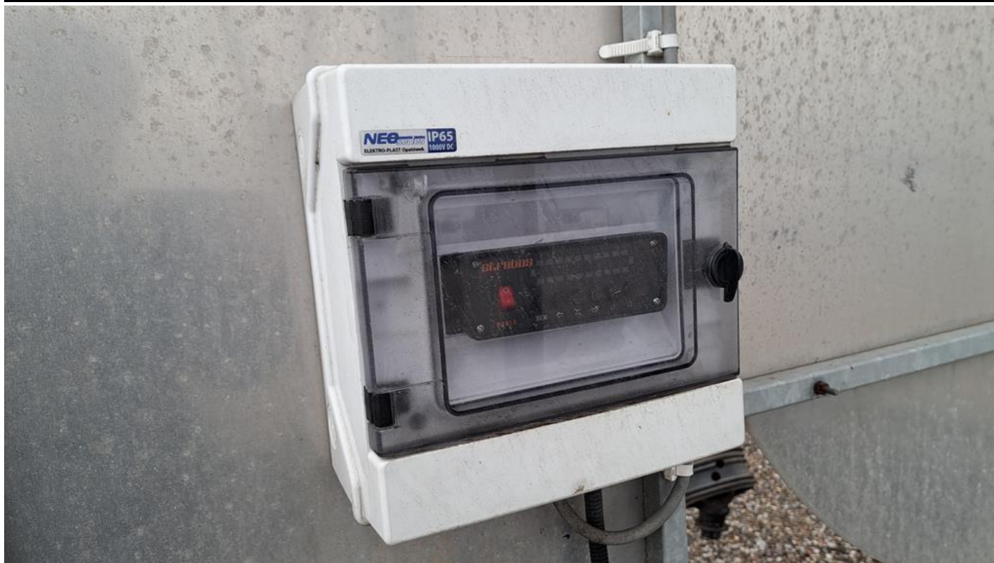
Fot. nr 21