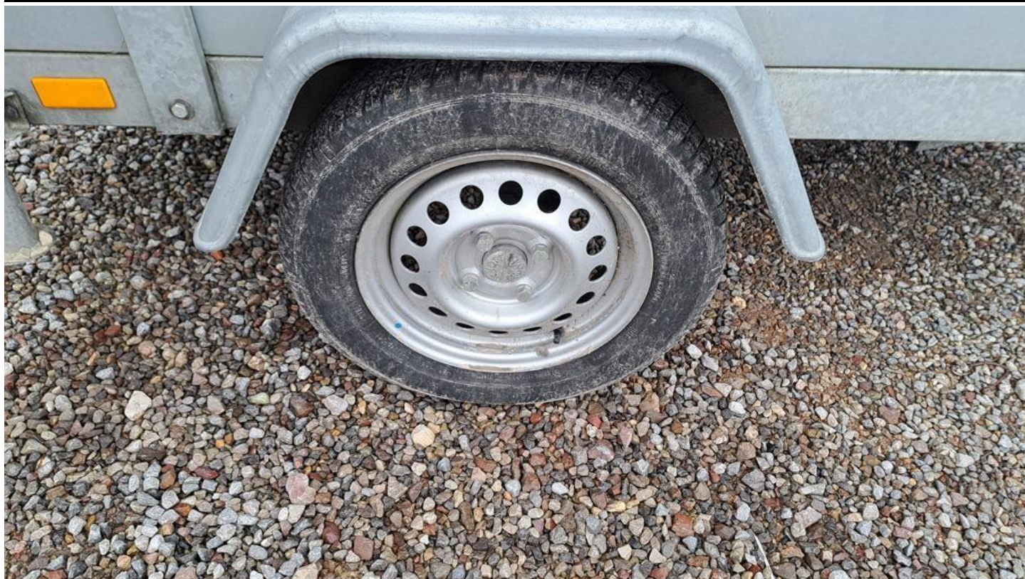
Fot. nr 19