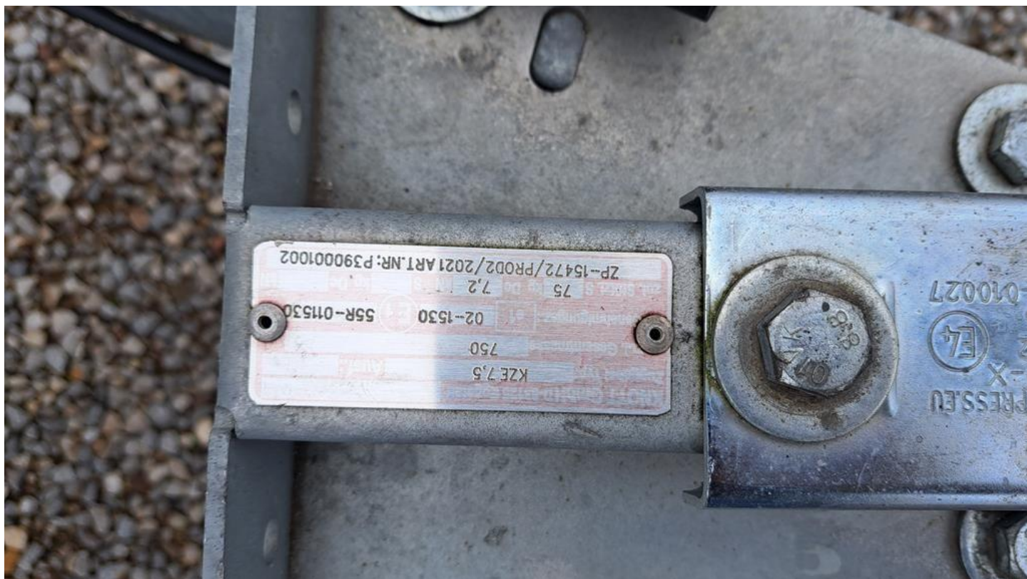
Fot. nr 8