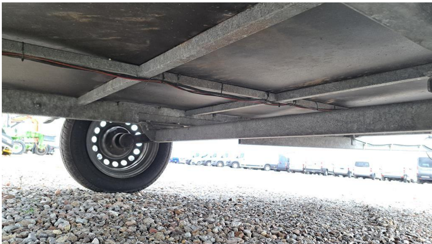
Fot. nr 18