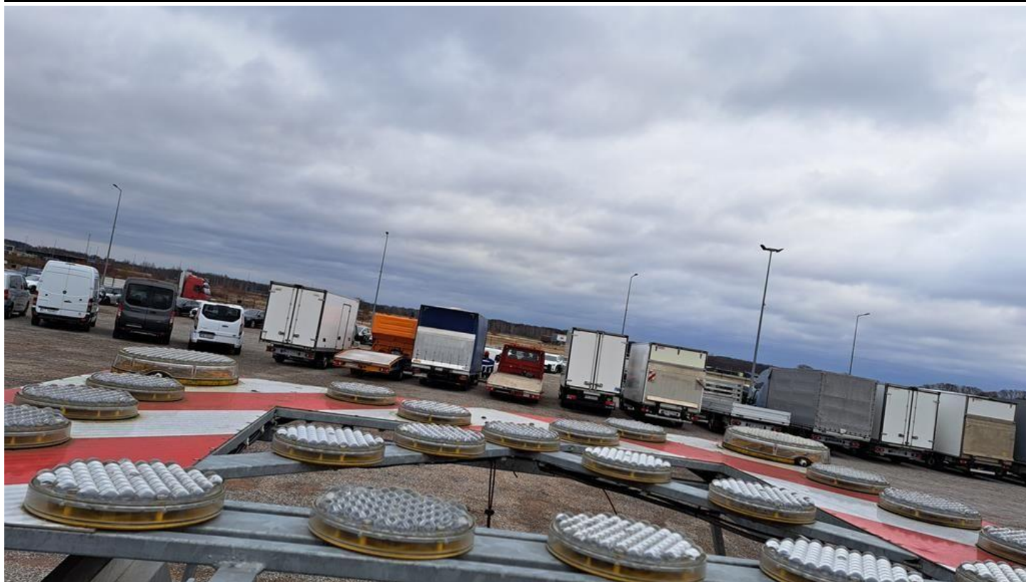
Fot. nr 25