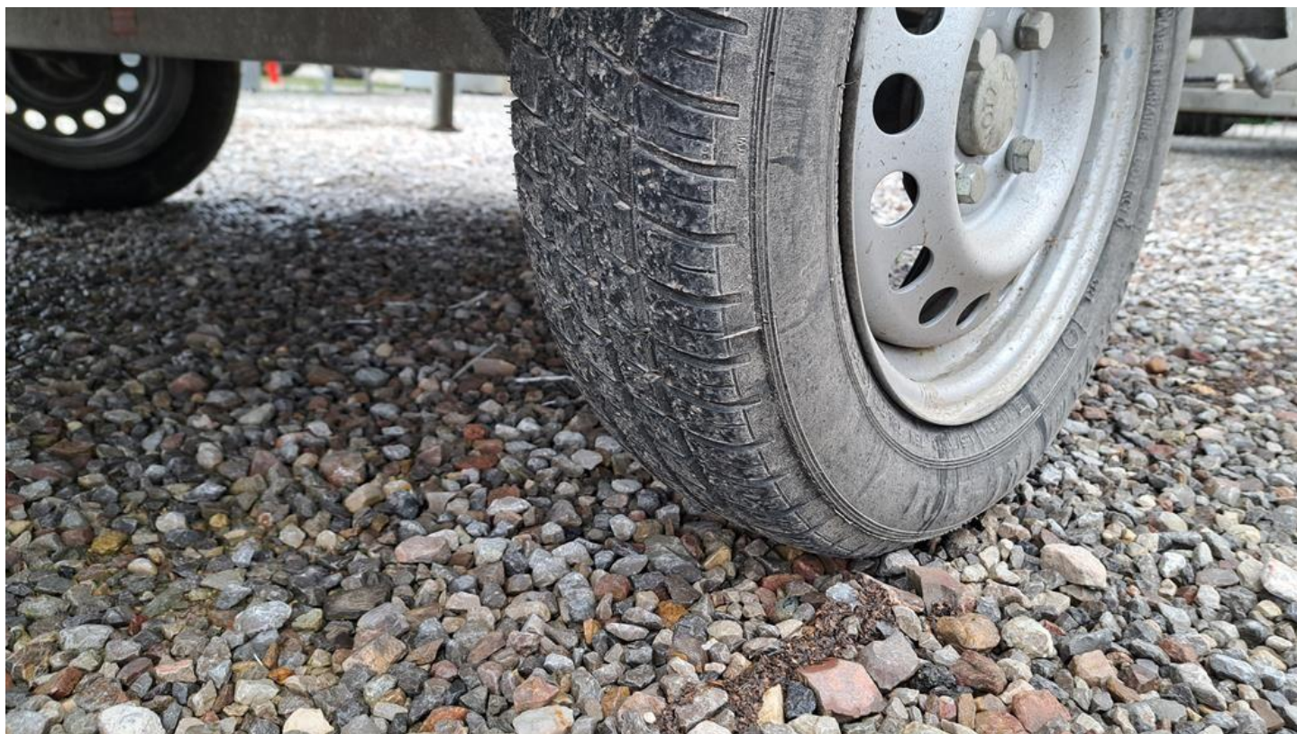
Fot. nr 14