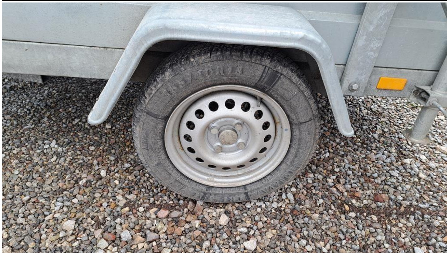
Fot. nr 13