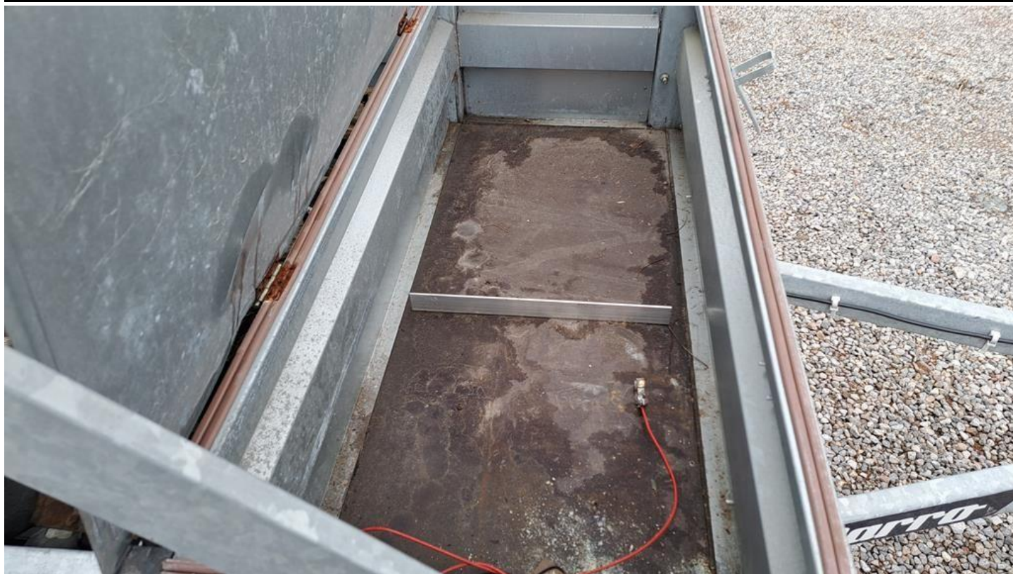
Fot. nr 11