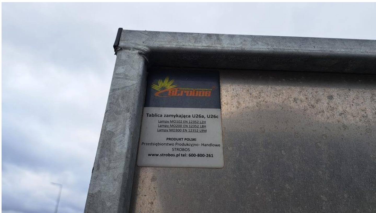
Fot. nr 26