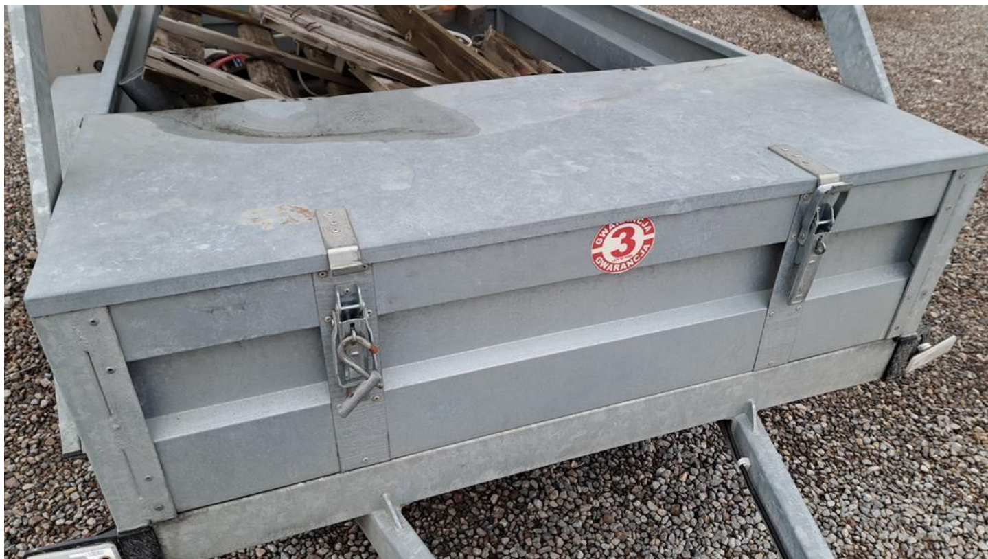
Fot. nr 10