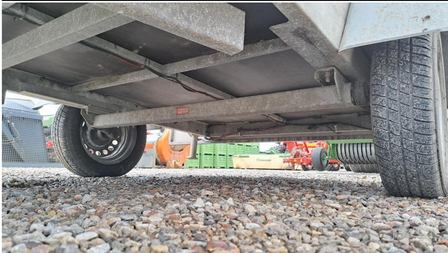
Fot. nr 15