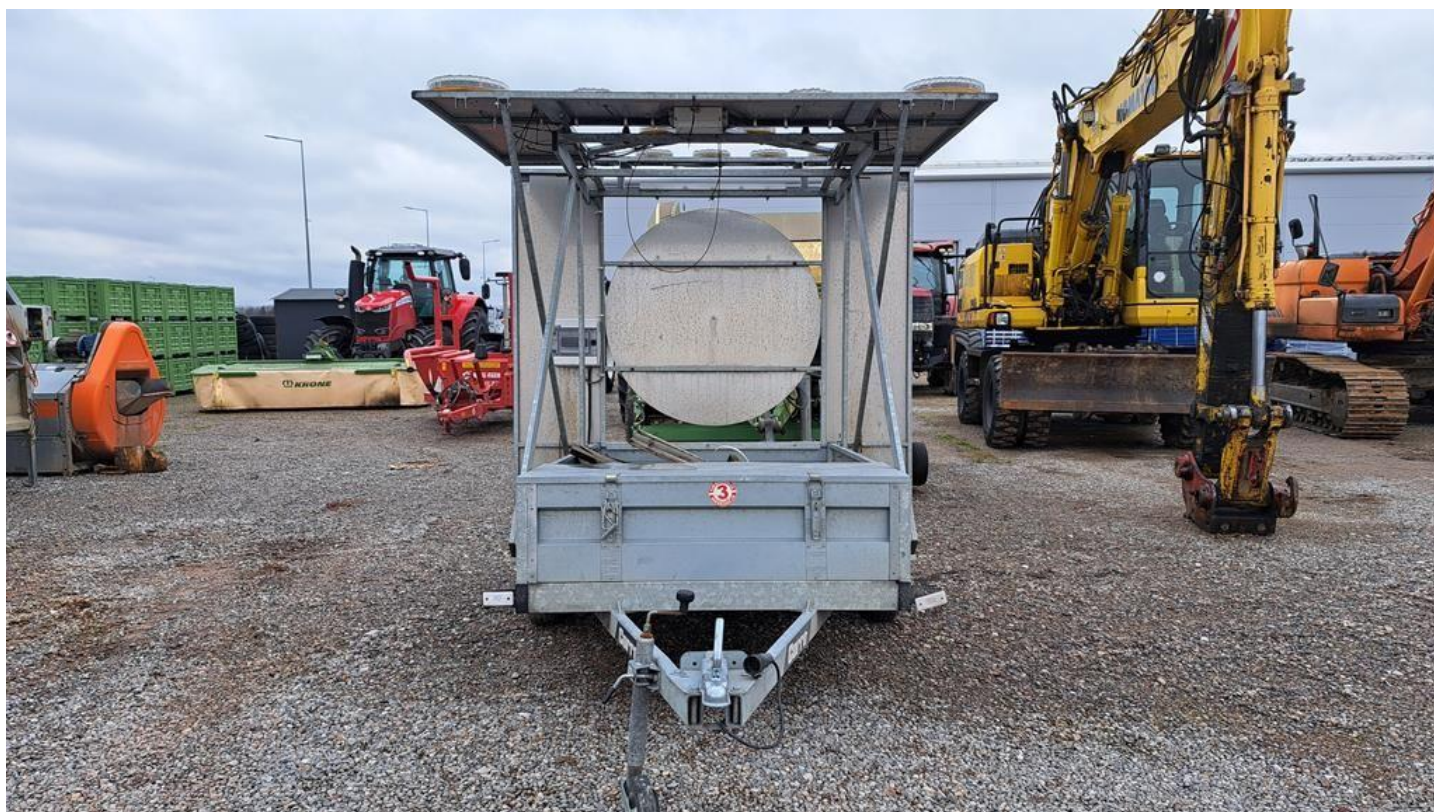
Fot. nr 2