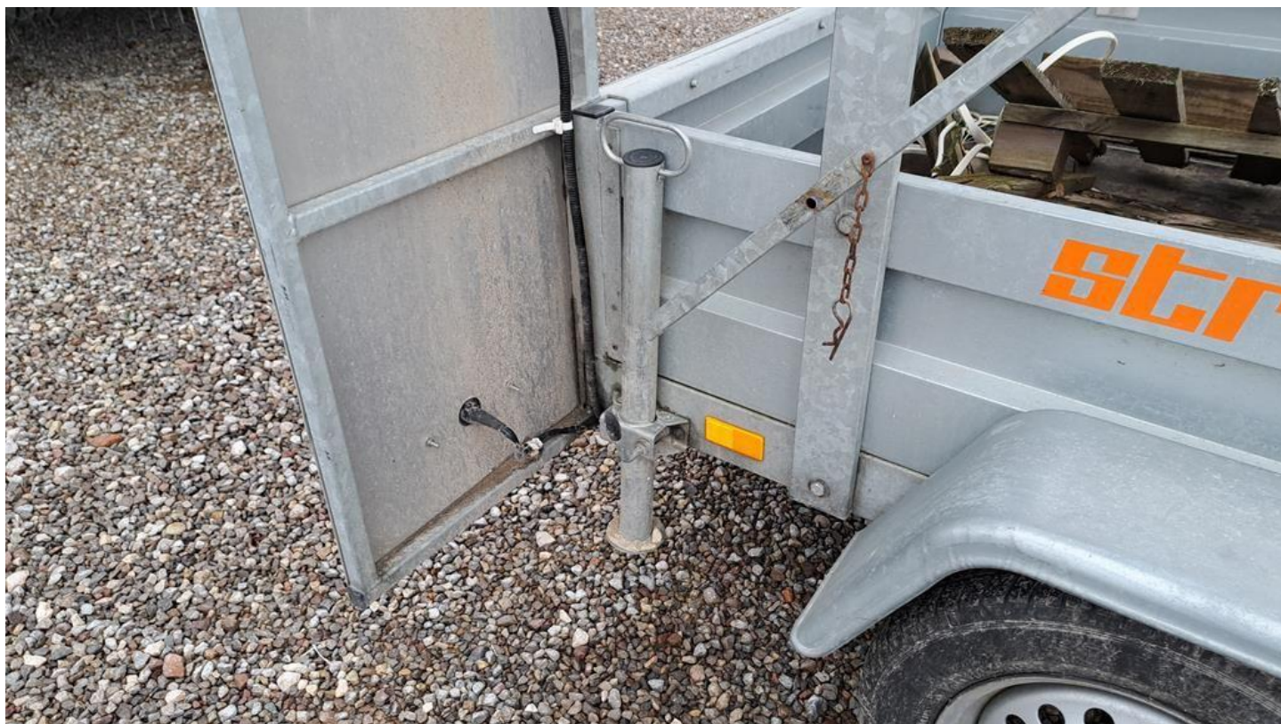
Fot. nr 20