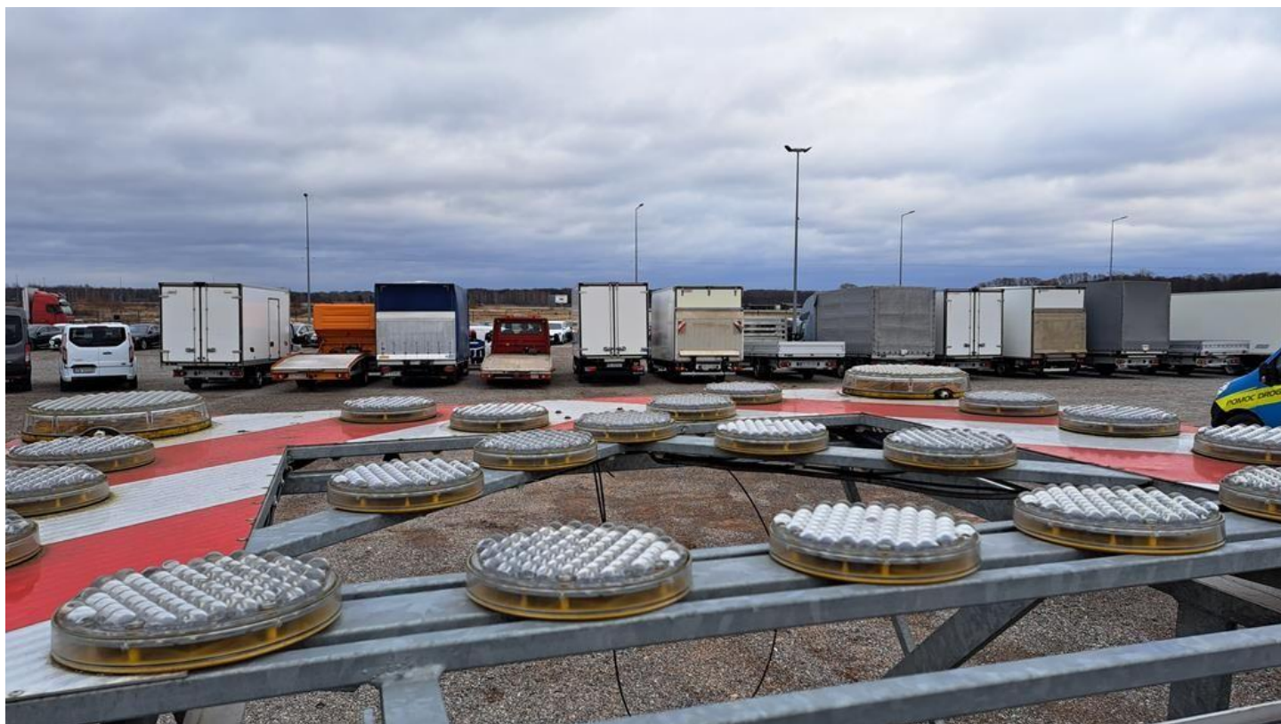
Fot. nr 24