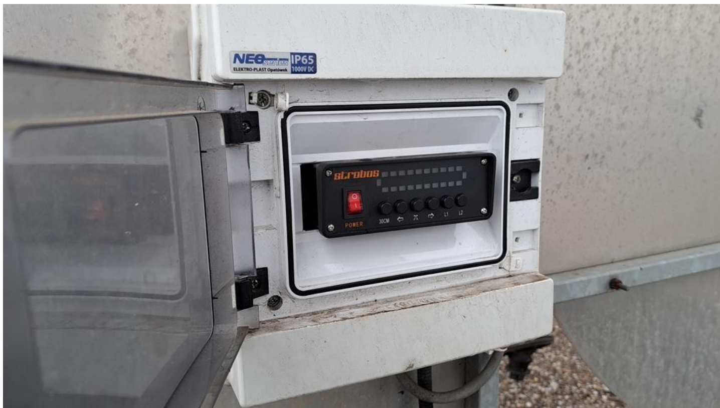
Fot. nr 22