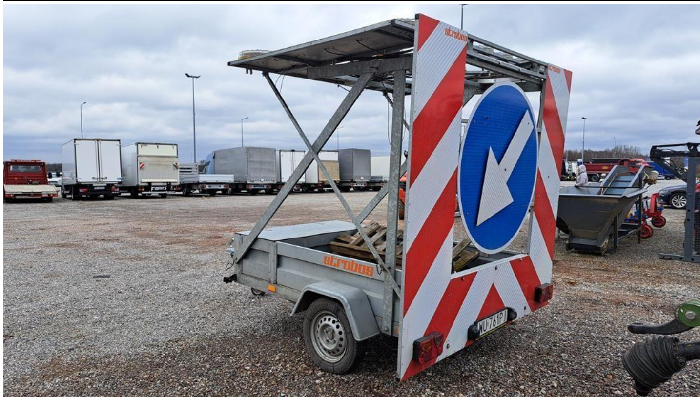
Fot. nr 5