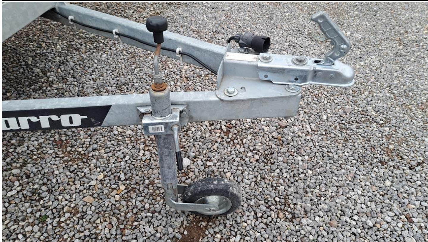
Fot. nr 9