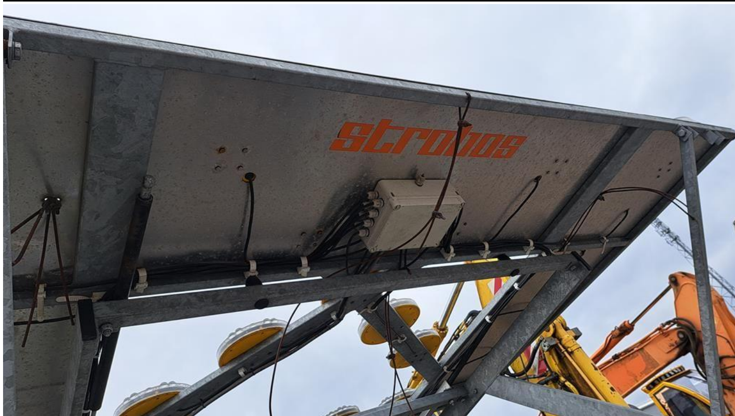
Fot. nr 23