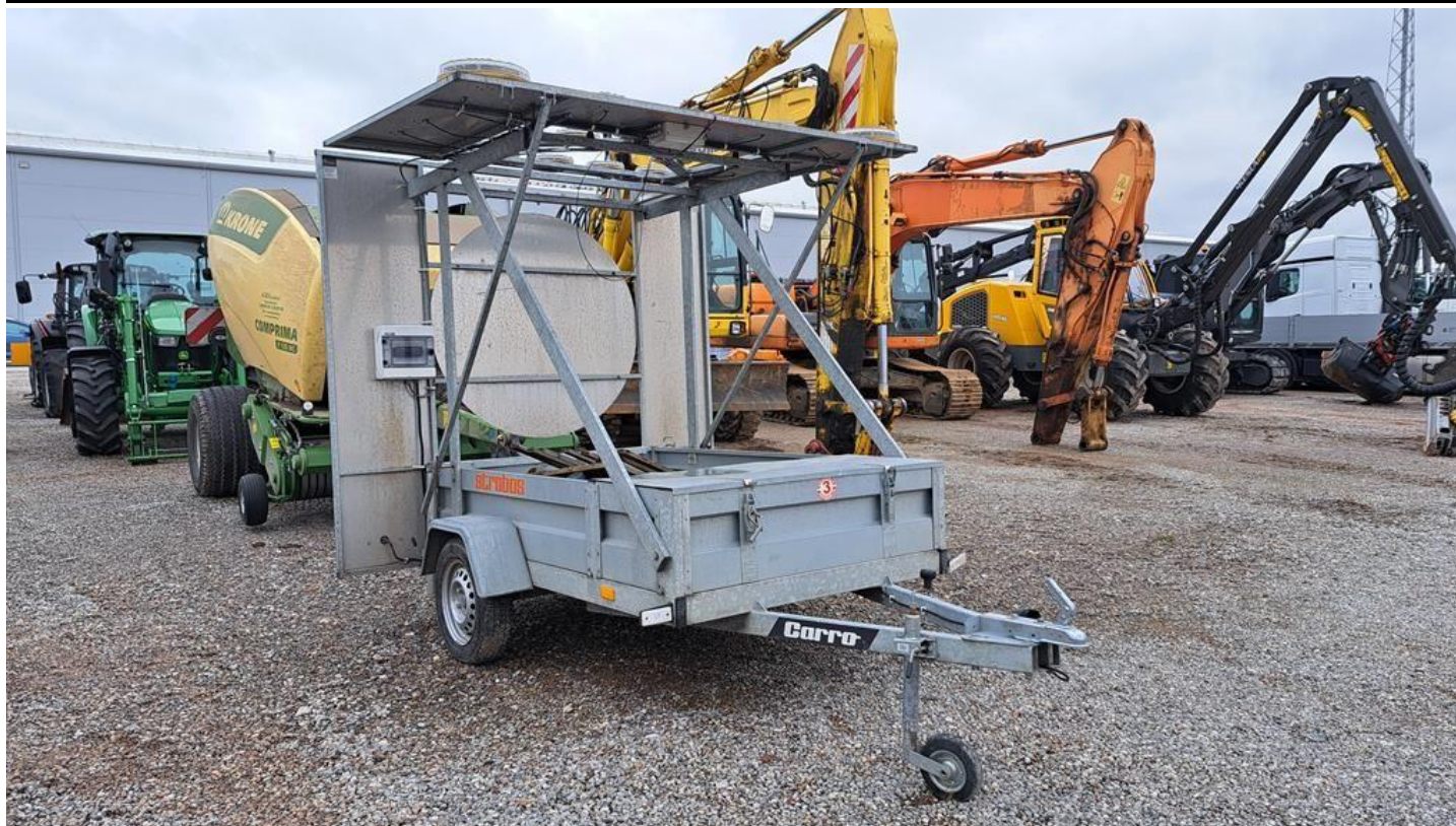
Fot. nr 3