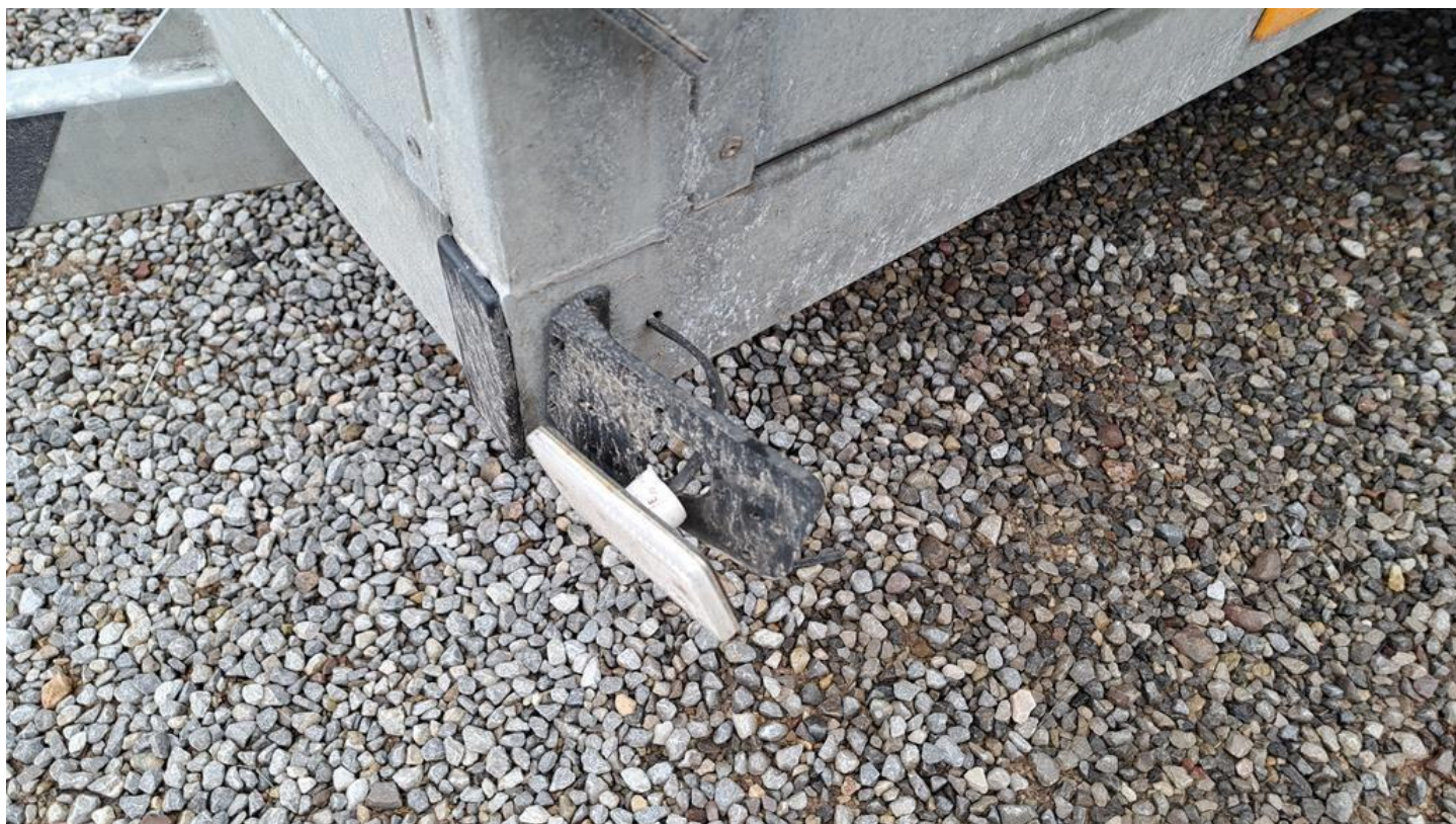
Fot. nr 16