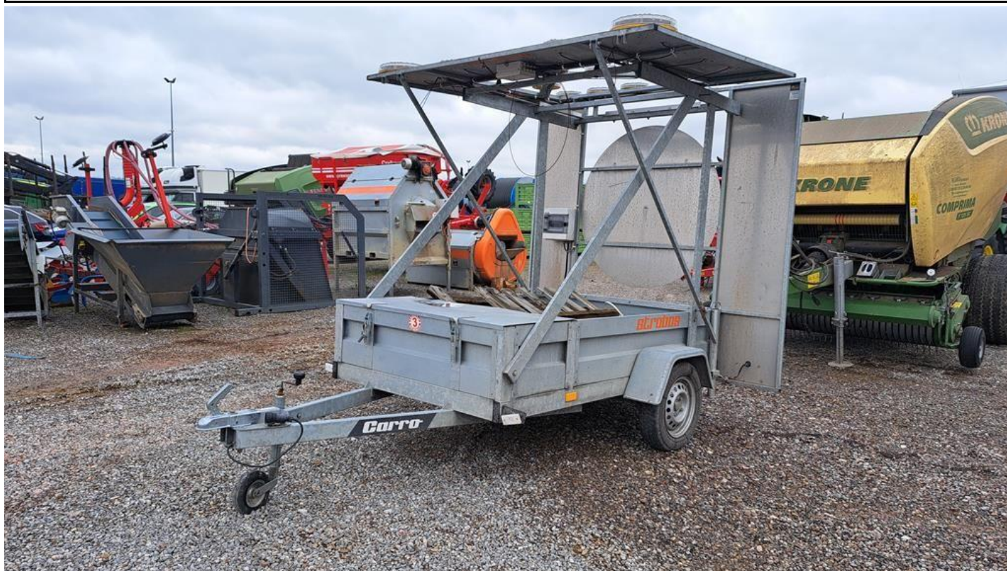
Fot. nr 1