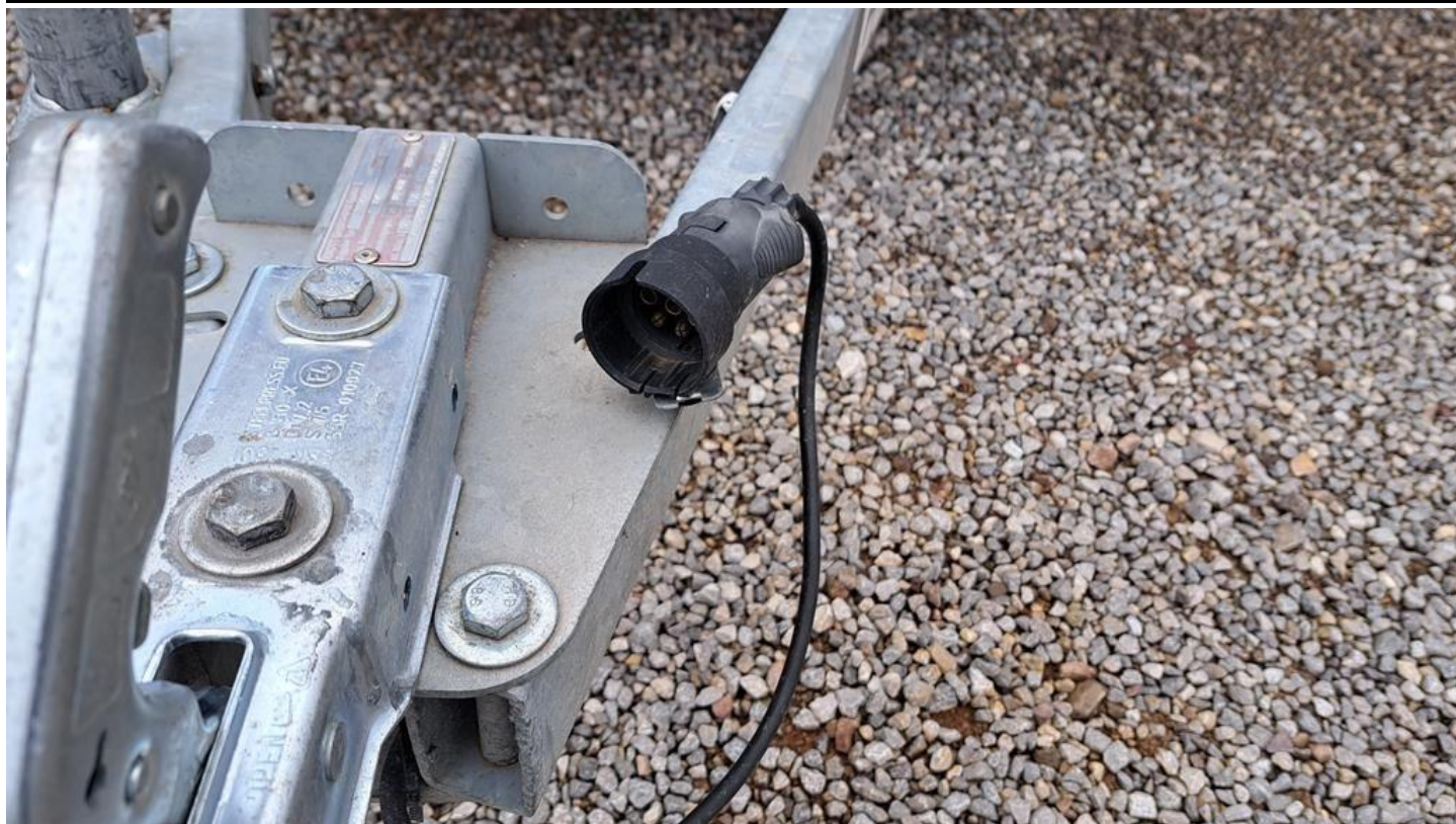
Fot. nr 17