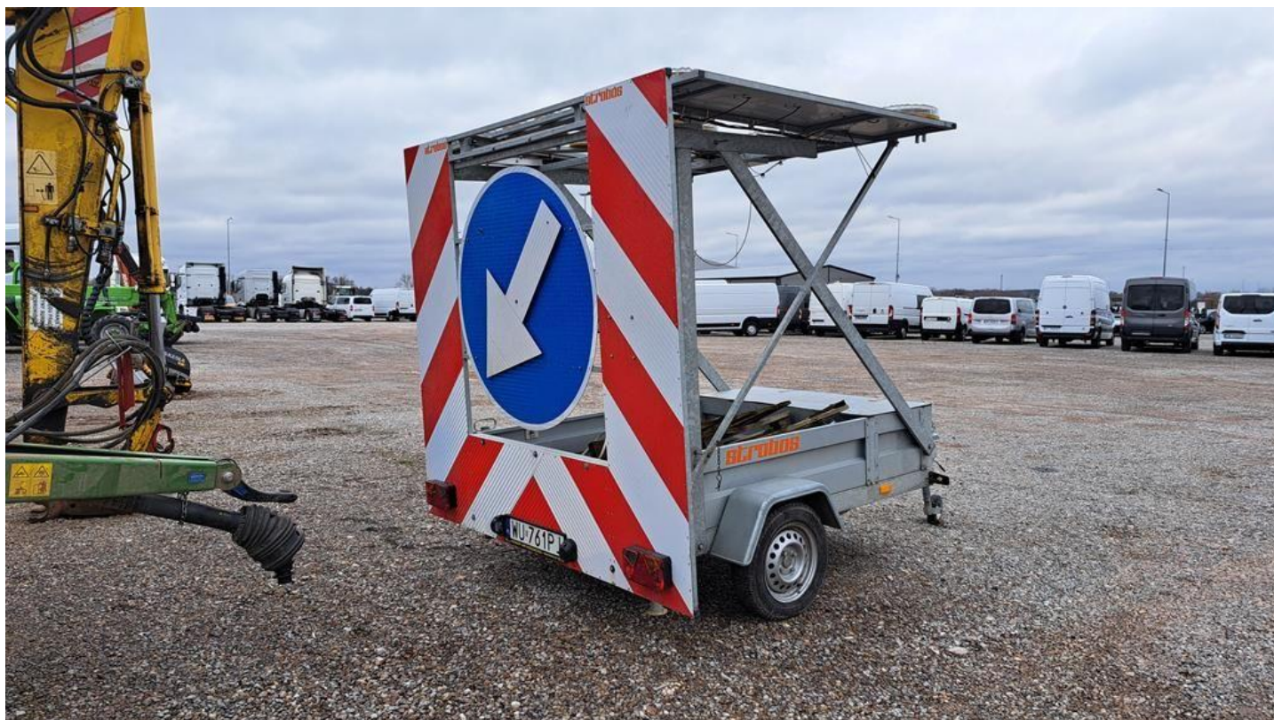
Fot. nr 4