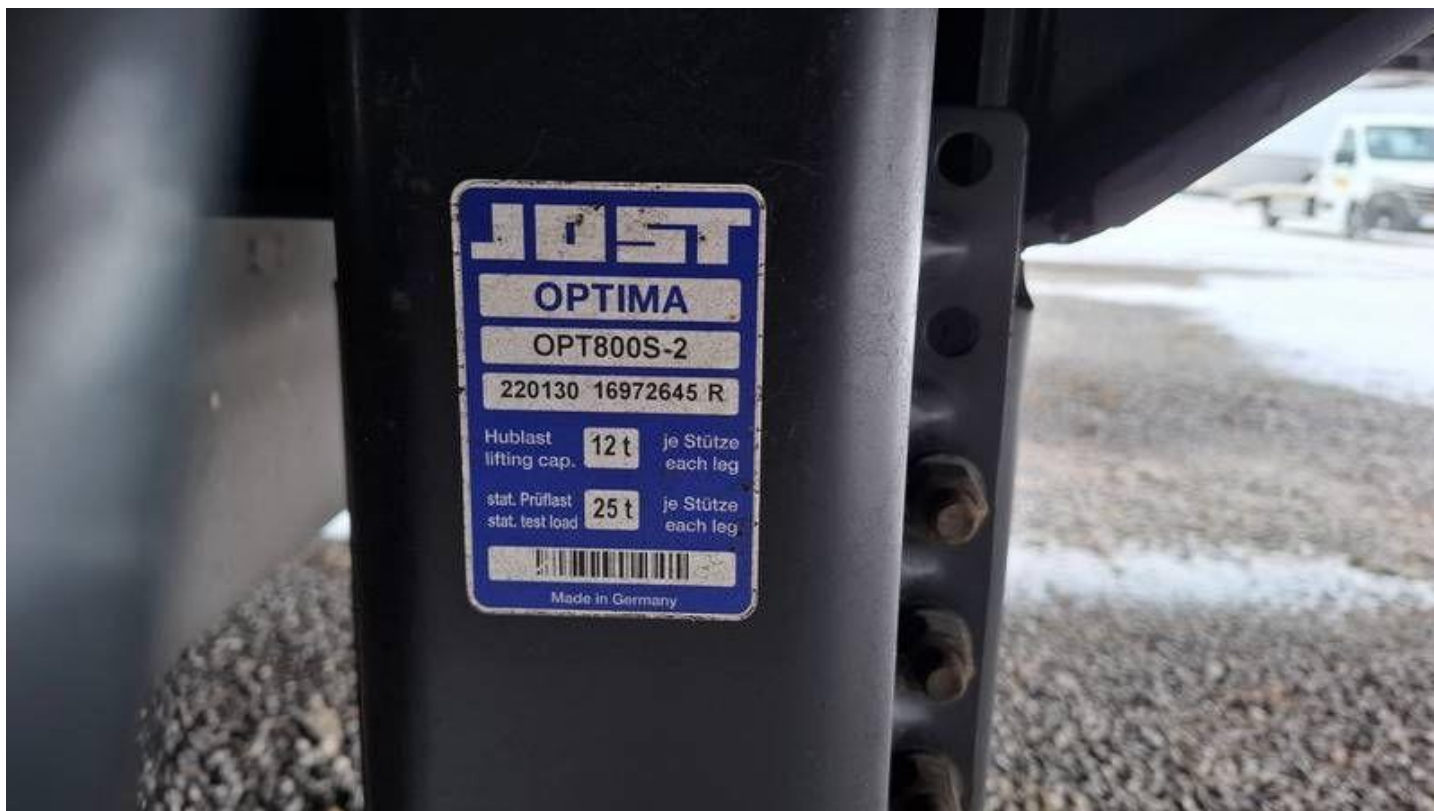
Fot. nr 14