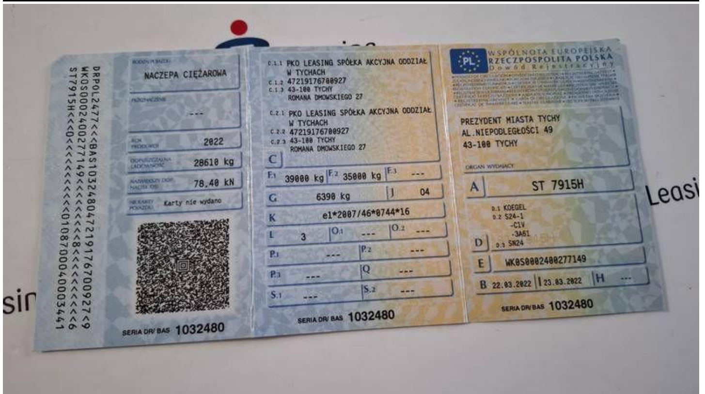
Fot. nr 51