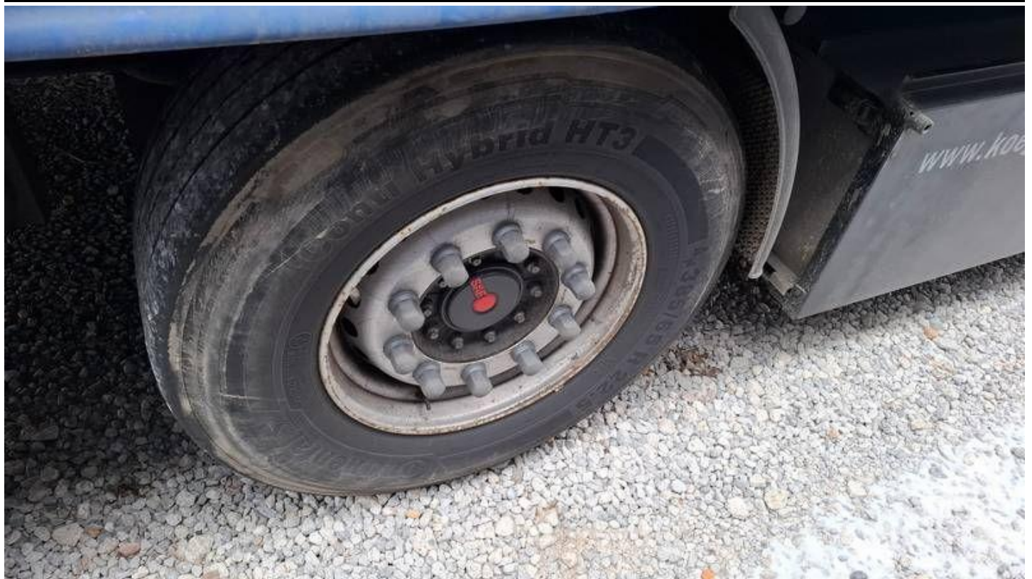
Fot. nr 43