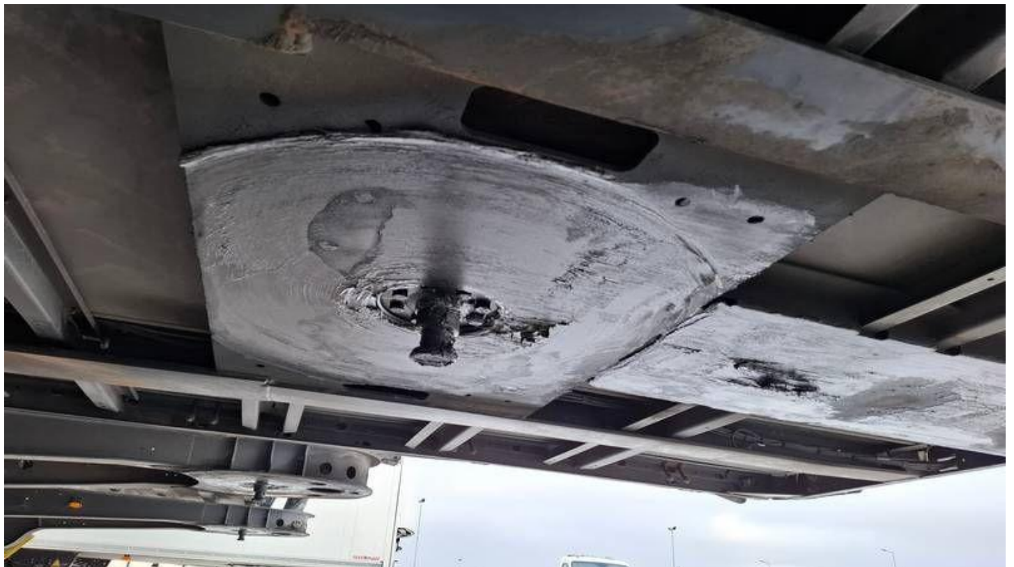
Fot. nr 12