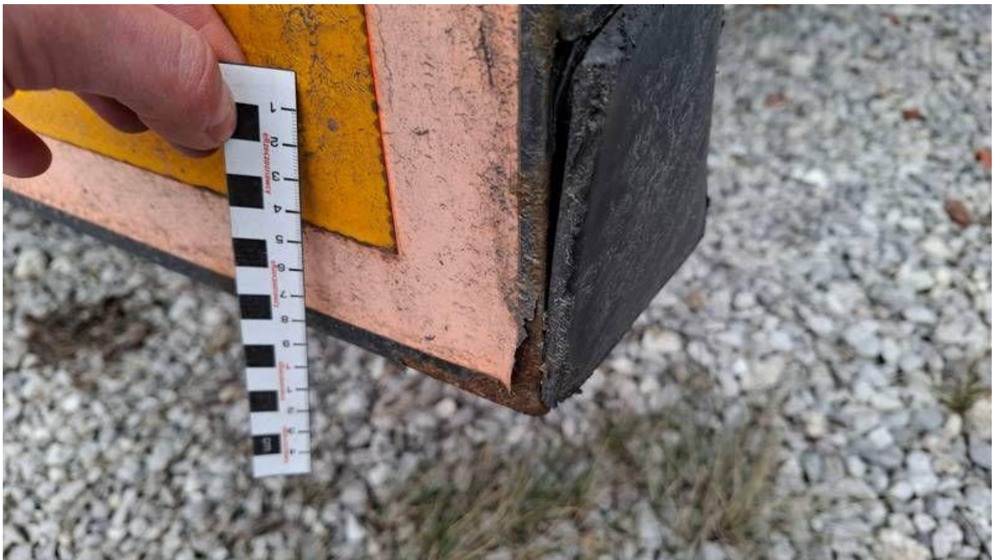
Fot. nr 36