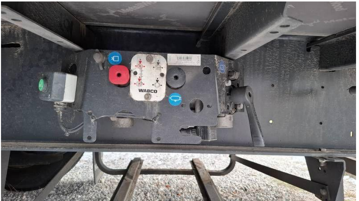
Fot. nr 20