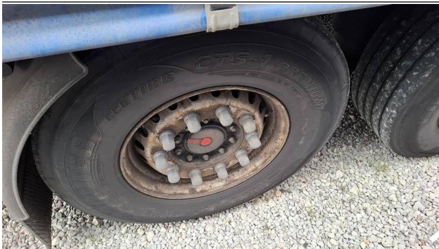
Fot. nr 47