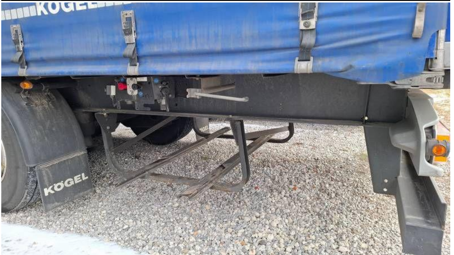
Fot. nr 19