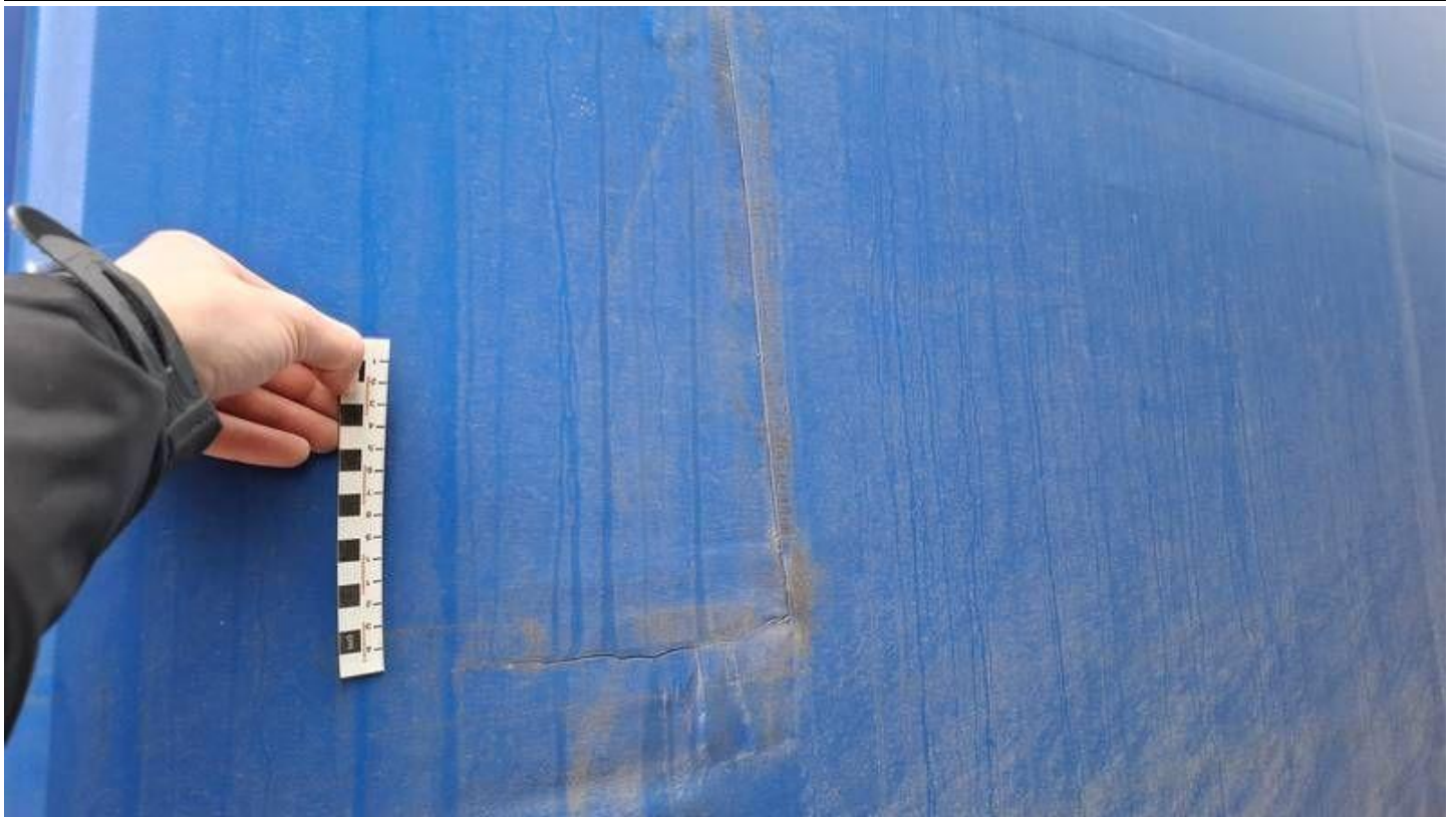
Fot. nr 31