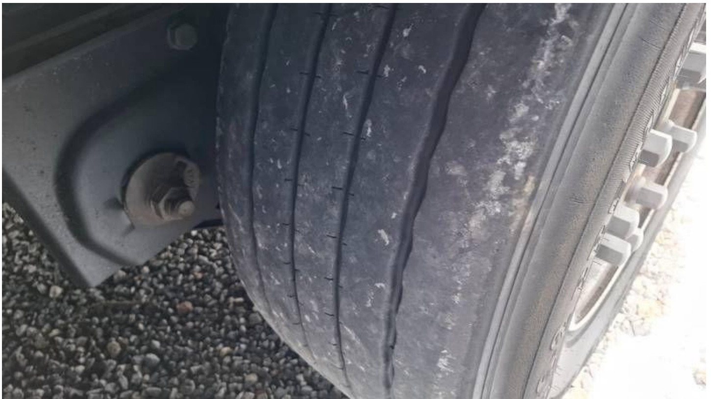
Fot. nr 40