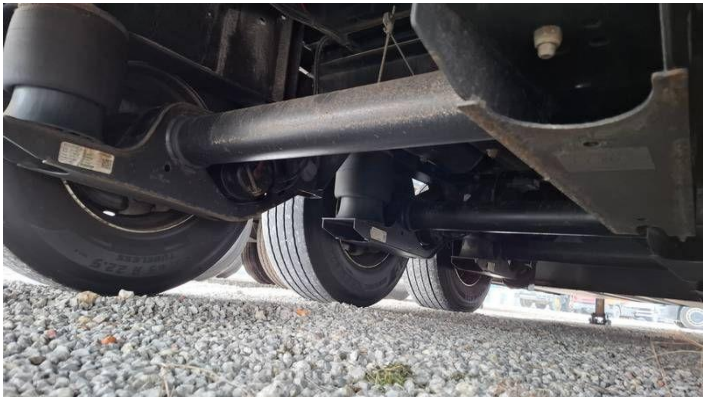
Fot. nr 50