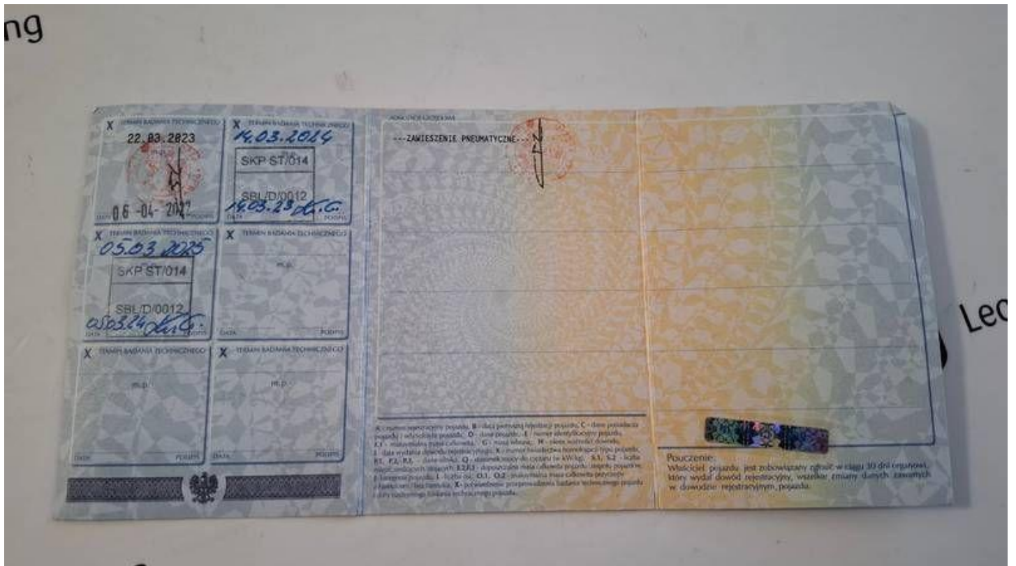
Fot. nr 52