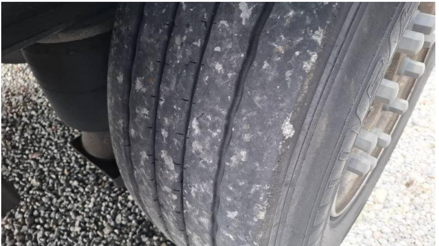
Fot. nr 46