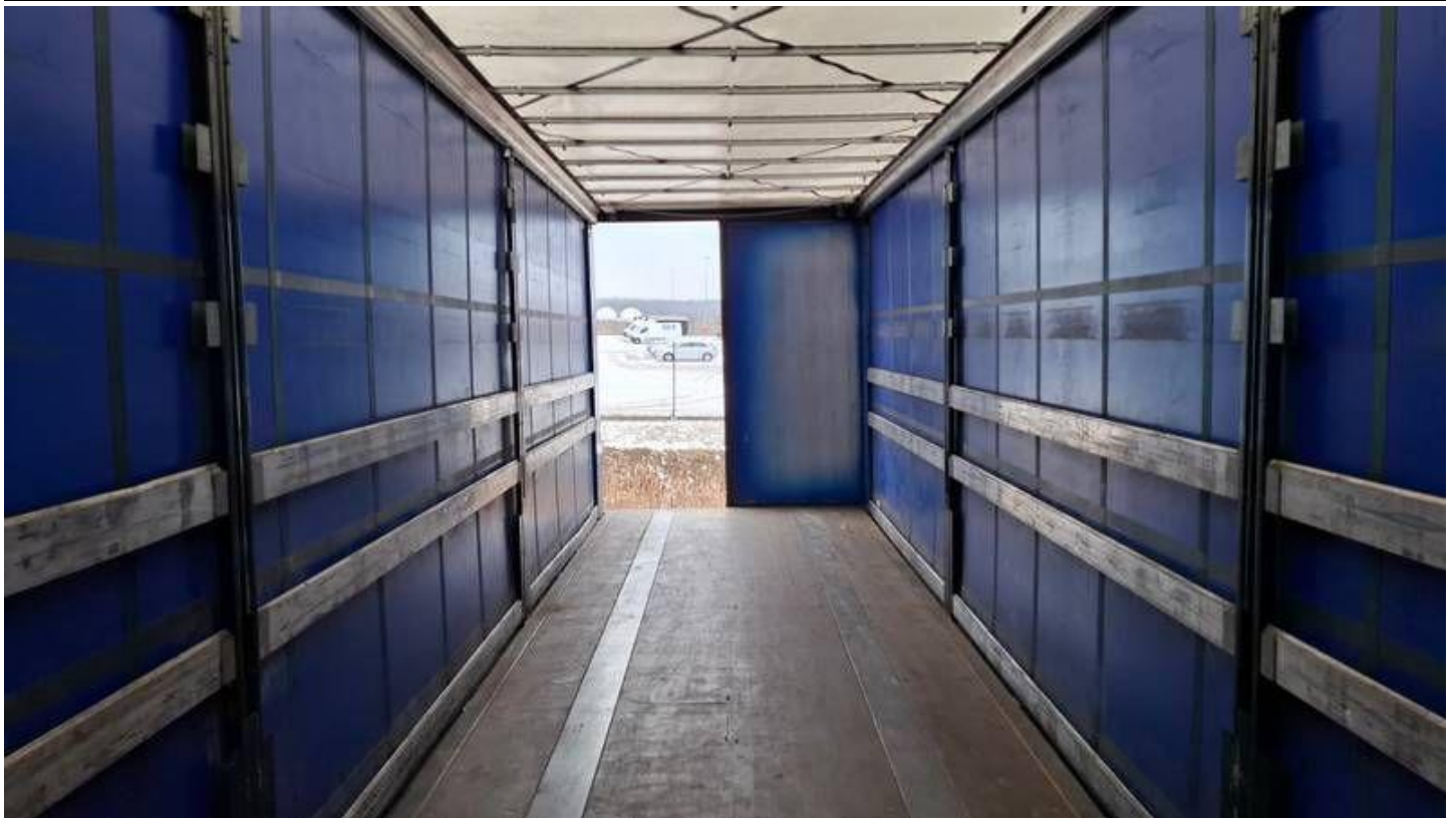
Fot. nr 27