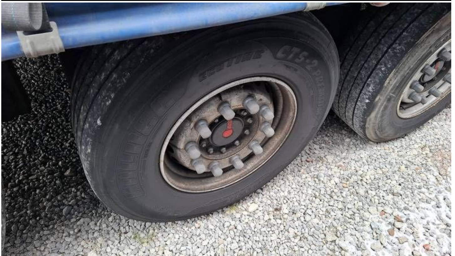
Fot. nr 45