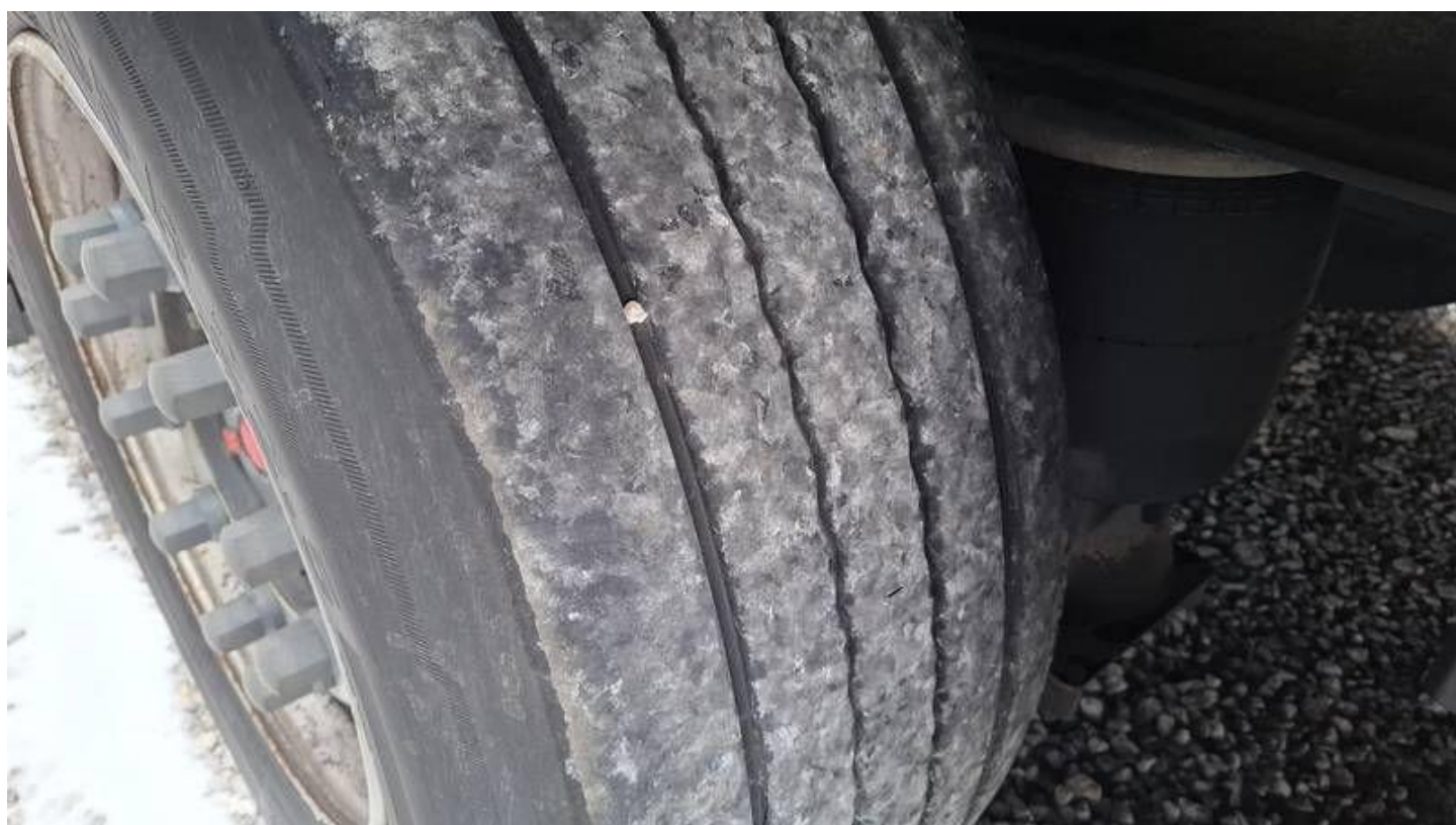
Fot. nr 38