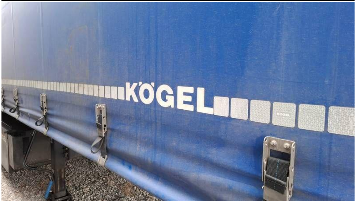
Fot. nr 49