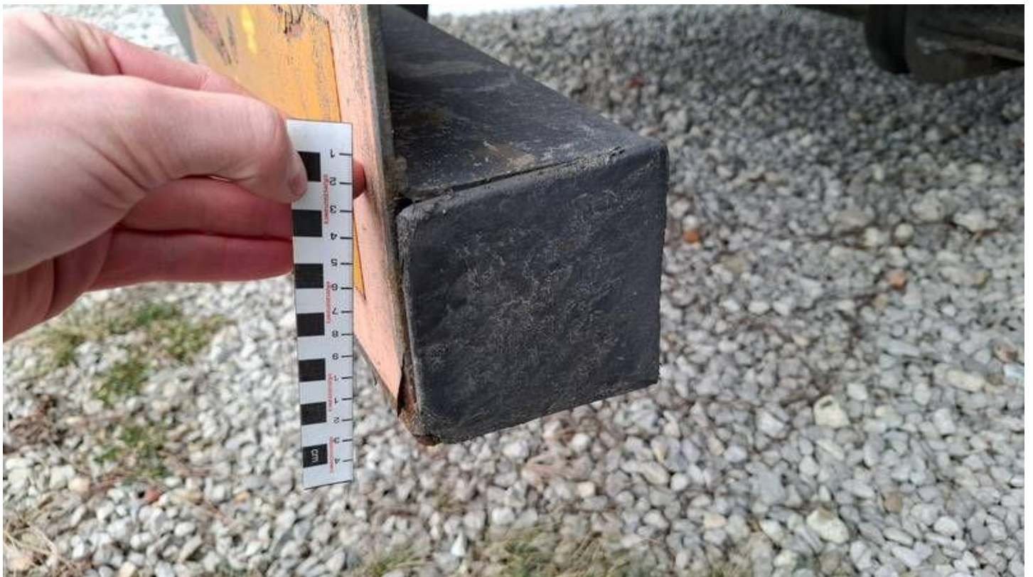
Fot. nr 30