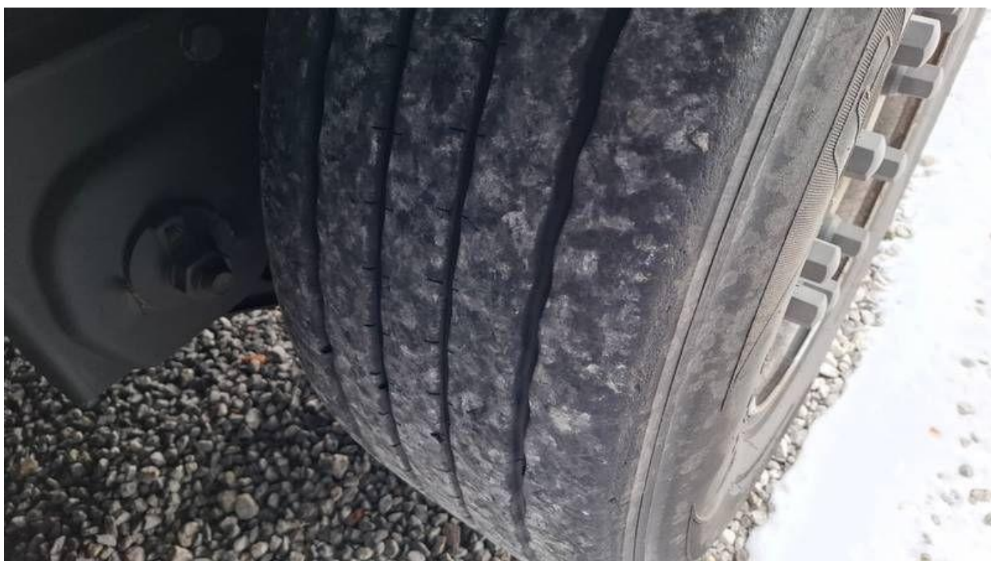
Fot. nr 42