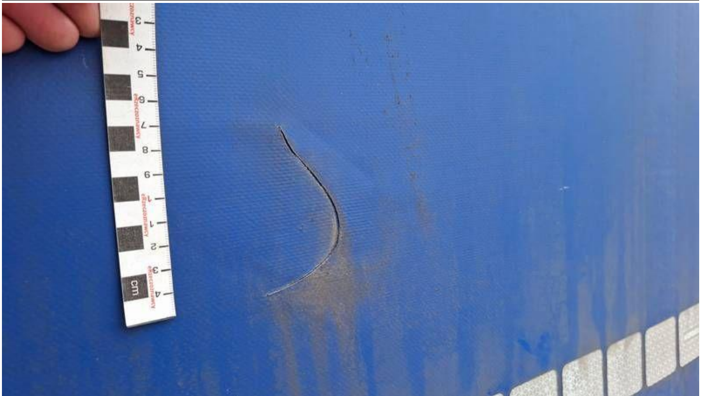
Fot. nr 33