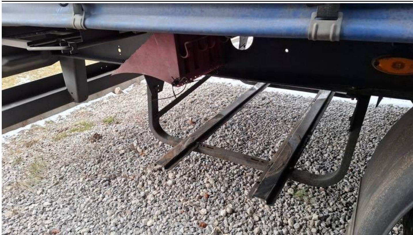
Fot. nr 17