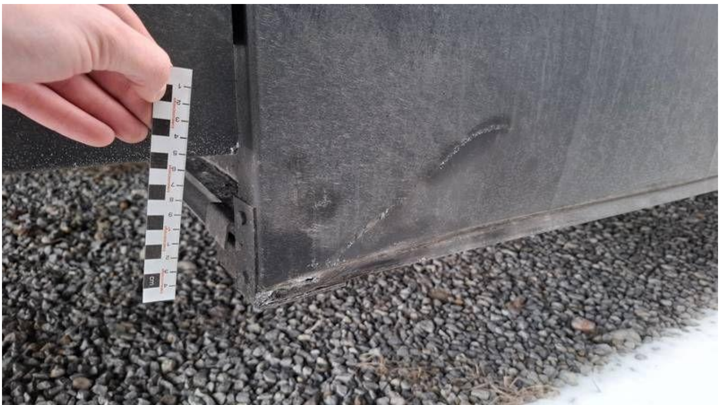
Fot. nr 32