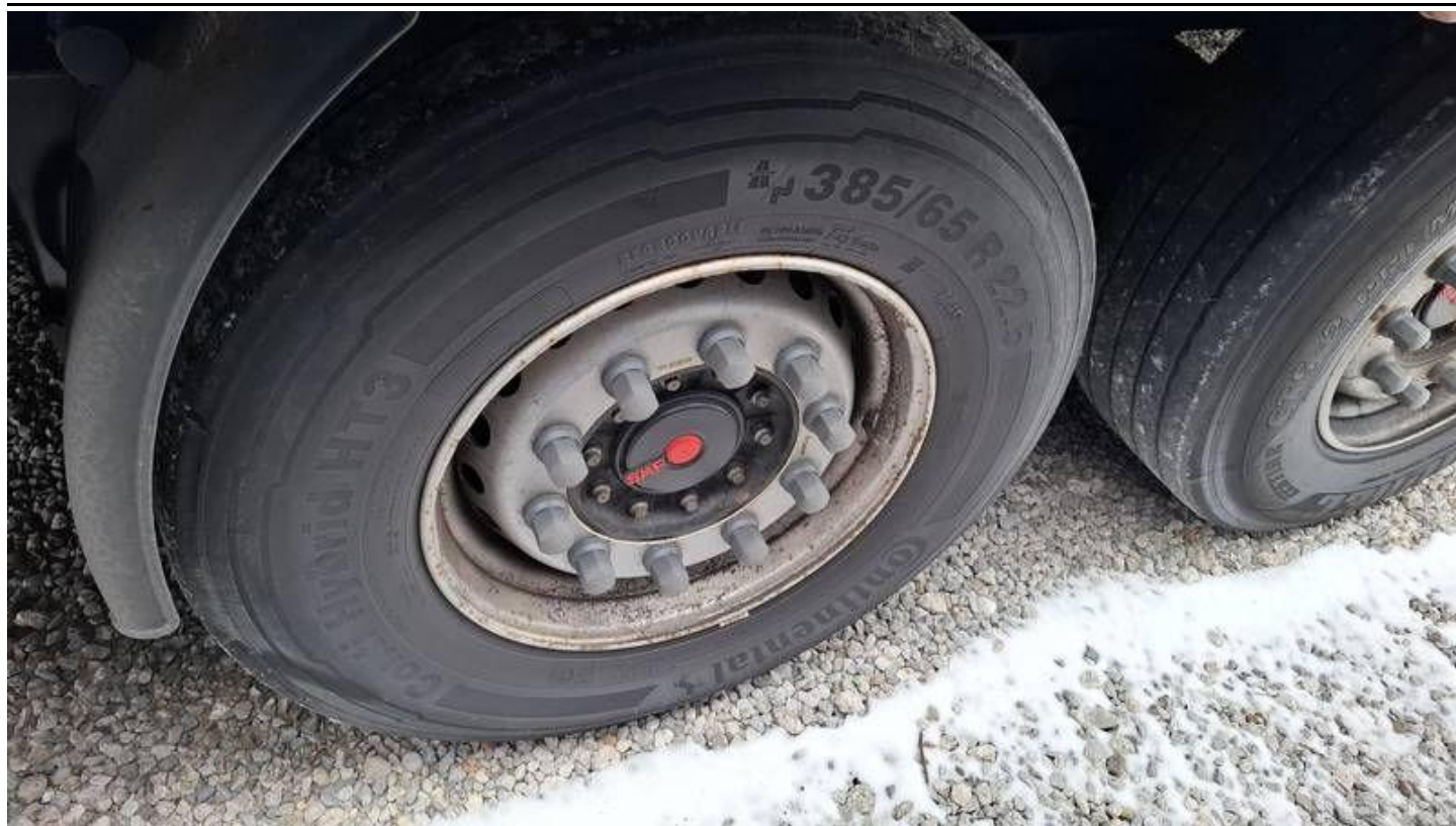
Fot. nr 37