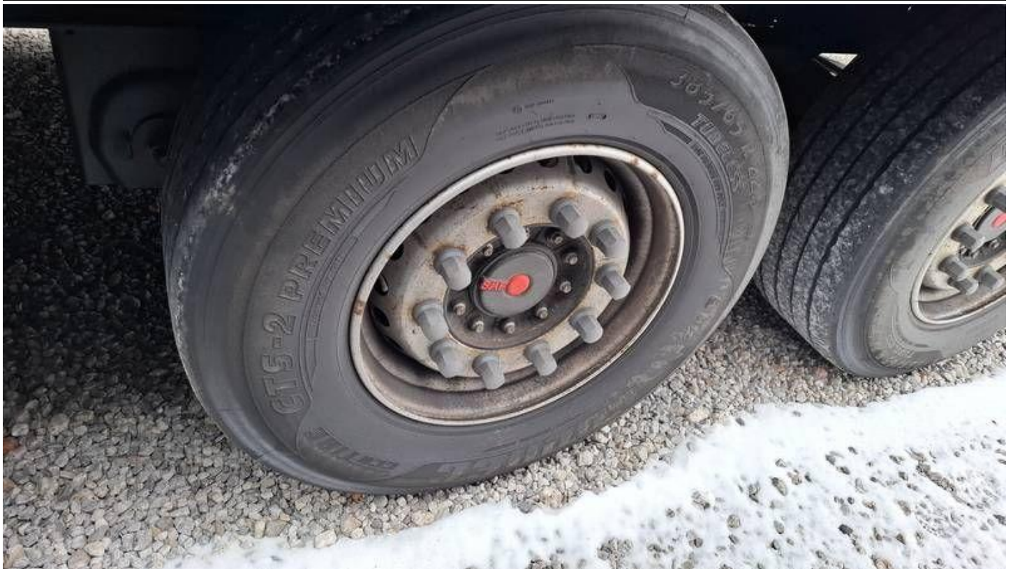
Fot. nr 39