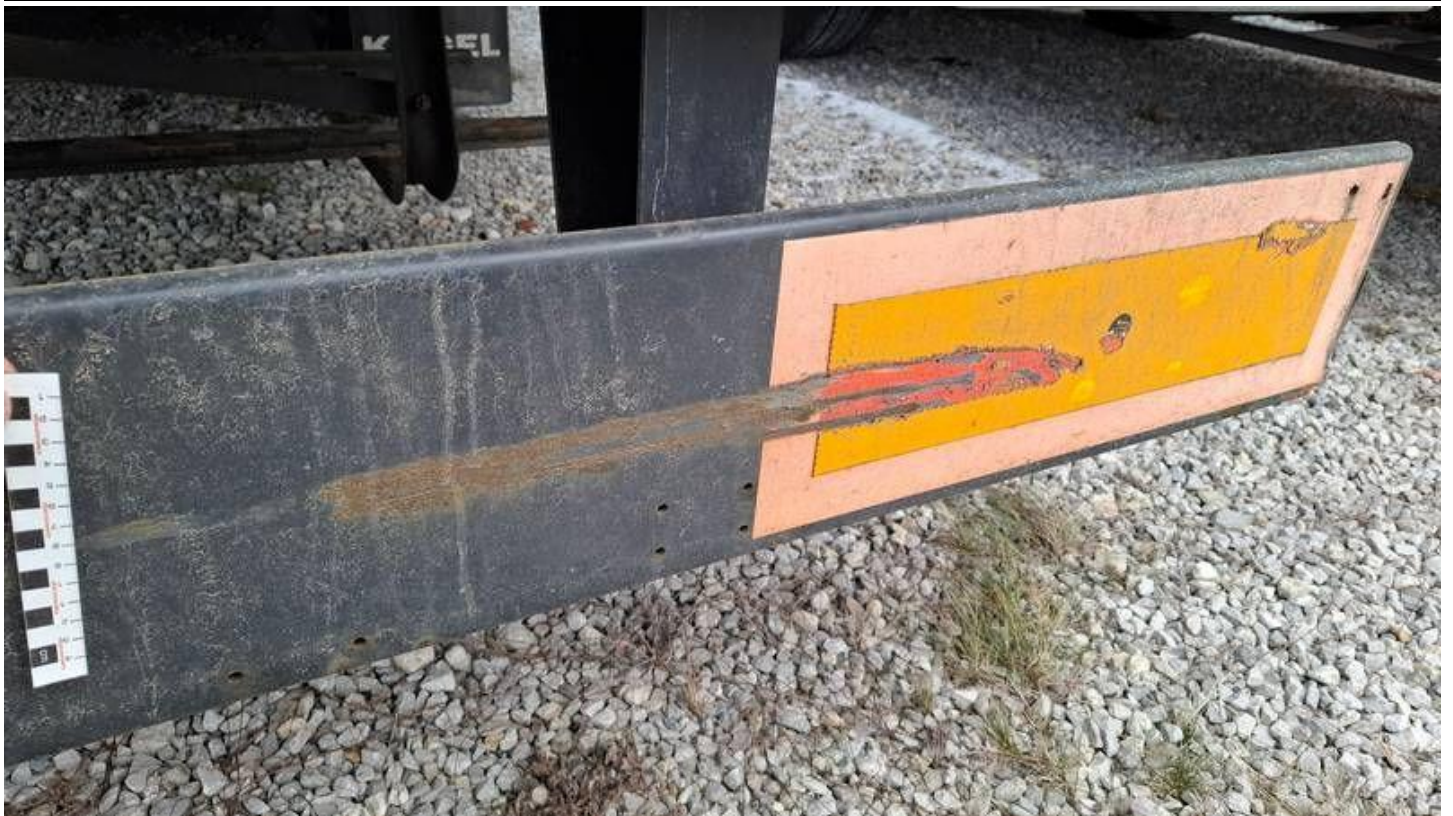
Fot. nr 35