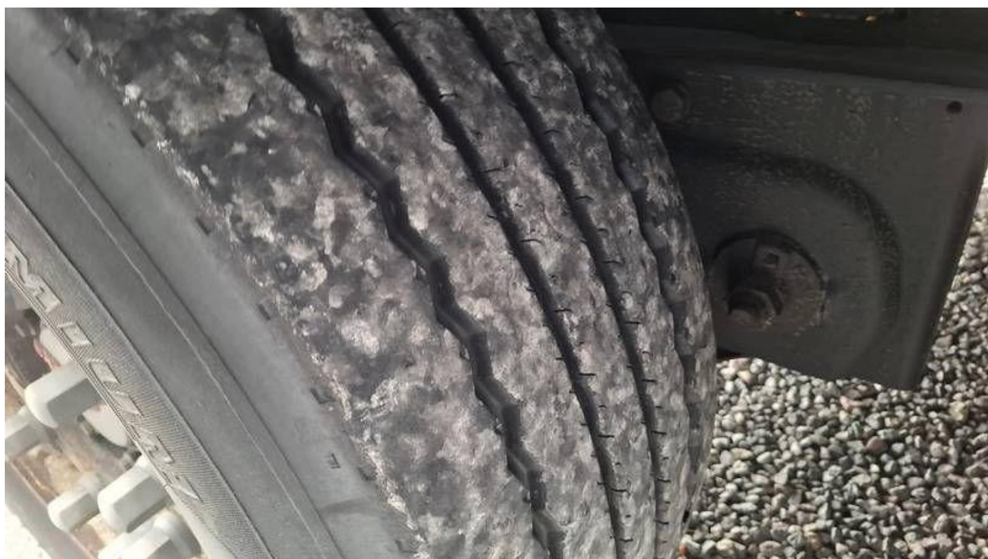
Fot. nr 48