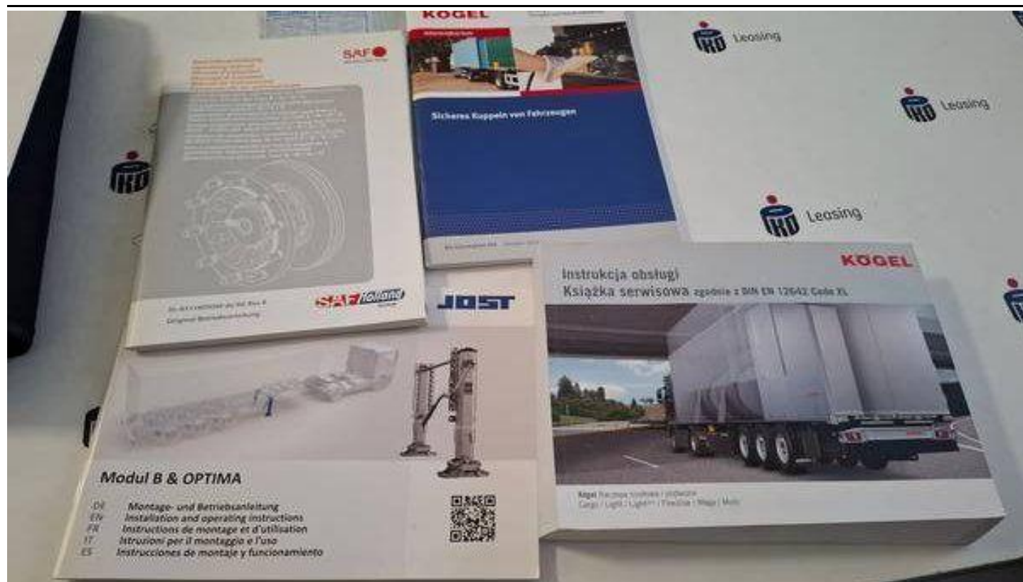
Fot. nr 53

Dokument wystawiony elektronicznie, wa ny bez podpisu