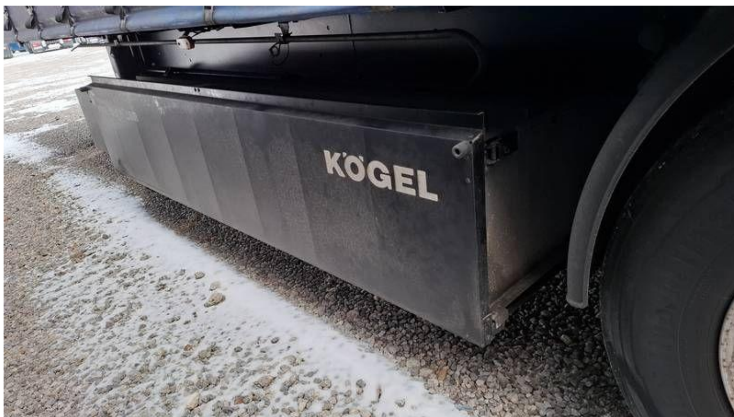
Fot. nr 22