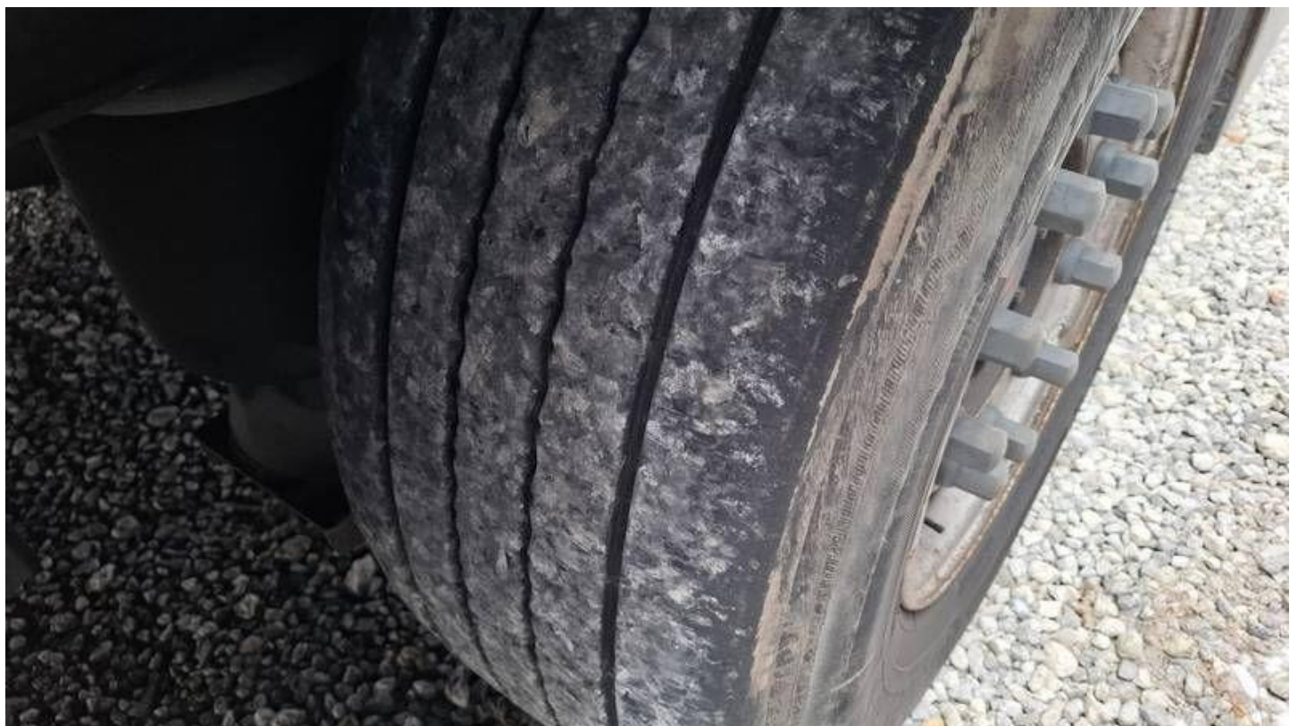
Fot. nr 44