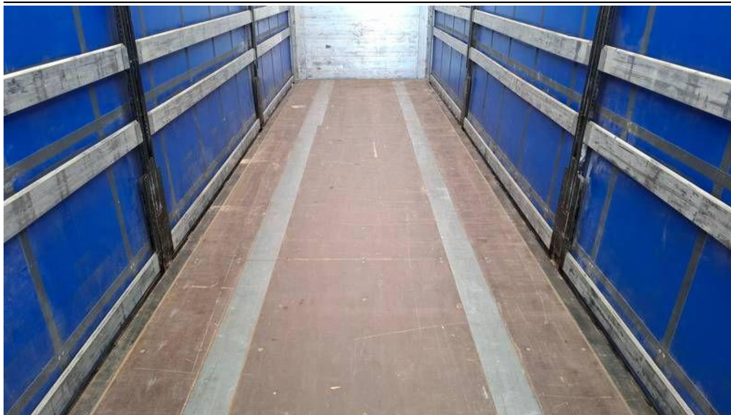
Fot. nr 23