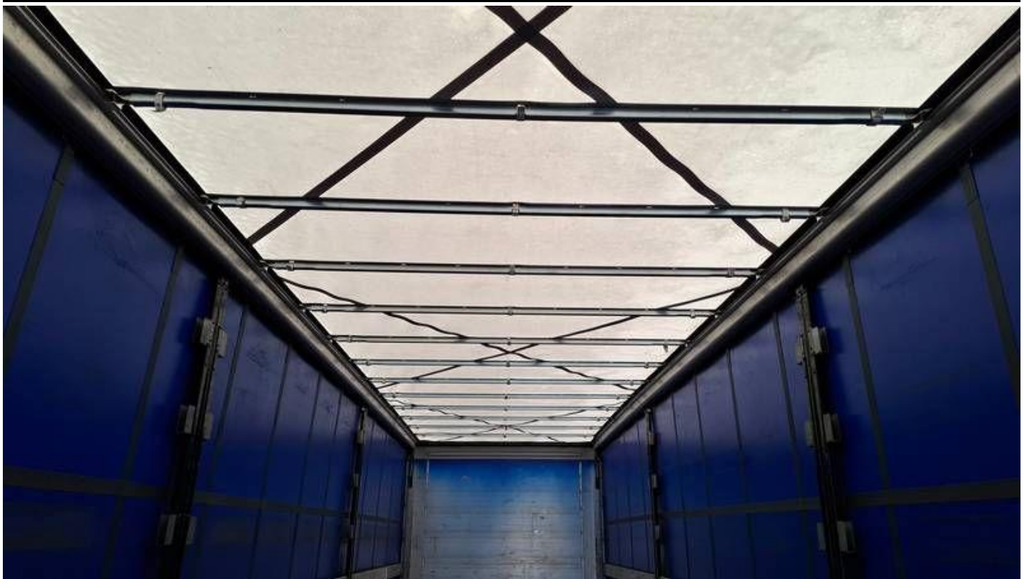
Fot. nr 25