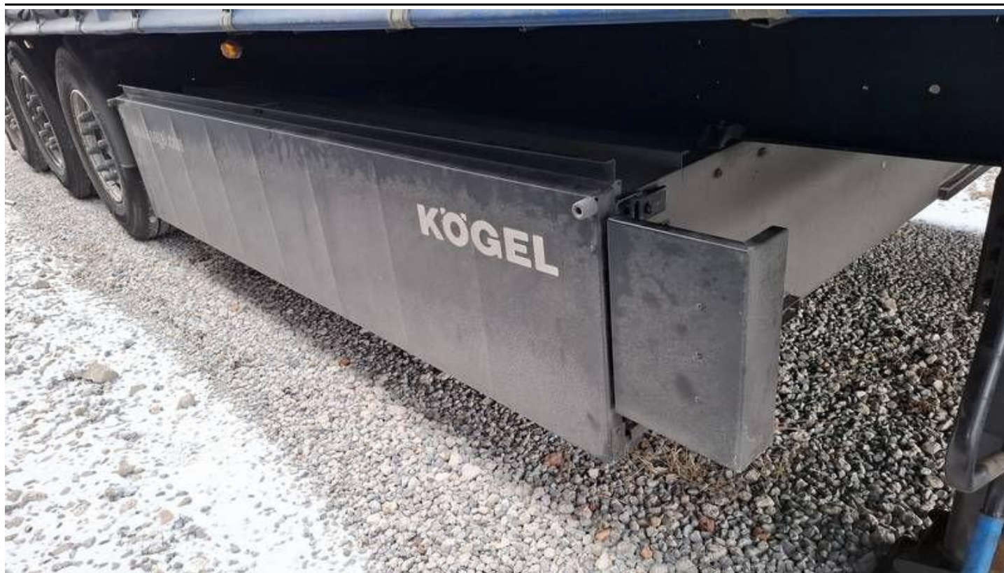
Fot. nr 15