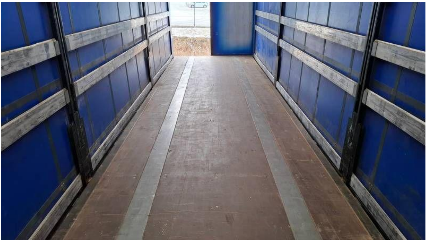
Fot. nr 26