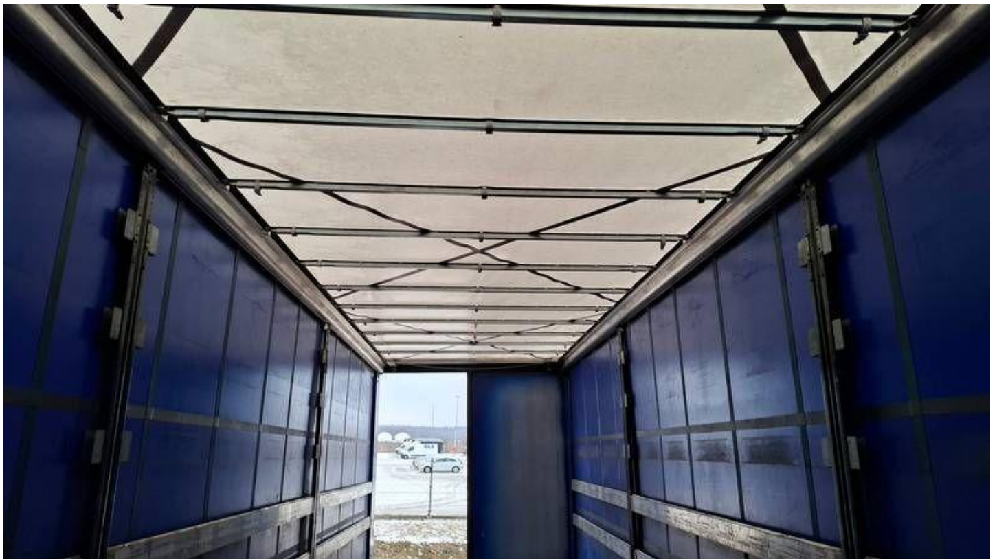
Fot. nr 28