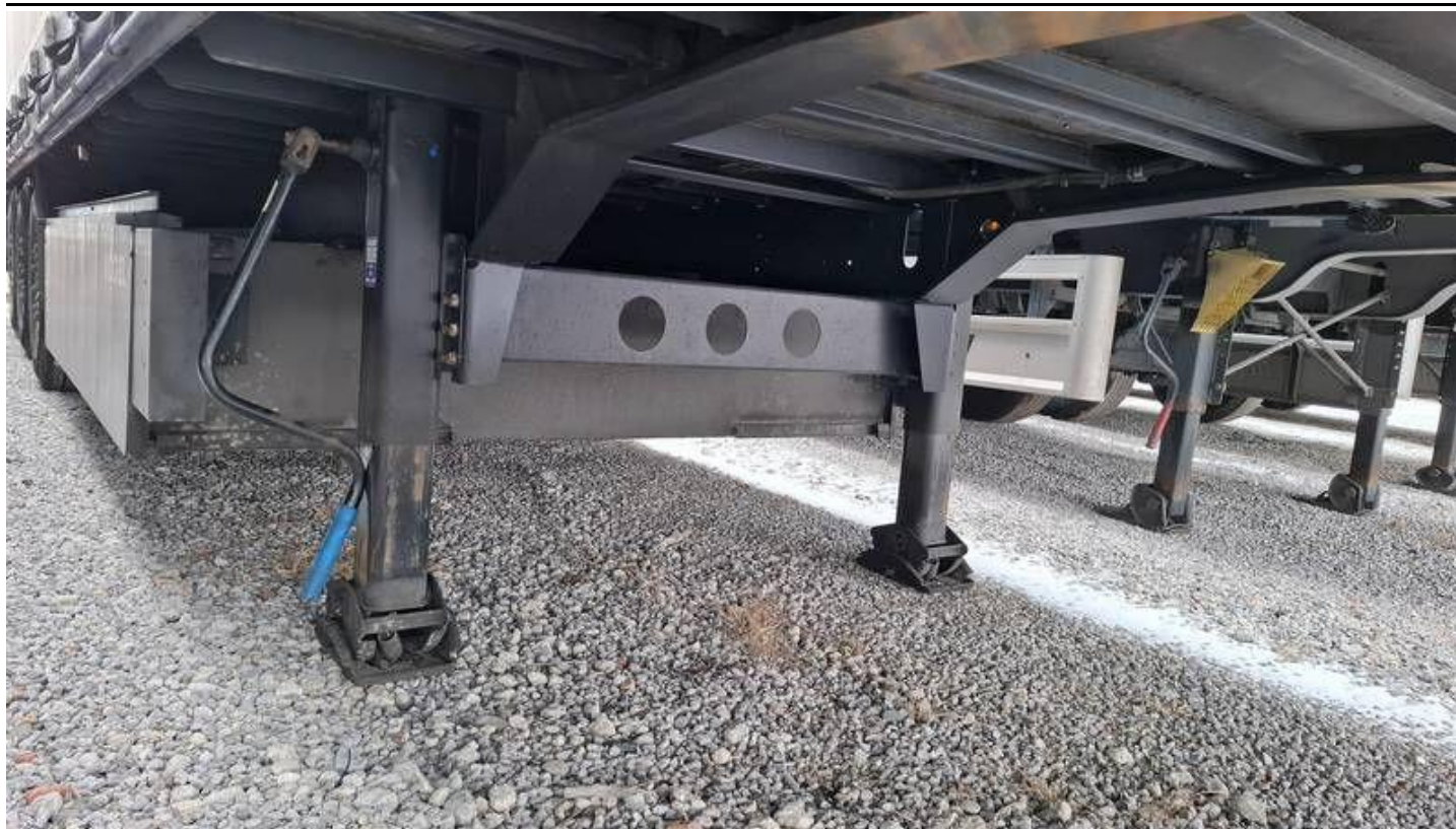
Fot. nr 13