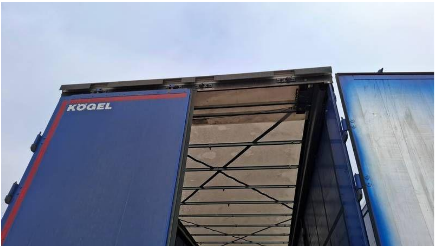
Fot. nr 29