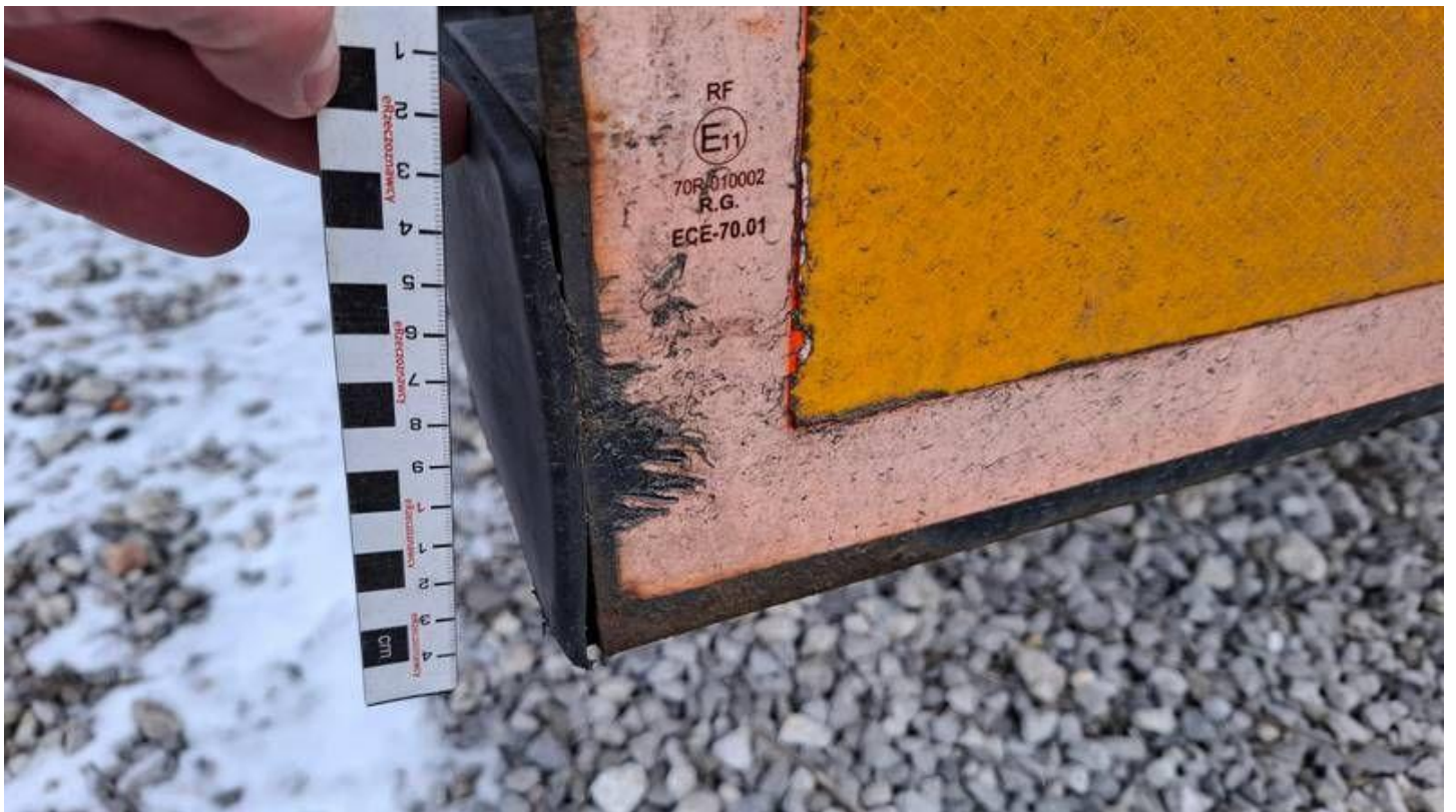
Fot. nr 34