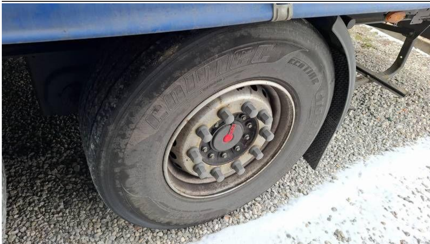
Fot. nr 41