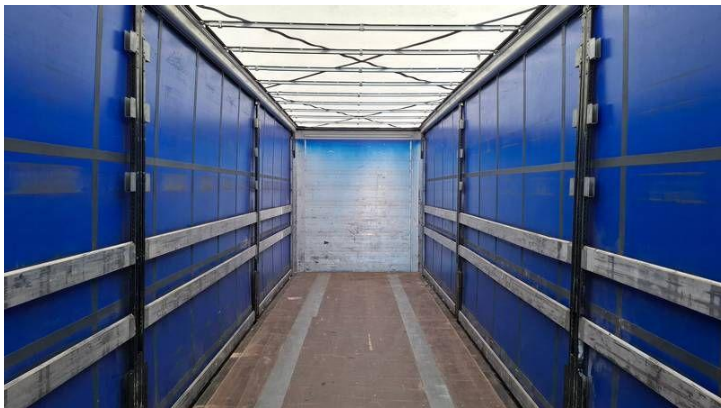
Fot. nr 24