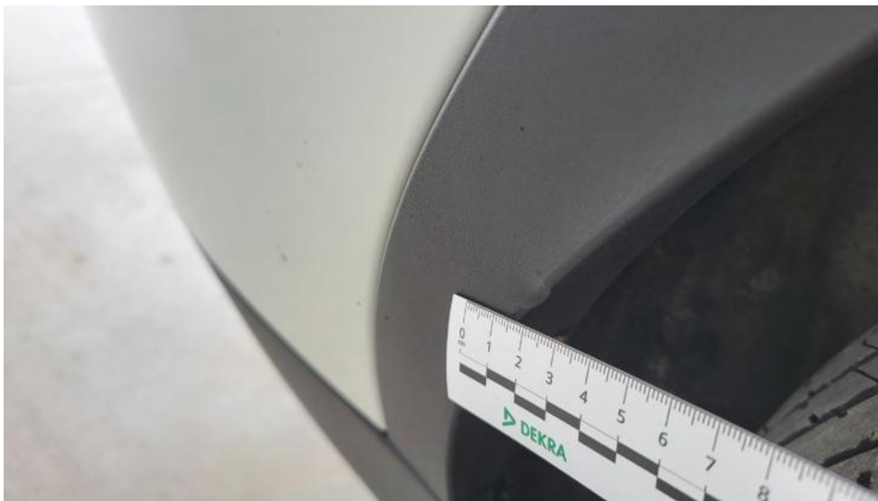
Fot. 49. Listwa krawędzi błotnika tył P - Wgniecenie/odkształcenie 1