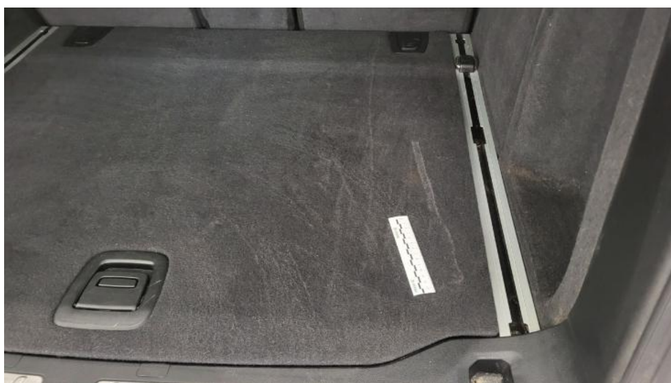
Fot. 76. Wykładzina podłogi bagażnika - Inne 1