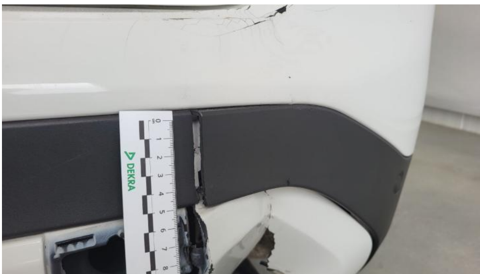
Fot. 50. Listwa śr zderzaka tylnego - Pęknięcie/rozerwanie 1