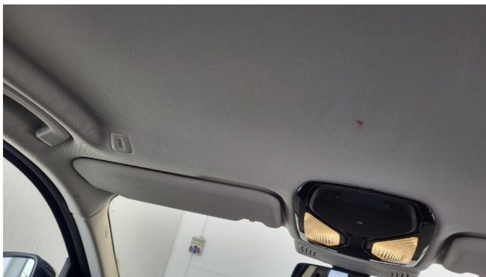
Fot. 74. Podsufitka - Inne 1