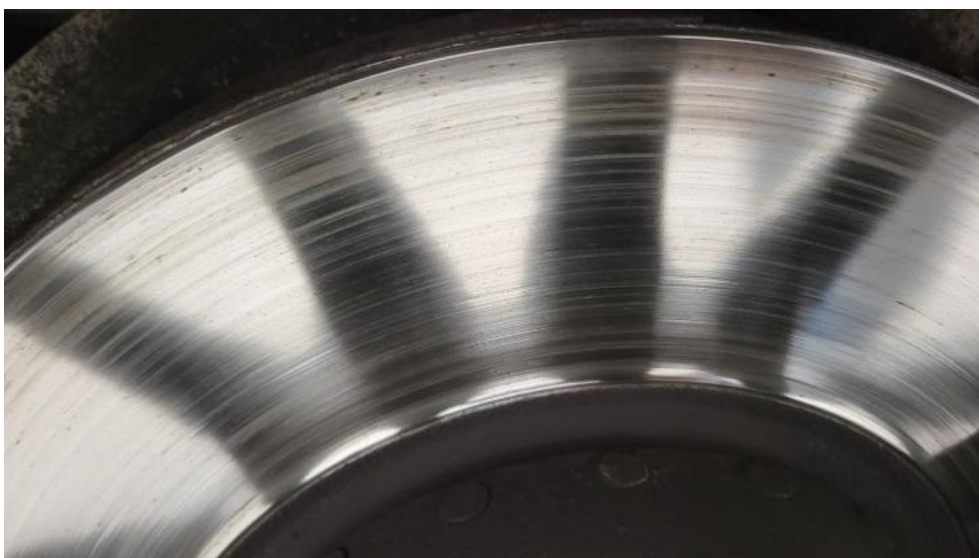
Fot. 18. Tarcza hamulcowa przednia lewa