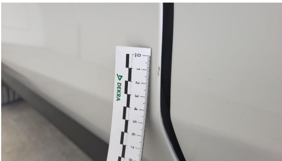
Fot. 62. Drzwi przed L - Rysa/odprysk 1