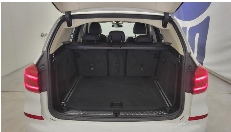
Fot. 19. Bagażnik