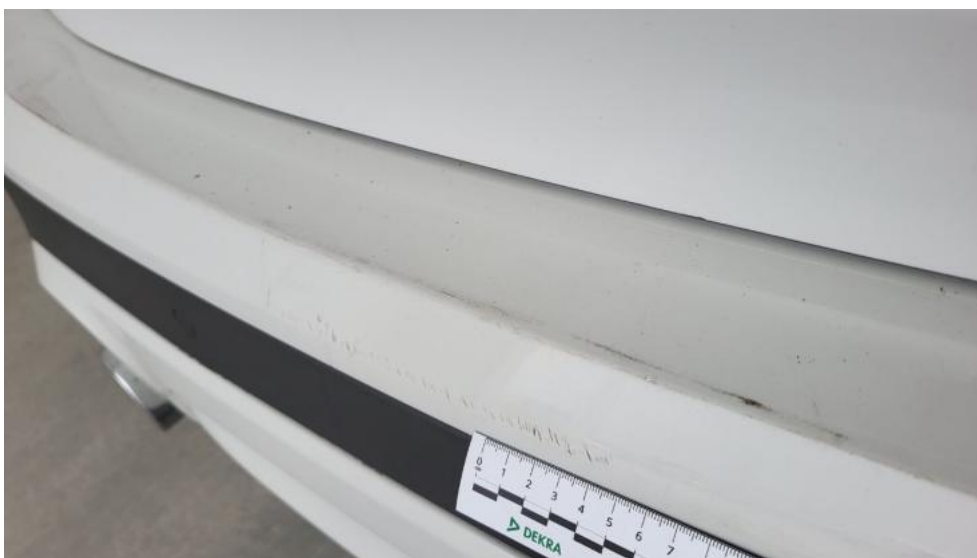
Fot. 54. Zderzak tylny - Rysa/odprysk 1