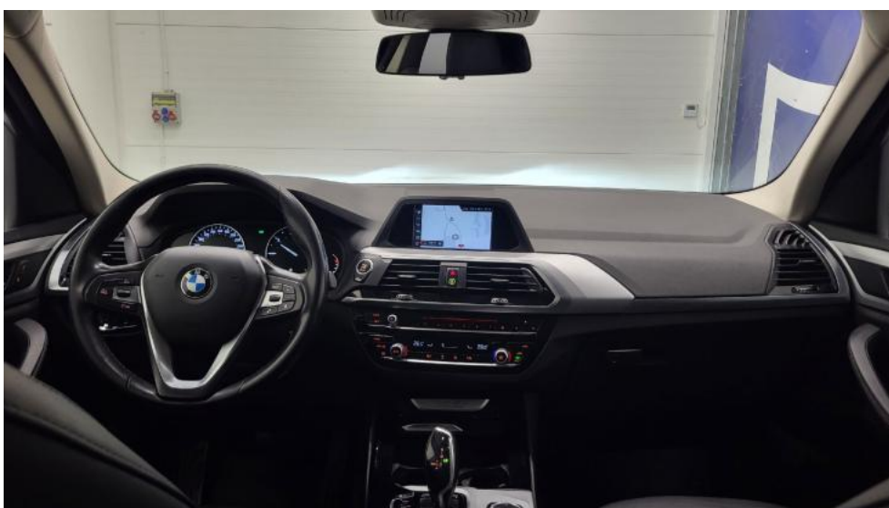
Fot. 28. Widok z tylnej kanapy na deskę rozdzielczą