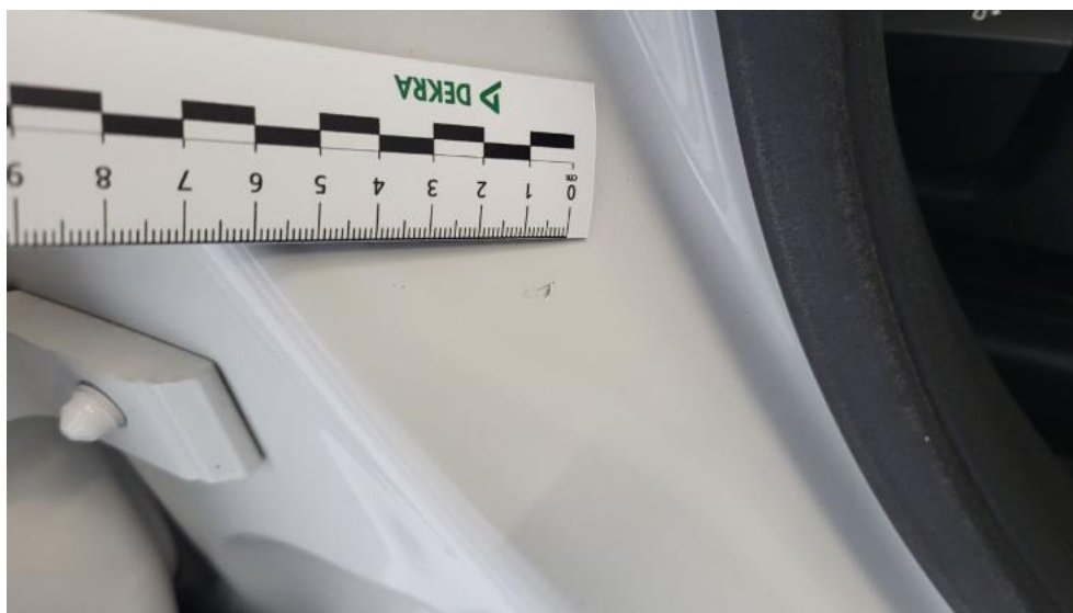
Fot. 45. Stupek środkowy P - Rysa/odprysk 1