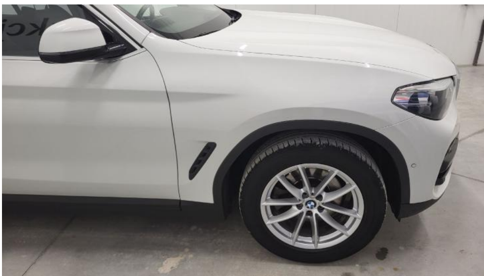
Fot. 4. Bok prawy z przodu