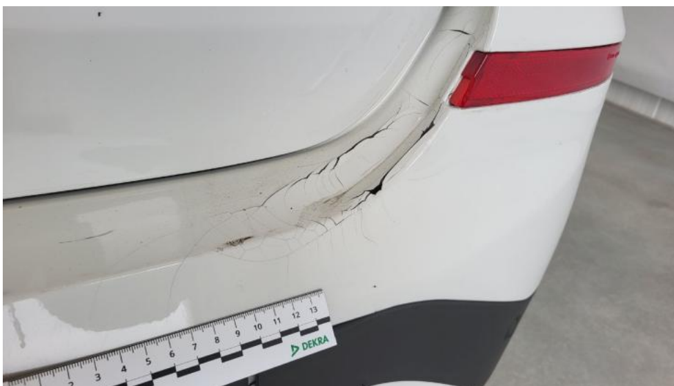
Fot. 55. Zderzak tylny - Pęknięcie/rozerwanie 1