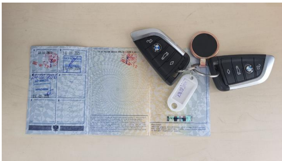
Fot. 33. Dow. Rej. Str.2 i klucze