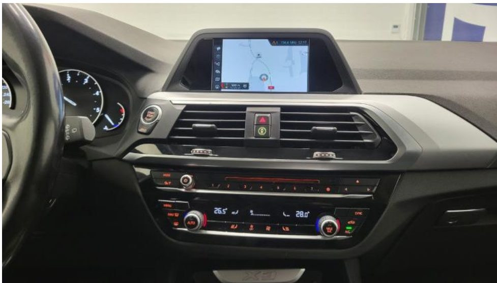
Fot. 29. Konsola środkowa