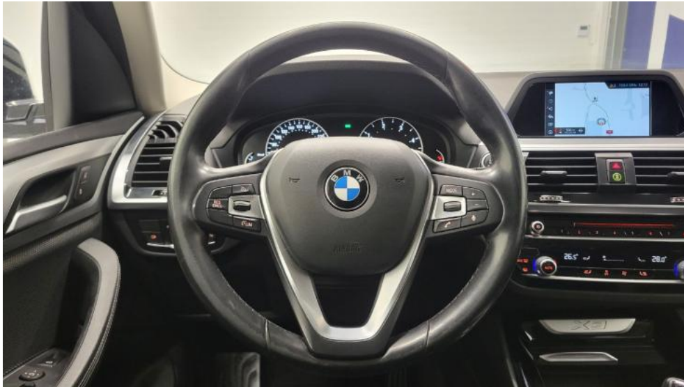
Fot. 31. Kierownica (na wprost)