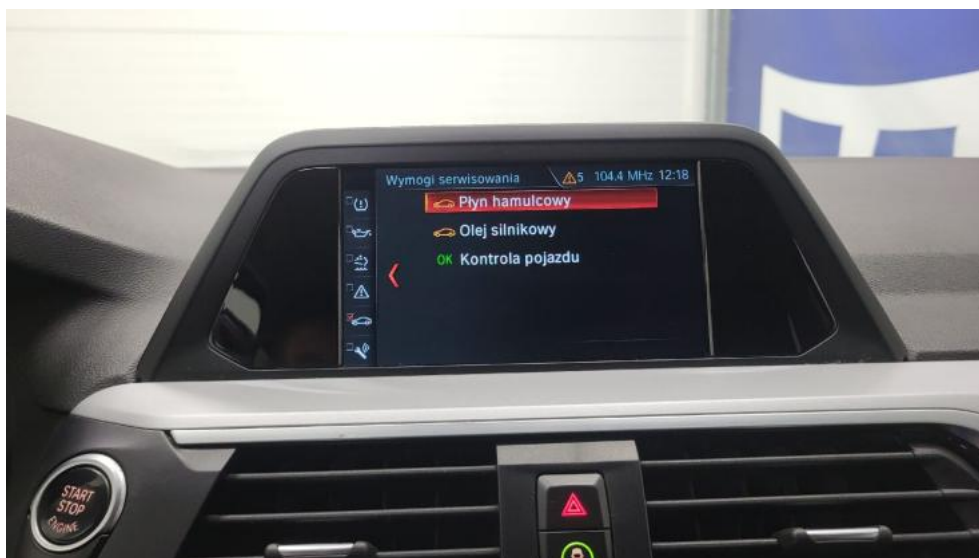
Fot. 34. Książka serwisowa – dane