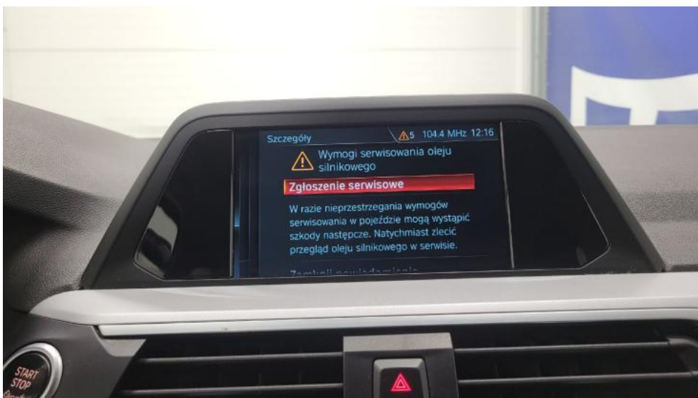
Fot. 38. Zdjęcie do protokołu