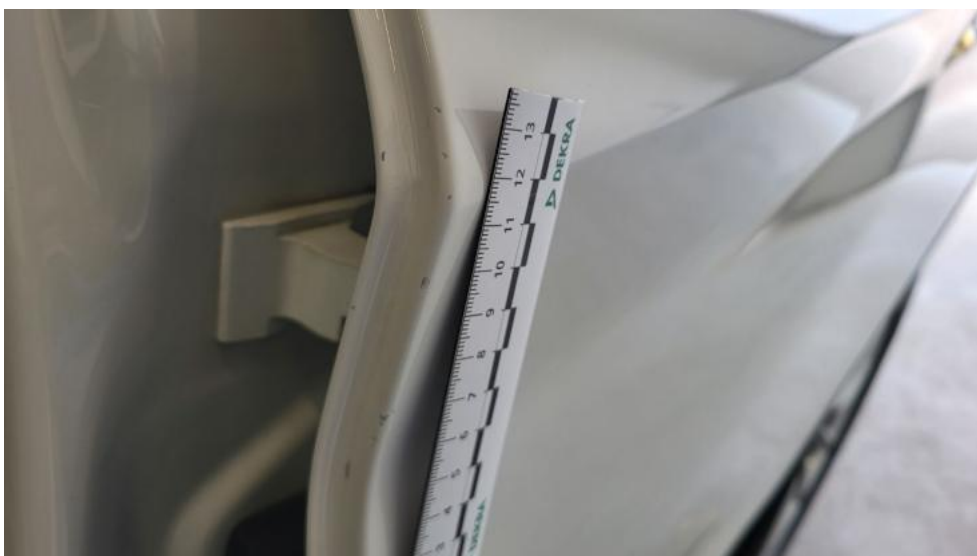
Fot. 64. Drzwi tylne L - Rysa/odprysk 1