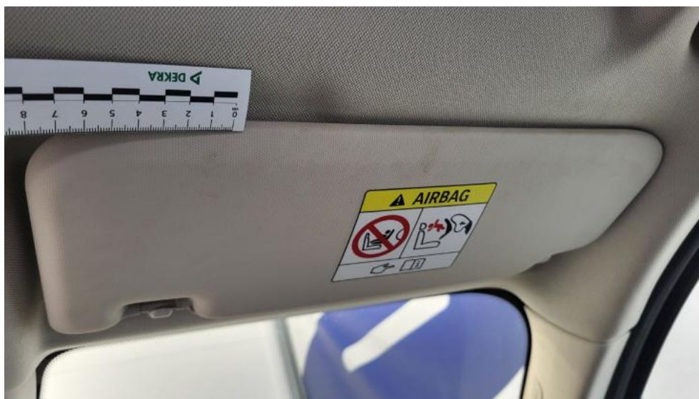
Fot. 73. Osłona p/słoneczna prawa - Inne 1