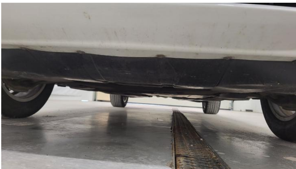
Fot. 13. Spód pojazdu przód