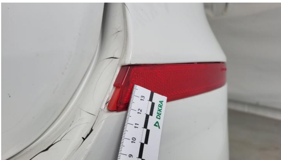
Fot. 48. Lampa przeciwmgielna tylna P - Pęknięcie/rozerwanie 1