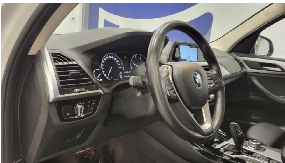
Fot. 26. Kierownica z lewej strony