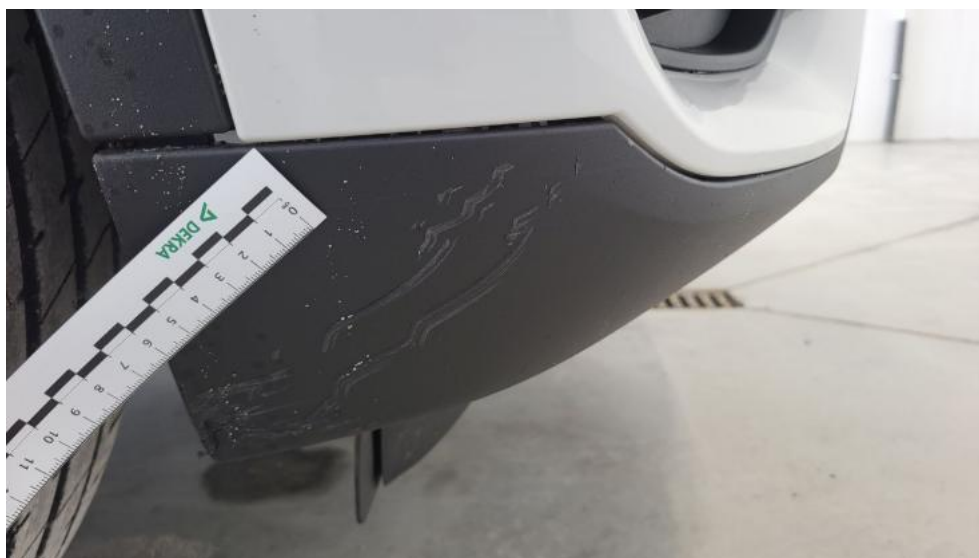
Fot. 42. Zderzak przedni cz dolna - Rysa/odprysk 1