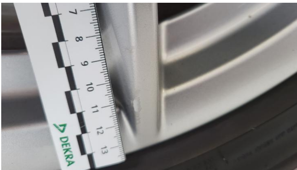
Fot. 47. Felga aluminiowa tylna P - Rysa/odprysk 1