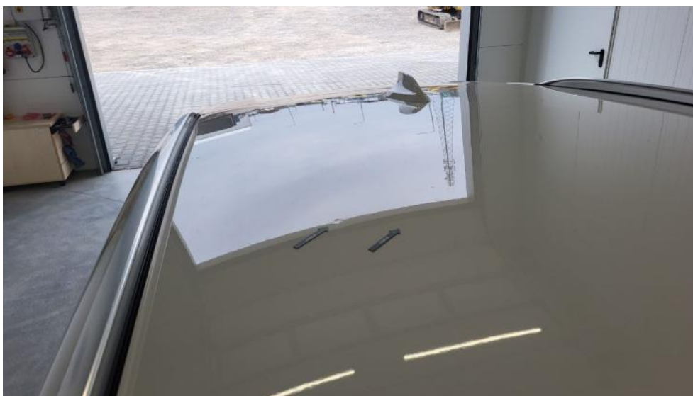
Fot. 57. Dach - Wgniecenie/odkształcenie 1