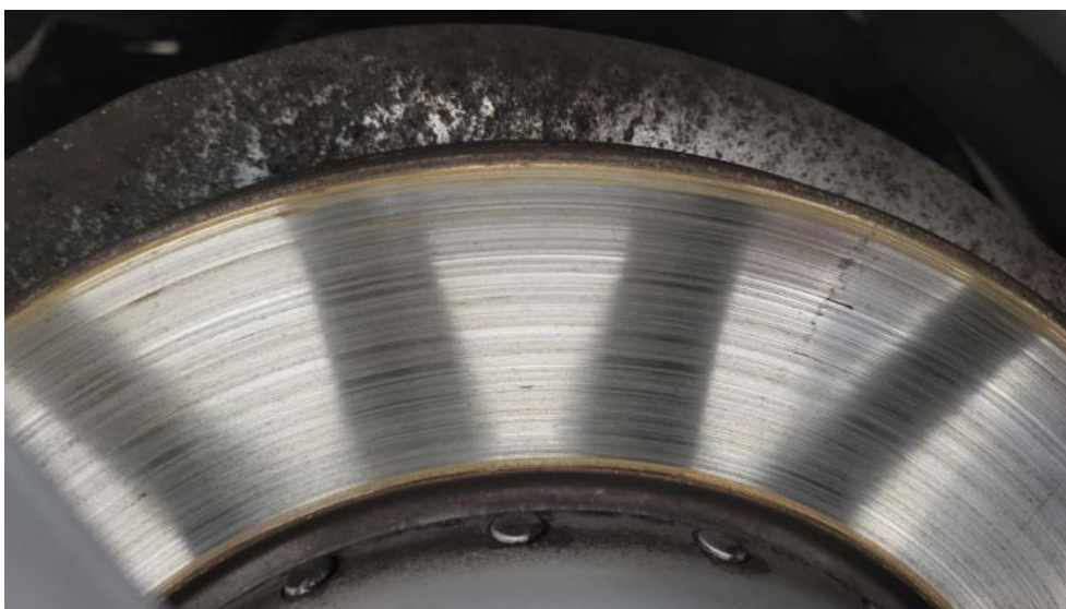
Fot. 16. Tarcza hamulcowa tylna prawa