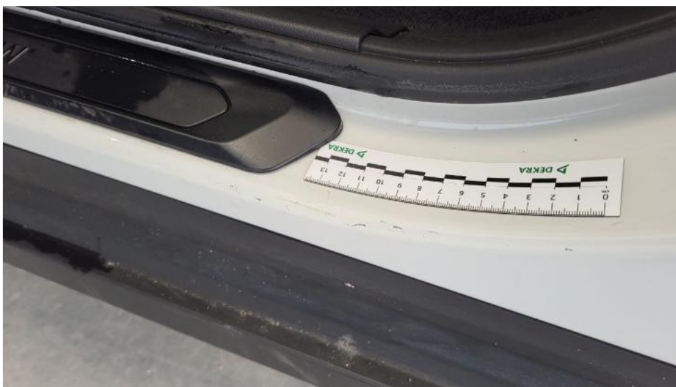
Fot. 65. Próg L - Rysa/odprysk 1