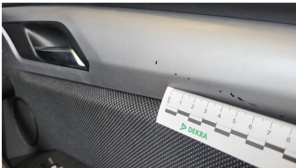
Fot. 70. Tapicerka drzwi tylnych P - Rysa/odprysk 1