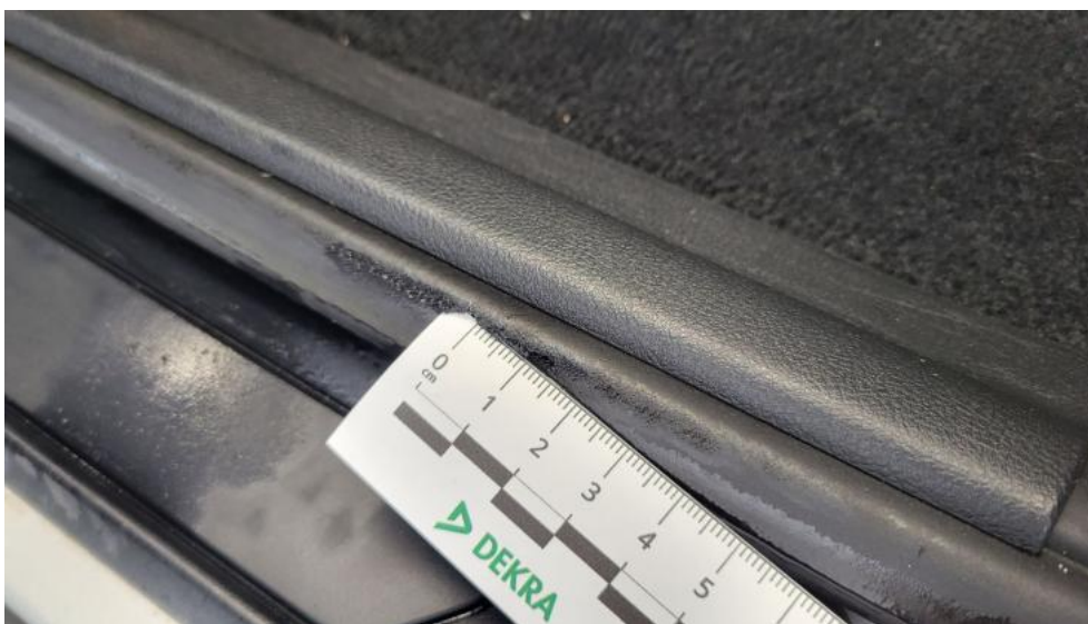
Fot. 71. Uszczelka drzwi przednich L - Pęknięcie/rozerwanie 1