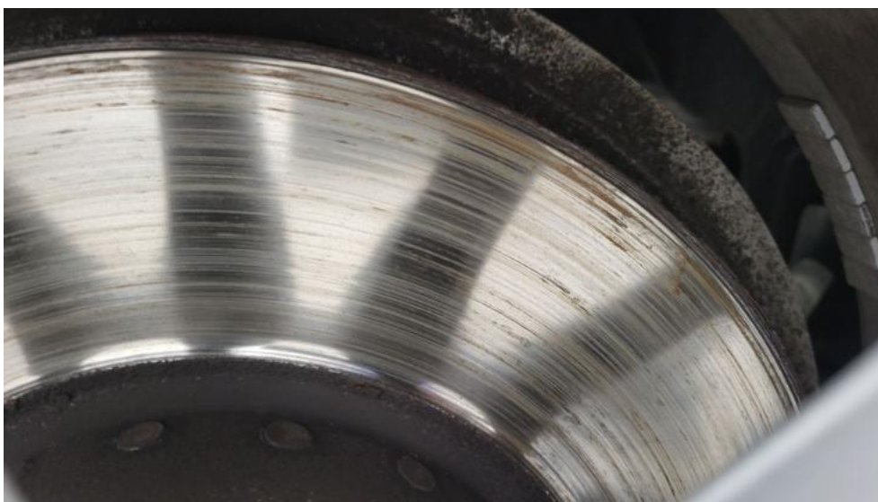
Fot. 15. Tarcza hamulcowa przednia prawa