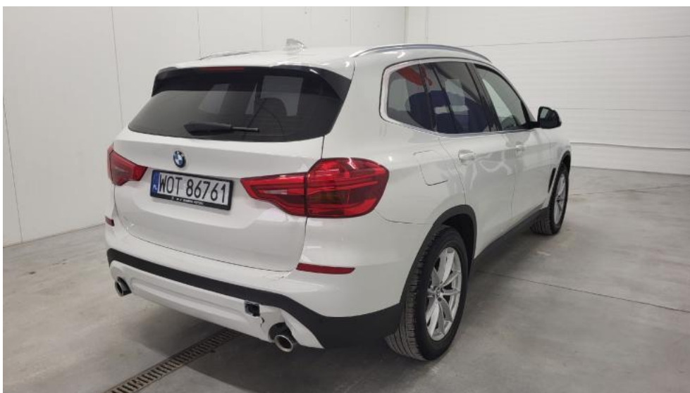
Fot. 6. Przekątna tylna prawa