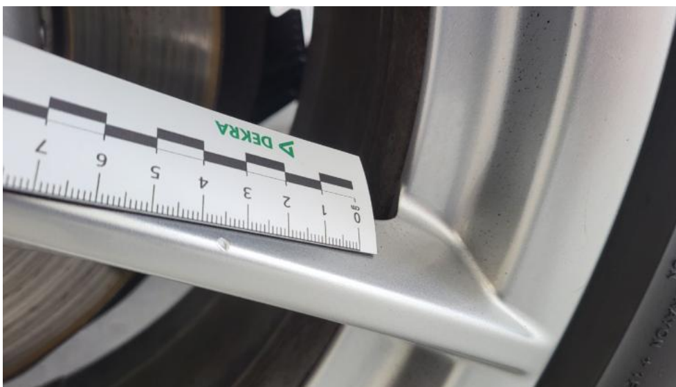
Fot. 61. Felga aluminiowa tylna L - Rysa/odprysk 1