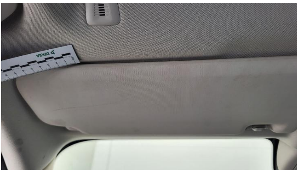
Fot. 72. Osłona p/słoneczna lewa - Inne 1