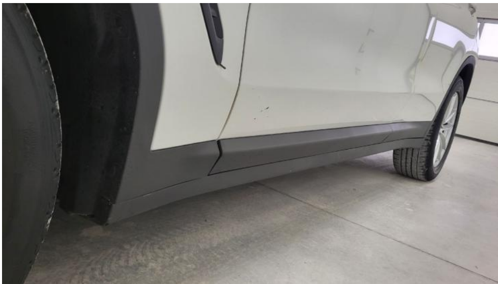
Fot. 11. Próg lewy (widok od przodu)