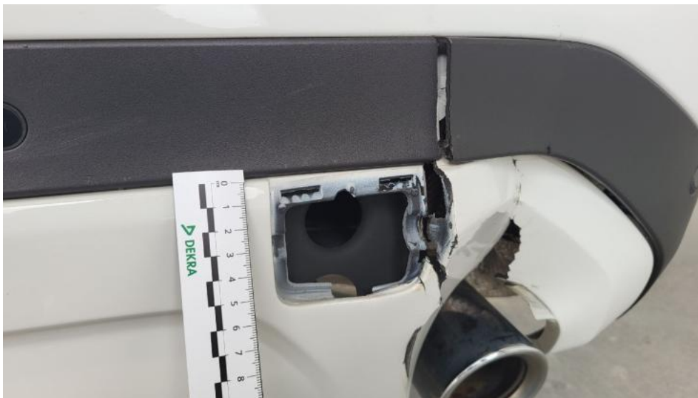
Fot. 53. Zaślepka tyl haka hol. - Inne 1