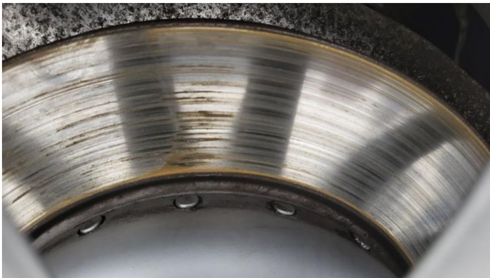
Fot. 17. Tarcza hamulcowa tylna lewa