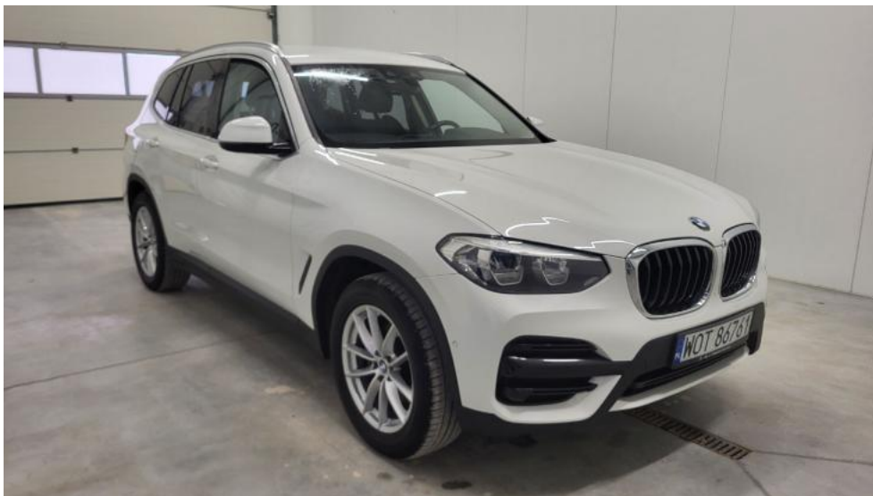
Fot. 3. Przekątna przednia prawa