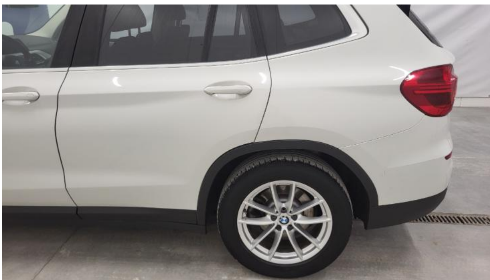
Fot. 9. Bok lewy z tyłu