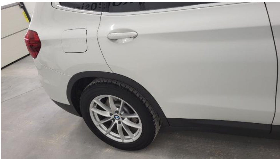
Fot. 5. Bok prawy z tyłu