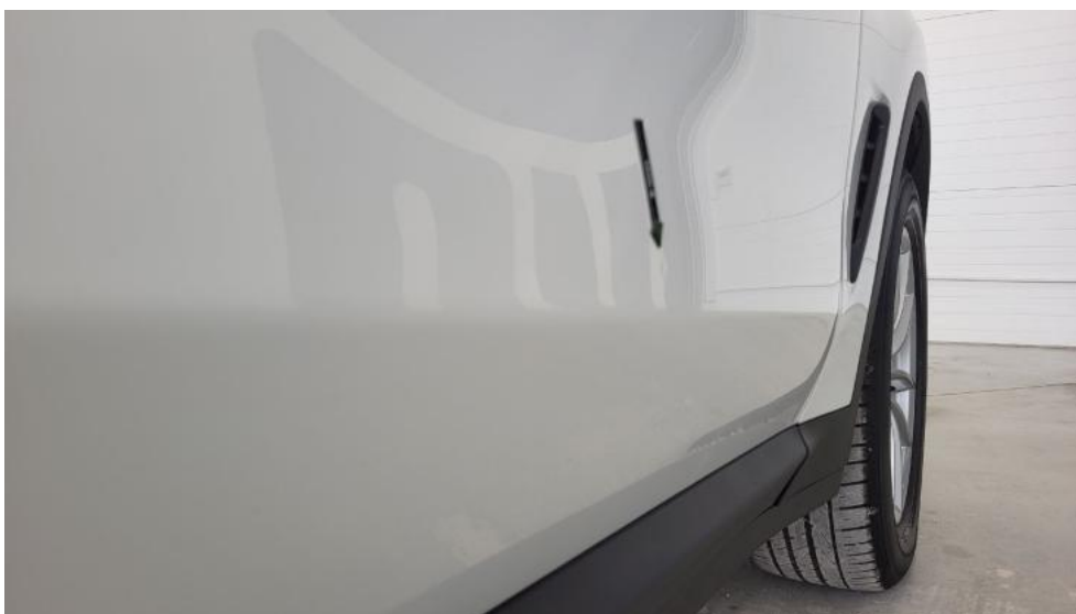
Fot. 44. Drzwi przednie P - Wgniecenie/odkształcenie 1