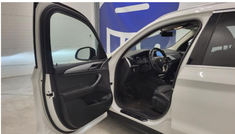
Fot. 25. Widok przez otwarte drzwi przednie lewe