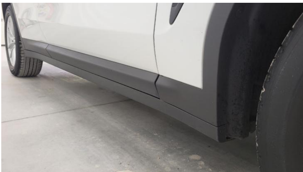
Fot. 12. Próg prawy (widok od przodu)