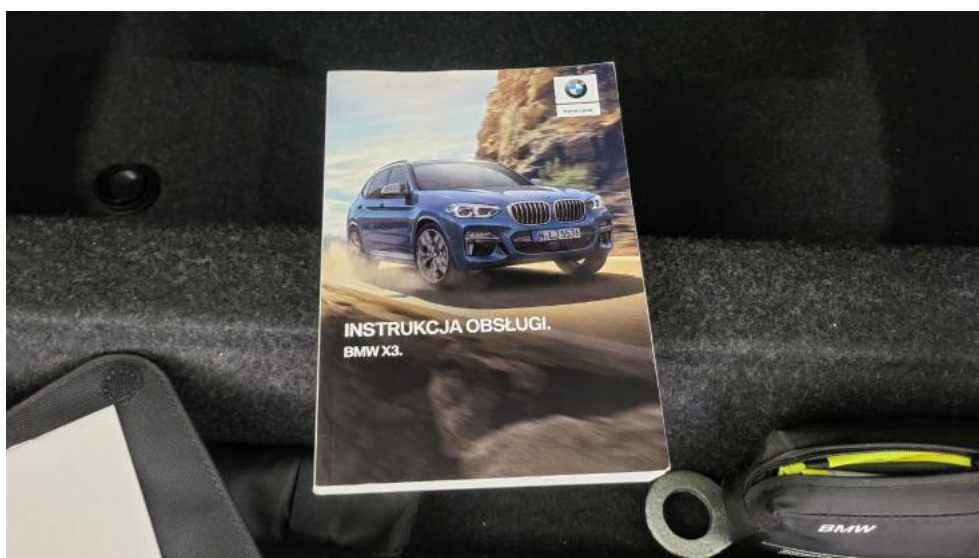
Fot. 36. Instrukcje