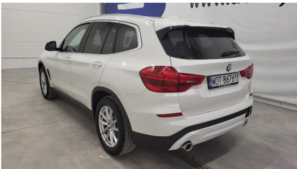
Fot. 8. Przekątna tylna lewa