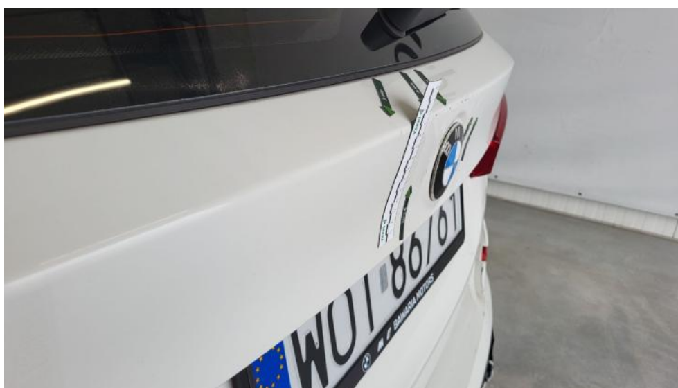
Fot. 52. Pokrywy bagażnika - Wgniecenie/odkształcenie 1