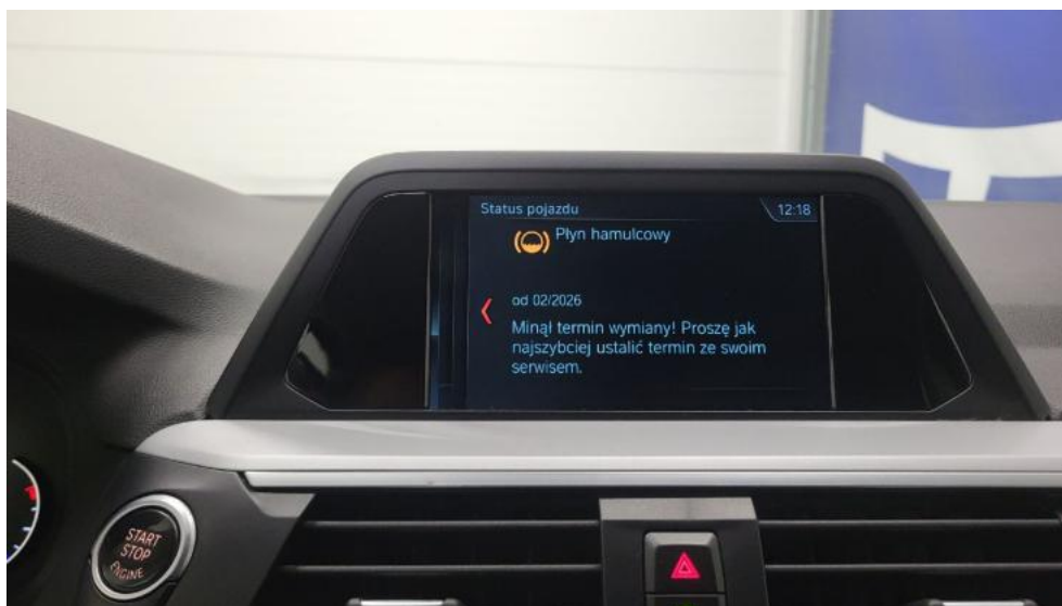
Fot. 35. Książka serwisowa – ostatni przegląd