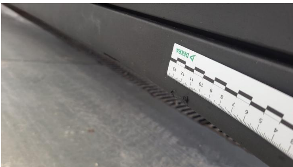
Fot. 66. Próg L - Rysa/odprysk 2