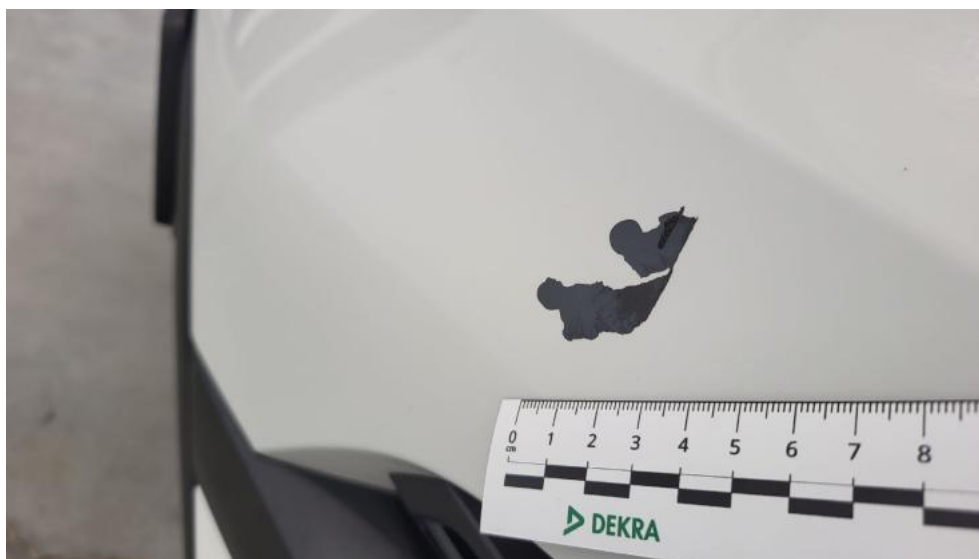
Fot. 41. Zderzak - Rysa/odprysk 1