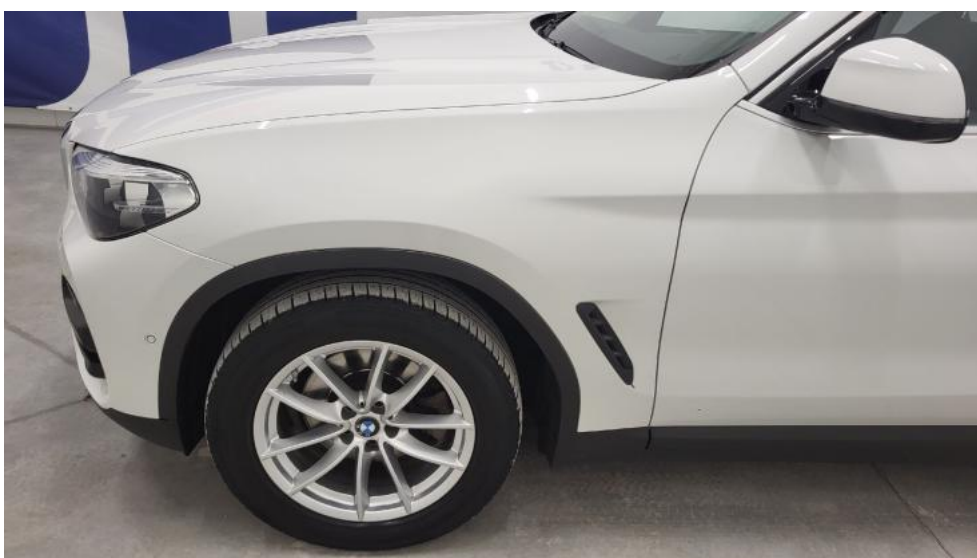
Fot. 10. Bok lewy z przodu