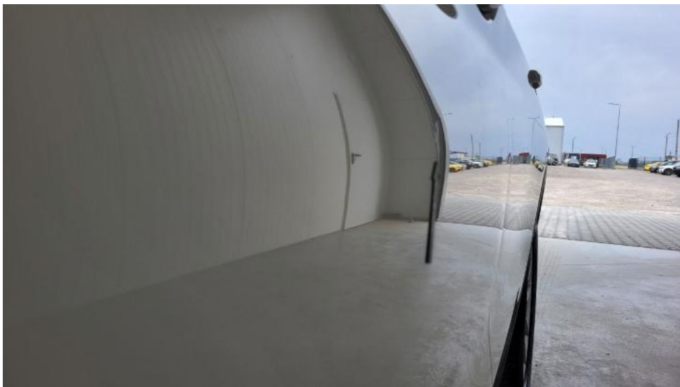
Fot. 63. Drzwi przed L - Wgniecenie/odkształcenie 1