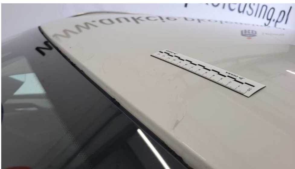
Fot. 58. Dach - Inne 1