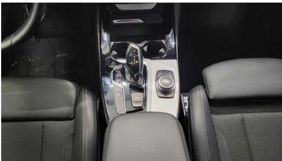
Fot. 30. Tunel środkowy