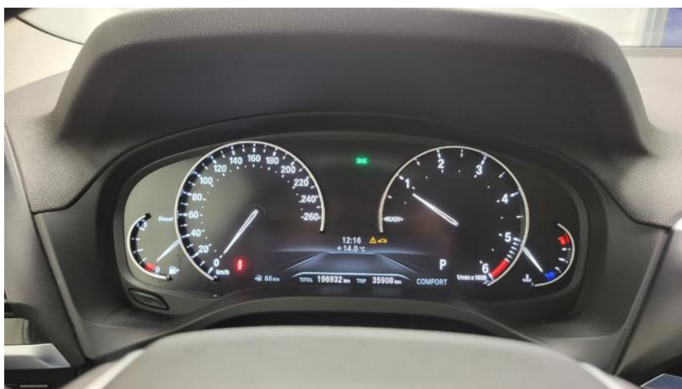
Fot. 24. Zestaw wskaźników - przebieg