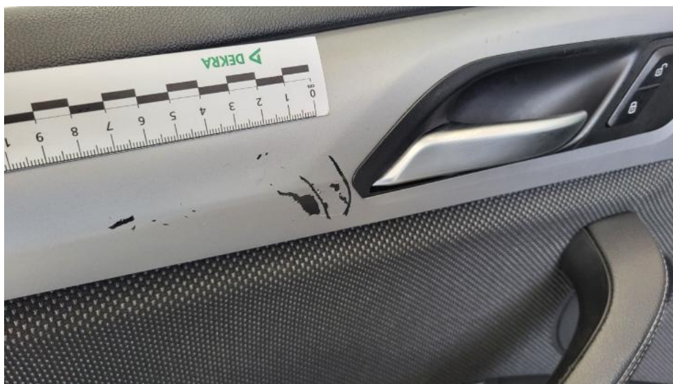
Fot. 69. Tapicerka drzwi przednich L - Rysa/odprysk 1