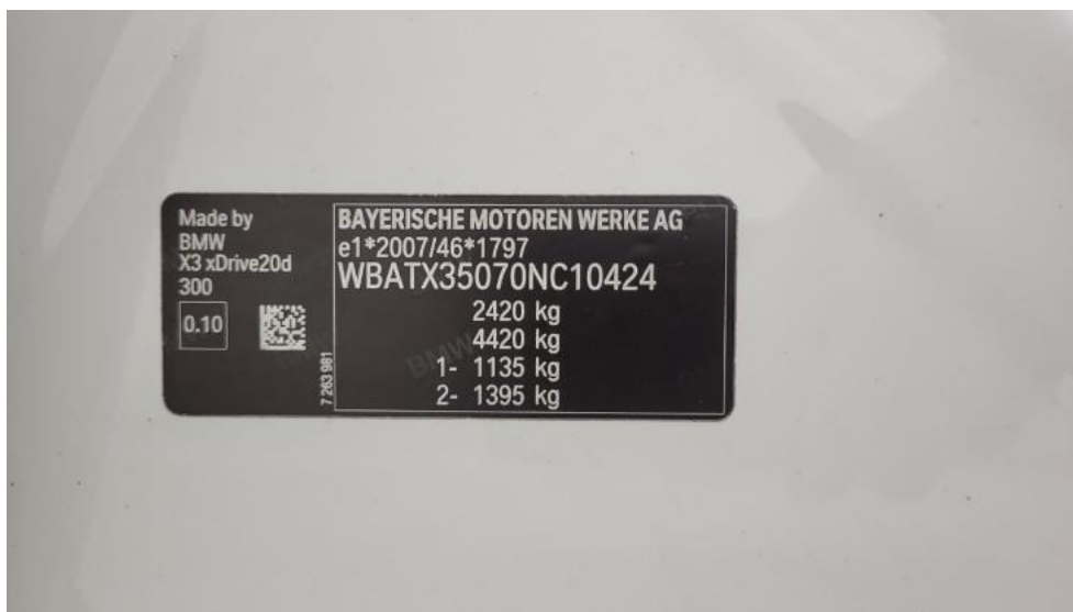
Fot. 23. Tabliczka znamionowa