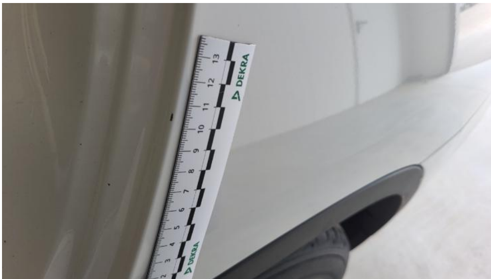
Fot. 59. Błotnik tylny L / Ściana boczna L - Rysa/odprysk 1