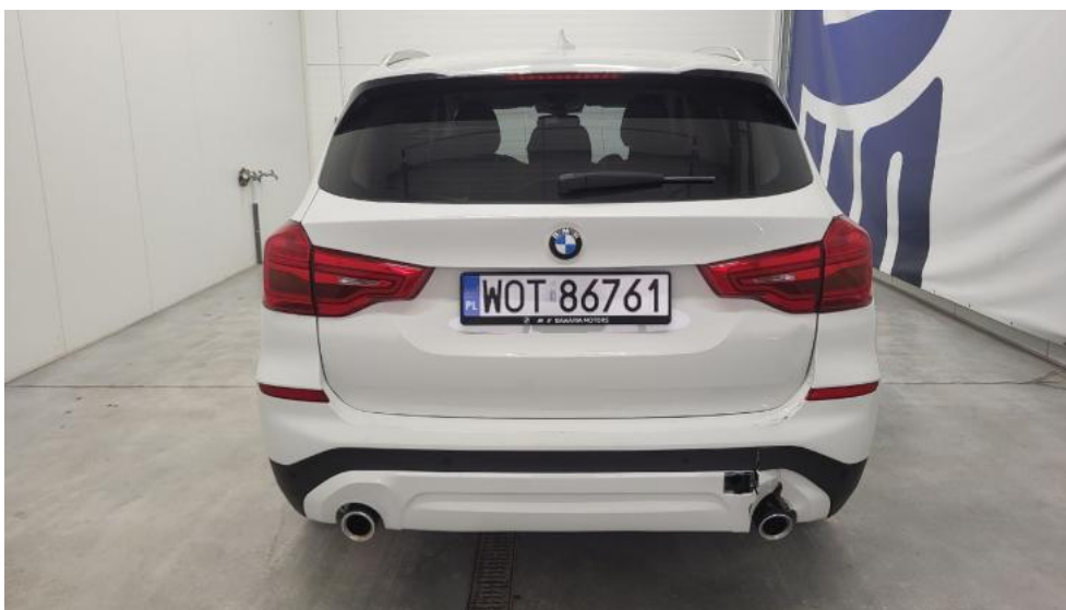
Fot. 7. Tyl