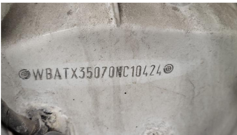
Fot. 22. Numer identyfikacyjny