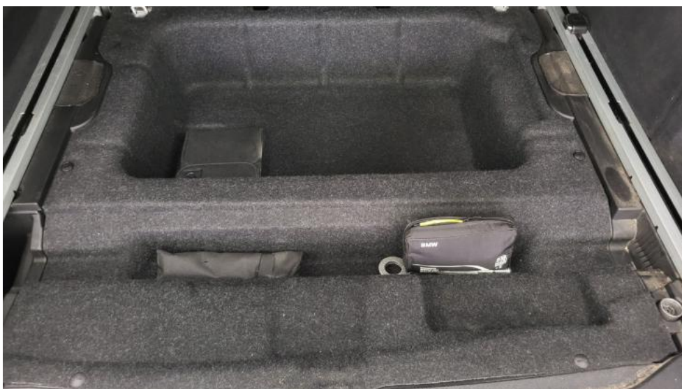
Fot. 20. Koło zapasowe