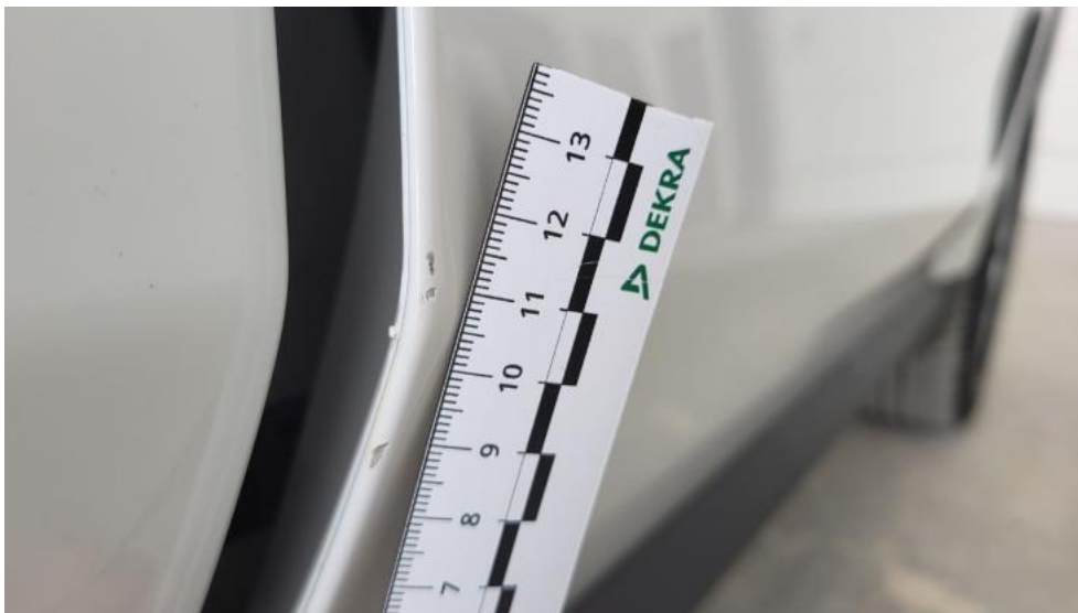
Fot. 43. Drzwi przednie P - Rysa/odprysk 1