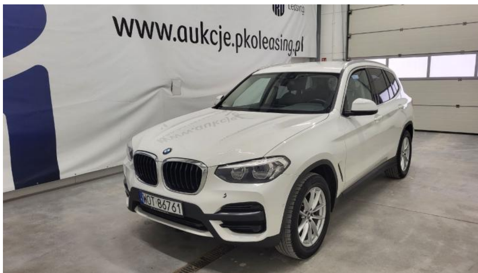
Fot. 1. Przekątna przednia lewa