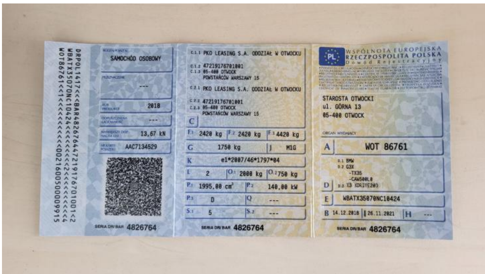
Fot. 32. Dowód rej. Str. 1