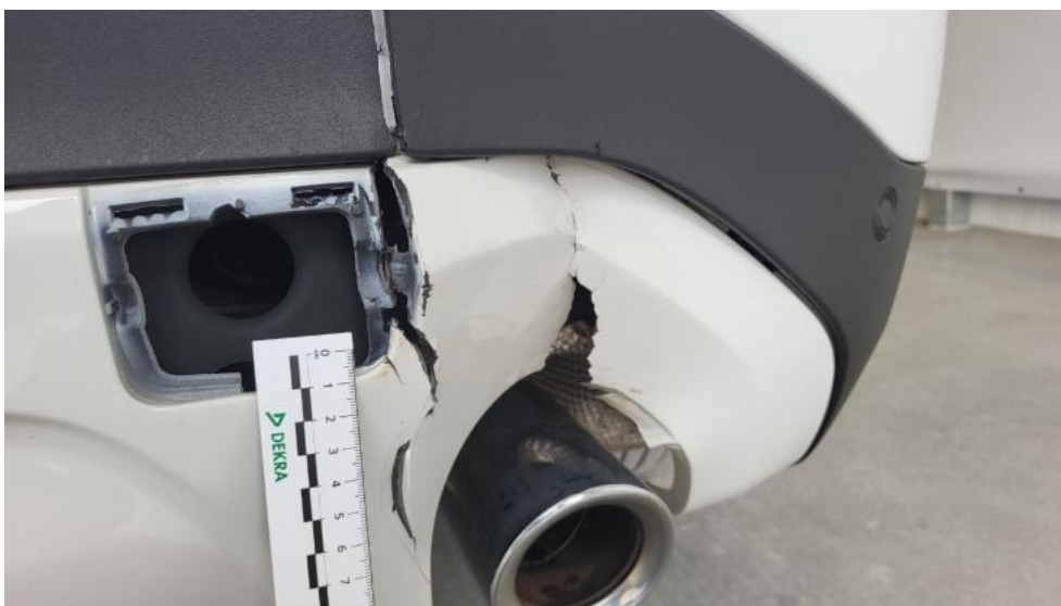
Fot. 56. Zderzak tylny cz dolna - Pęknięcie/rozerwanie 1