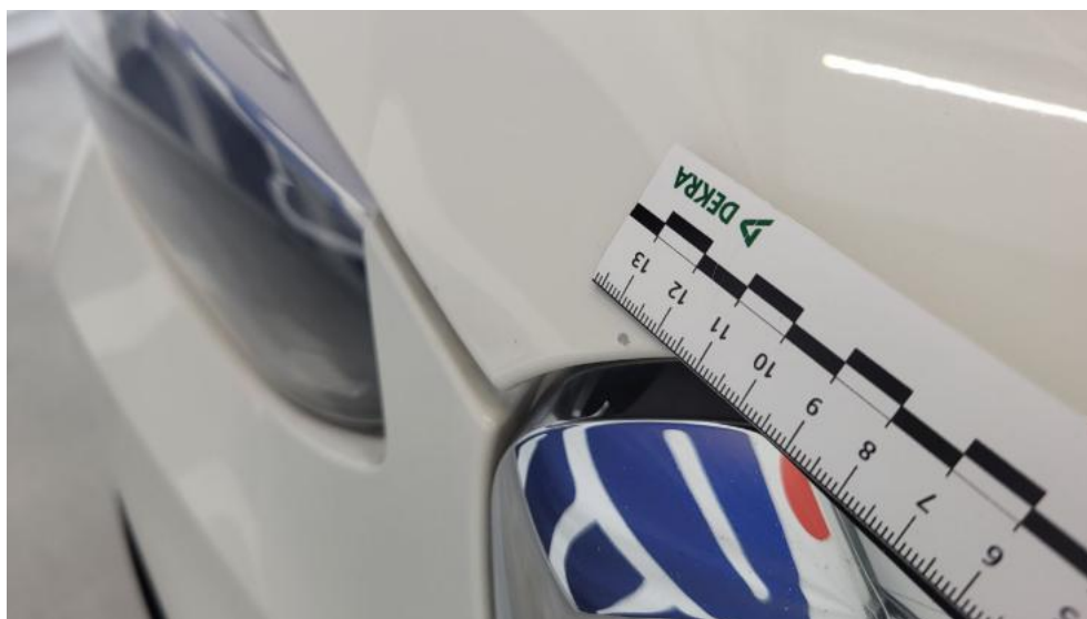
Fot. 40. Pokrywa komory silnika - Rysa/odprysk 1