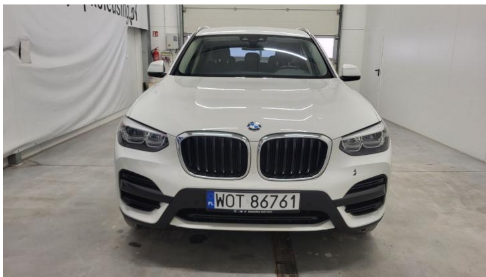
Fot. 2. Przód