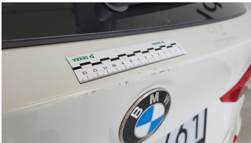
Fot. 51. Pokrywy bagażnika - Rysa/odprysk 1