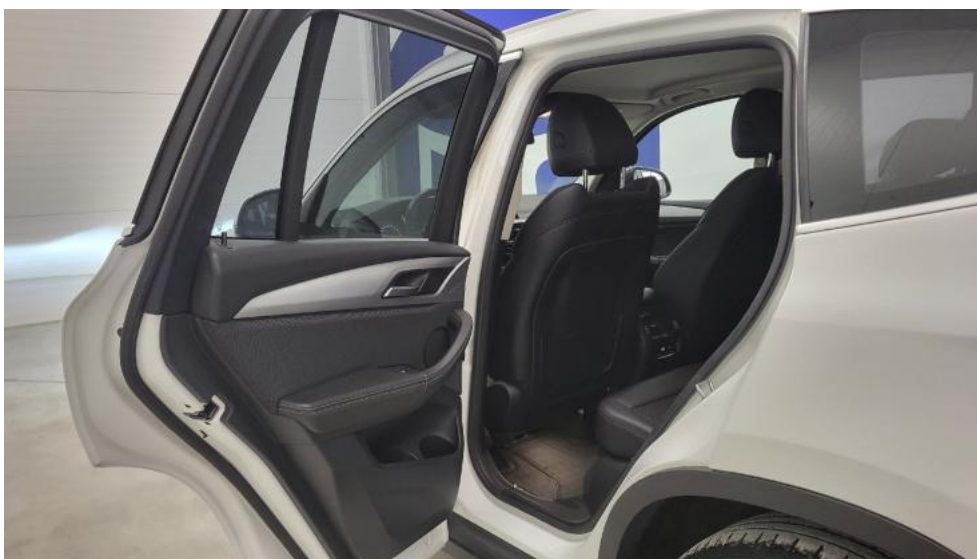
Fot. 27. Widok przez otwarte drzwi tylne lewe