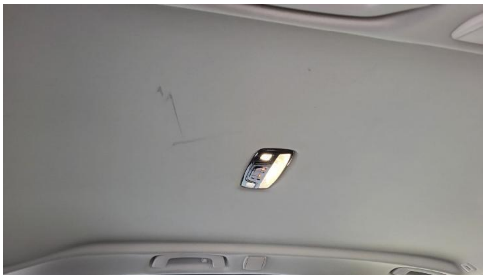
Fot. 75. Podsufitka - Inne 2