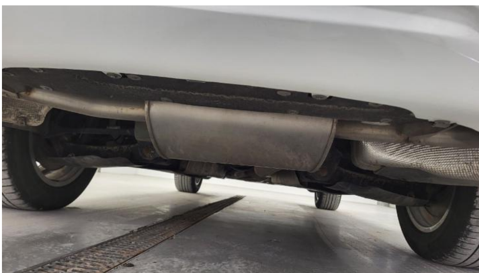
Fot. 14. Spód pojazdu tył