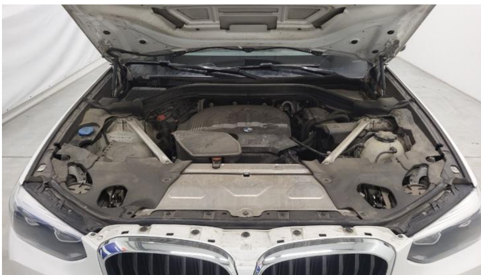
Fot. 21. Komora silnika