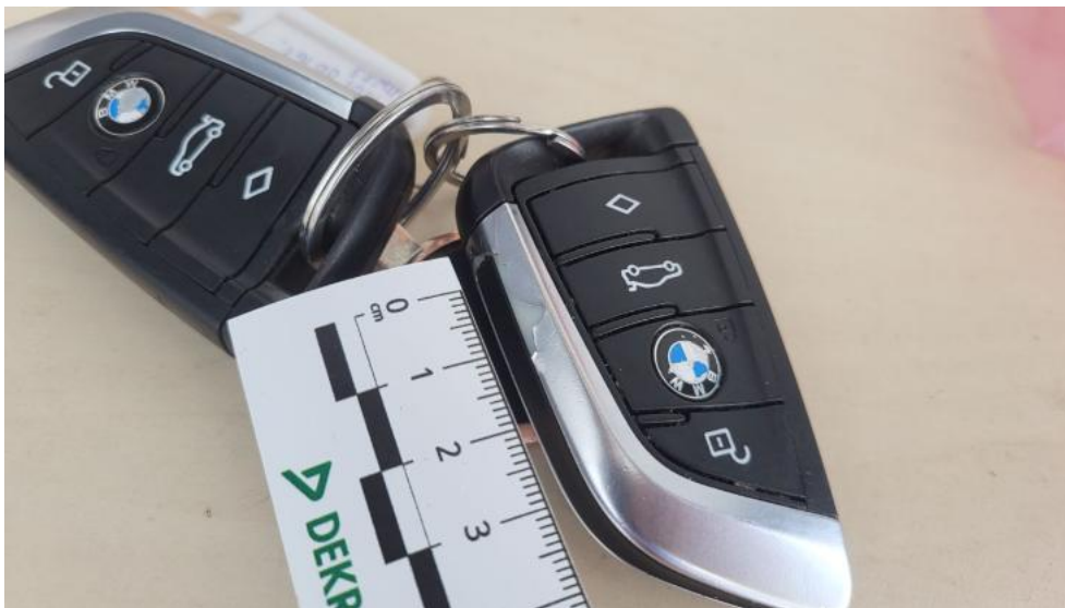
Fot. 37. Zdjęcie do protokołu