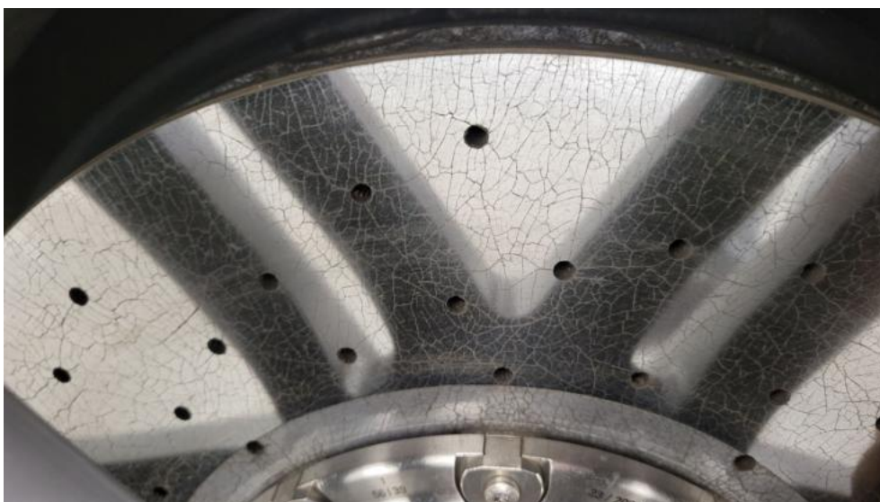
Photo 18. Tarcza hamulcowa przednia lewa