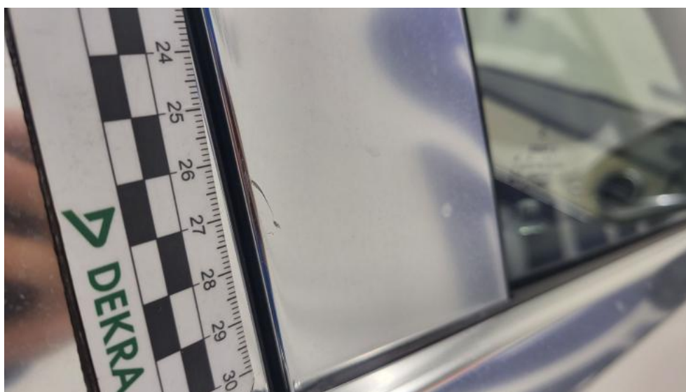
Photo 66. Drzwi przednie P - Rysa/odprysk 1