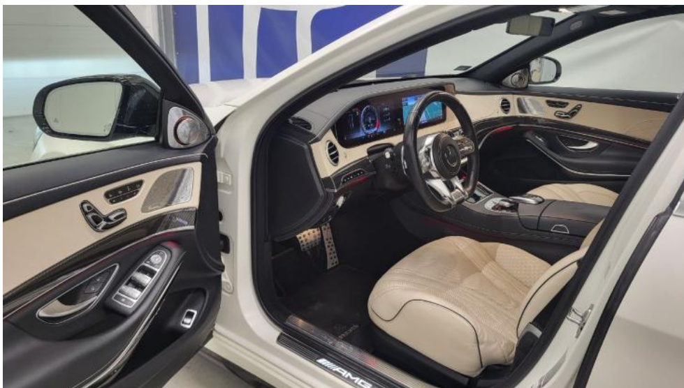
Photo 26. Widok przez otwarte drzwi przednie lewe