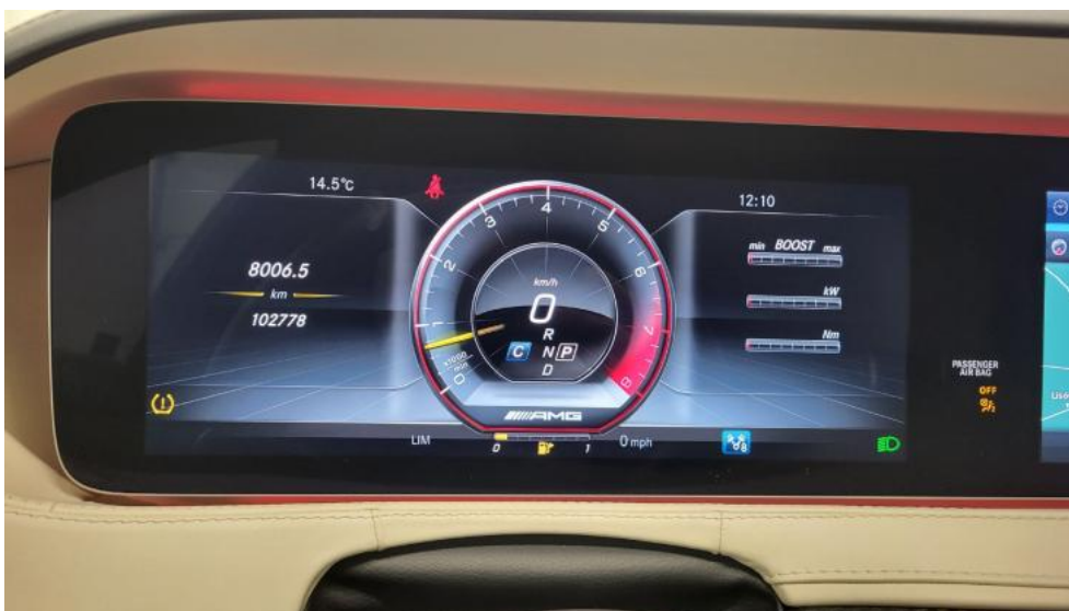
Photo 24. Zestaw wskaźników - przebieg