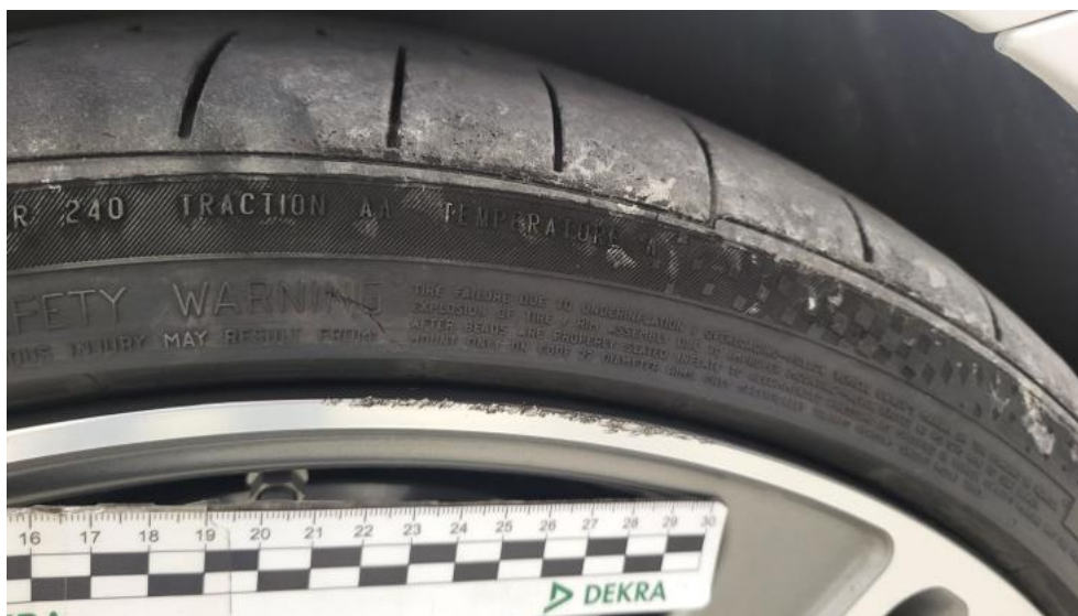
Photo 65. Felga aluminiowa przednia P - Rysa/odprysk 1