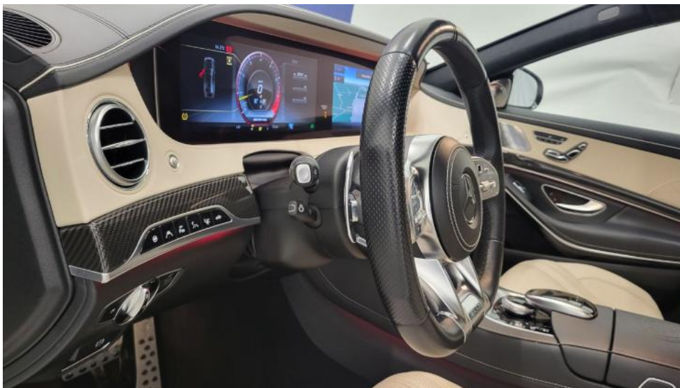
Photo 27. Kierownica z lewej strony