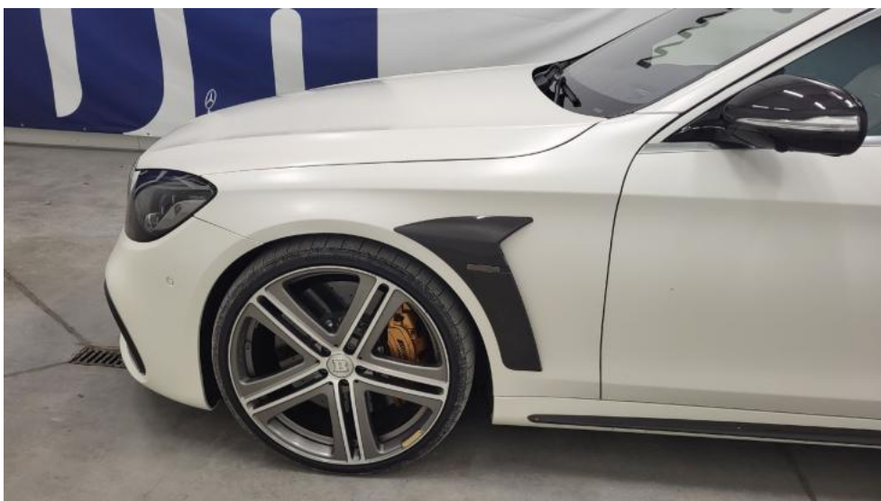
Photo 10. Bok lewy z przodu