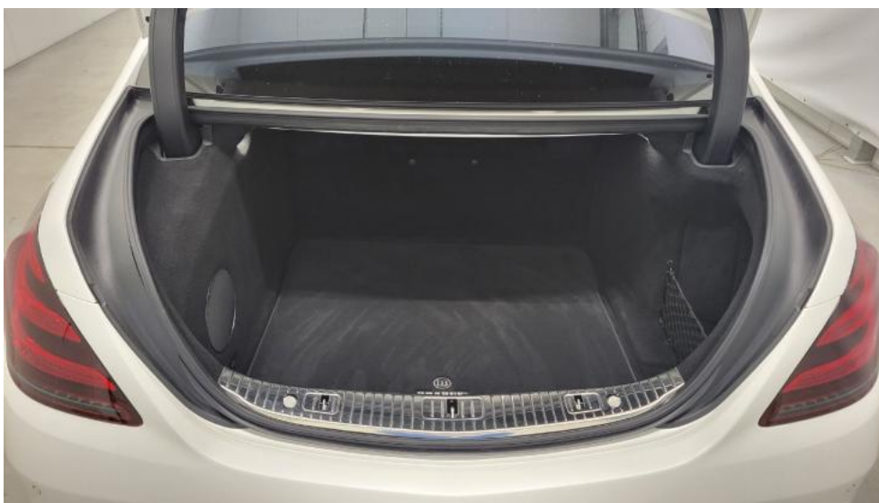
Photo 19. Bagażnik