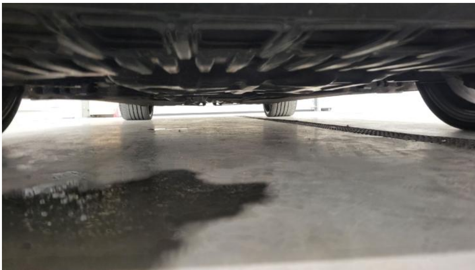
Photo 13. Spód pojazdu przód