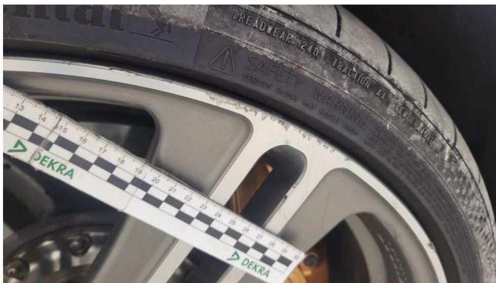
Photo 71. Felga Aluminiowa przednia L - Rysa/odprysk 1