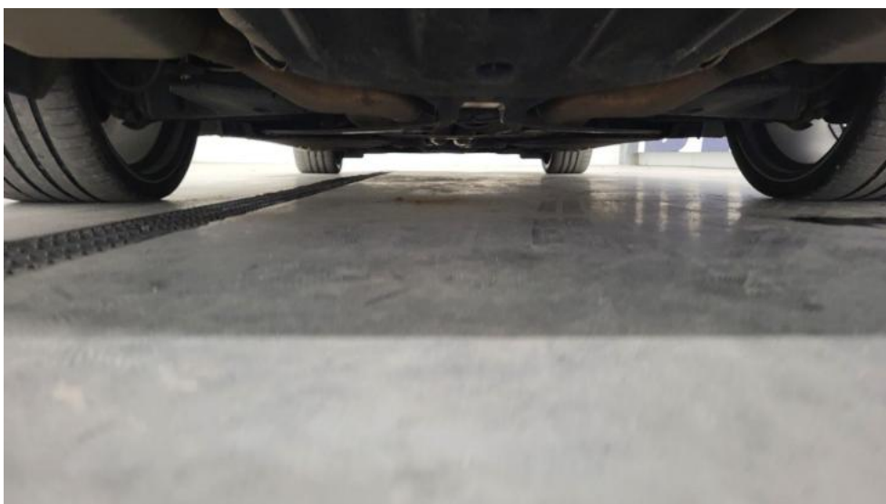
Photo 14. Spód pojazdu tył