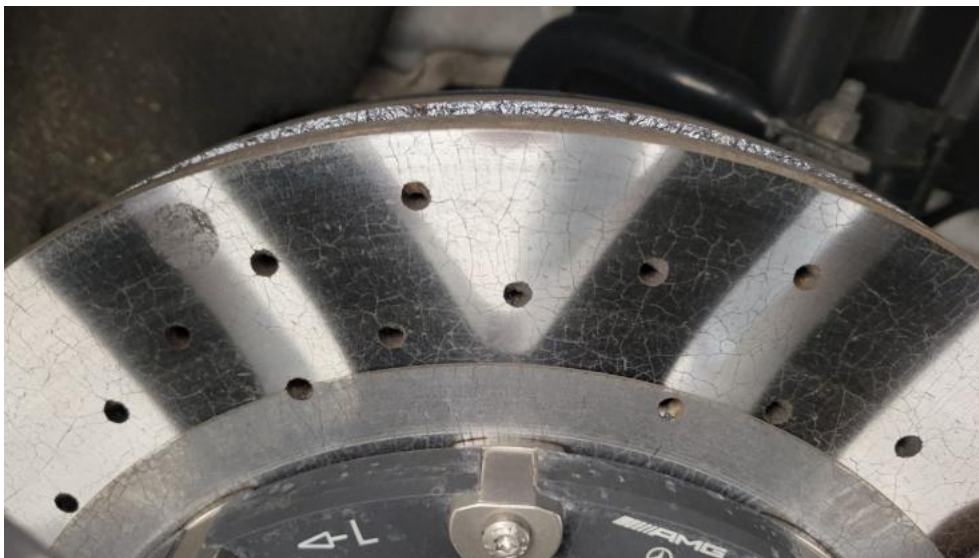
Photo 17. Tarcza hamulcowa tylna lewa