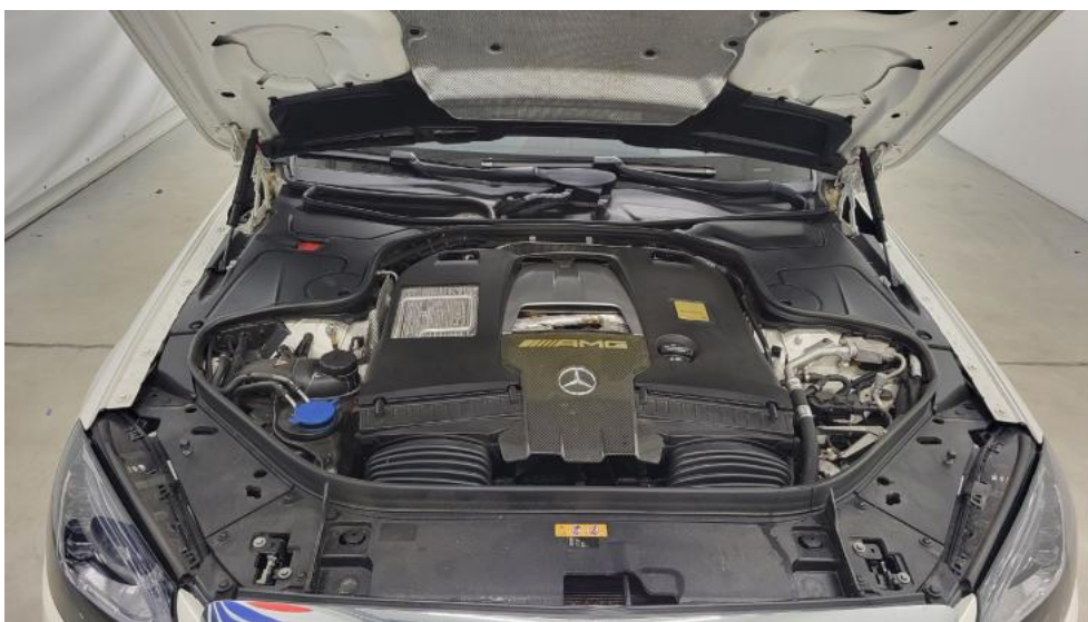
Photo 21. Komora silnika