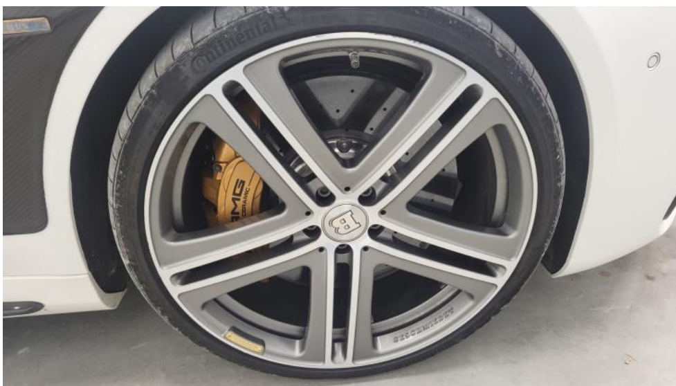
Photo 64. Felga aluminiowa przednia P - zdjęcie poglądowe 1