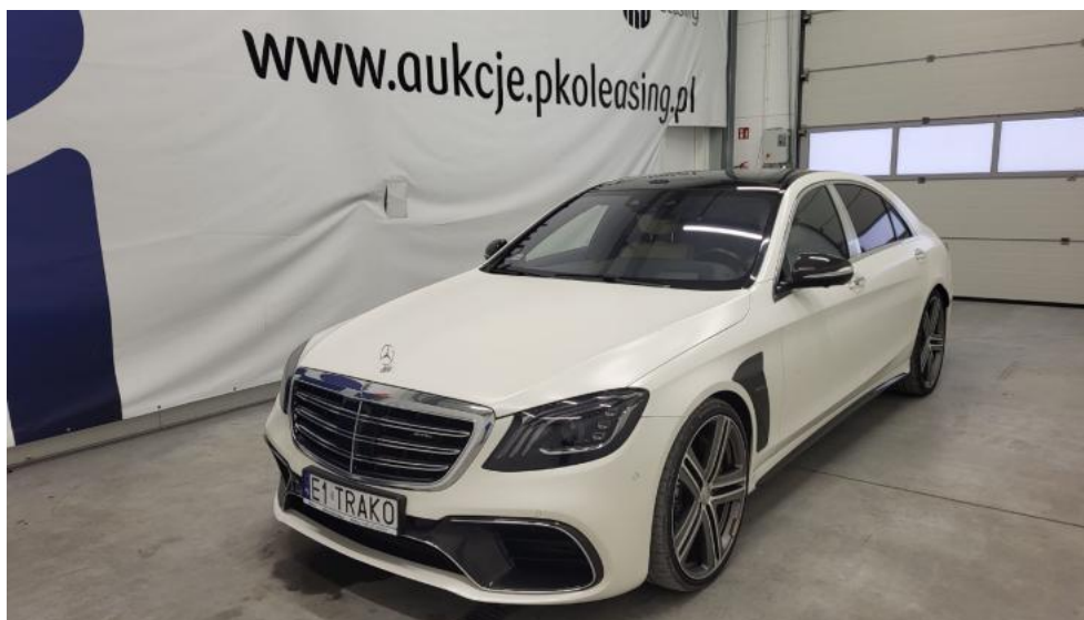
Photo 1. Przekątna przednia lewa