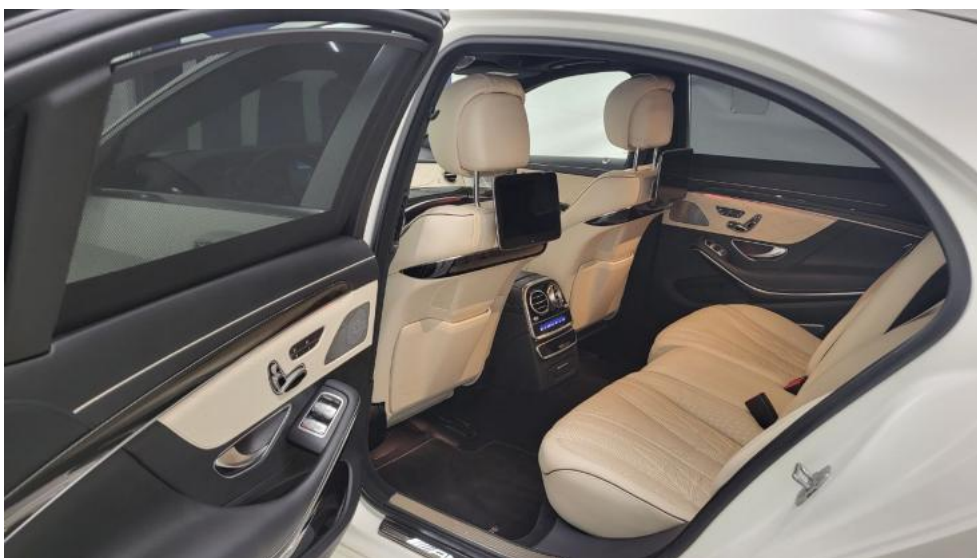
Photo 28. Widok przez otwarte drzwi tylne lewe