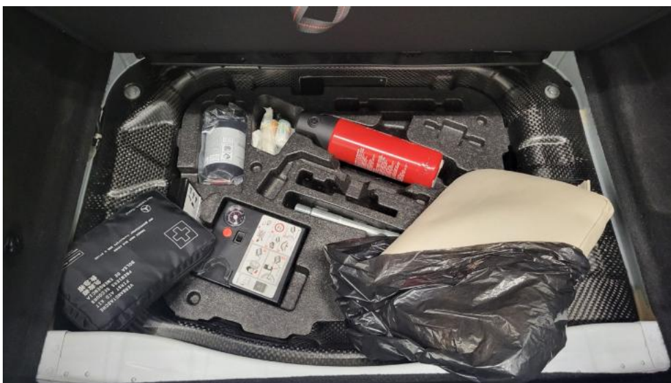
Photo 20. Koło zapasowe