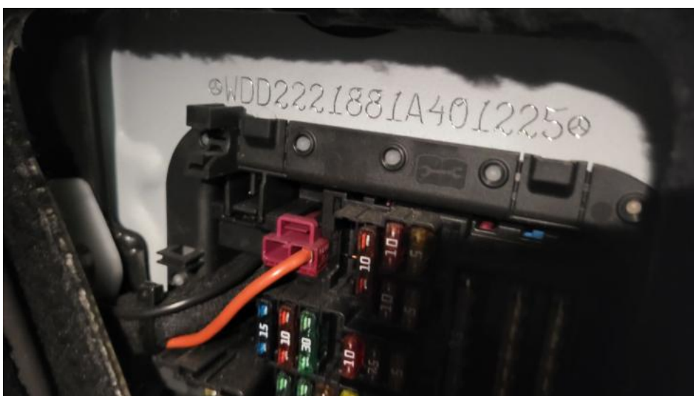
Photo 22. Numer identyfikacyjny