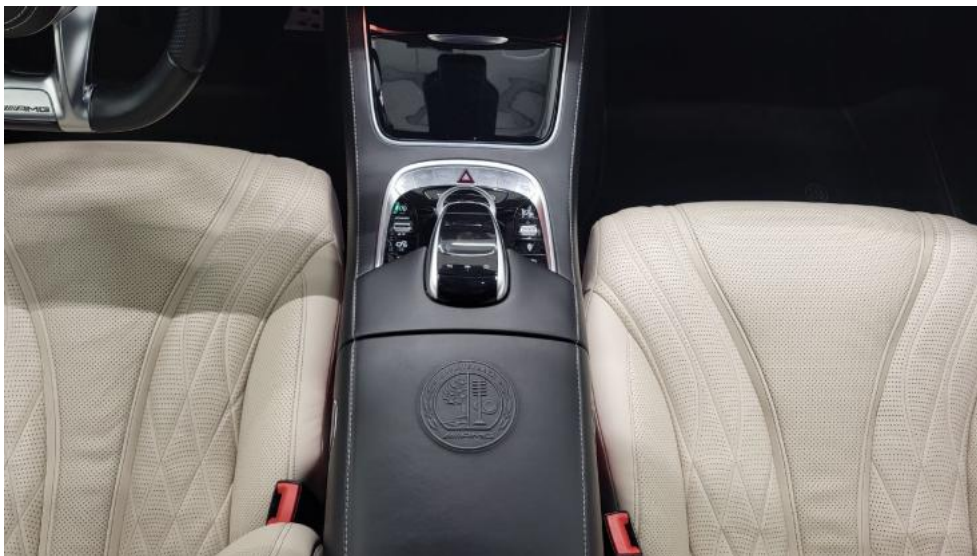
Photo 31. Tunel środkowy