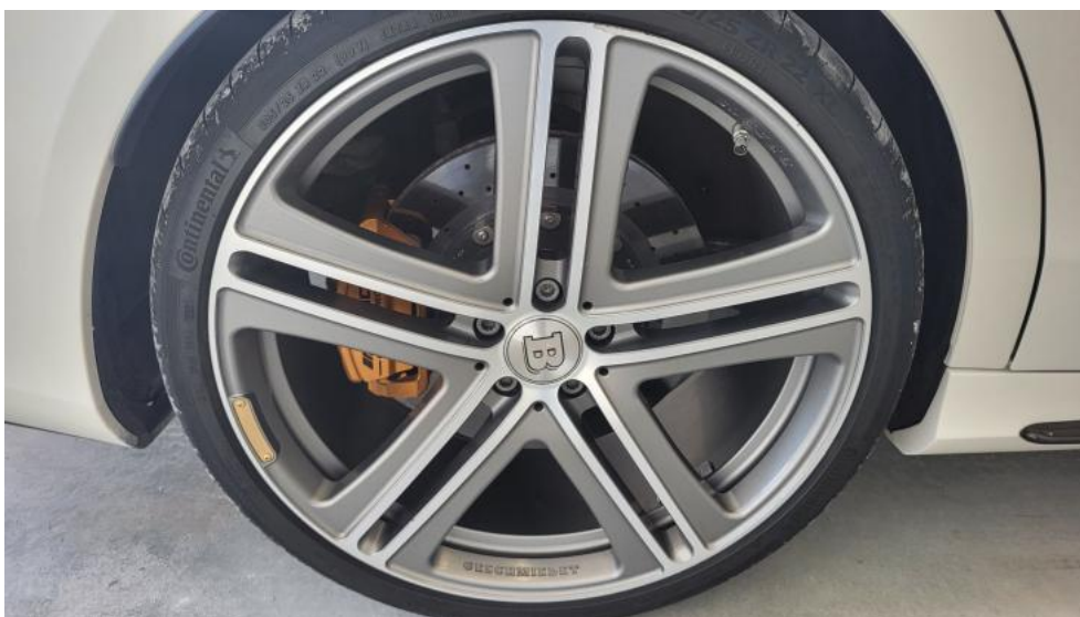
Photo 68. Felga aluminiowa tylna P - zdjęcie poglądowe 1