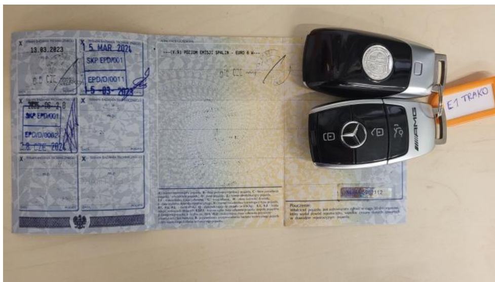
Photo 34. Dow. Rej. Str.2 i Klucze