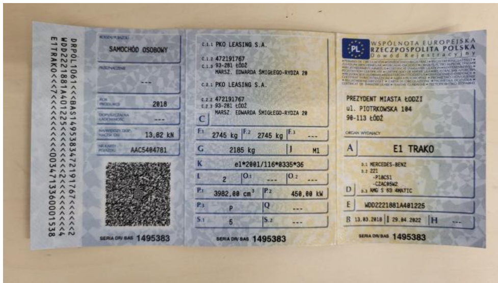
Photo 33. Dowód rej. Str. 1