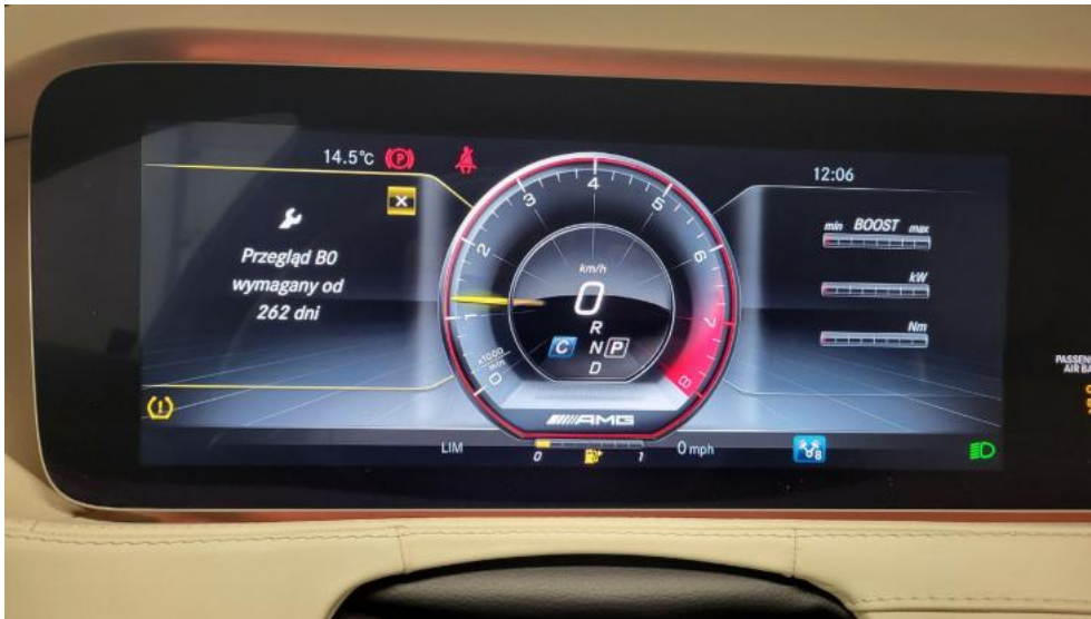
Photo 25. Zestaw wskaźników - serwis