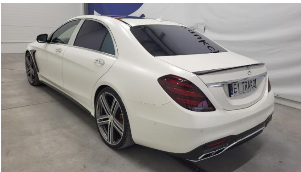
Photo 8. Przekątna tylna lewa