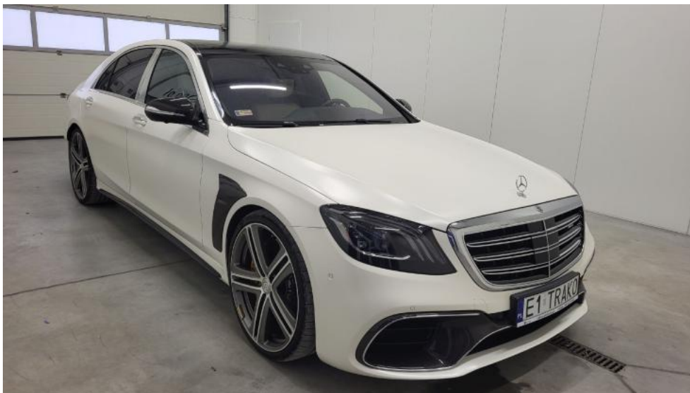
Photo 3. Przekątna przednia prawa