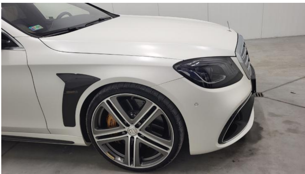
Photo 4. Bok prawy z przodu