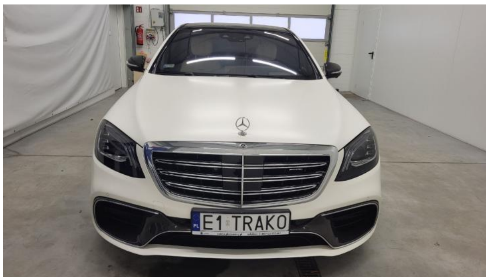
Photo 2. Przód