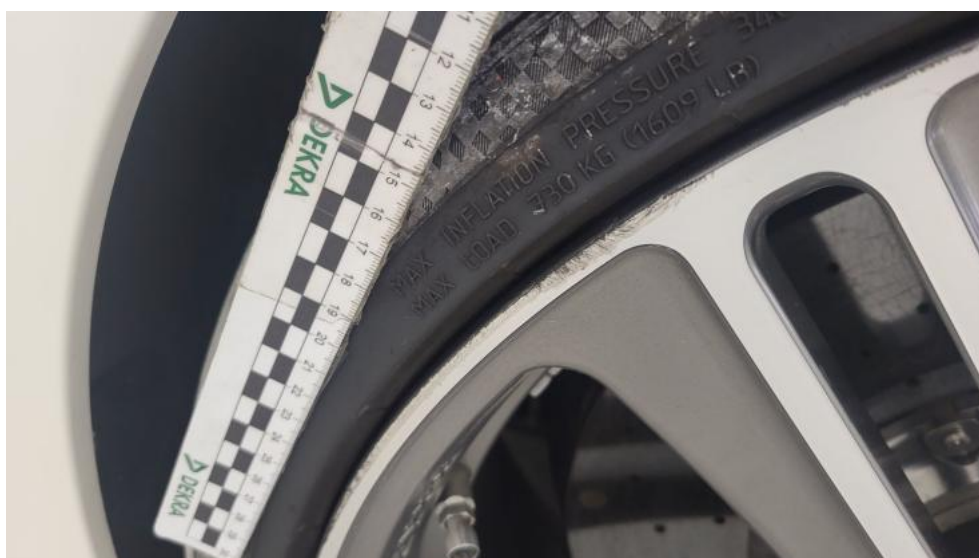
Photo 72. Felga Aluminiowa przednia L - Rysa/odprysk 2