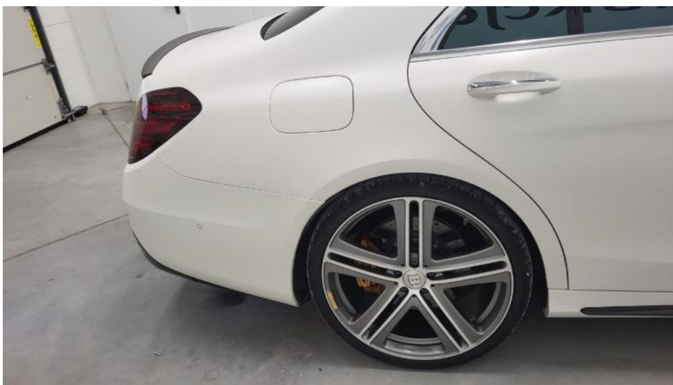
Photo 5. Bok prawy z tyłu