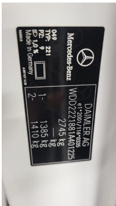
Photo 23. Tabliczka znamionowa