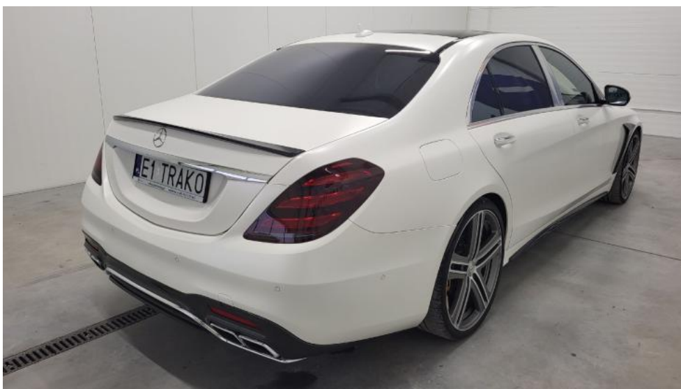
Photo 6. Przekątna tylna prawa