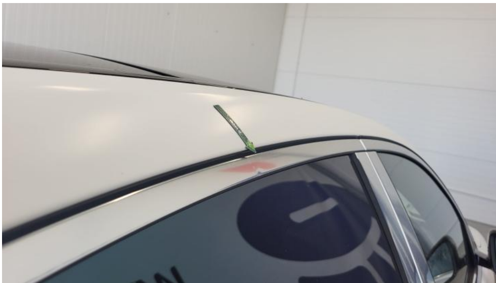
Photo 67. Drzwi tylne P - Wgniecenie/odkształcenie 1