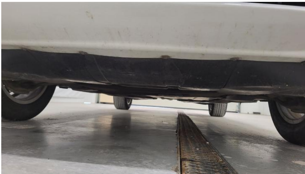
Photo 13. Spód pojazdu przód