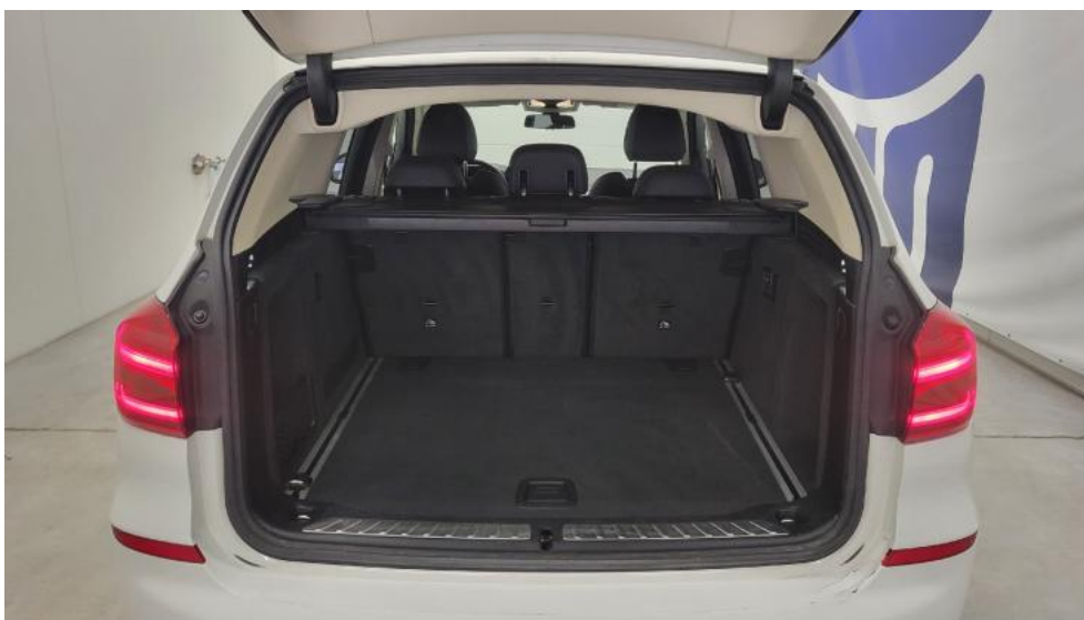
Photo 19. Bagażnik