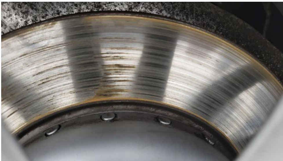
Photo 17. Tarcza hamulcowa tylna lewa