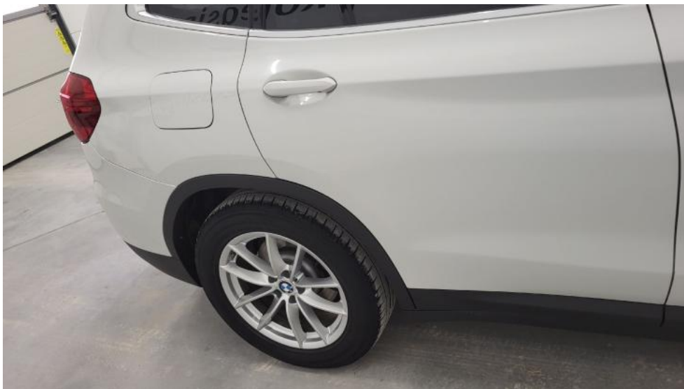
Photo 5. Bok prawy z tyłu