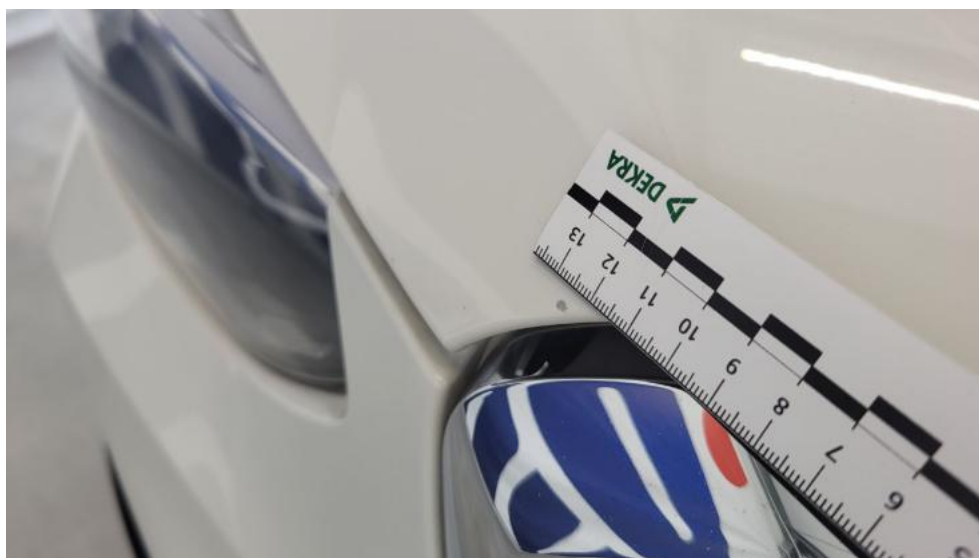
Photo 40. Pokrywa komory silnika - Rysa/odprysk 1