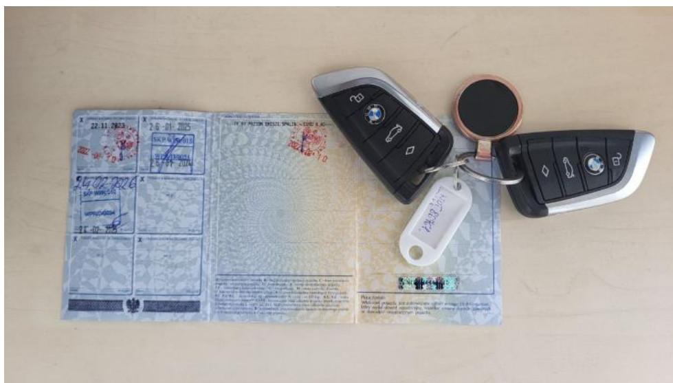
Photo 33. Dow. Rej. Str.2 i klucze