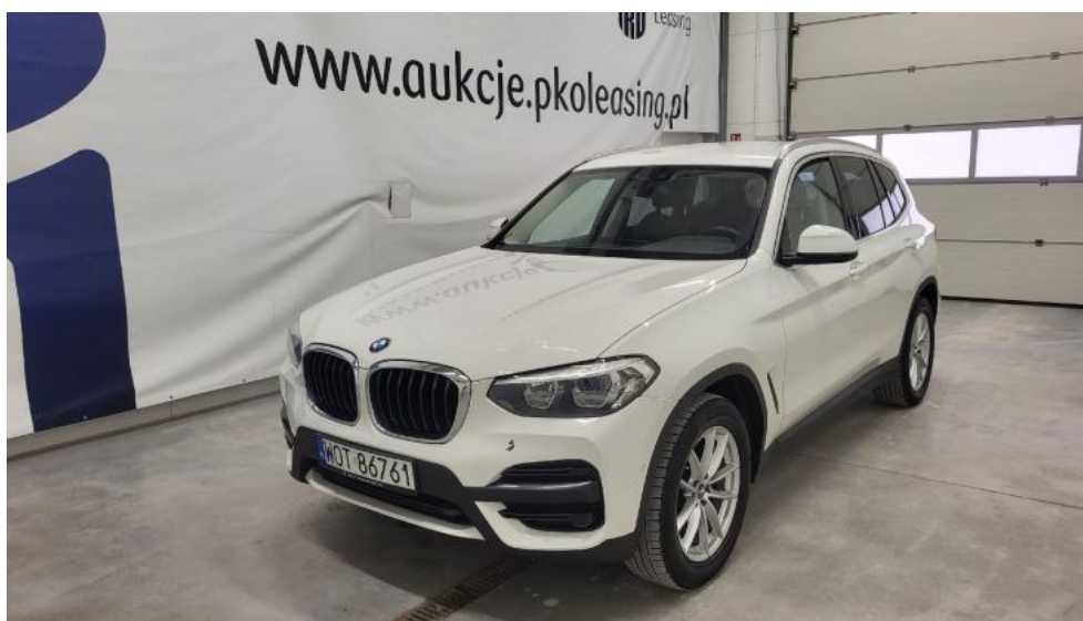
Photo 1. Przekątna przednia lewa