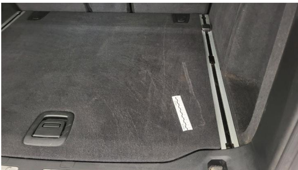
Photo 76. Wykładzina podłogi bagażnika - Inne 1