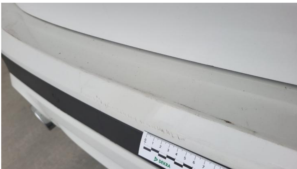
Photo 54. Zderzak tylny - Rysa/odprysk 1