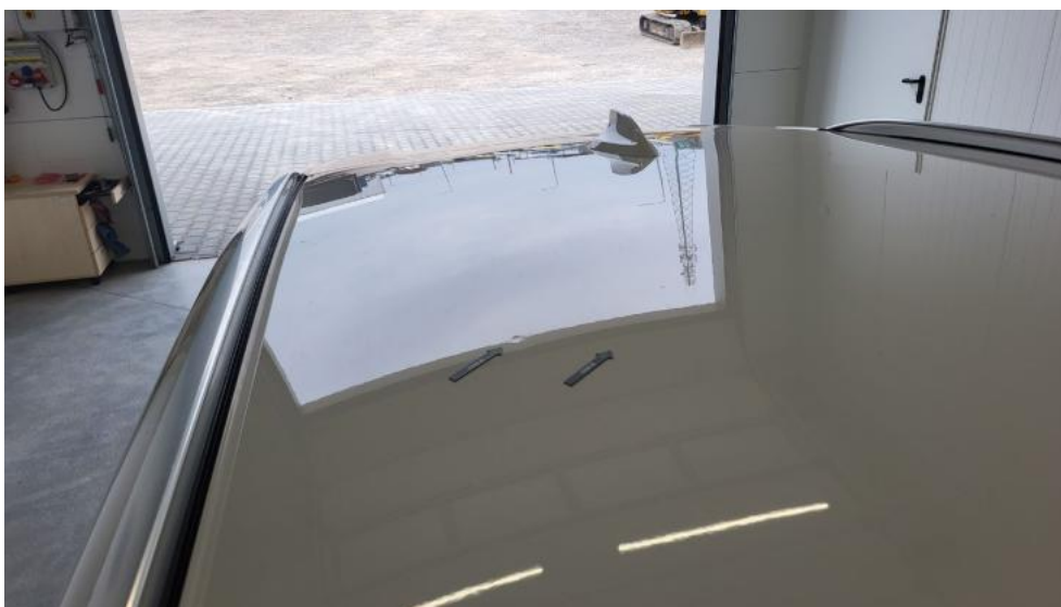
Photo 57. Dach - Wgniecenie/odkształcenie 1