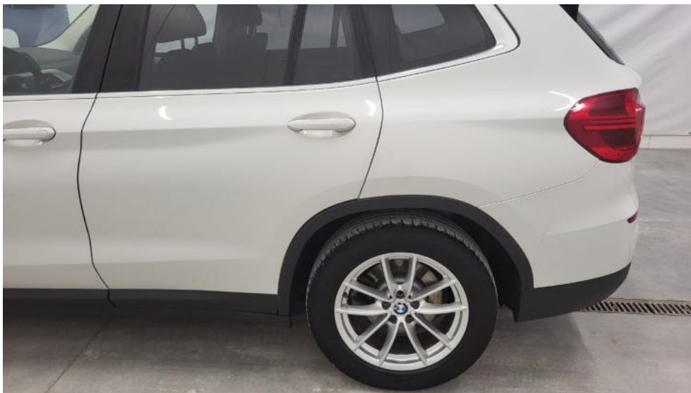
Photo 9. Bok lewy z tyłu