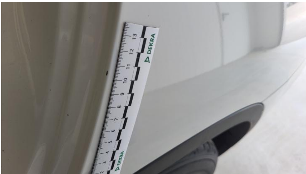
Photo 59. Błotnik tylny L / Ściana boczna L - Rysa/odprysk 1