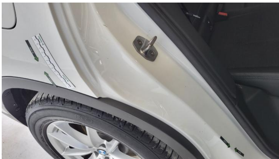
Photo 46. Błotnik tylny P / Ściana boczna P - Wgniecenie/odkształcenie 1