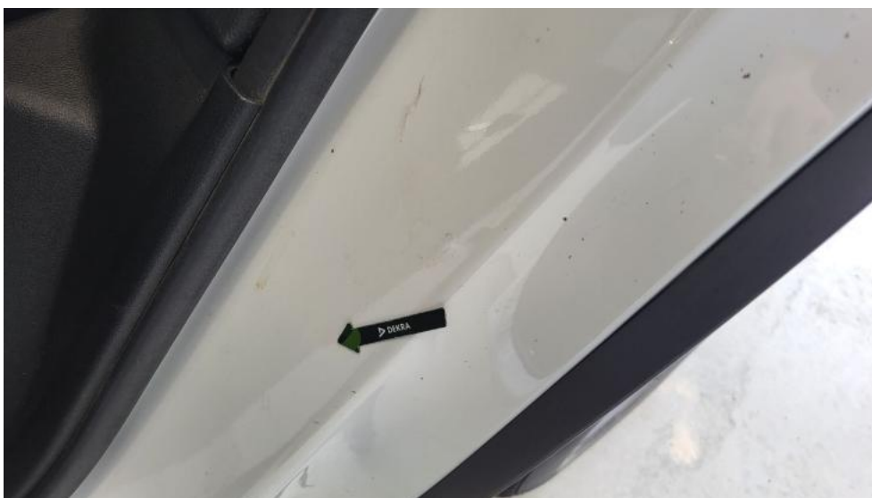
Photo 60. Błotnik tylny L / Ściana boczna L - Wgniecenie/odkształcenie 1