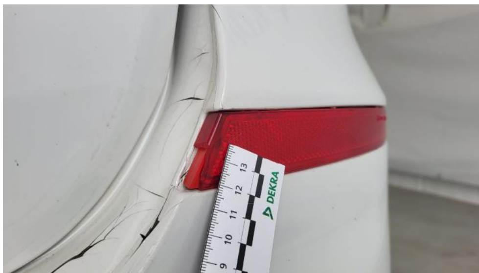
Photo 48. Lampa przeciwmgielna tylna P - Pęknięcie/rozerwanie 1