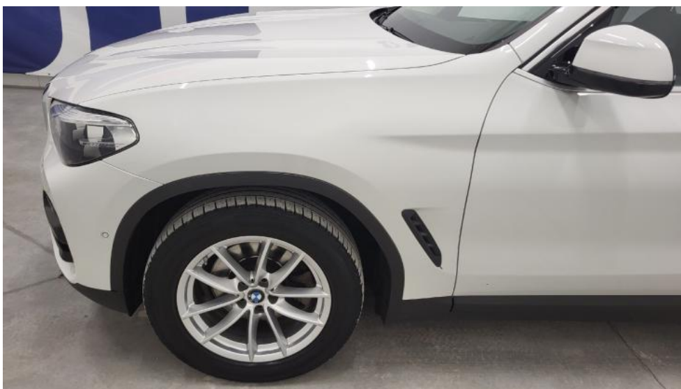
Photo 10. Bok lewy z przodu