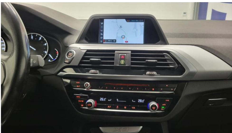
Photo 29. Konsola środkowa