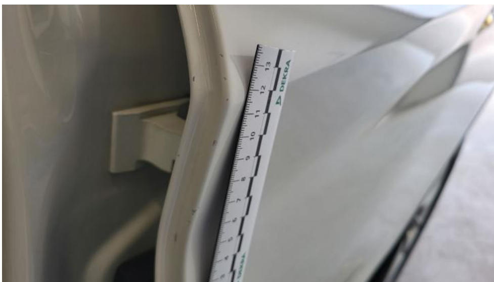
Photo 64. Drzwi tylne L - Rysa/odprysk 1