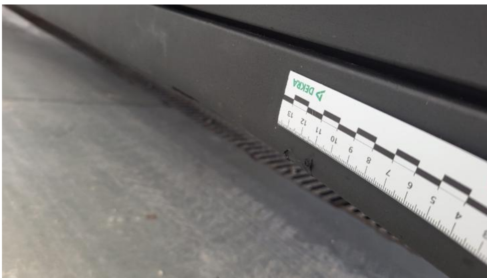
Photo 66. Próg L - Rysa/odprysk 2