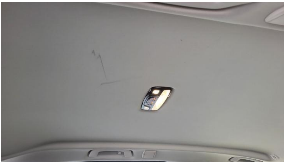
Photo 75. Podsufitka - Inne 2