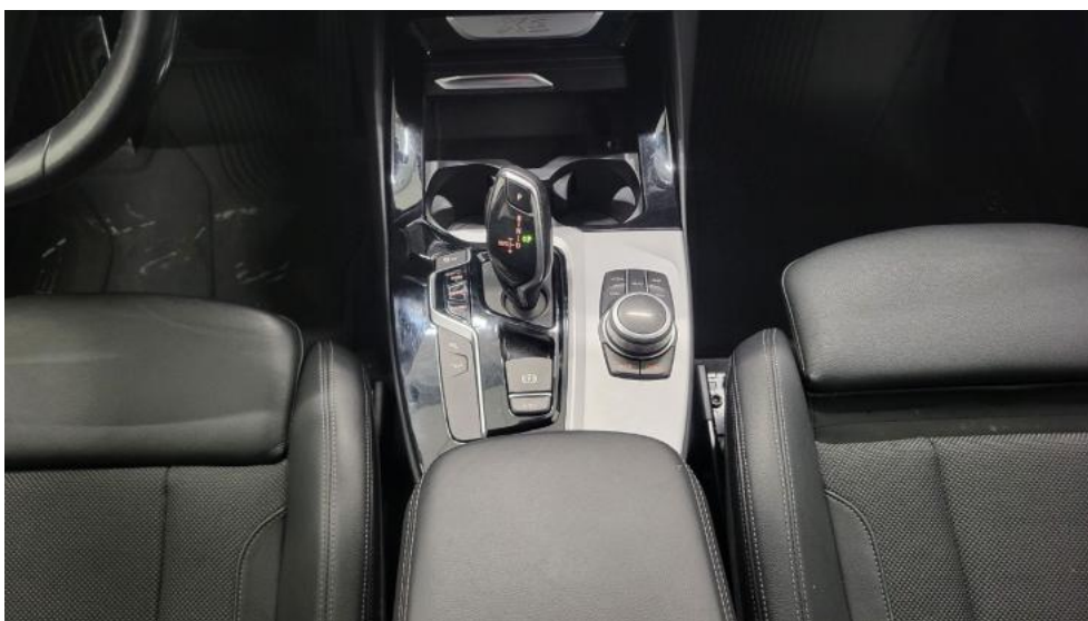
Photo 30. Tunel środkowy