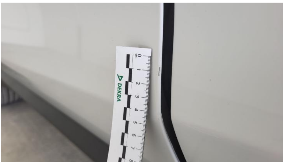
Photo 62. Drzwi przed L - Rysa/odprysk 1