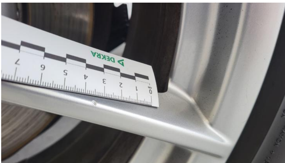
Photo 61. Felga aluminiowa tylna L - Rysa/odprysk 1