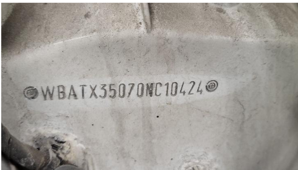
Photo 22. Numer identyfikacyjny