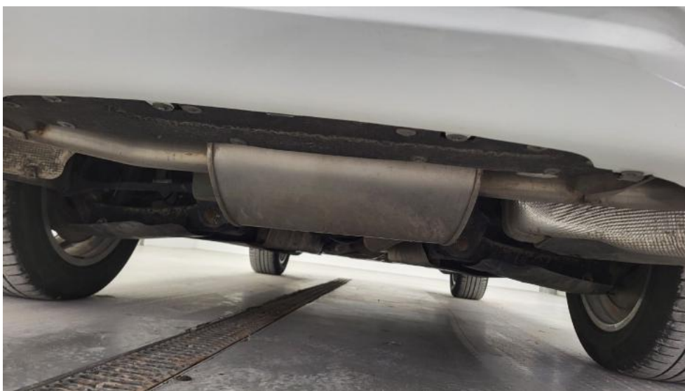
Photo 14. Spód pojazdu tył