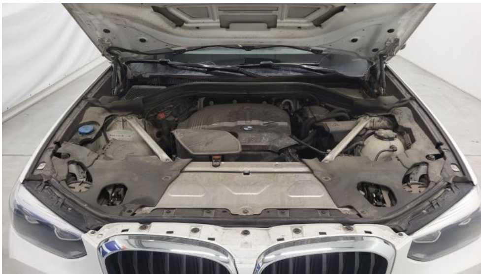
Photo 21. Komora silnika