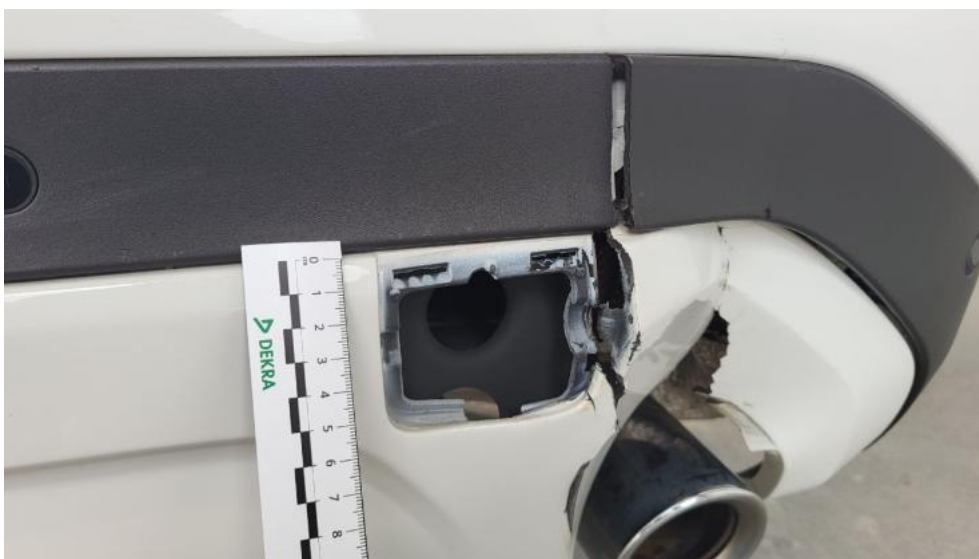
Photo 53. Zaślepka tyl haka hol. - Inne 1