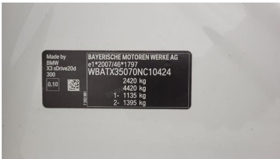
Photo 23. Tabliczka znamionowa