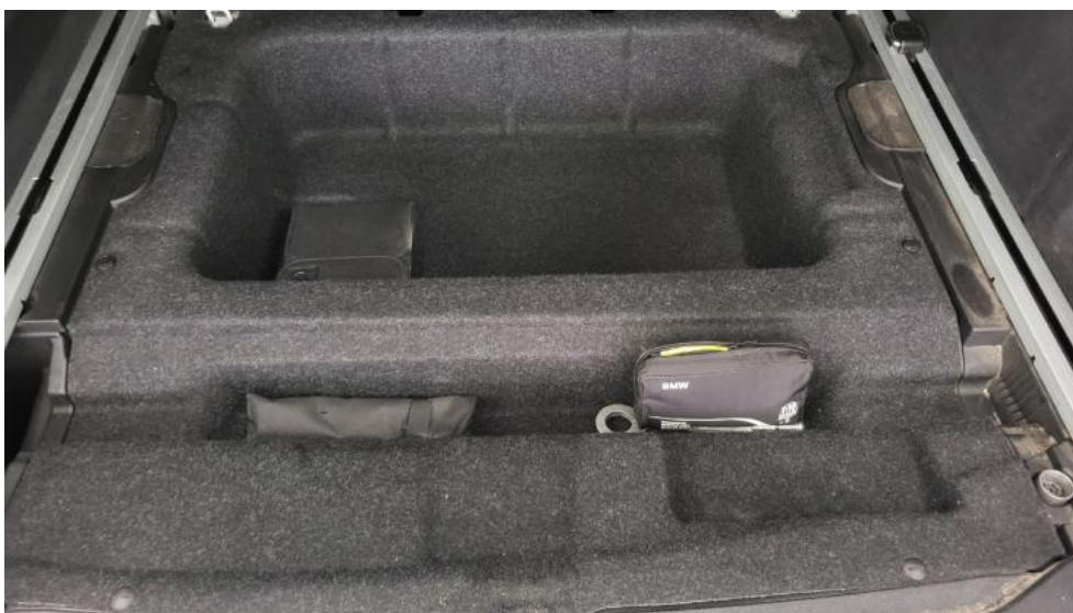
Photo 20. Koło zapasowe