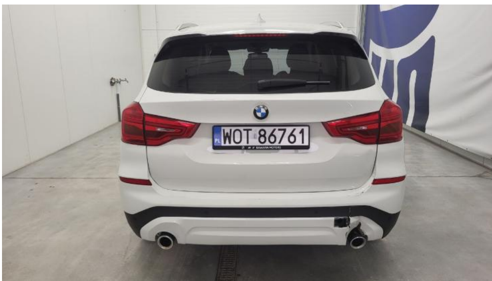
Photo 7. Tyl