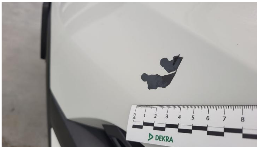
Photo 41. Zderzak - Rysa/odprysk 1