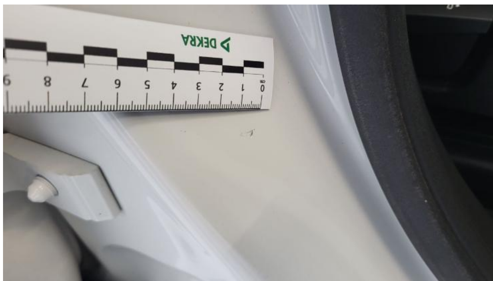
Photo 45. Słupek środkowy P - Rysa/odprysk 1