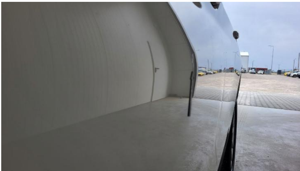
Photo 63. Drzwi przed L - Wgniecenie/odkształcenie 1