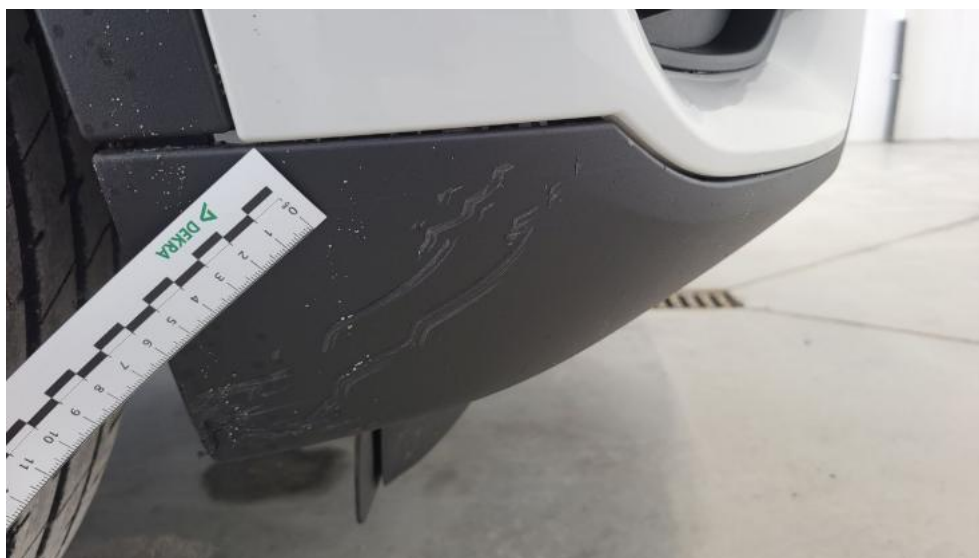
Photo 42. Zderzak przedni cz dolna - Rysa/odprysk 1