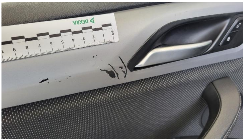
Photo 69. Tapicerka drzwi przednich L - Rysa/odprysk 1