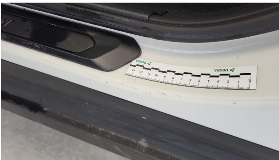
Photo 65. Próg L - Rysa/odprysk 1