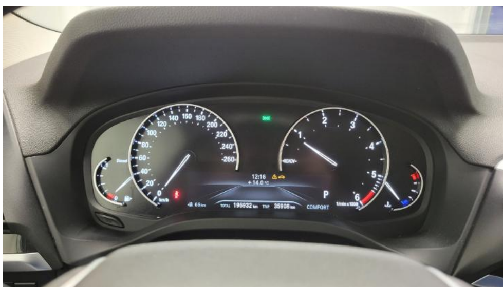
Photo 24. Zestaw wskaźników - przebieg