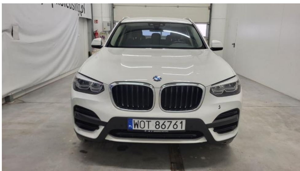
Photo 2. Przód