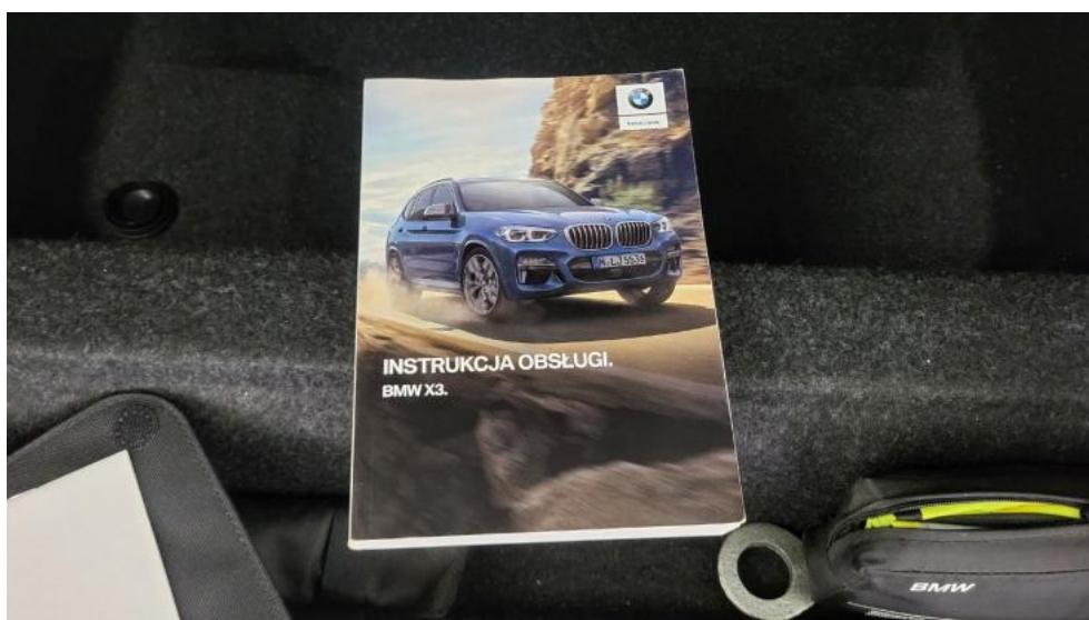
Photo 36. Instrukcje