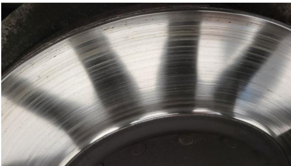
Photo 18. Tarcza hamulcowa przednia lewa