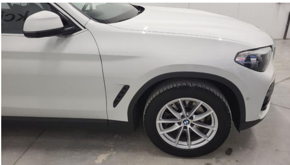
Photo 4. Bok prawy z przodu