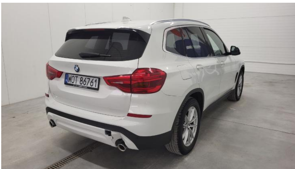
Photo 6. Przekątna tylna prawa