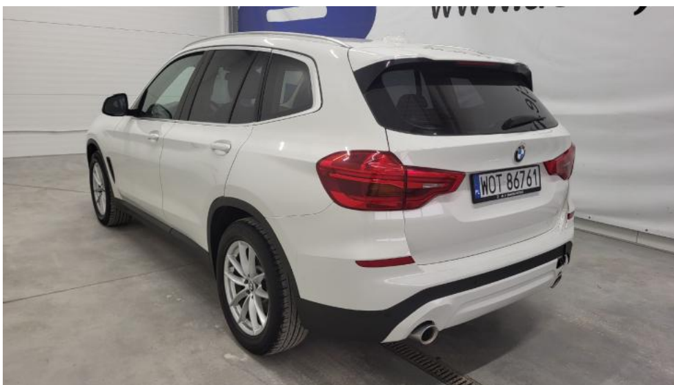
Photo 8. Przekątna tylna lewa