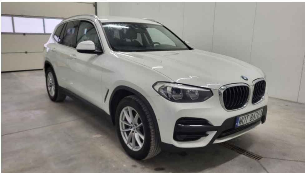
Photo 3. Przekątna przednia prawa