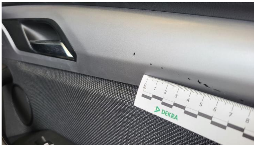
Photo 70. Tapicerka drzwi tylnych P - Rysa/odprysk 1