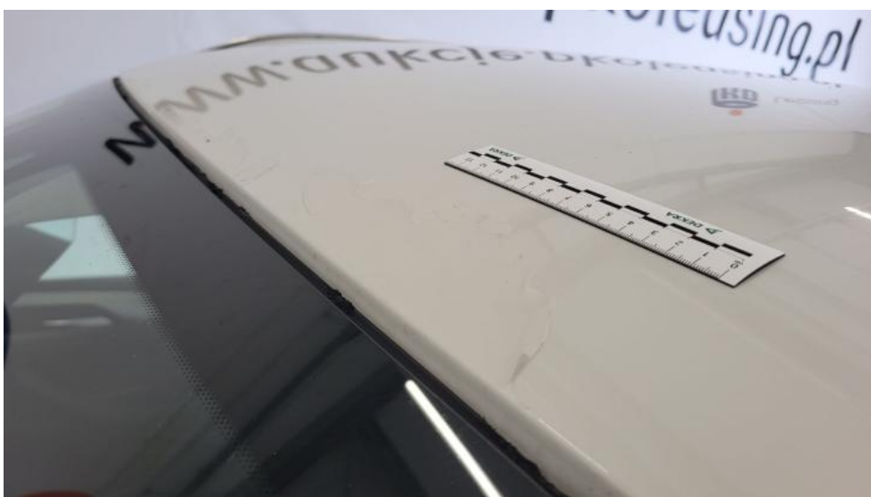
Photo 58. Dach - Inne 1