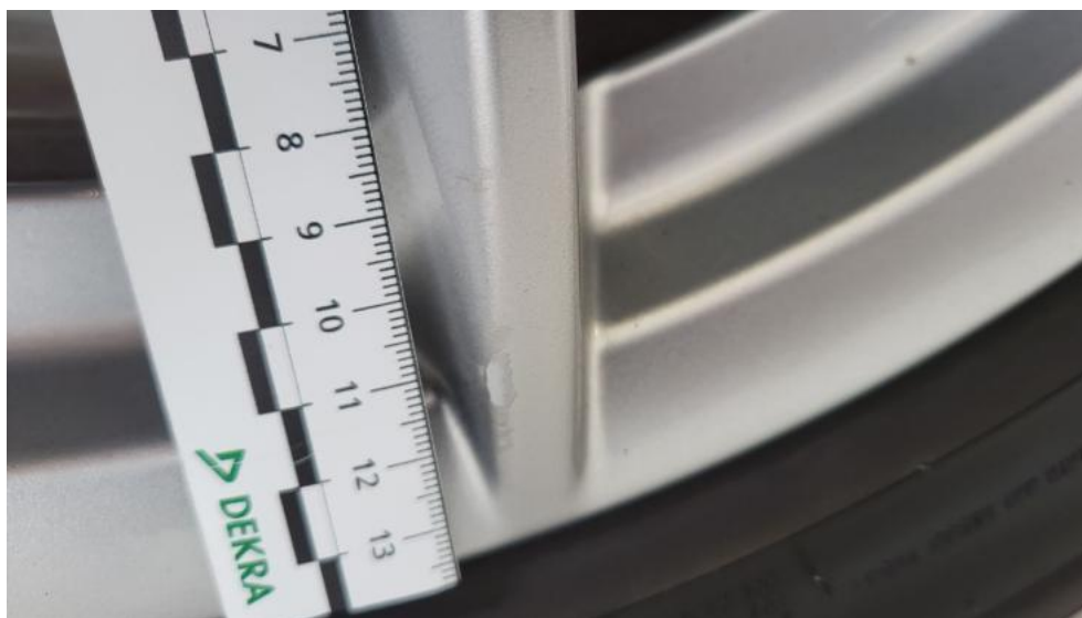
Photo 47. Felga aluminiowa tylna P - Rysa/odprysk 1