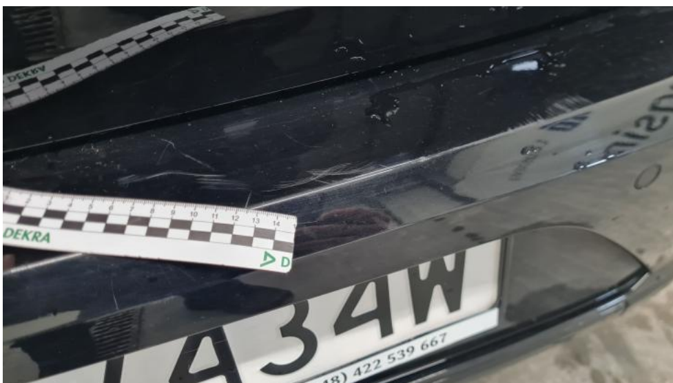
Photo 46. Zderzak tylny - Rysa/odprysk 1