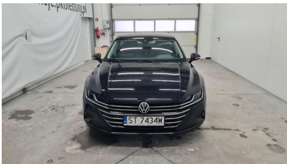
Photo 2. Przód