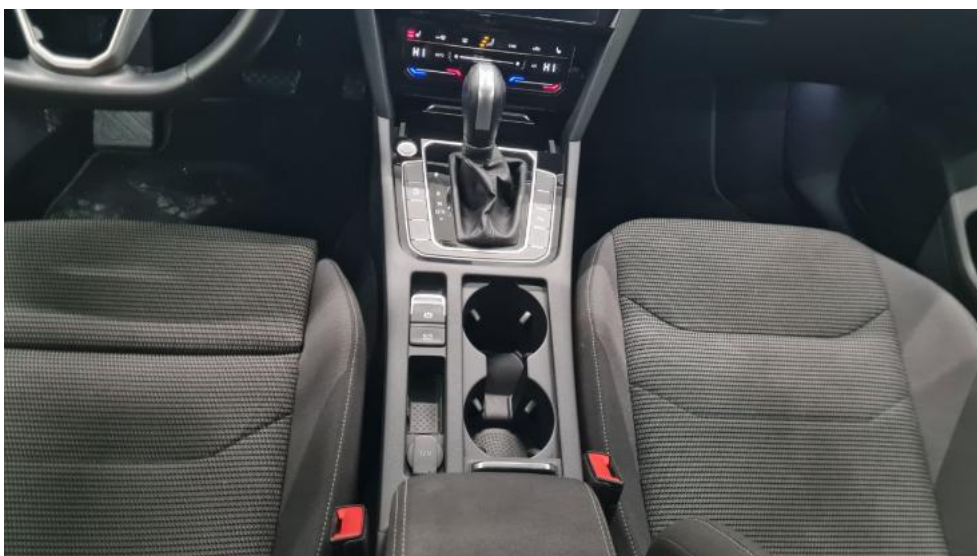
Photo 86. Tunel środkowy