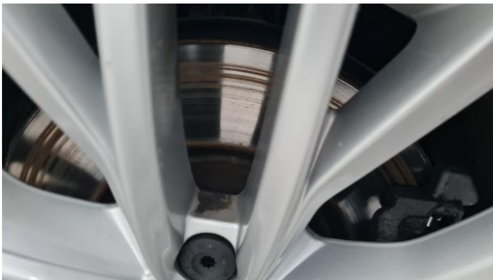
Photo 15. Tarcza hamulcowa przednia prawa