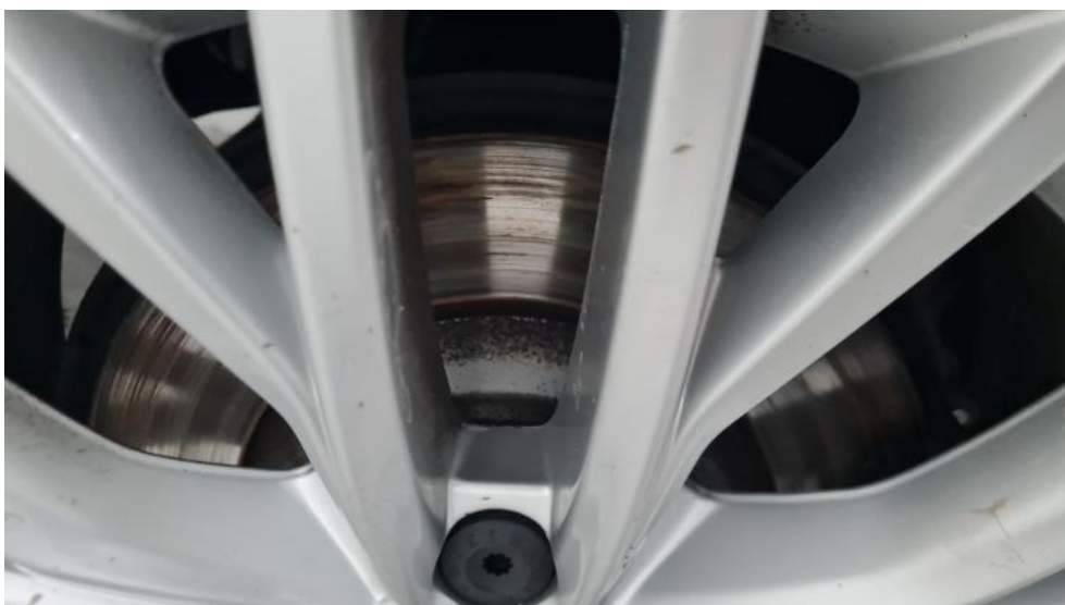
Photo 72. Tarcza hamulcowa tylna prawa