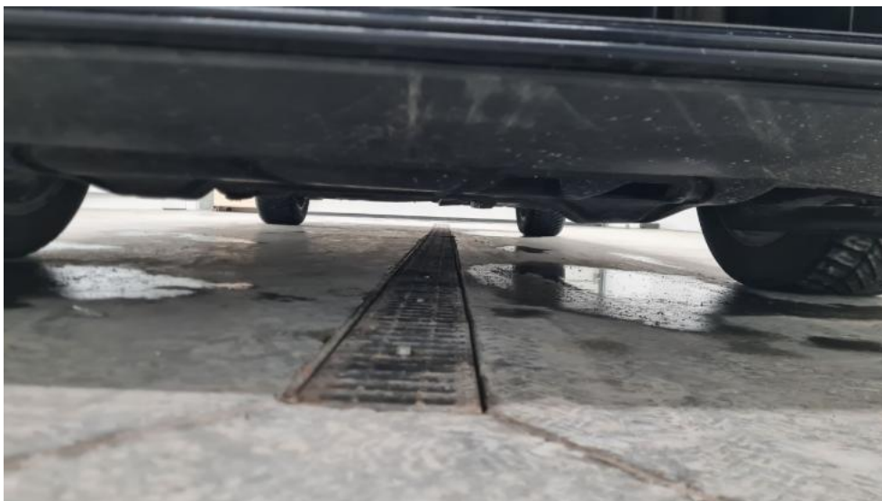
Photo 69. Spód pojazdu przód