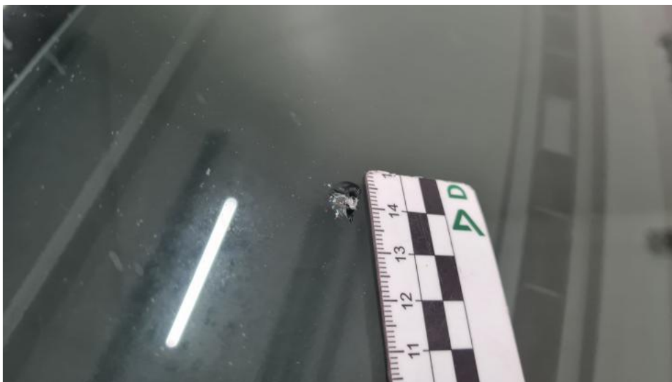
Photo 39. Szyba czołowa - Pęknięcie/rozerwanie 1