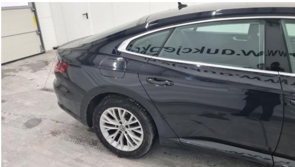
Photo 5. Bok prawy z tyłu