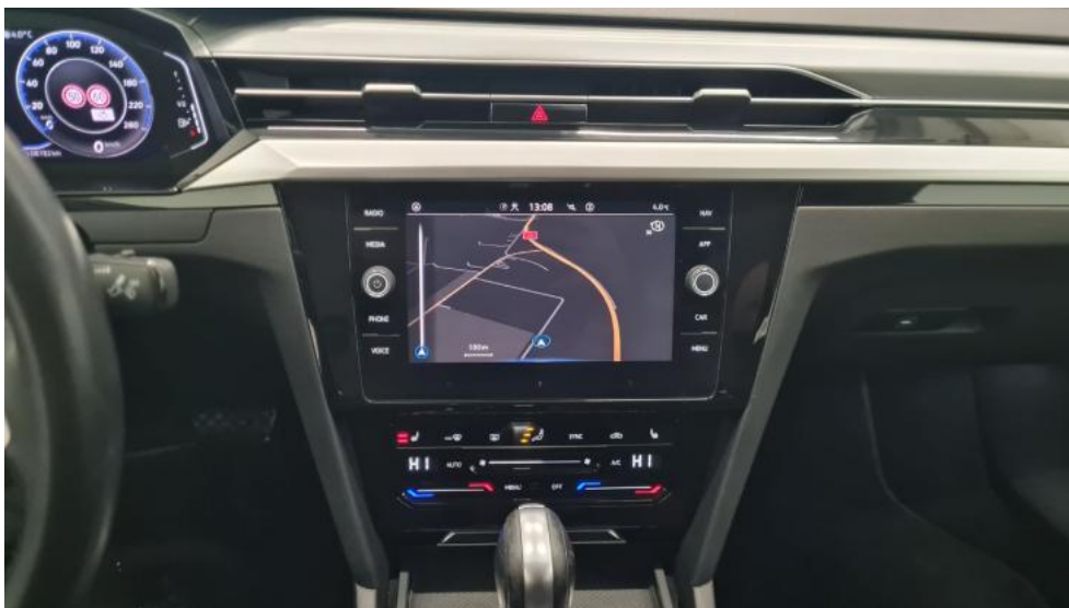
Photo 85. Konsola środkowa