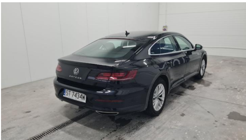
Photo 62. Przekątna tylna prawa