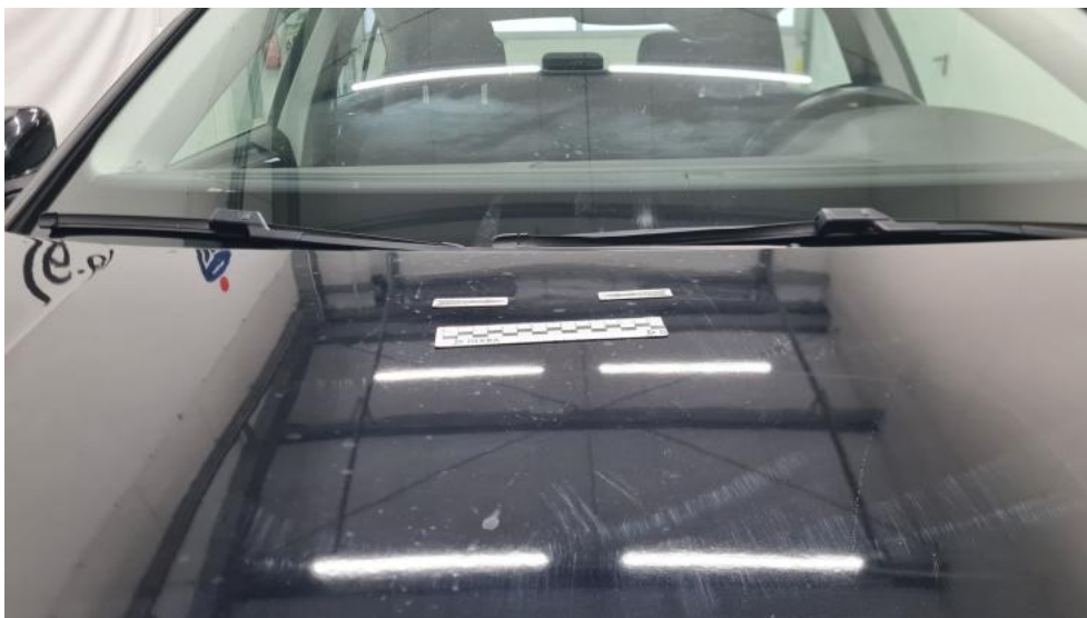
Photo 93. Pokrywa komory silnika - Wgniecenie/odkształcenie 1