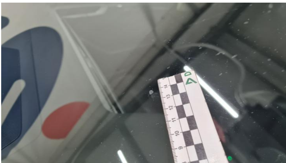
Photo 40. Szyba czołowa - Pęknięcie/rozerwanie 2