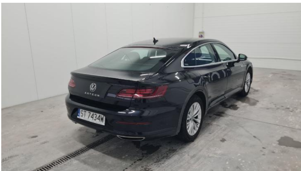
Photo 6. Przekątna tylna prawa