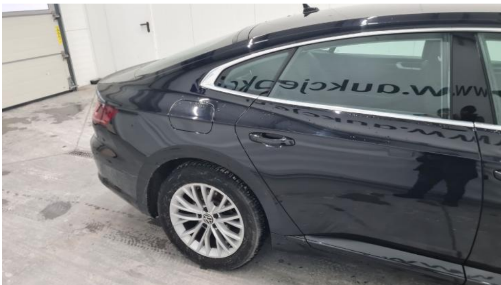
Photo 61. Bok prawy z tyłu