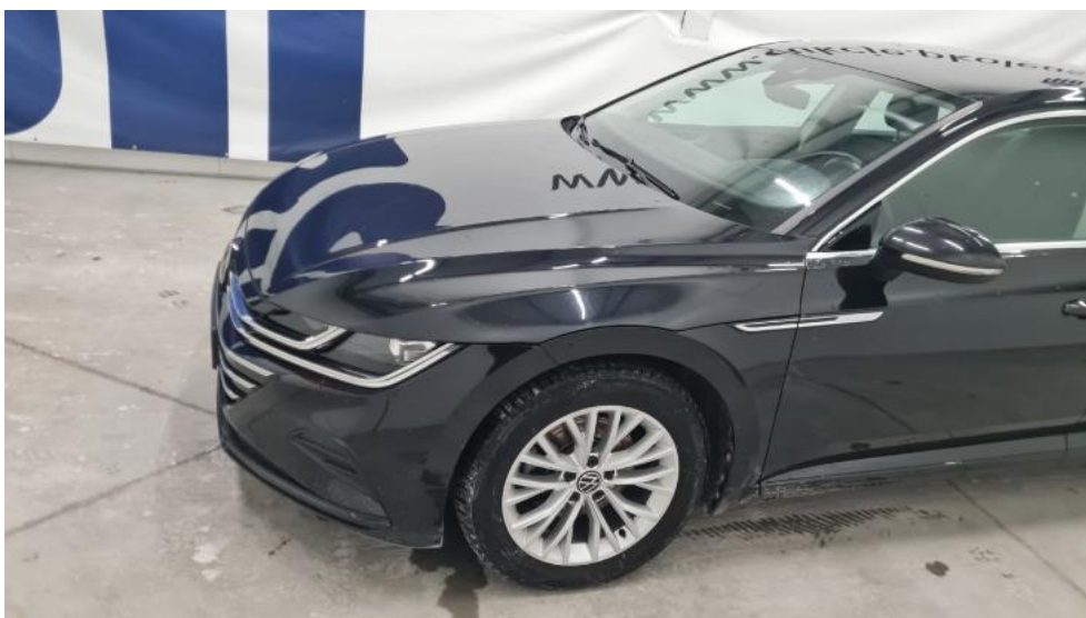
Photo 10. Bok lewy z przodu