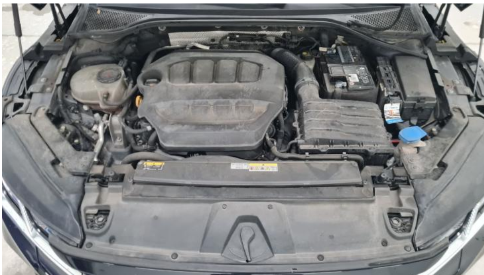
Photo 77. Komora silnika