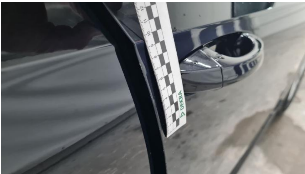
Photo 43. Drzwi przednie P - Rysa/odprysk 1