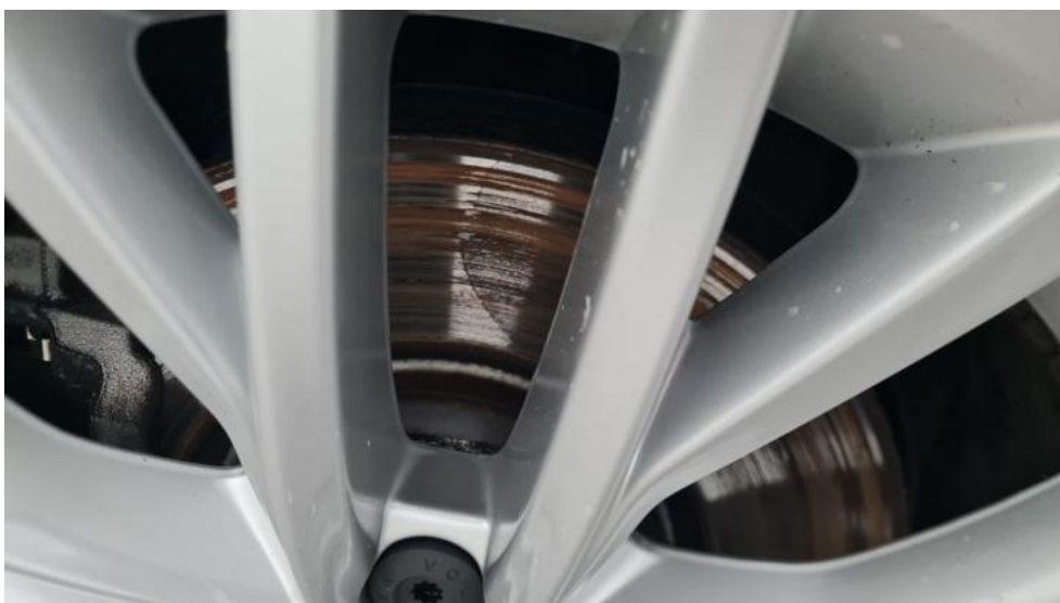
Photo 74. Tarcza hamulcowa przednia lewa