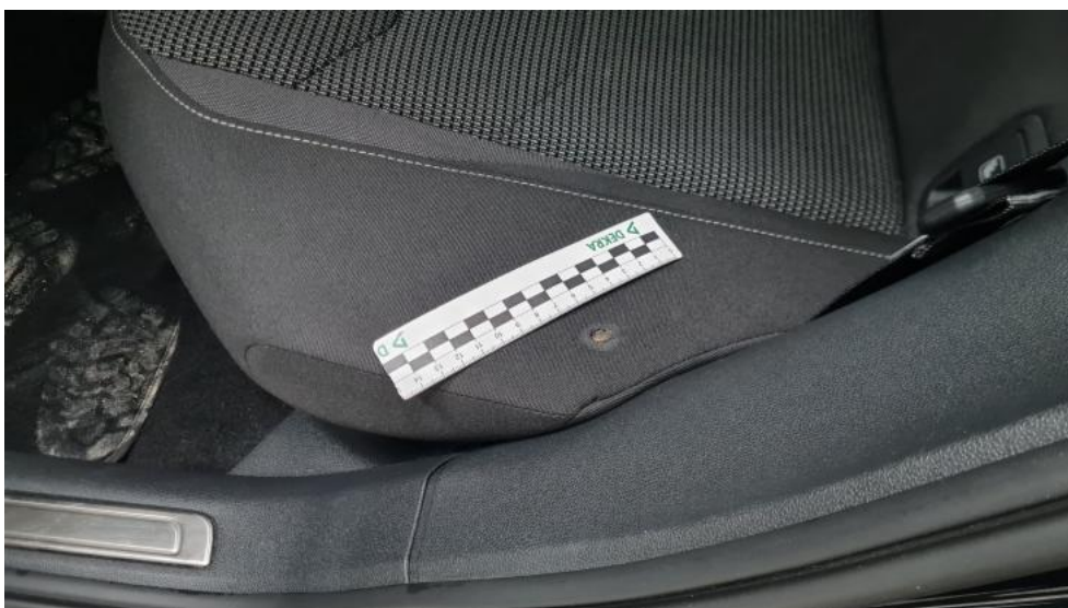
Photo 108. Kanapa tyl. - Inne 1