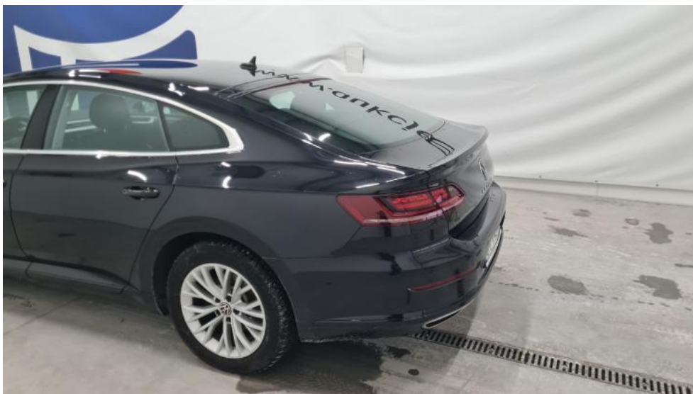
Photo 65. Bok lewy z tyłu