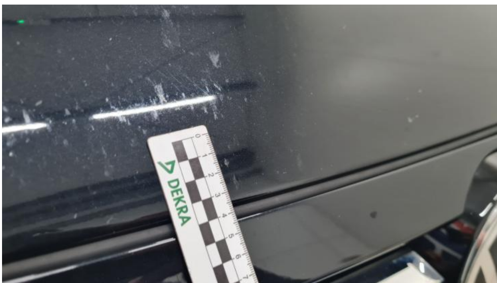
Photo 36. Pokrywa komory silnika - Rysa/odprysk 1