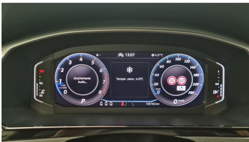
Photo 80. Zestaw wskaźników - przebieg