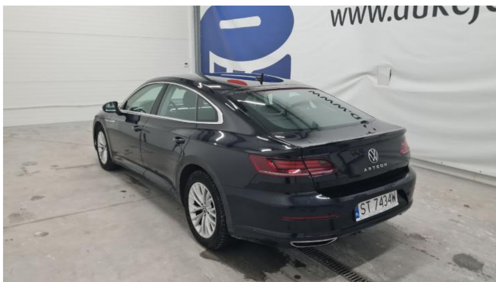
Photo 64. Przekątna tylna lewa