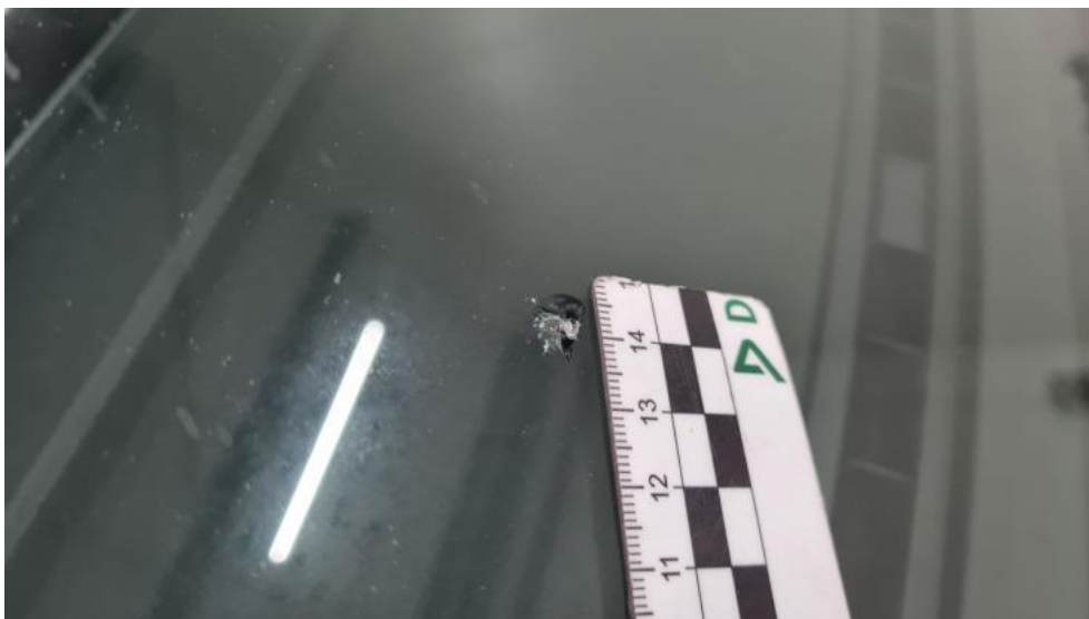
Photo 95. Szyba czołowa - Pęknięcie/rozerwanie 1