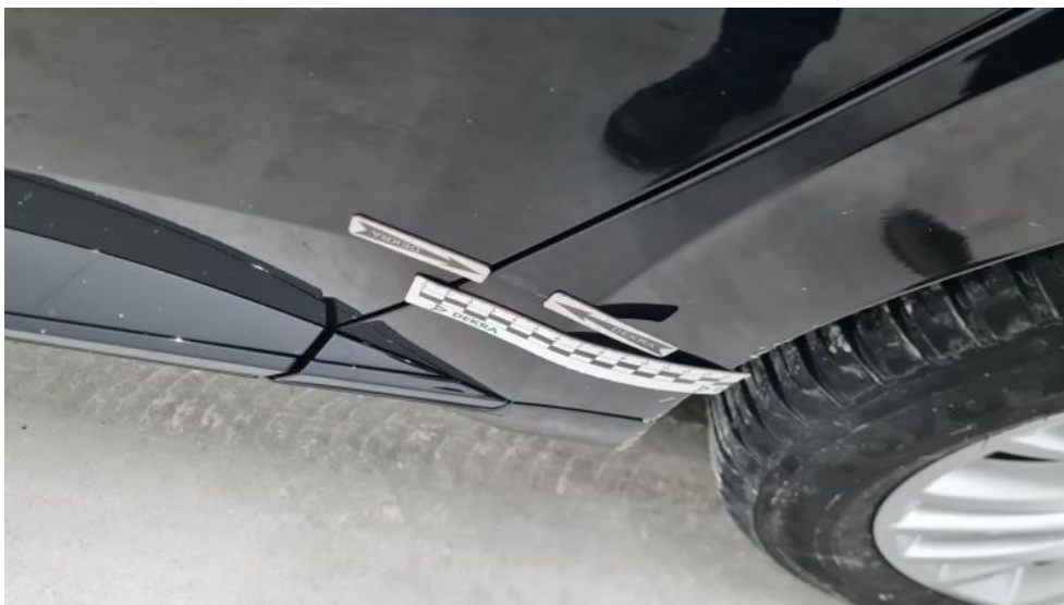
Photo 103. Błotnik tylny L / Ściana boczna L - Wgniecenie/odkształcenie 1