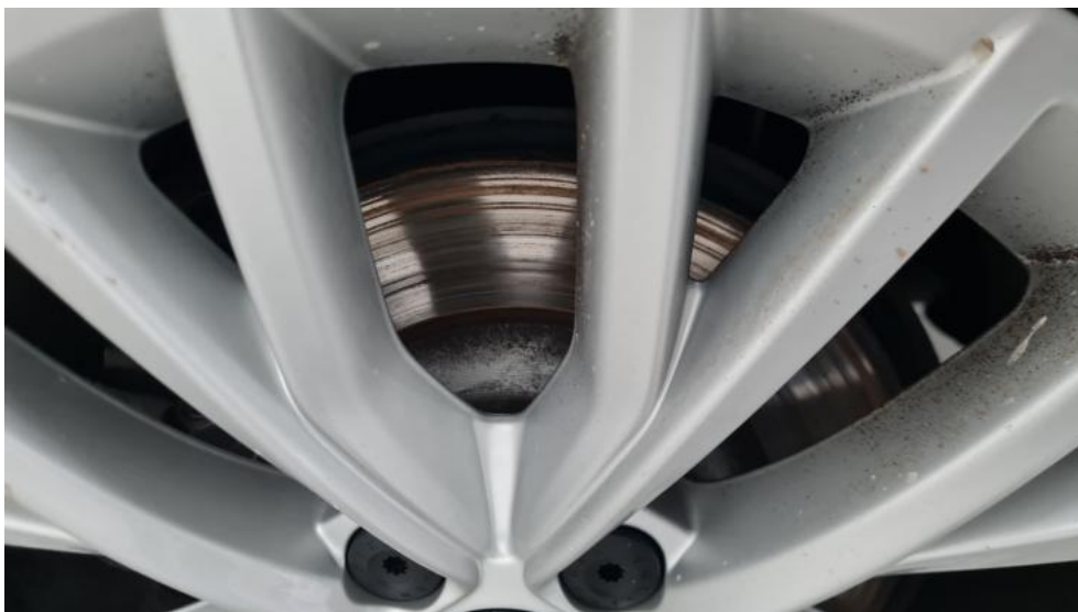
Photo 17. Tarcza hamulcowa tylna lewa