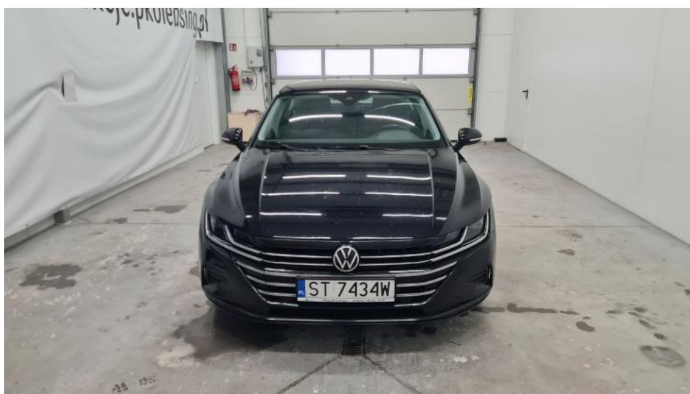
Photo 58. Przód