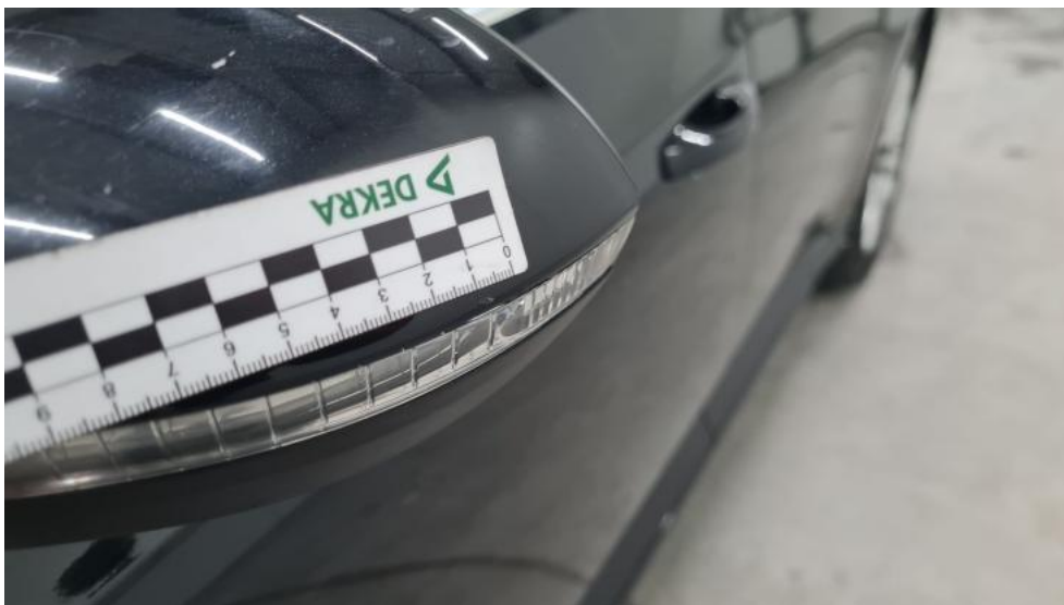
Photo 107. Lusterko zew L - Rysa/odprysk 1