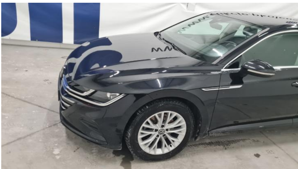
Photo 66. Bok lewy z przodu