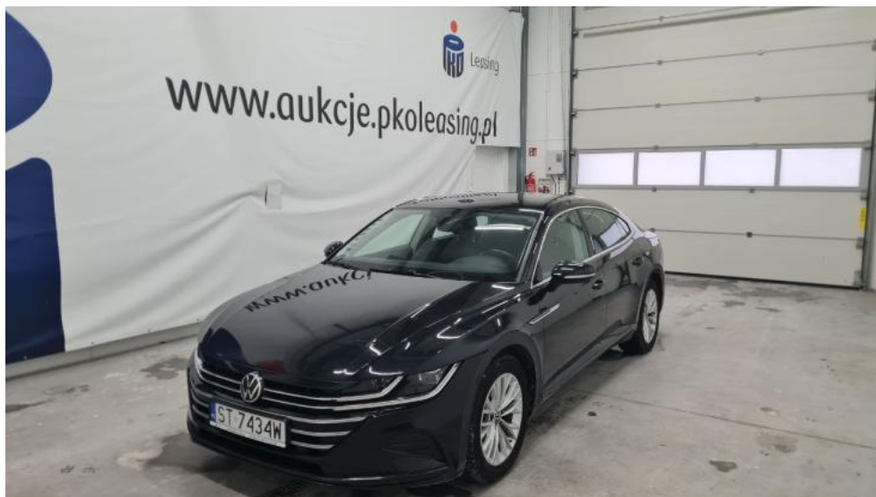
Photo 57. Przekątna przednia lewa