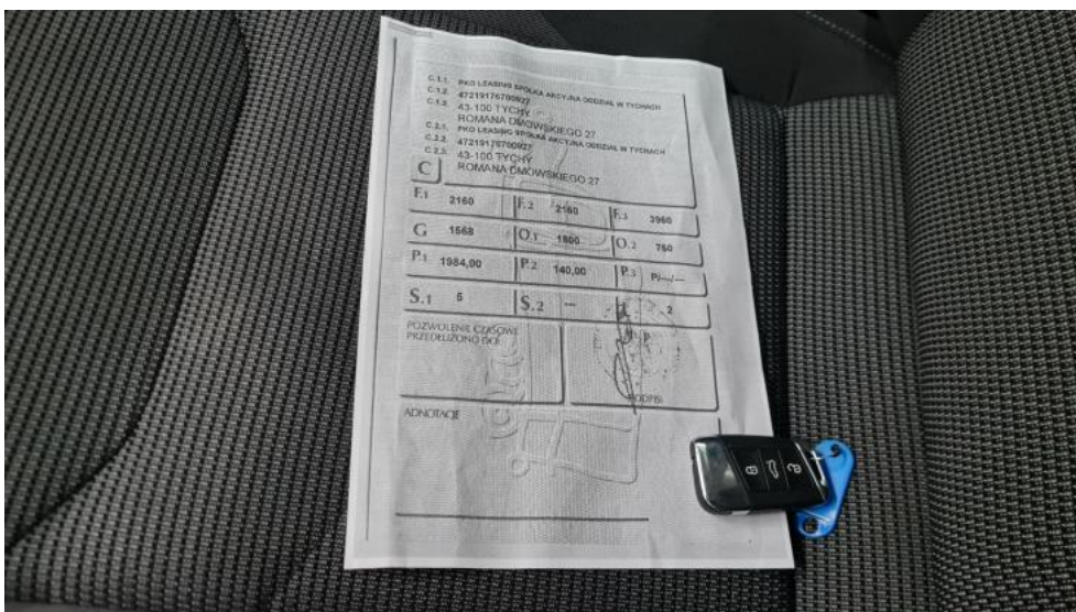
Photo 90. Dow. Rej. ksero Str.2 i klucze