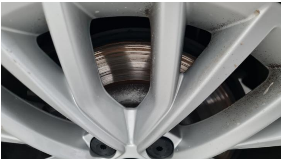
Photo 73. Tarcza hamulcowa tylna lewa