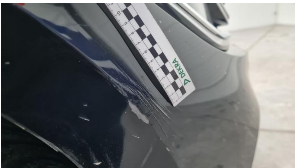
Photo 42. Zderzak - Pęknięcie/rozerwanie 1