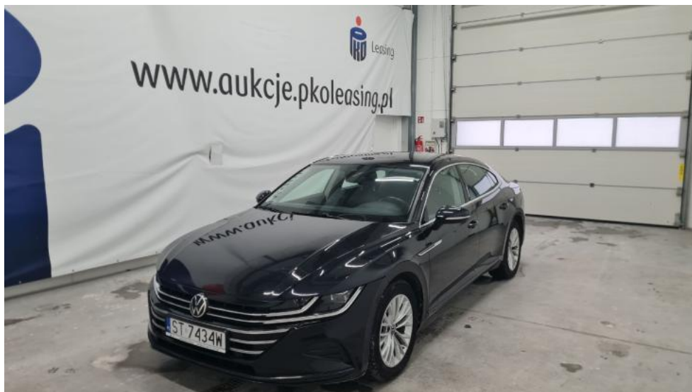
Photo 1. Przekątna przednia lewa