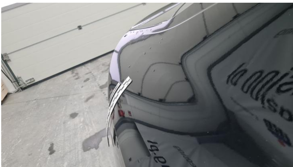
Photo 44. Błotnik tylny P / Ściana boczna P - Wgniecenie/odkształcenie 1