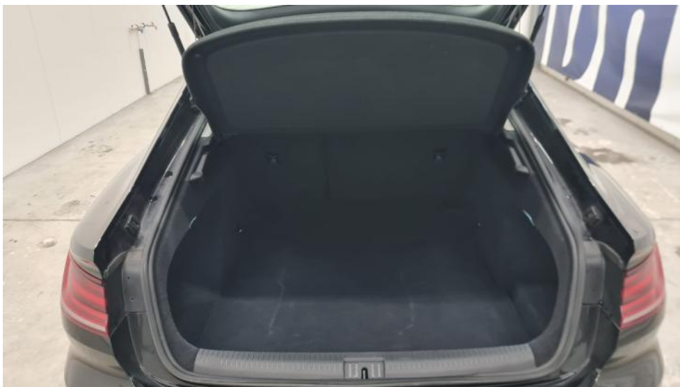
Photo 75. Bagażnik