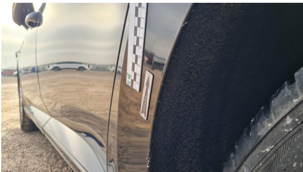
Photo 104. Błotnik tylny L / Ściana boczna L - Wgniecenie/odkształcenie 2