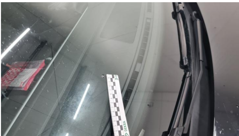
Photo 94. Szyba czołowa - zdjęcie poglądowe 1