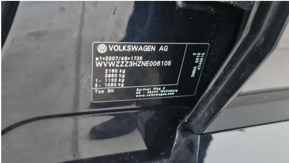
Photo 23. Tabliczka znamionowa