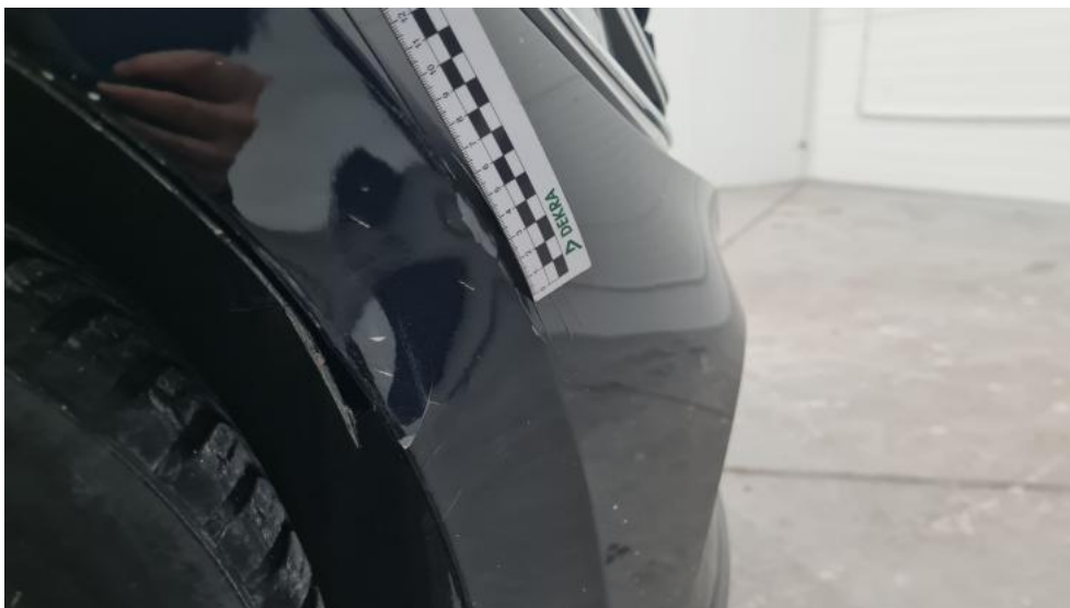
Photo 41. Zderzak - Wgniecenie/odkształcenie 1