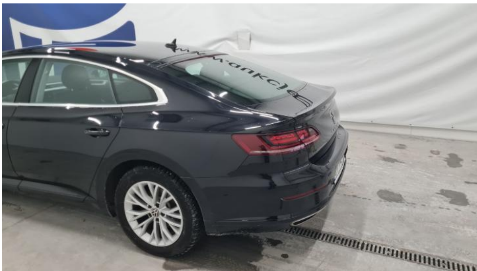
Photo 9. Bok lewy z tyłu