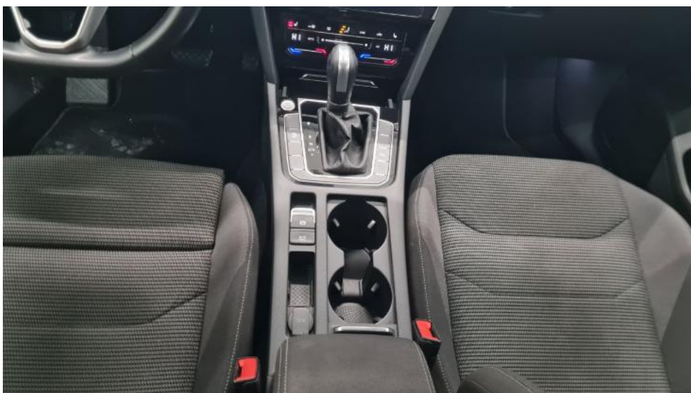
Photo 30. Tunel środkowy