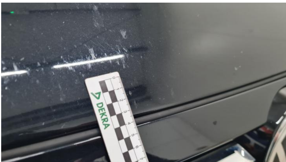
Photo 92. Pokrywa komory silnika - Rysa/odprysk 1