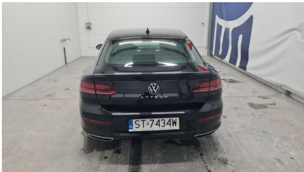
Photo 63. Tył