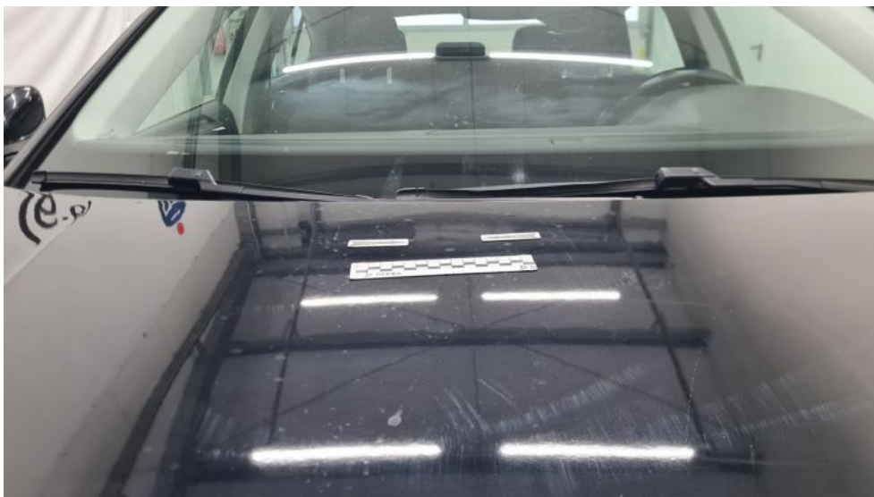
Photo 37. Pokrywa komory silnika - Wgniecenie/odkształcenie 1