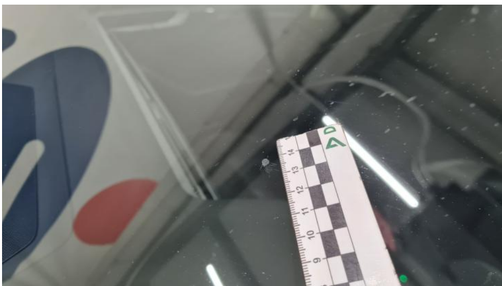
Photo 96. Szyba czołowa - Pęknięcie/rozerwanie 2