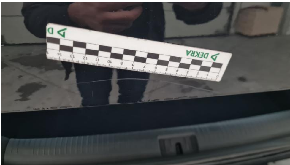
Photo 45. Pokrywy bagażnika - Rysa/odprysk 1