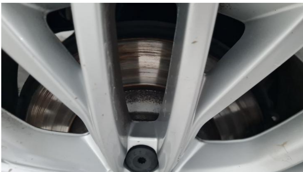
Photo 16. Tarcza hamulcowa tylna prawa