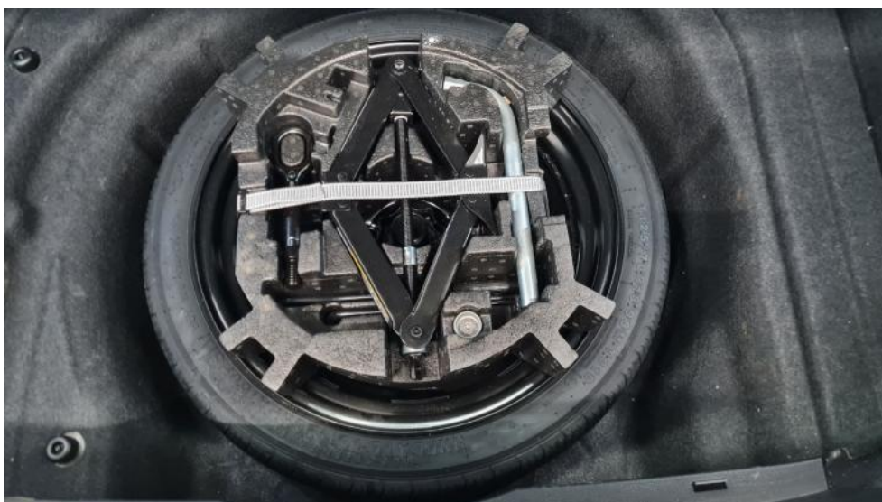
Photo 76. Koło zapasowe