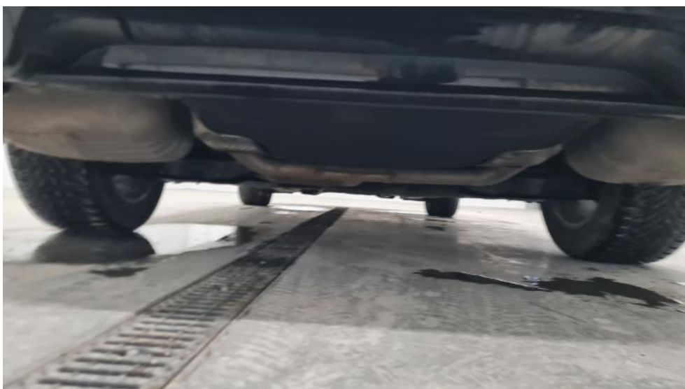
Photo 70. Spód pojazdu tył