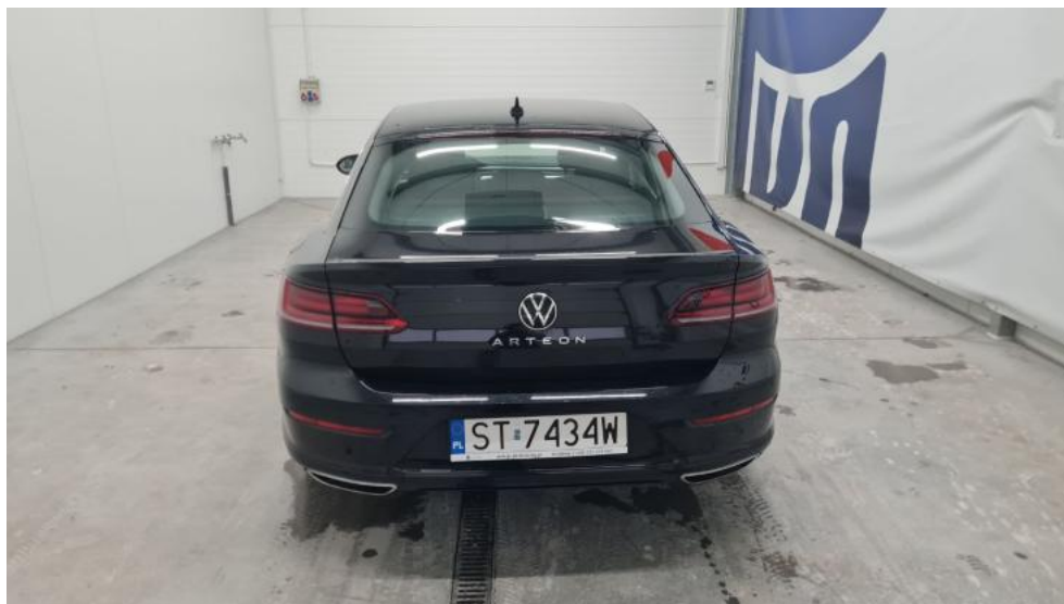
Photo 7. Tył