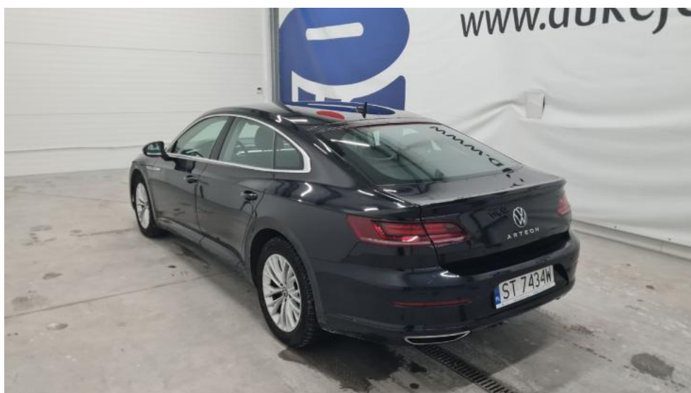
Photo 8. Przekątna tylna lewa