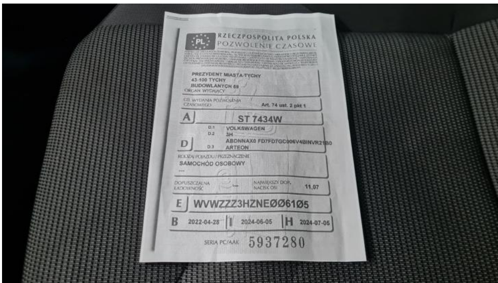
Photo 89. Dow. rej. ksero Str. 1