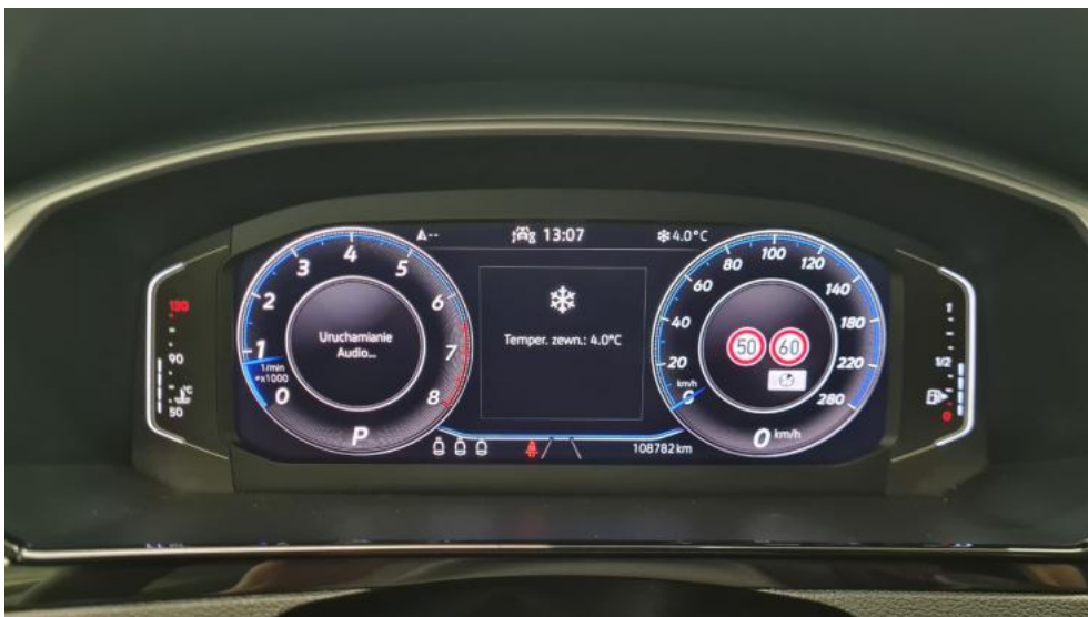
Photo 24. Zestaw wskaźników - przebieg