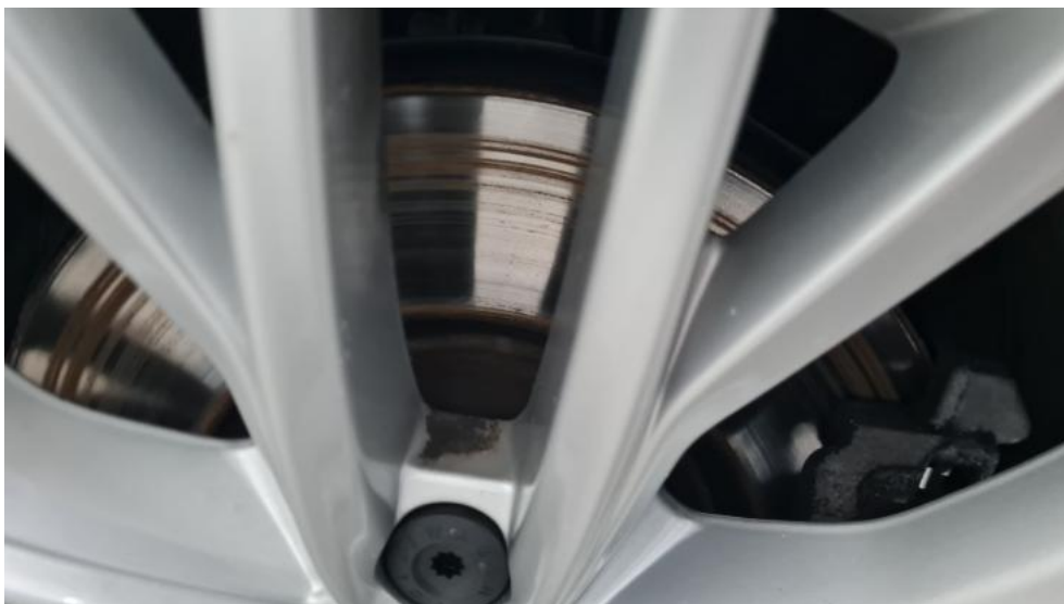
Photo 71. Tarcza hamulcowa przednia prawa