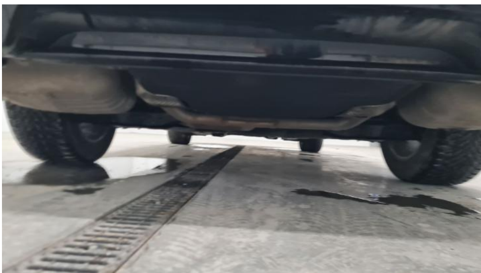
Photo 14. Spód pojazdu tył