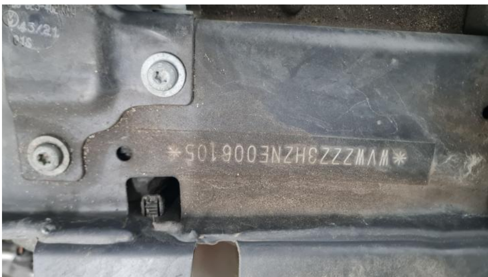
Photo 78. Numer identyfikacyjny