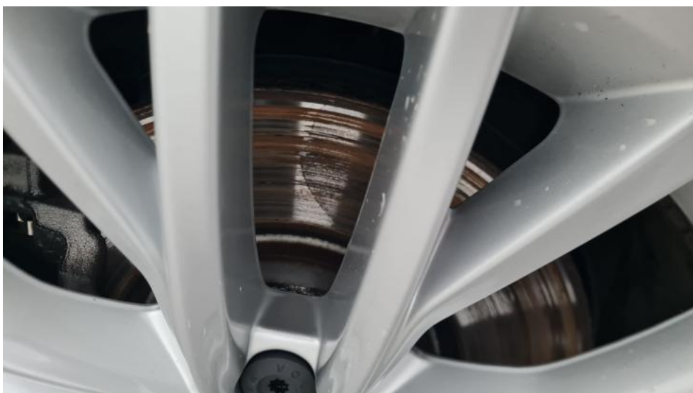
Photo 18. Tarcza hamulcowa przednia lewa