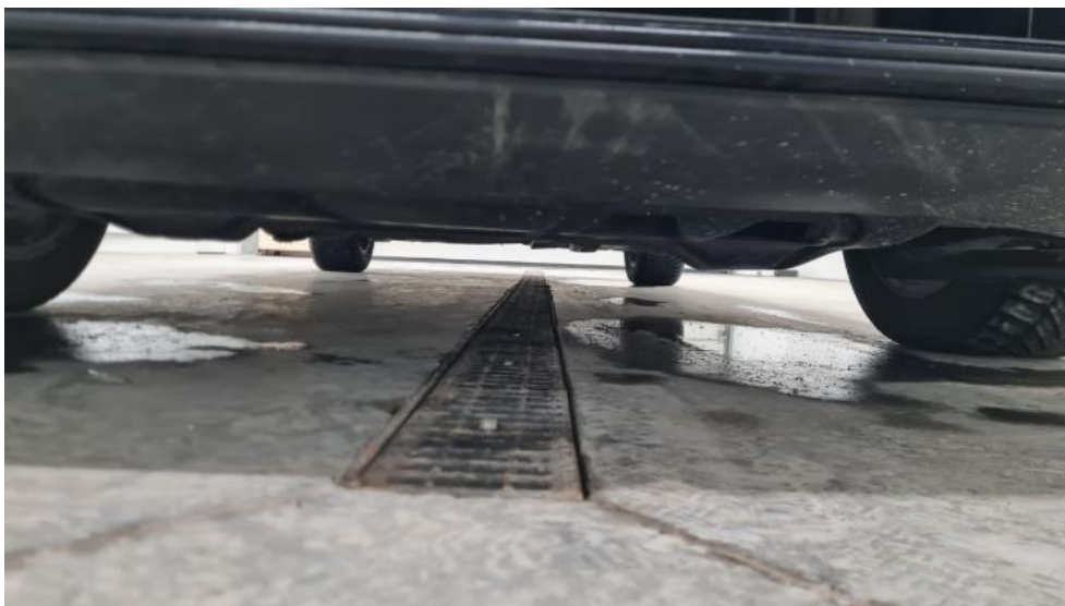
Photo 13. Spód pojazdu przód