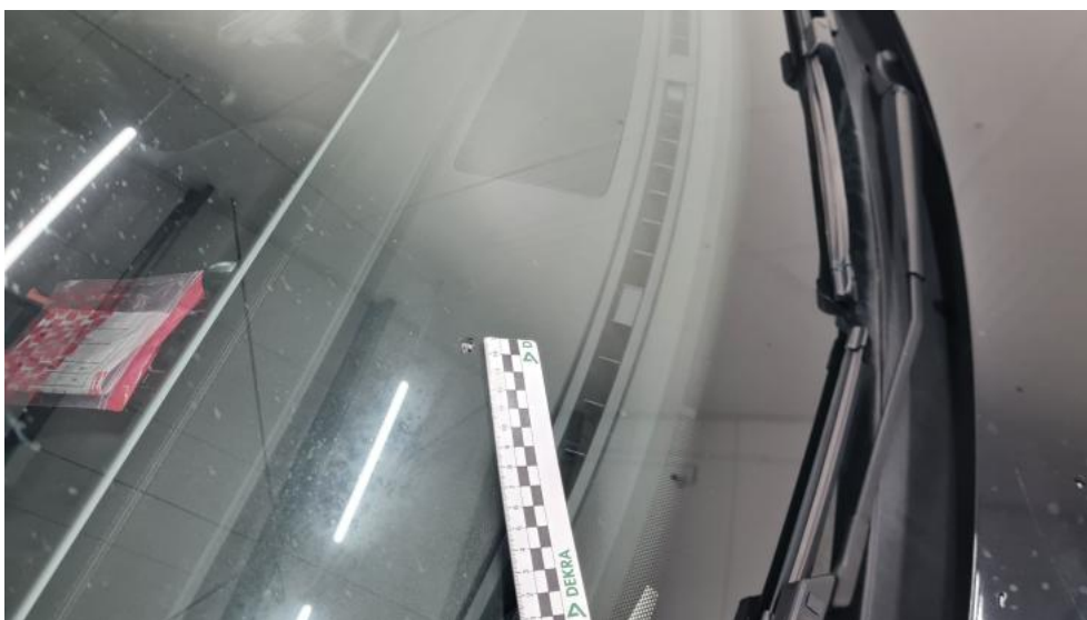
Photo 38. Szyba czołowa - zdjęcie poglądowe 1