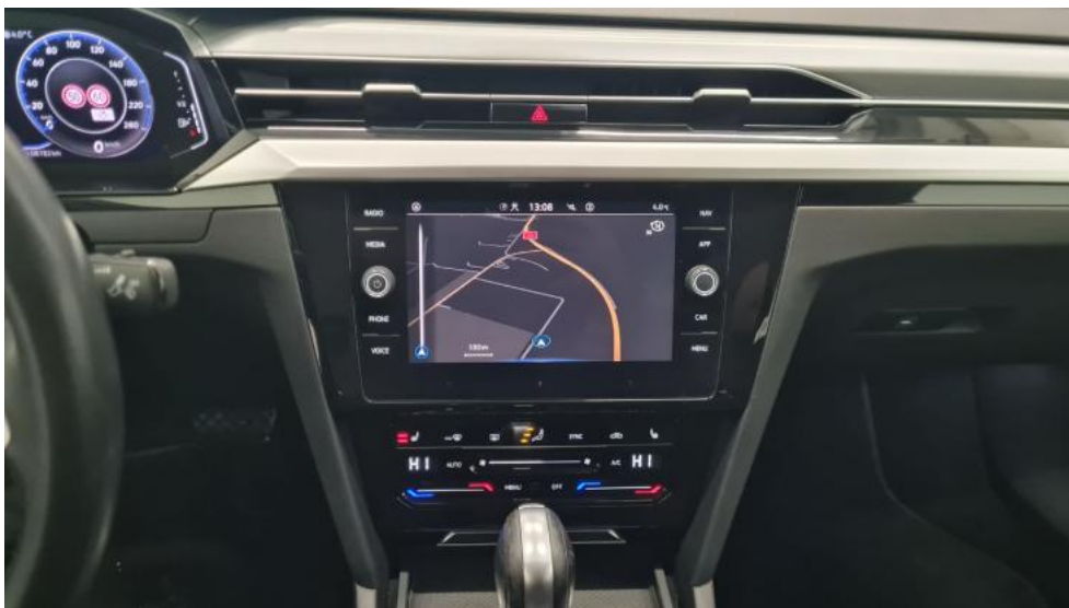
Photo 29. Konsola środkowa