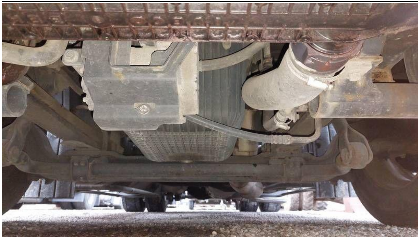
Fot. nr 65