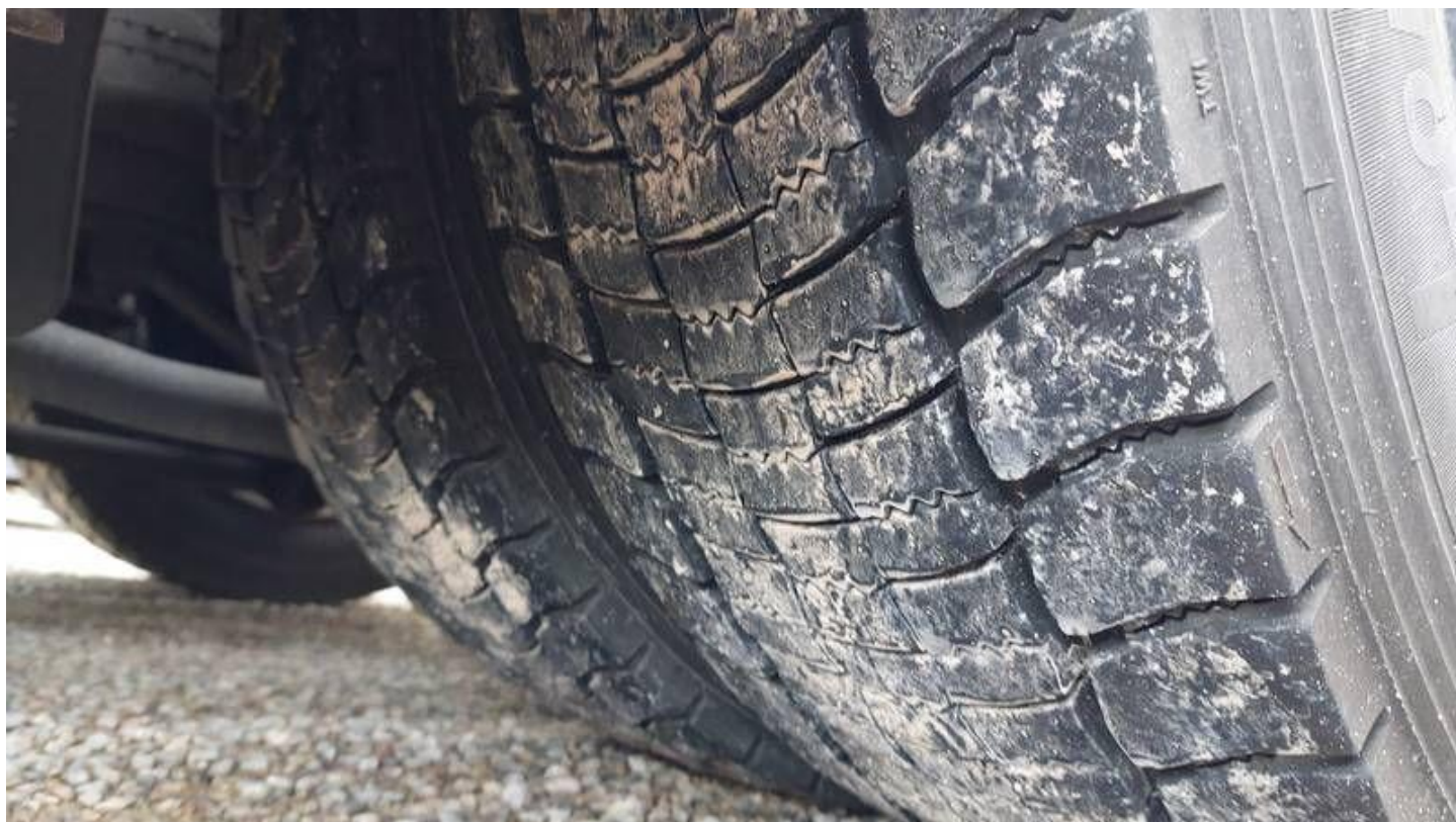
Fot. nr 80