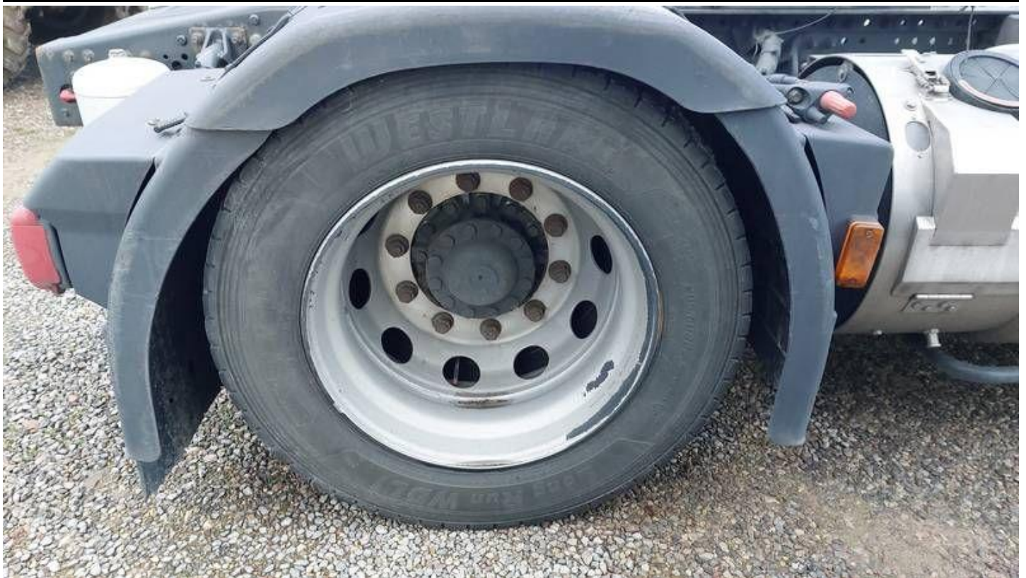
Fot. nr 81