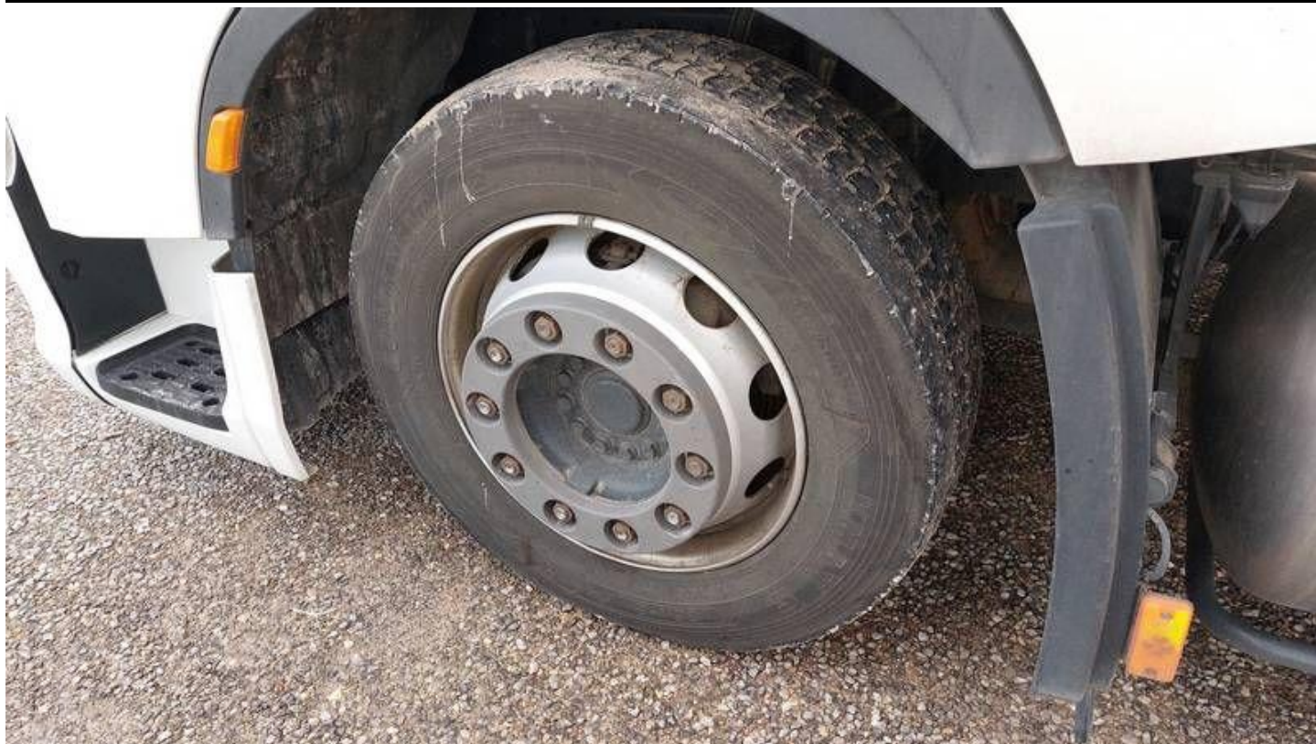
Fot. nr 75