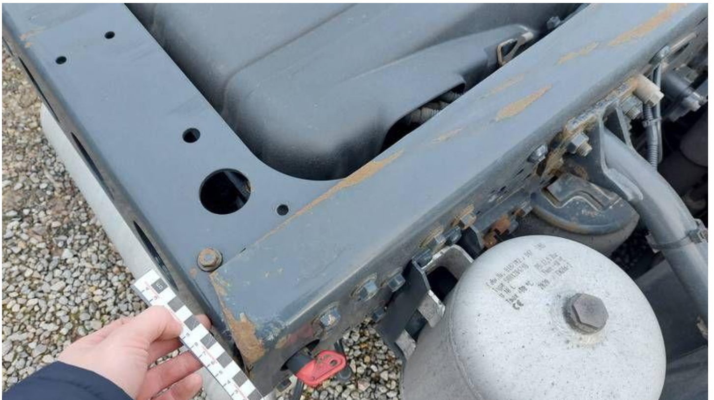
Fot. nr 60