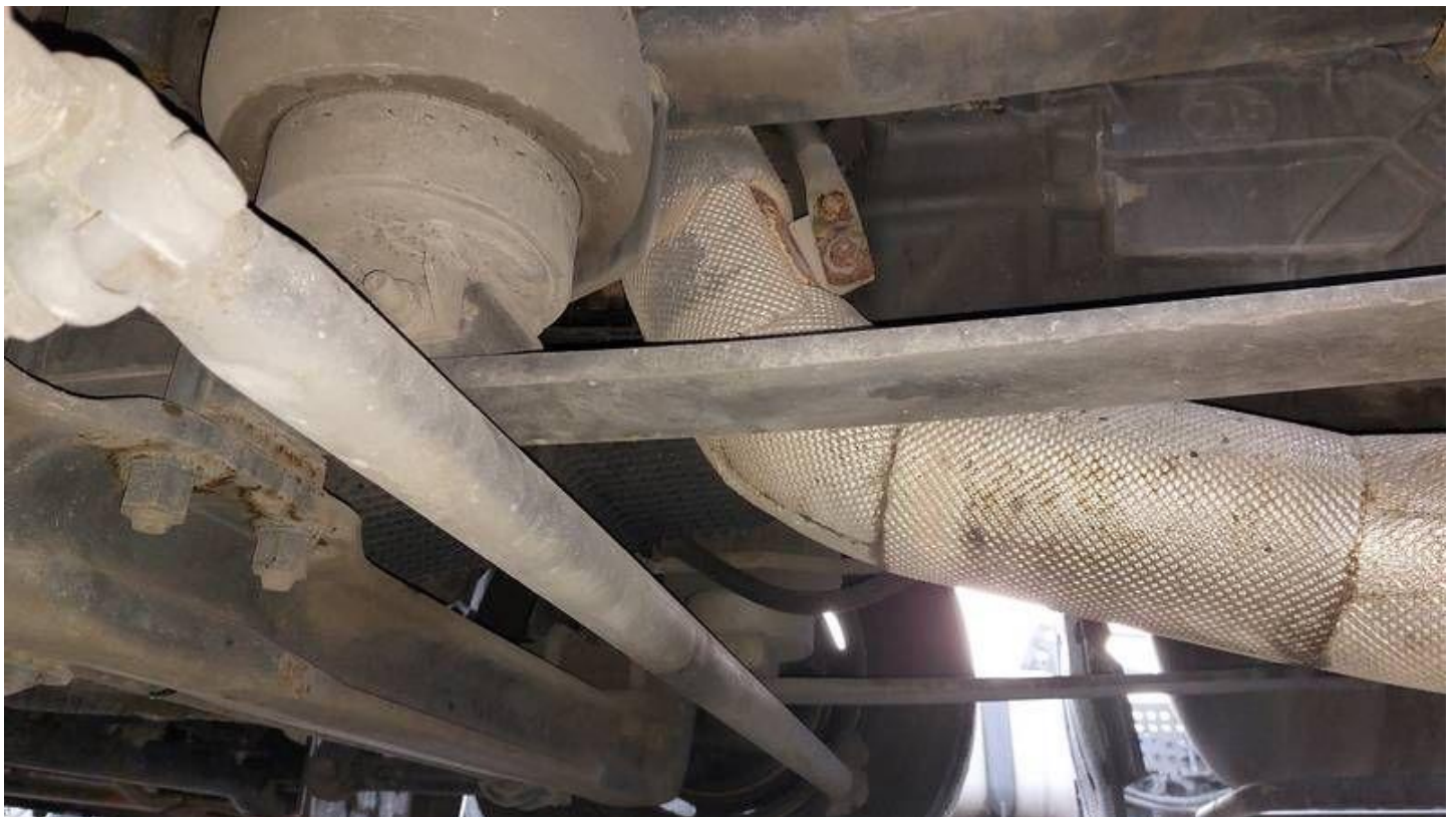
Fot. nr 74