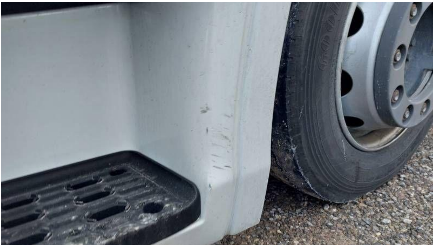
Fot. nr 55