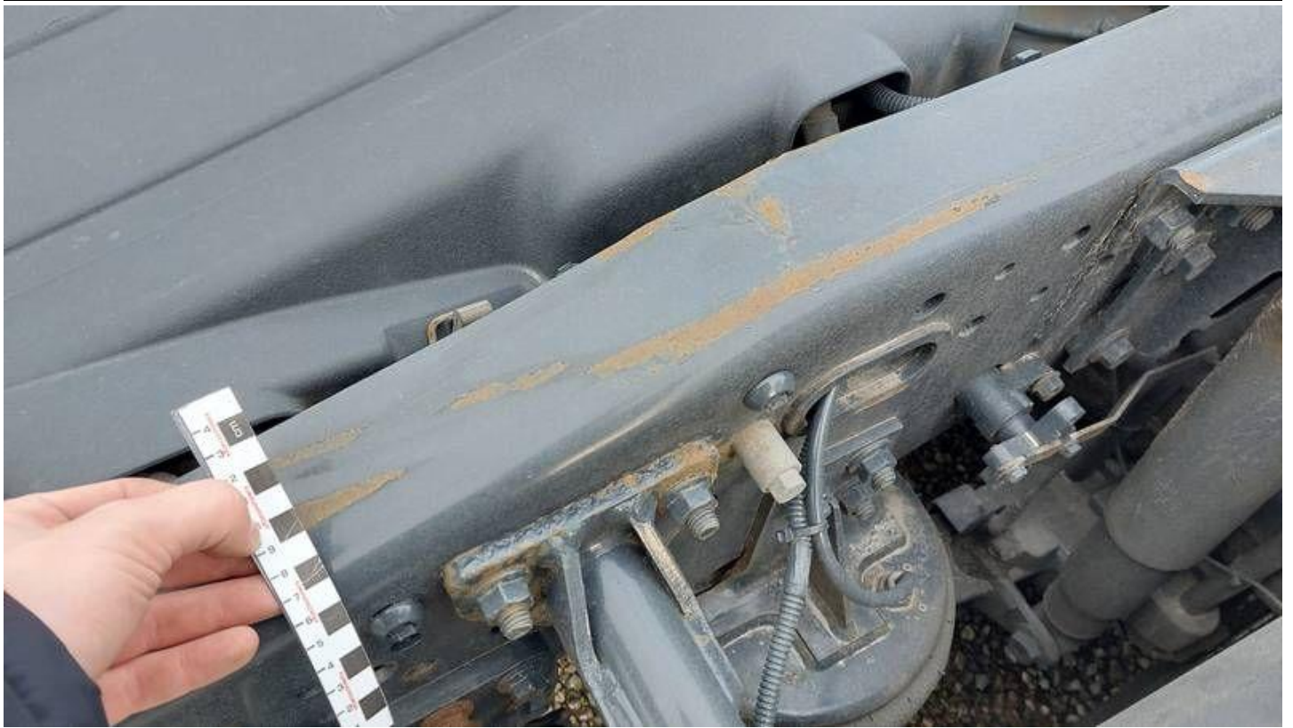
Fot. nr 61