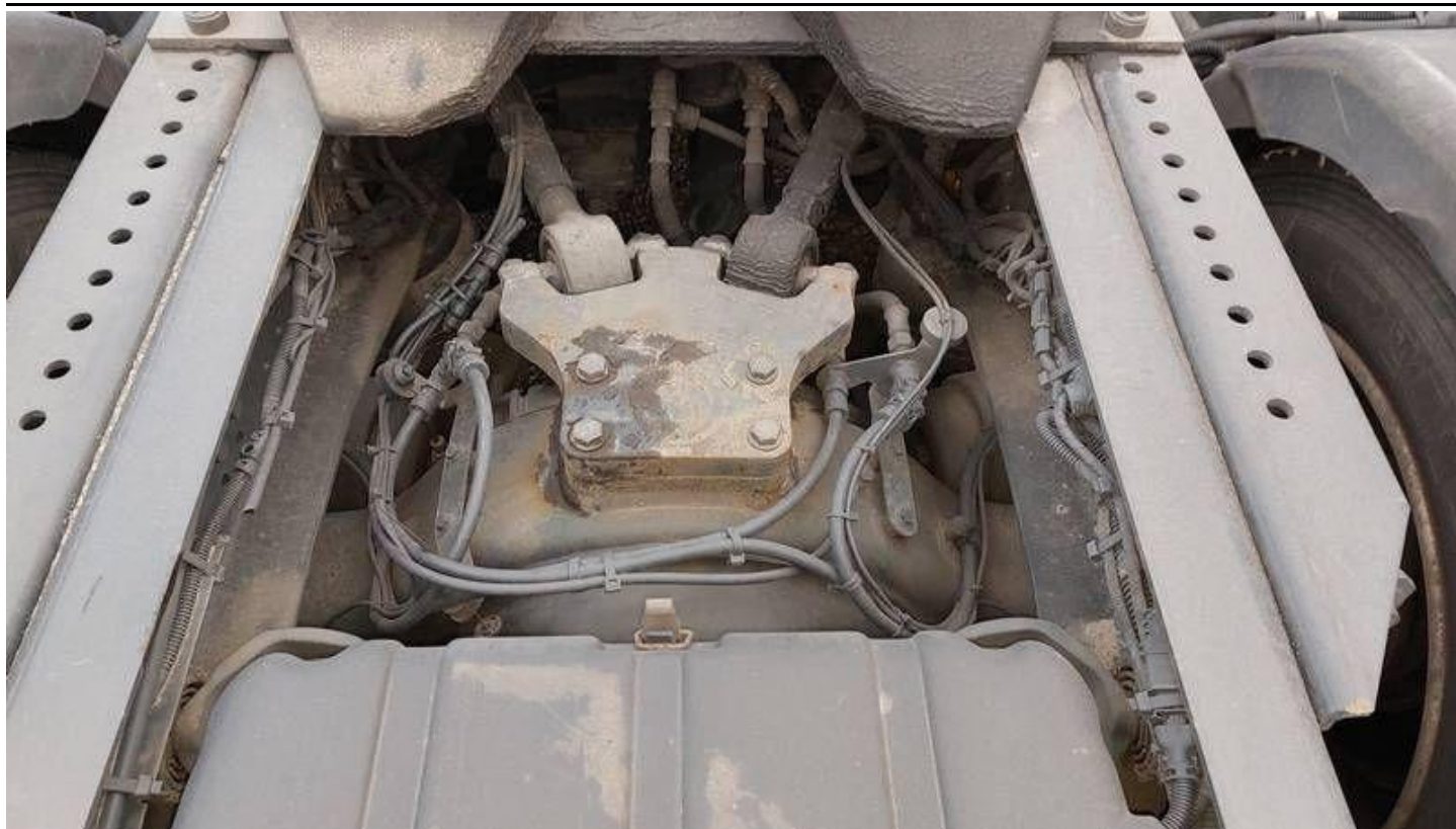
Fot. nr 71