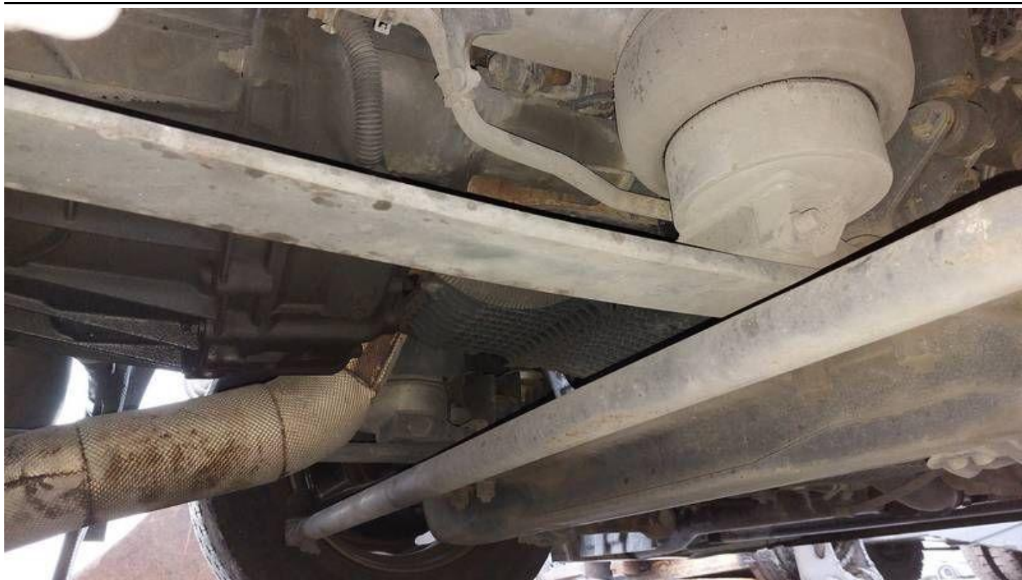
Fot. nr 67