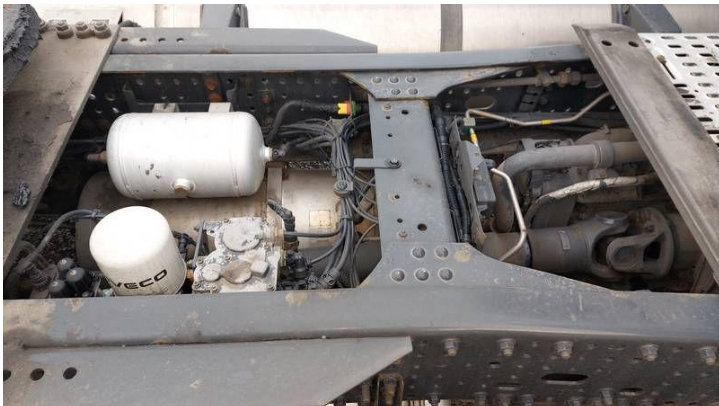
Fot. nr 68