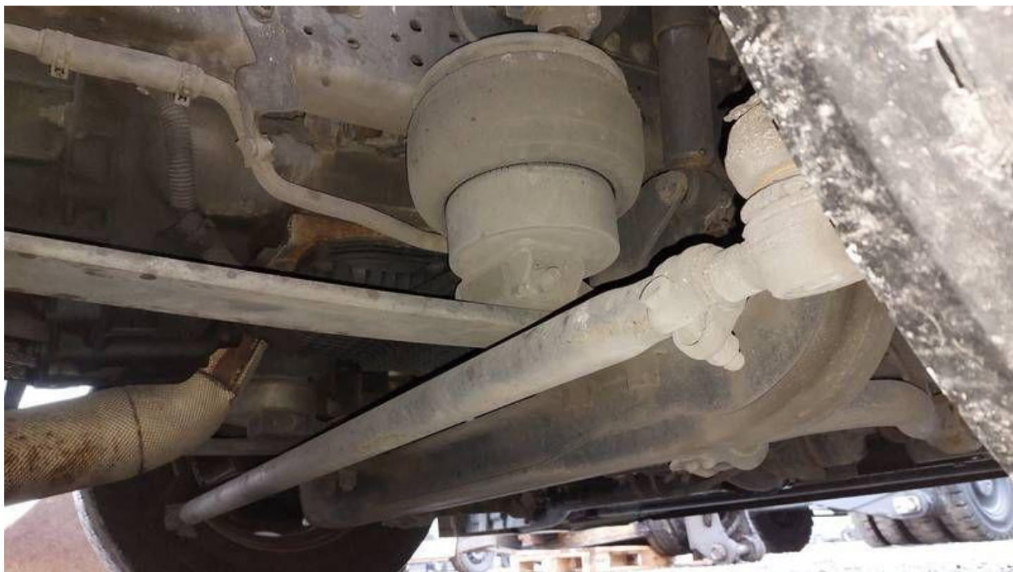
Fot. nr 66