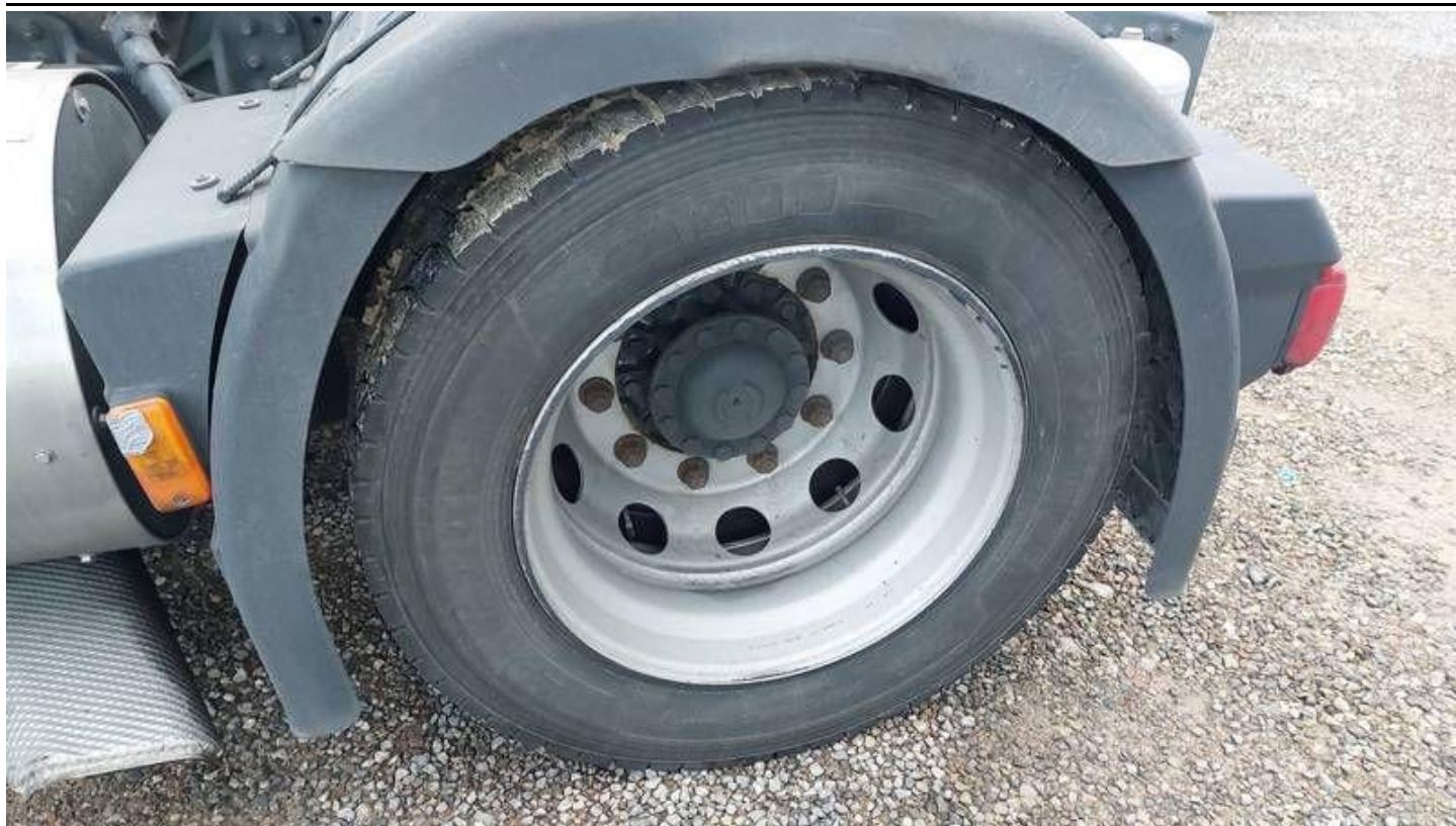
Fot. nr 79