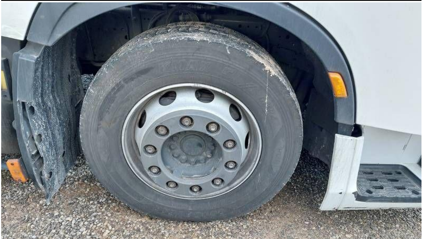
Fot. nr 77