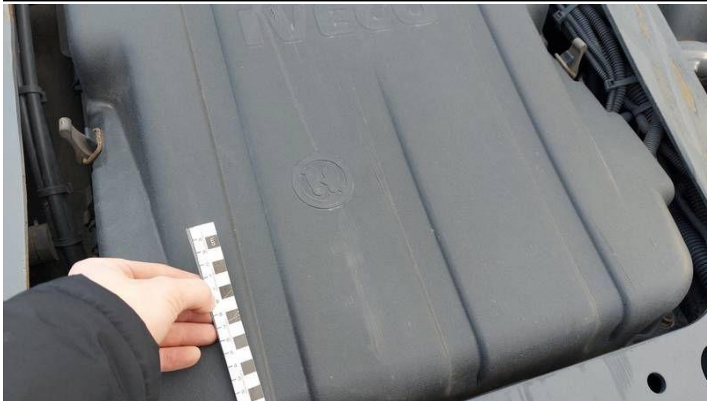
Fot. nr 63