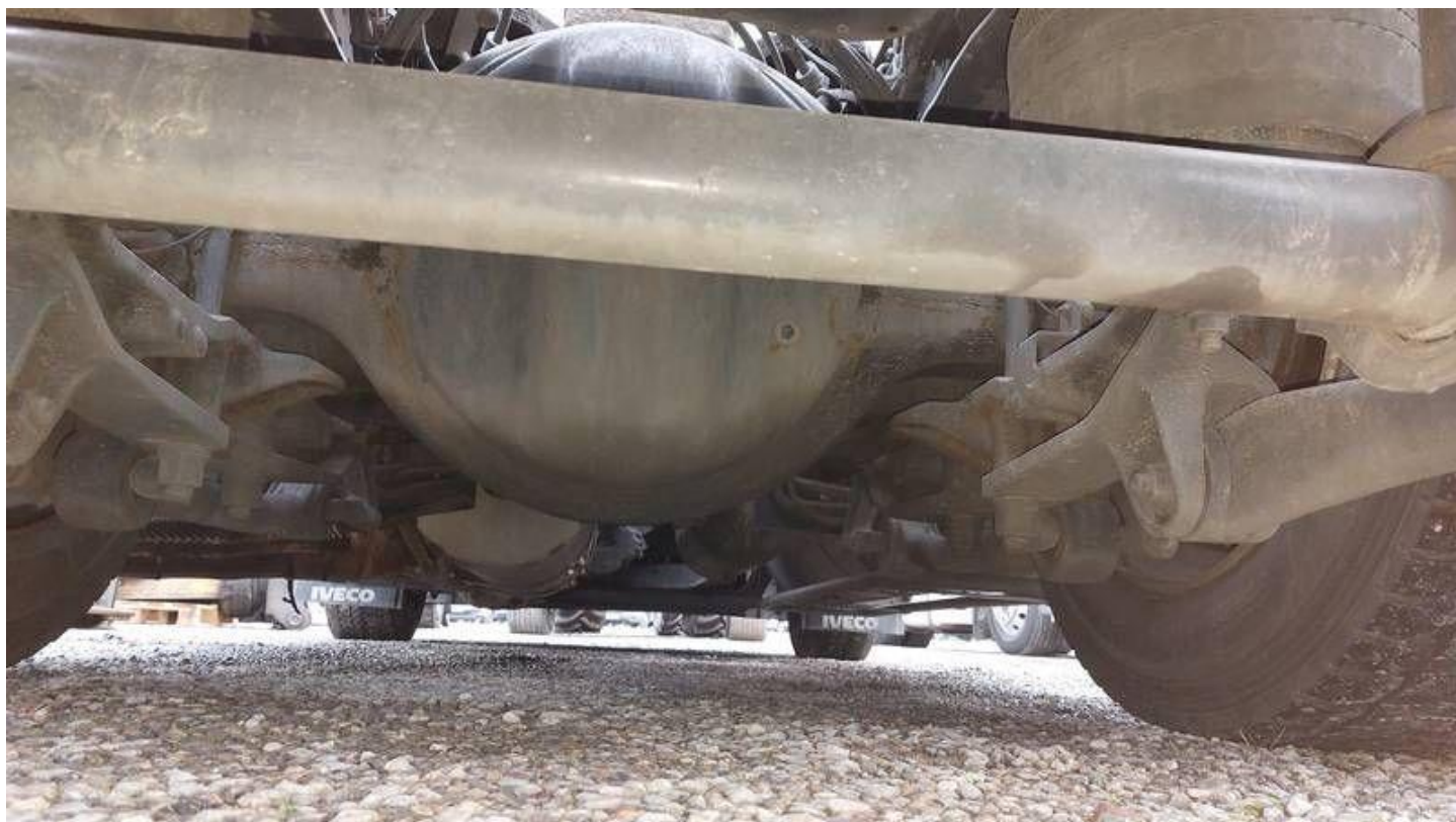
Fot. nr 72