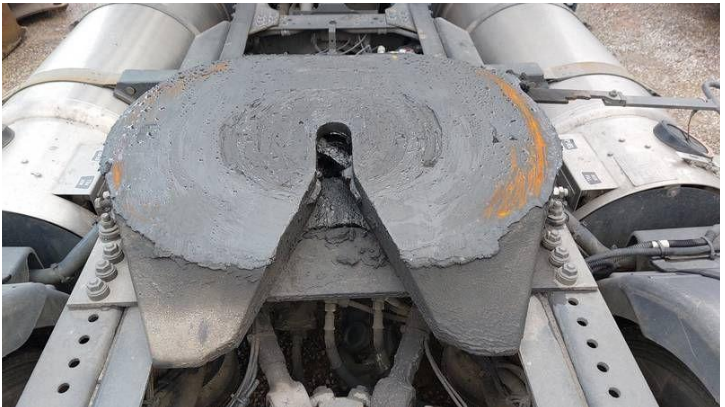
Fot. nr 70