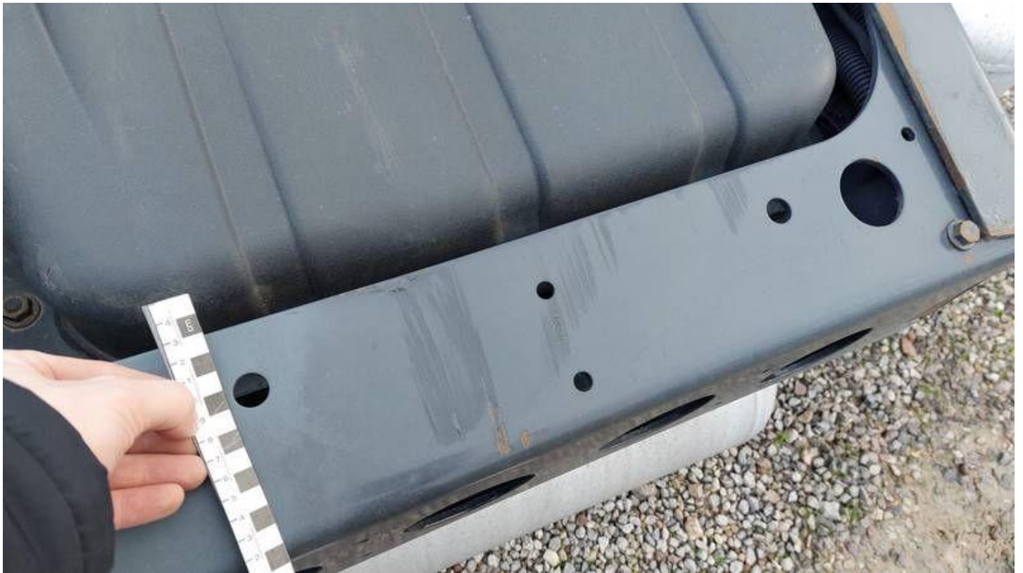
Fot. nr 62