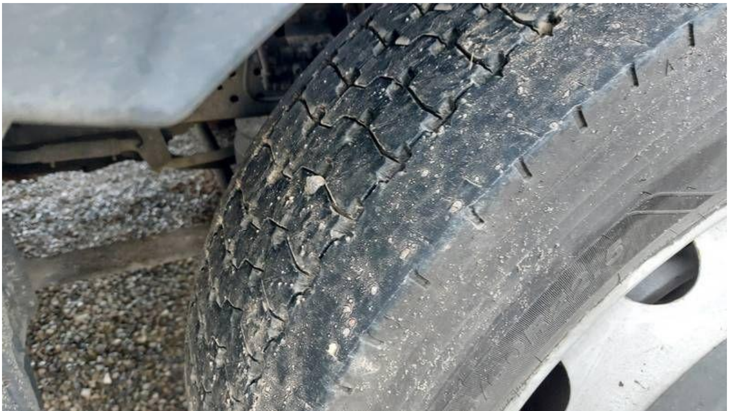
Fot. nr 78