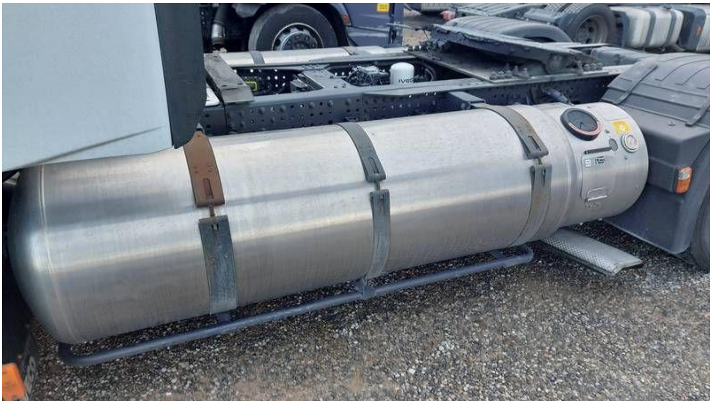
Fot. nr 56