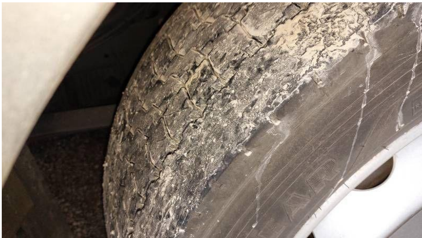
Fot. nr 76