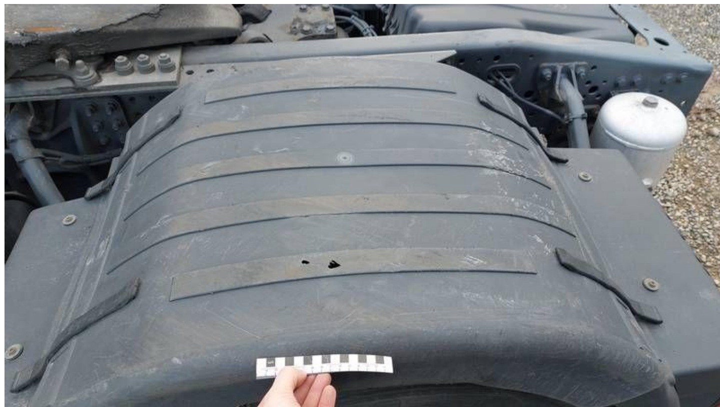
Fot. nr 58