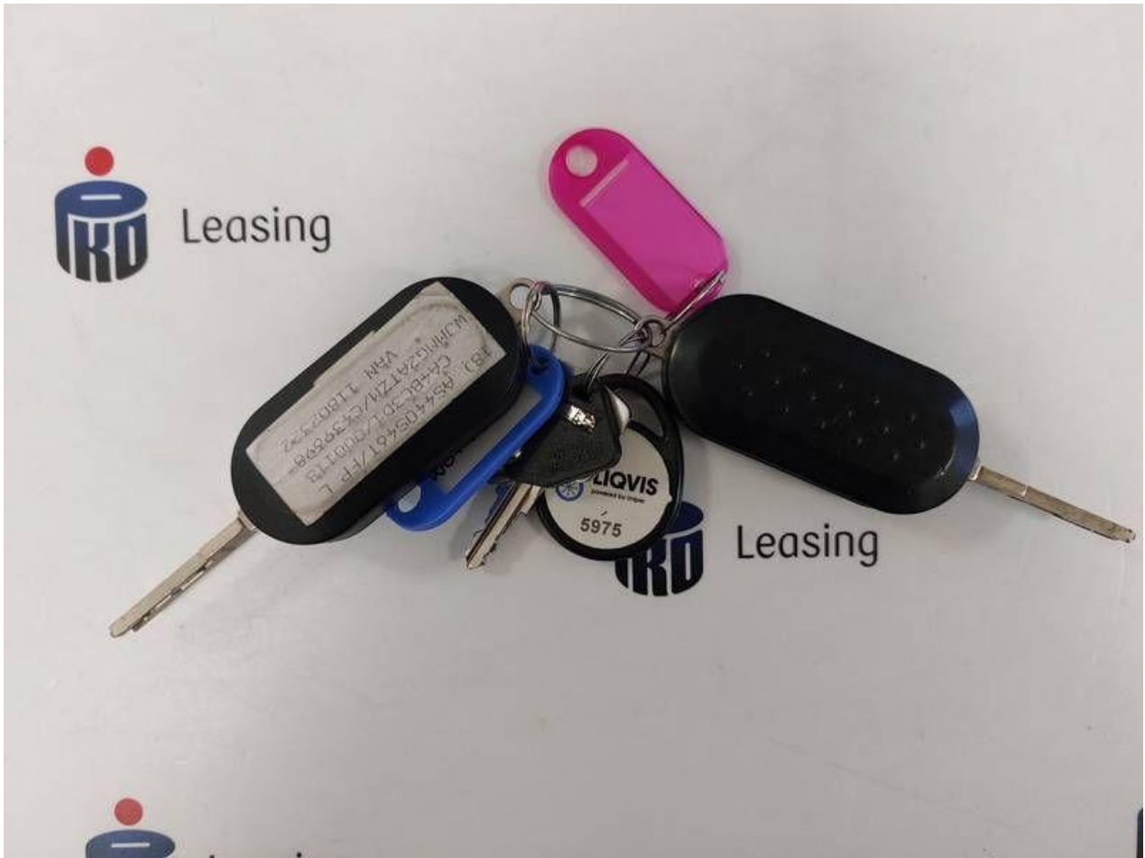
Fot. nr 85

Dokument wystawiony elektronicznie, w a ny bez podpisu