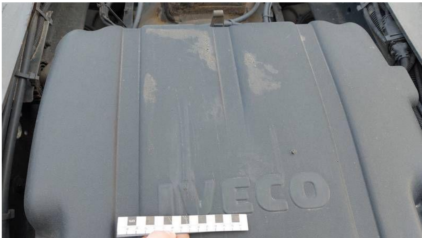
Fot. nr 64