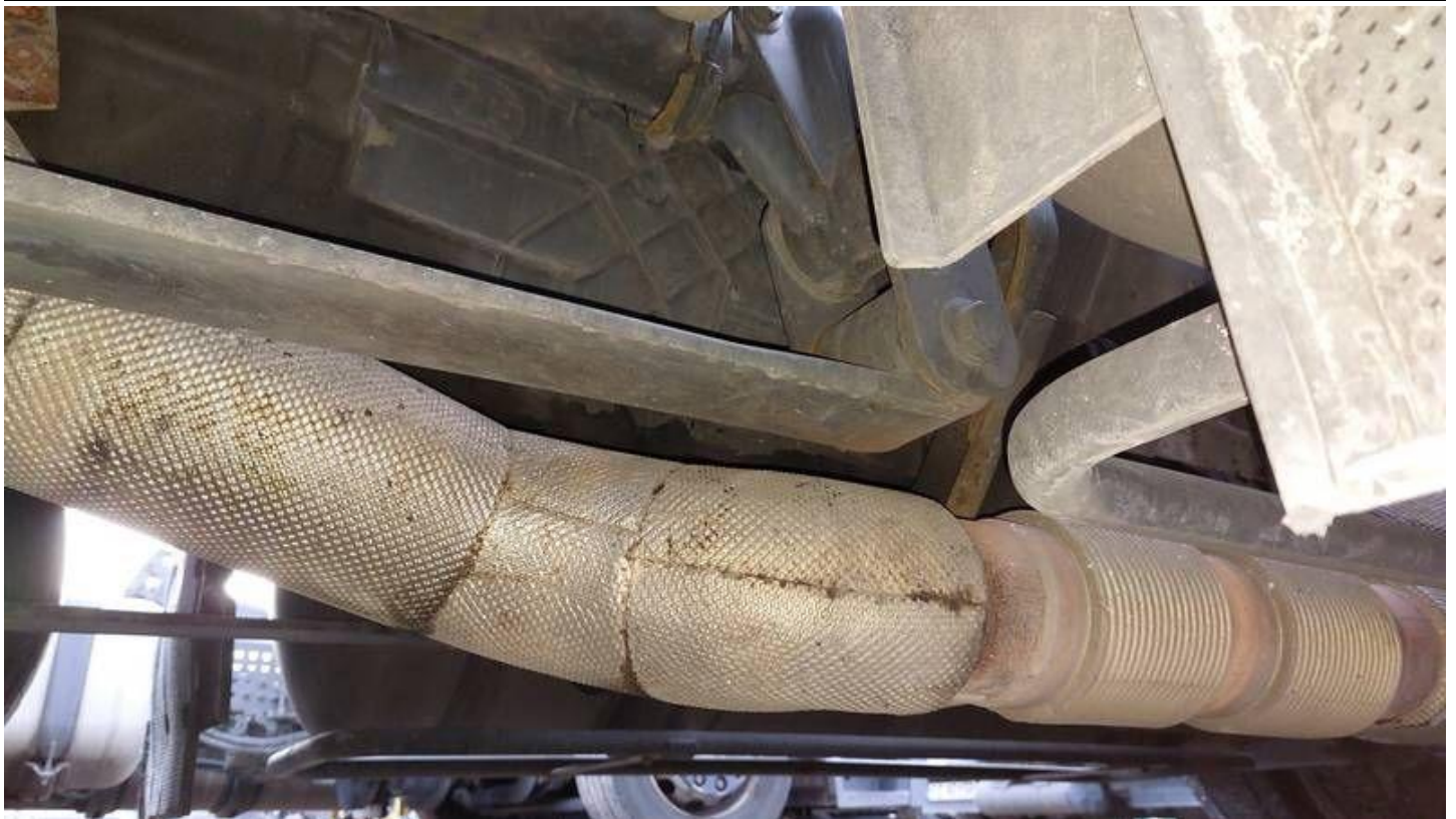
Fot. nr 73