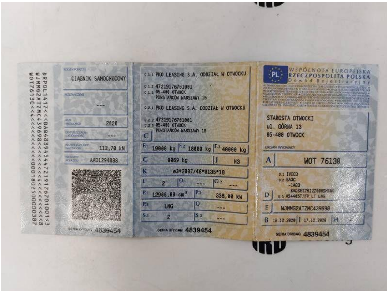
Fot. nr 83