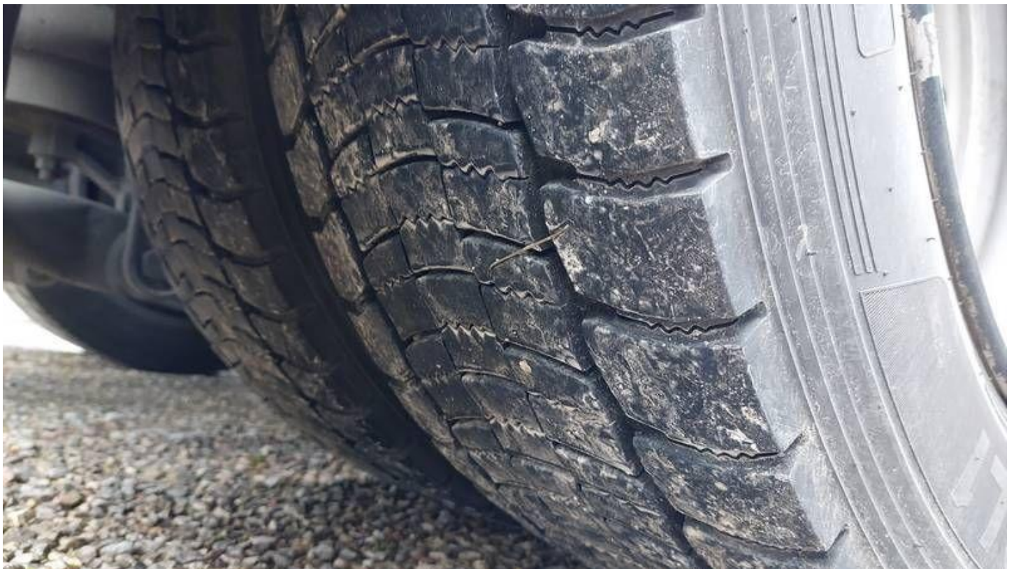
Fot. nr 82