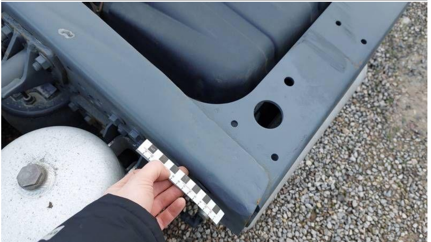
Fot. nr 59