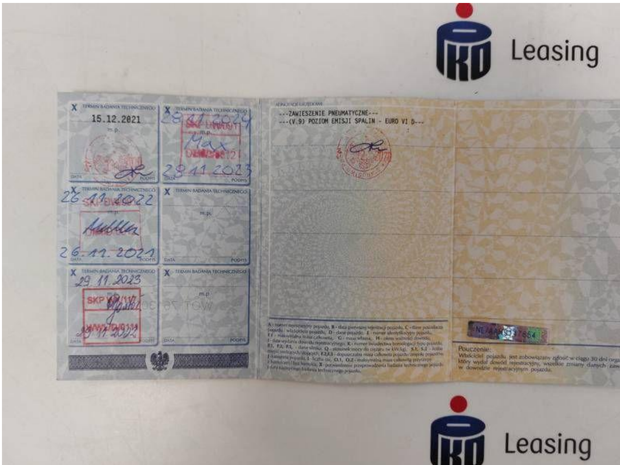
Fot. nr 84