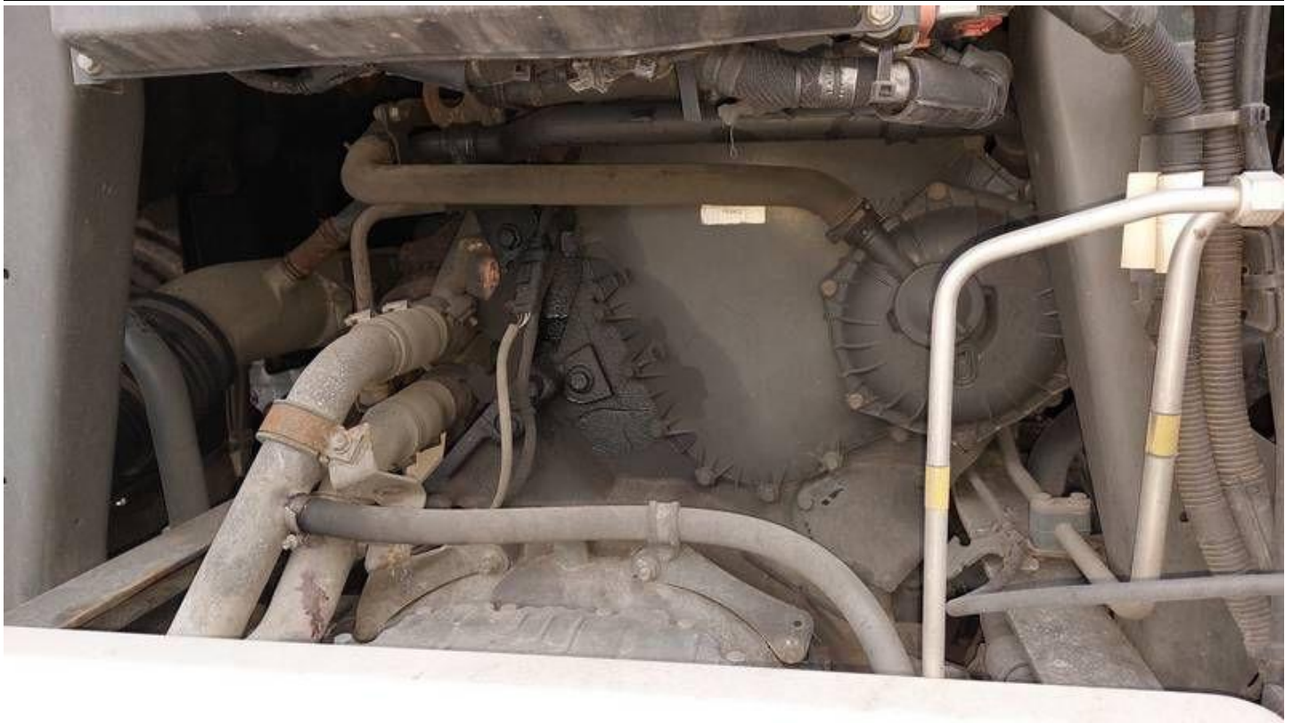
Fot. nr 69