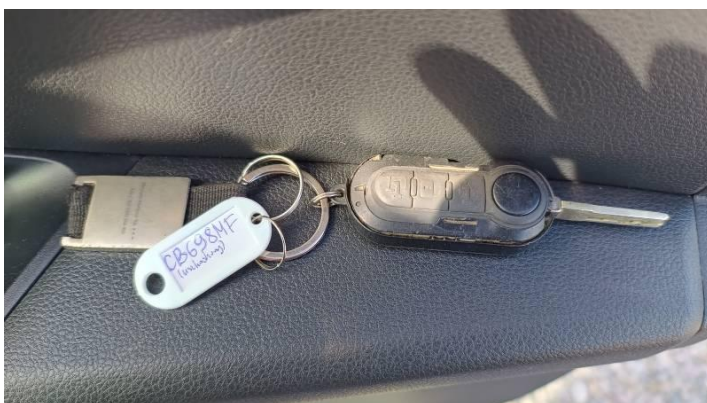
Fot. nr 94

Dokument wystawiony elektronicznie, waminy bez podpisu