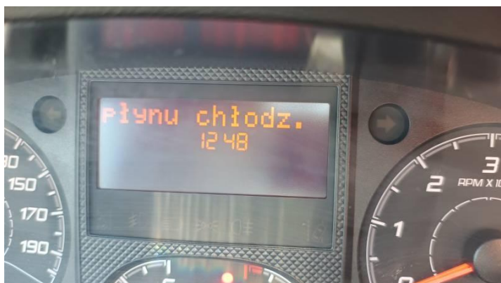
Fot. nr 89