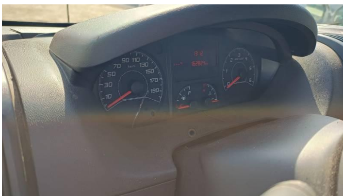
Fot. nr 84