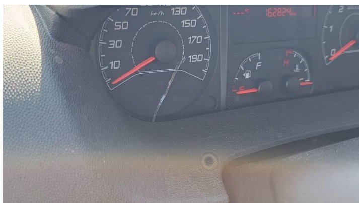
Fot. nr 85