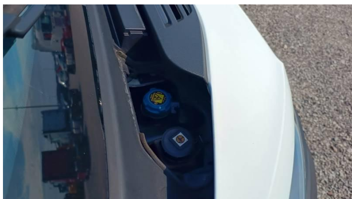
Fot. nr 81