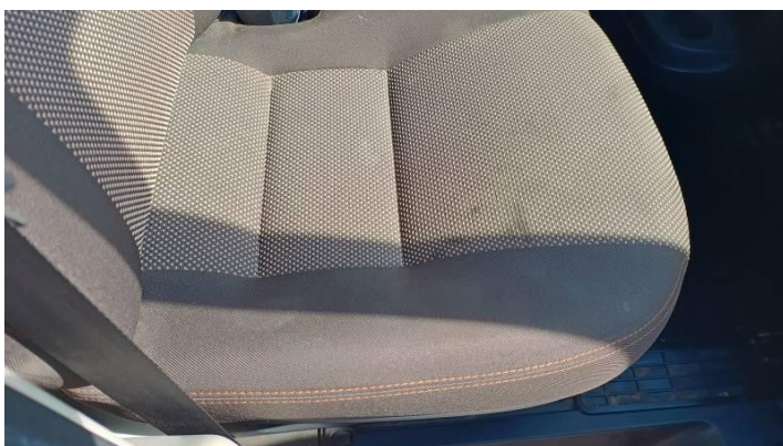
Fot. nr 86