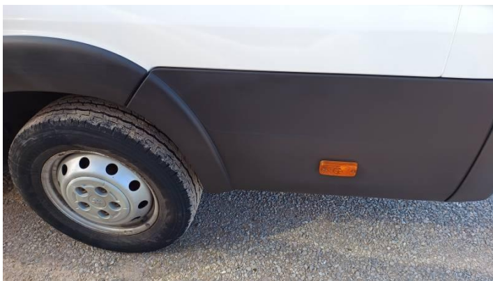
Fot. nr 92