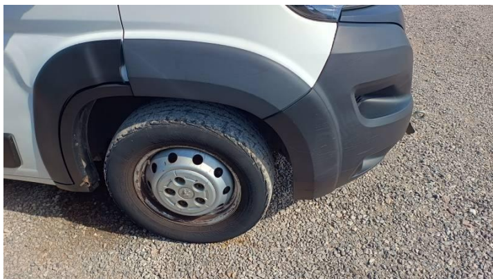
Fot. nr 91