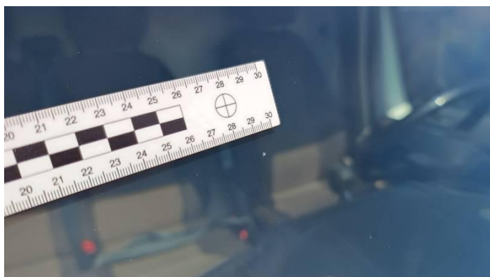
Fot. nr 83