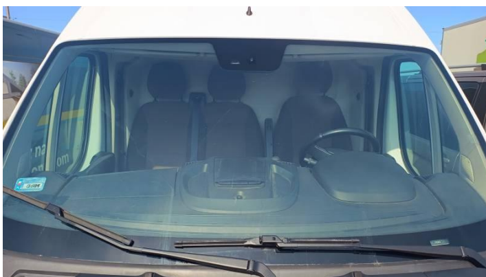
Fot. nr 82