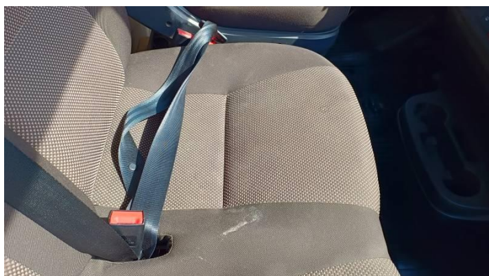
Fot. nr 87