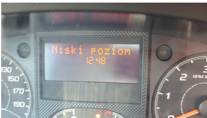
Fot. nr 88