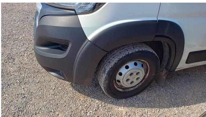
Fot. nr 90