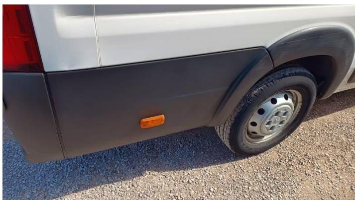
Fot. nr 93