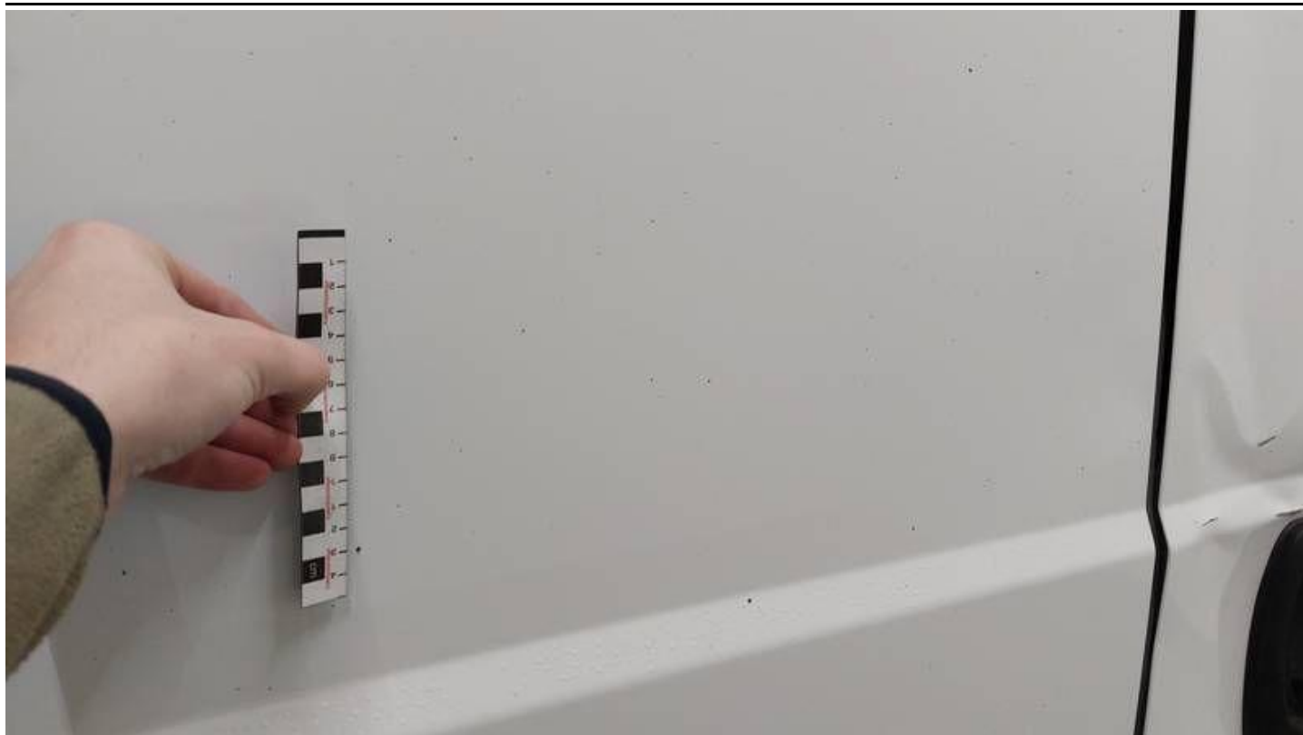
Fot. nr 63