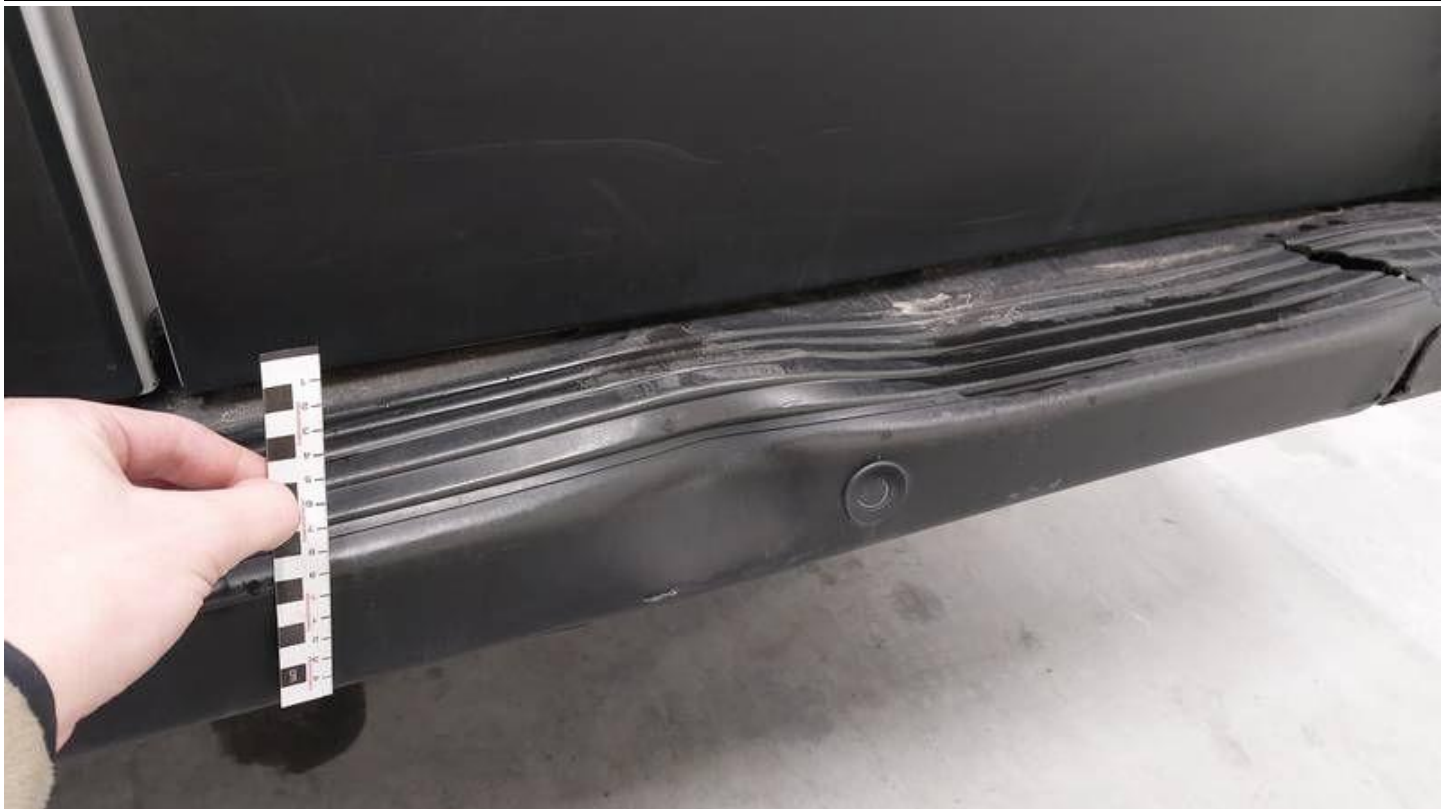
Fot. nr 59