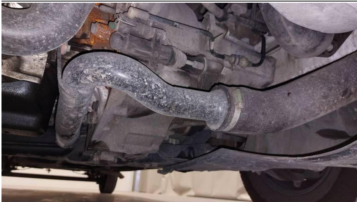
Fot. nr 65