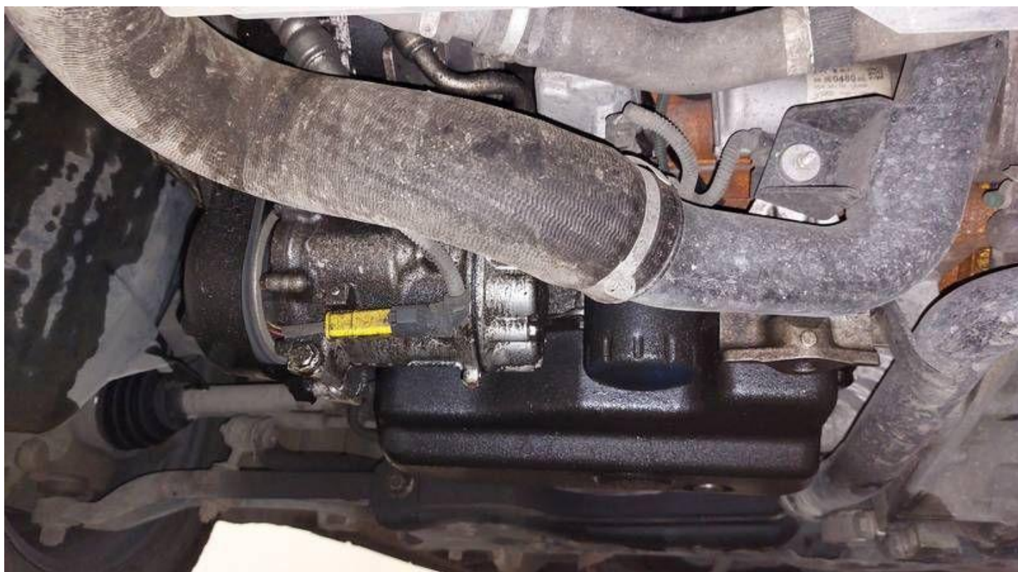
Fot. nr 68