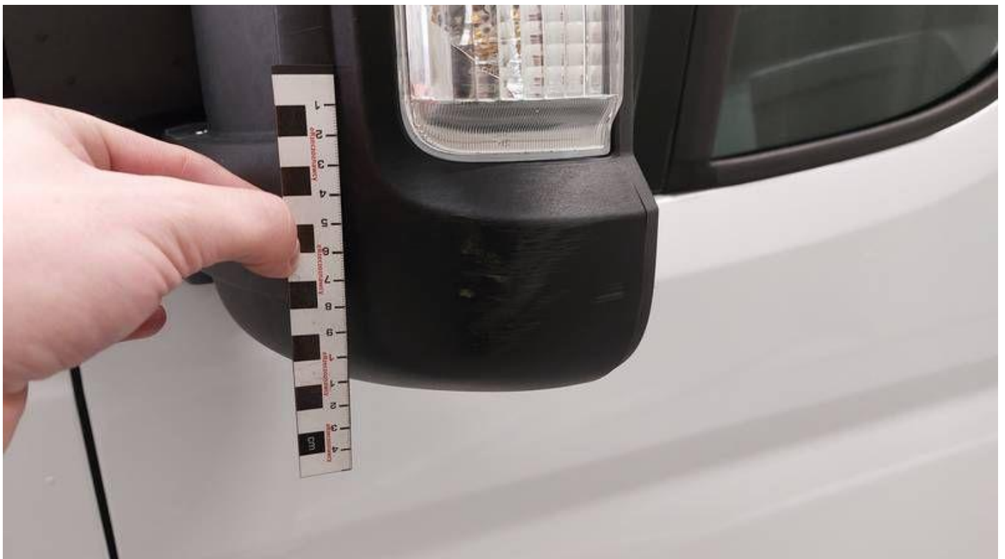
Fot. nr 52