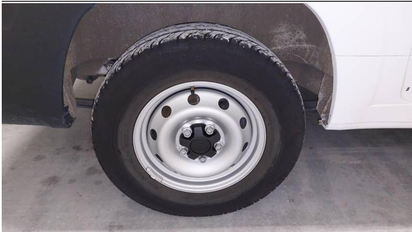
Fot. nr 79