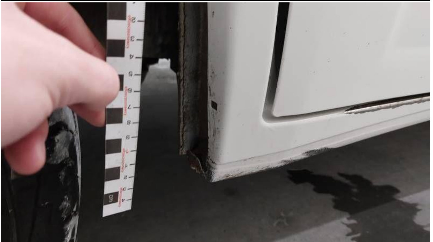
Fot. nr 53