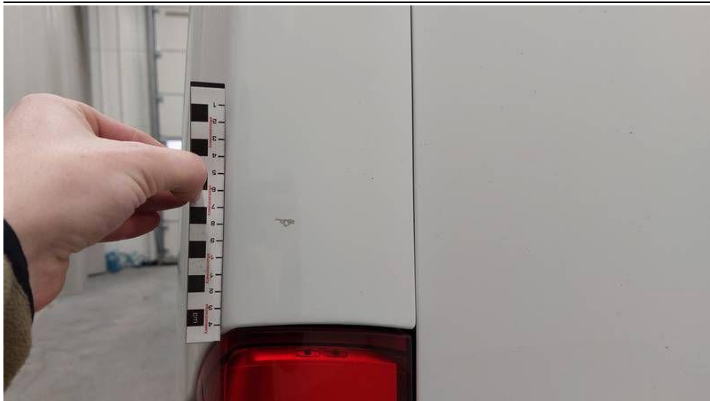
Fot. nr 57