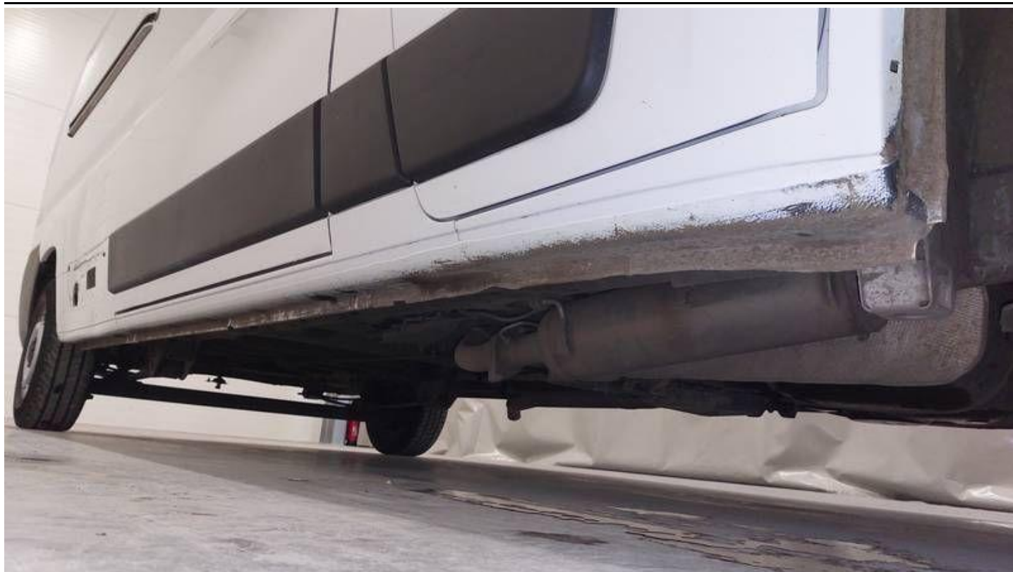
Fot. nr 69