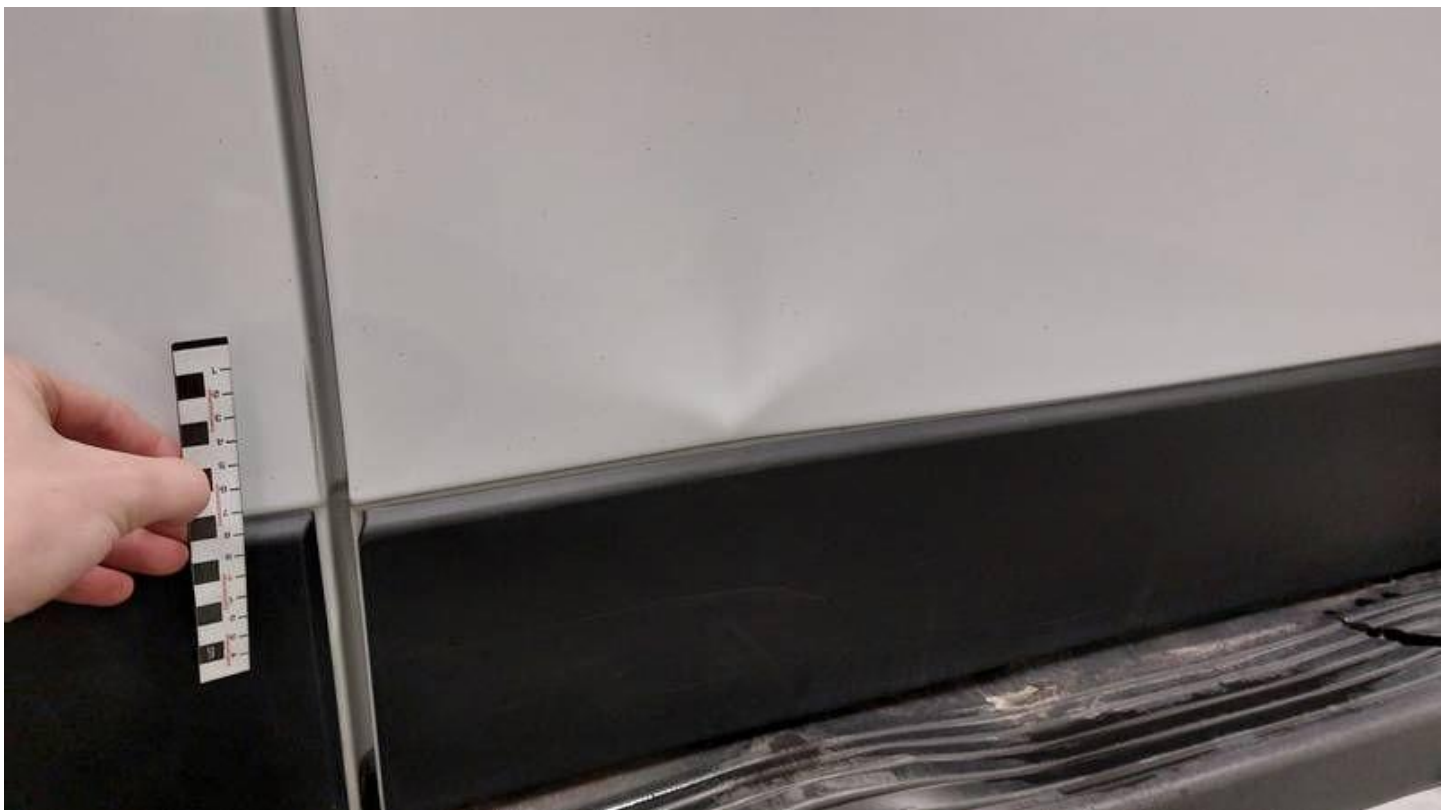
Fot. nr 60