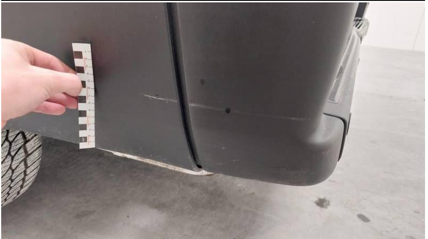
Fot. nr 55