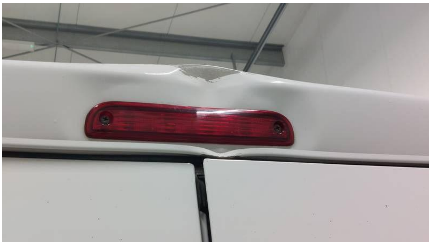
Fot. nr 58