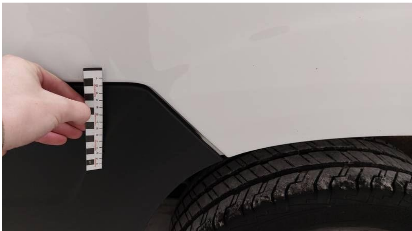
Fot. nr 48