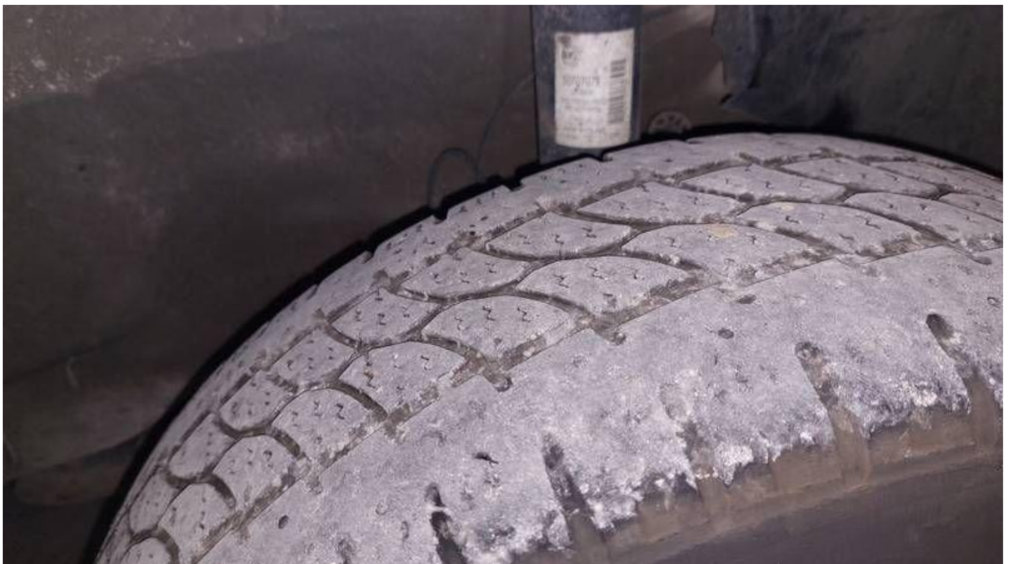
Fot. nr 76