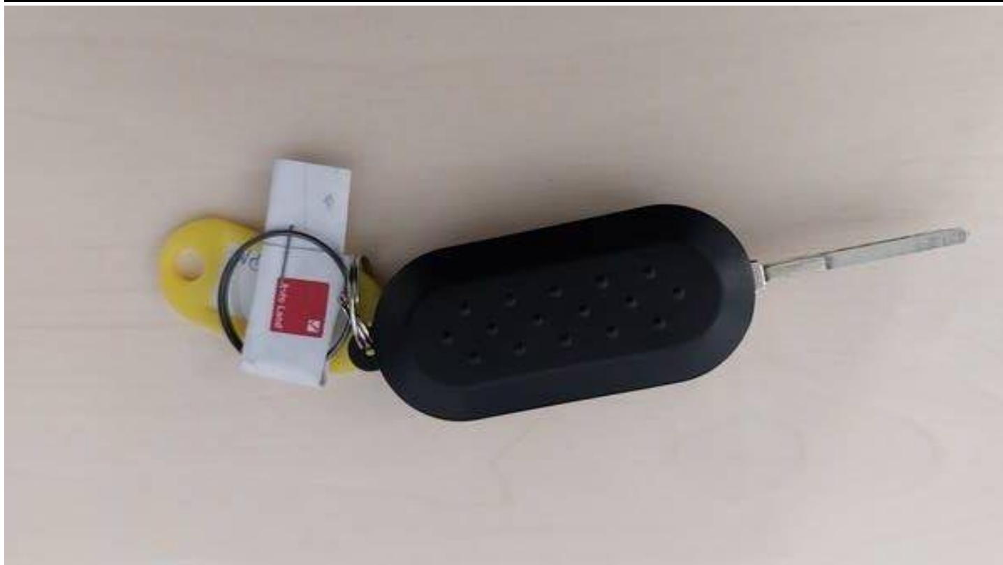
Fot. nr 83

Dokument wystawiony elektronicznie, warty bez podpisu