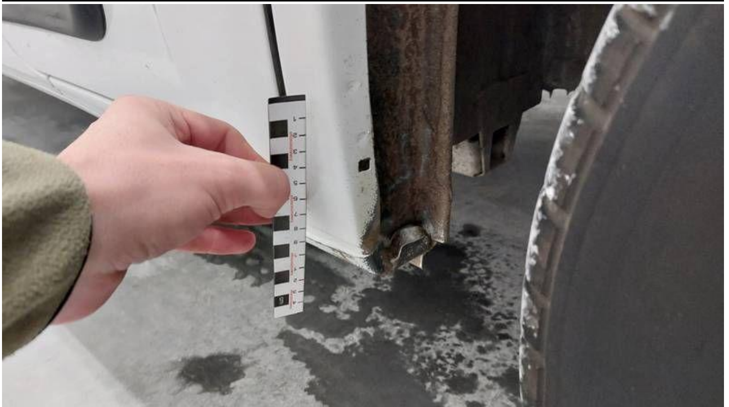
Fot. nr 51