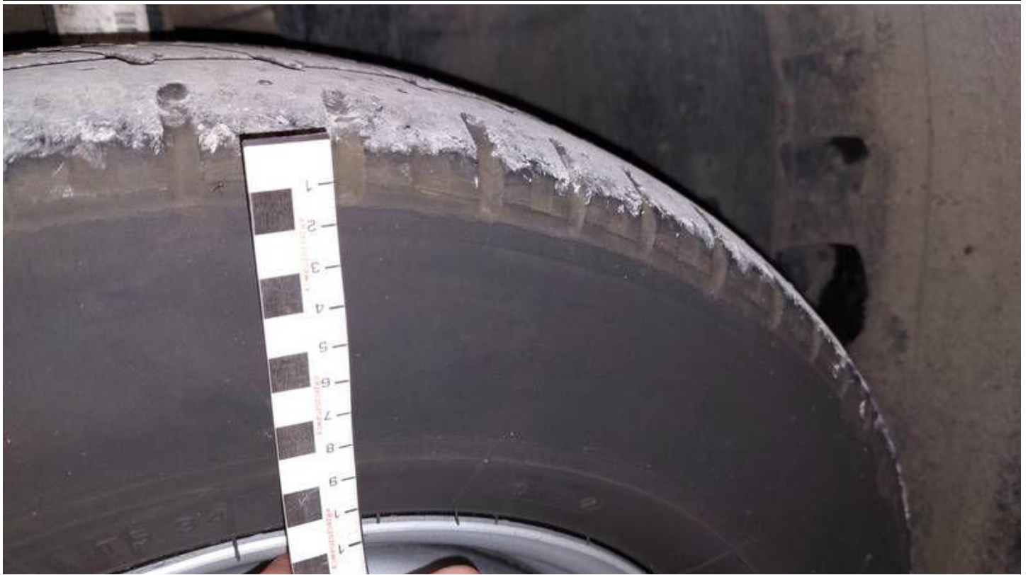
Fot. nr 75