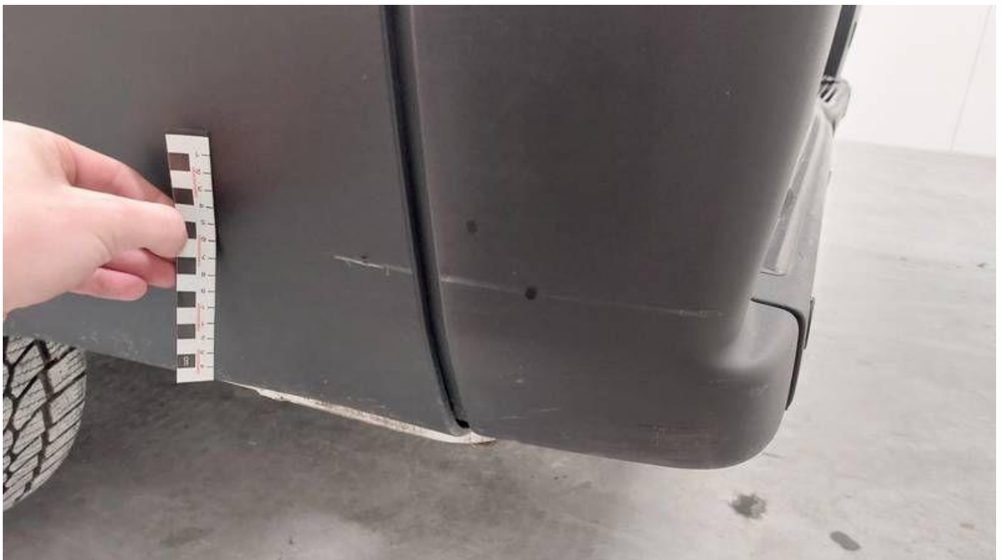
Fot. nr 56