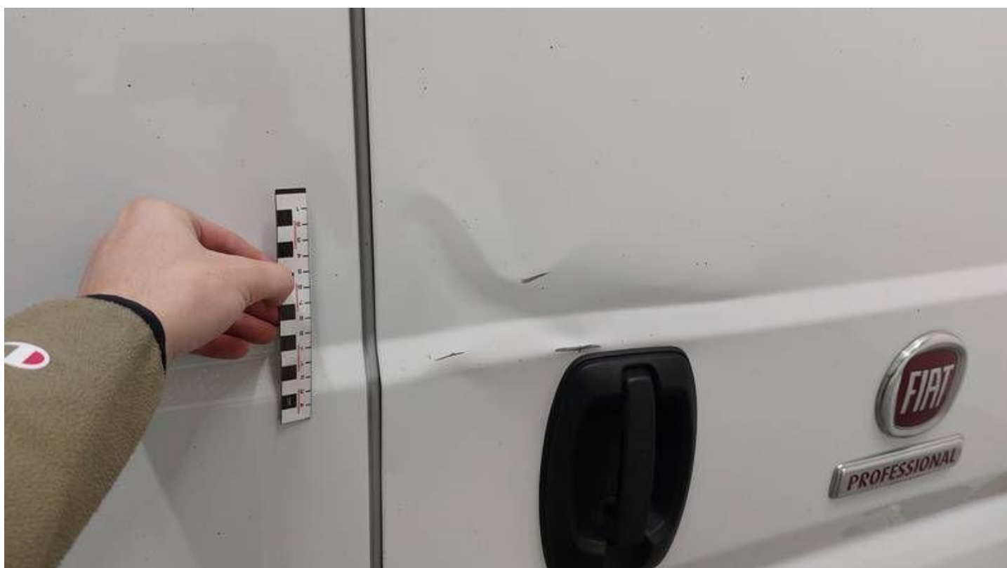
Fot. nr 62