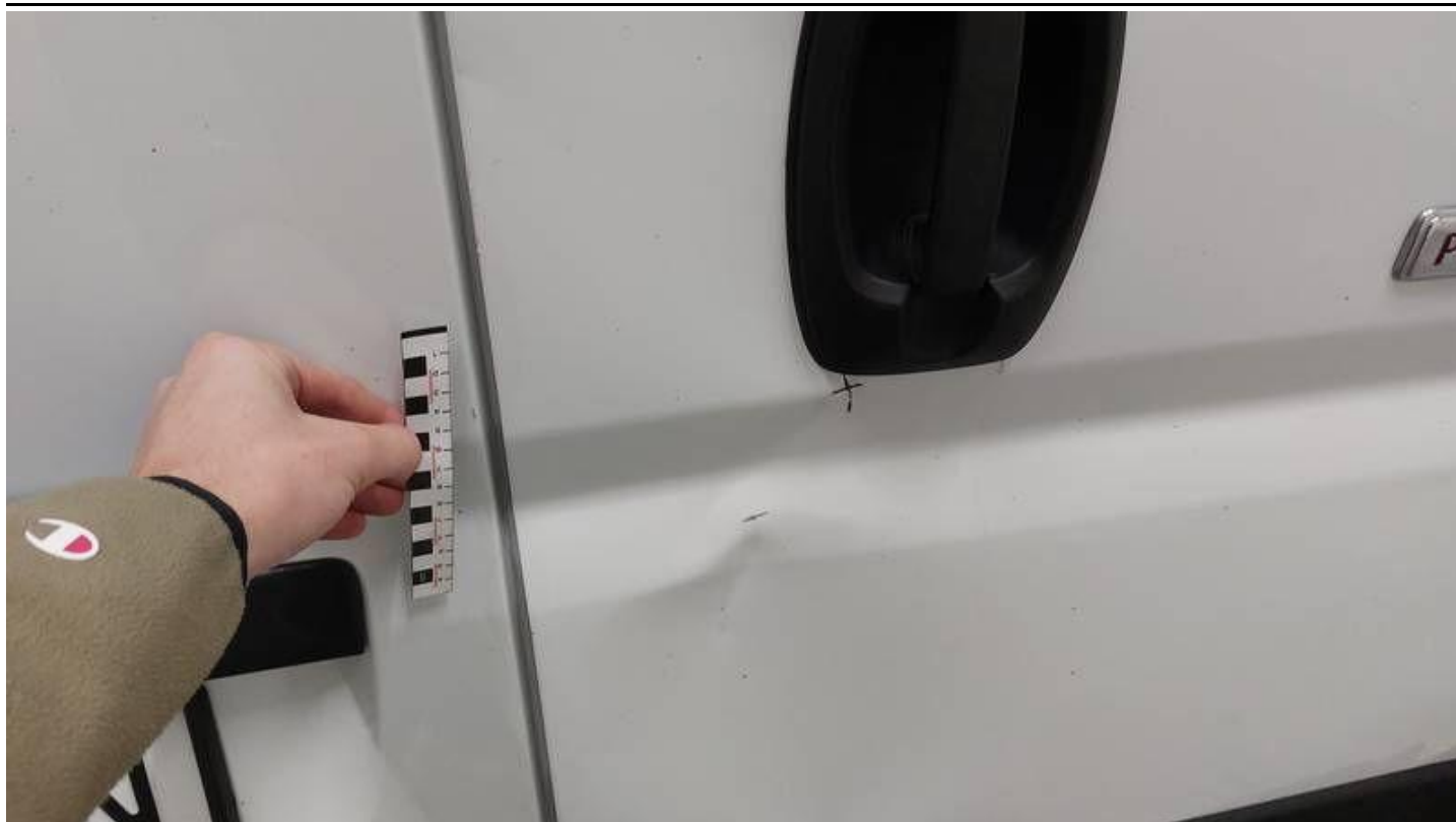
Fot. nr 61