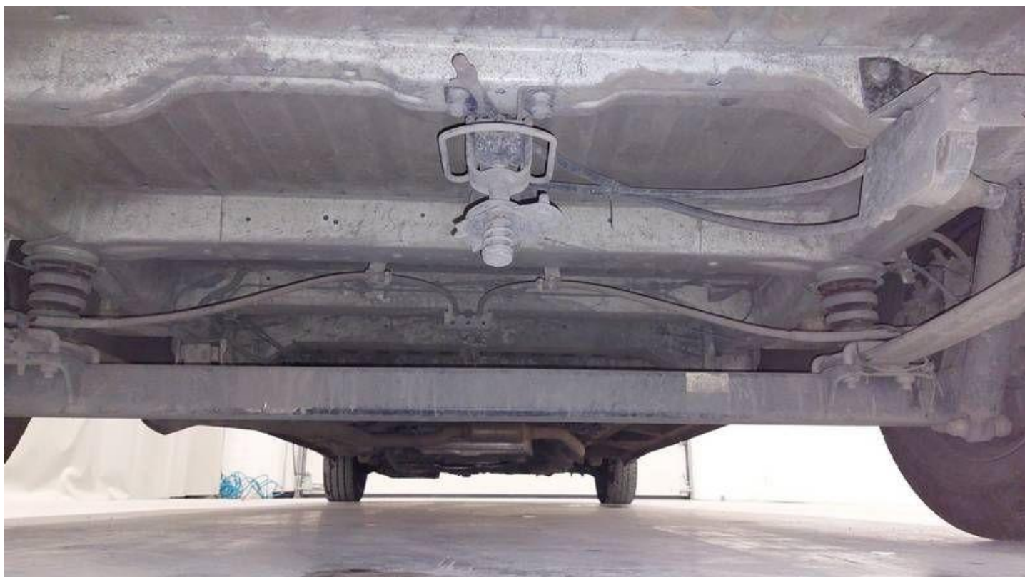
Fot. nr 70