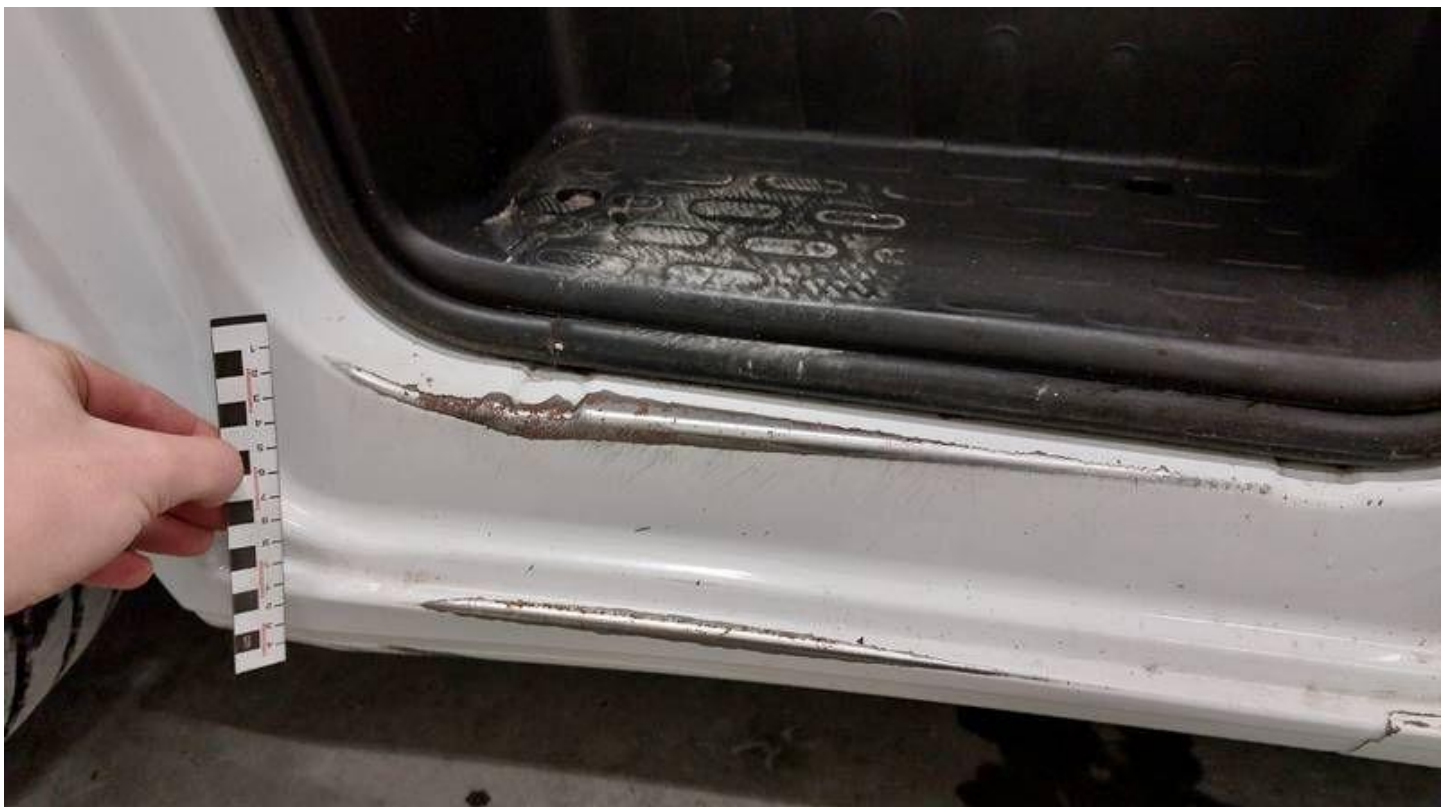
Fot. nr 54