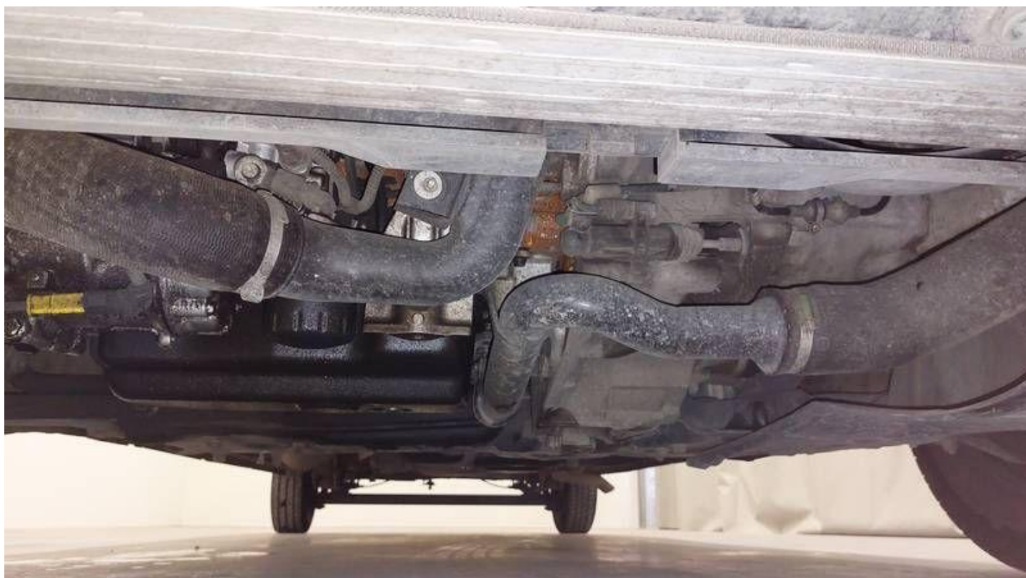
Fot. nr 64