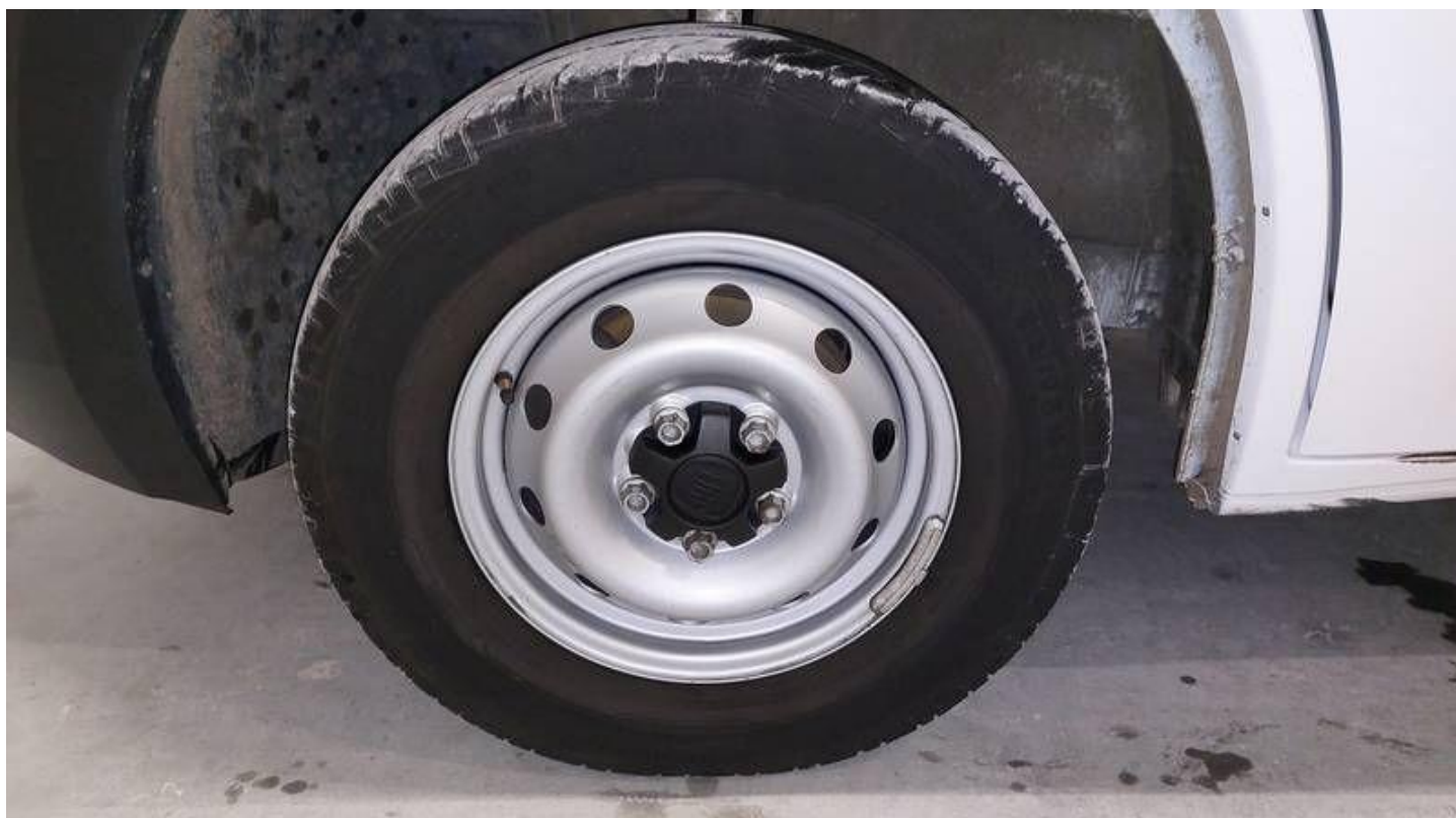
Fot. nr 72