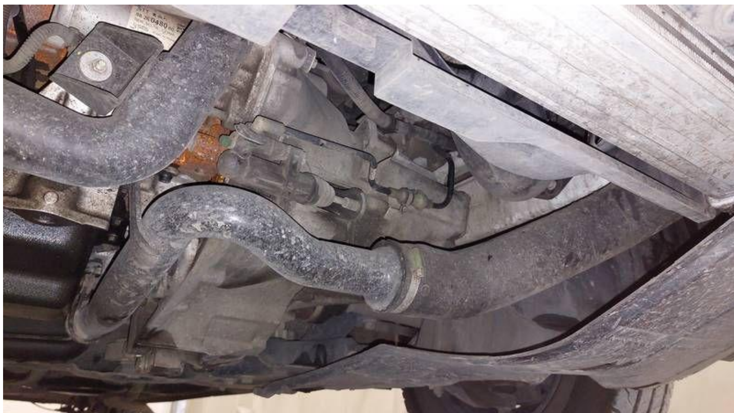
Fot. nr 66