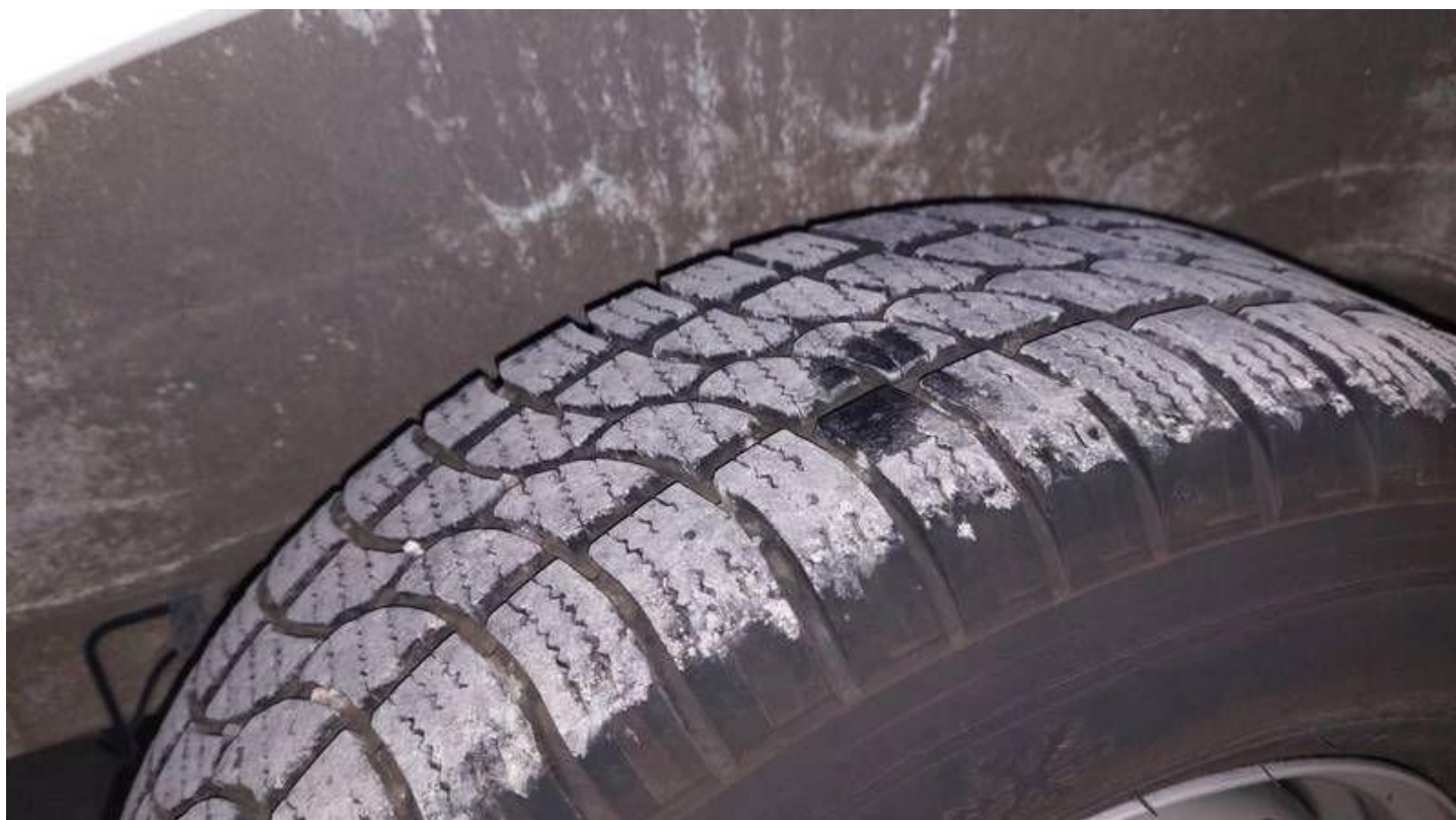
Fot. nr 78