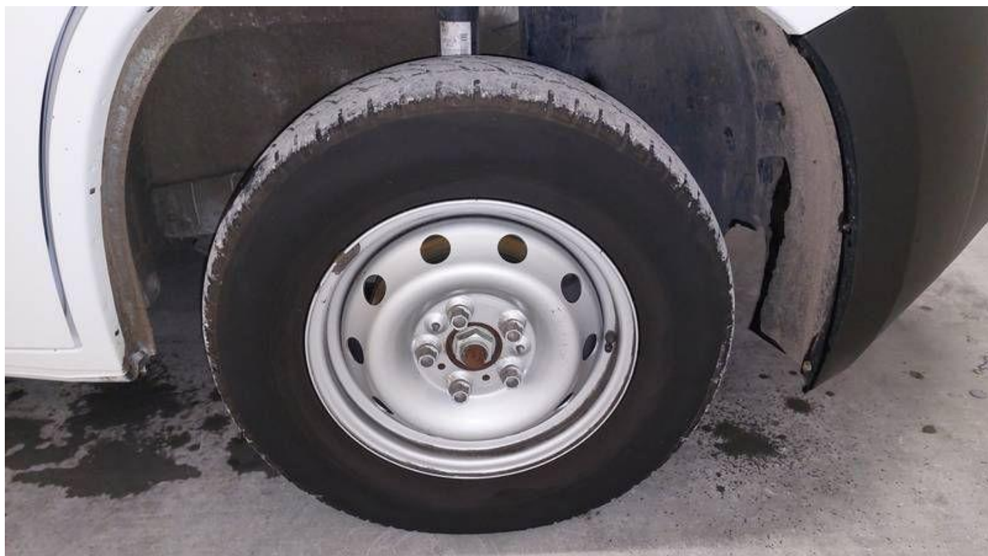
Fot. nr 74