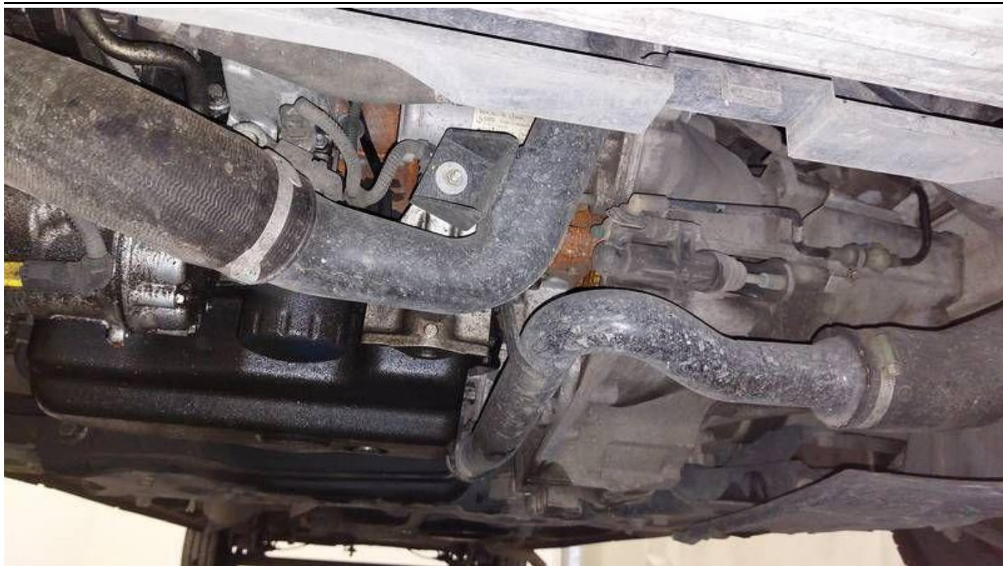
Fot. nr 67