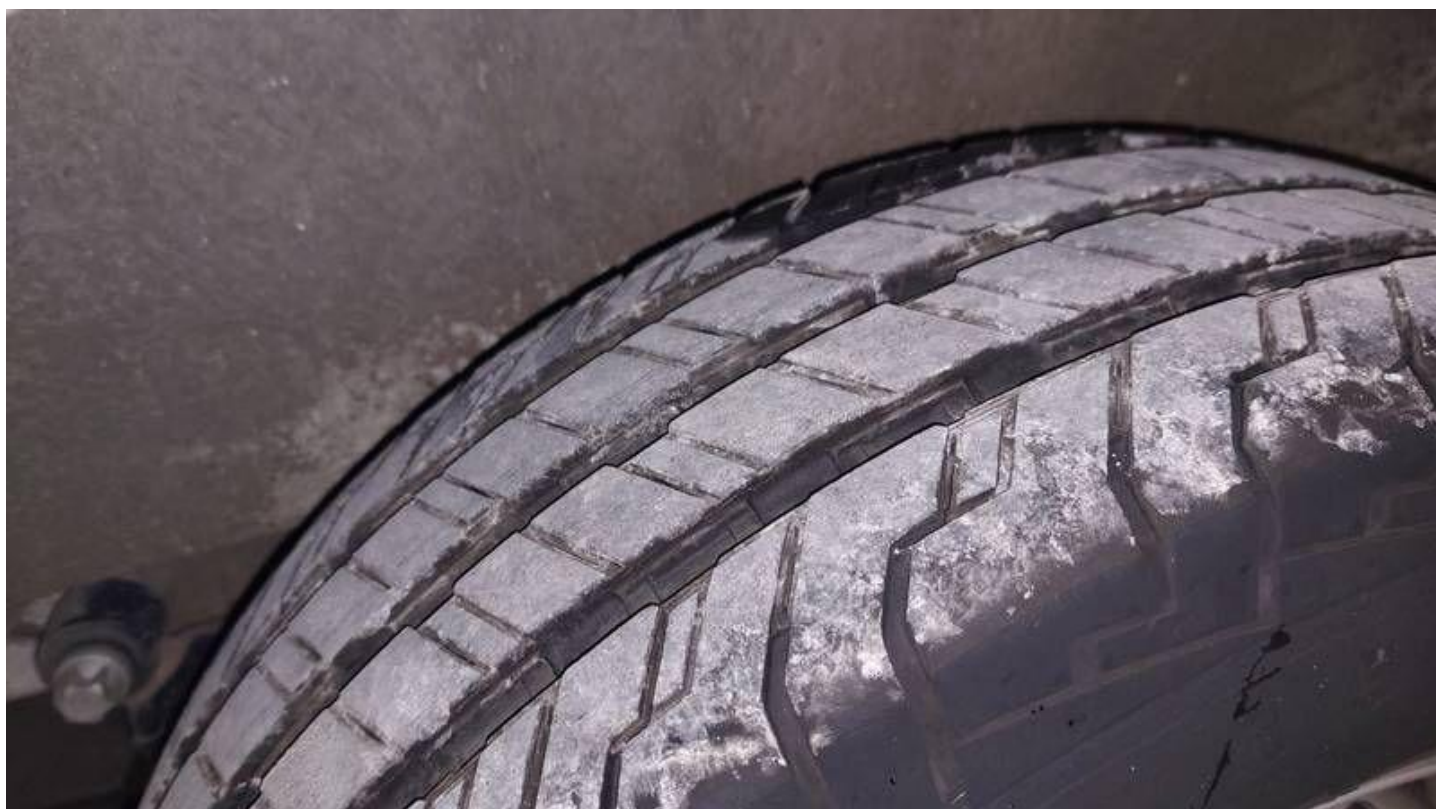
Fot. nr 80