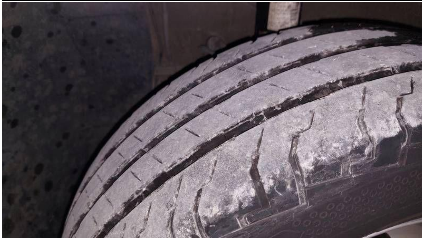
Fot. nr 73