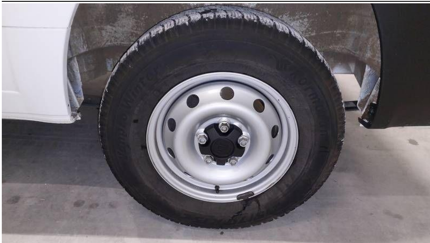
Fot. nr 77