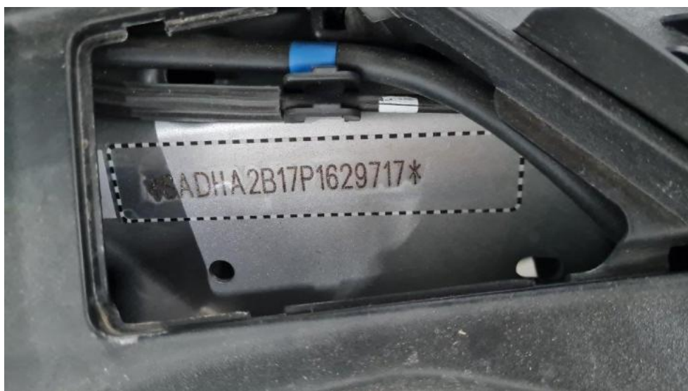
Fot. 7. Pole numerowe