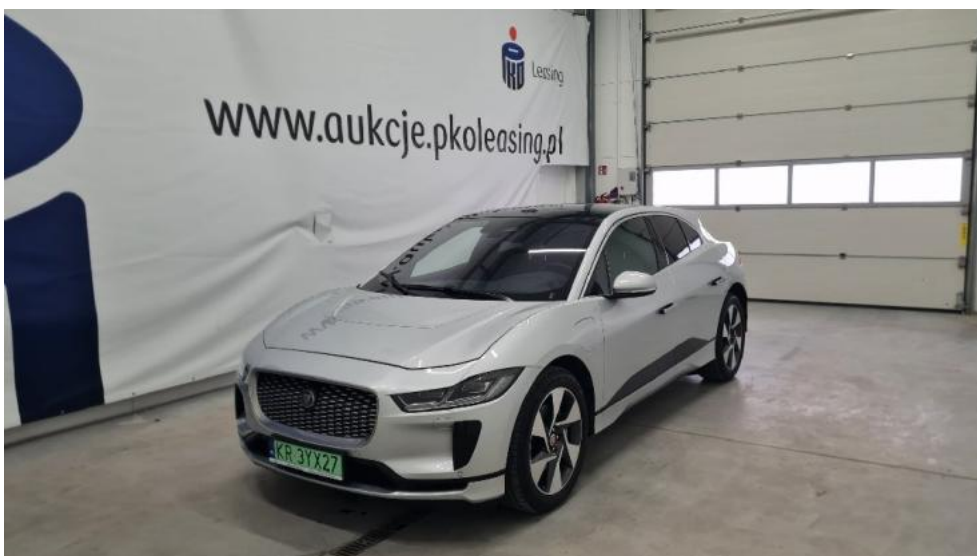
Fot. 6. Lewy bok przód