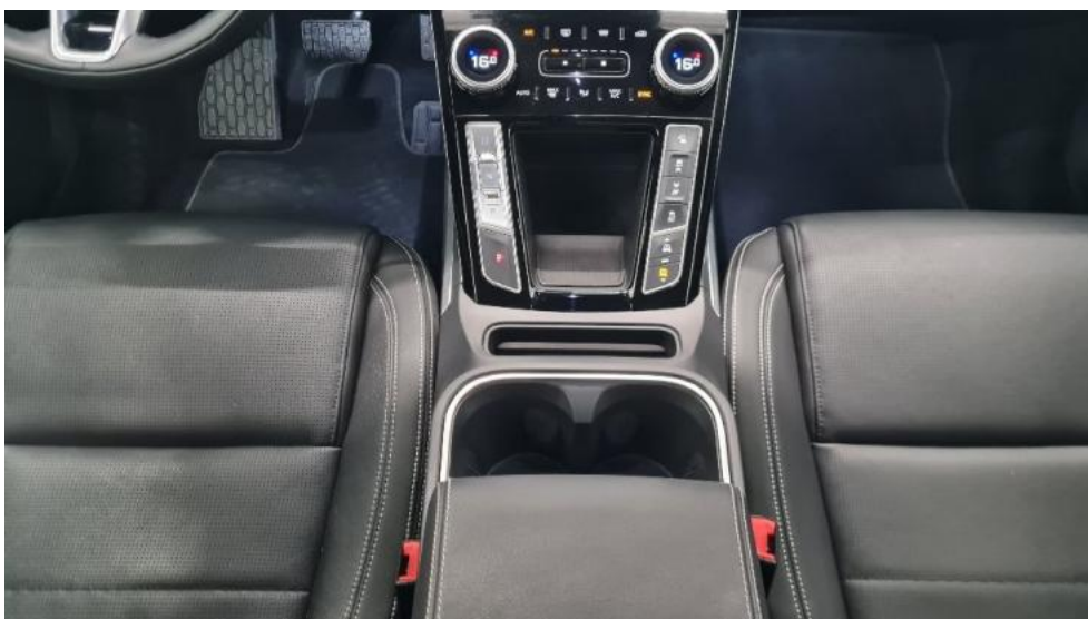
Fot. 14. Tunel środkowy