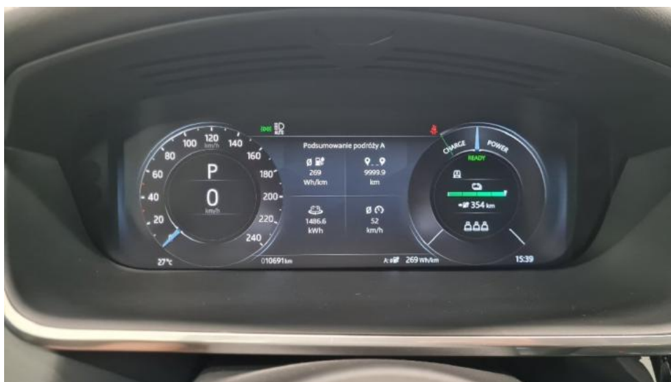
Fot. 9. Wskaźniki /przebieg/paliwo