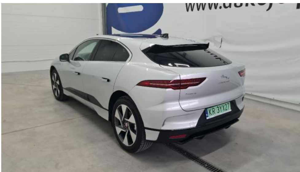
Fot. 5. Lewy bok tył