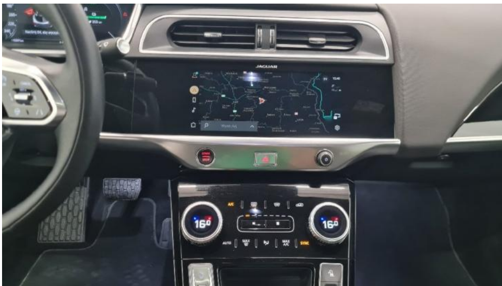
Fot. 13. Konsola środkowa