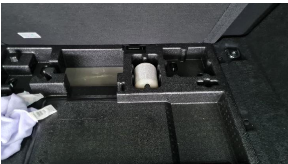
Fot. 18. Koło zapasowe/trójkąt/gaśnica