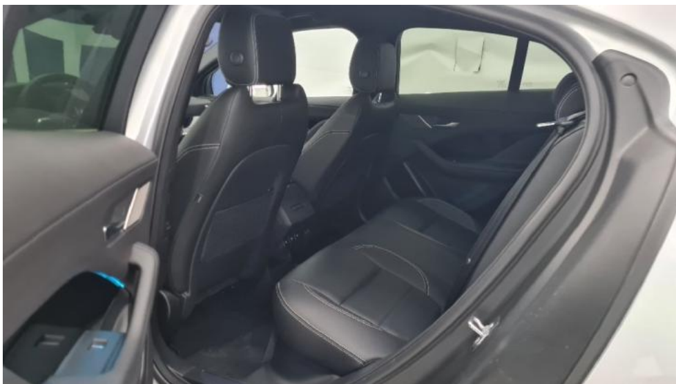
Fot. 11. Widok przez lewe tylne drzwi