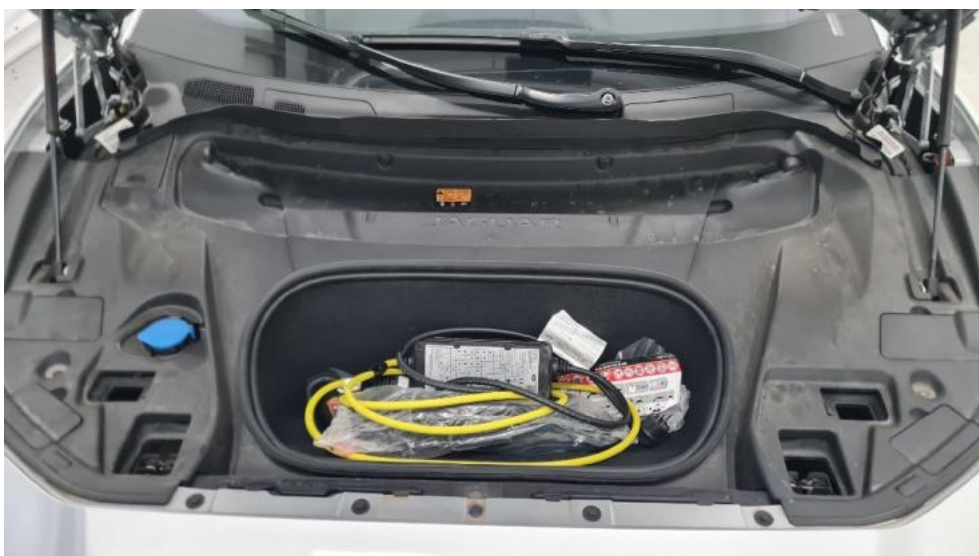
Fot. 16. Komora silnika