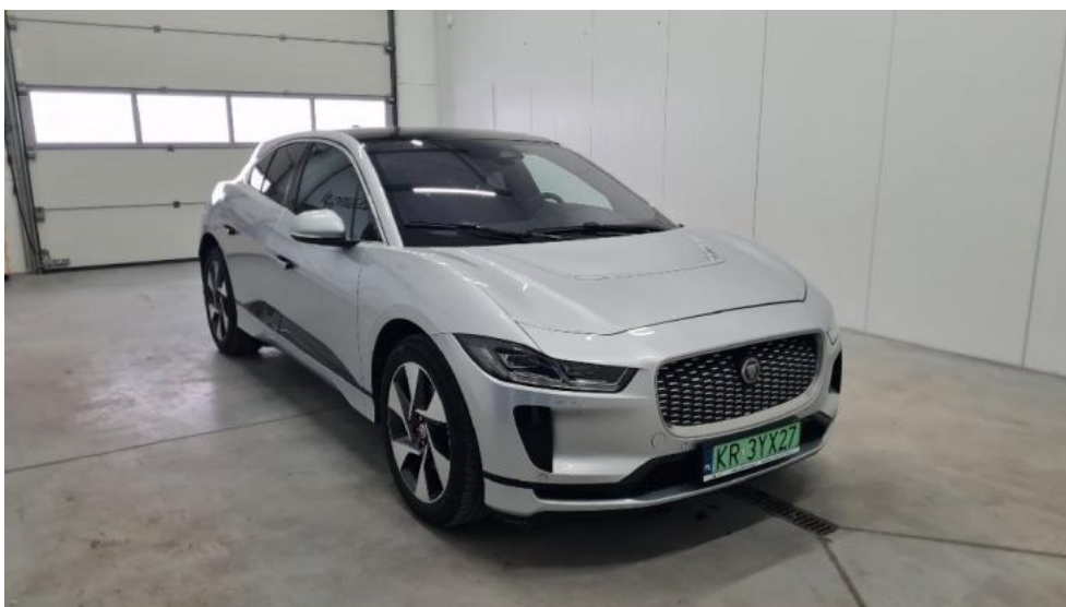
Fot. 2. Prawy bok przód