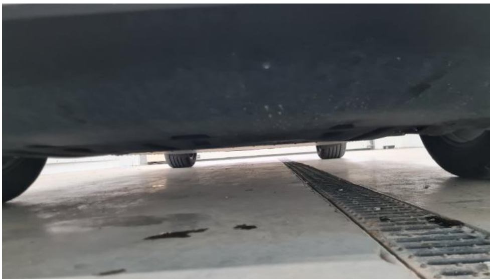
Fot. 19. Spód pojazdu przód