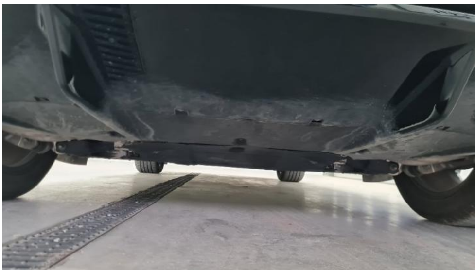
Fot. 20. Spód pojazdu tył