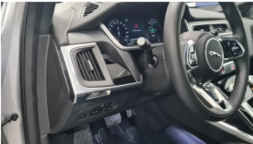
Fot. 15. Kierownica widok z lewej strony (widoczne przełączniki)