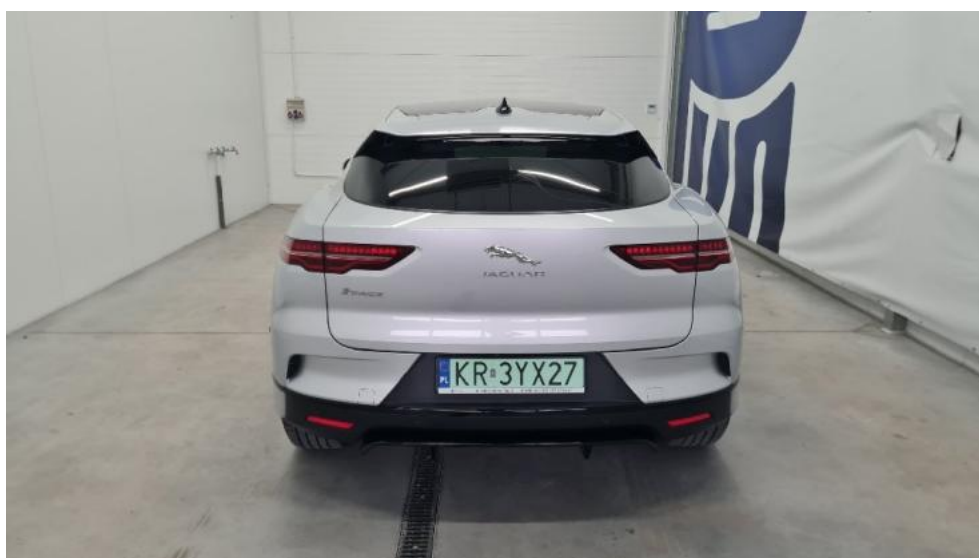
Fot. 4. Tył