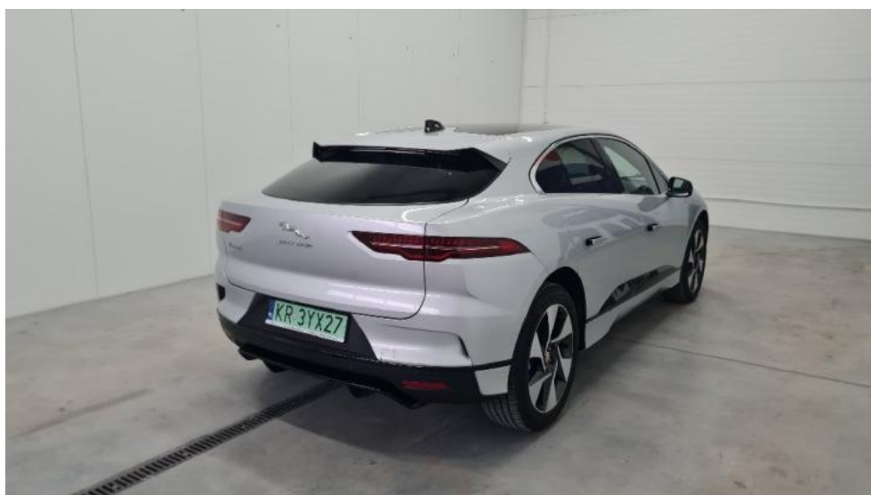
Fot. 3. Prawy bok tył