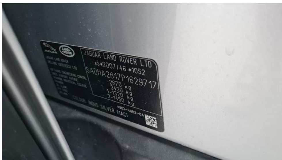
Fot. 8. Tabliczka