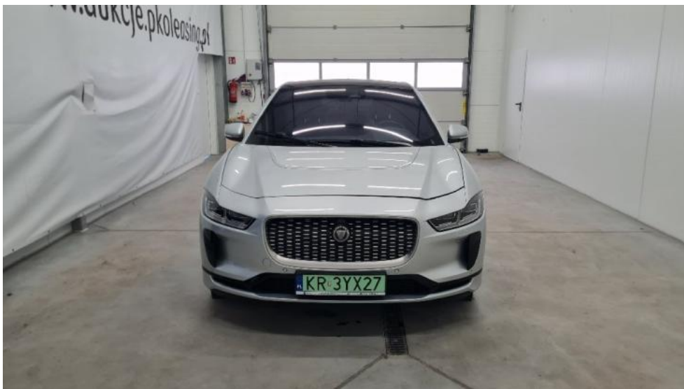
Fot. 1. Przód