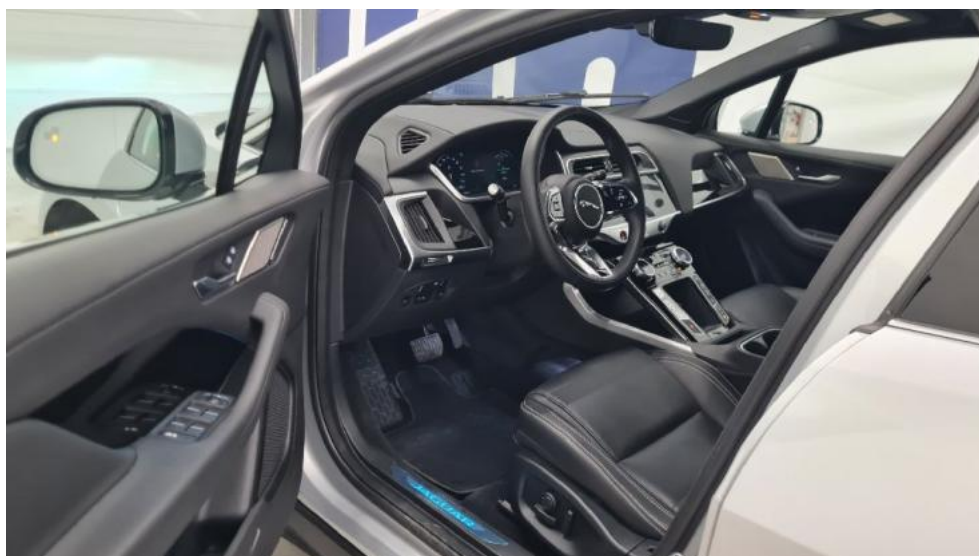
Fot. 10. Widok przez lewe przednie drzwi