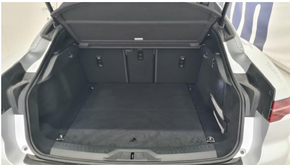
Fot. 17. Bagażnik