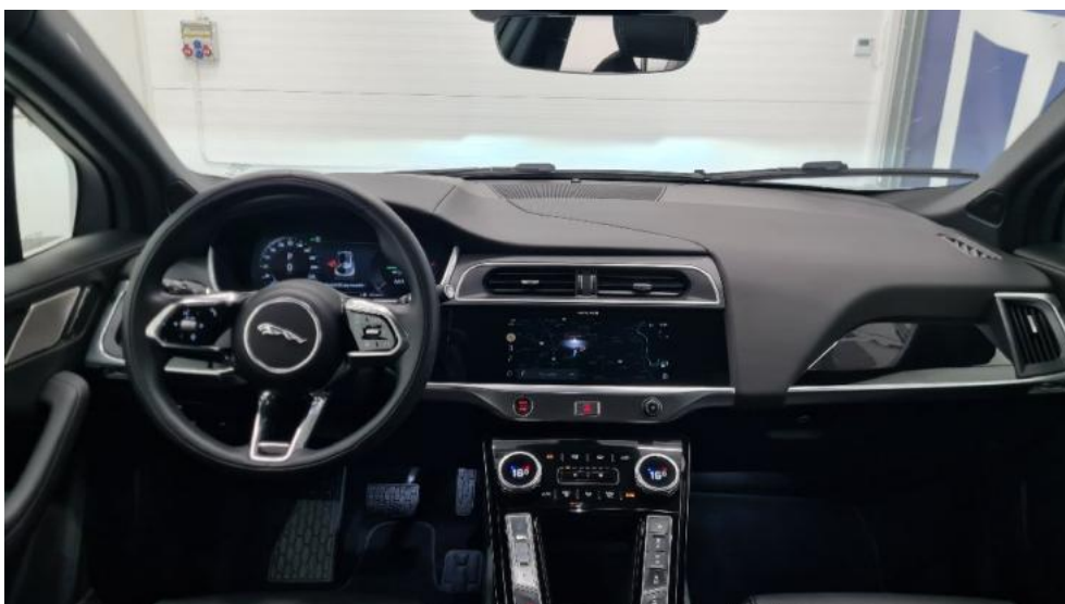
Fot. 12. Widok z tylnego siedzenia