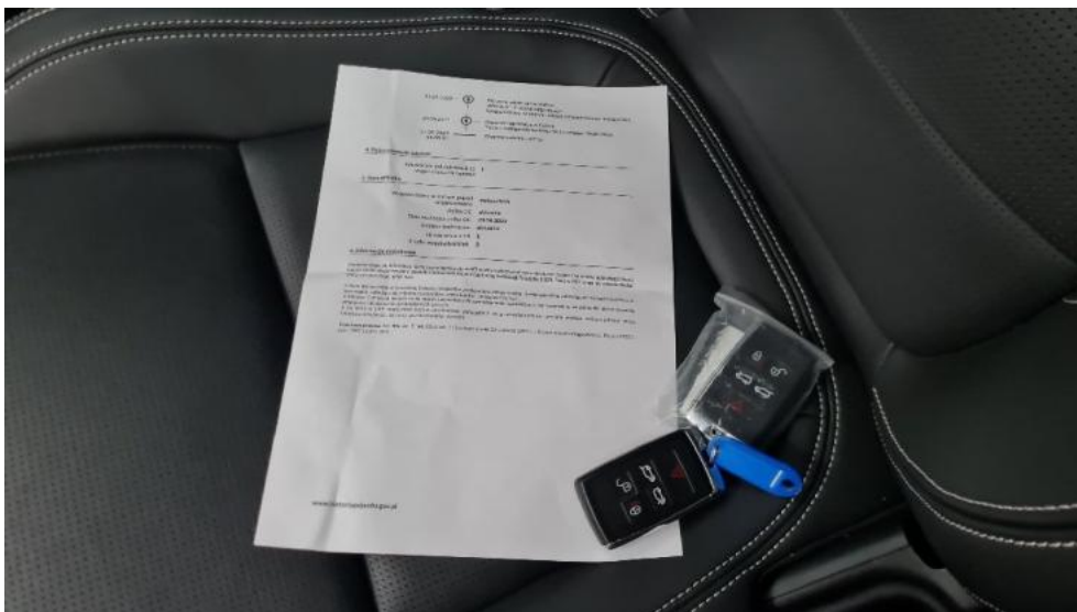
Fot. 22. Dowód rejestracyjny 2. strona / klucze