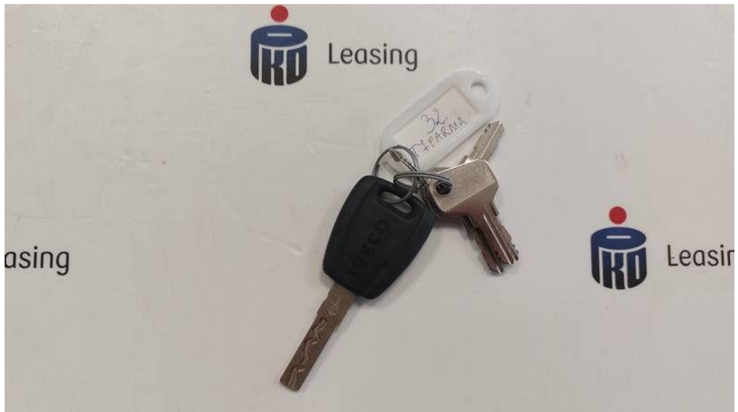
Fot. nr 64

Dokument wystawiony elektronicznie, w a ny bez podpisu