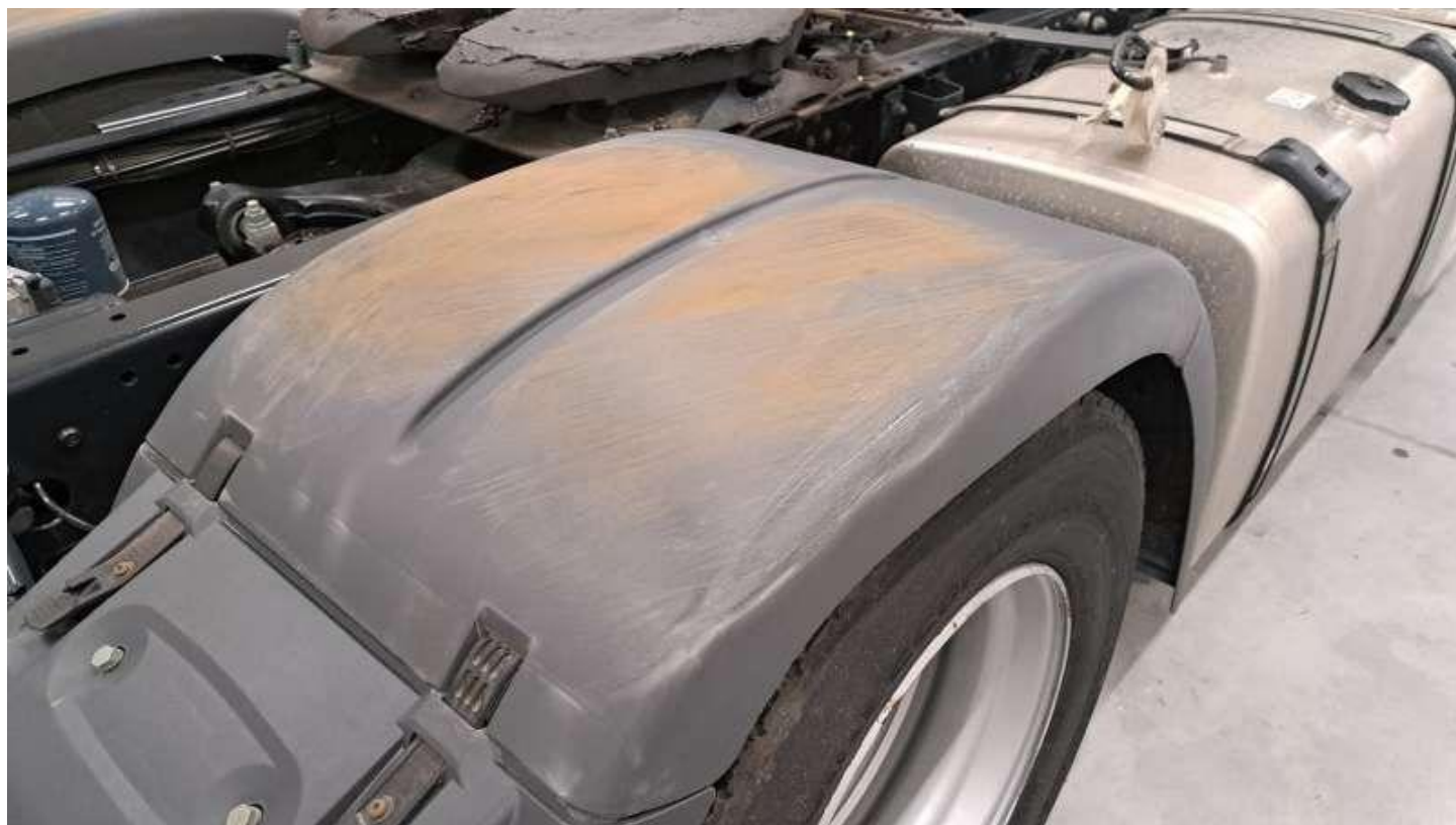
Fot. nr 52