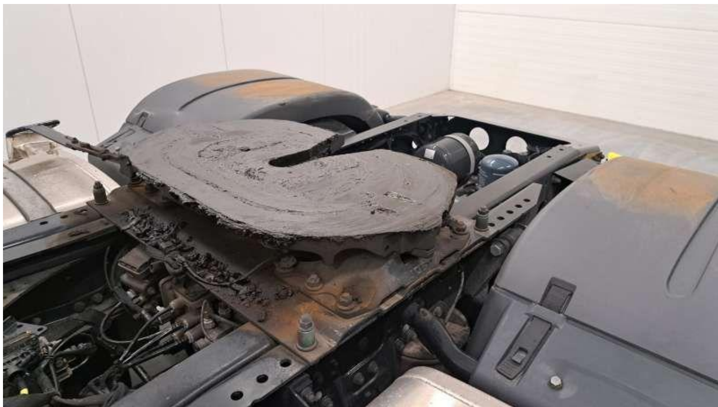
Fot. nr 48