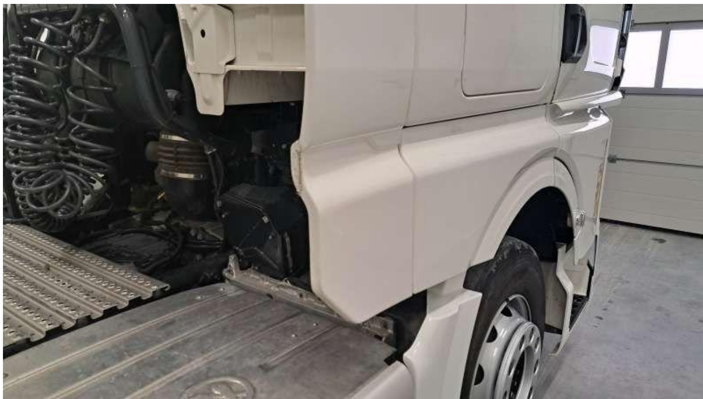
Fot. nr 56