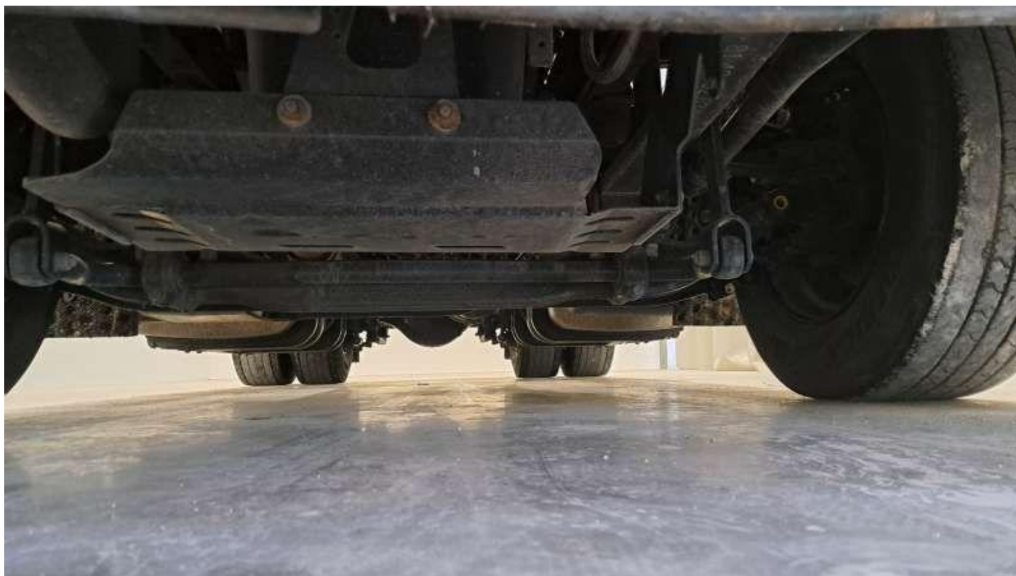
Fot. nr 58