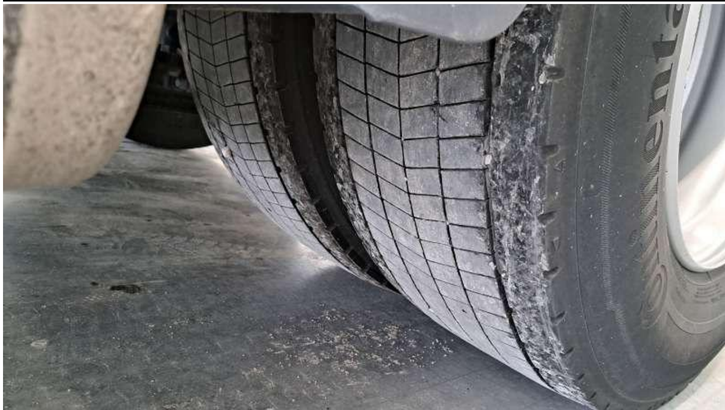
Fot. nr 67