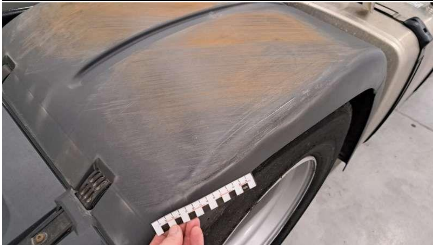
Fot. nr 53