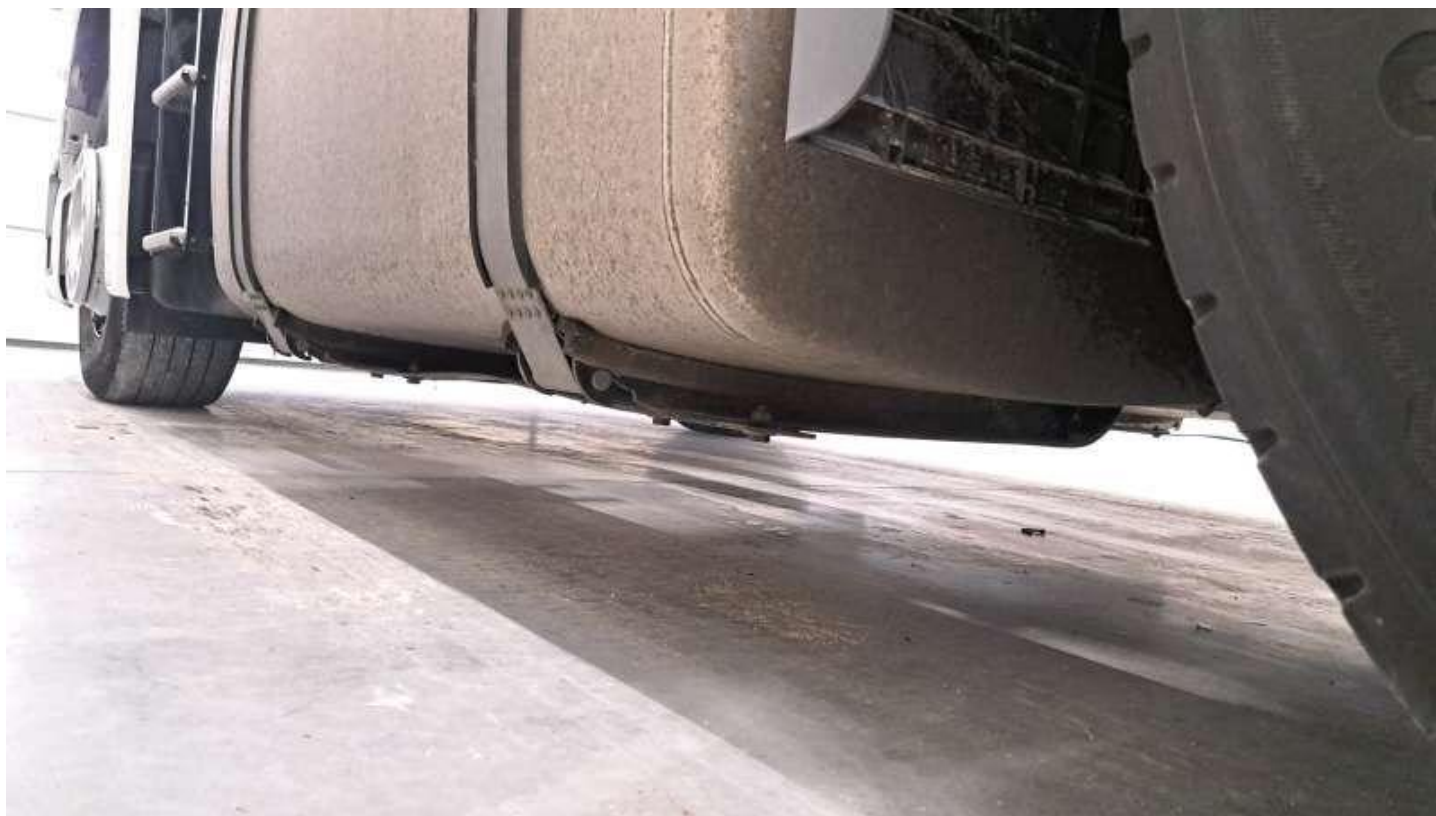
Fot. nr 62