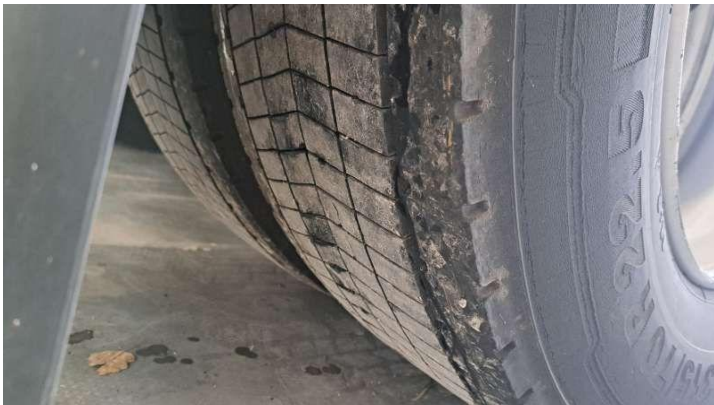
Fot. nr 68