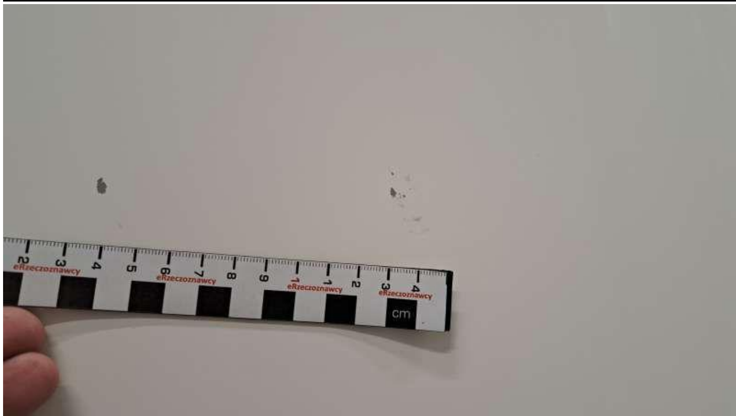
Fot. nr 39