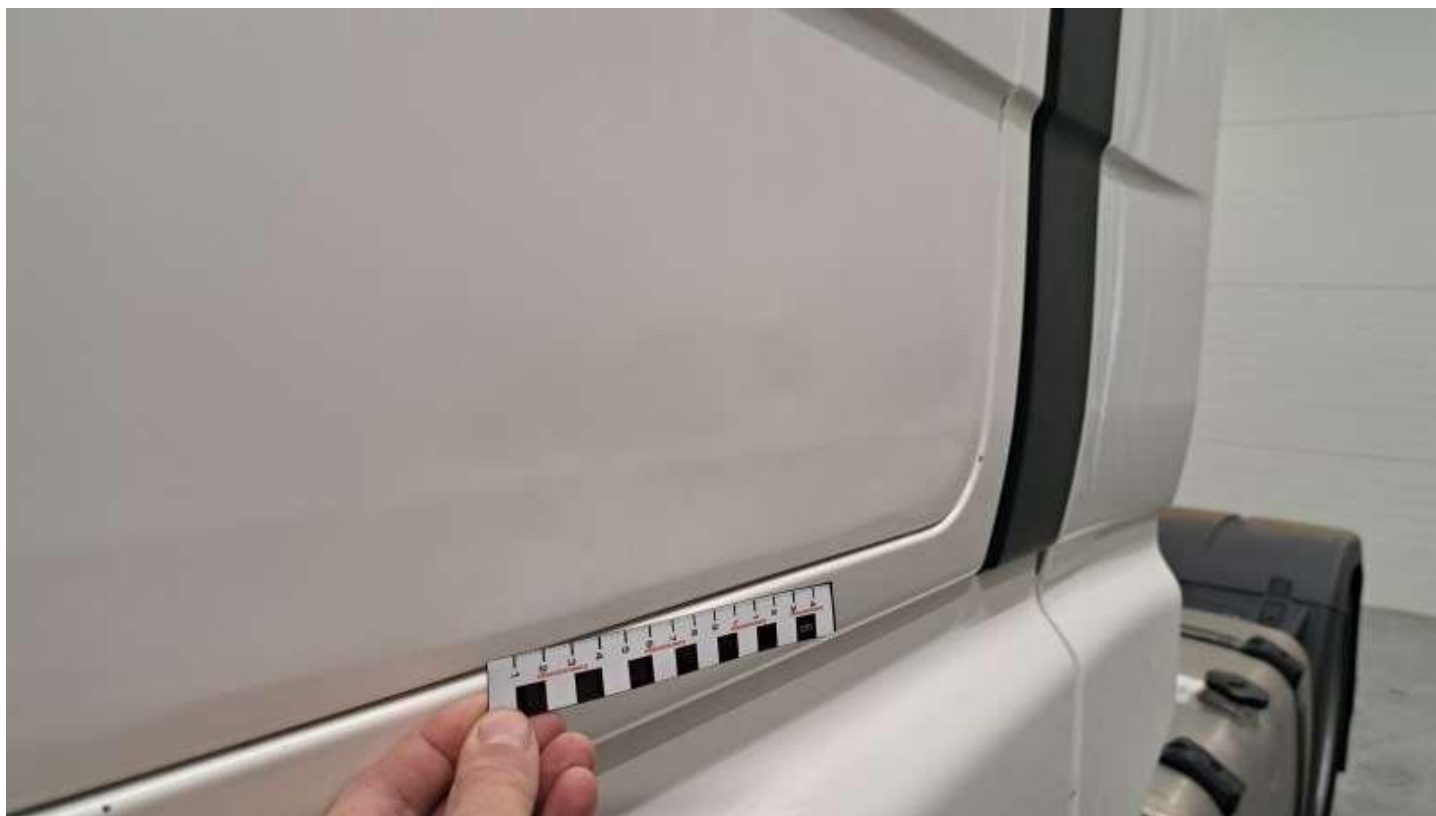
Fot. nr 42