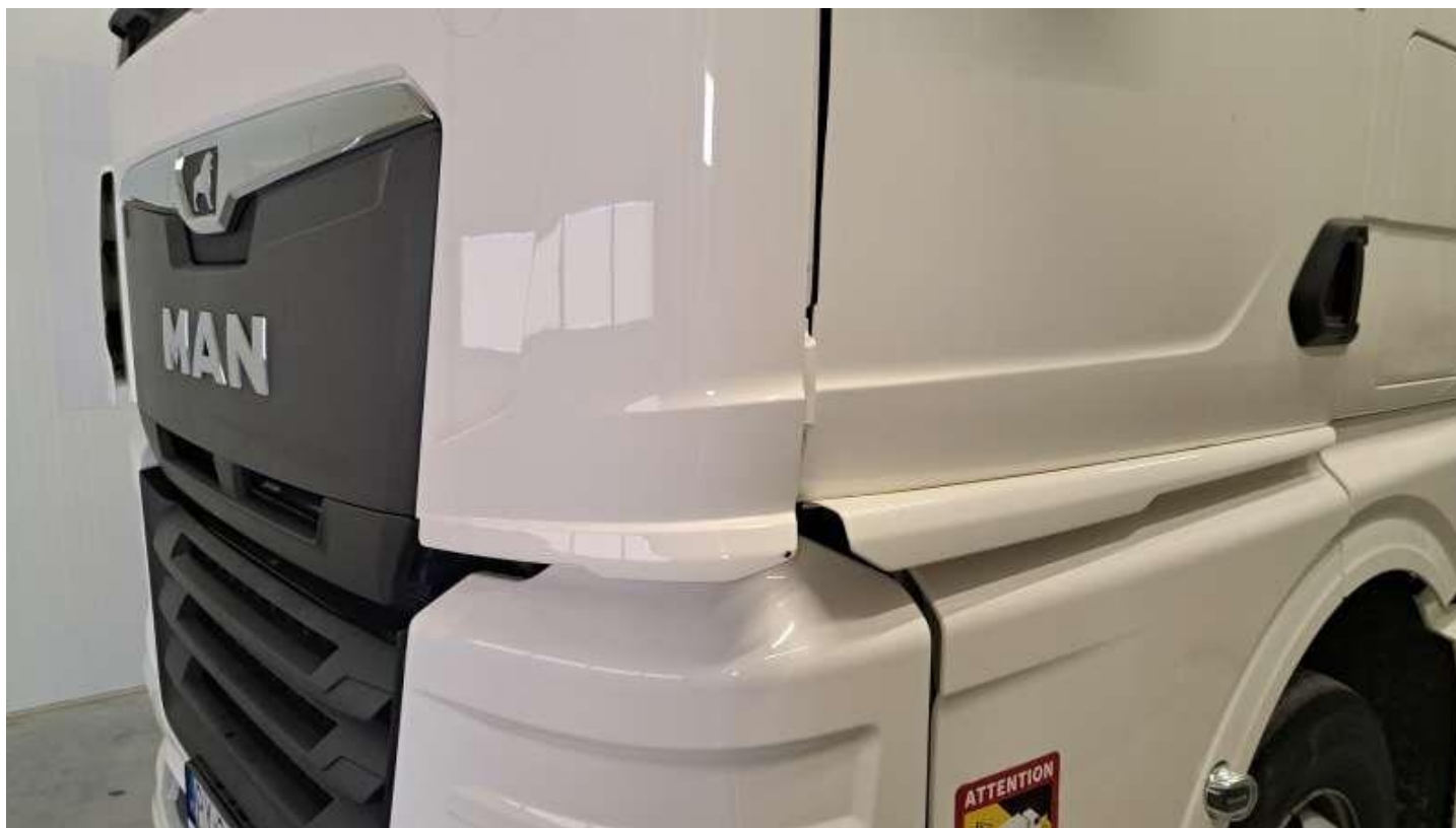
Fot. nr 36