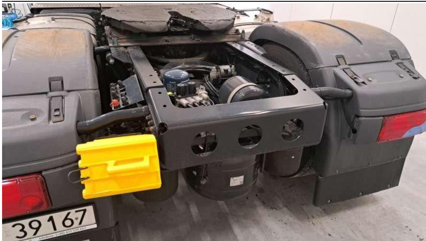
Fot. nr 51