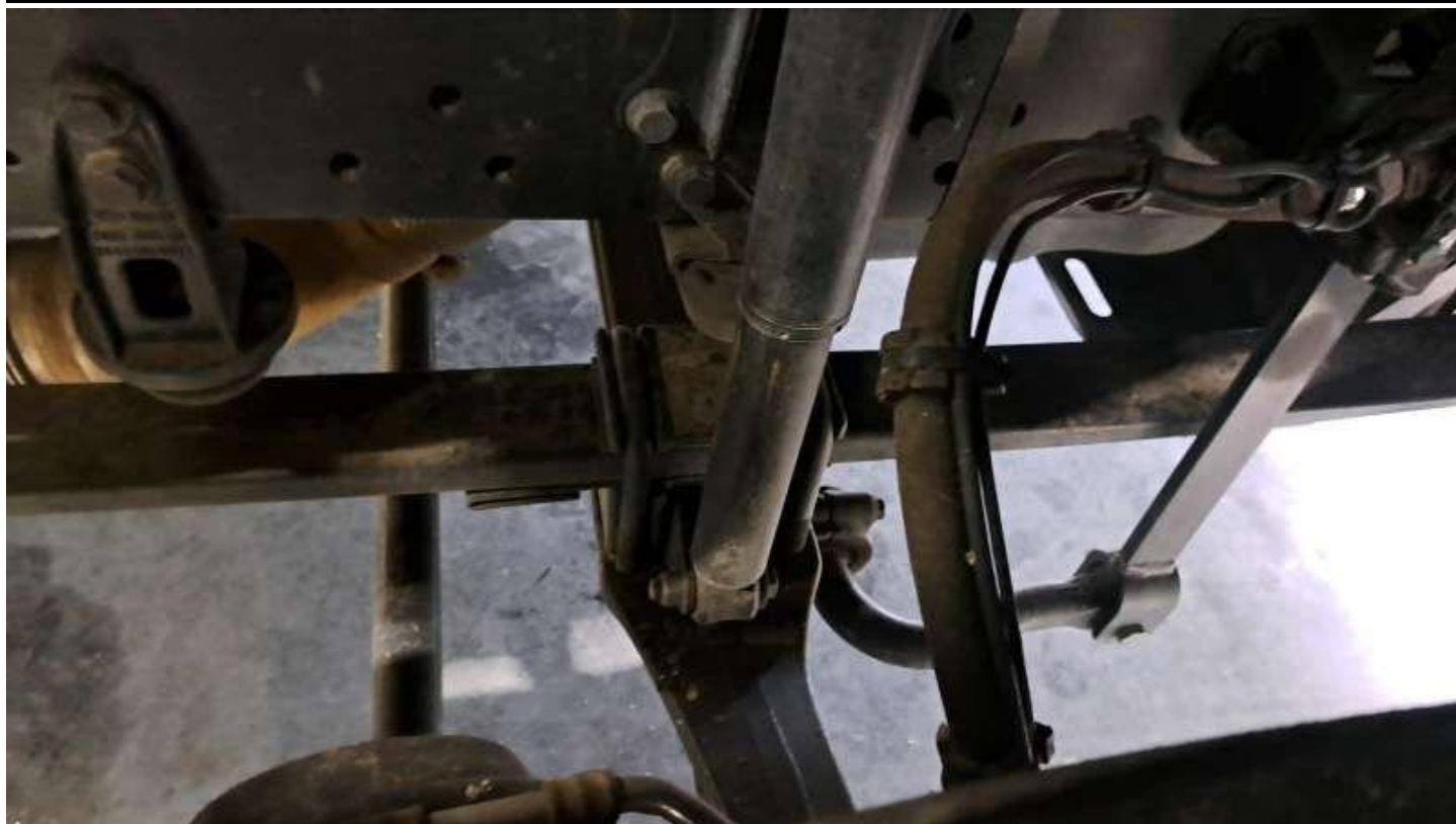
Fot. nr 59