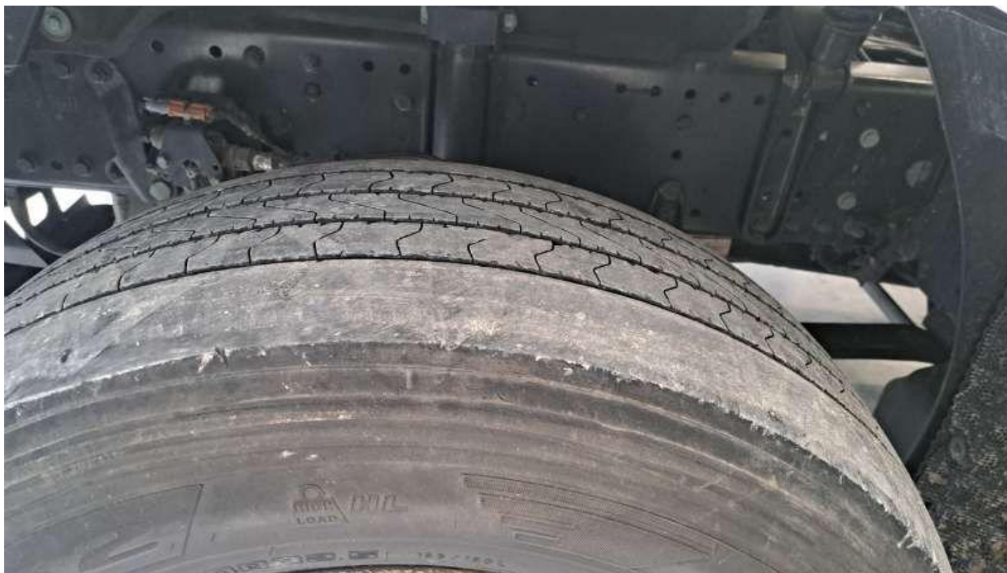
Fot. nr 66