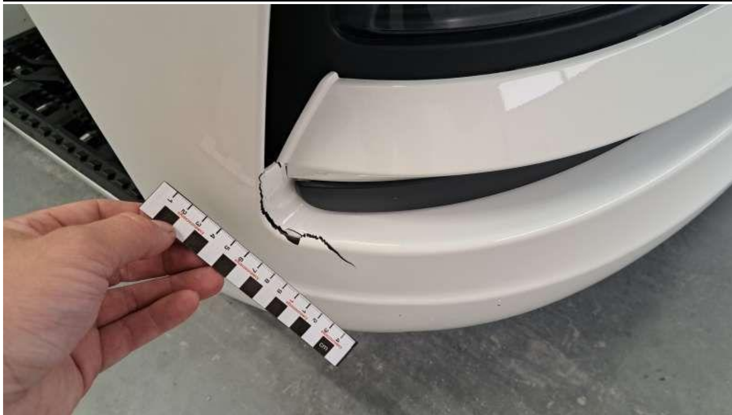
Fot. nr 35