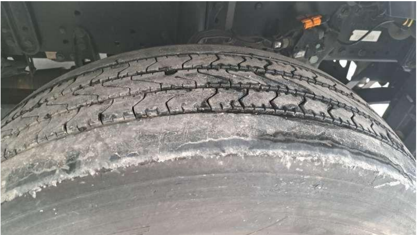
Fot. nr 69