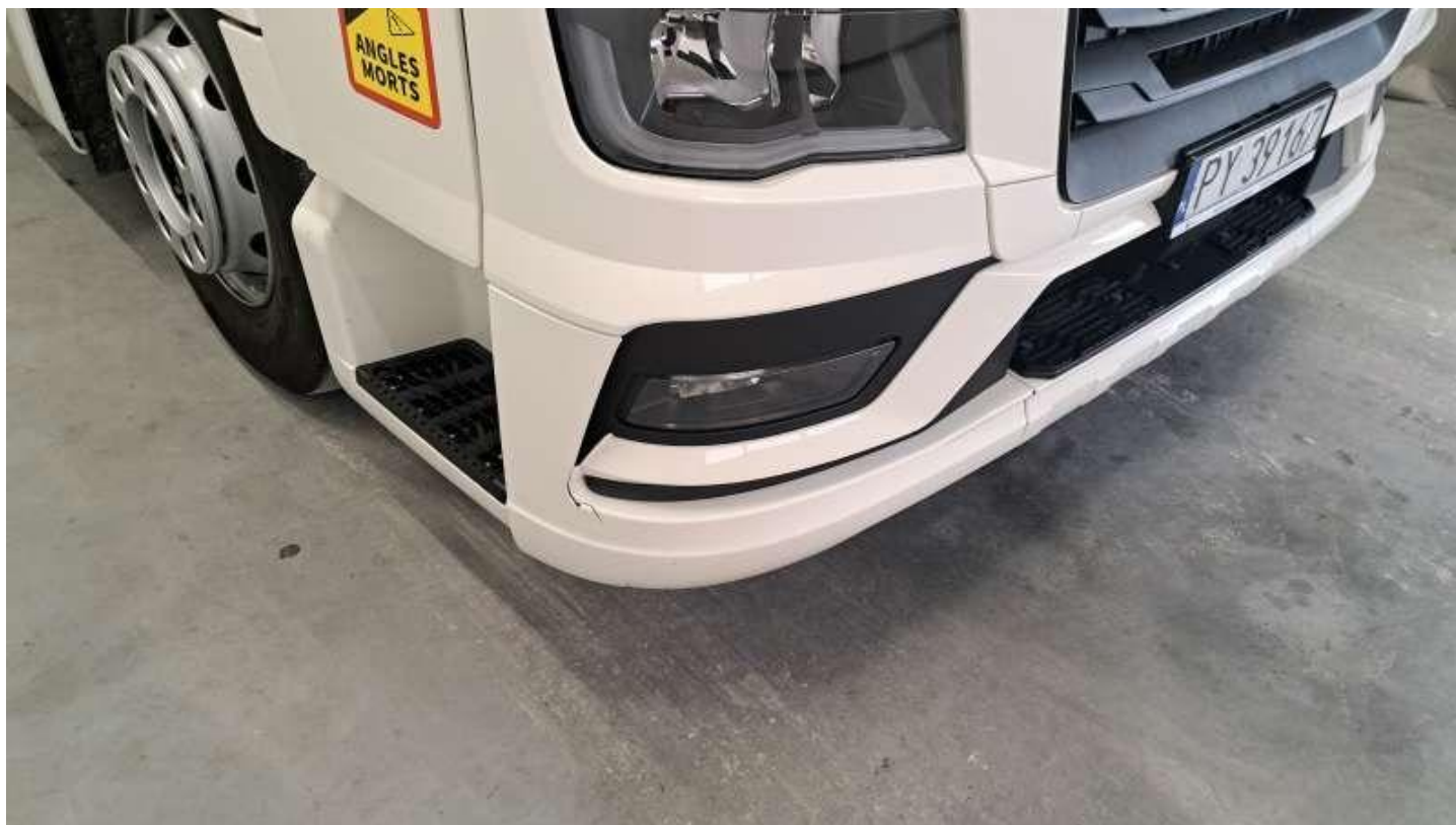
Fot. nr 34