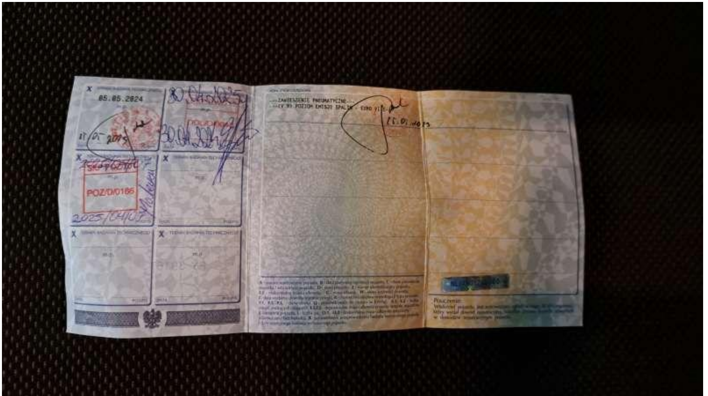
Fot. nr 72