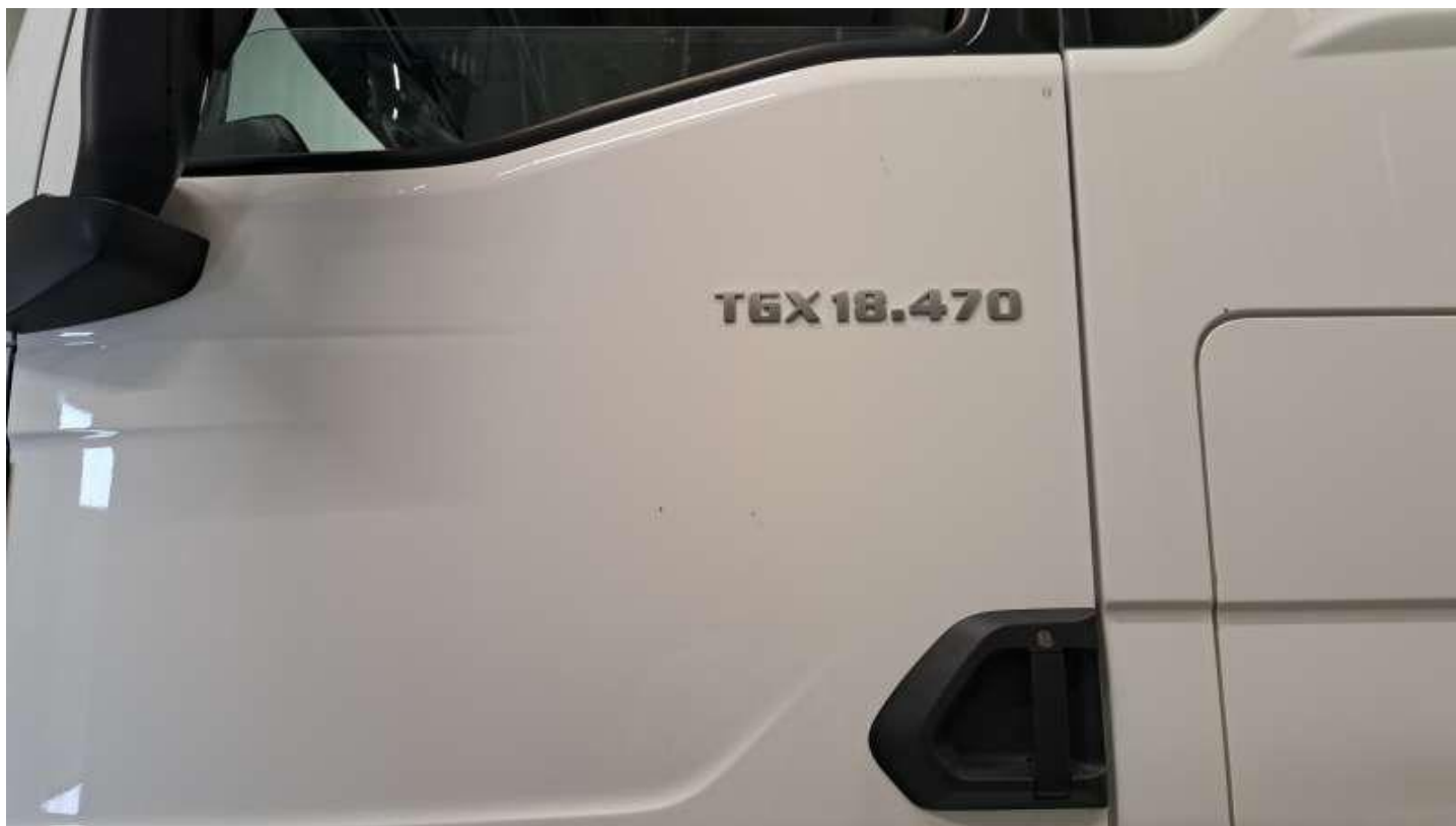
Fot. nr 38