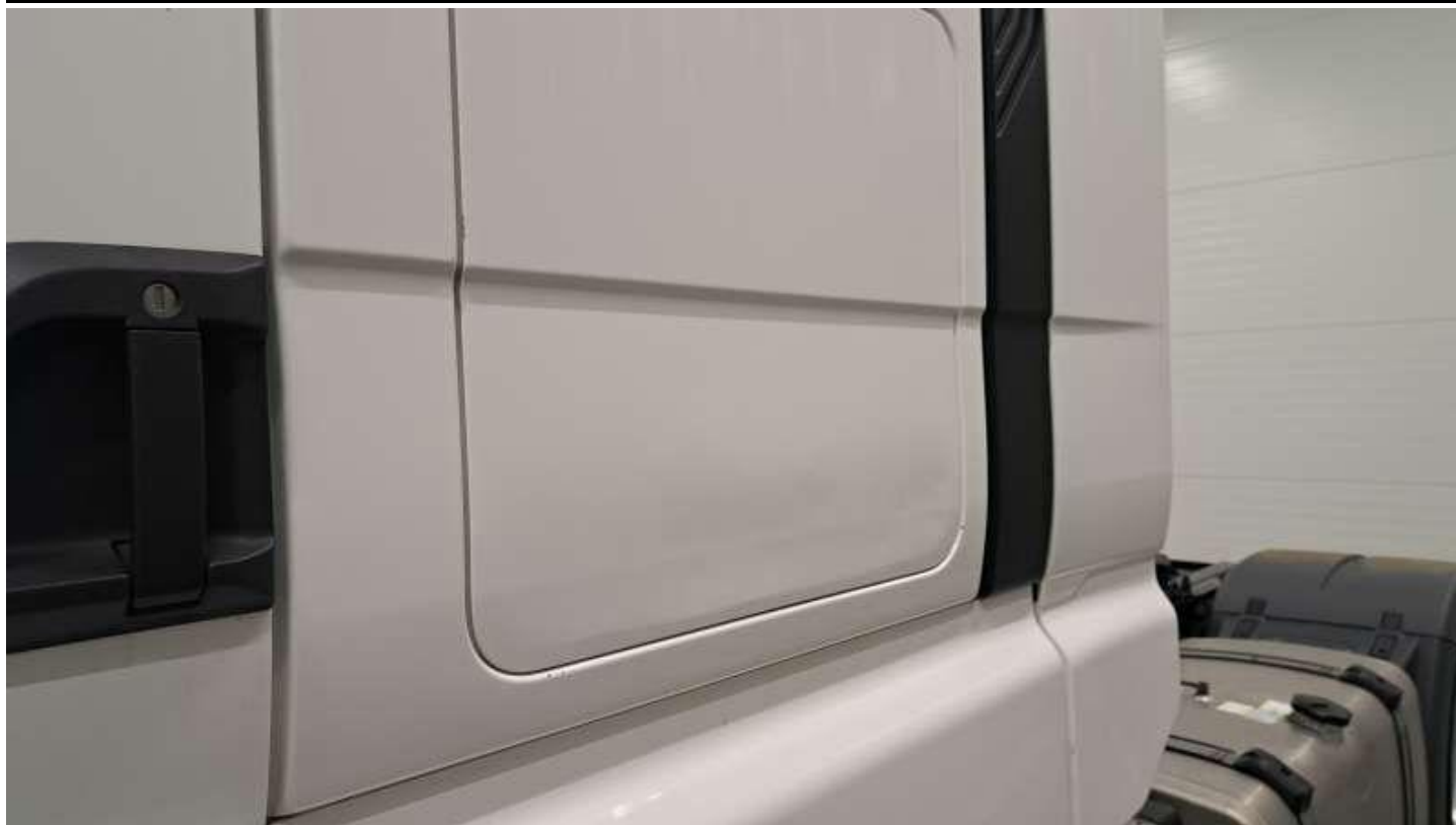
Fot. nr 41