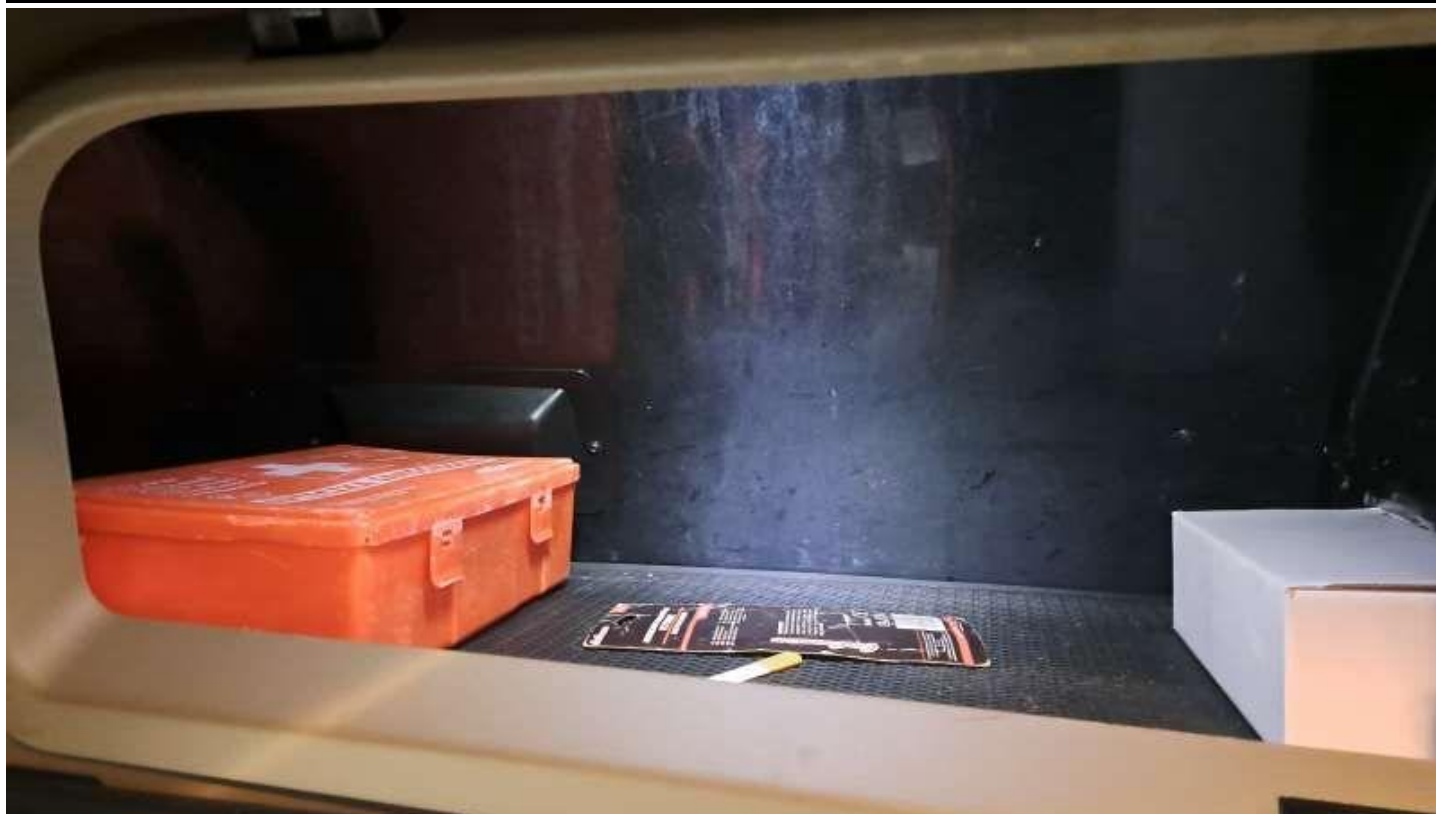
Fot. nr 63