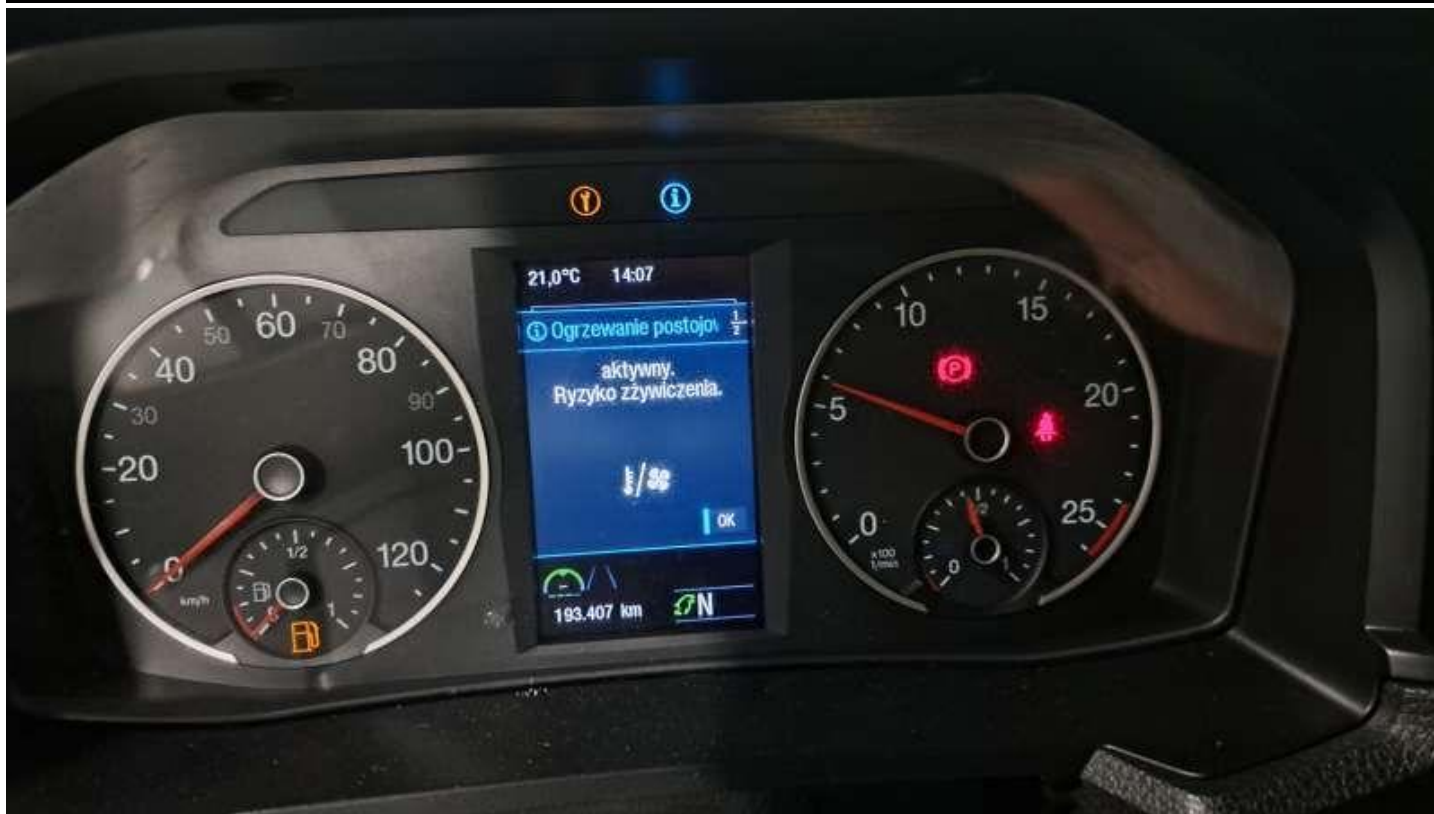
Fot. nr 65