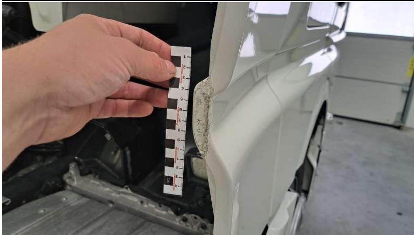
Fot. nr 57