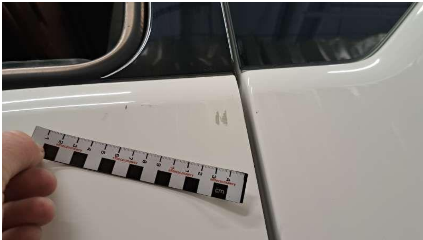
Fot. nr 40