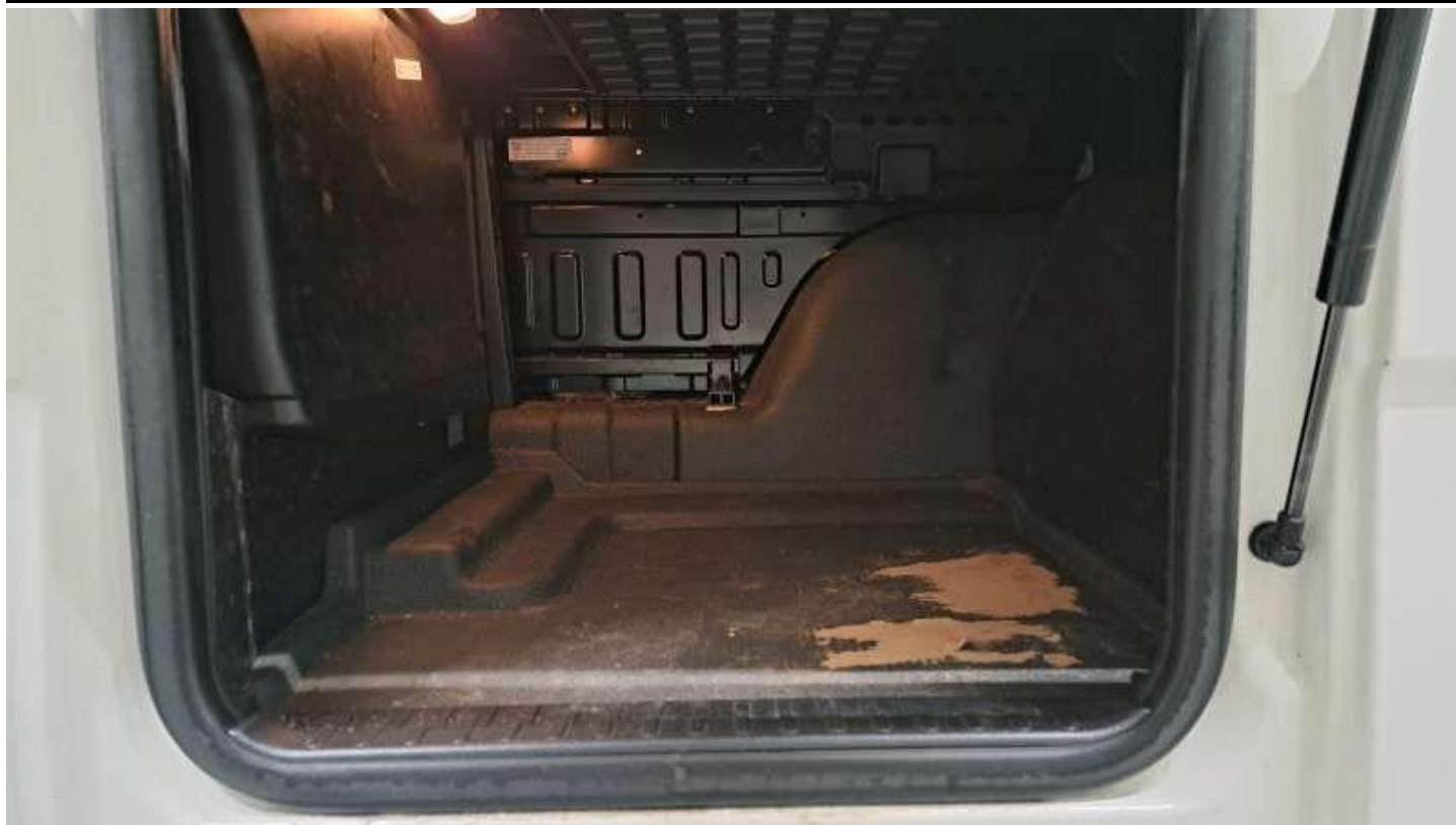
Fot. nr 33