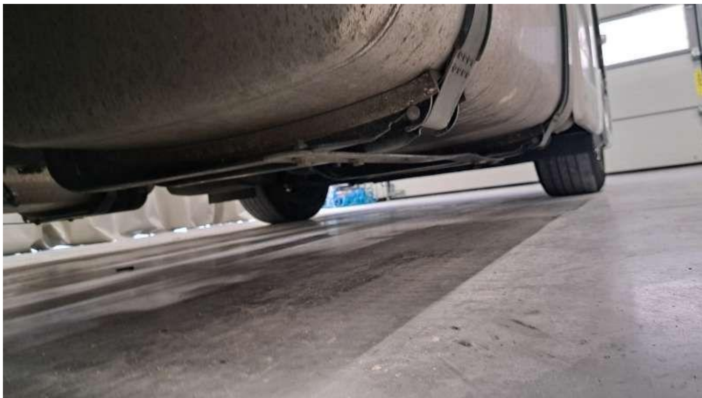
Fot. nr 60