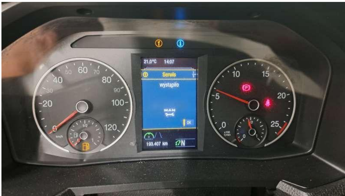
Fot. nr 64