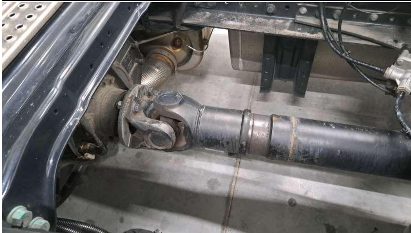
Fot. nr 47