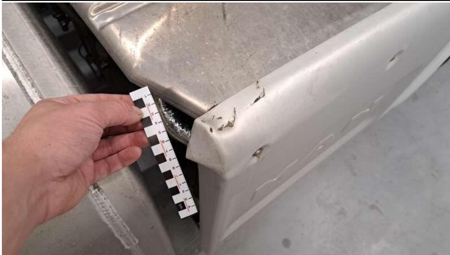
Fot. nr 55