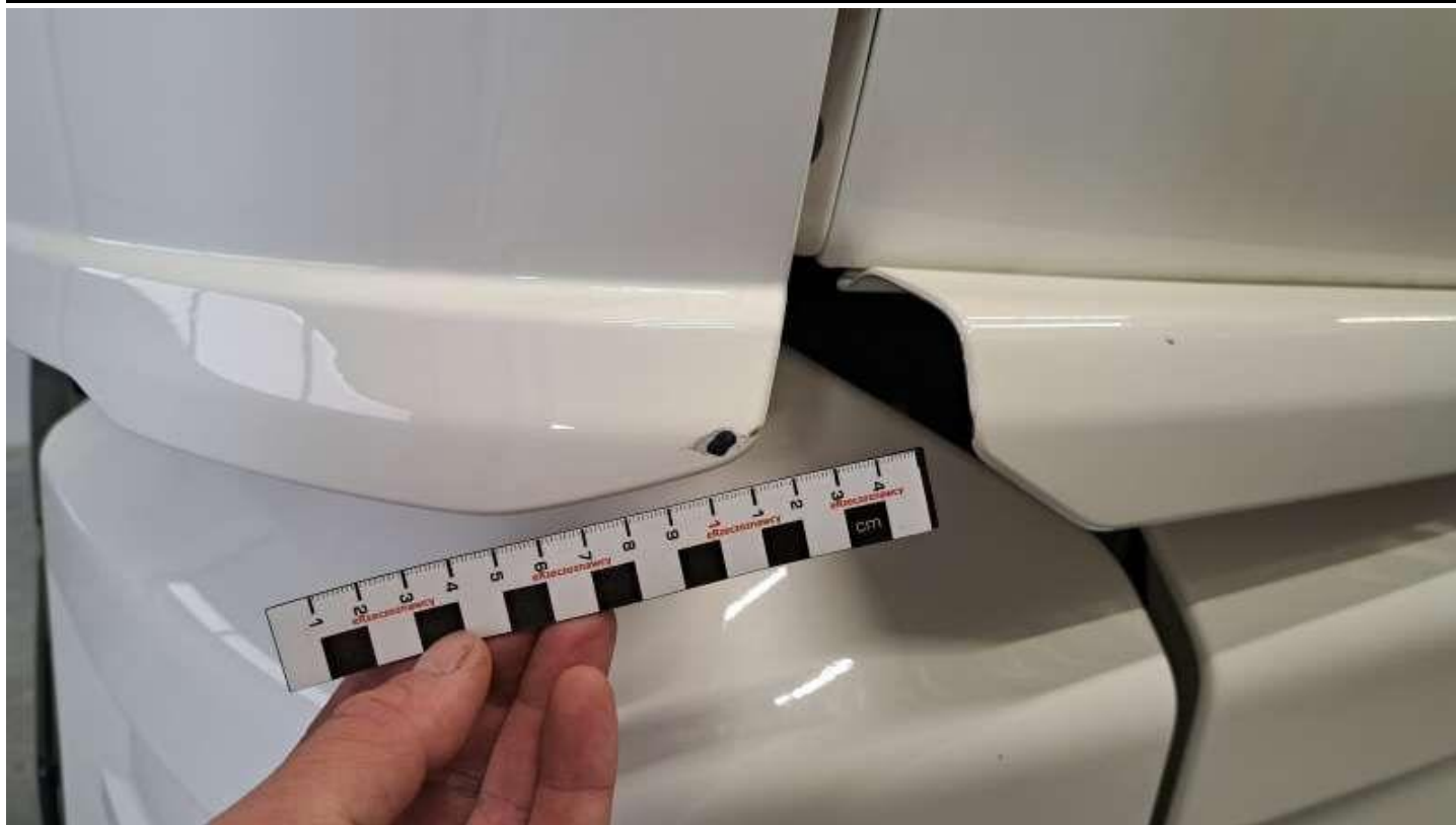
Fot. nr 37