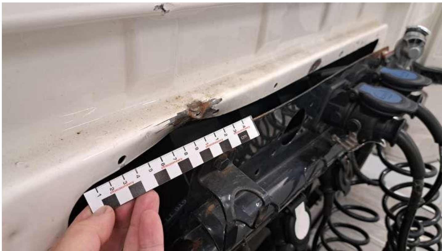
Fot. nr 46