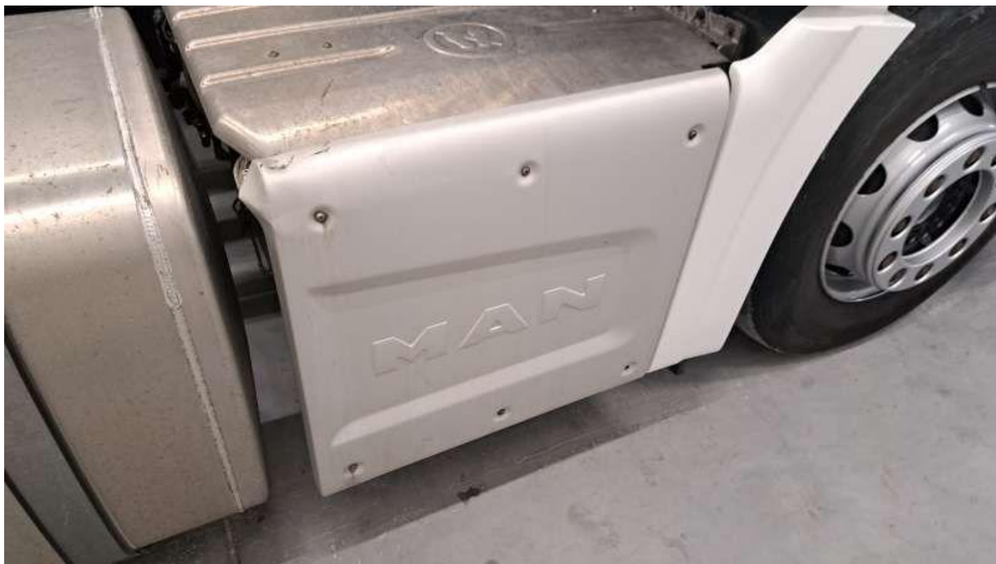
Fot. nr 54