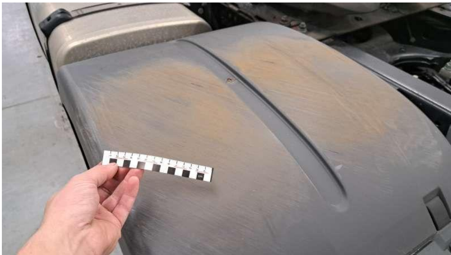
Fot. nr 50