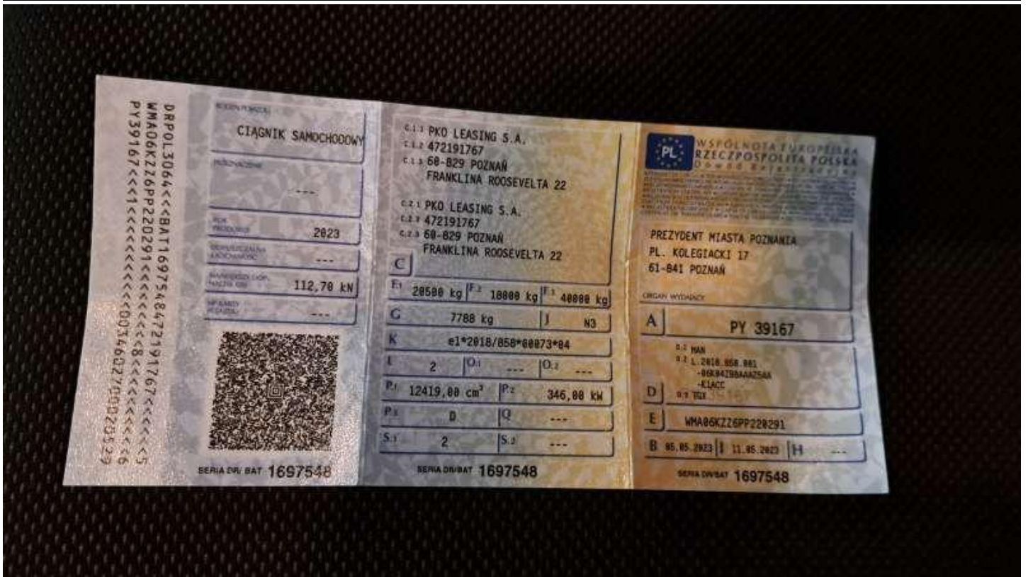
Fot. nr 71