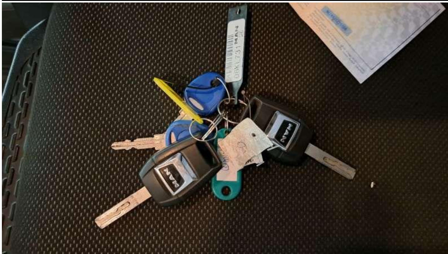
Fot. nr 73

Dokument wystawiony elektronicznie, wamy bez podpisu