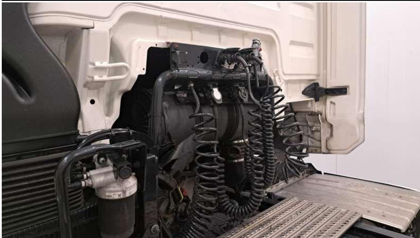
Fot. nr 45