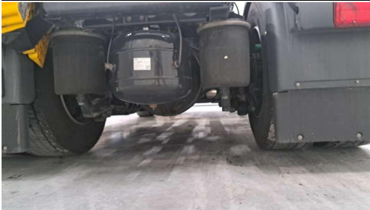
Fot. nr 61