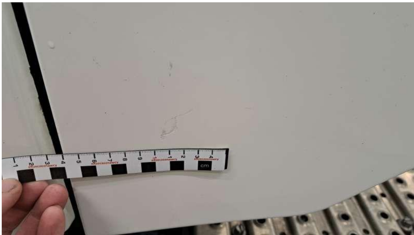
Fot. nr 44