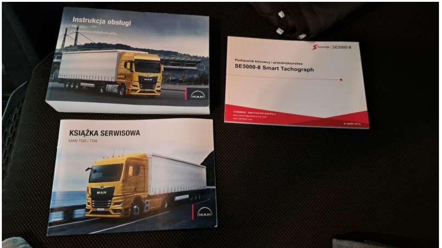
Fot. nr 70