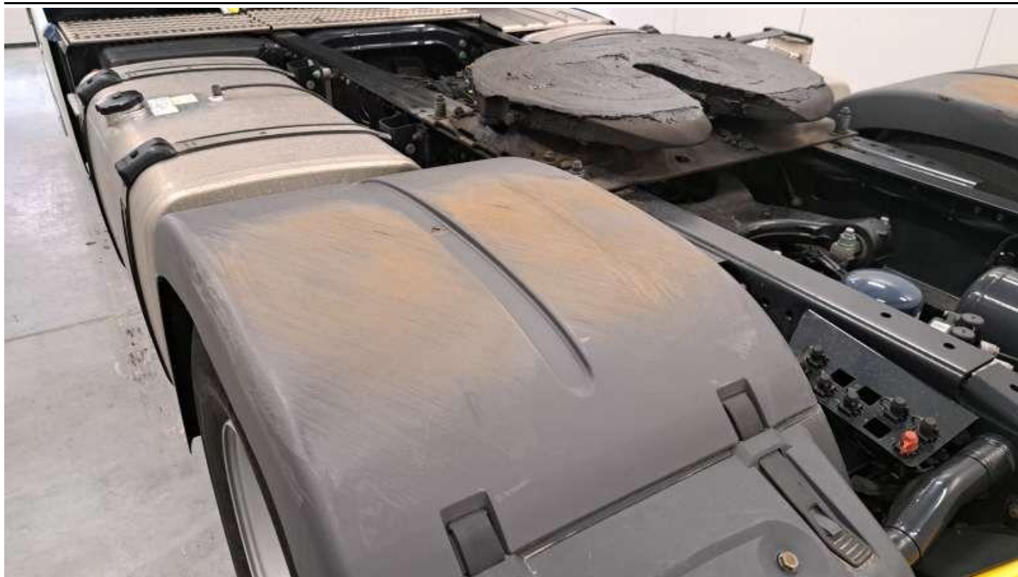
Fot. nr 49