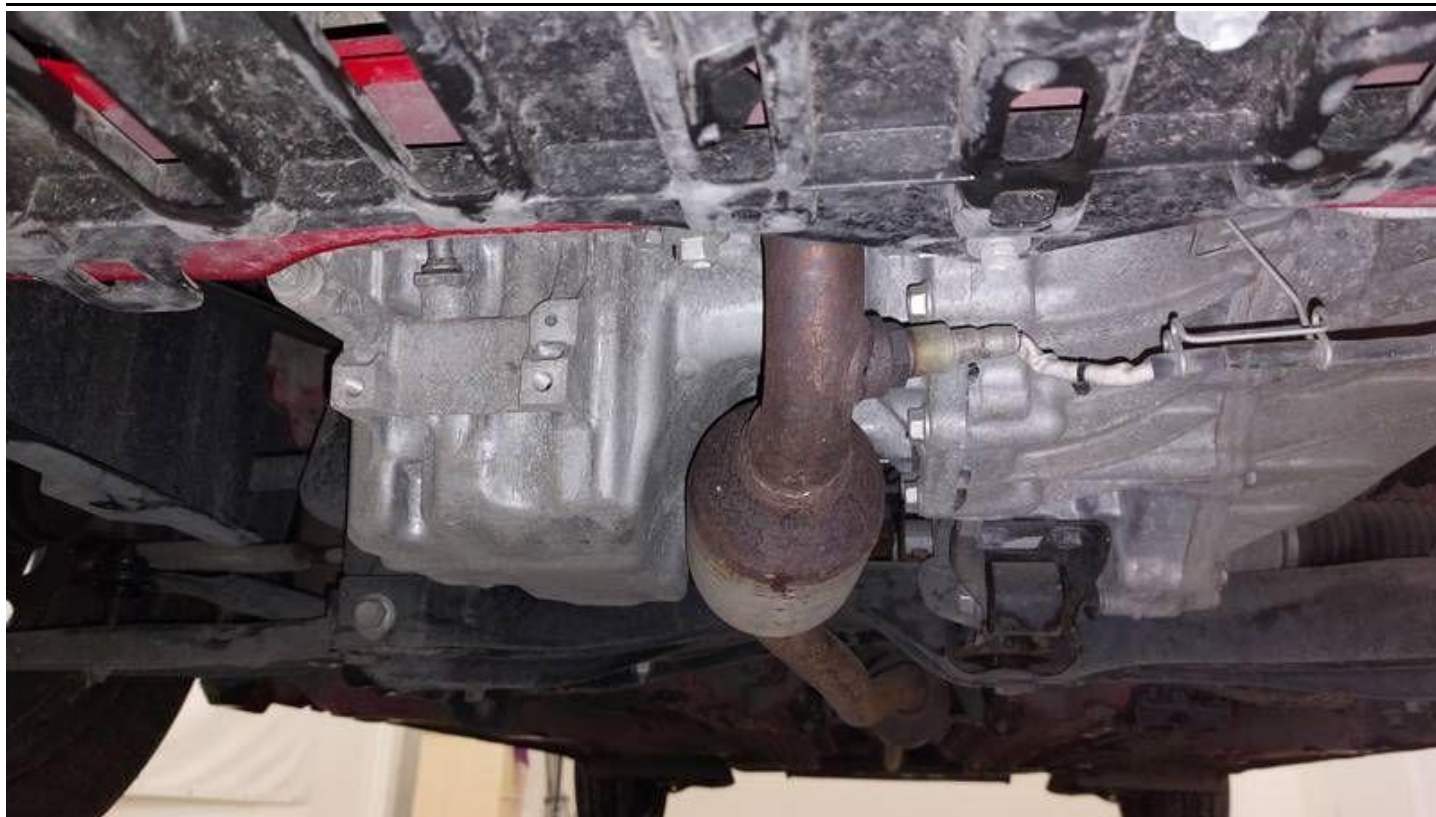
Fot. nr 49