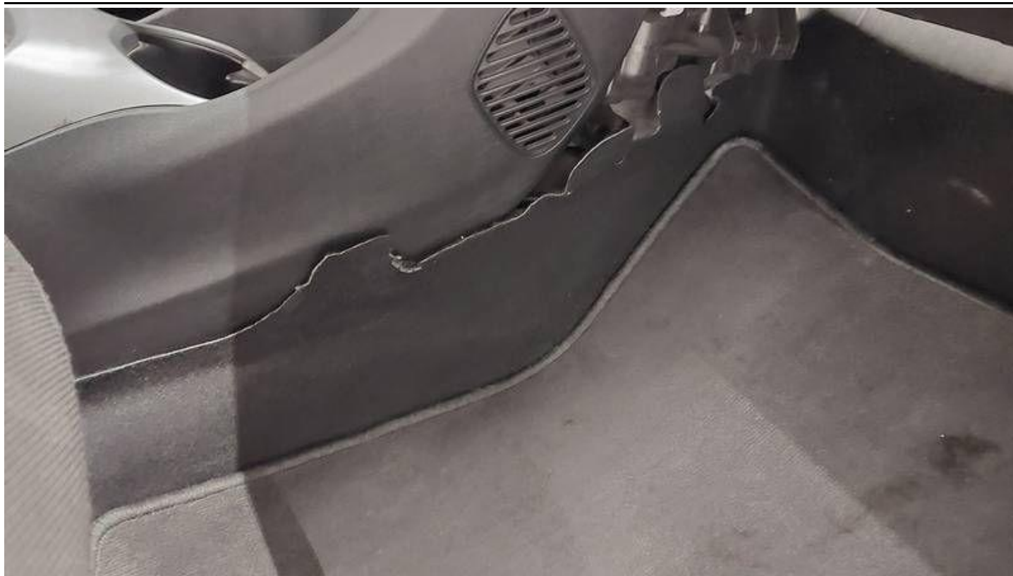
Fot. nr 37