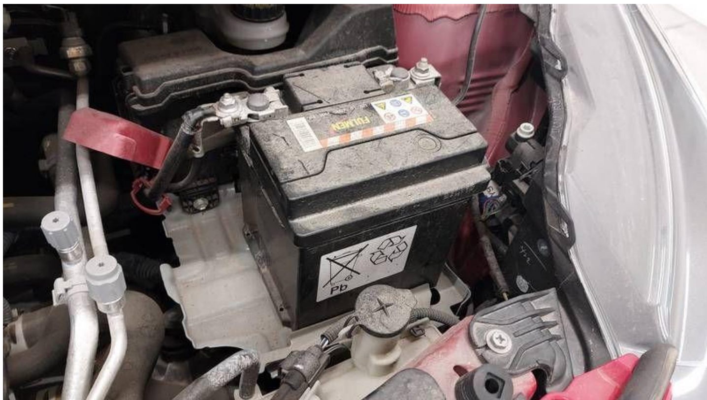
Fot. nr 42