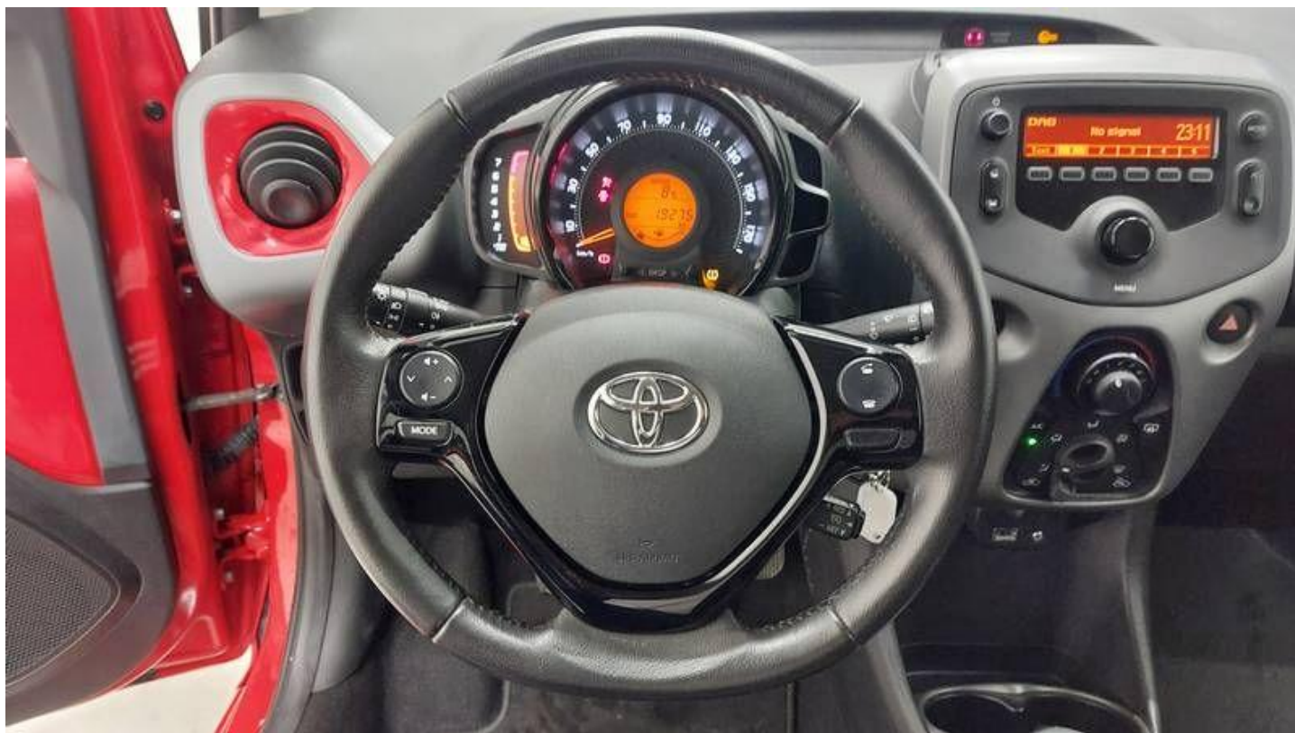
Fot. nr 16