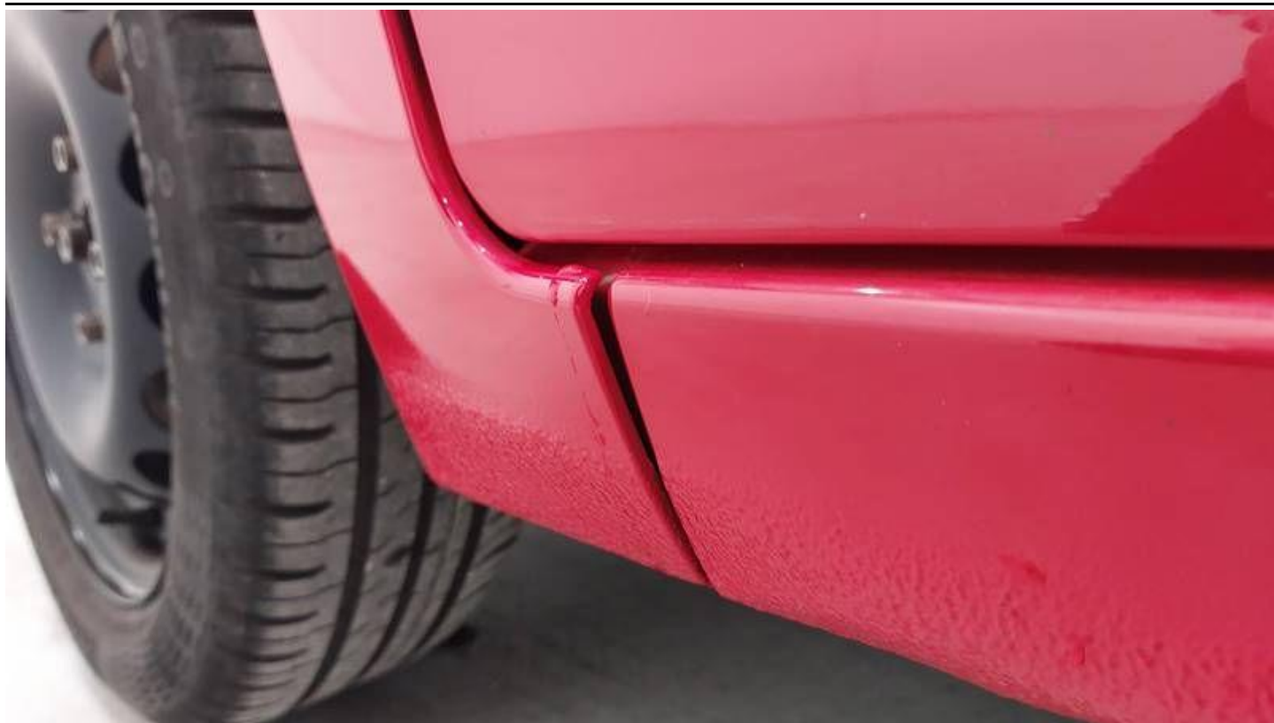
Fot. nr 53