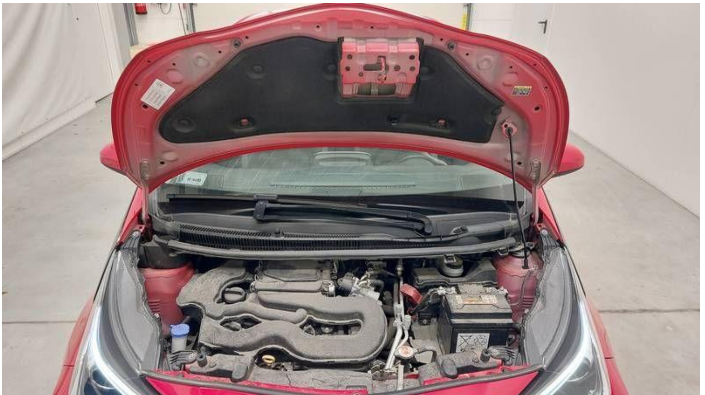
Fot. nr 40