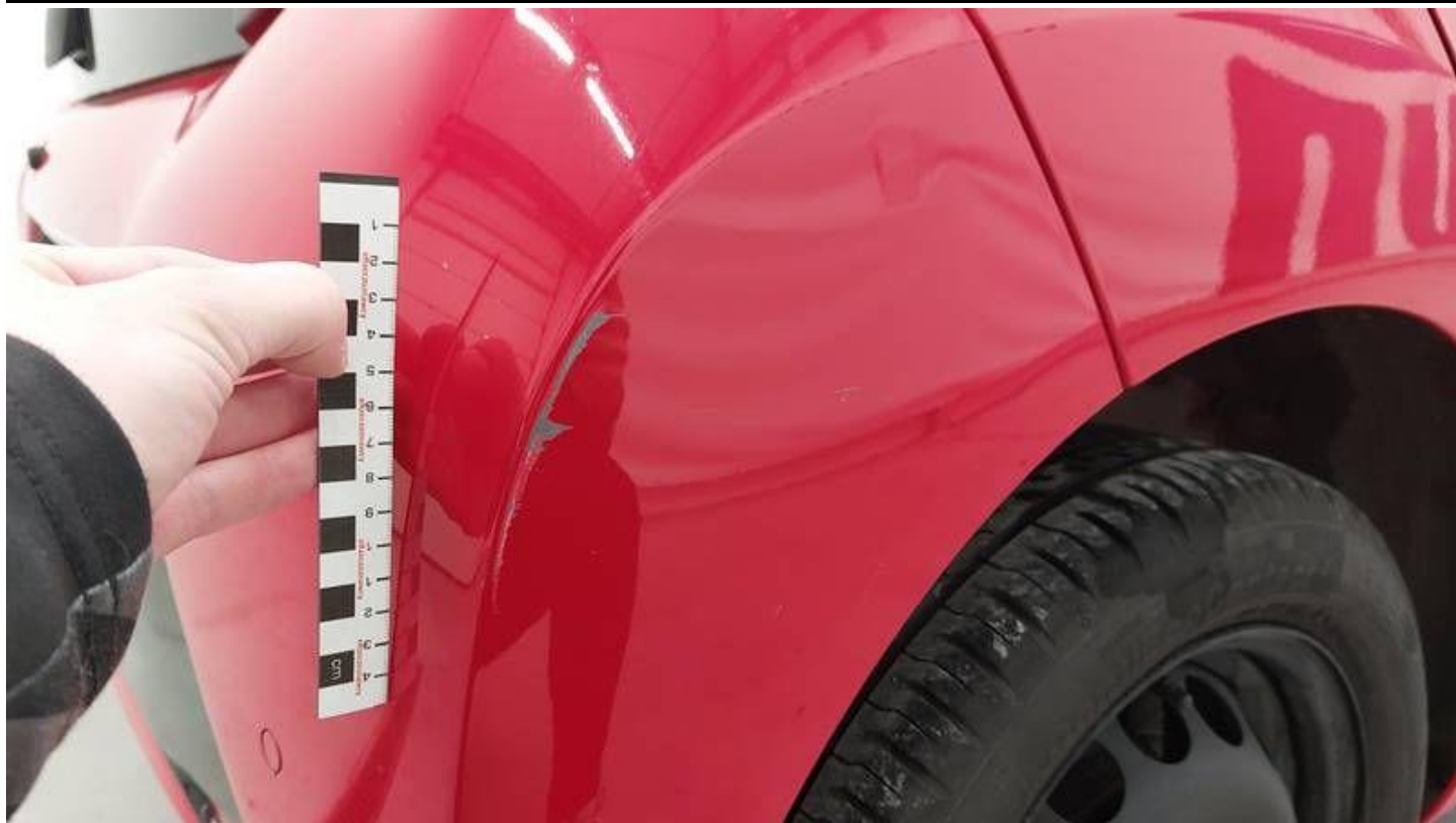
Fot. nr 43