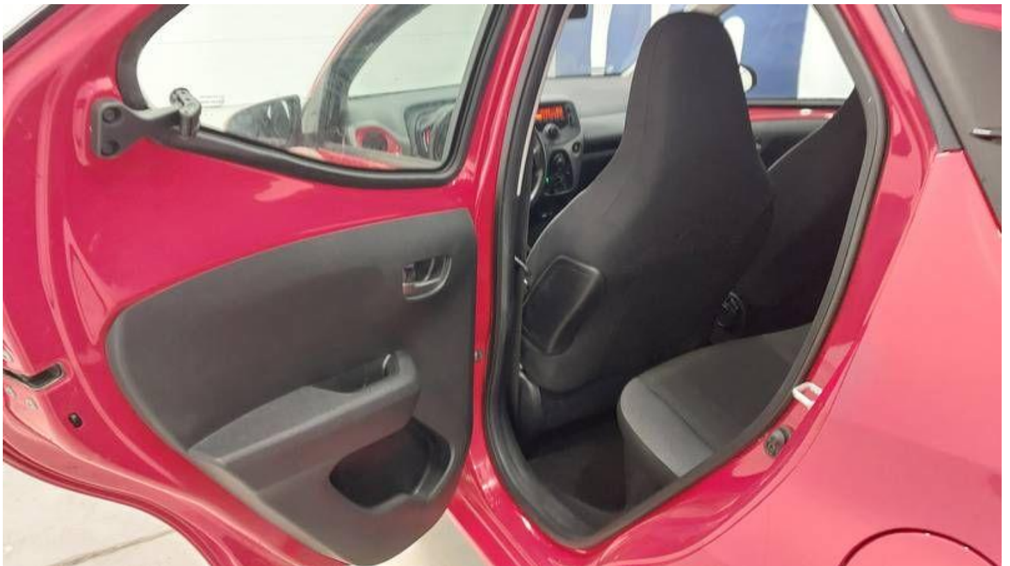
Fot. nr 24