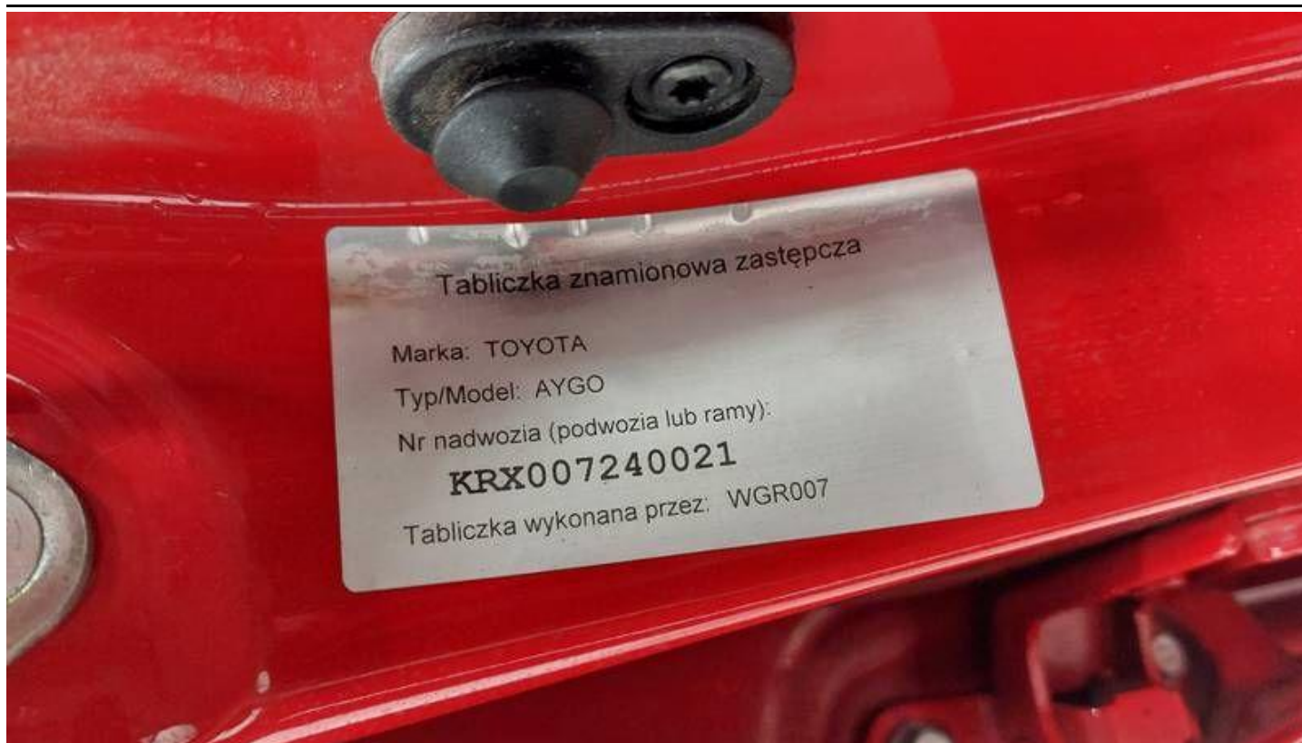
Fot. nr 9