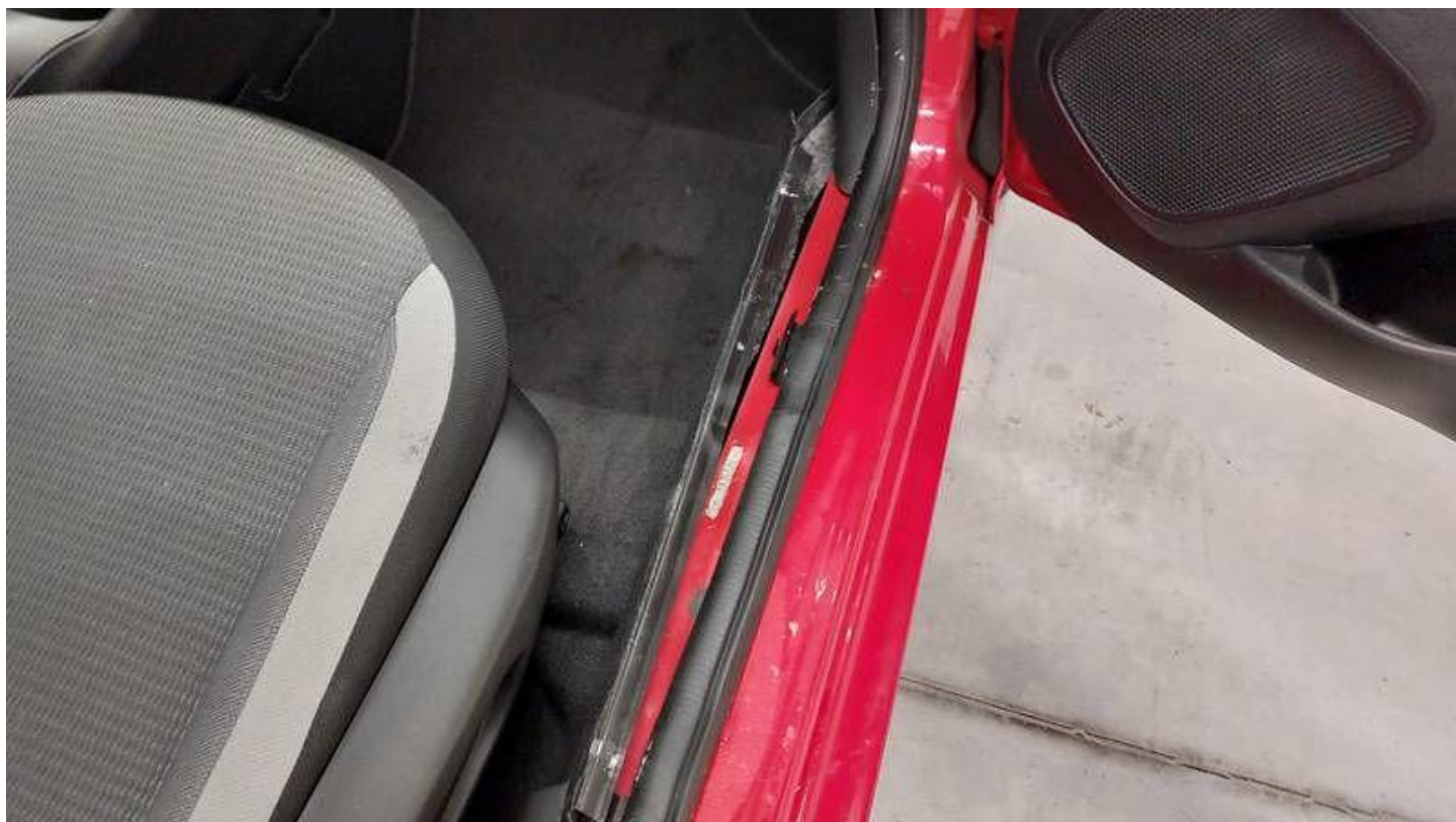
Fot. nr 36