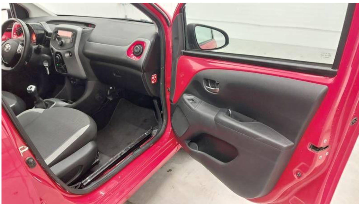
Fot. nr 32