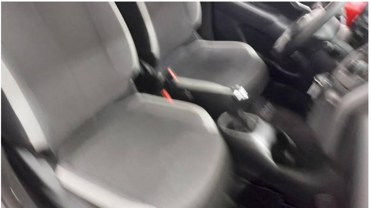
Fot. nr 34