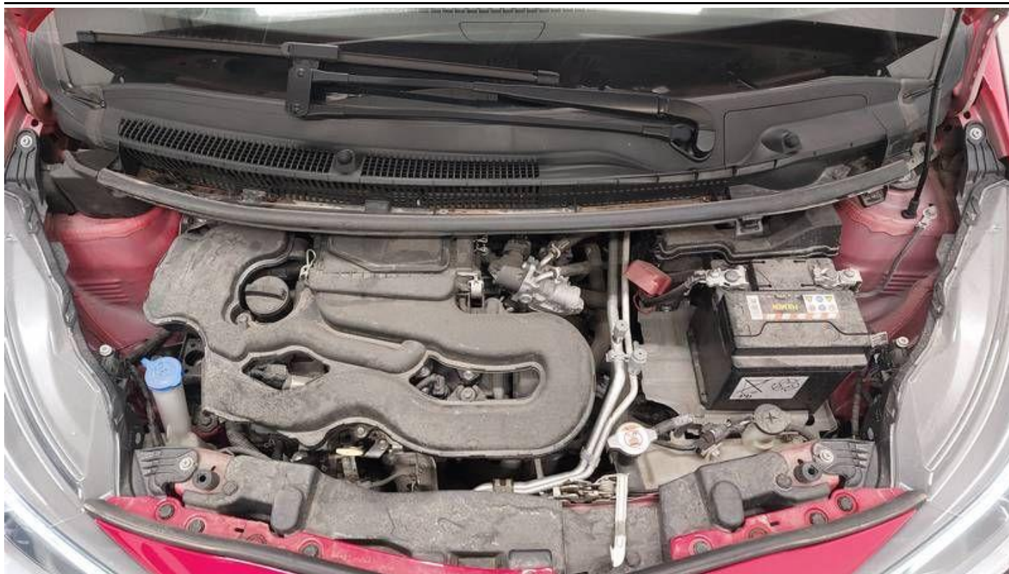
Fot. nr 41