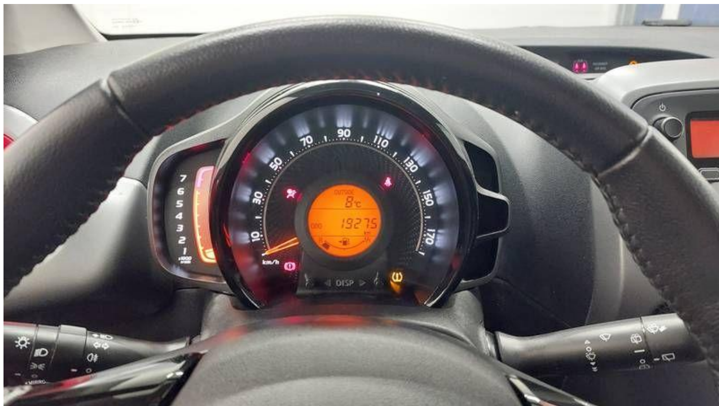
Fot. nr 8