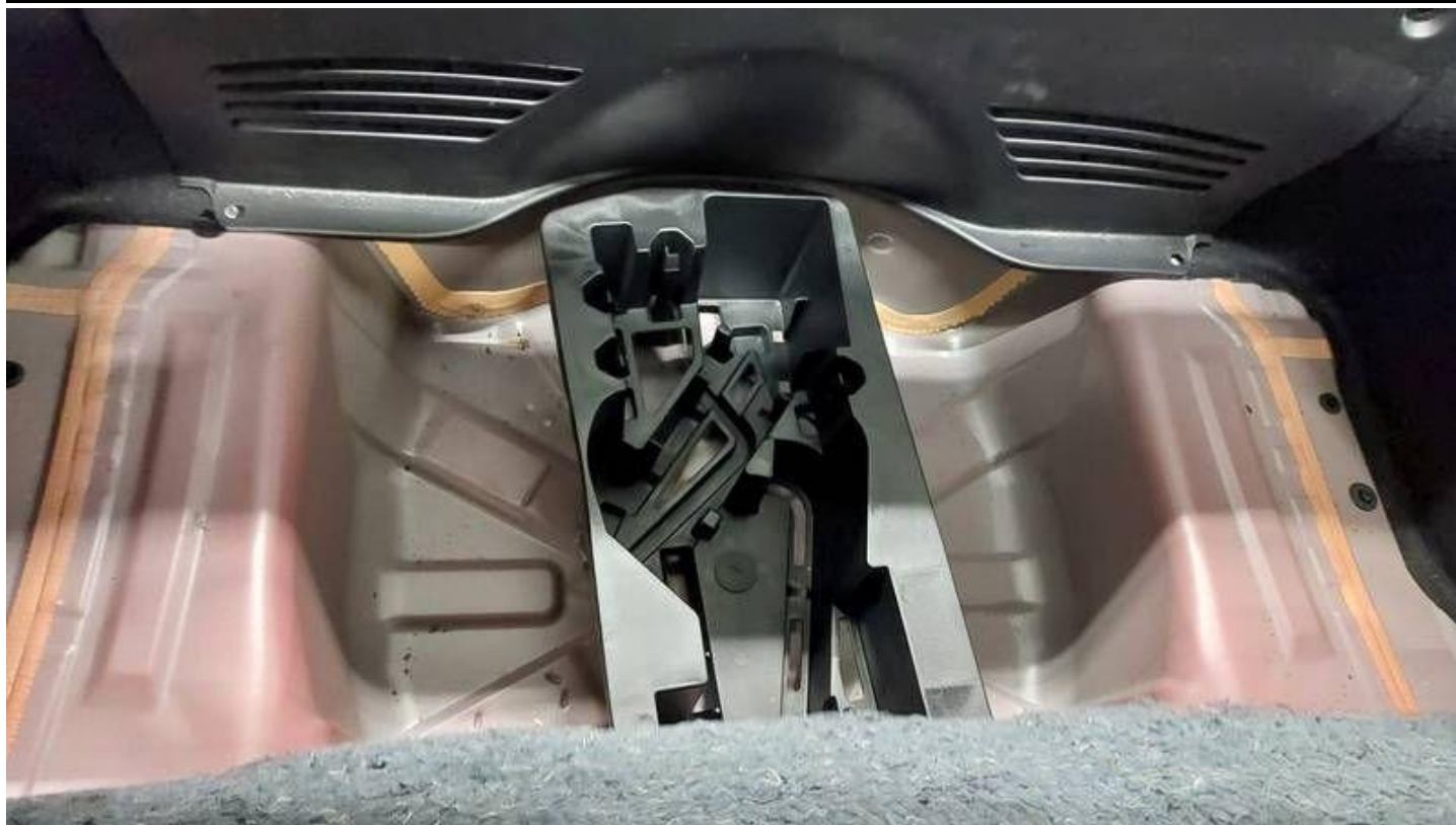
Fot. nr 31