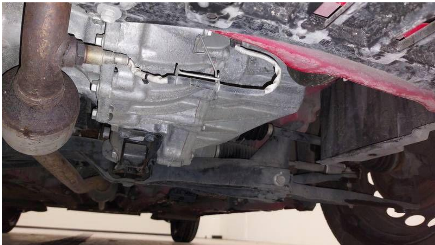
Fot. nr 48