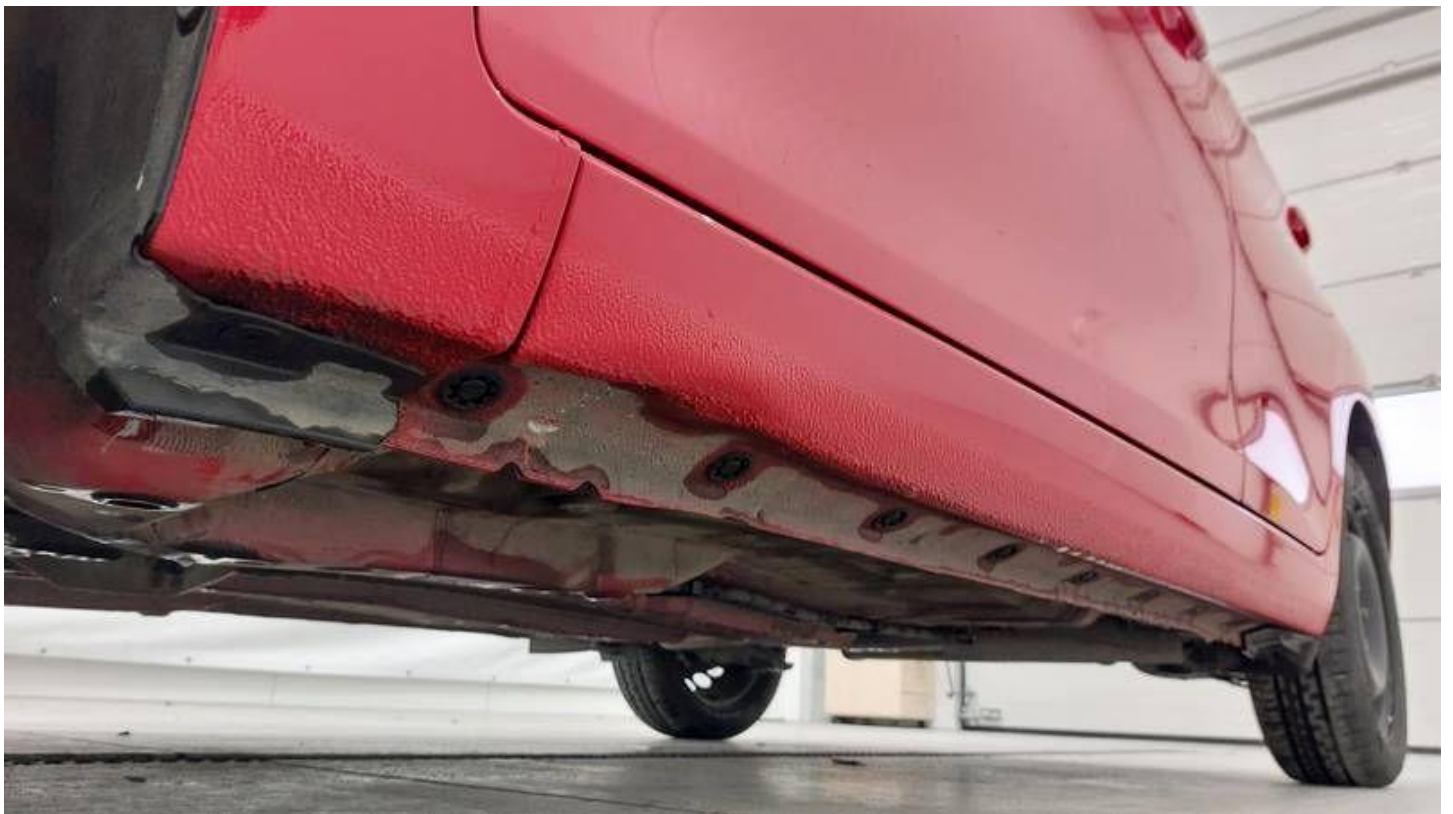
Fot. nr 52