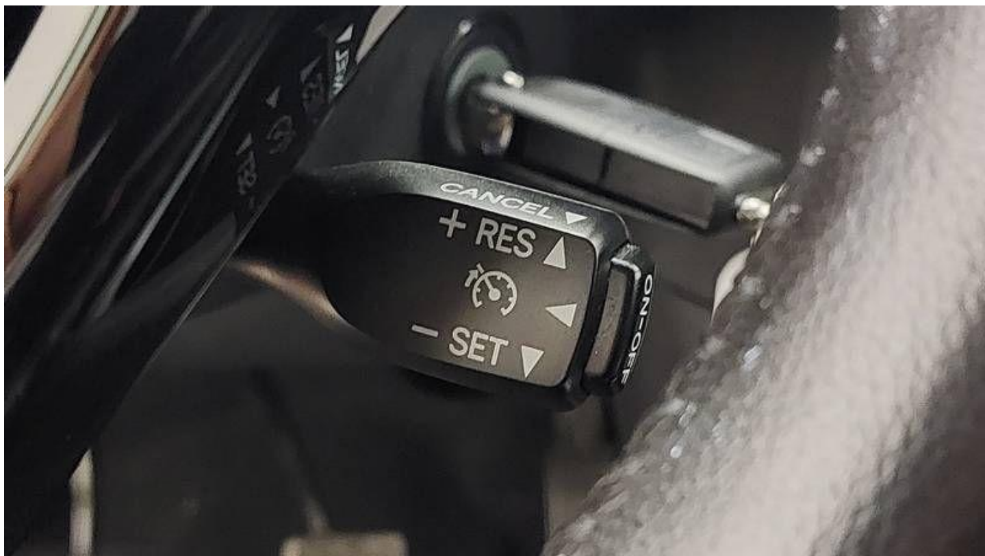
Fot. nr 18