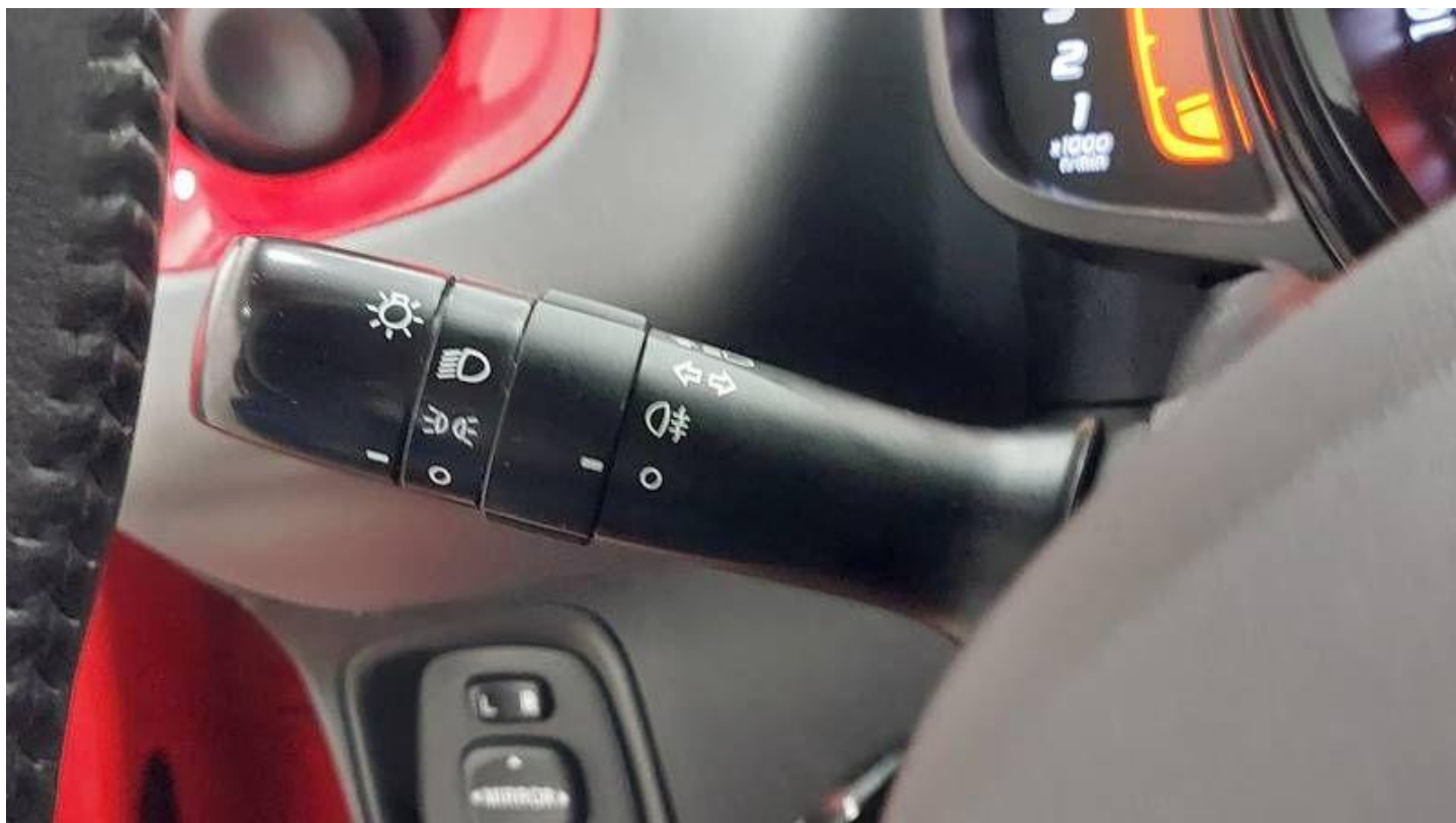
Fot. nr 20