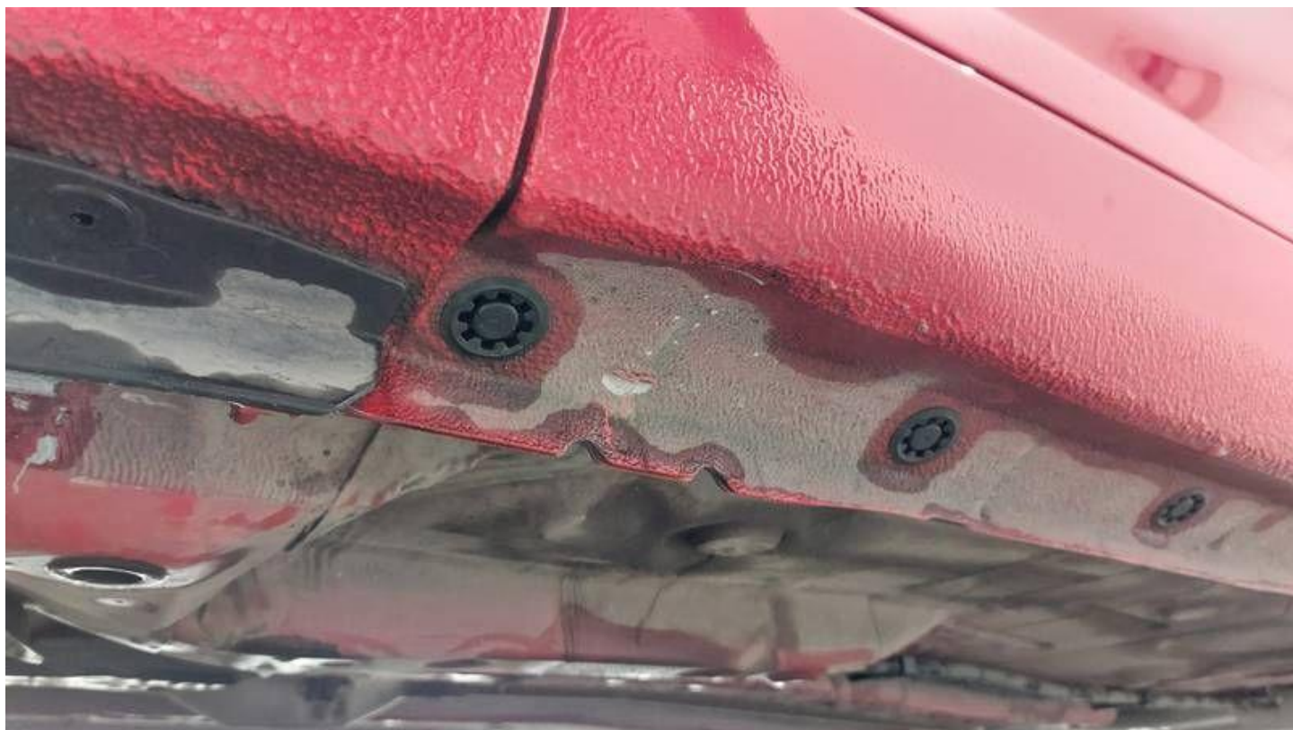
Fot. nr 54