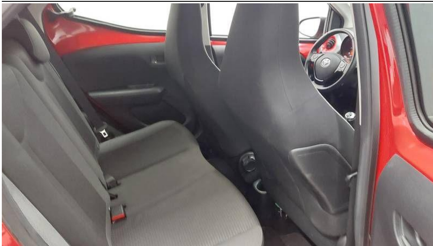
Fot. nr 29