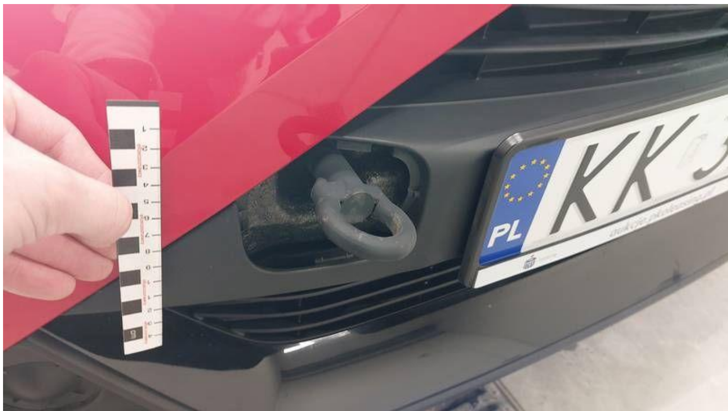
Fot. nr 44