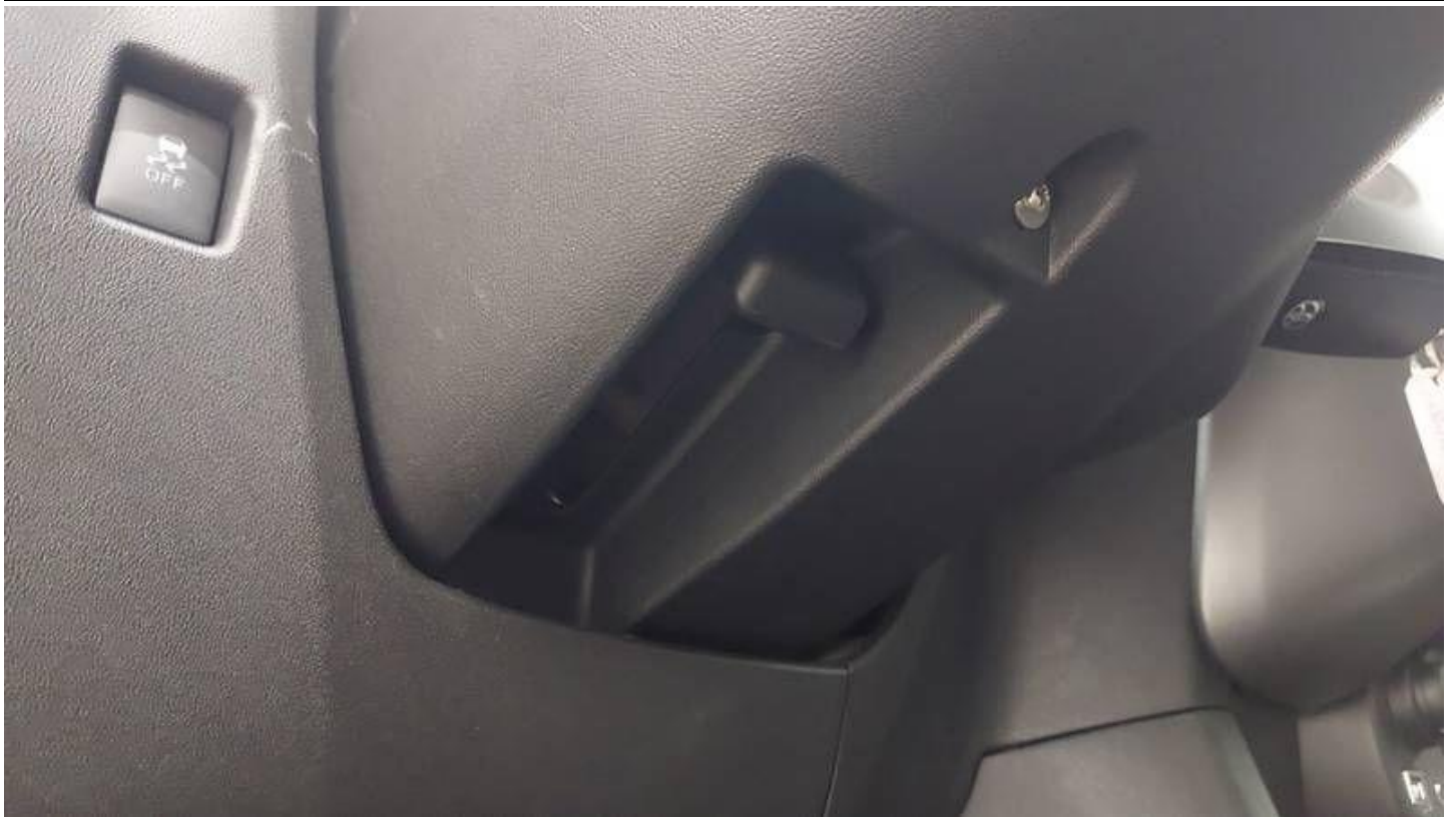
Fot. nr 23