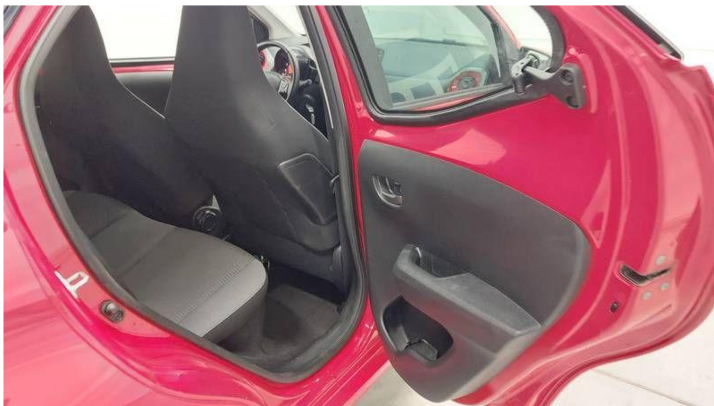
Fot. nr 28