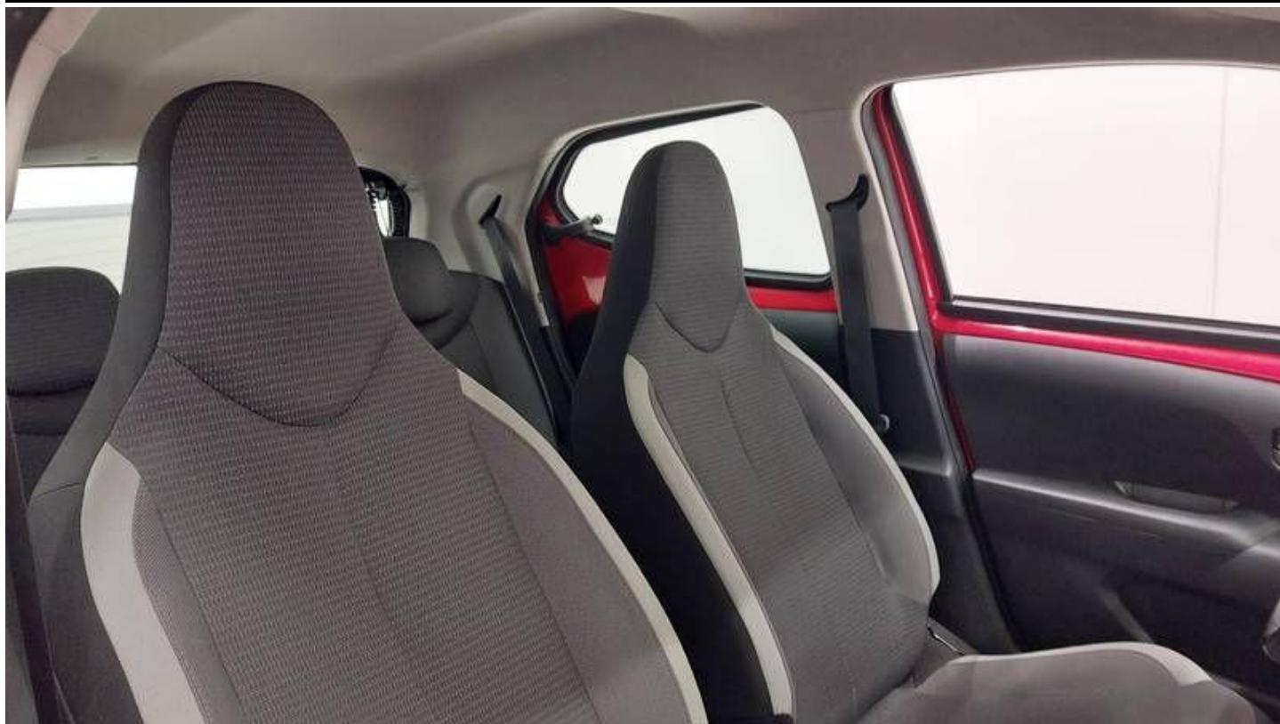
Fot. nr 35