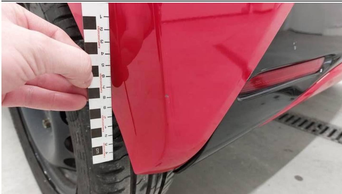
Fot. nr 45