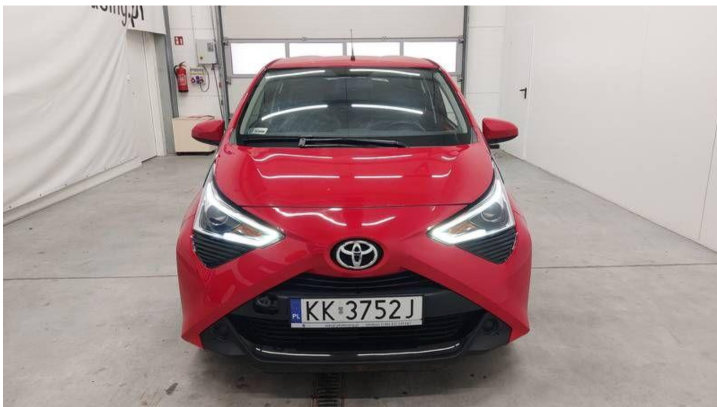
Fot. nr 2