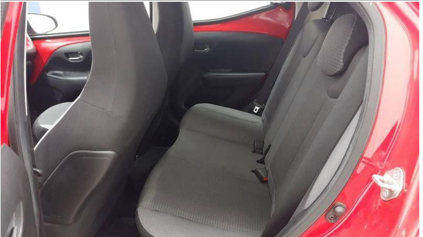
Fot. nr 25