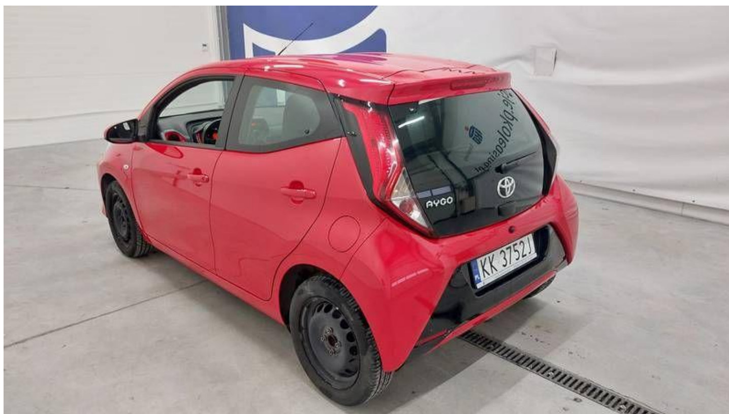
Fot. nr 6