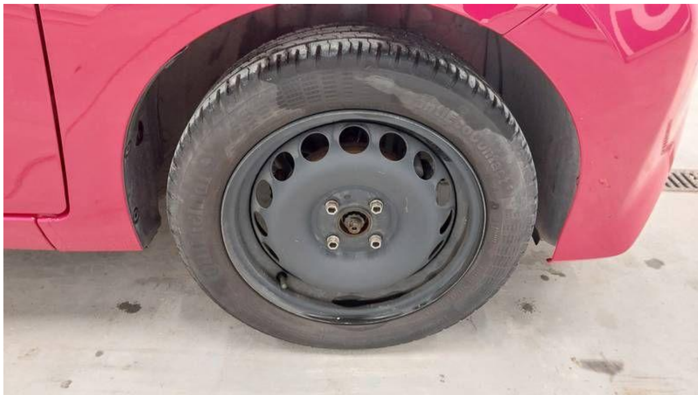
Fot. nr 56