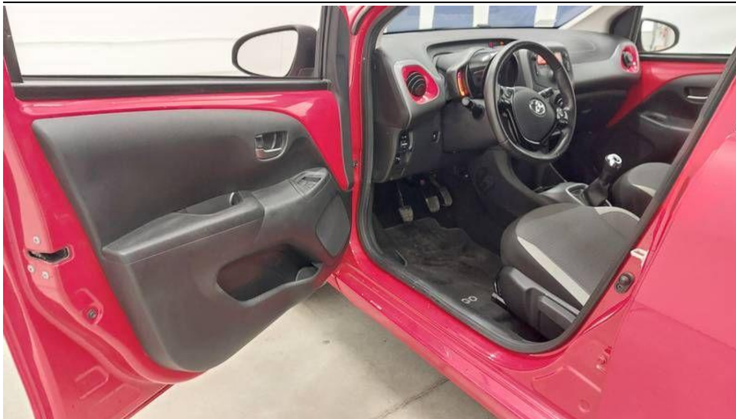
Fot. nr 11