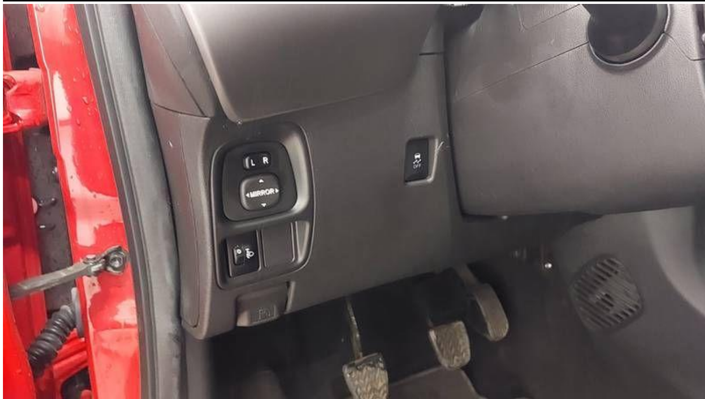
Fot. nr 15