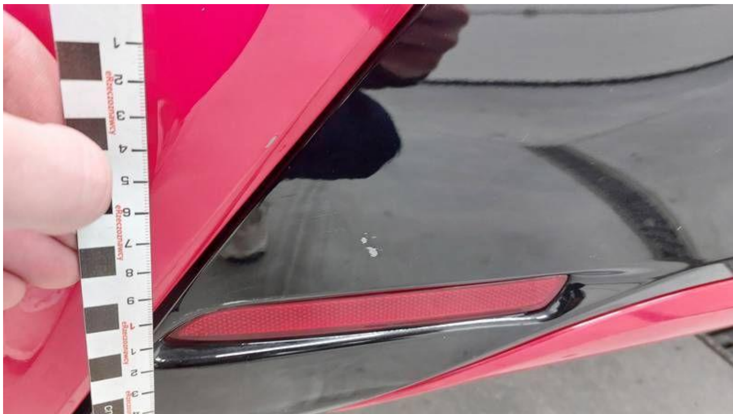
Fot. nr 46