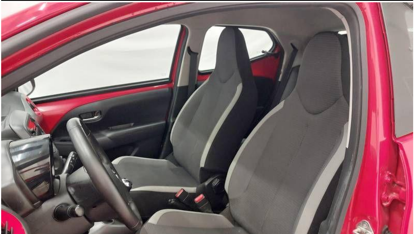
Fot. nr 13