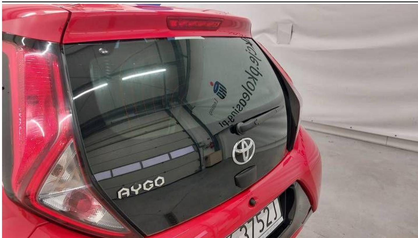
Fot. nr 27