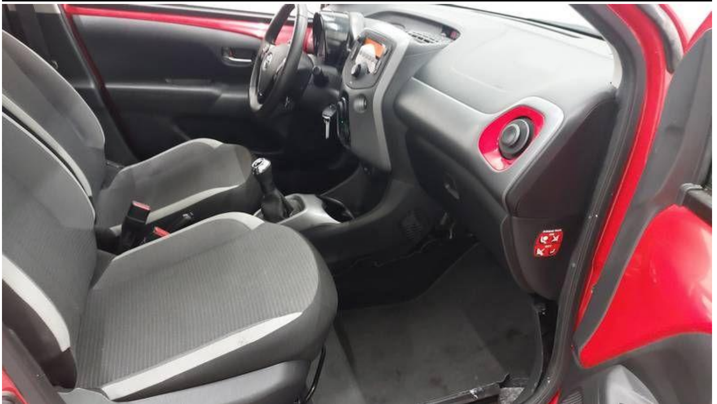
Fot. nr 33