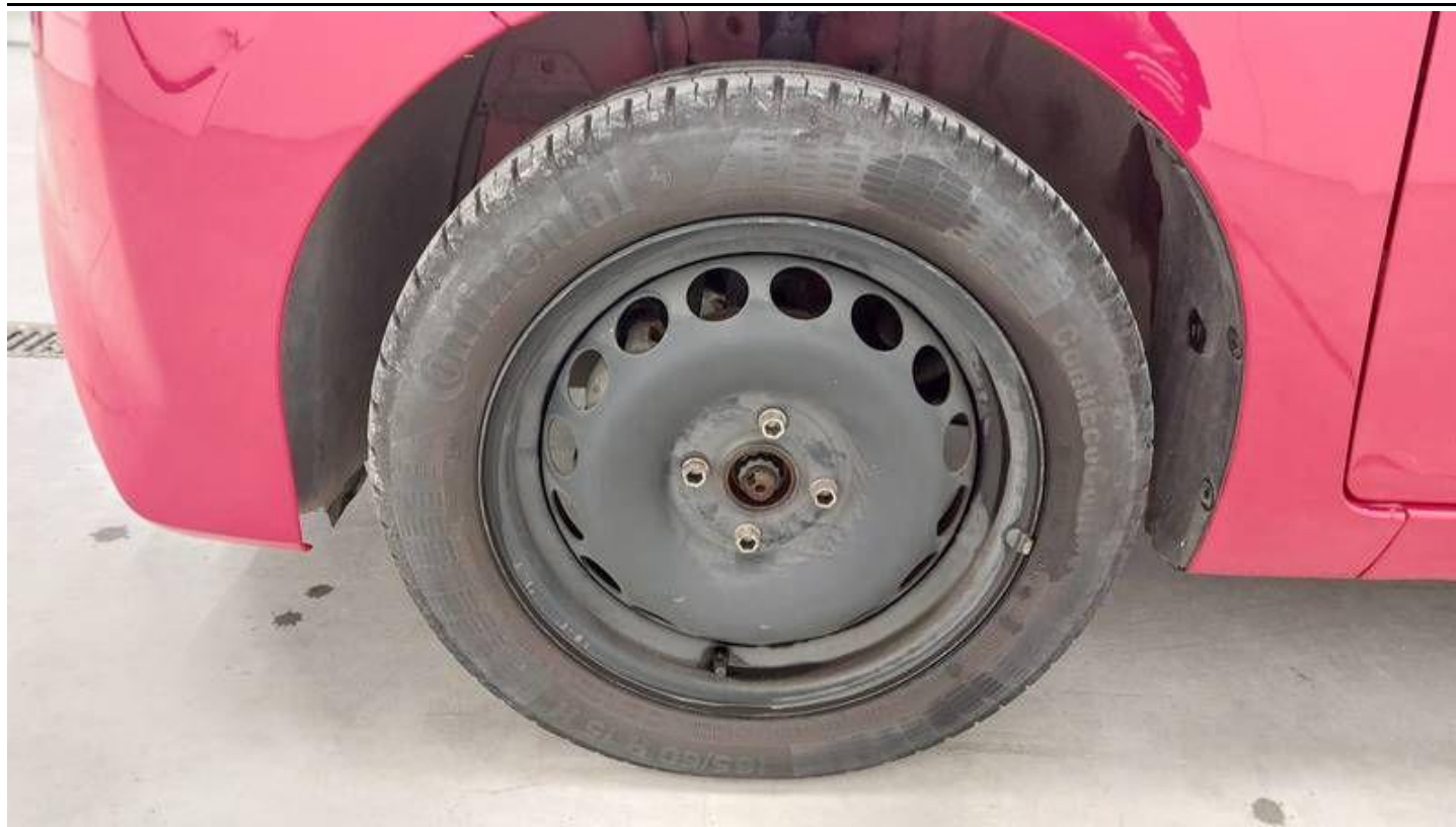
Fot. nr 55