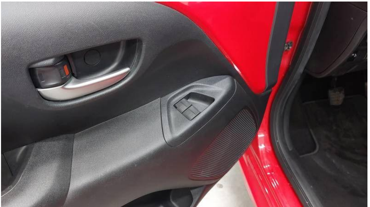
Fot. nr 14