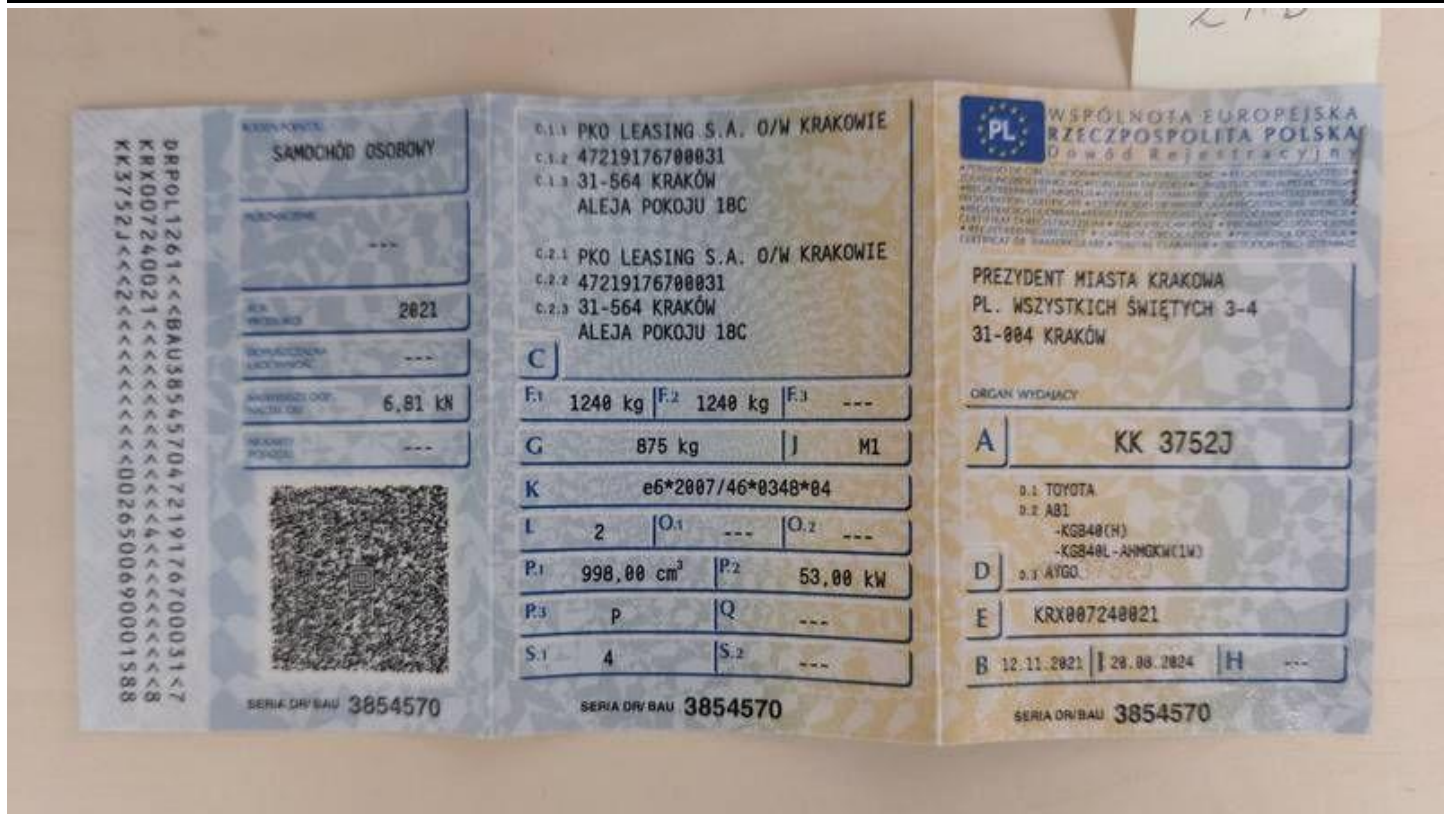
Fot. nr 59