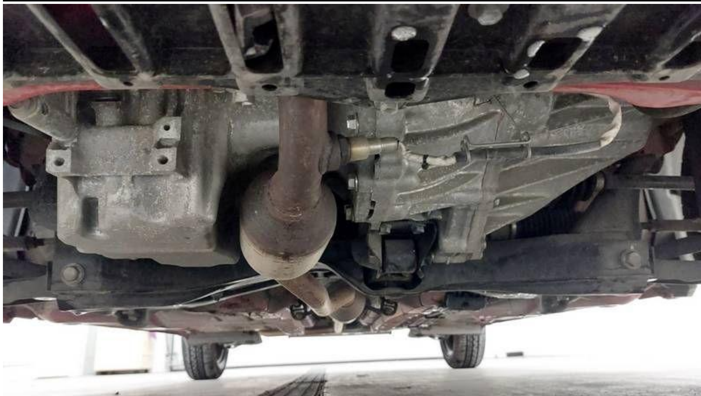
Fot. nr 47