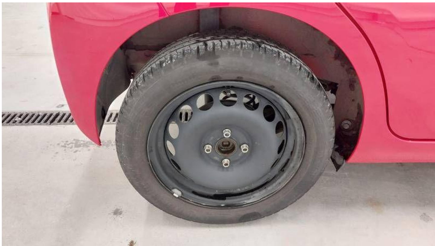
Fot. nr 58