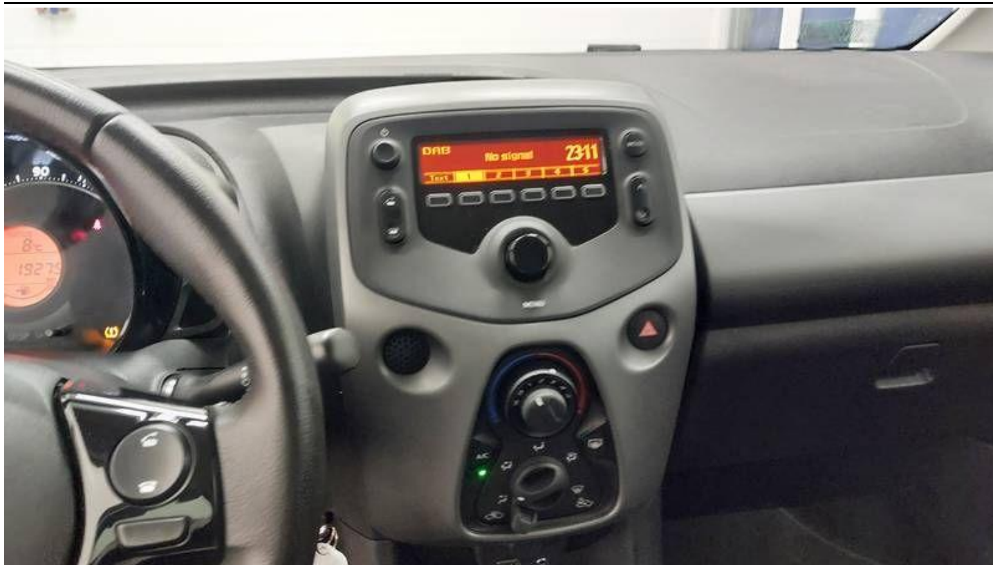
Fot. nr 21