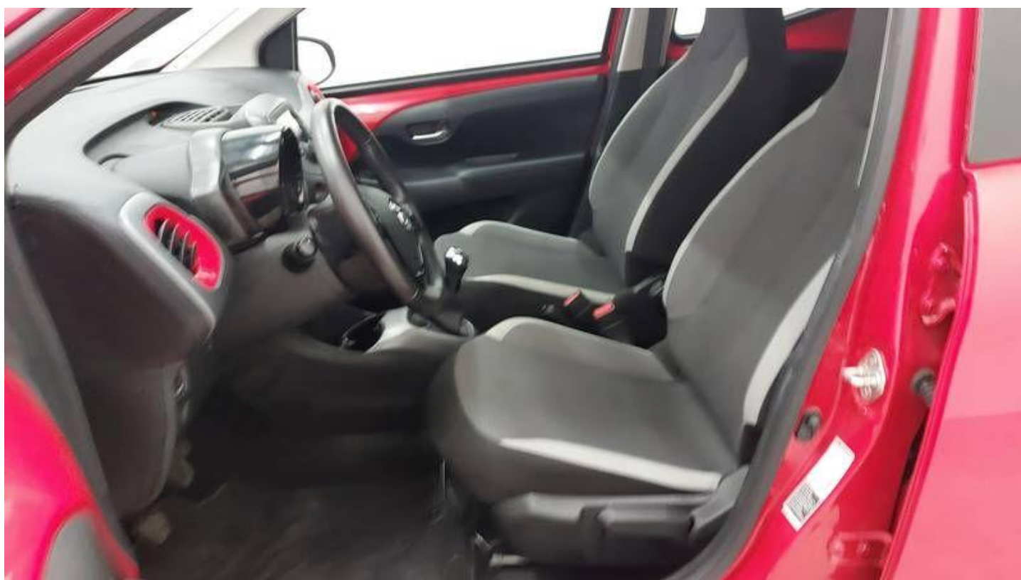
Fot. nr 12