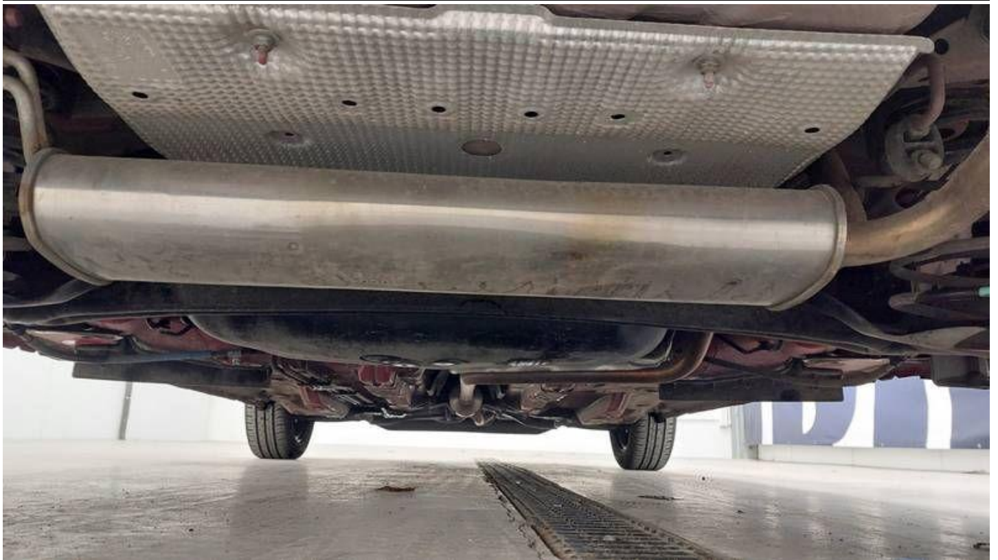
Fot. nr 51