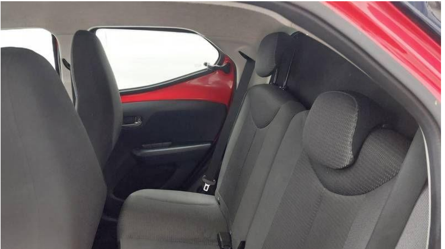
Fot. nr 26