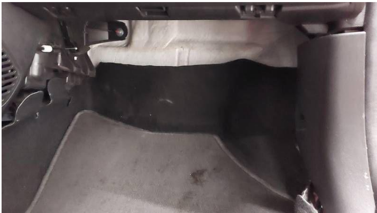
Fot. nr 38