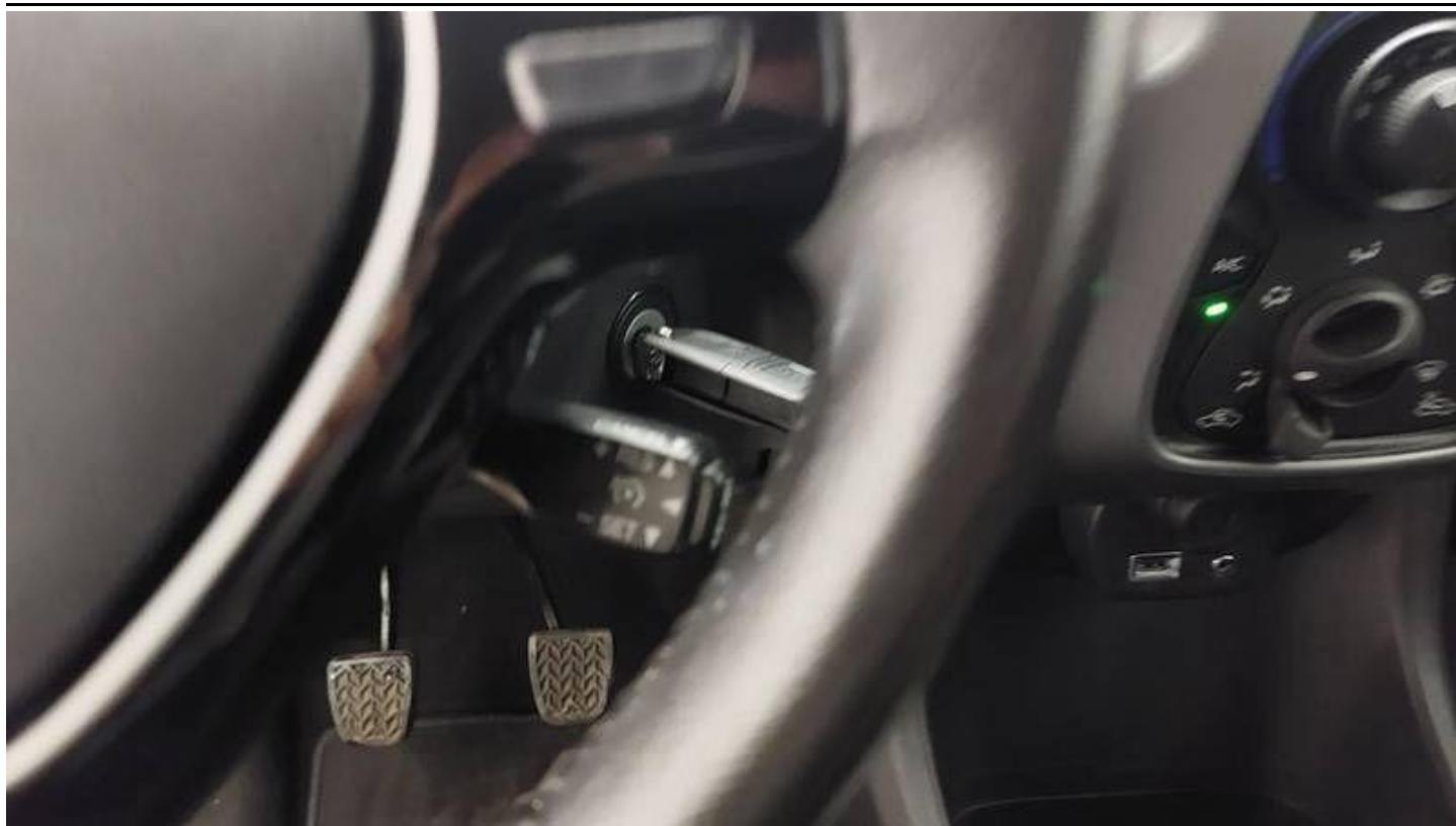
Fot. nr 17