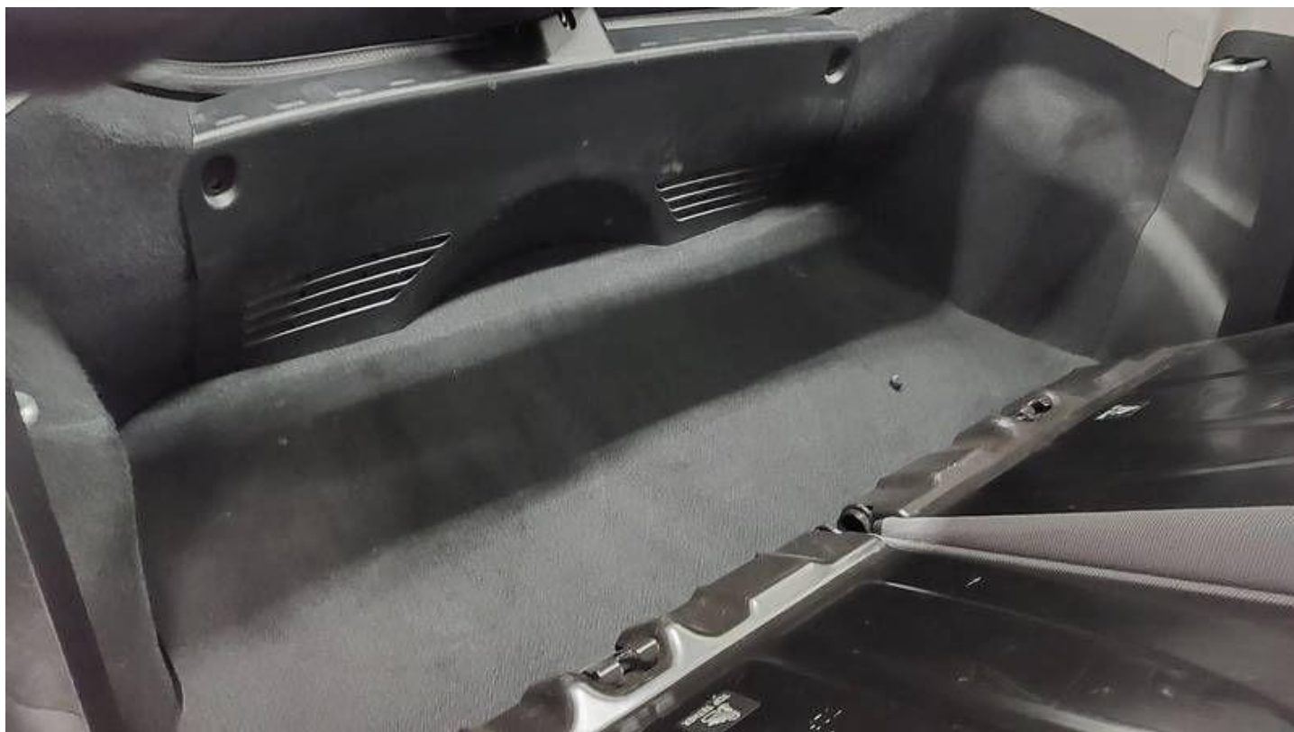
Fot. nr 30