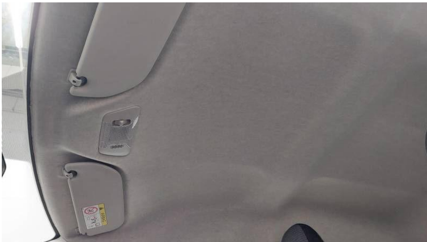
Fot. nr 22