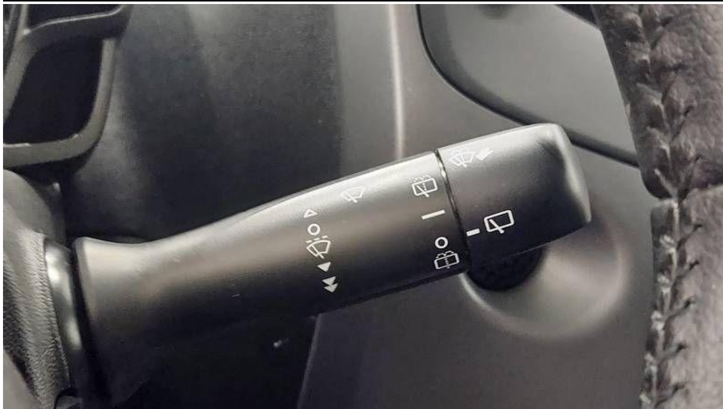
Fot. nr 19