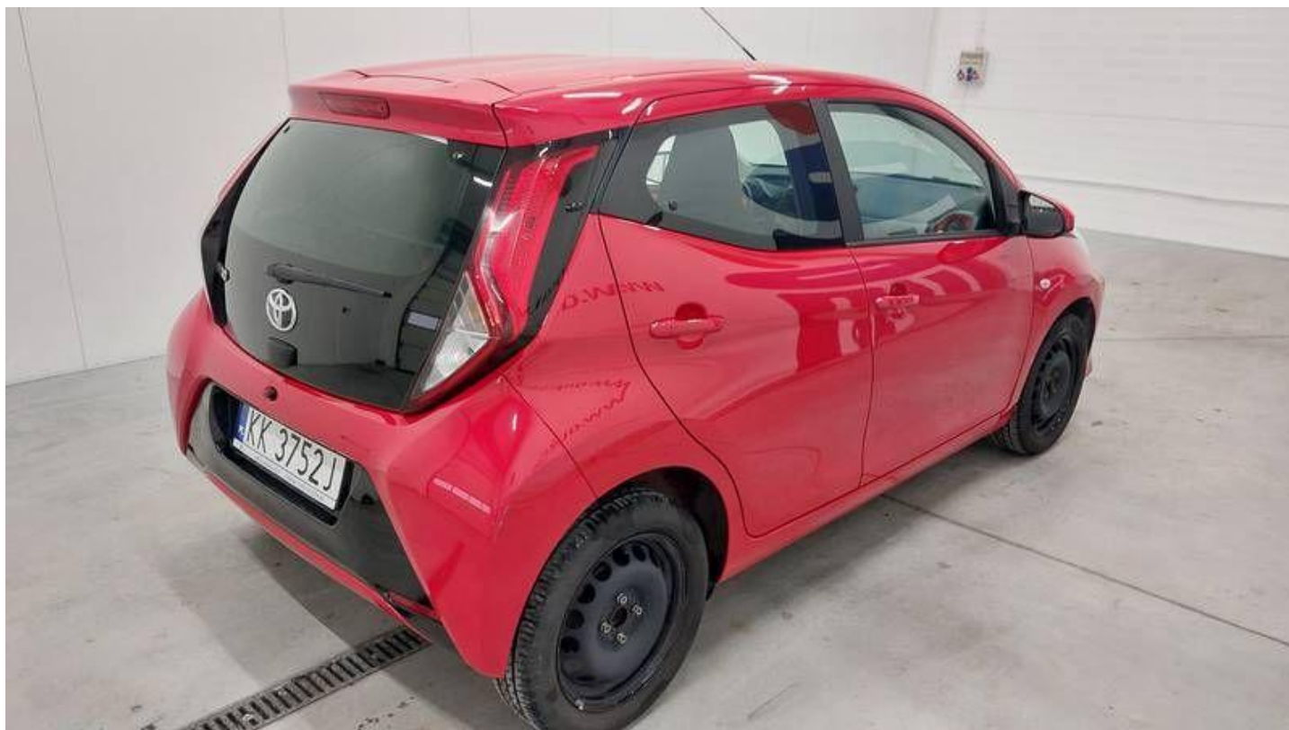
Fot. nr 4