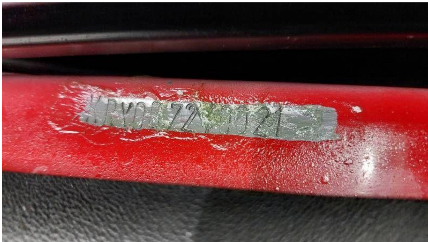
Fot. nr 10