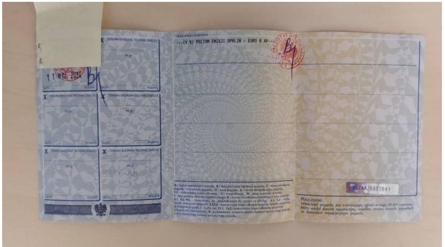
Fot. nr 60

Dokument wystawiony elektronicznie, wa ny bez podpisu