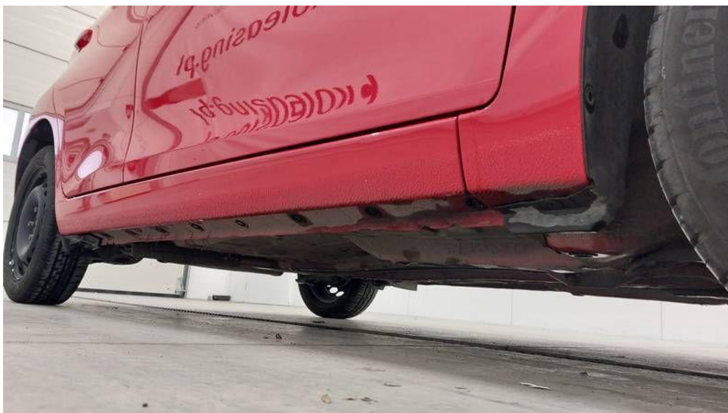
Fot. nr 50