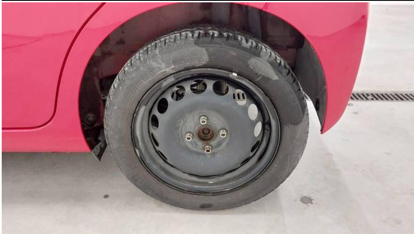
Fot. nr 57