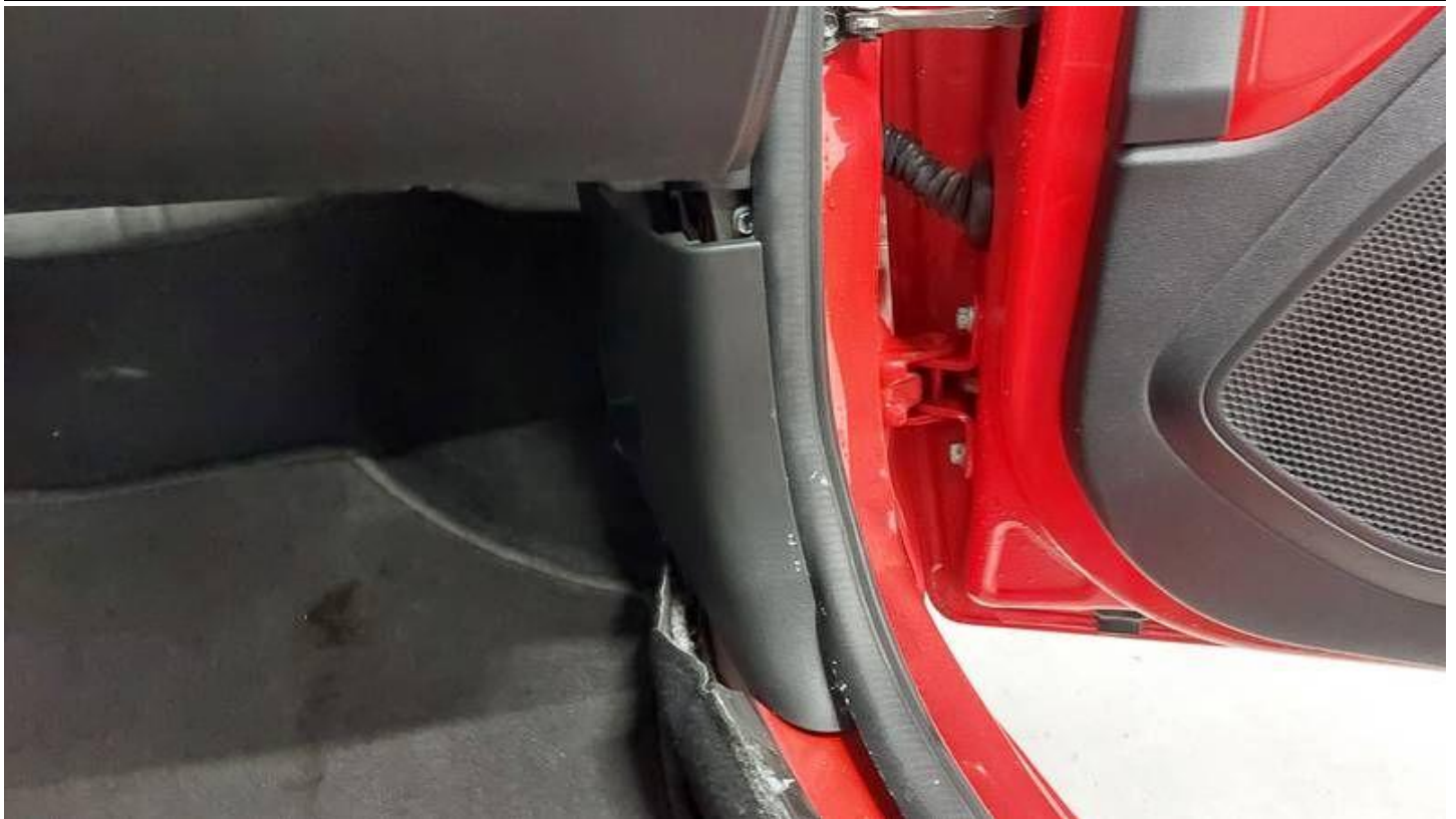
Fot. nr 39