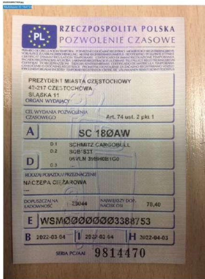
Fot. nr 57