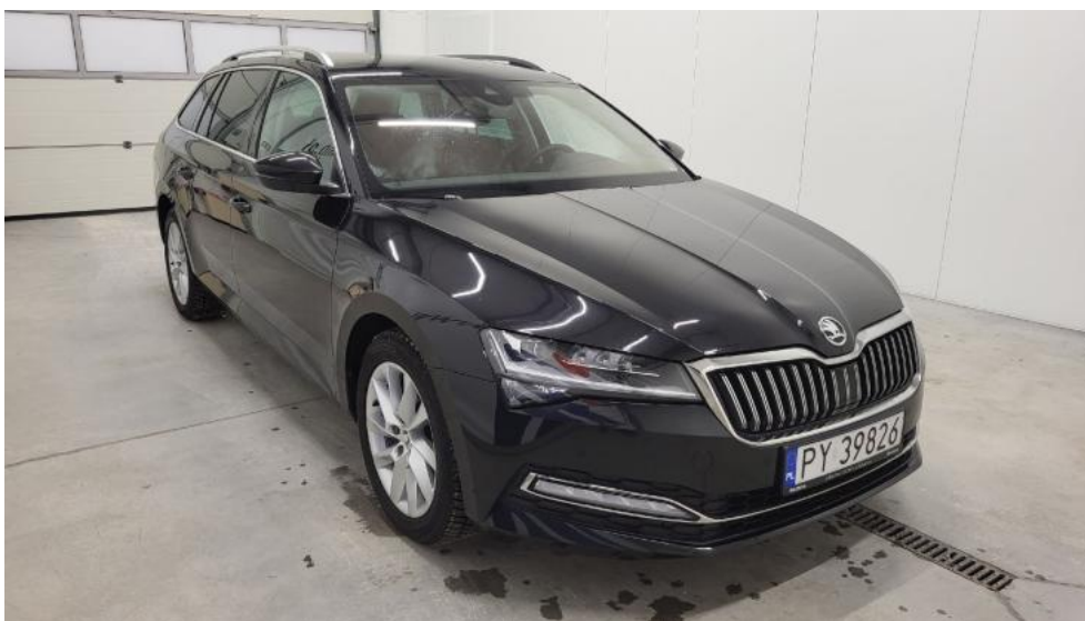
Photo 3. Przekątna przednia prawa