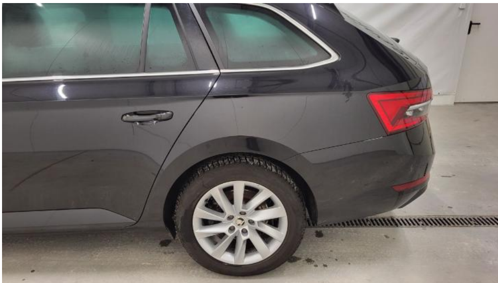
Photo 9. Bok lewy z tyłu