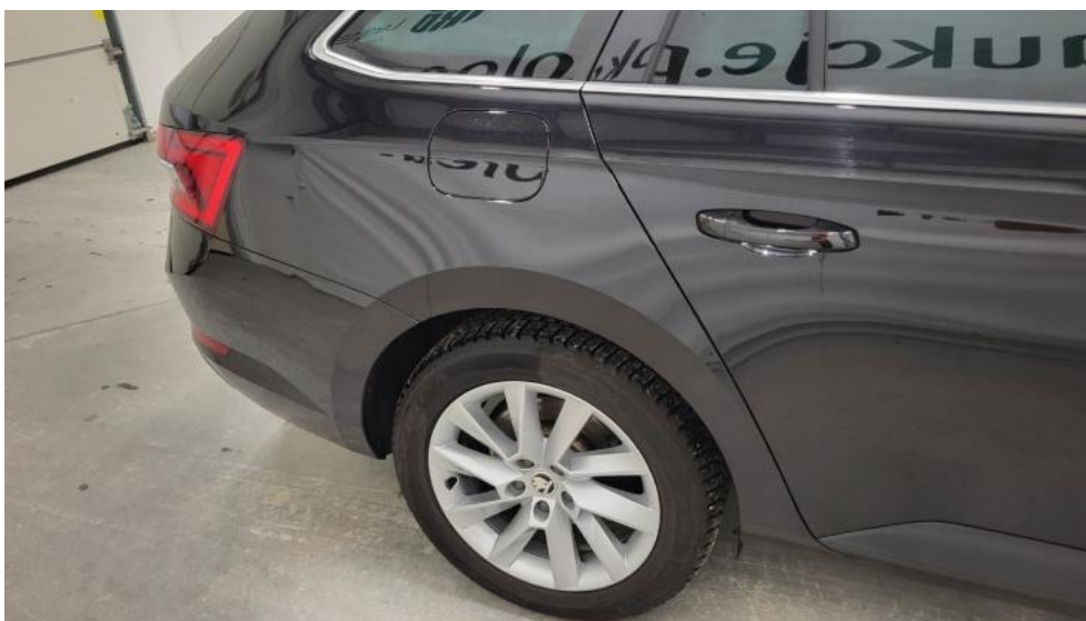
Photo 5. Bok prawy z tyłu