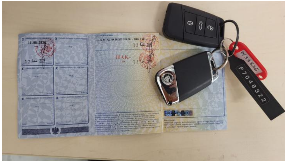
Photo 33. Dow. Rej. Str.2 i klucze