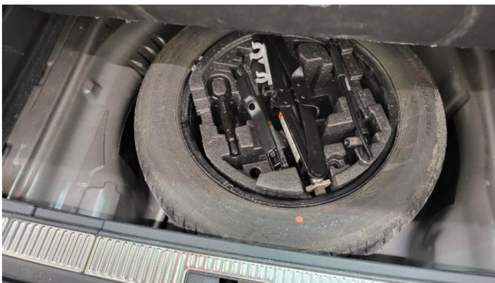
Photo 20. Koło zapasowe