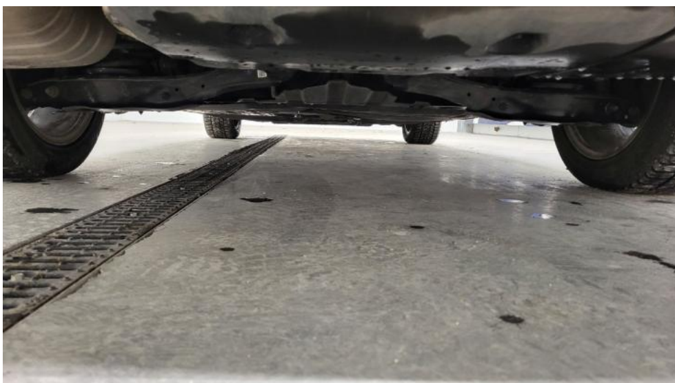
Photo 14. Spód pojazdu tył