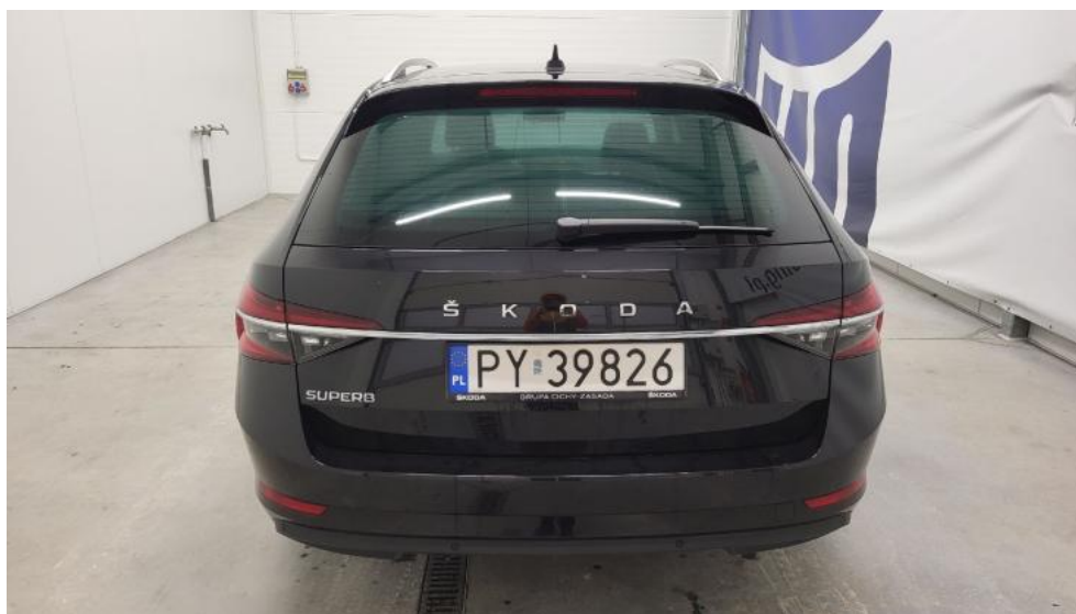
Photo 7. Tyl