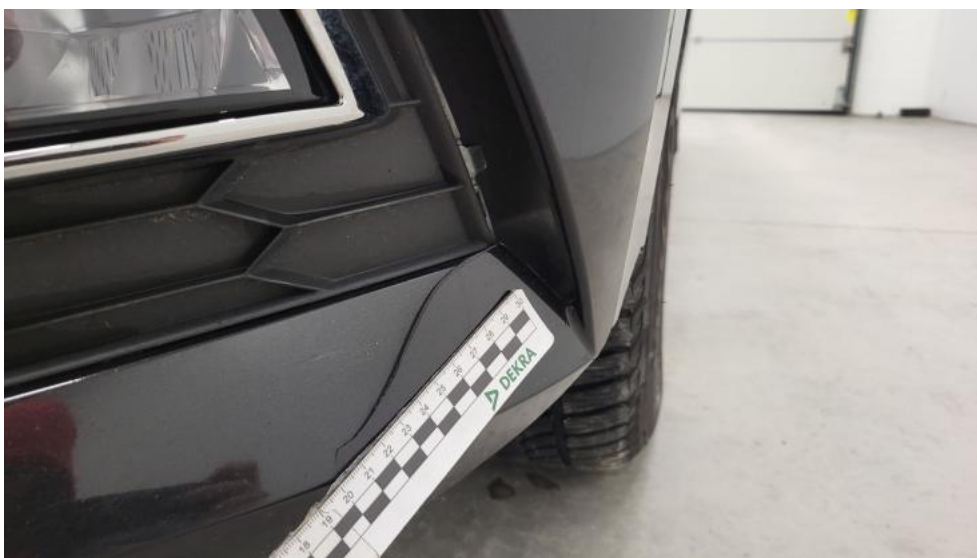
Photo 42. Zderzak - Pęknięcie/rozerwanie 1