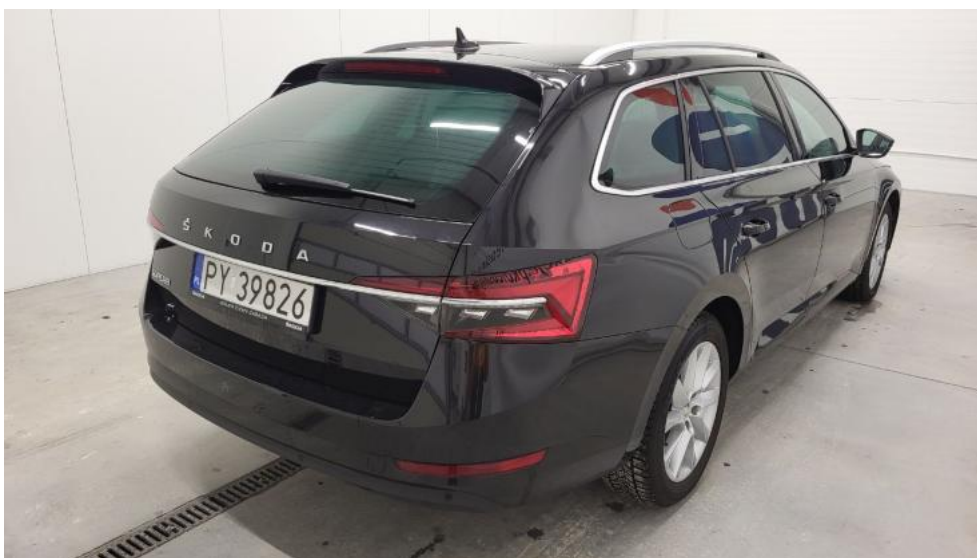
Photo 6. Przekątna tylna prawa