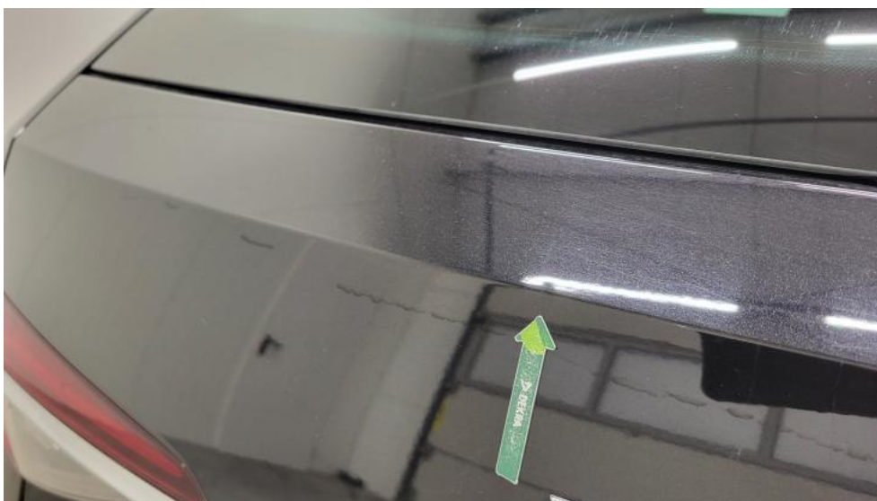
Photo 44. Pokrywy bagażnika - Wgniecenie/odkształcenie 1