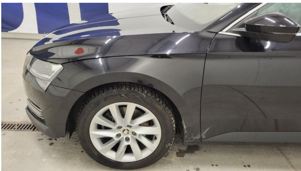
Photo 10. Bok lewy z przodu