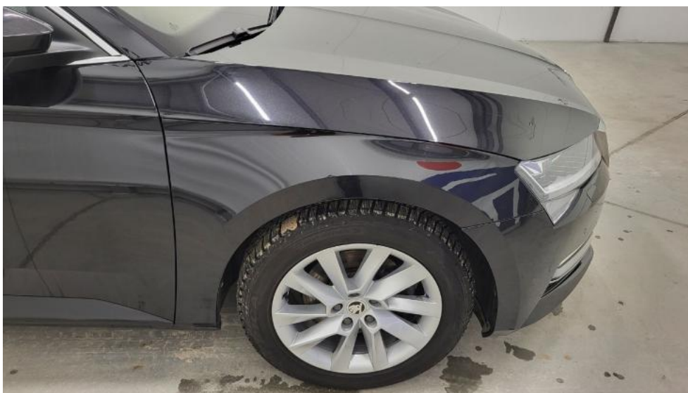
Photo 4. Bok prawy z przodu