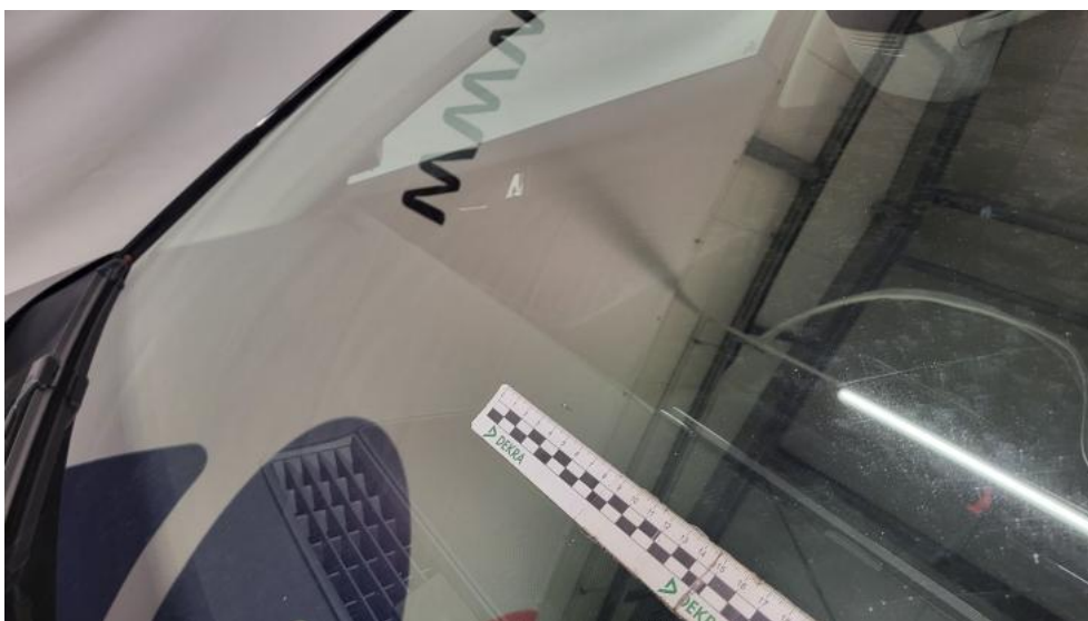
Photo 38. Szyba czołowa - zdjęcie poglądowe 1