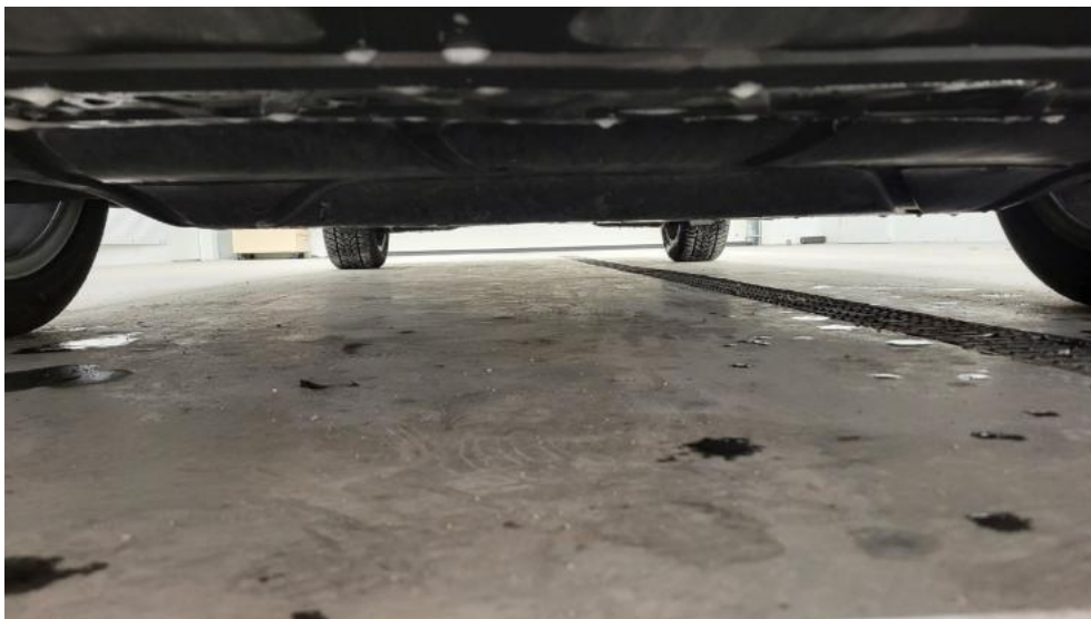
Photo 13. Spód pojazdu przód