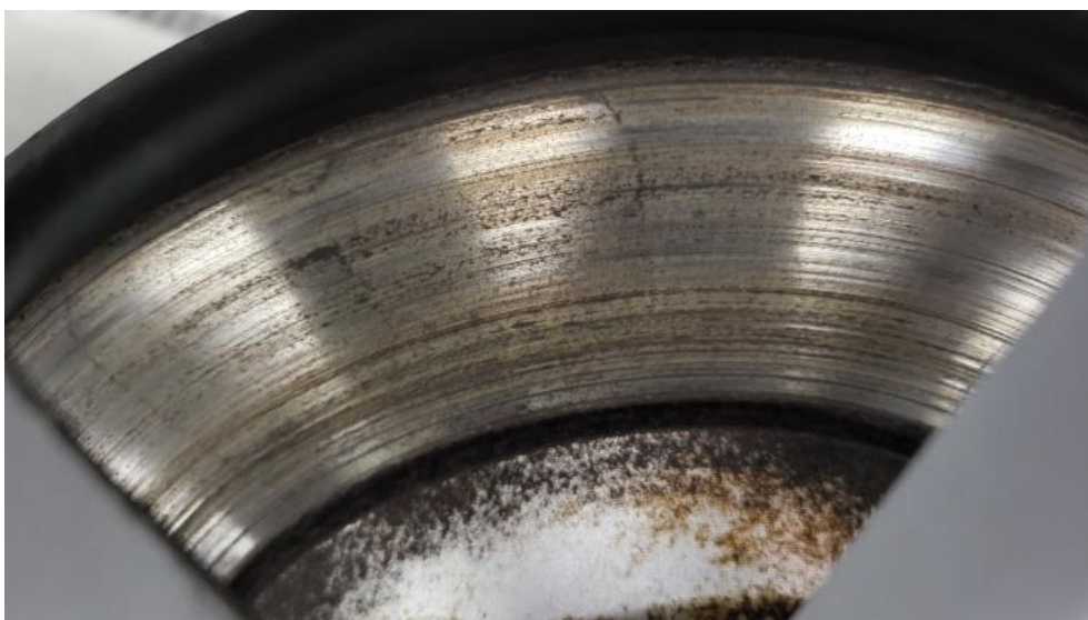
Photo 16. Tarcza hamulcowa tylna prawa