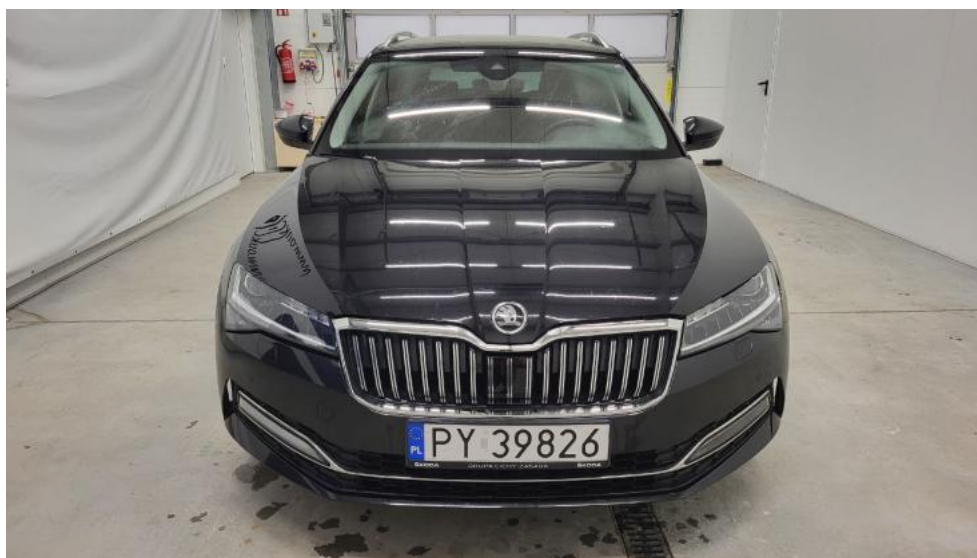
Photo 2. Przód