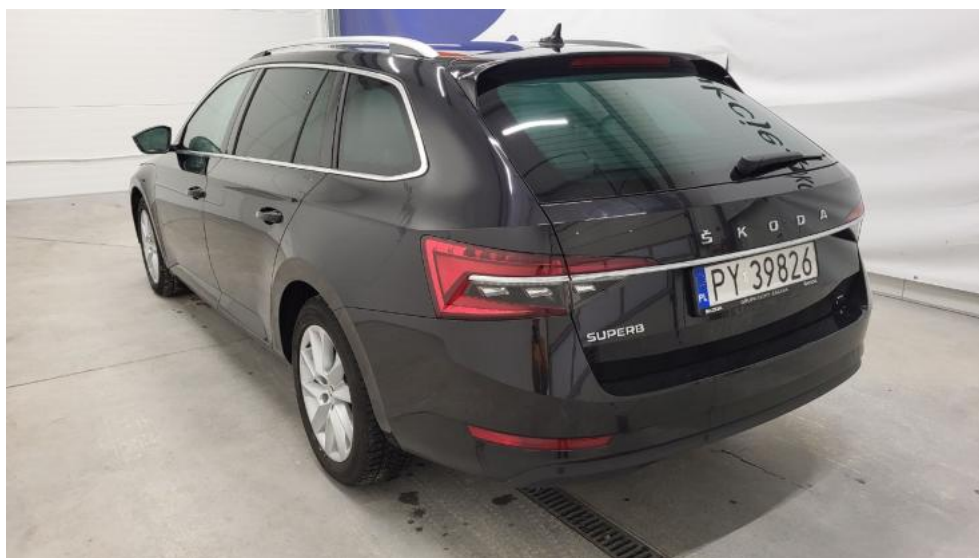
Photo 8. Przekątna tylna lewa