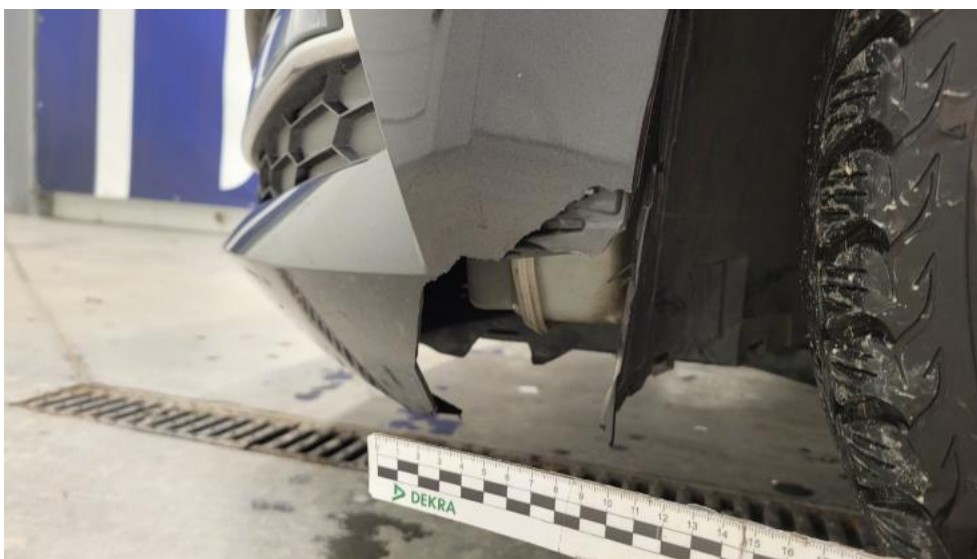
Photo 43. Zderzak - Pęknięcie/rozerwanie 2