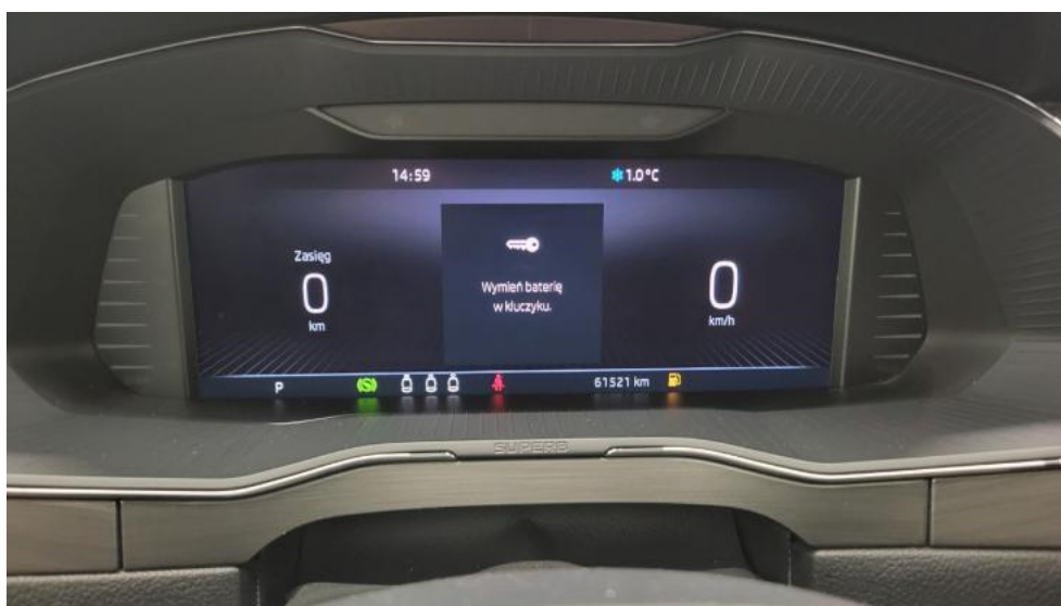
Photo 24. Zestaw wskaźników - przebieg