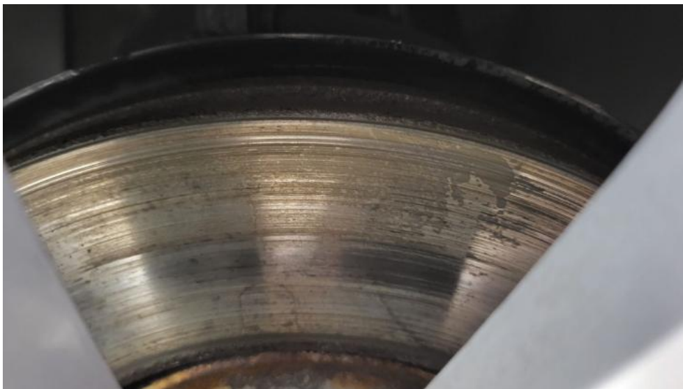
Photo 15. Tarcza hamulcowa przednia prawa