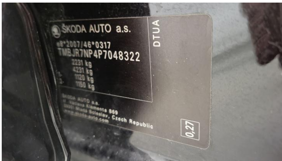
Photo 23. Tabliczka znamionowa