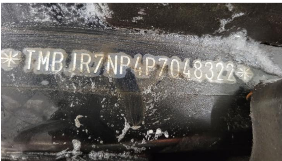
Photo 22. Numer identyfikacyjny