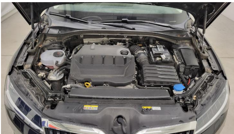
Photo 21. Komora silnika