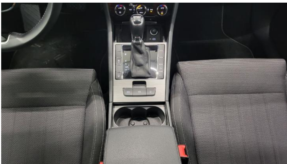
Photo 30. Tunel środkowy