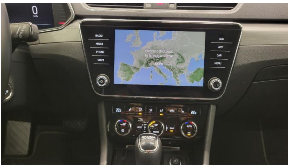
Photo 29. Konsola środkowa