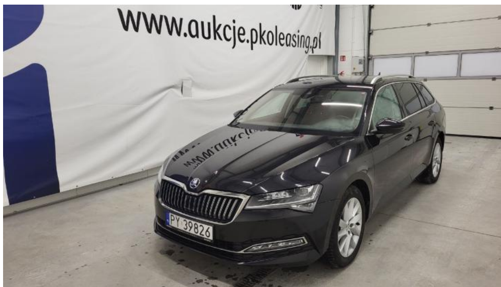
Photo 1. Przekątna przednia lewa