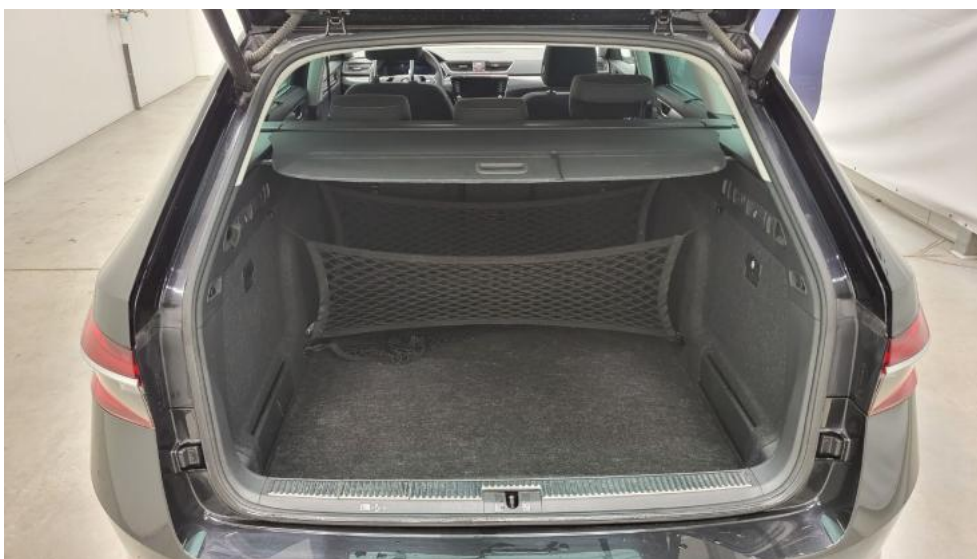
Photo 19. Bagażnik