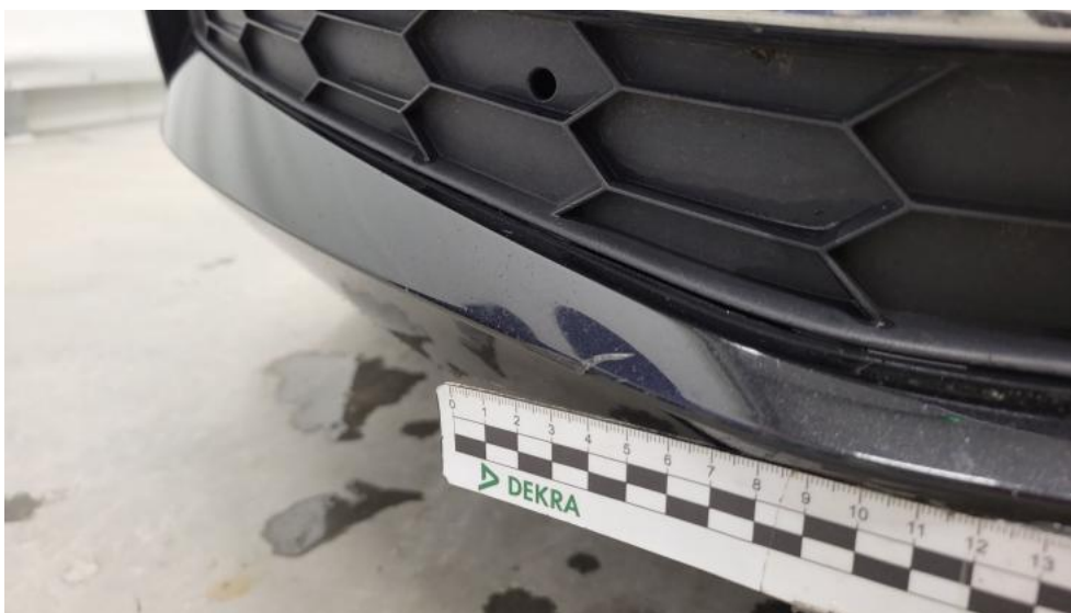
Photo 41. Zderzak - Rysa/odprysk 1