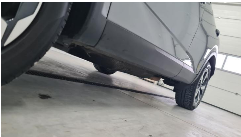
Fot. 11. Próg lewy (widok od przodu)