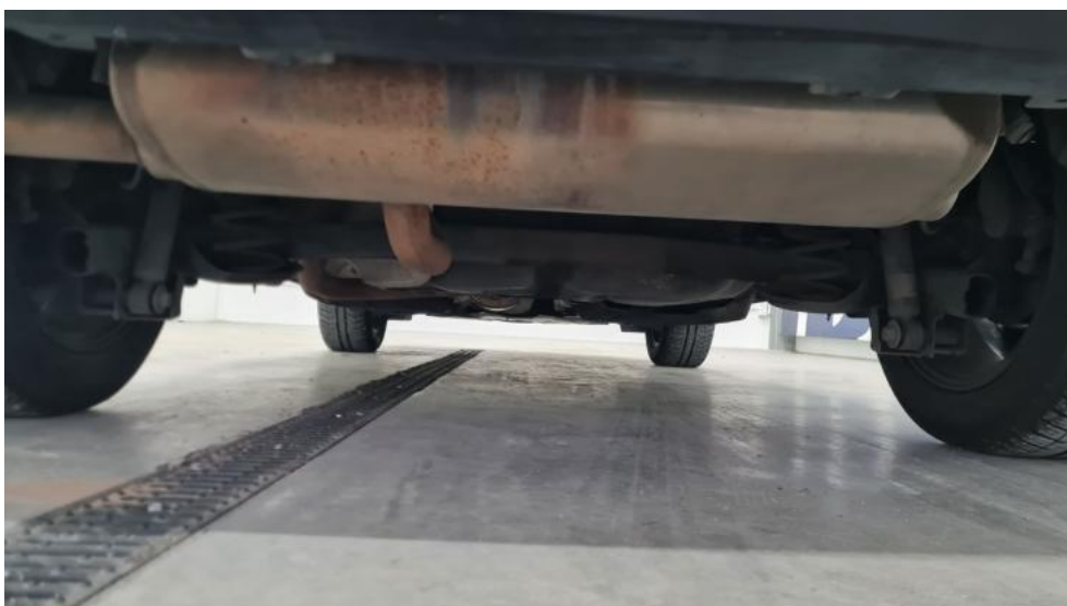
Fot. 14. Spód pojazdu tył