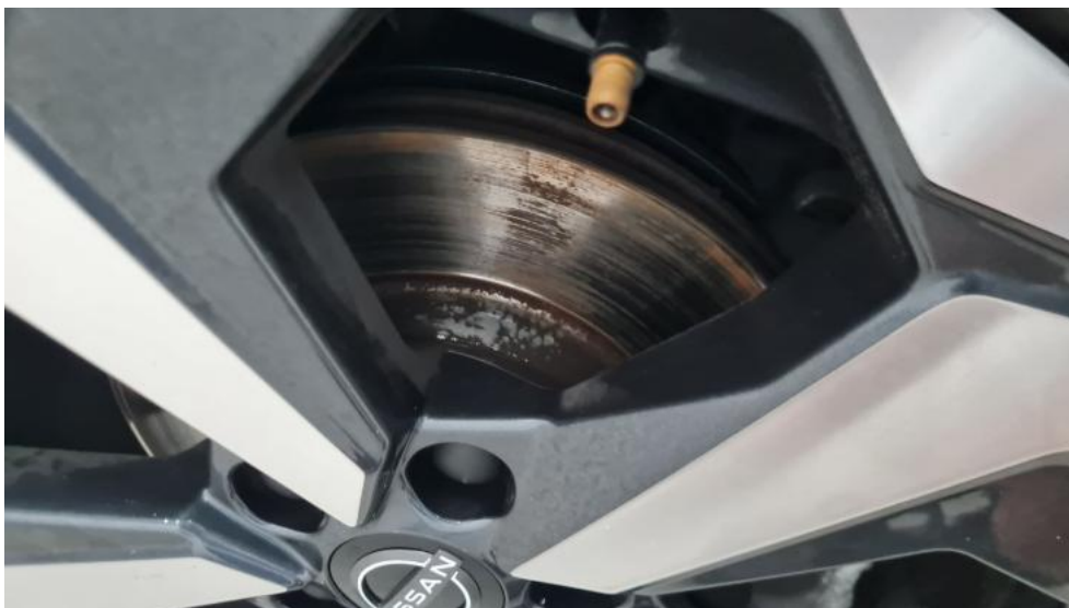
Fot. 15. Tarcza hamulcowa przednia prawa