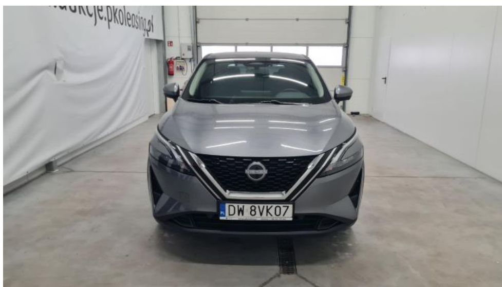
Fot. 2. Przód