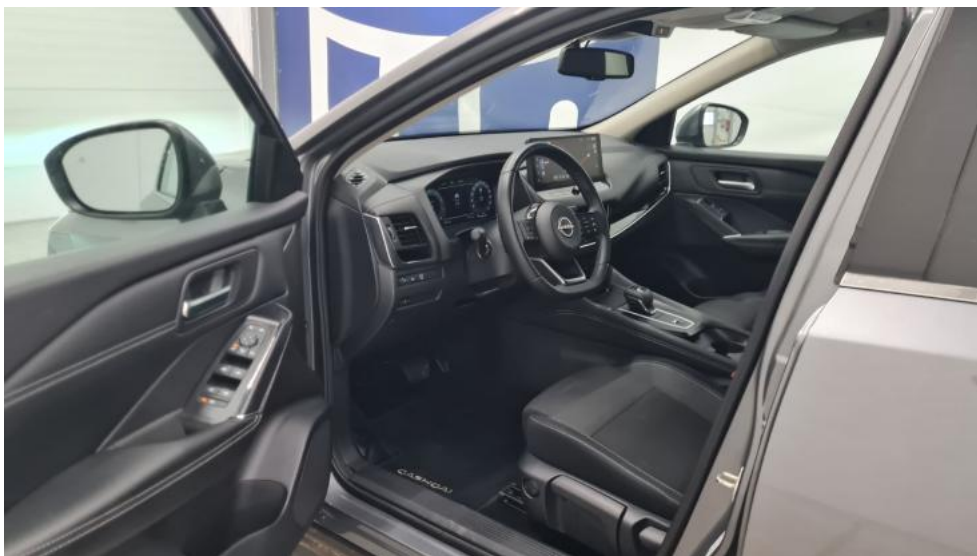
Fot. 25. Widok przez otwarte drzwi przednie lewe