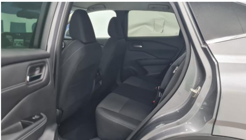
Fot. 27. Widok przez otwarte drzwi tylne lewe