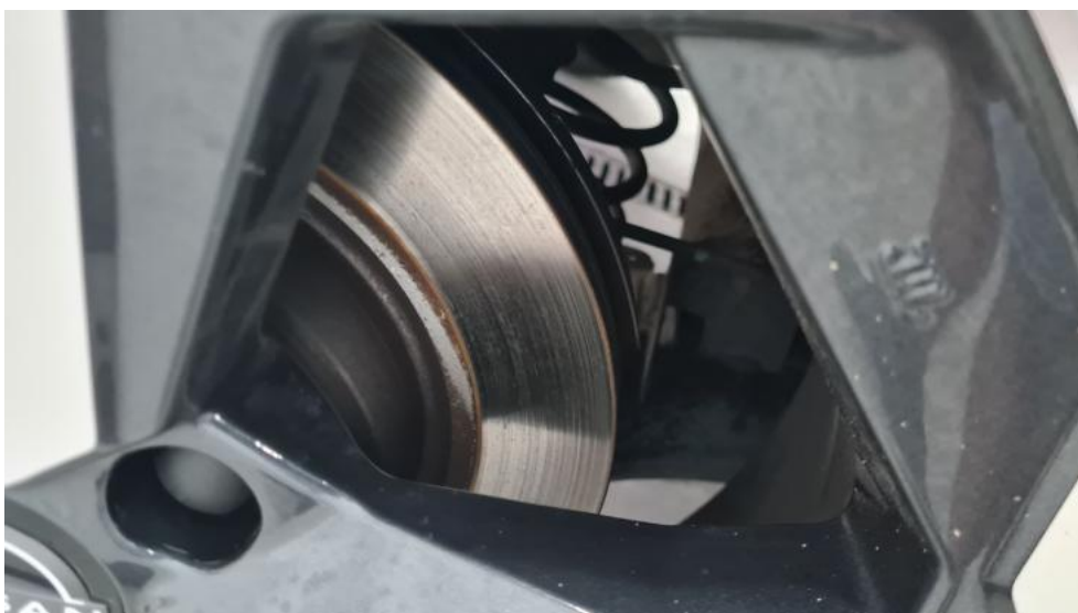
Fot. 16. Tarcza hamulcowa tylna prawa