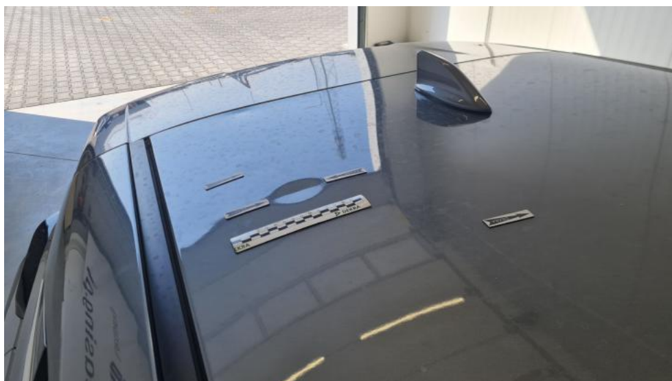
Fot. 38. Dach - Wgniecenie/odkształcenie 1