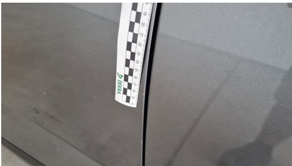
Fot. 40. Drzwi przed L - Rysa/odprysk 1