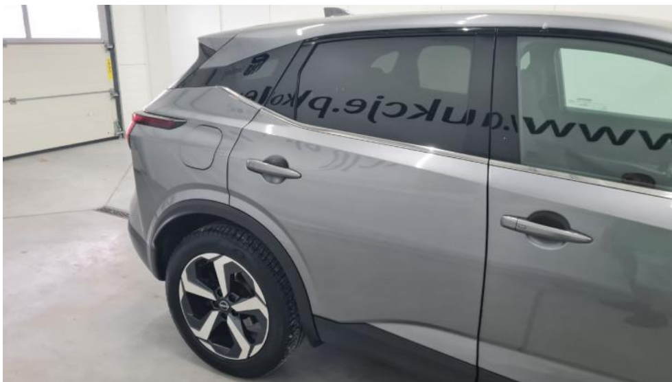
Fot. 5. Bok prawy z tyłu