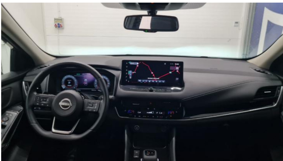
Fot. 28. Widok z tylnej kanapy na deskę rozdź.