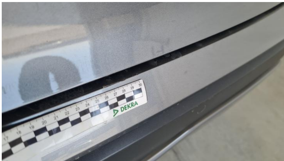
Fot. 37. Zderzak tylny - Rysa/odprysk 1