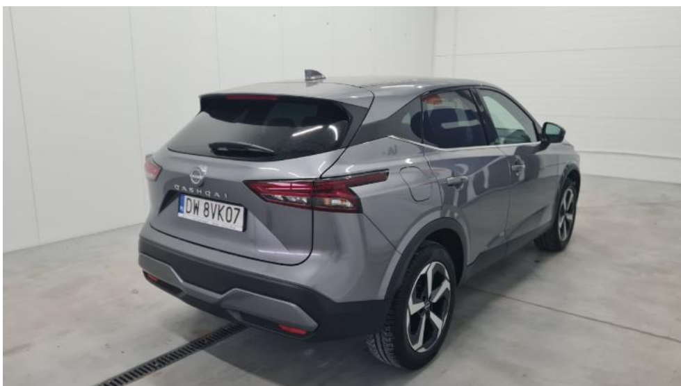
Fot. 6. Przekątna tylna prawa