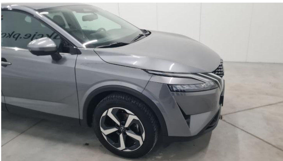
Fot. 4. Bok prawy z przodu