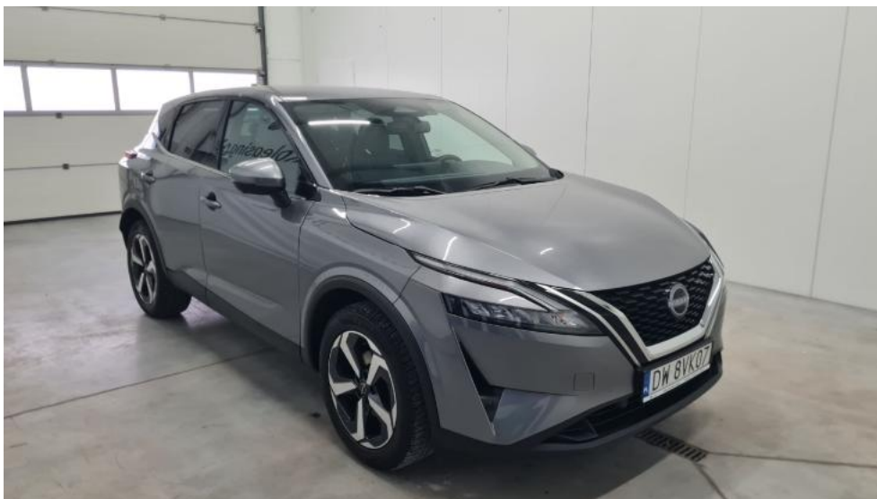
Fot. 3. Przekątna przednia prawa