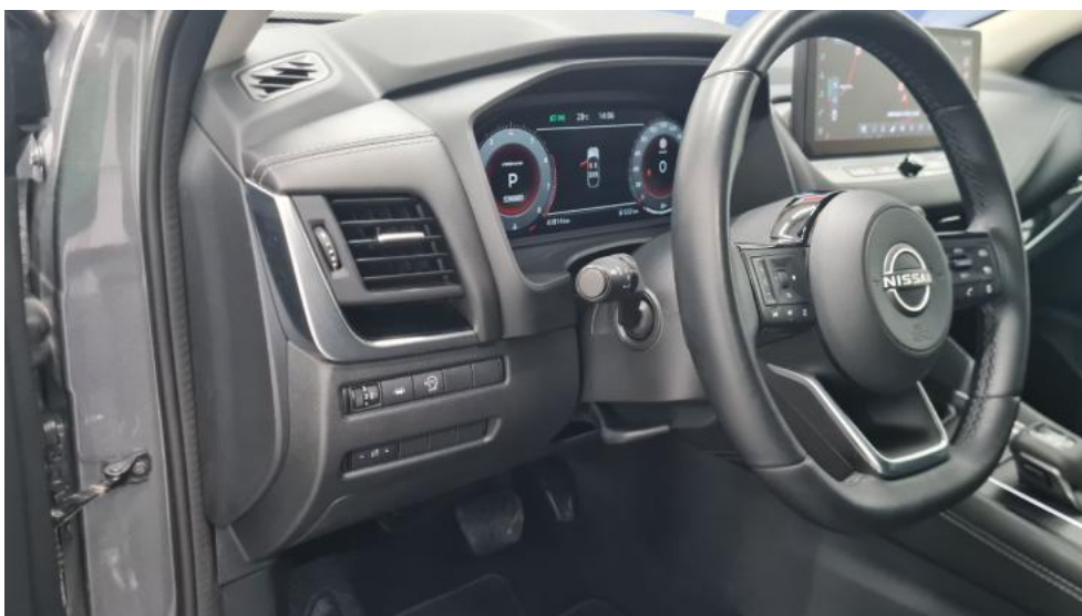
Fot. 26. Kierownica z lewej strony