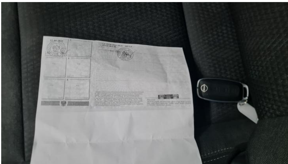
Fot. 33. Dow. Rej. ksero Str.2 i klucze