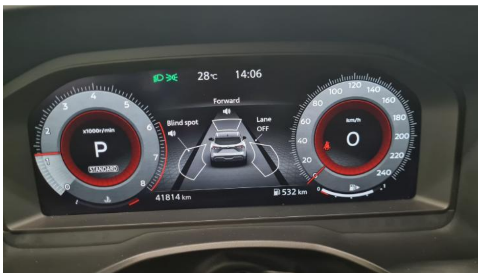
Fot. 24. Zestaw wskaźników - przebieg