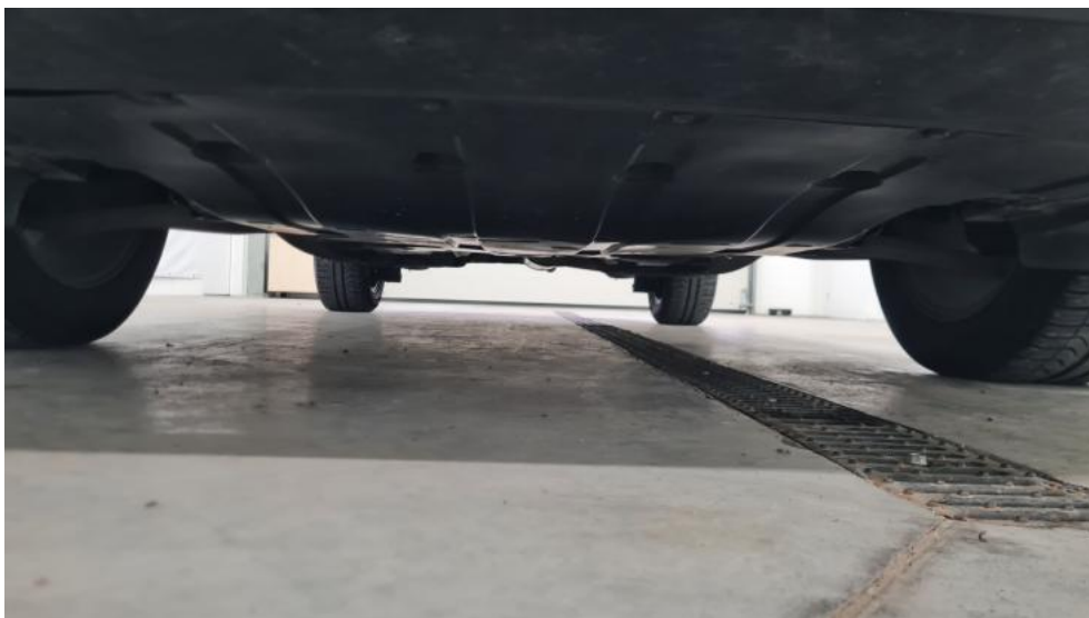
Fot. 13. Spód pojazdu przód