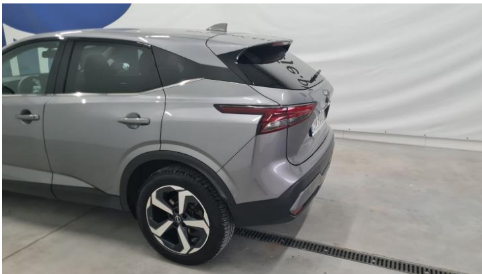
Fot. 9. Bok lewy z tyłu