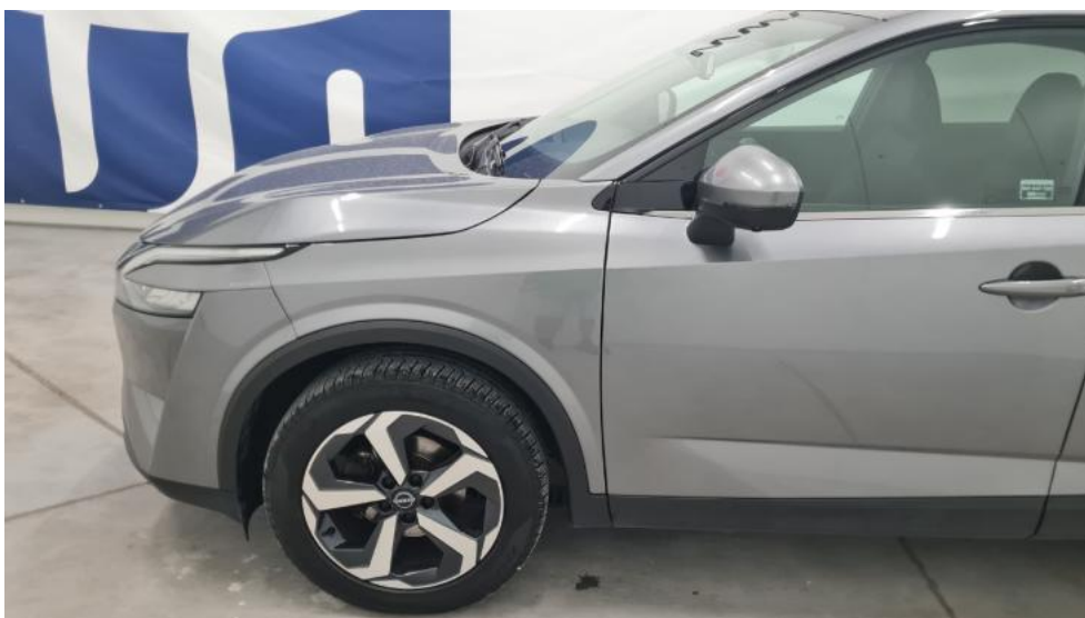
Fot. 10. Bok lewy z przodu