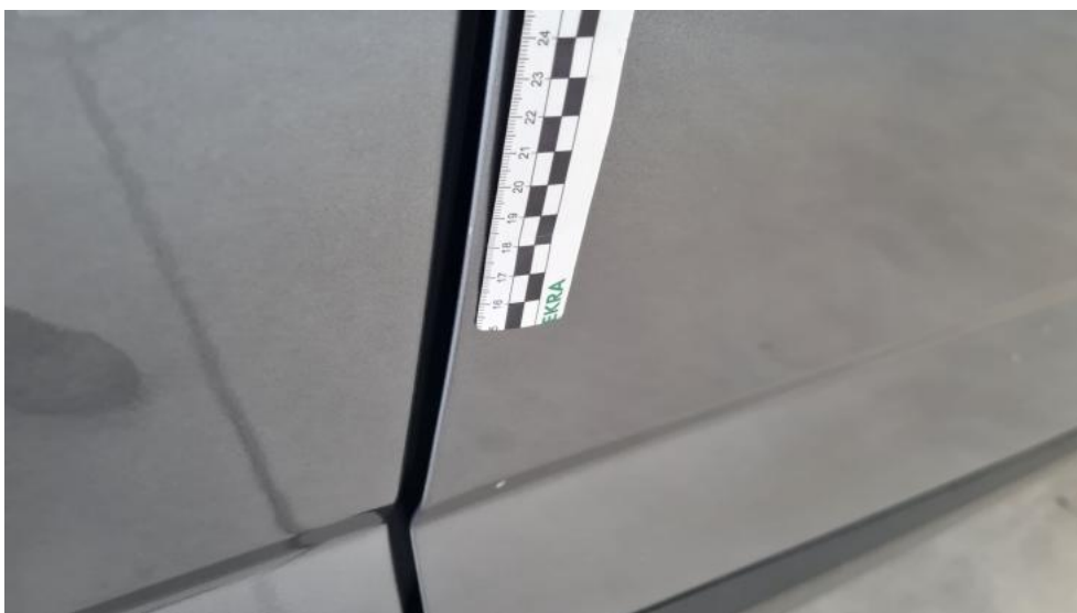
Fot. 36. Drzwi przednie P - Rysa/odprysk 1