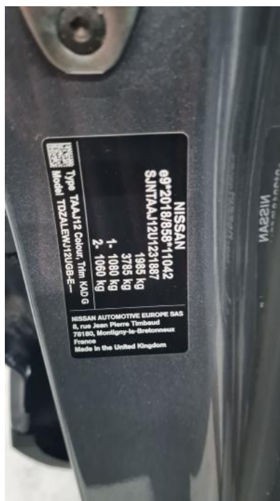
Fot. 23. Tabliczka znamionowa