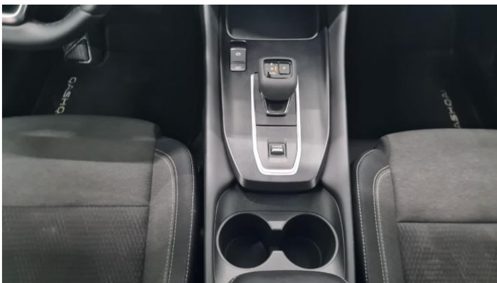
Fot. 30. Tunel środkowy