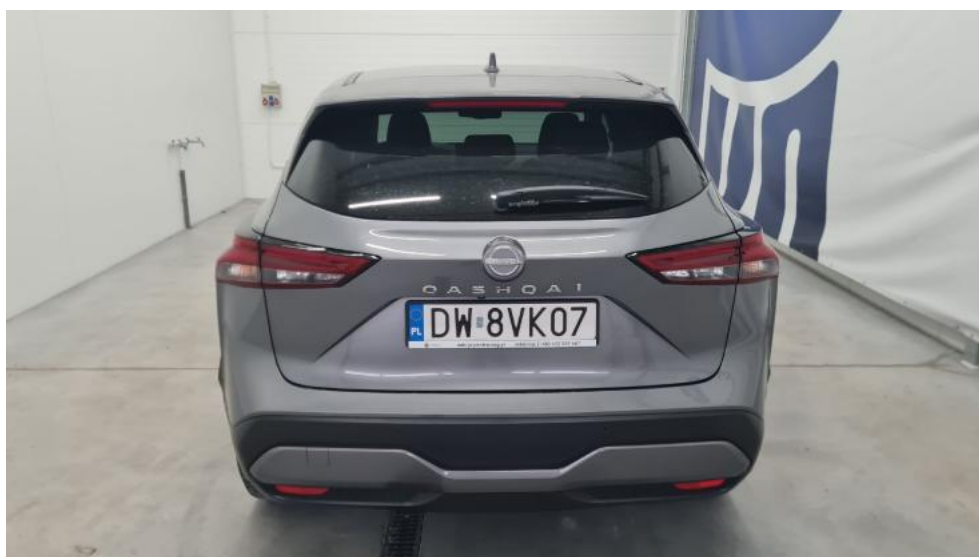
Fot. 7. Tył