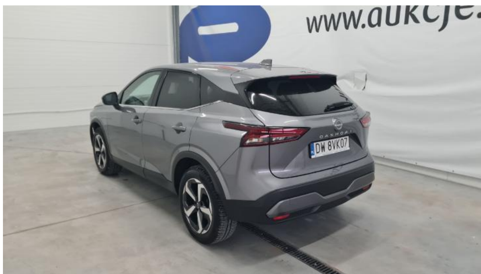
Fot. 8. Przekątna tylna lewa