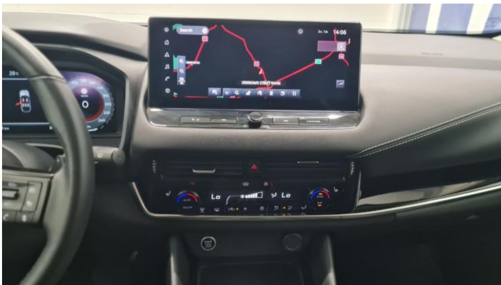
Fot. 29. Konsola środkowa