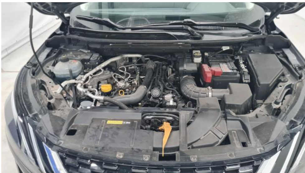
Fot. 21. Komora silnika