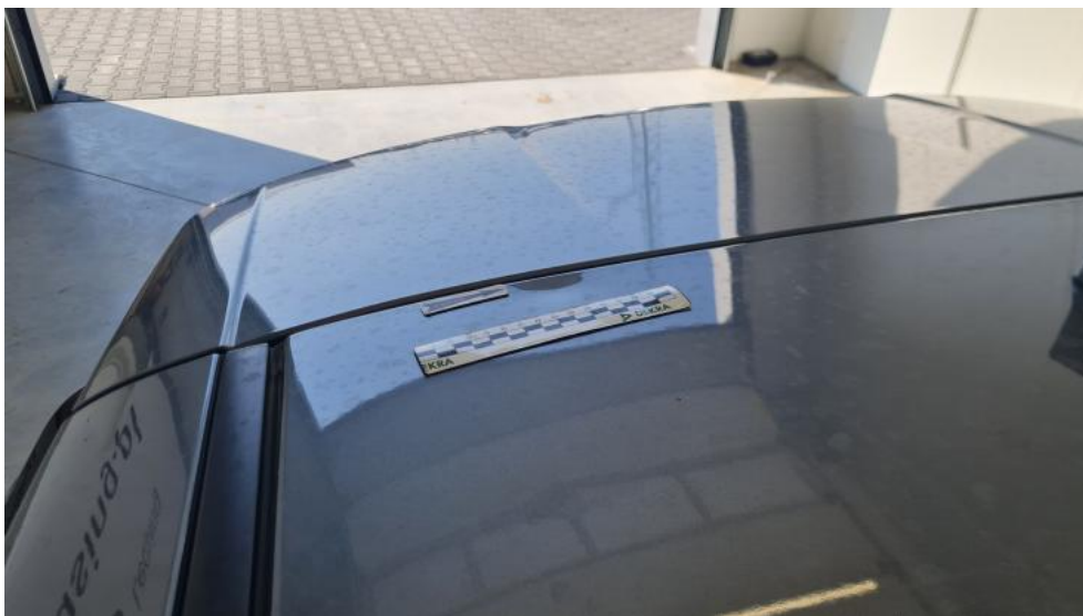
Fot. 39. Dach - Wgniecenie/odkształcenie 2