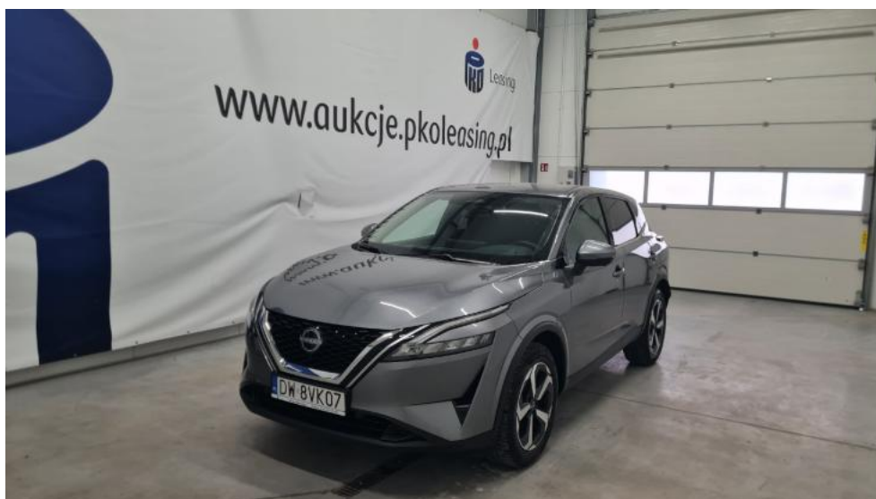
Fot. 1. Przekątna przednia lewa