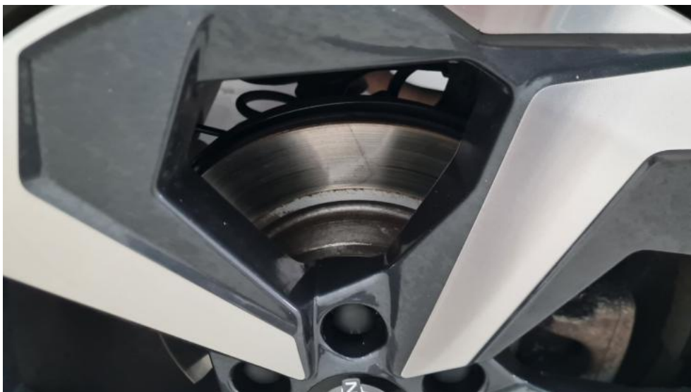
Fot. 17. Tarcza hamulcowa tylna lewa