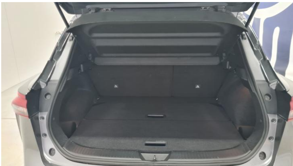
Fot. 19. Bagażnik