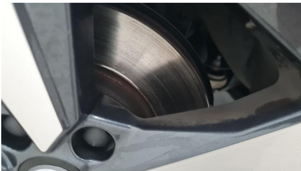
Fot. 18. Tarcza hamulcowa przednia lewa