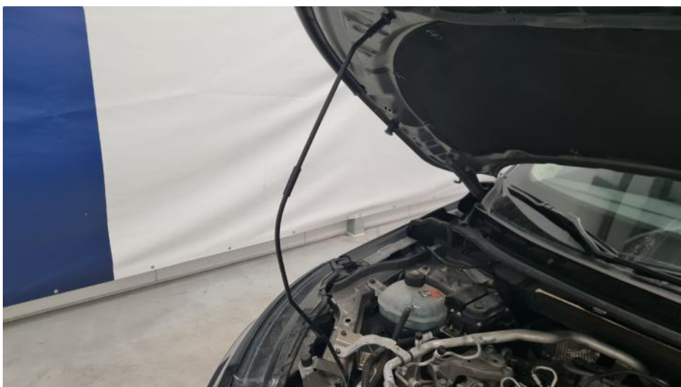
Fot. 34. Zdjęcie do protokołu