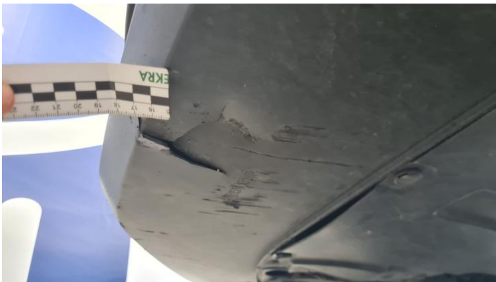
Fot. 35. Spoiler zderzaka przedniego - Pęknięcie/rozerwanie 1