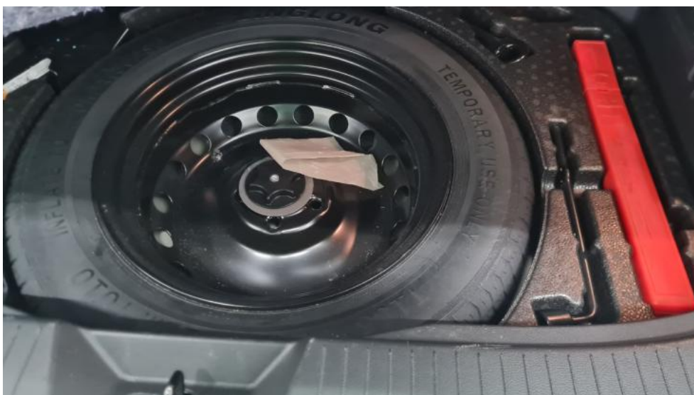
Fot. 20. Koło zapasowe