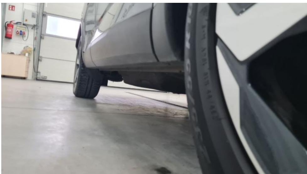
Fot. 12. Próg prawy (widok od przodu)