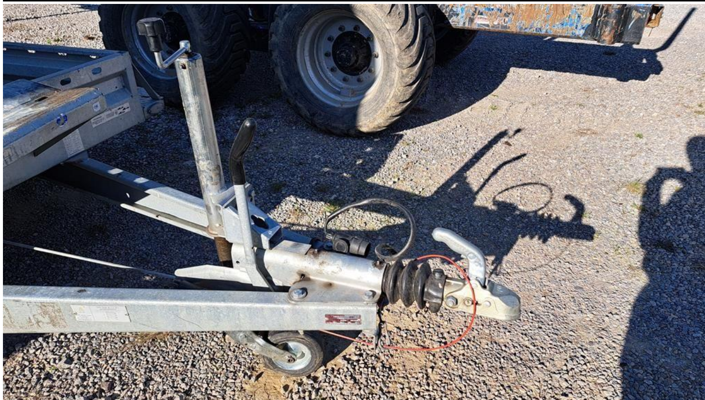
Fot. nr 9