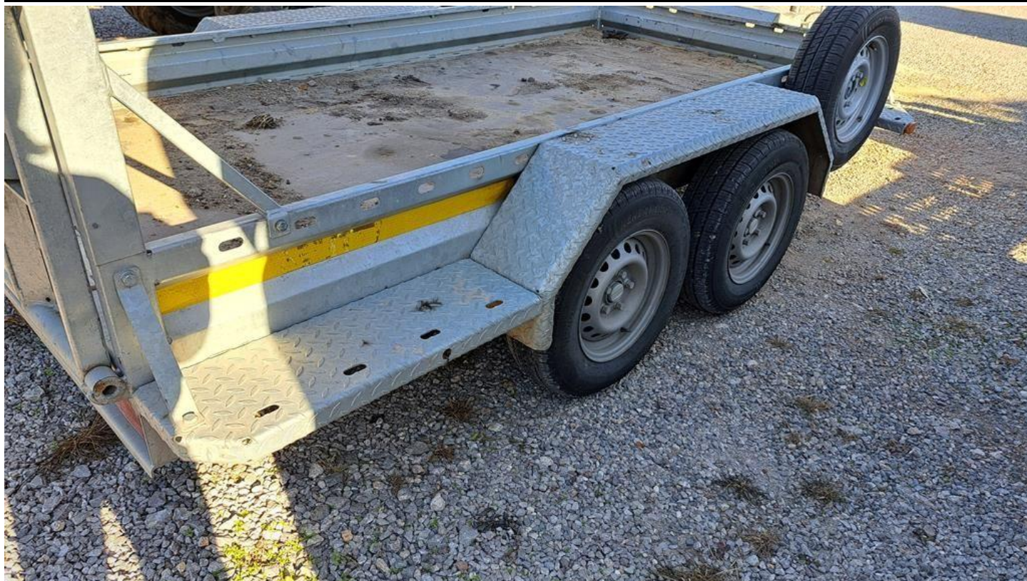
Fot. nr 17