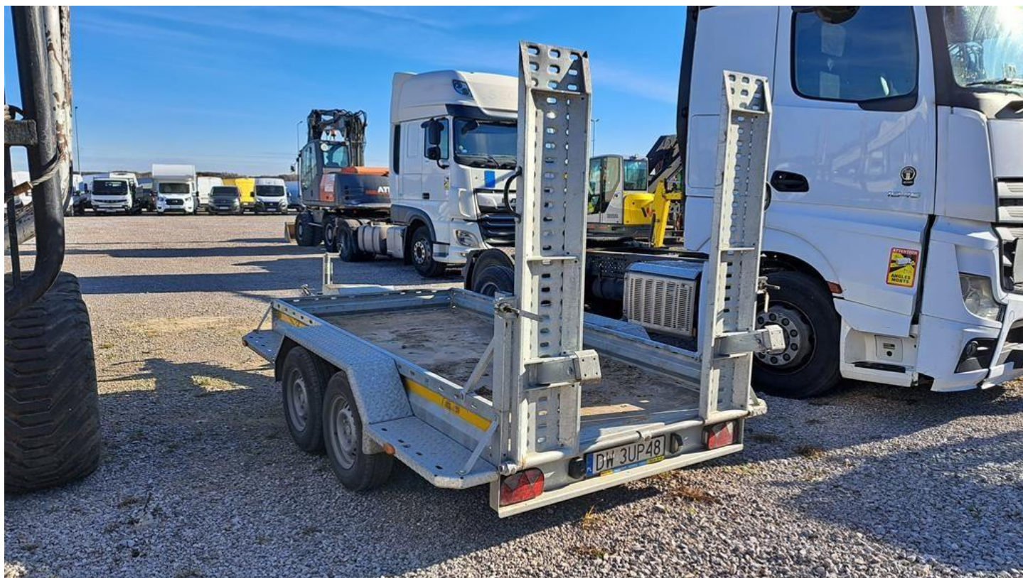
Fot. nr 6