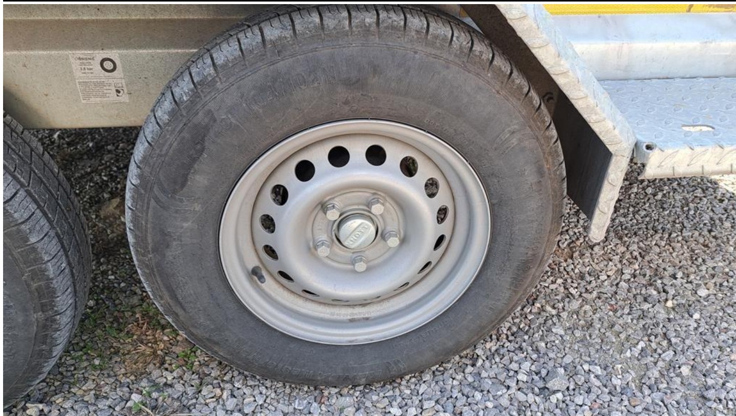
Fot. nr 15