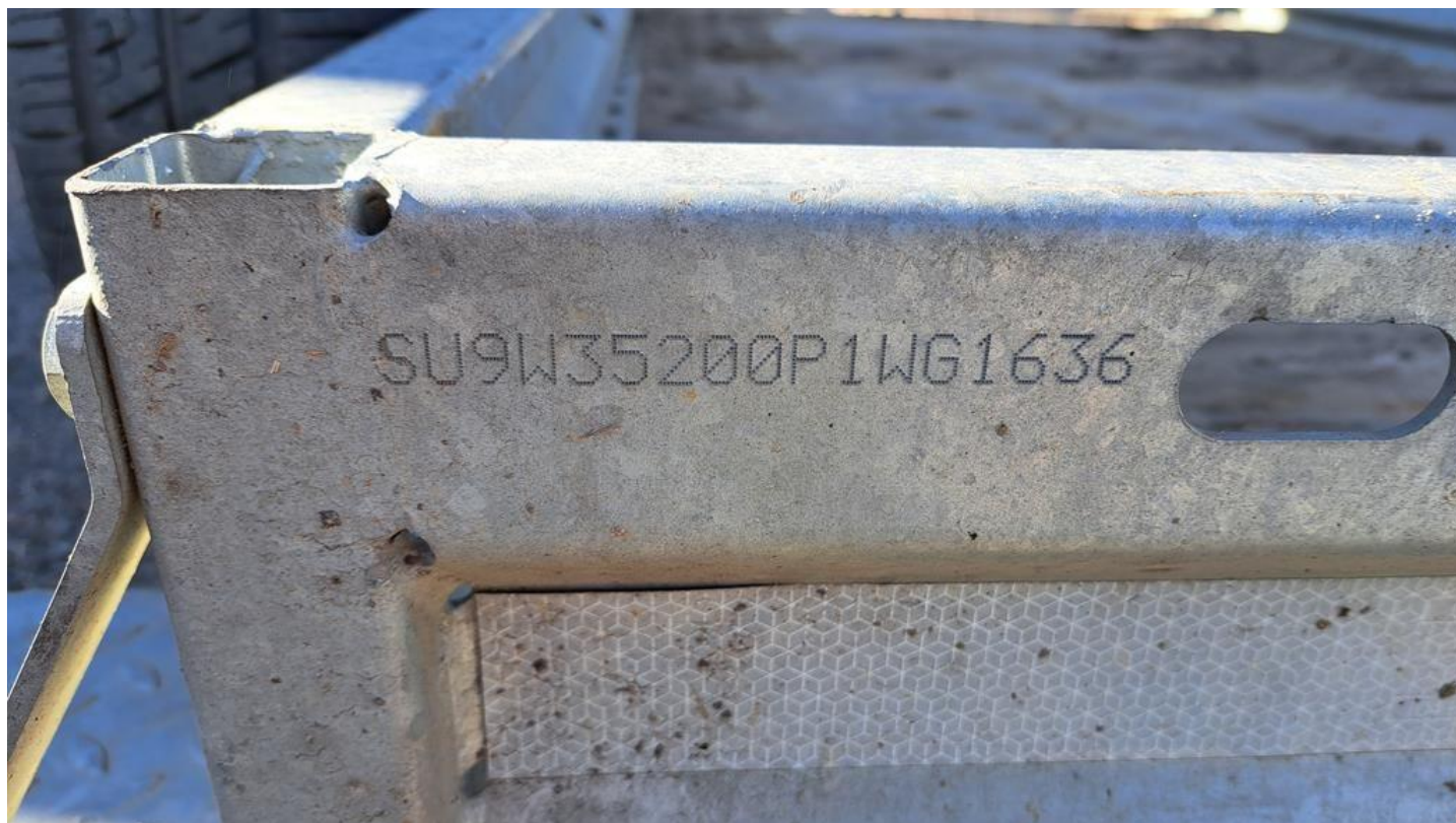
Fot. nr 8