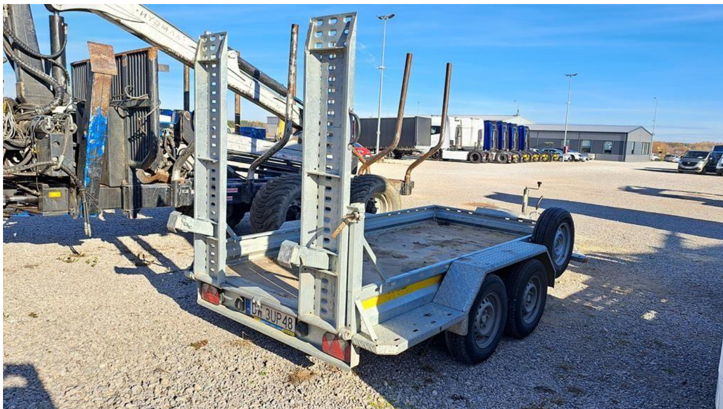
Fot. nr 4