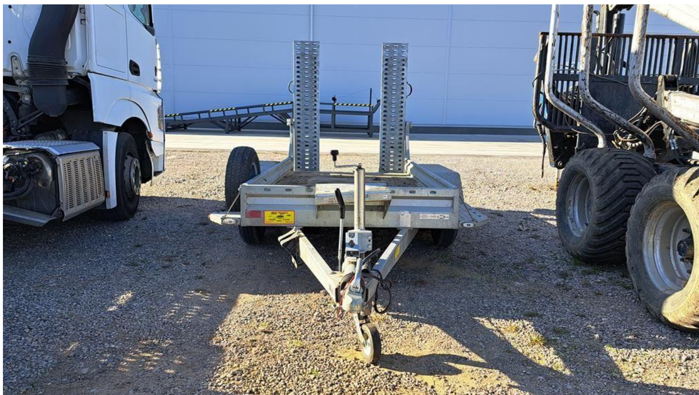
Fot. nr 2