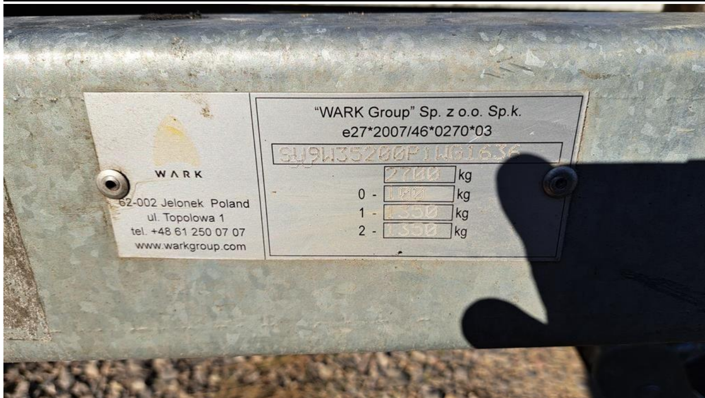
Fot. nr 7