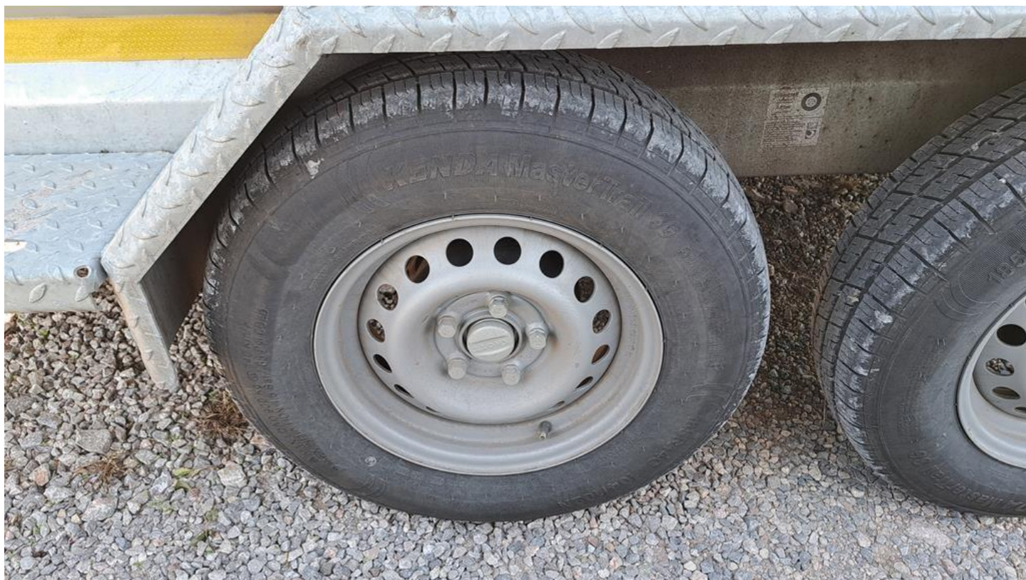
Fot. nr 20