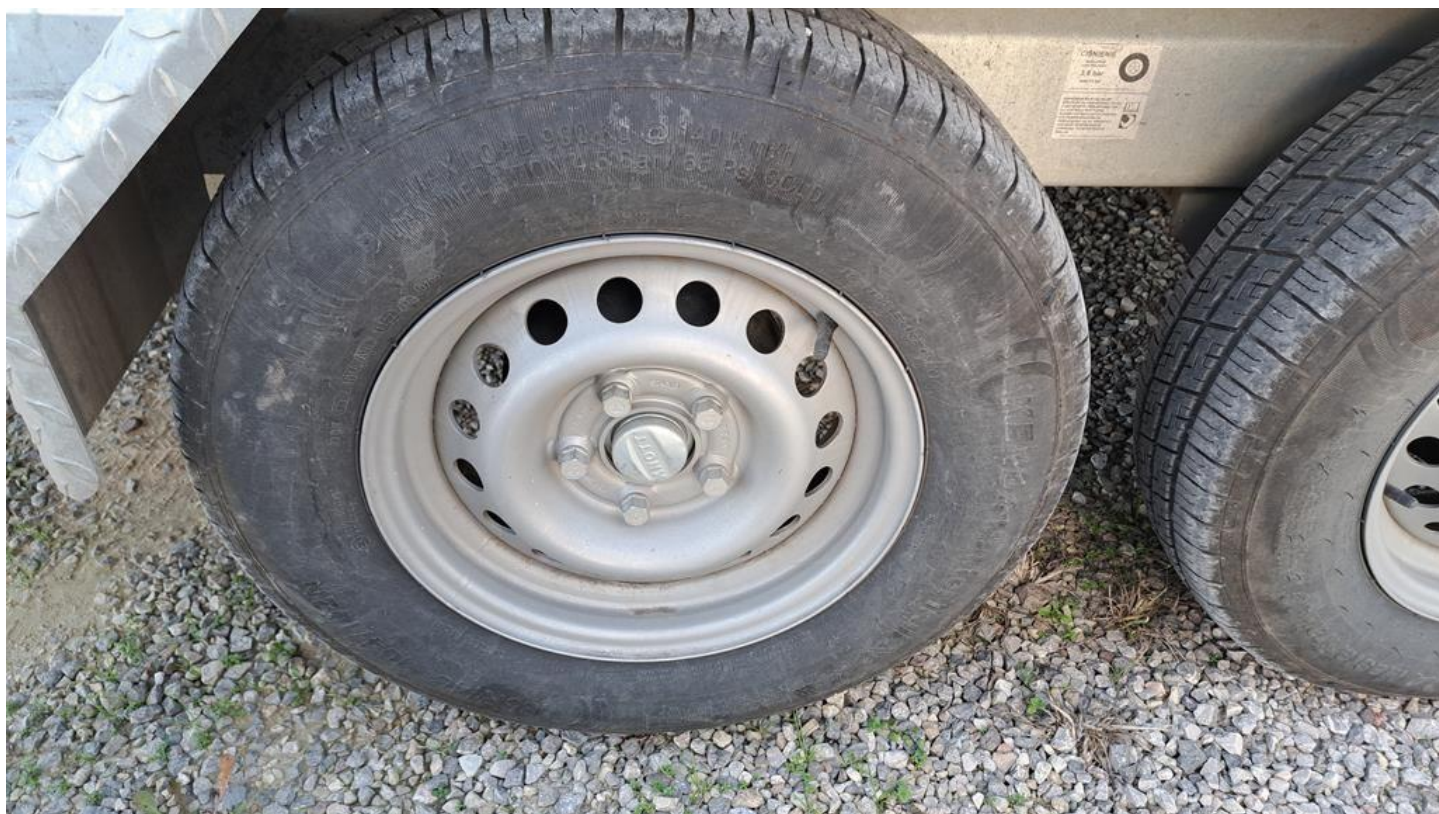
Fot. nr 14