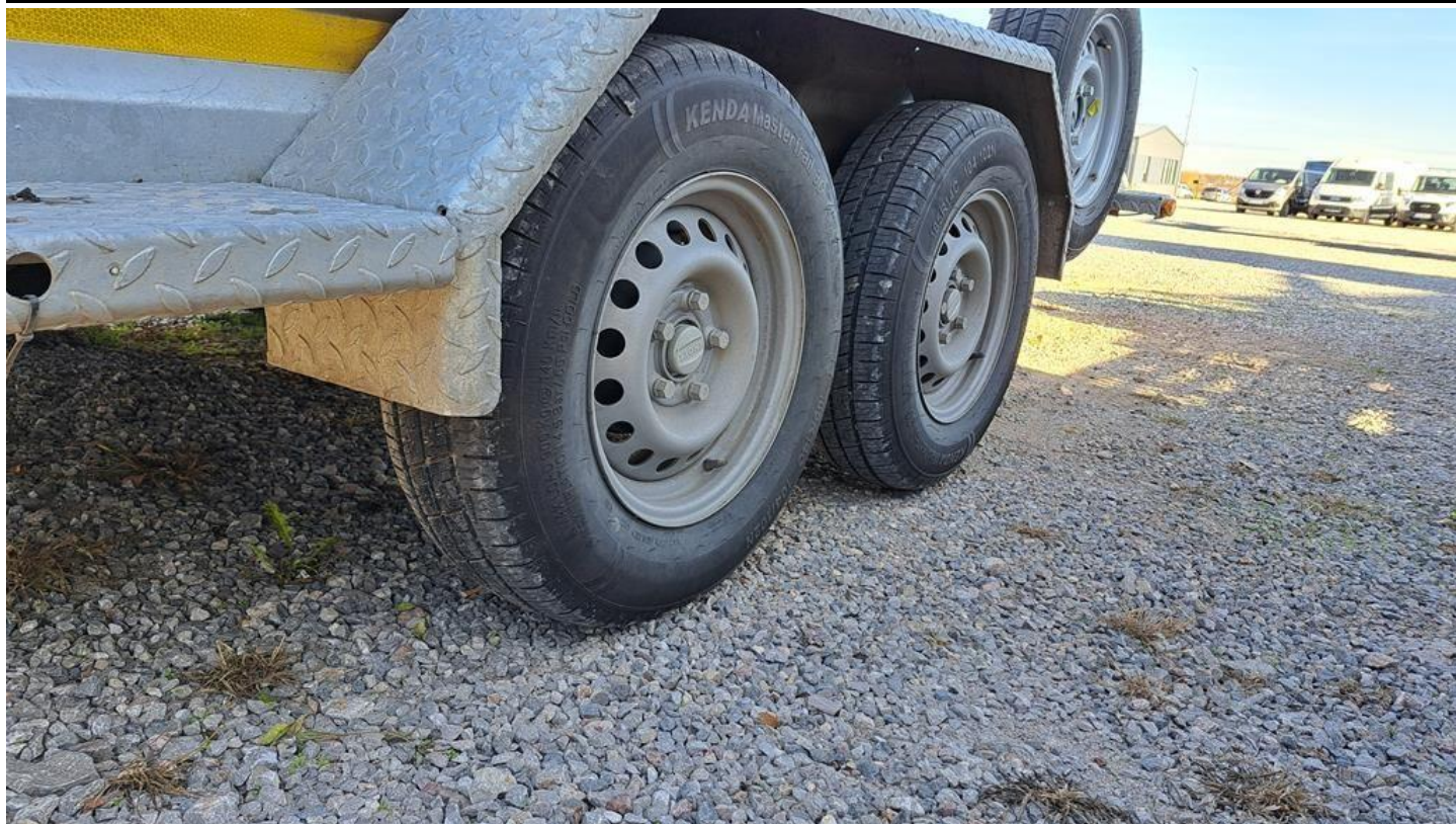
Fot. nr 19