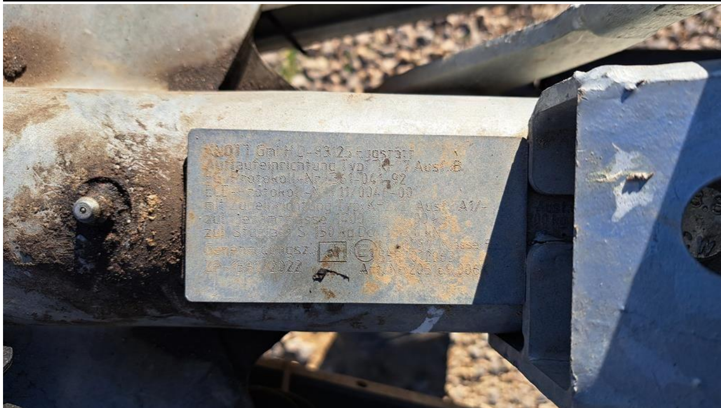
Fot. nr 23