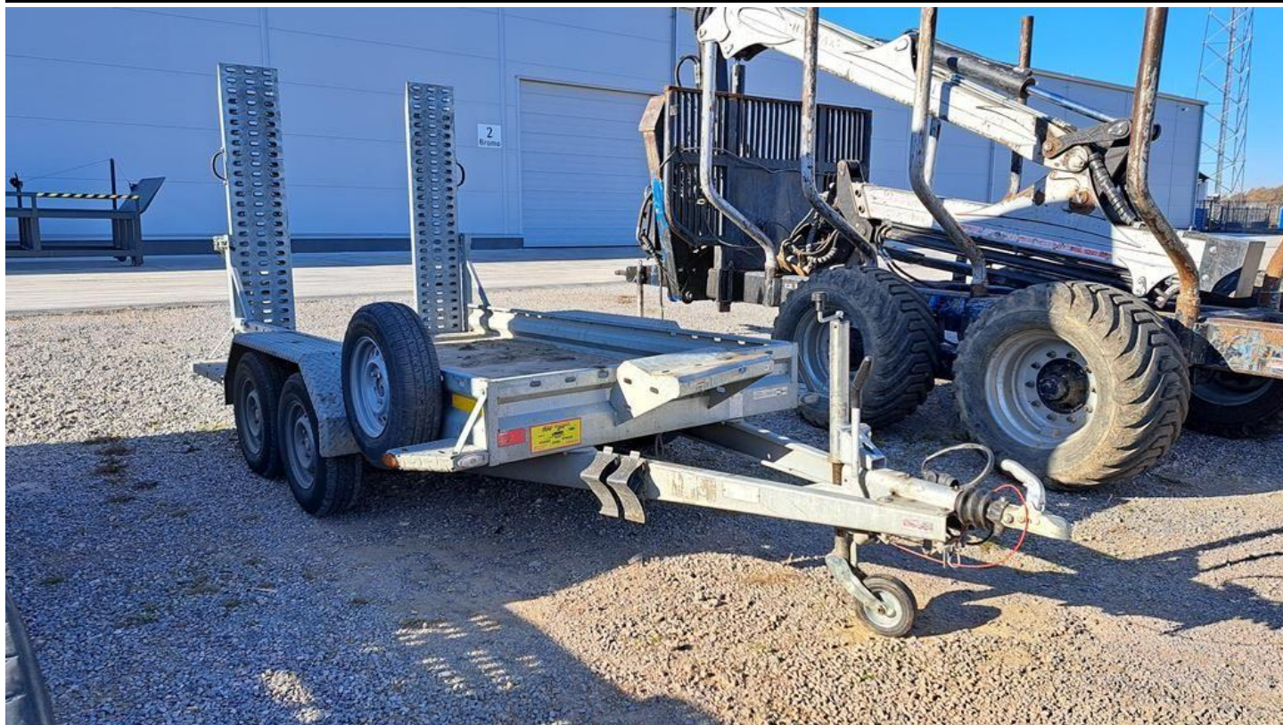
Fot. nr 3