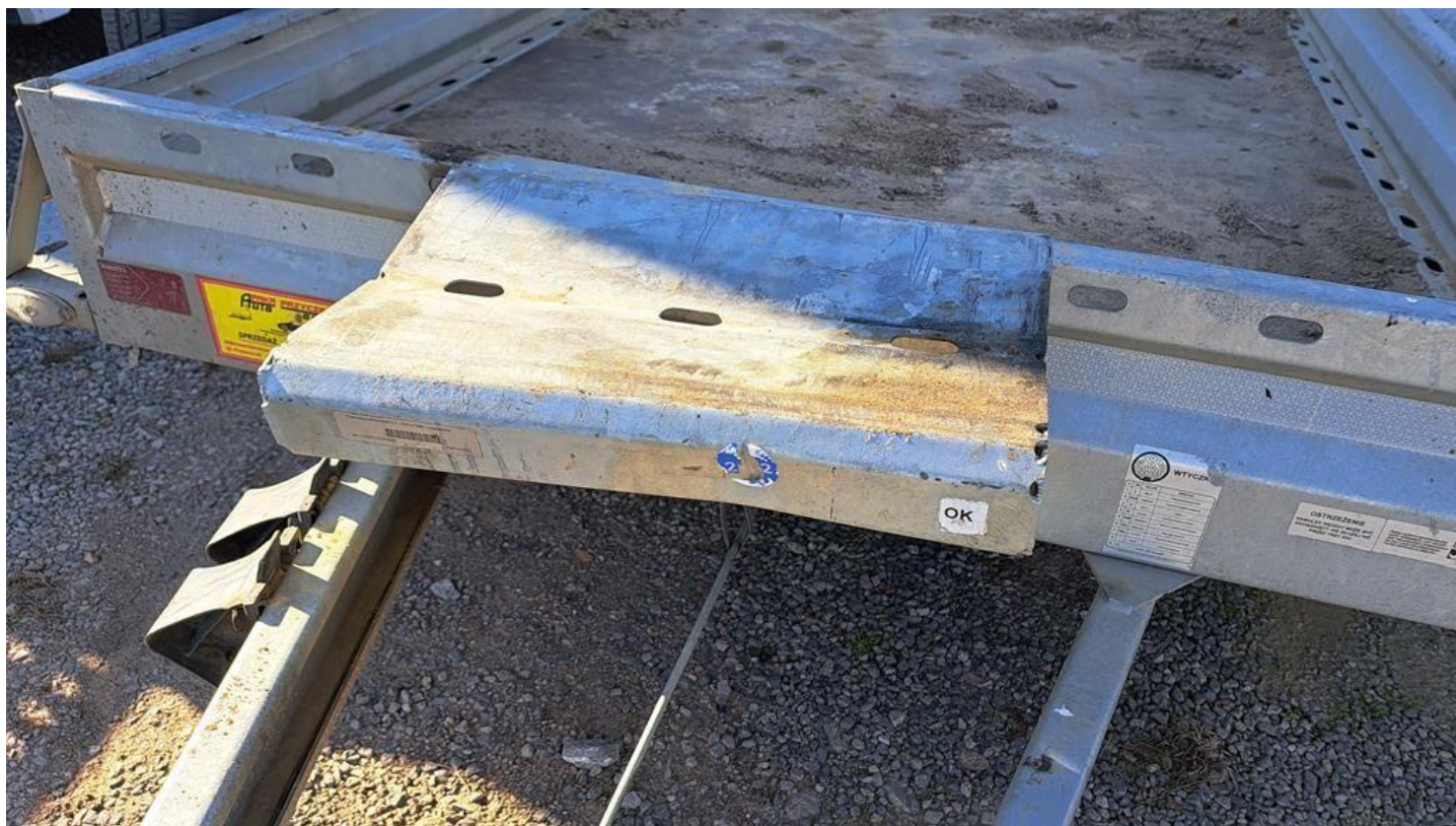
Fot. nr 24