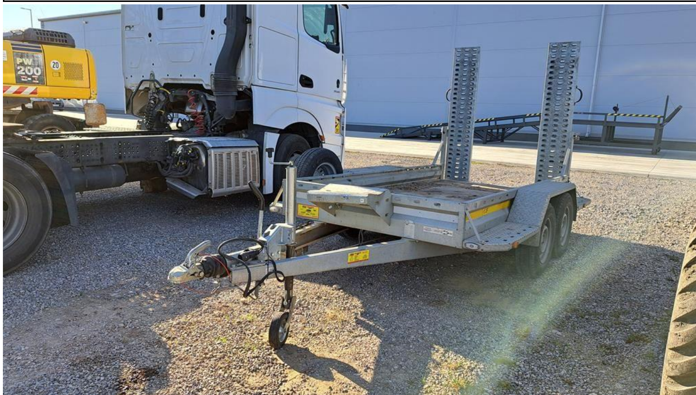
Fot. nr 1