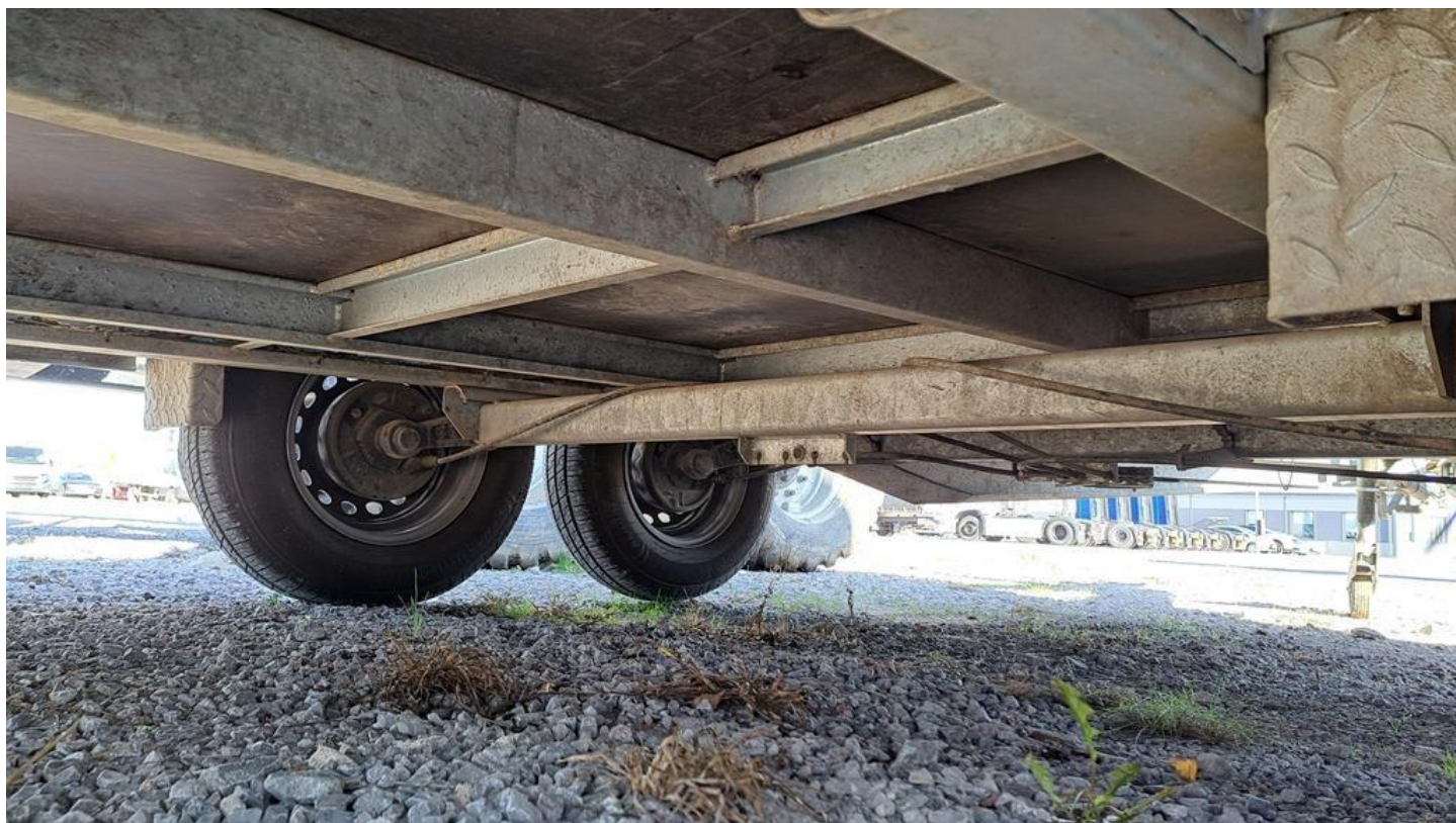
Fot. nr 18