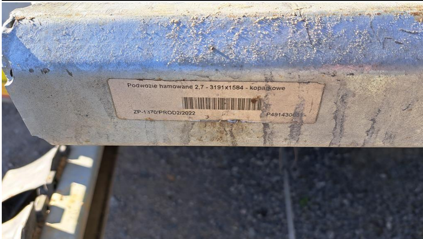
Fot. nr 25