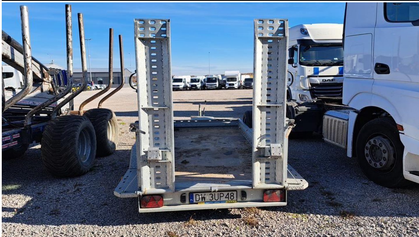
Fot. nr 5