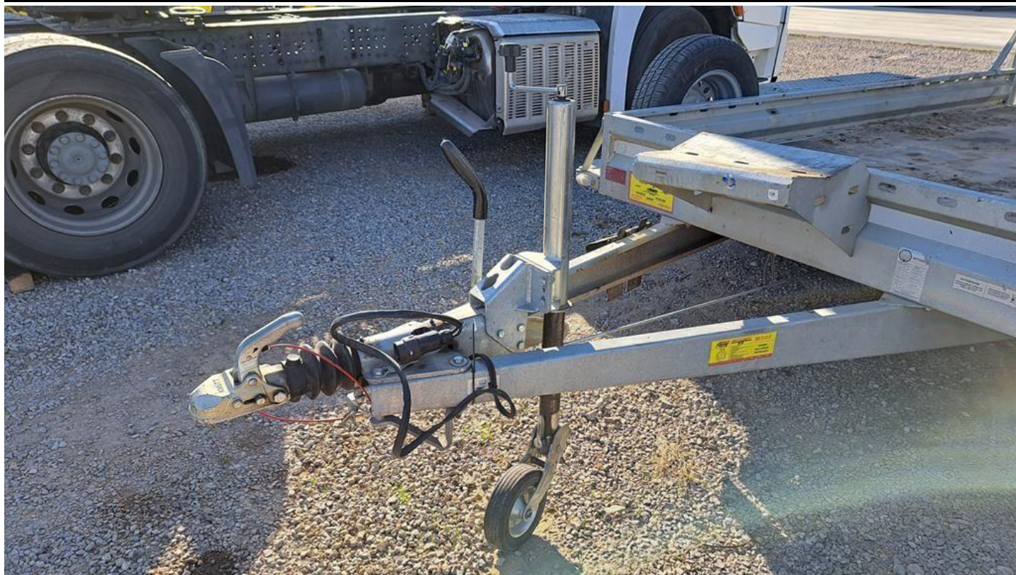
Fot. nr 11