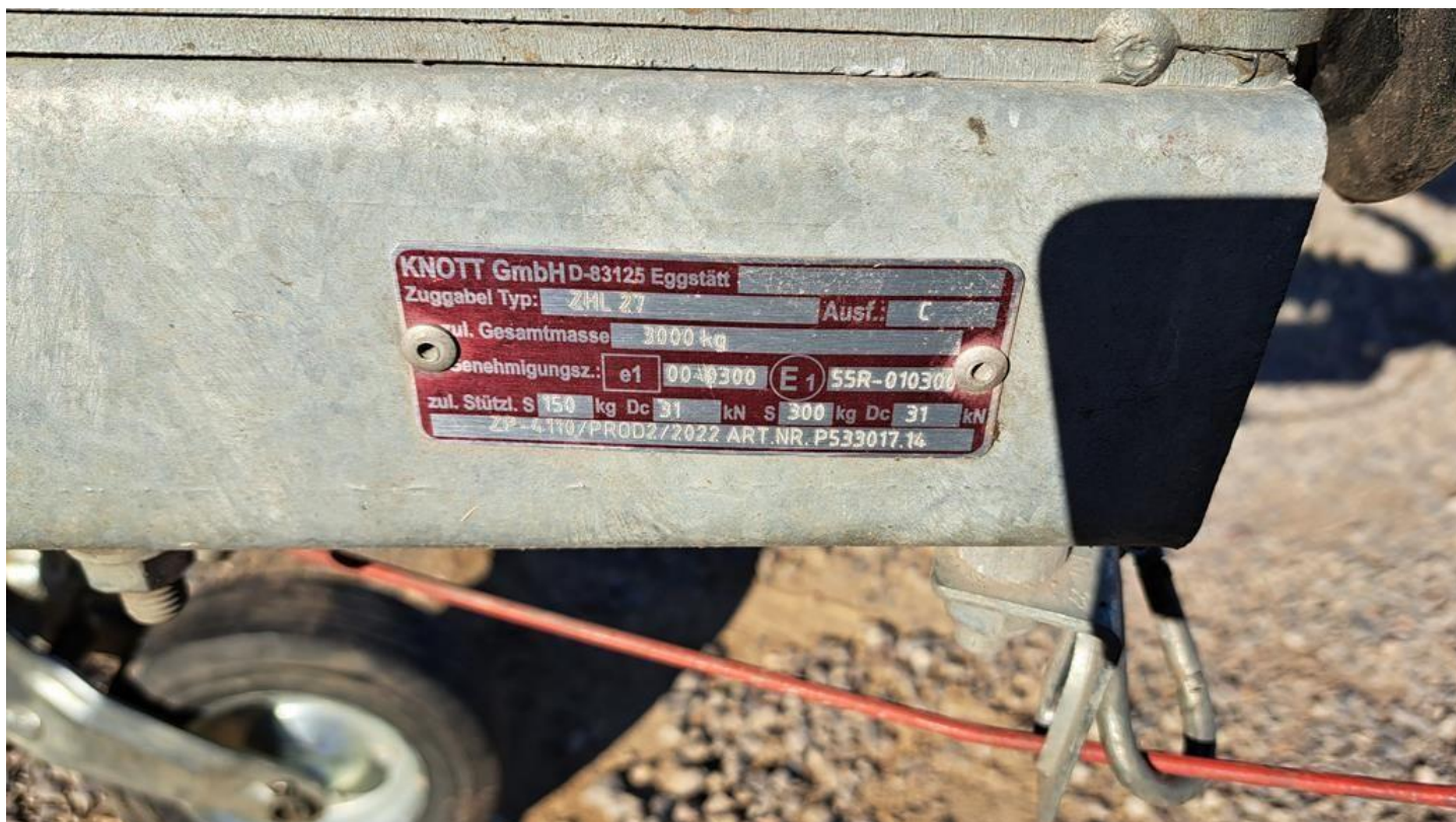
Fot. nr 10