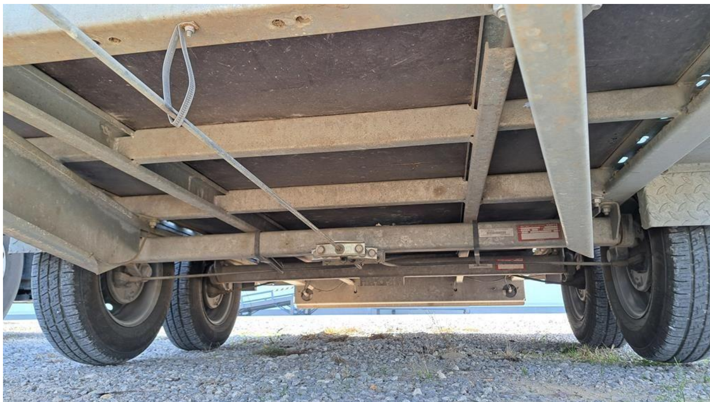
Fot. nr 12