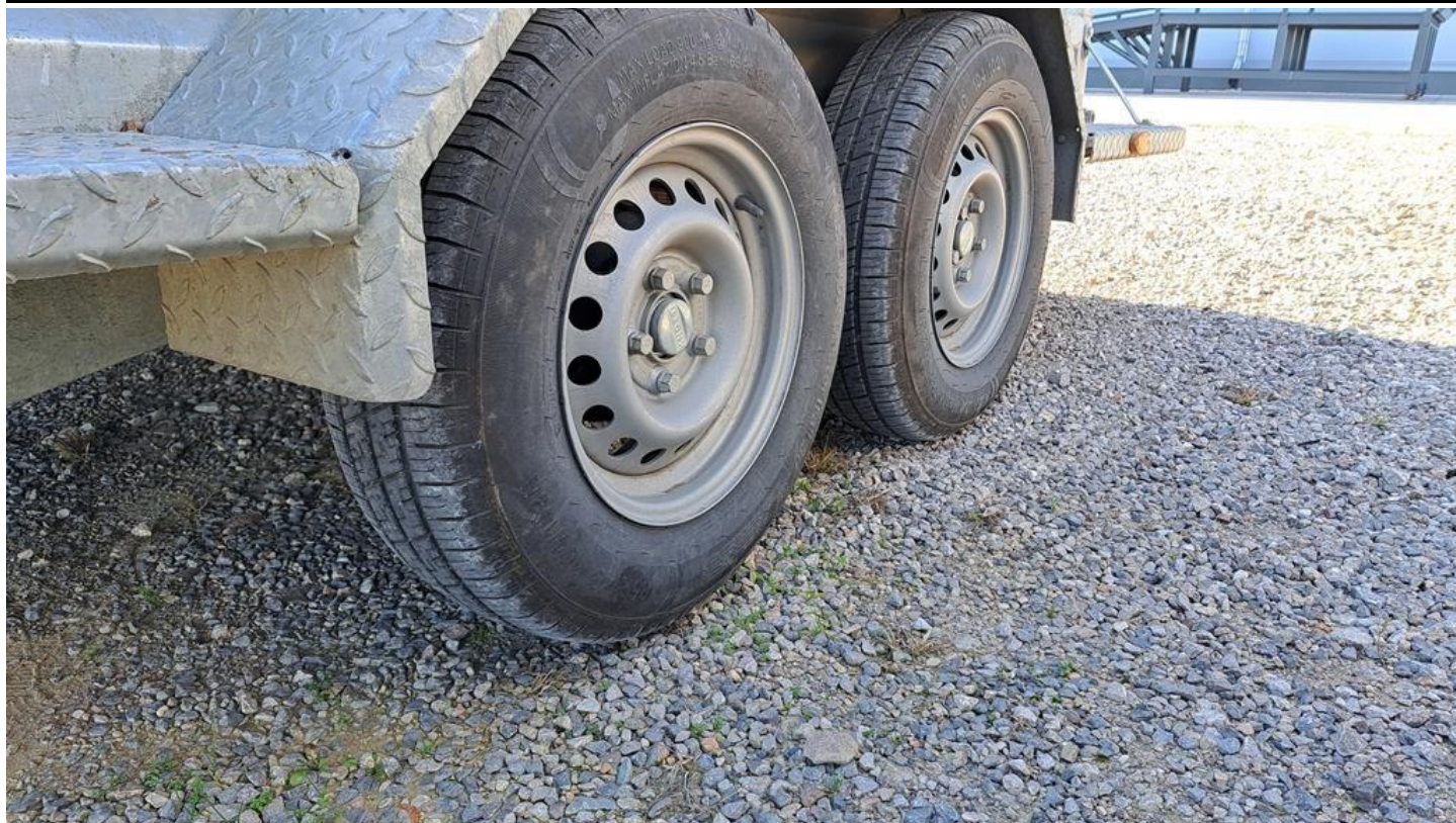
Fot. nr 13