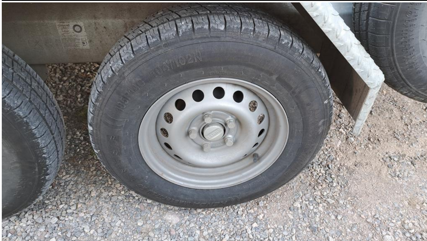
Fot. nr 21