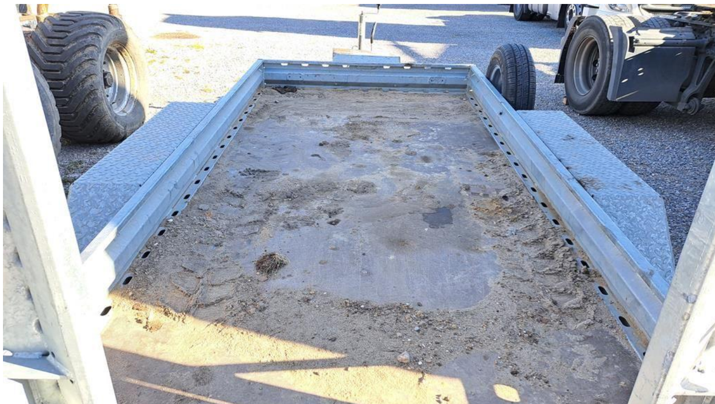
Fot. nr 16