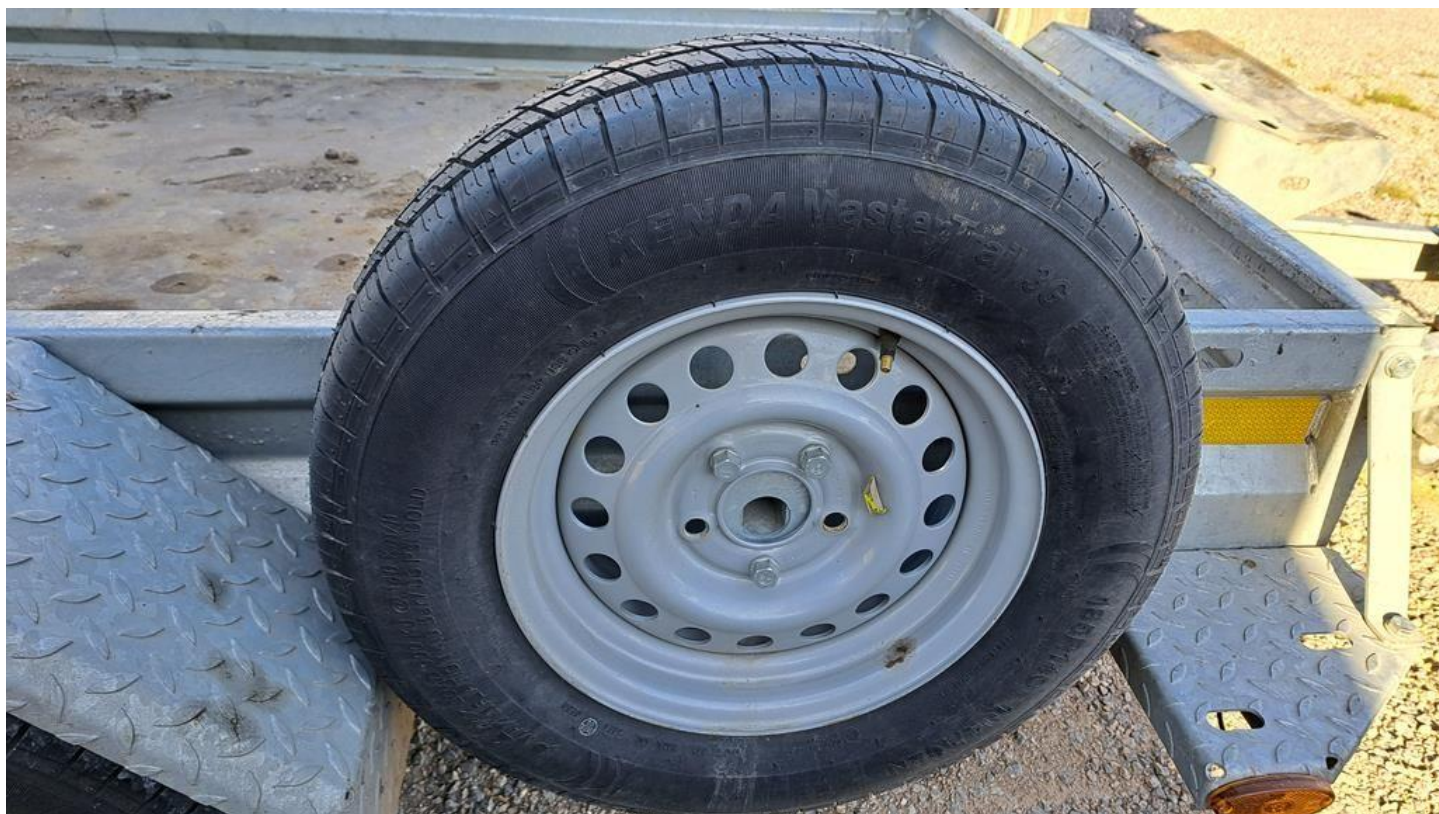
Fot. nr 22