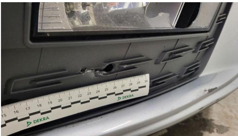
Photo 38. Kratka/zaślepka halogenu P - Pęknięcie/rozerwanie 1