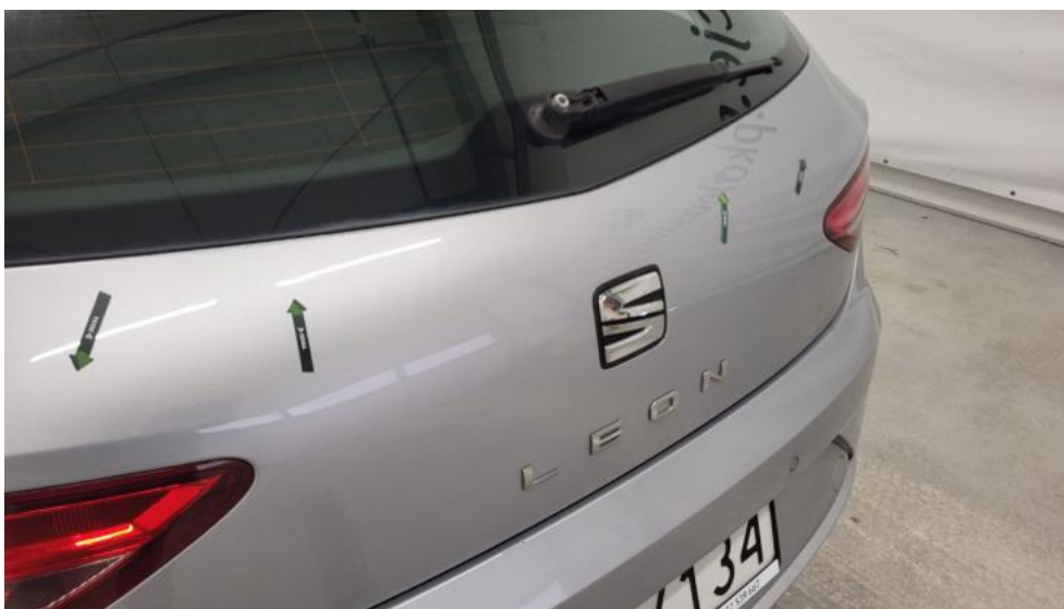
Photo 59. Pokrywy bagażnika - Wgniecenie/odkształcenie 1