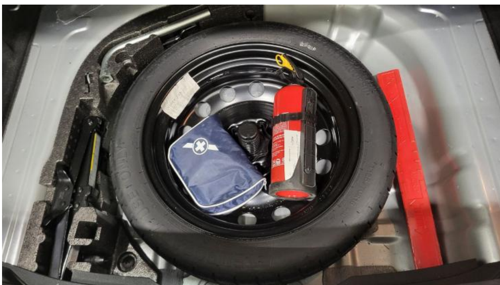
Photo 20. Koło zapasowe