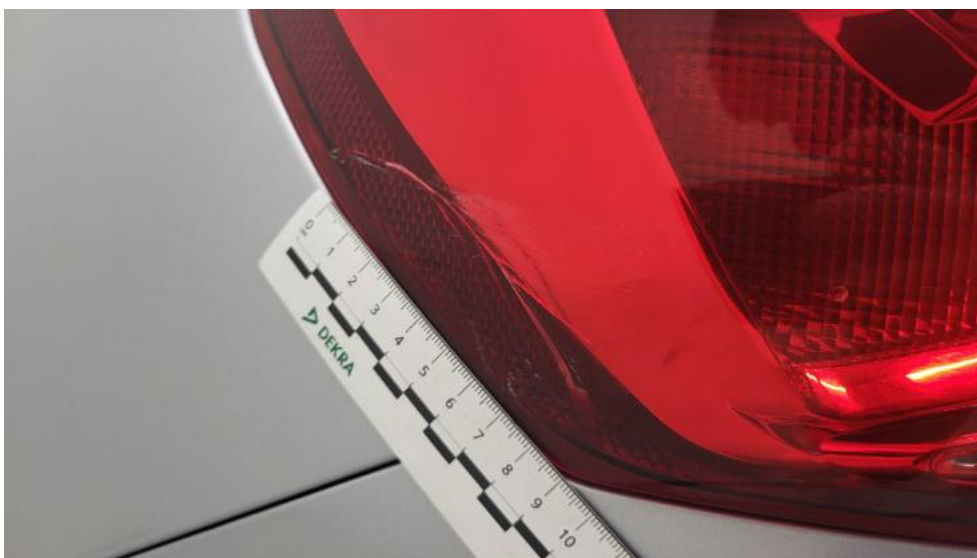
Photo 66. Lampa tylna zew L - Pęknięcie/rozerwanie 1