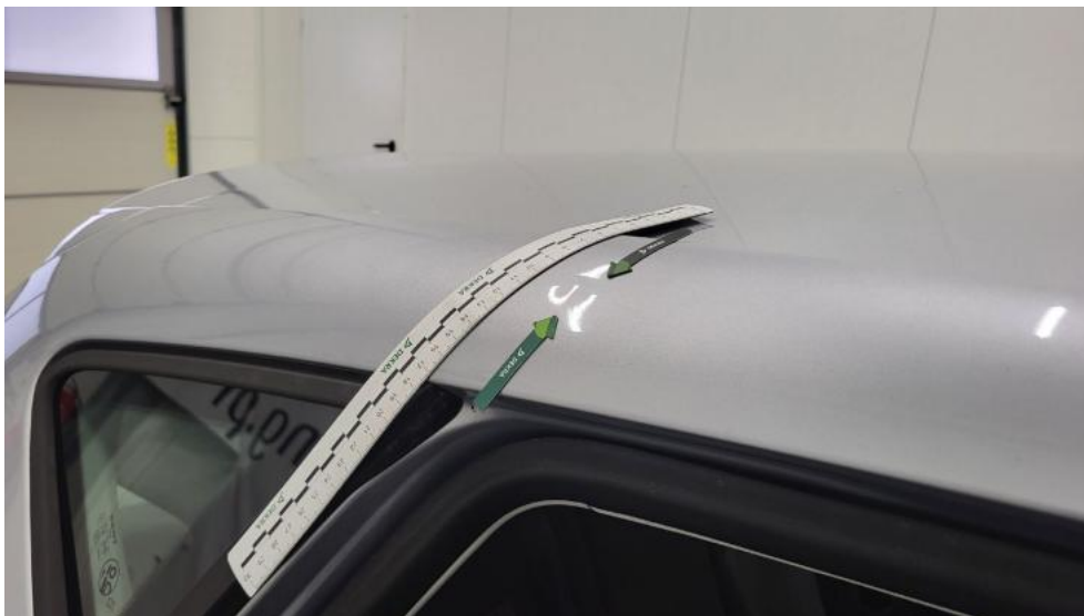
Photo 55. Błotnik tylny P / Ściana boczna P - Wgniecenie/odkształcenie 1