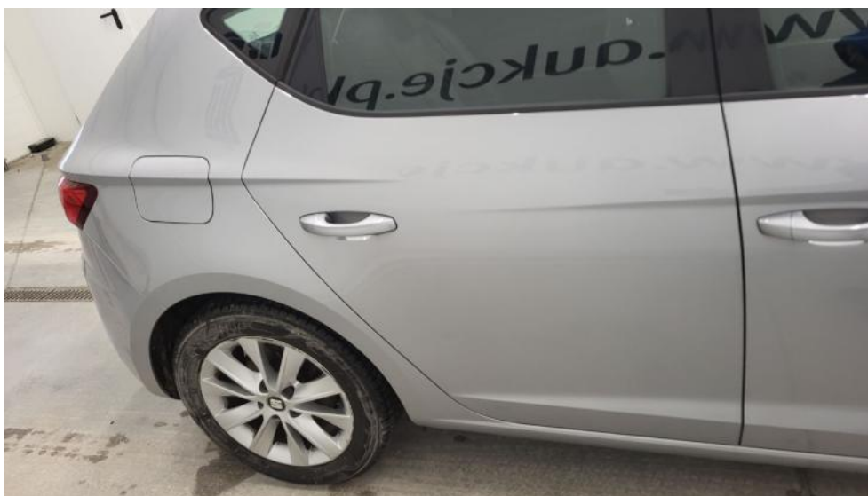
Photo 5. Bok prawy z tyłu