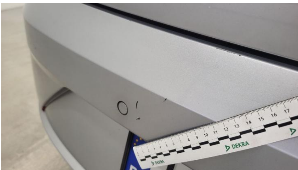
Photo 61. Zderzak tylny - Rysa/odprysk 2