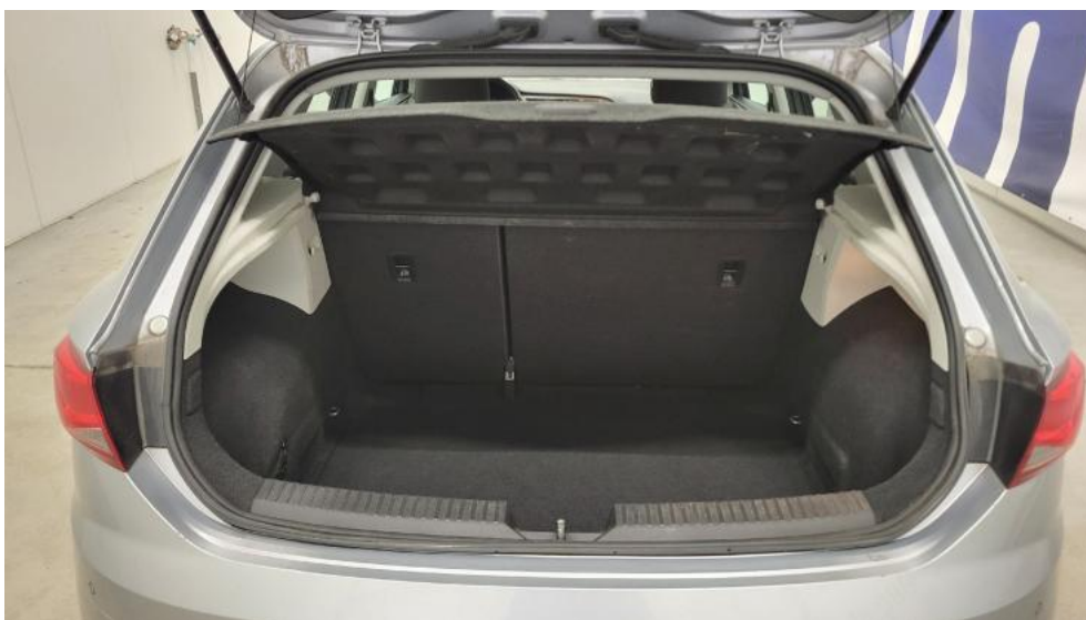
Photo 19. Bagażnik