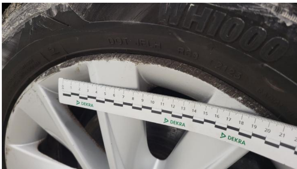
Photo 49. Felga aluminiowa przednia P - Rysa/odprysk 1