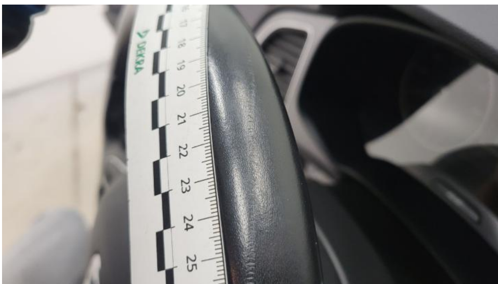
Photo 72. Koło kierownicy - Rysa/odprysk 1