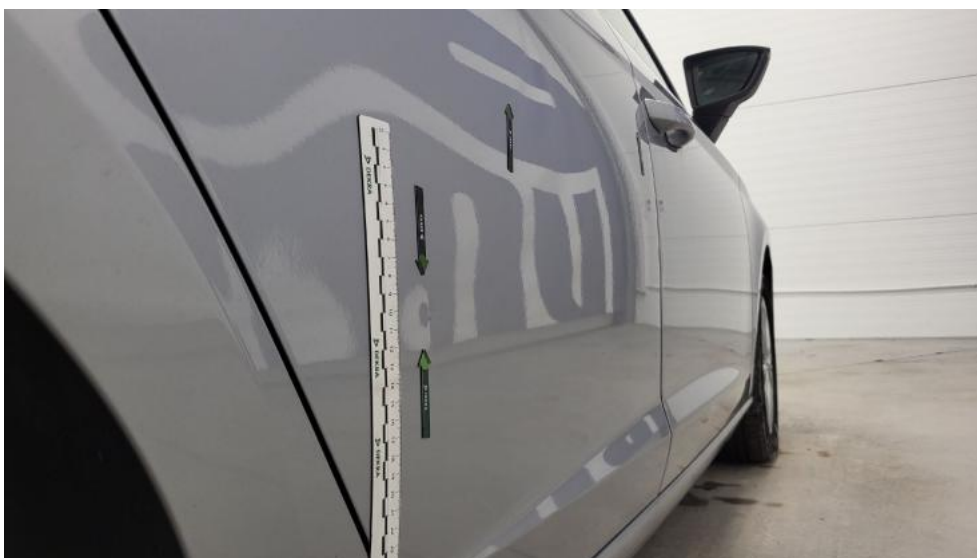
Photo 52. Drzwi tylne P - Wgniecenie/odkształcenie 1