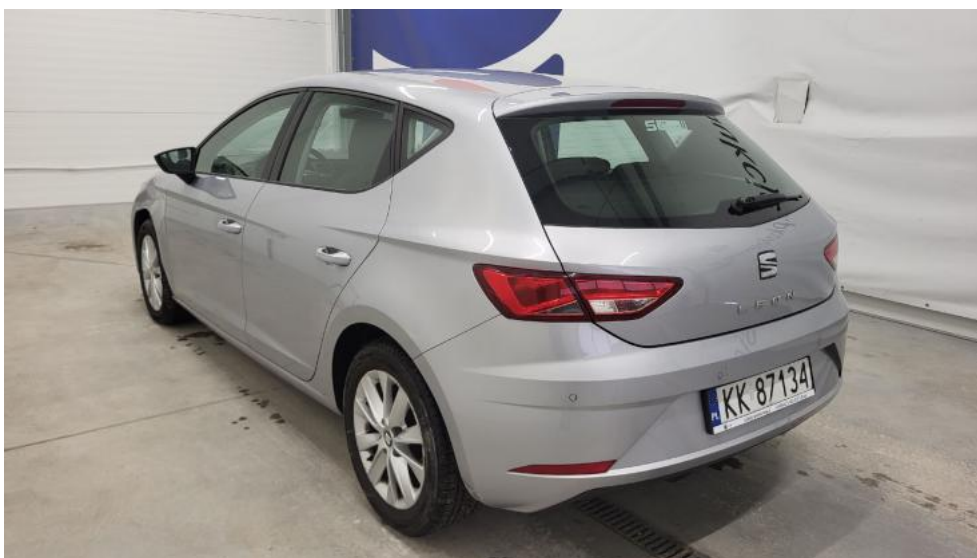
Photo 8. Przekątna tylna lewa