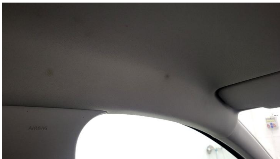
Photo 75. Podsufitka - Inne 2