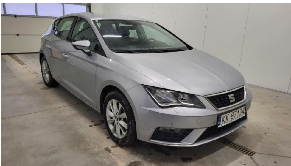
Photo 3. Przekątna przednia prawa