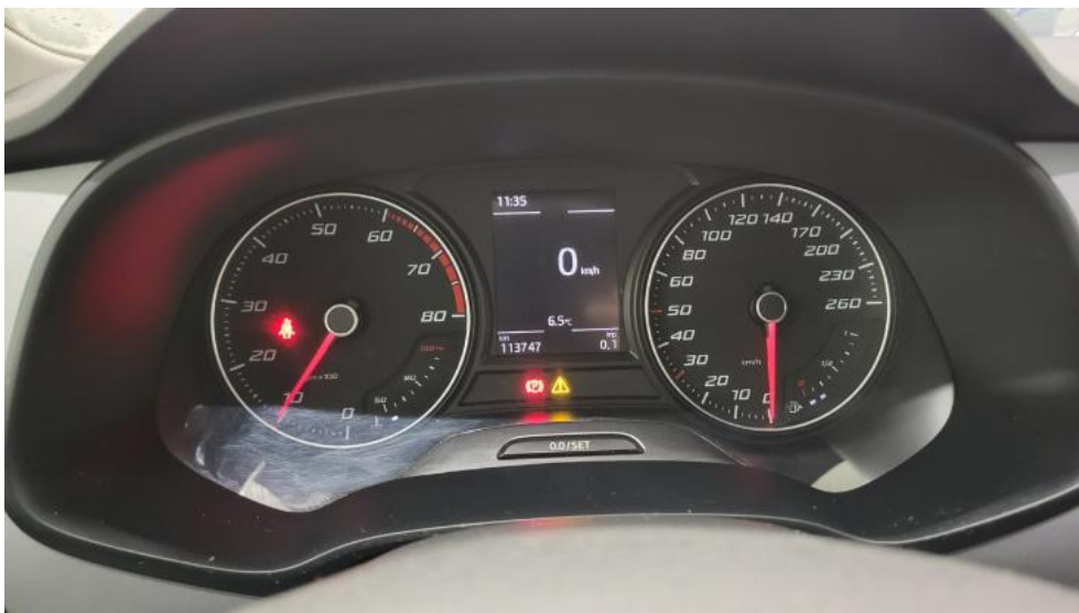
Photo 24. Zestaw wskaźników - przebieg