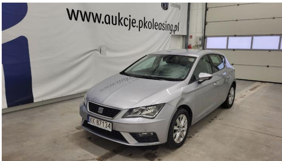
Photo 1. Przekątna przednia lewa