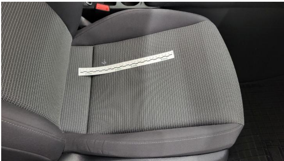
Photo 73. Fotel prz. praw. - Inne 1