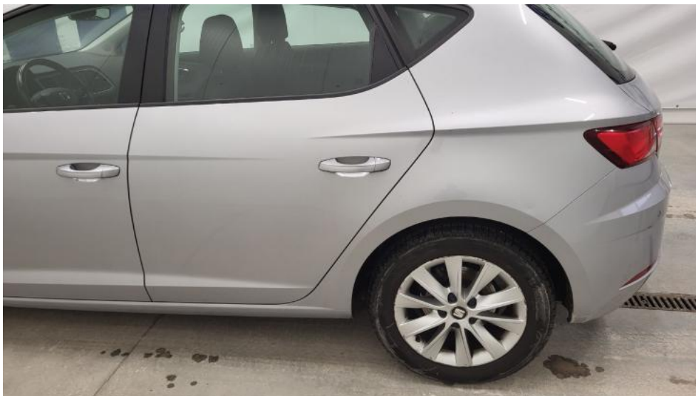
Photo 9. Bok lewy z tyłu