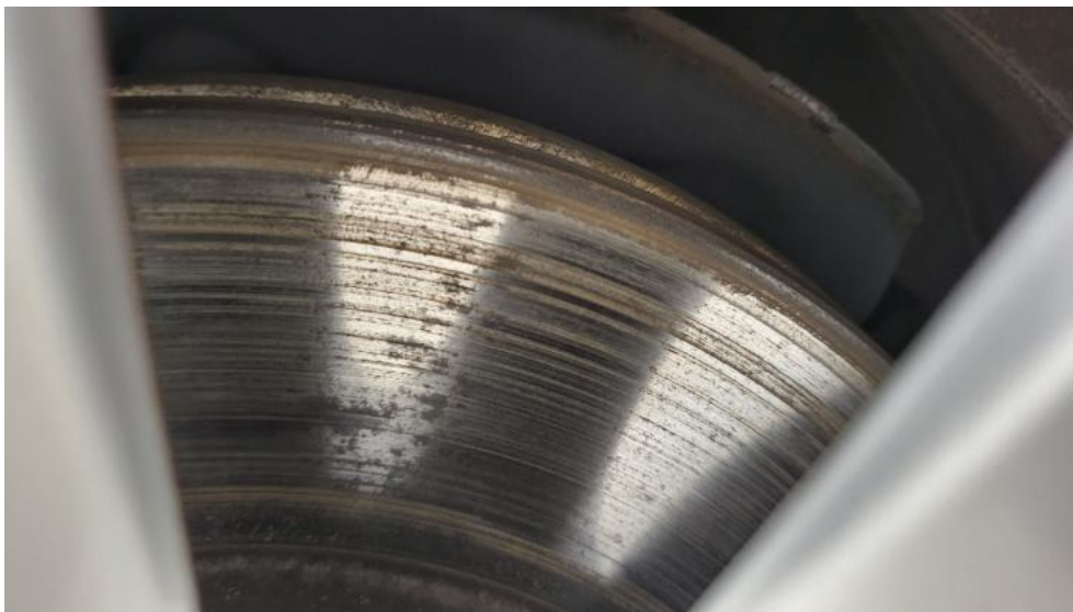
Photo 15. Tarcza hamulcowa przednia prawa