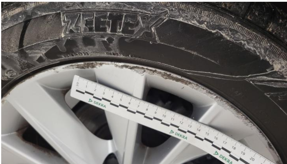
Photo 57. Felga aluminiowa tylna P - Rysa/odprysk 1