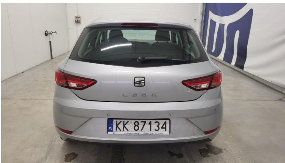
Photo 7. Tył