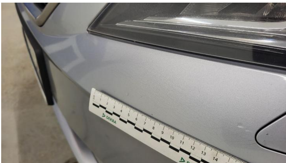
Photo 46. Zderzak - Pęknięcie/rozerwanie 1