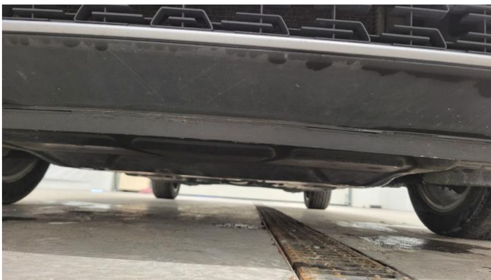
Photo 13. Spód pojazdu przód