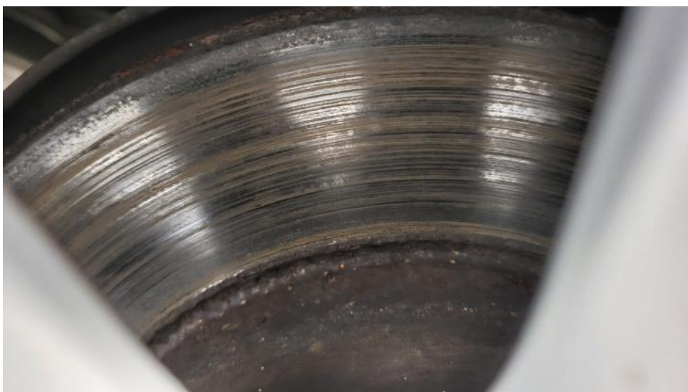
Photo 16. Tarcza hamulcowa tylna prawa