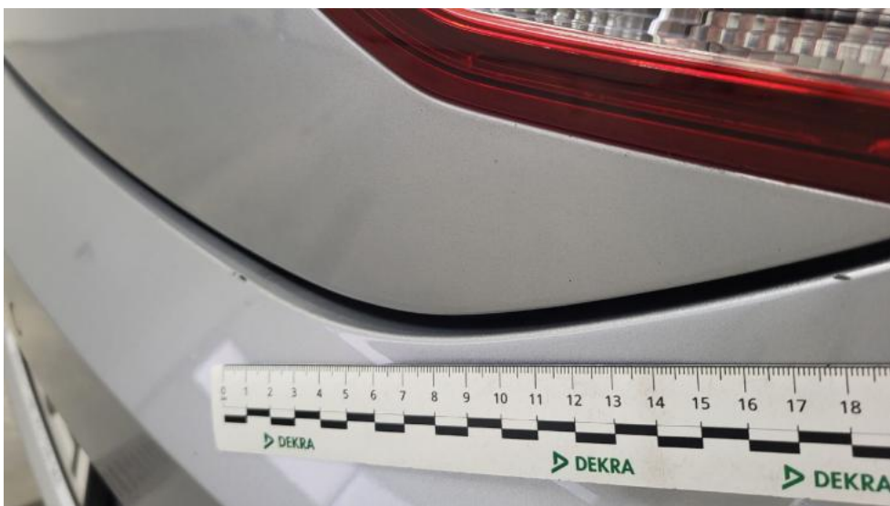
Photo 60. Zderzak tylny - Rysa/odprysk 1