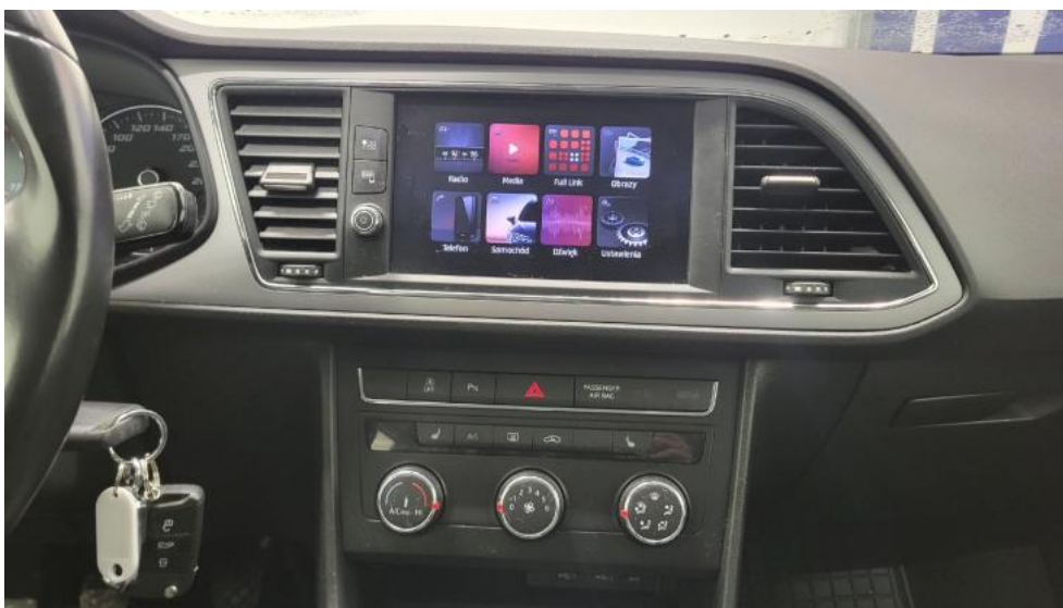
Photo 29. Konsola środkowa