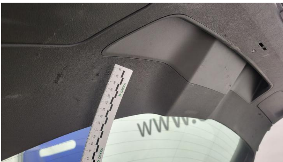
Photo 78. Wykładzina pokrywy tylnej - Rysa/odprysk 1