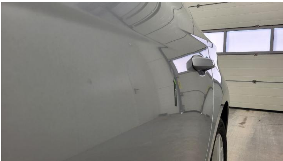
Photo 69. Drzwi tylne L - Wgniecenie/odkształcenie 1