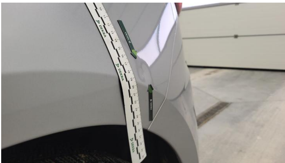
Photo 65. Błotnik tylny L / Ściana boczna L - Wgniecenie/odkształcenie 1