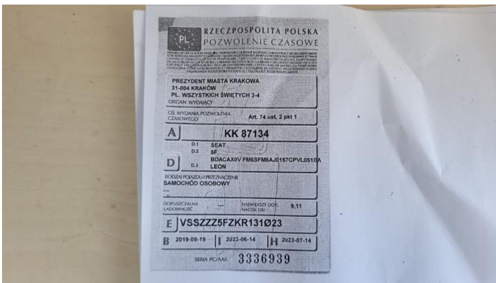
Photo 34. Dow. rej. ksero Str. 1