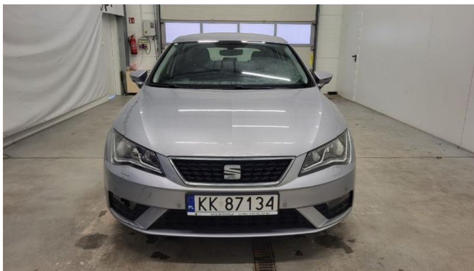
Photo 2. Przód