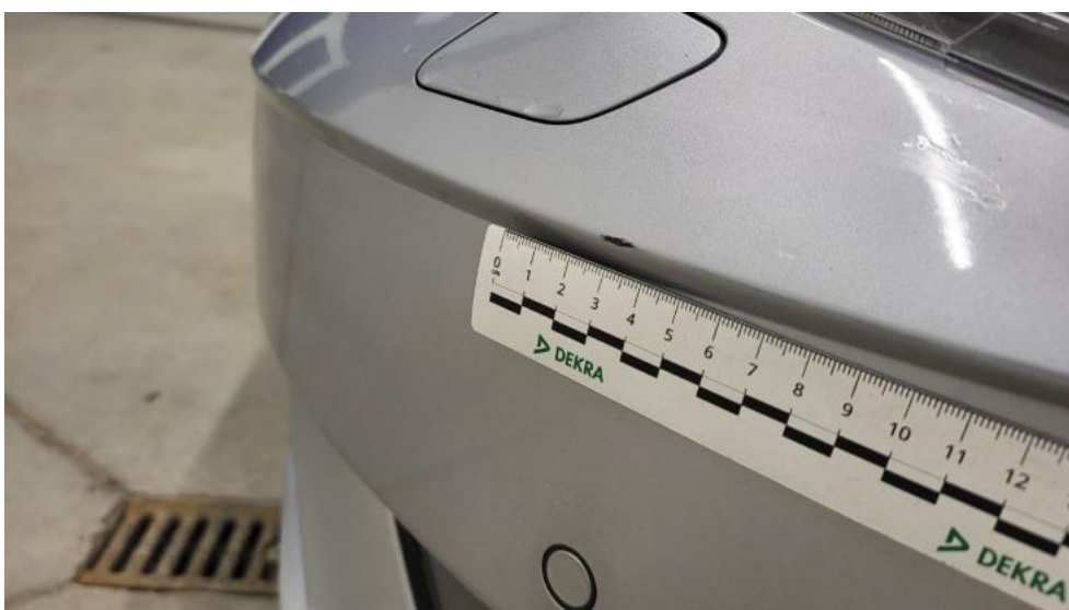
Photo 44. Zderzak - Rysa/odprysk 1