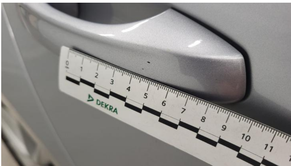
Photo 53. Klamka drzwi tyl P - Rysa/odprysk 1