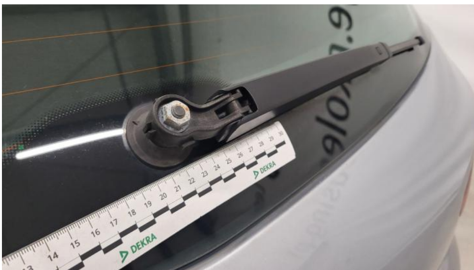
Photo 58. Pióro wycieraczki szyby tyl - Inne 1