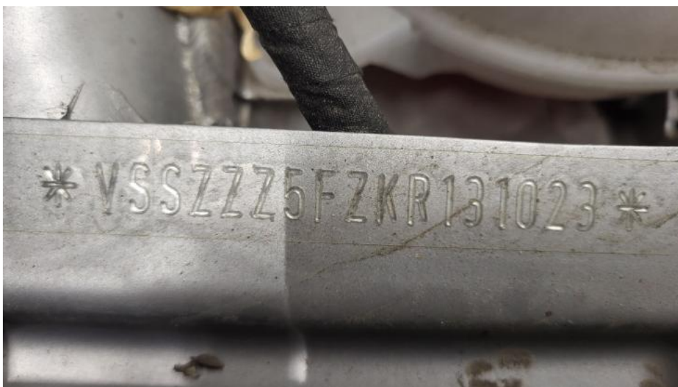
Photo 22. Numer identyfikacyjny