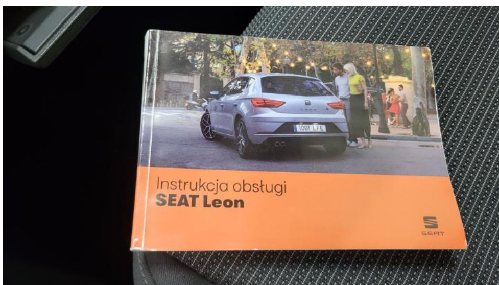
Photo 36. Instrukcje