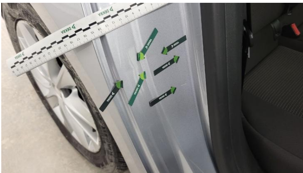
Photo 56. Błotnik tylny P / Ściana boczna P - Wgniecenie/odkształcenie 2