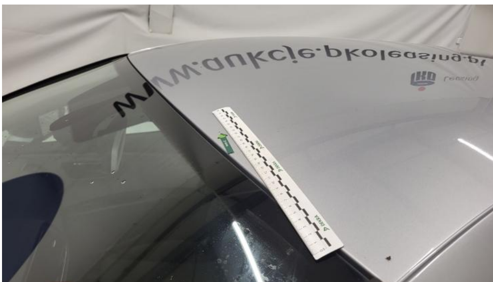
Photo 63. Dach - zdjęcie poglądowe 1