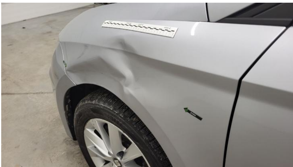
Photo 70. Błotnik przedni L - Wgniecenie/odkształcenie 1