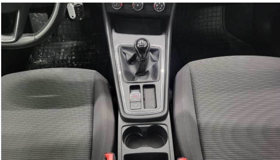
Photo 30. Tunel środkowy