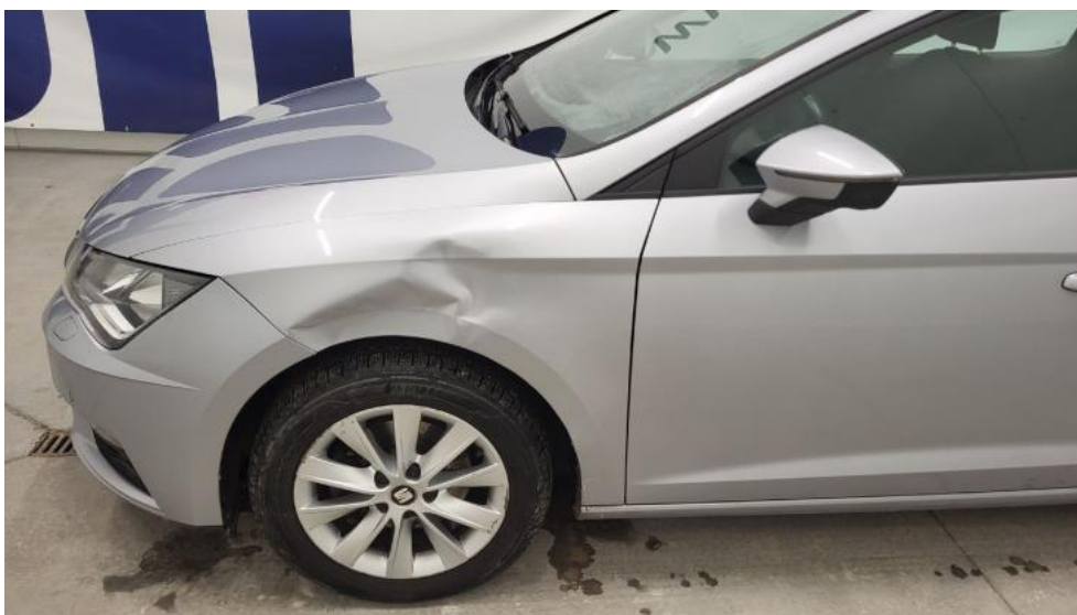
Photo 10. Bok lewy z przodu