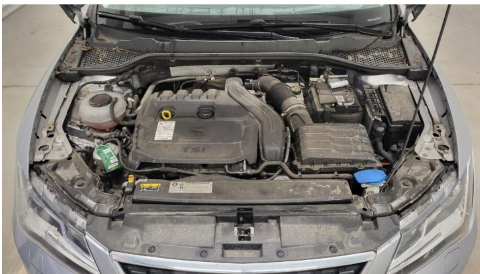
Photo 21. Komora silnika