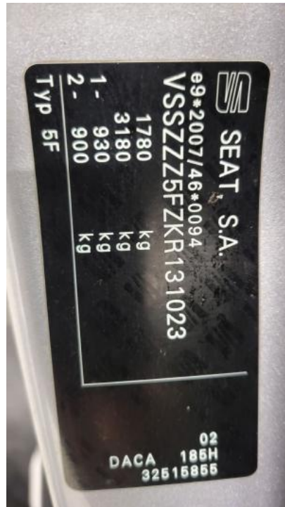
Photo 23. Tabliczka znamionowa