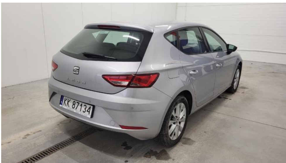
Photo 6. Przekątna tylna prawa