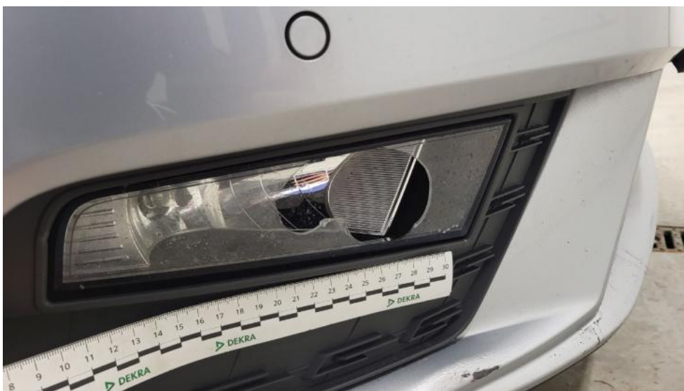
Photo 51. Reflektor przeciwmgielny P - Pęknięcie/rozerwanie 1