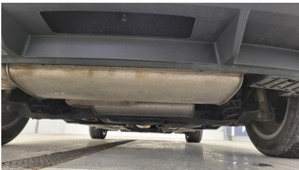
Photo 14. Spód pojazdu tył