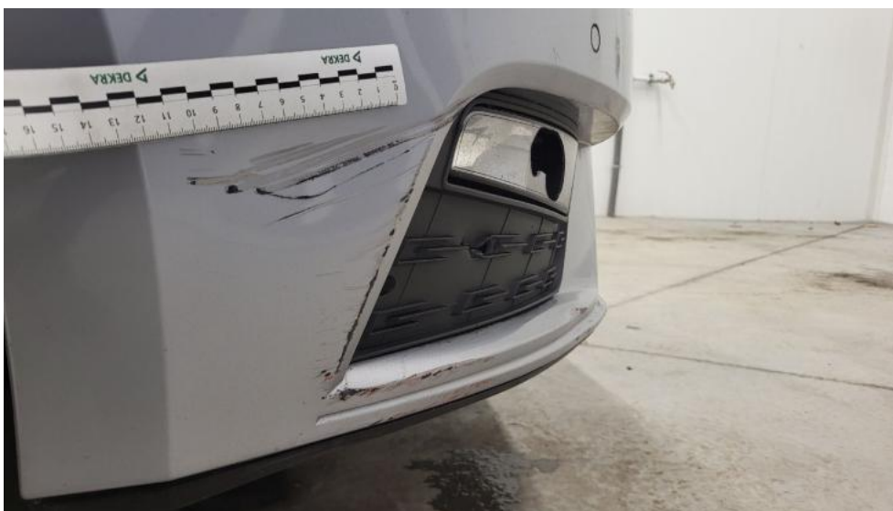
Photo 45. Zderzak - Wgniecenie/odkształcenie 1