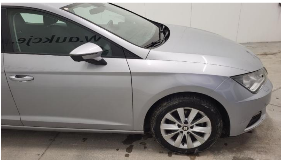
Photo 4. Bok prawy z przodu