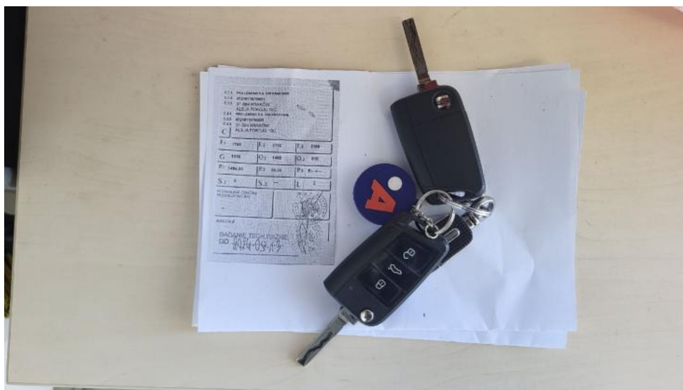
Photo 35. Dow. Rej. ksero Str.2 i klucze