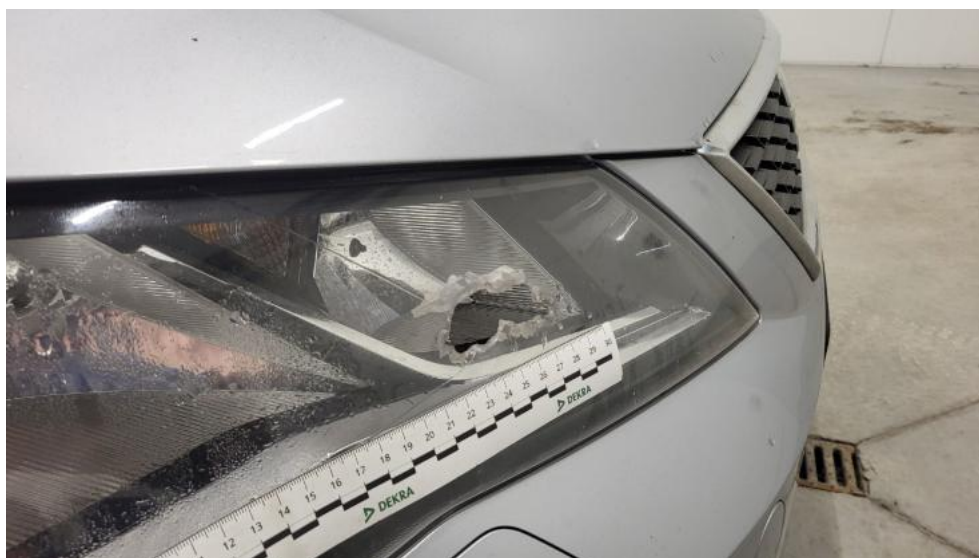
Photo 50. Reflektor P - Pęknięcie/rozerwanie 1