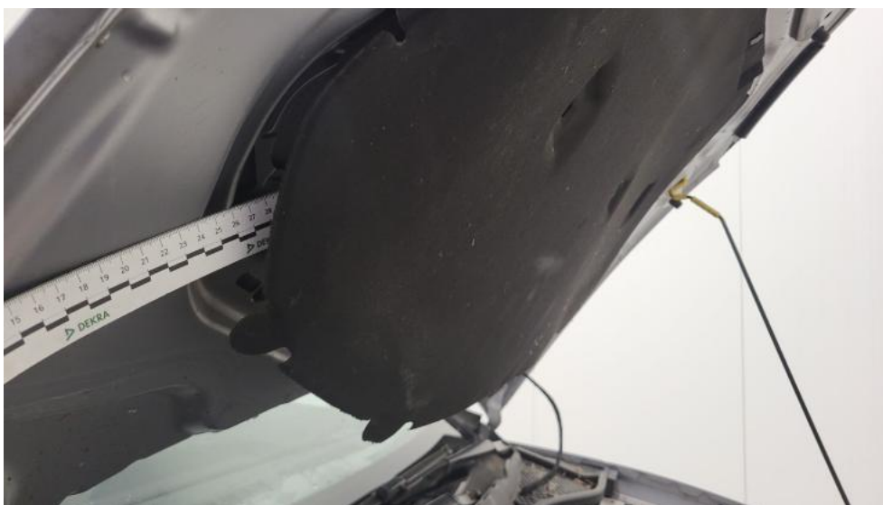
Photo 43. Wykładzina pokrywy komory silnika - Inne 1