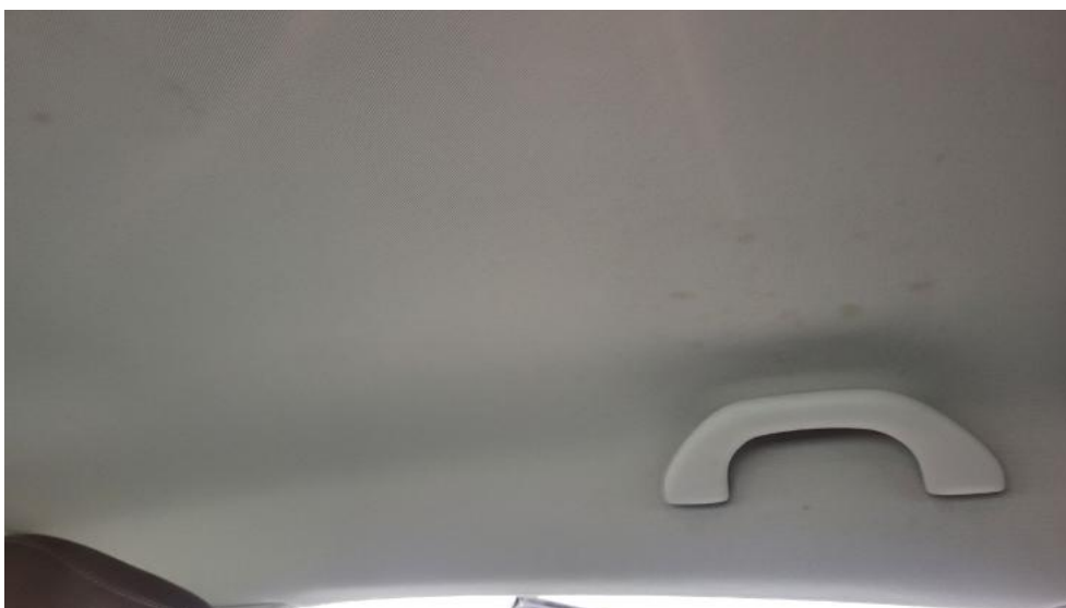
Photo 74. Podsufitka - Inne 1