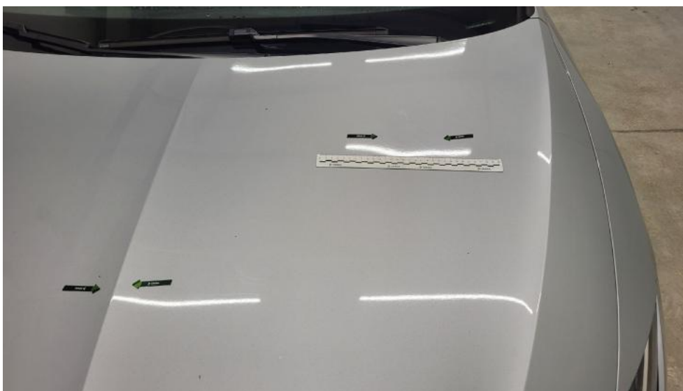
Photo 41. Pokrywa komory silnika - Wgniecenie/odkształcenie 1