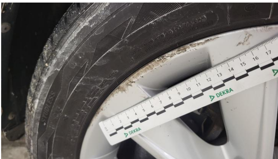
Photo 71. Felga Aluminiowa przednia L - Rysa/odprysk 1