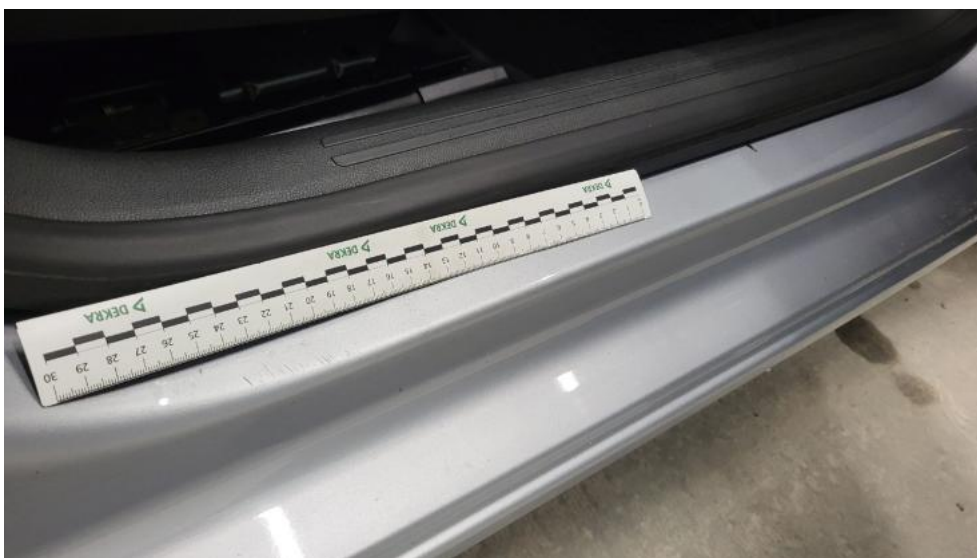
Photo 54. Próg P - Rysa/odprysk 1