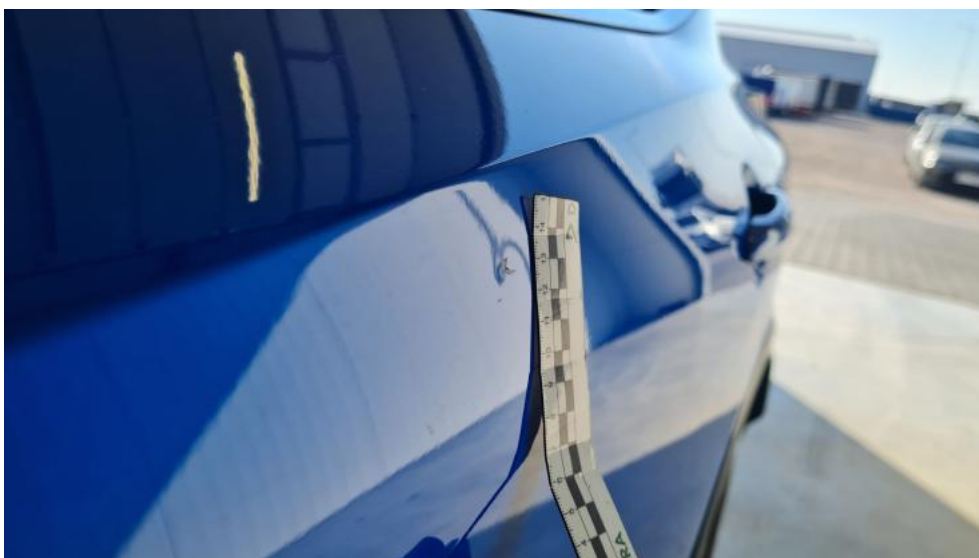
Photo 40. Drzwi tylne L - Wgniecenie/odkształcenie 1