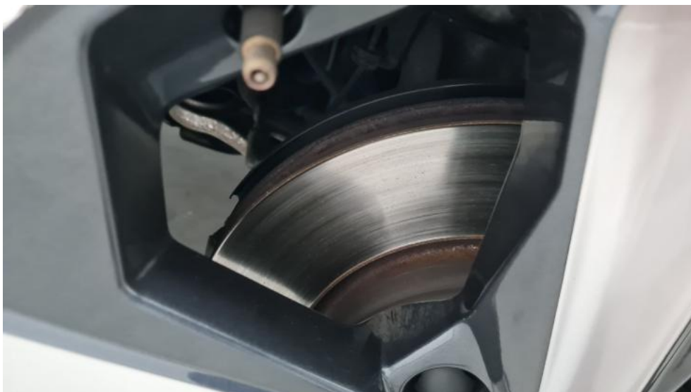
Photo 15. Tarcza hamulcowa przednia prawa