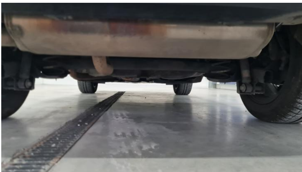
Photo 14. Spód pojazdu tył