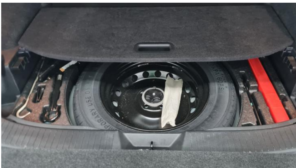
Photo 20. Koło zapasowe