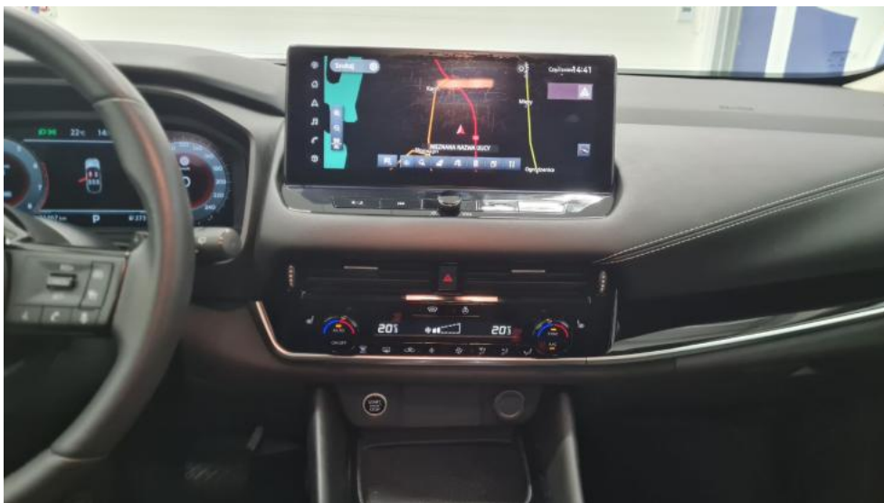
Photo 29. Konsola środkowa