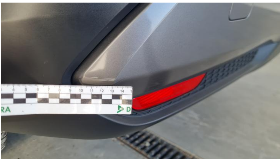
Photo 36. Spojler zderzaka tylnego - Rysa/odprysk 1