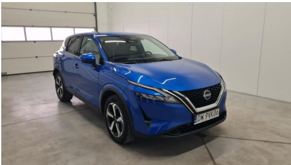
Photo 3. Przekątna przednia prawa