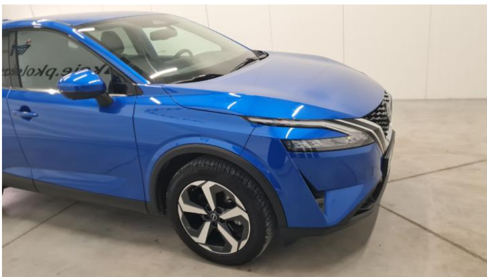
Photo 4. Bok prawy z przodu