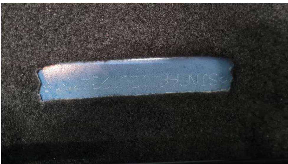
Photo 22. Numer identyfikacyjny