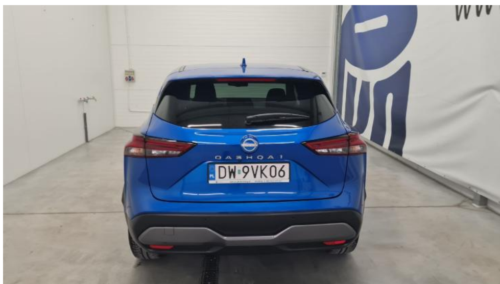
Photo 7. Tył