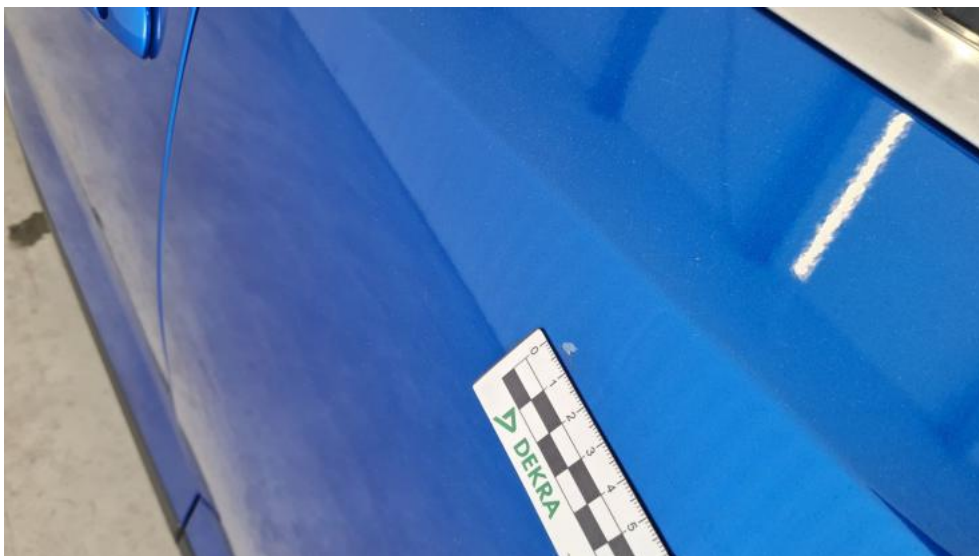
Photo 39. Drzwi tylne L - Rysa/odprysk 1