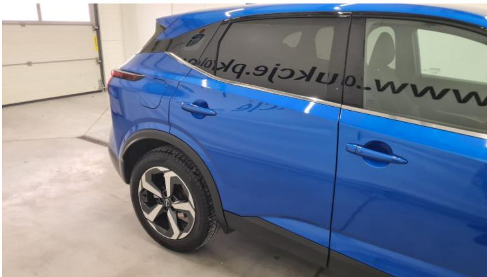
Photo 5. Bok prawy z tyłu