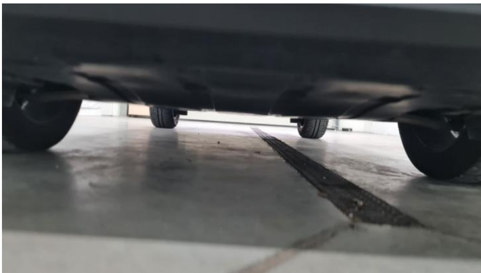
Photo 13. Spód pojazdu przód