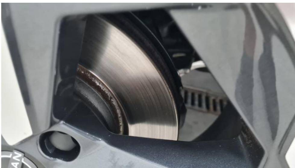
Photo 18. Tarcza hamulcowa przednia lewa