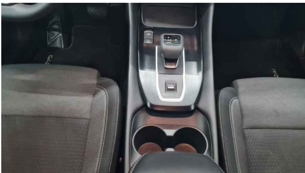
Photo 30. Tunel środkowy