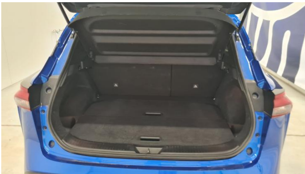
Photo 19. Bagażnik