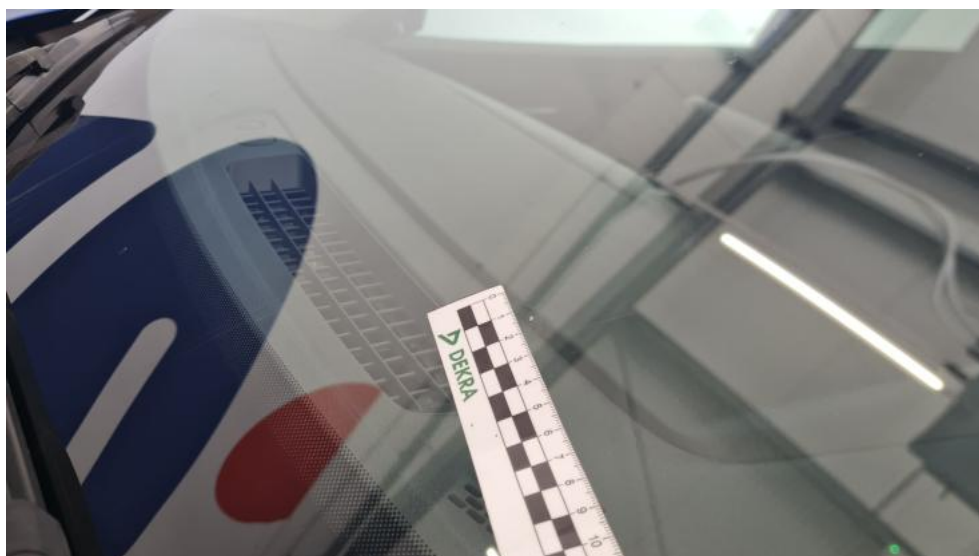
Photo 34. Szyba czołowa - Rysa/odprysk 1