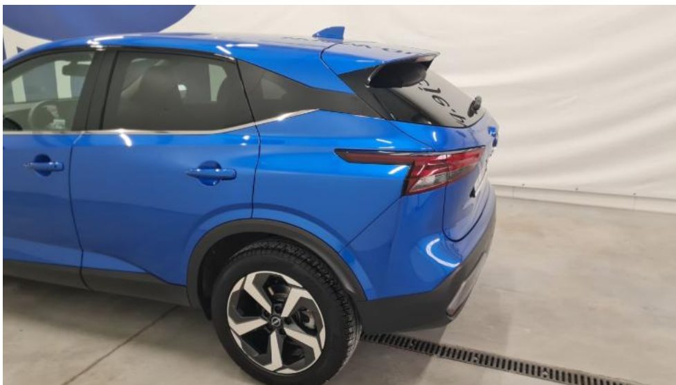
Photo 9. Bok lewy z tyłu