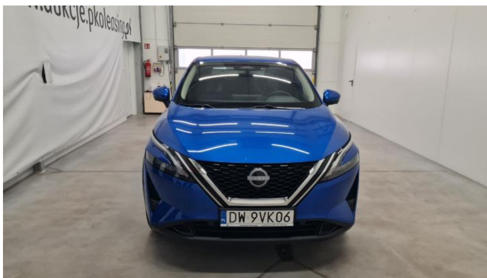
Photo 2. Przód