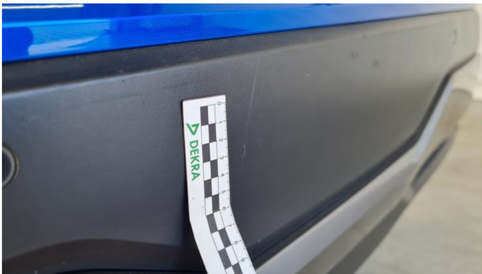
Photo 37. Spojler zderzaka tylnego - Rysa/odprysk 2