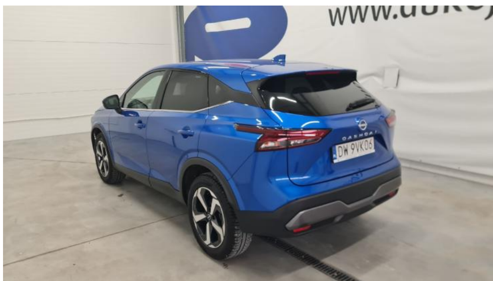
Photo 8. Przekątna tylna lewa