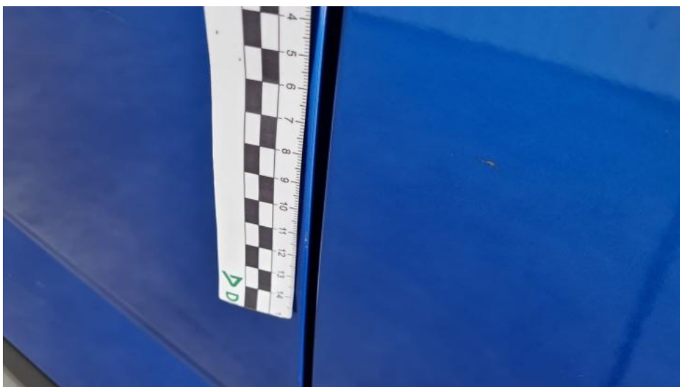
Photo 38. Drzwi przed L - Rysa/odprysk 1