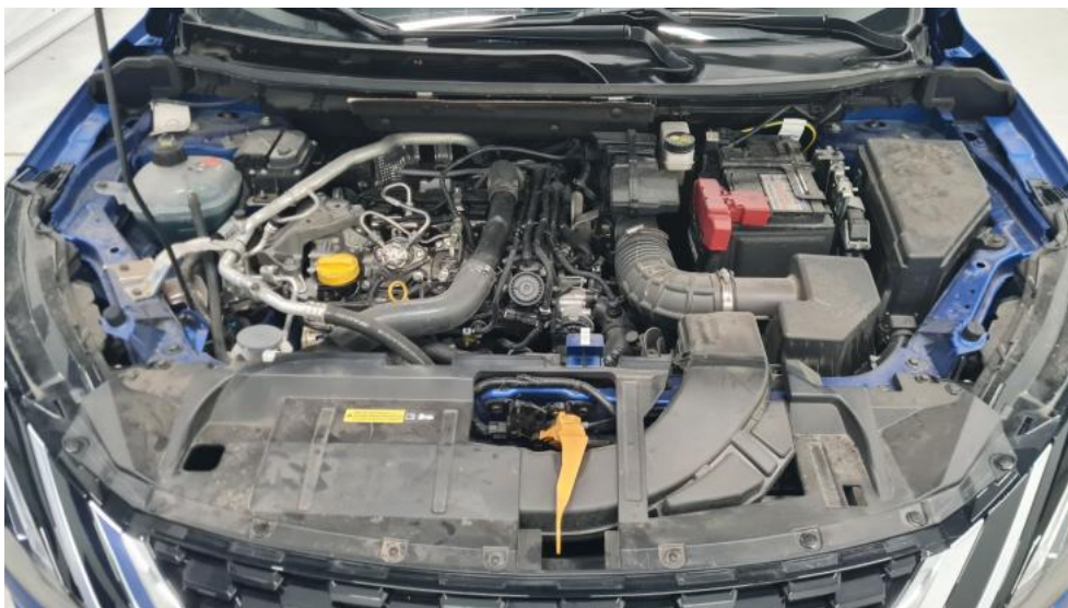
Photo 21. Komora silnika