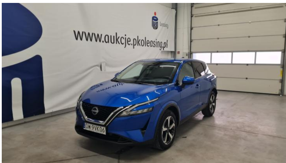
Photo 1. Przekątna przednia lewa