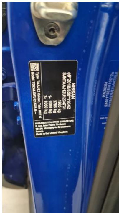
Photo 23. Tabliczka znamionowa