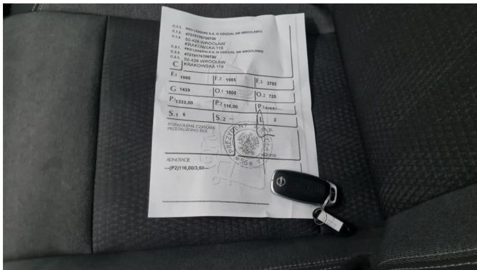
Photo 33. Dow. Rej. tym. Str.2 i klucze