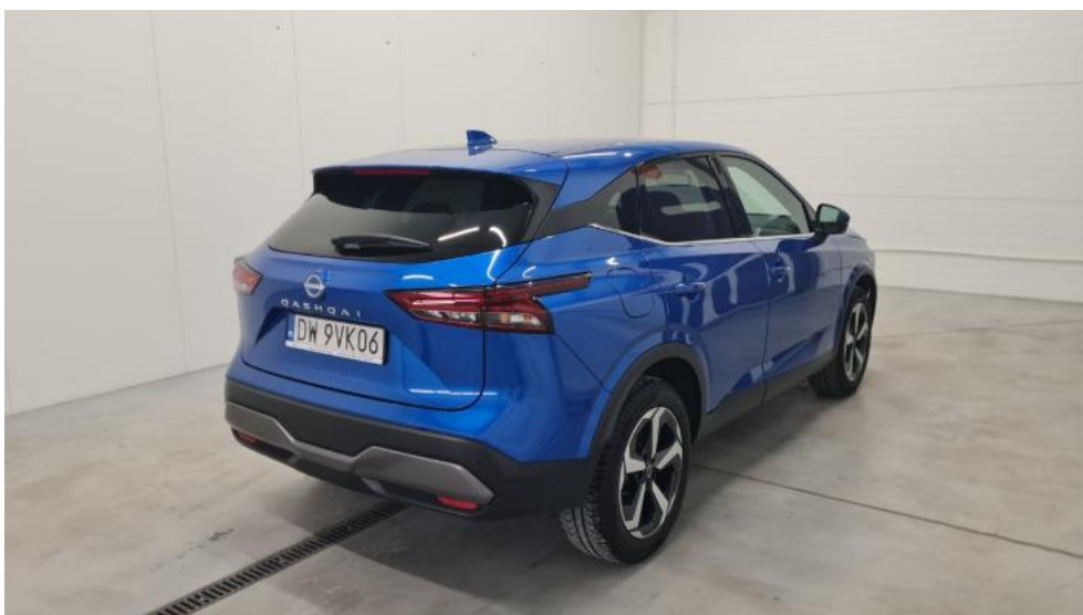
Photo 6. Przekątna tylna prawa