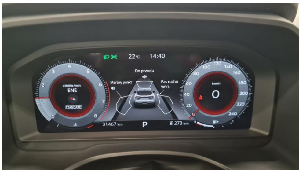
Photo 24. Zestaw wskaźników - przebieg