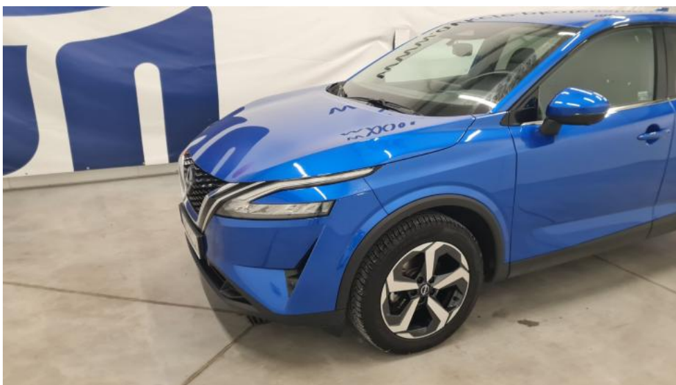
Photo 10. Bok lewy z przodu