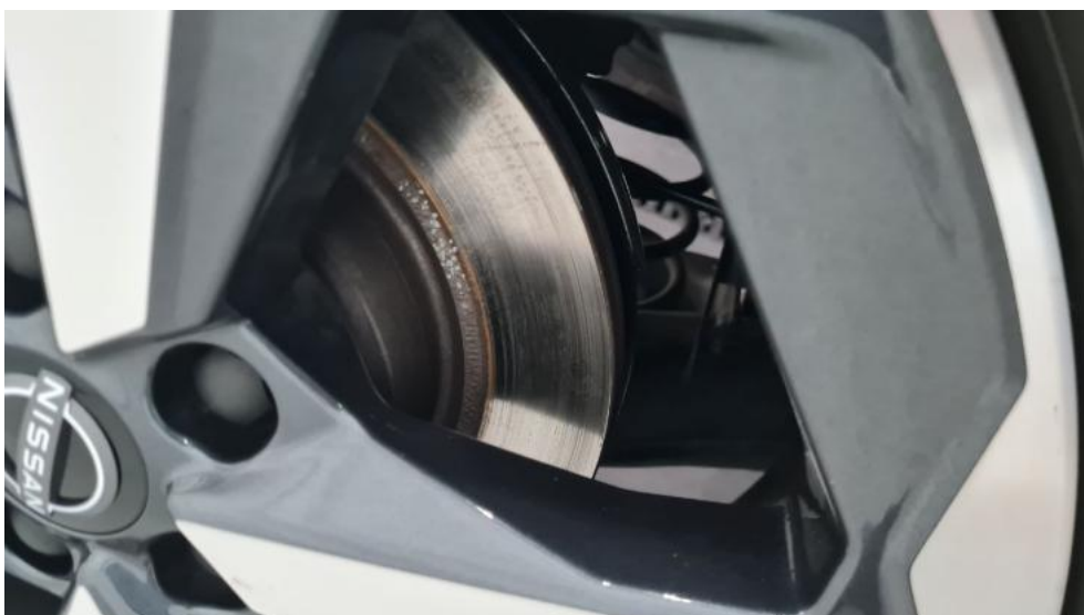
Photo 16. Tarcza hamulcowa tylna prawa