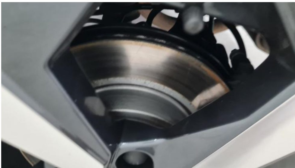
Photo 17. Tarcza hamulcowa tylna lewa