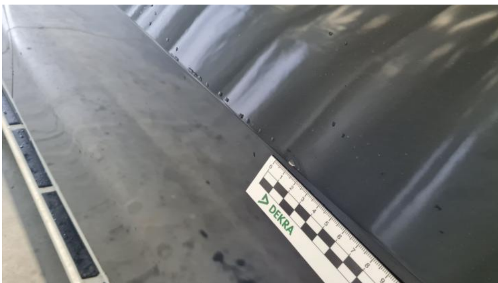
Photo 46. Drzwi przednie P - Rysa/odprysk 1