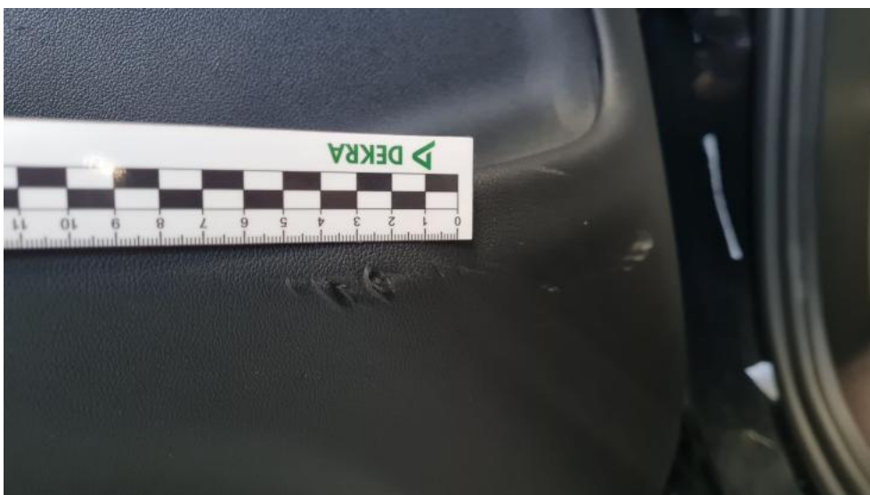
Photo 54. Tapicerka drzwi tylnych L - Pęknięcie/rozerwanie 1