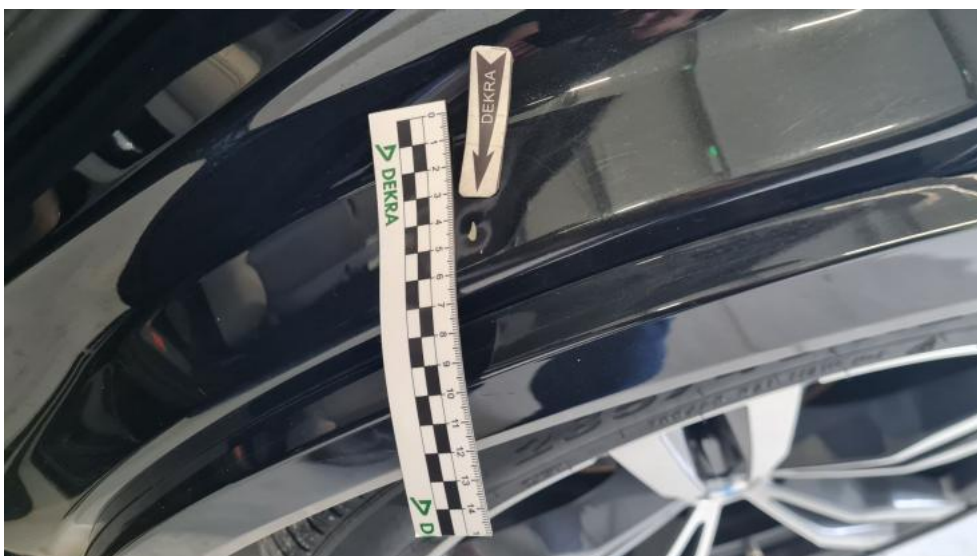
Photo 50. Błotnik tylny L / Ściana boczna L - Wgniecenie/odkształcenie 1