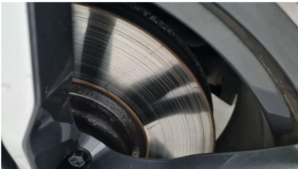
Photo 15. Tarcza hamulcowa przednia prawa