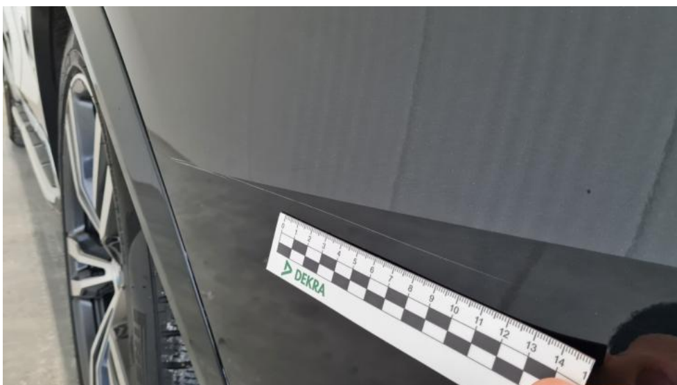
Photo 48. Zderzak tylny - Rysa/odprysk 1