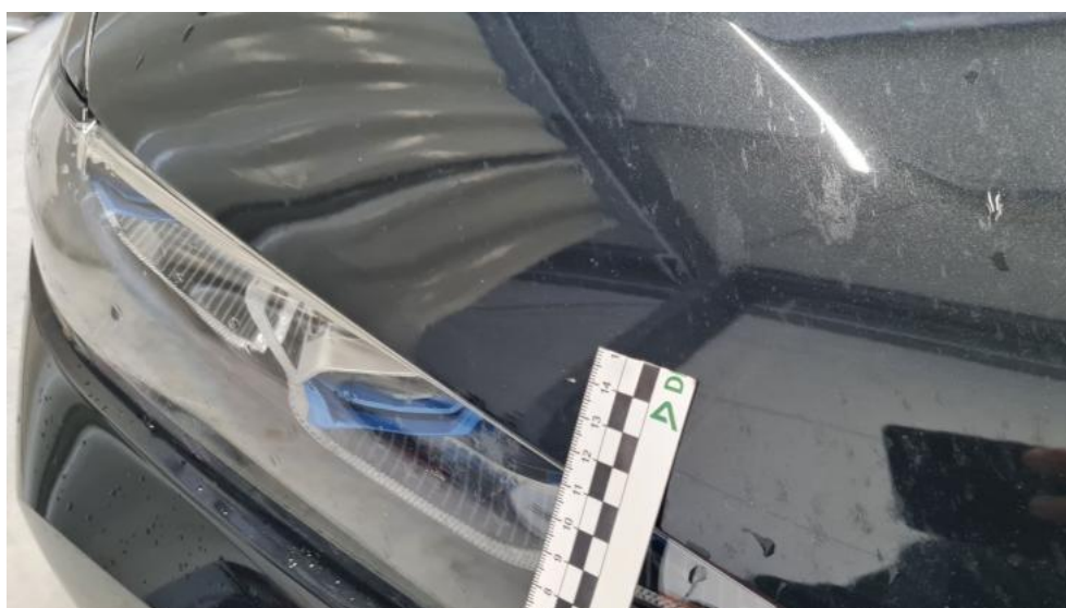
Photo 42. Pokrywa komory silnika - Rysa/odprysk 1