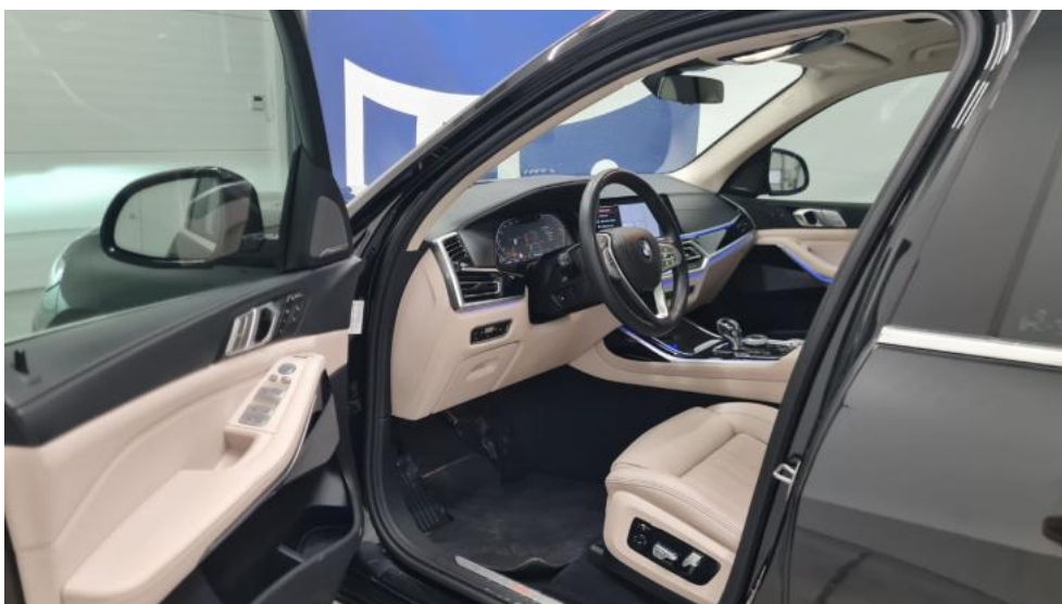
Photo 24. Widok przez otwarte drzwi przednie lewe