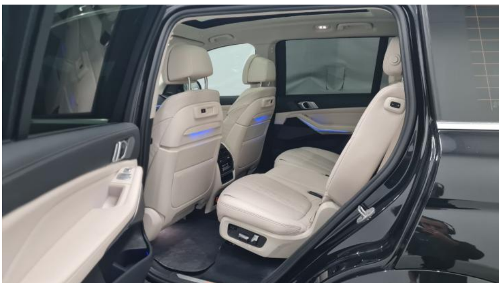
Photo 26. Widok przez otwarte drzwi tylne lewe