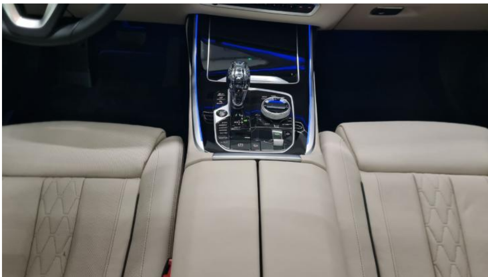
Photo 29. Tunel środkowy