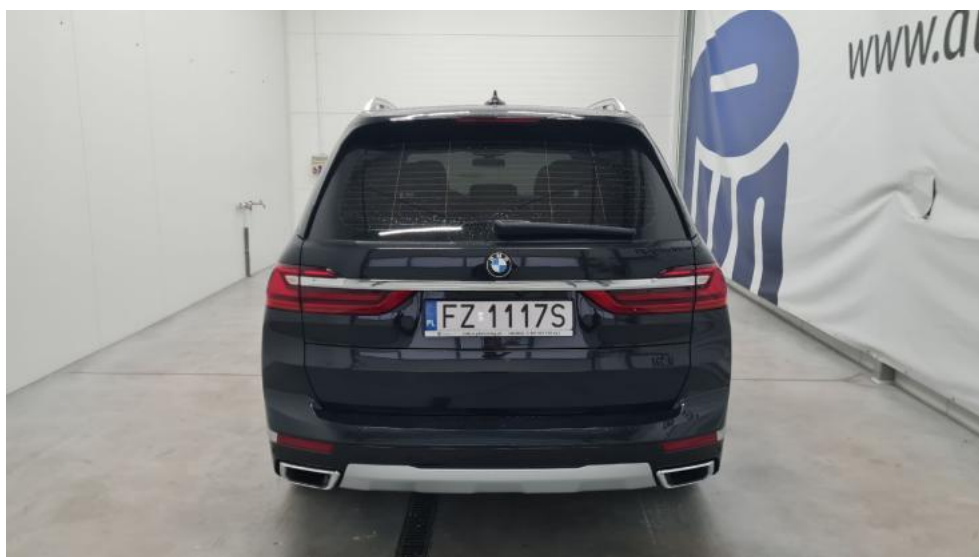
Photo 7. Tył