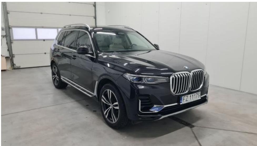
Photo 3. Przekątna przednia prawa