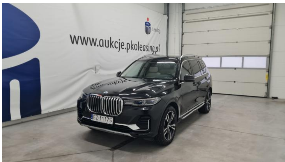
Photo 1. Przekątna przednia lewa