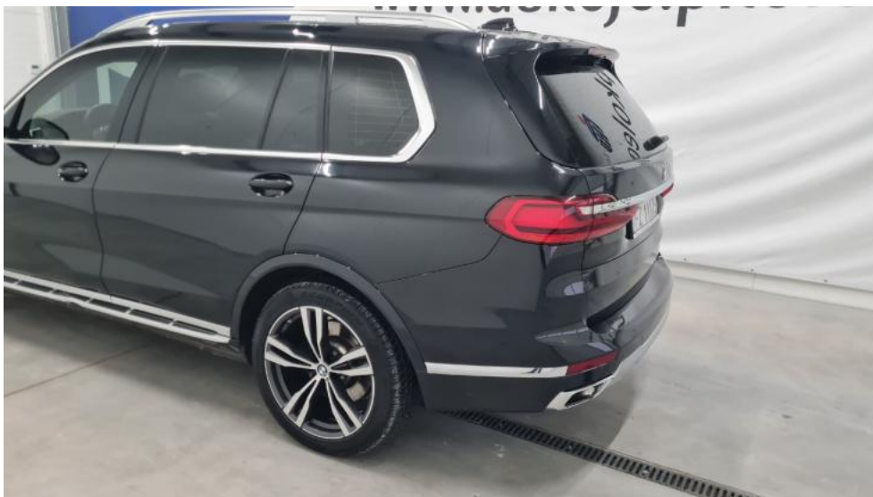
Photo 9. Bok lewy z tyłu