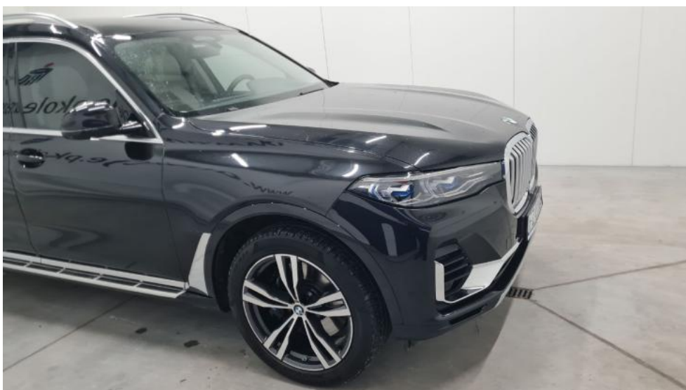
Photo 4. Bok prawy z przodu