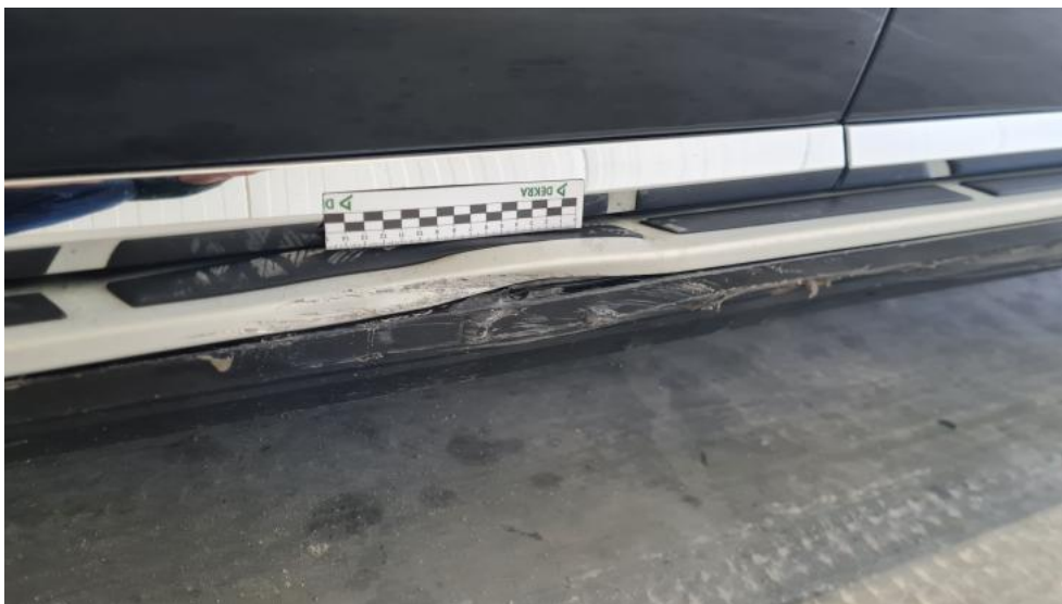
Photo 53. Próg L - Wgniecenie/odkształcenie 1