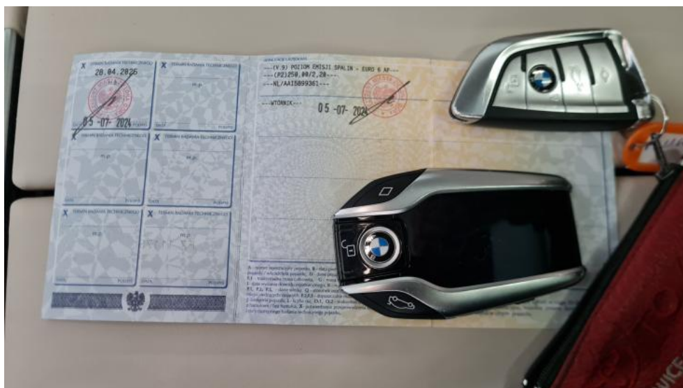
Photo 32. Dow. Rej. Str.2 i klucze