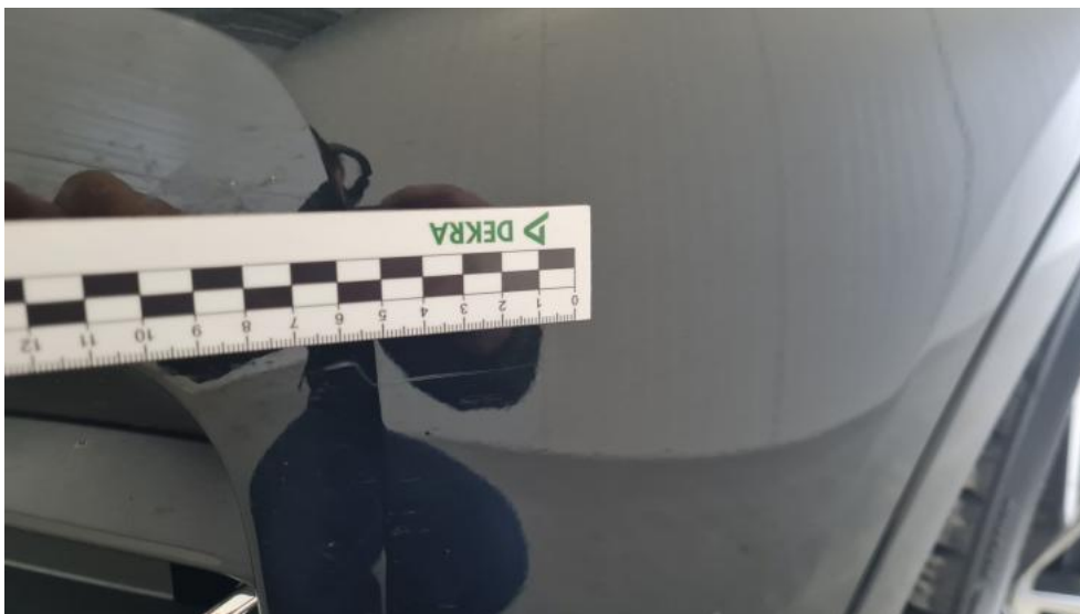
Photo 45. Zderzak - Rysa/odprysk 1