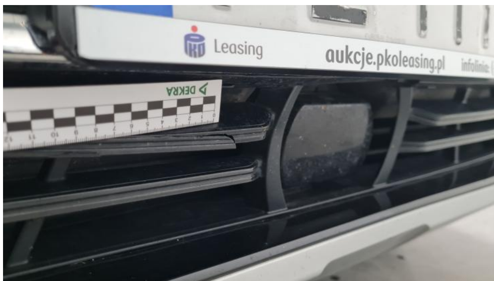
Photo 41. Kratka zderzaka prz. - Pęknięcie/rozerwanie 1