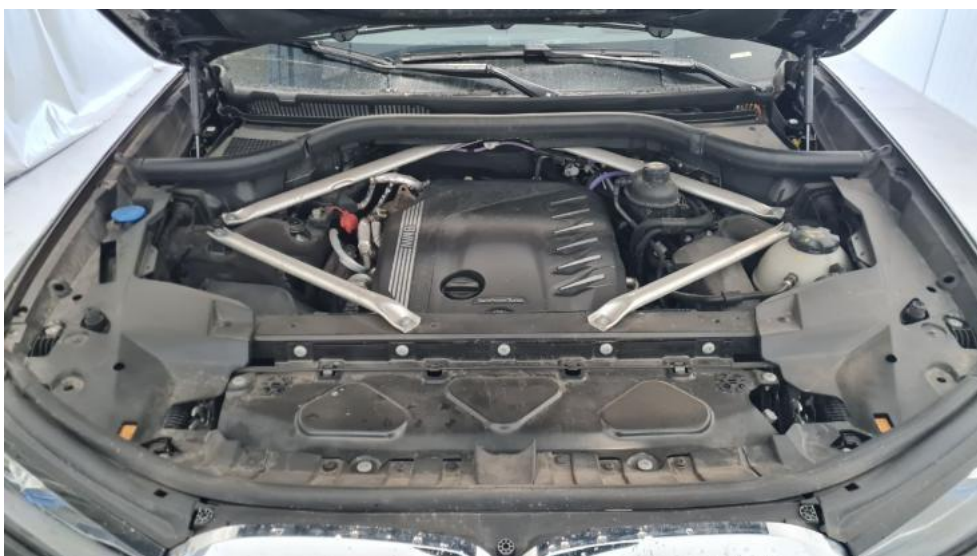
Photo 20. Komora silnika