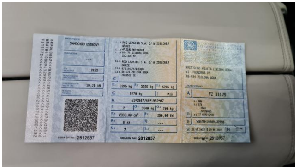
Photo 31. Dowód rej. Str. 1