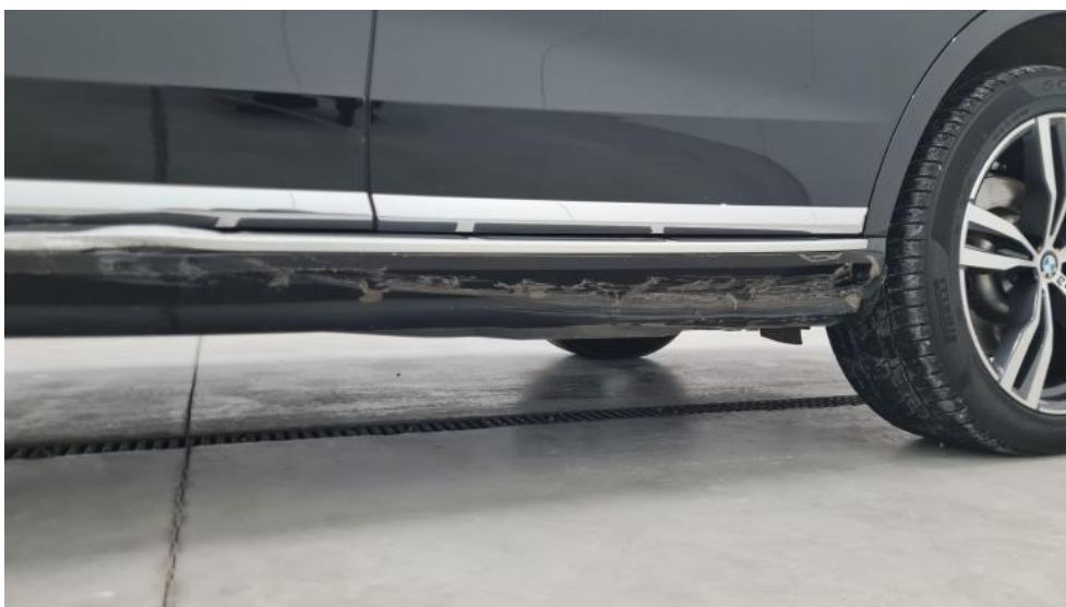
Photo 52. Próg L - zdjęcie poglądowe 2