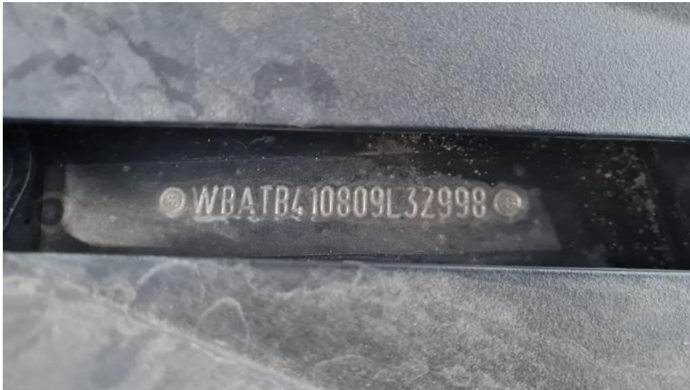
Photo 21. Numer identyfikacyjny