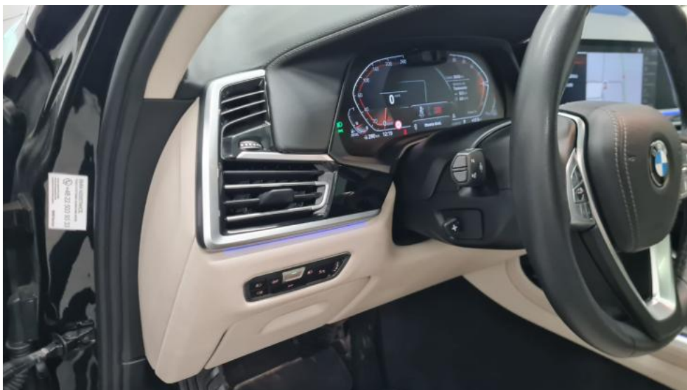
Photo 25. Kierownica z lewej strony