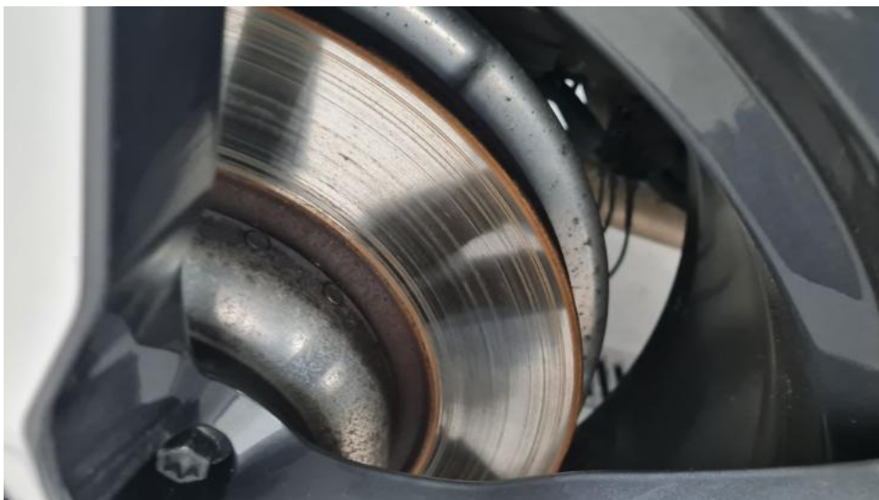
Photo 17. Tarcza hamulcowa tylna lewa