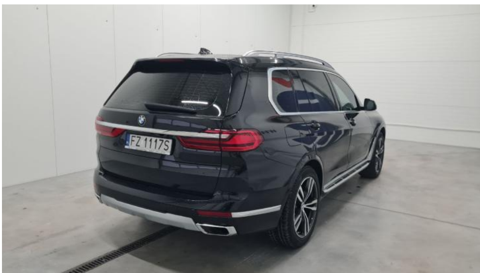
Photo 6. Przekątna tylna prawa