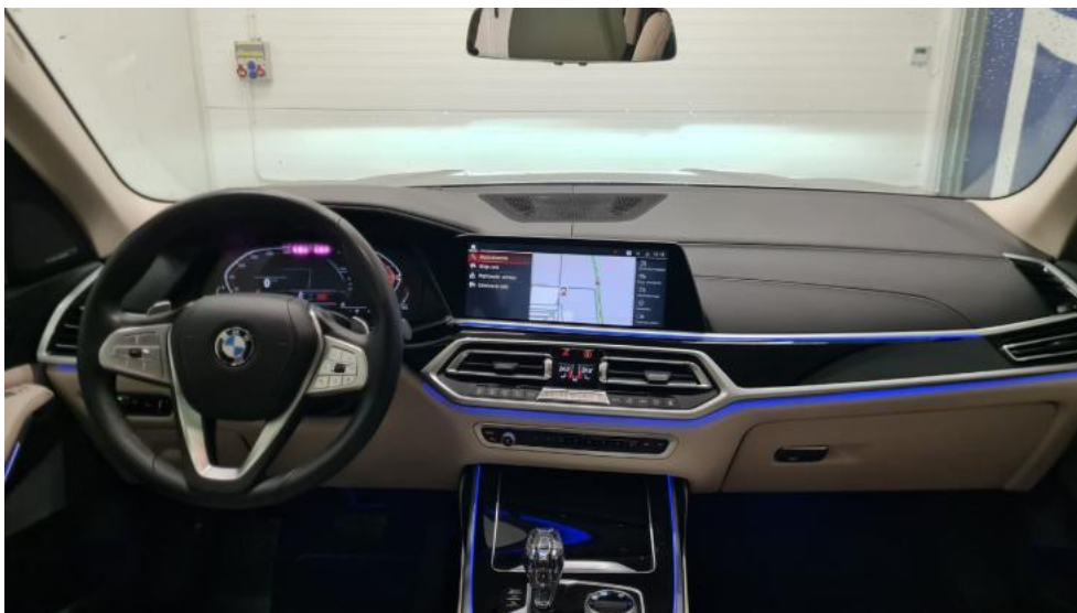
Photo 27. Widok z tylnej kanapy na deskę rozd.