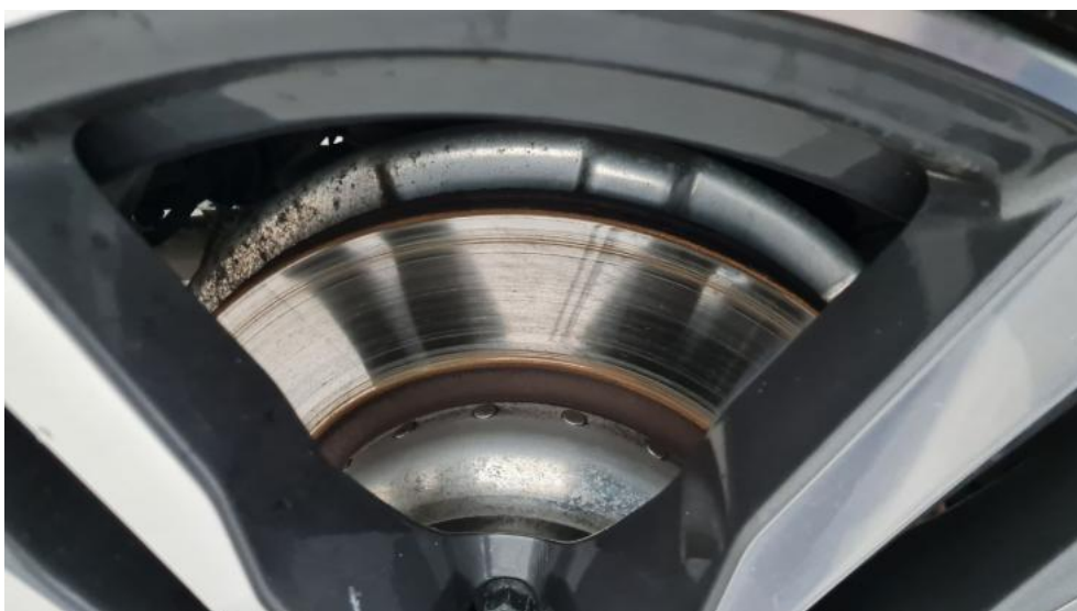
Photo 16. Tarcza hamulcowa tylna prawa