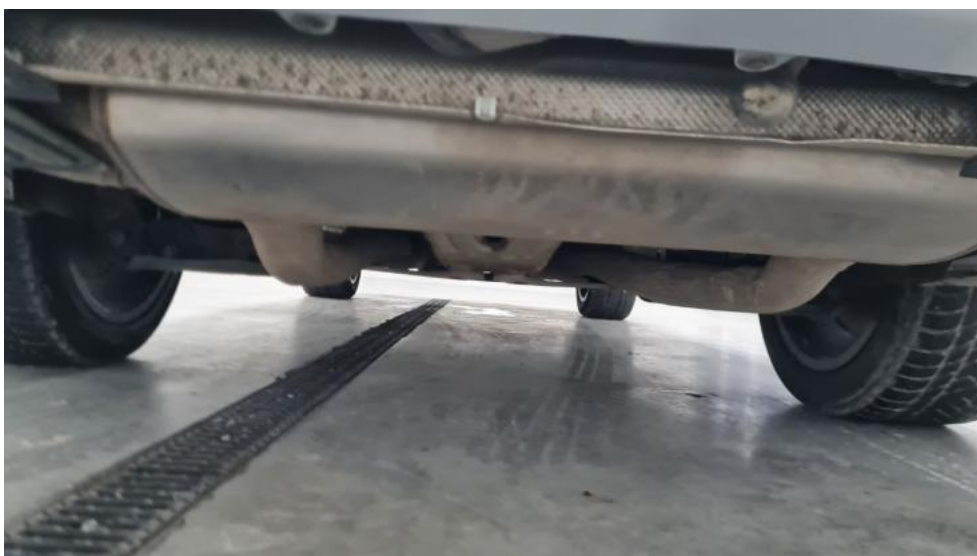
Photo 14. Spód pojazdu tył