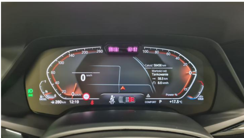
Photo 23. Zestaw wskaźników - przebieg