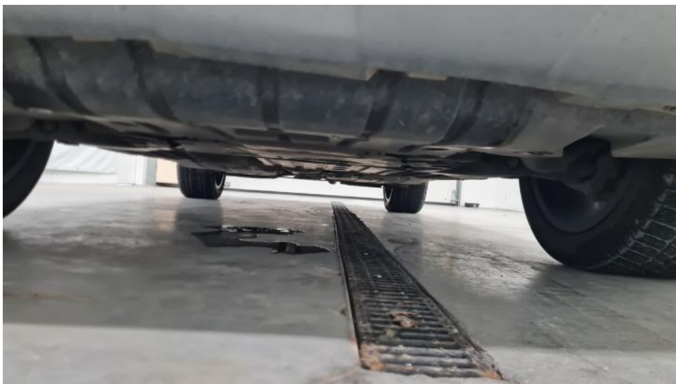
Photo 13. Spód pojazdu przód