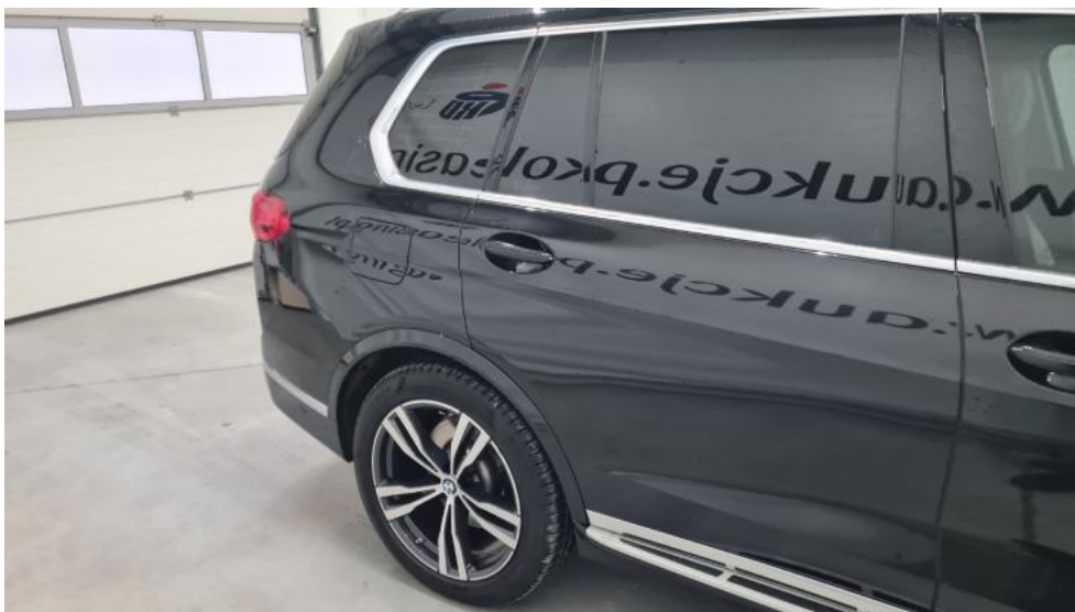
Photo 5. Bok prawy z tyłu