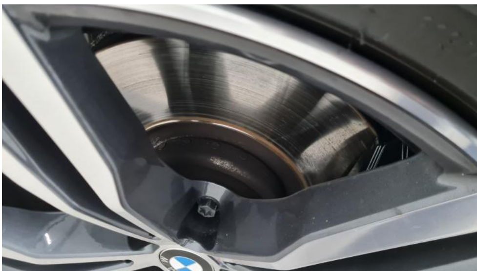
Photo 18. Tarcza hamulcowa przednia lewa