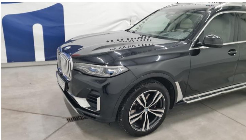
Photo 10. Bok lewy z przodu