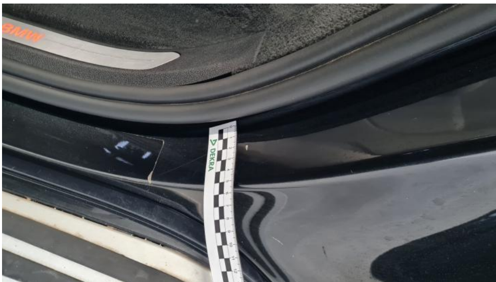
Photo 49. Błotnik tylny L / Ściana boczna L - Rysa/odprysk 1