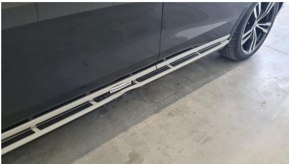
Photo 51. Próg L - zdjęcie poglądowe 1