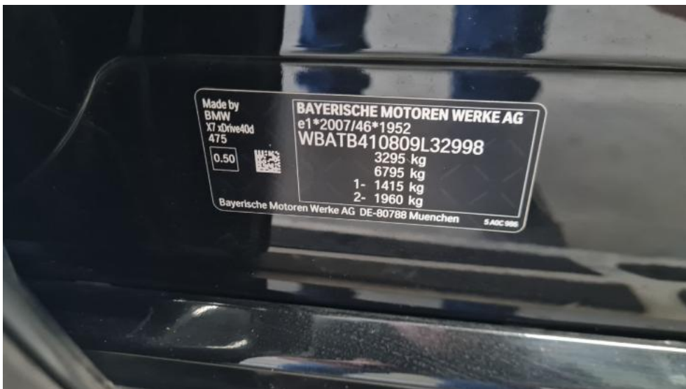
Photo 22. Tabliczka znamionowa