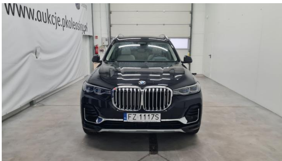
Photo 2. Przód