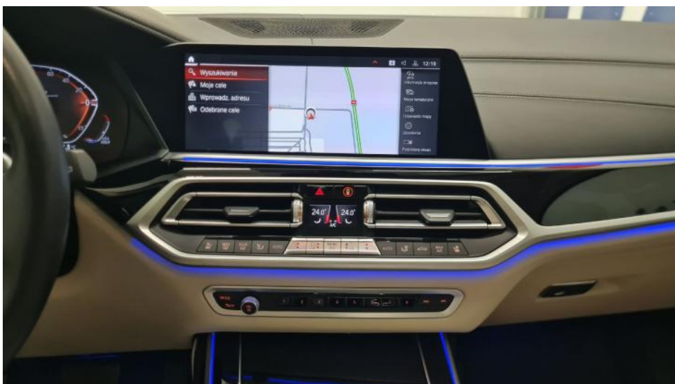
Photo 28. Konsola środkowa