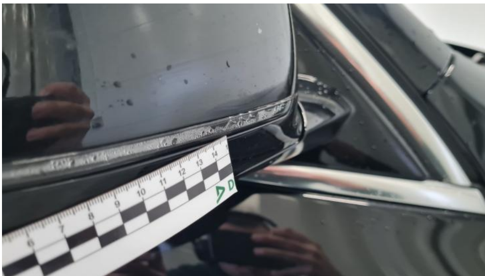
Photo 47. Lusterko zew P - Inne 1