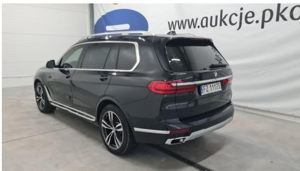
Photo 8. Przekątna tylna lewa