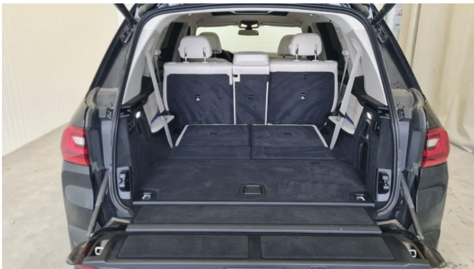
Photo 19. Bagażnik