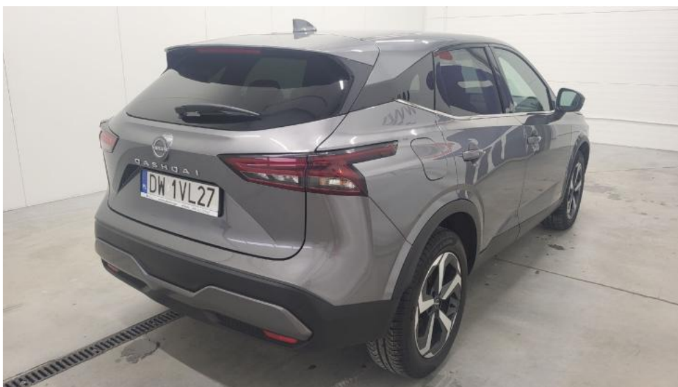
Photo 6. Przekątna tylna prawa