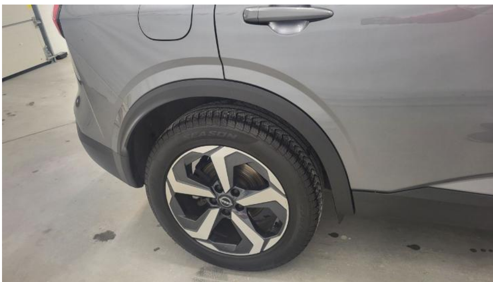
Photo 5. Bok prawy z tyłu