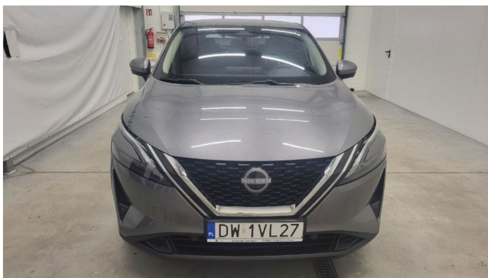
Photo 2. Przód