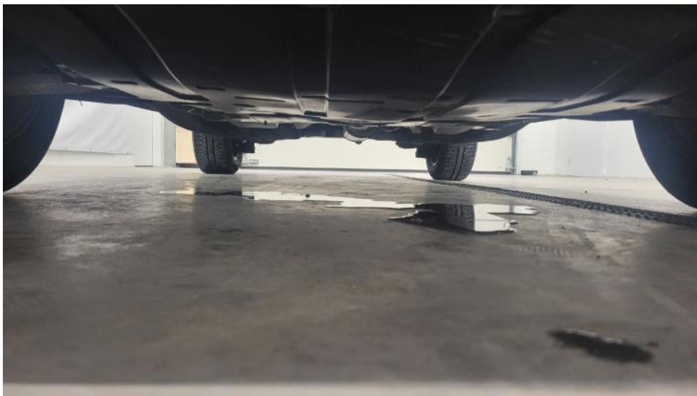
Photo 13. Spód pojazdu przód