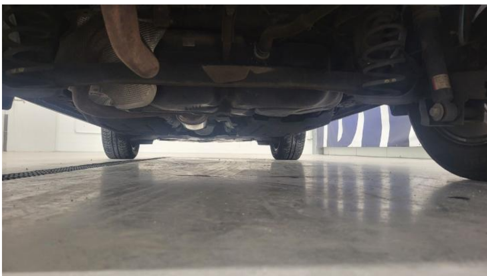
Photo 14. Spód pojazdu tył