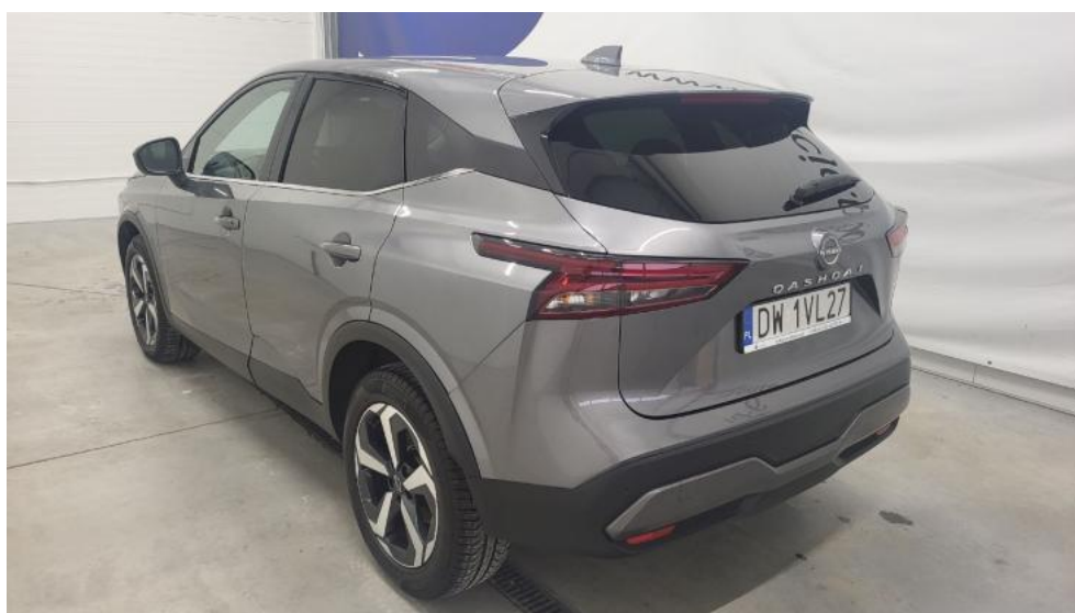
Photo 8. Przekątna tylna lewa