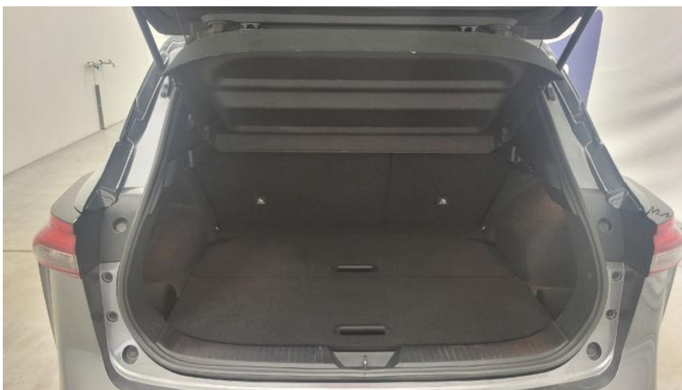
Photo 19. Bagażnik