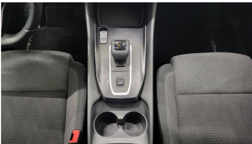
Photo 30. Tunel środkowy