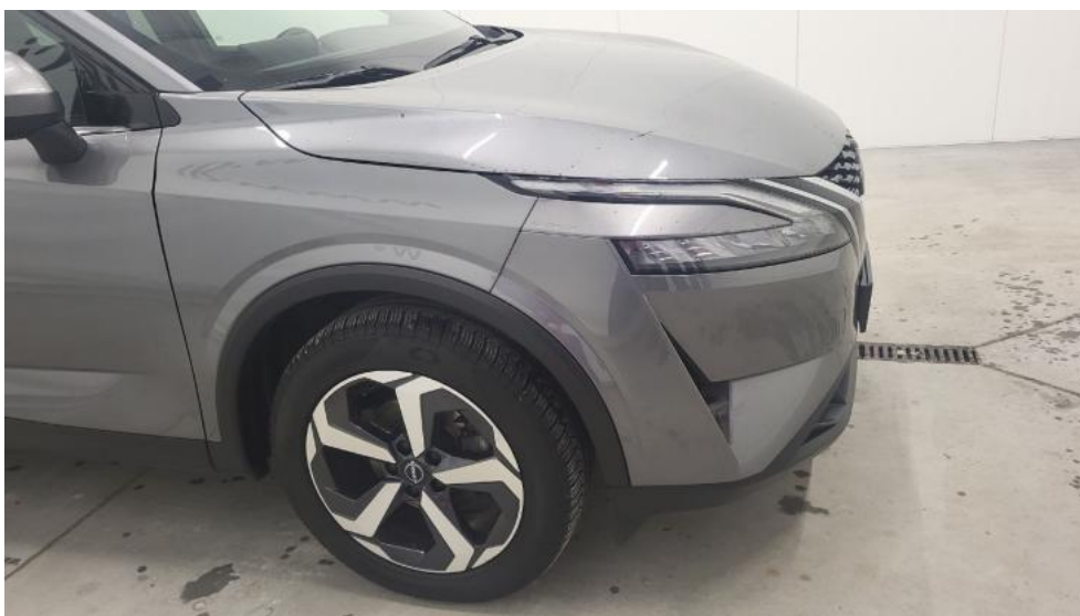
Photo 4. Bok prawy z przodu