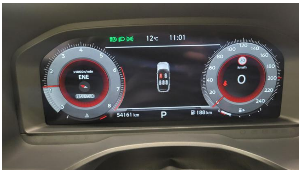
Photo 24. Zestaw wskaźników - przebieg