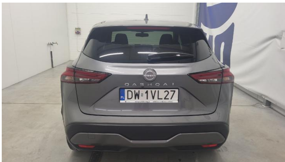
Photo 7. Tyl