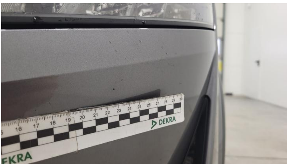
Photo 36. Zderzak - Rysa/odprysk 1