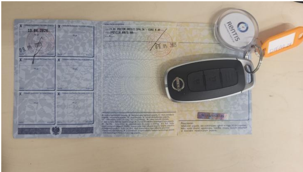
Photo 33. Dow. Rej. Str.2 i klucze