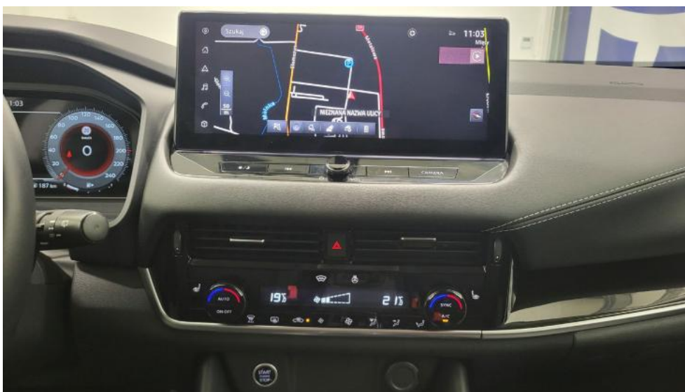
Photo 29. Konsola środkowa