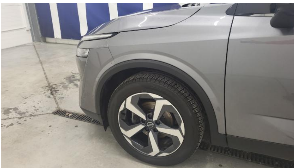
Photo 10. Bok lewy z przodu