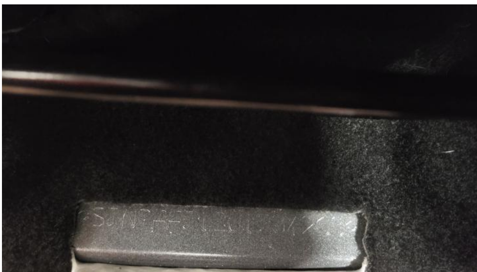
Photo 22. Numer identyfikacyjny