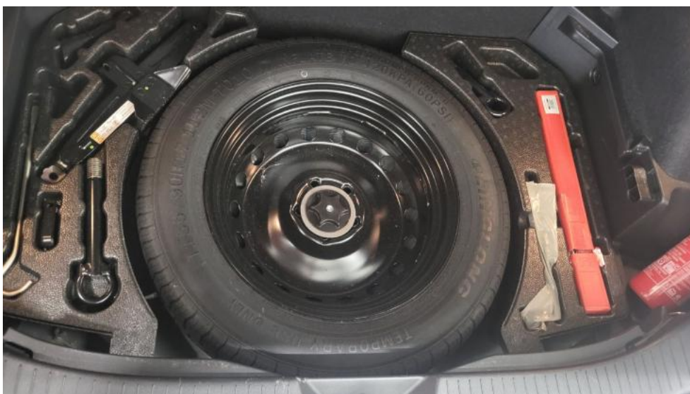
Photo 20. Koło zapasowe