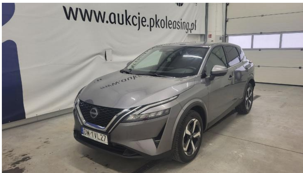
Photo 1. Przekątna przednia lewa