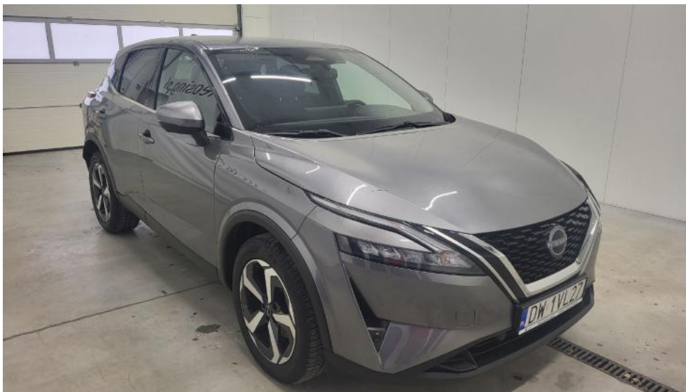
Photo 3. Przekątna przednia prawa