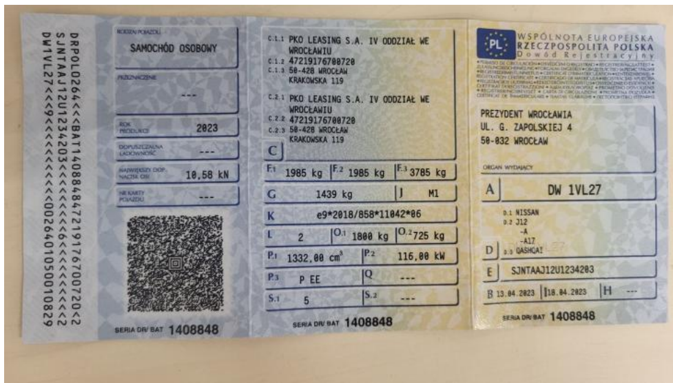
Photo 32. Dowód rej. Str. 1