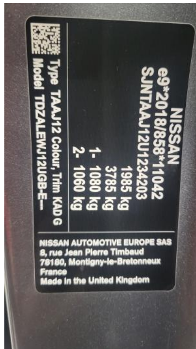
Photo 23. Tabliczka znamionowa