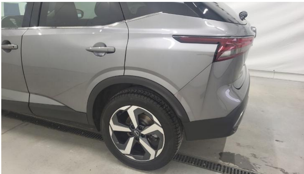
Photo 9. Bok lewy z tyłu