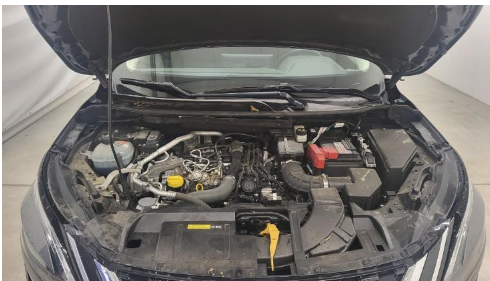
Photo 21. Komora silnika