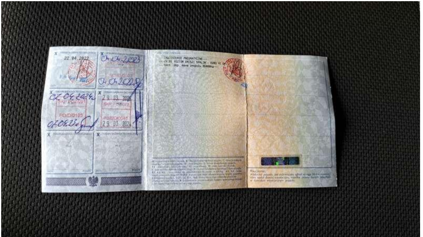
Fot. nr 65

Dokument wystawiony elektronicznie, waży bez podpisu