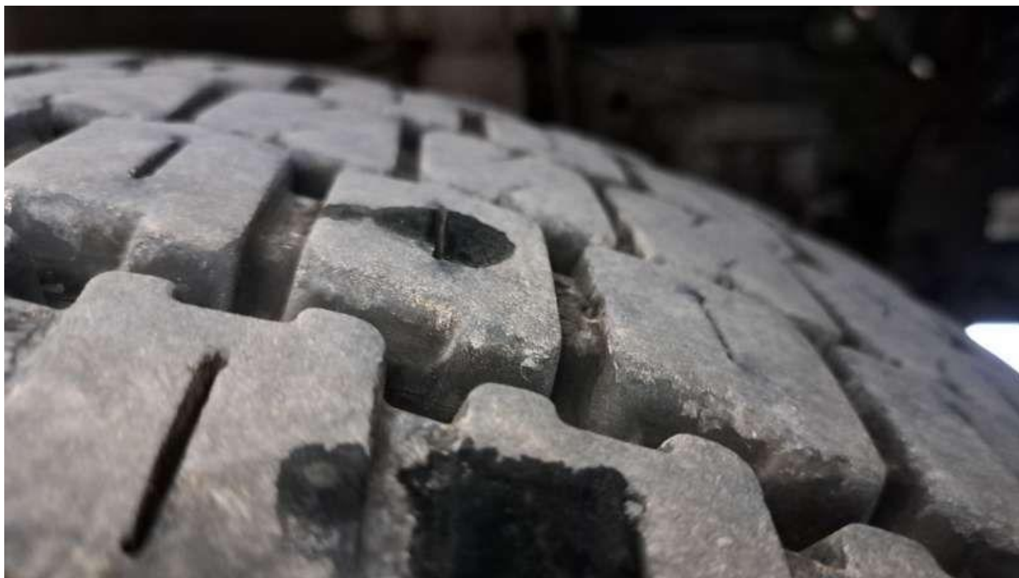
Fot. nr 62