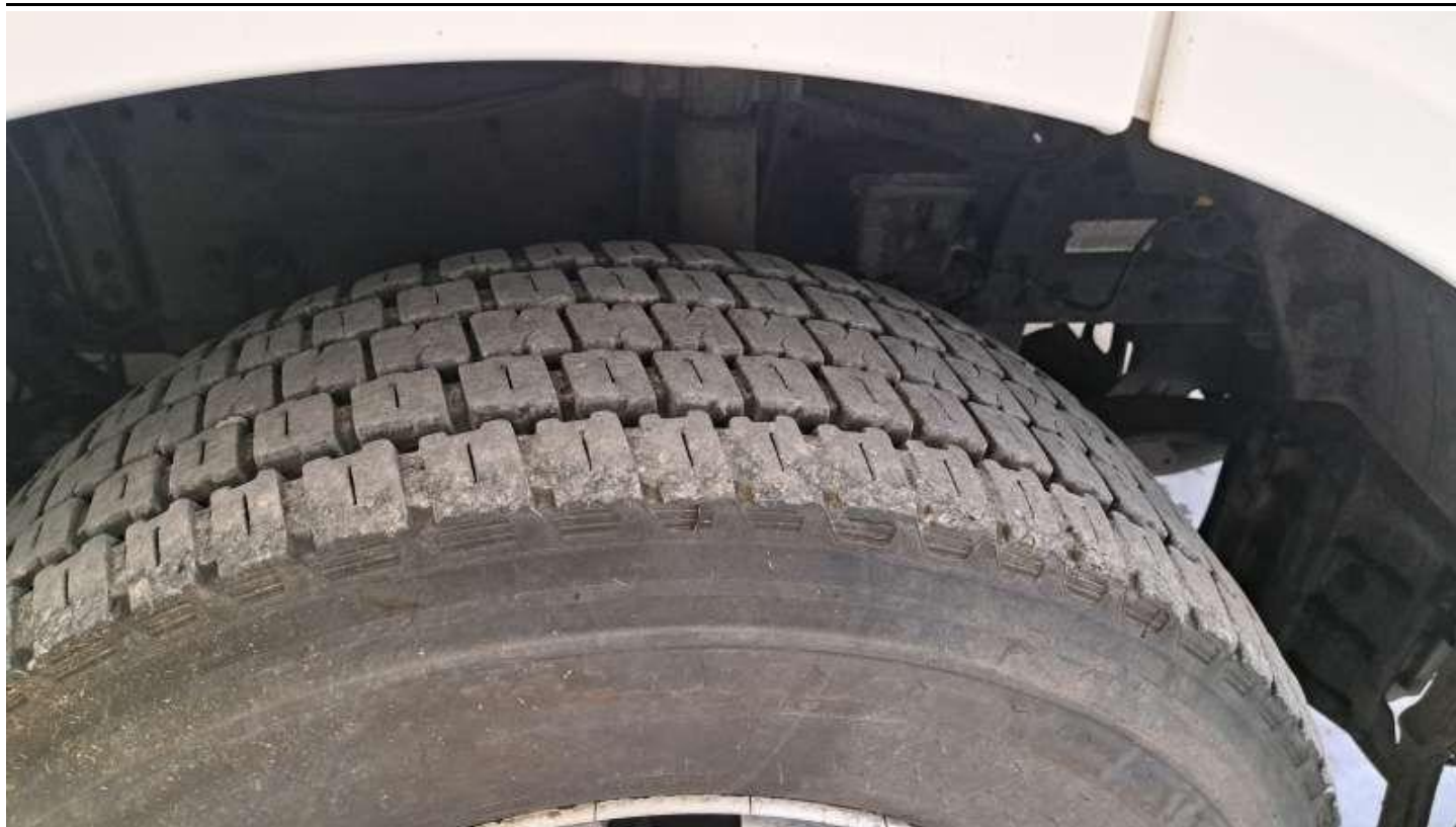
Fot. nr 61