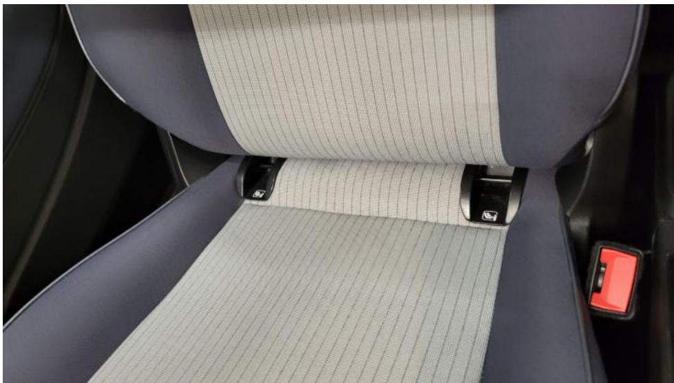
Fot. 43. Zdjęcie do protokołu