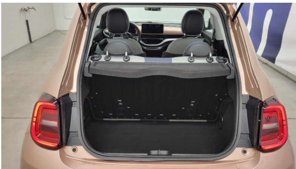
Fot. 19. Bagażnik