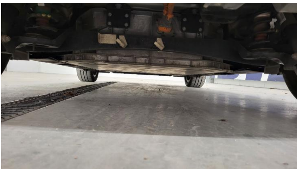
Fot. 14. Spód pojazdu tył