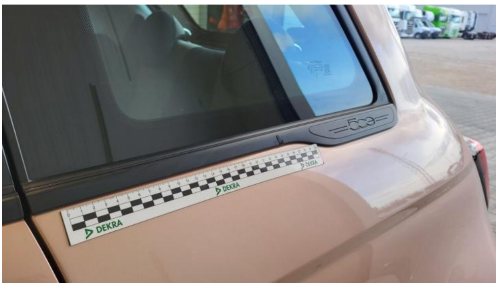
Fot. 56. Uszczelka szyby bocznej tyl L - zdjęcie poglądowe 1