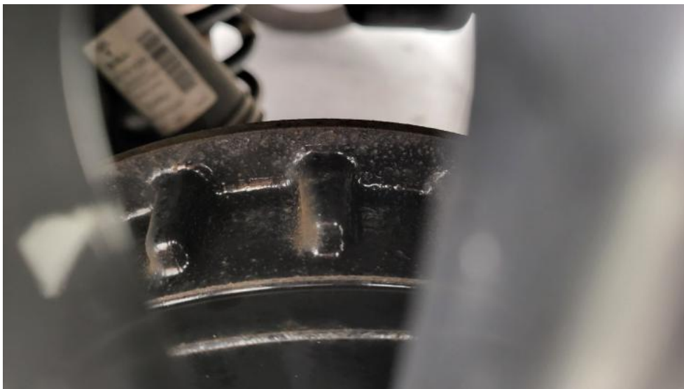
Fot. 17. Tarcza hamulcowa tylna lewa