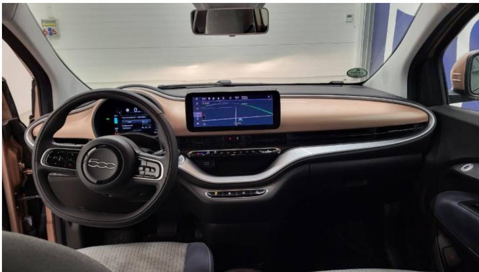
Fot. 27. Widok z tylnej kanapy na deskę rozd.