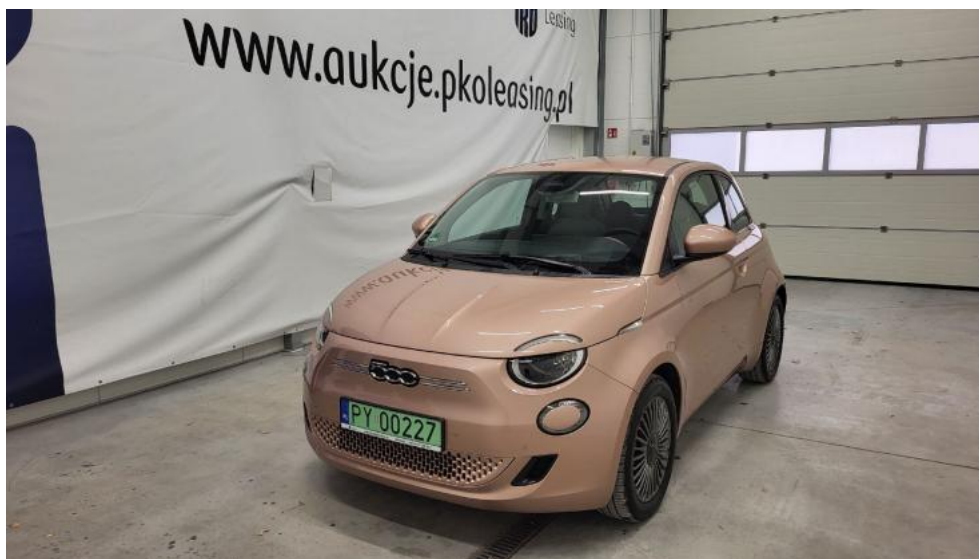
Fot. 1. Przekątna przednia lewa