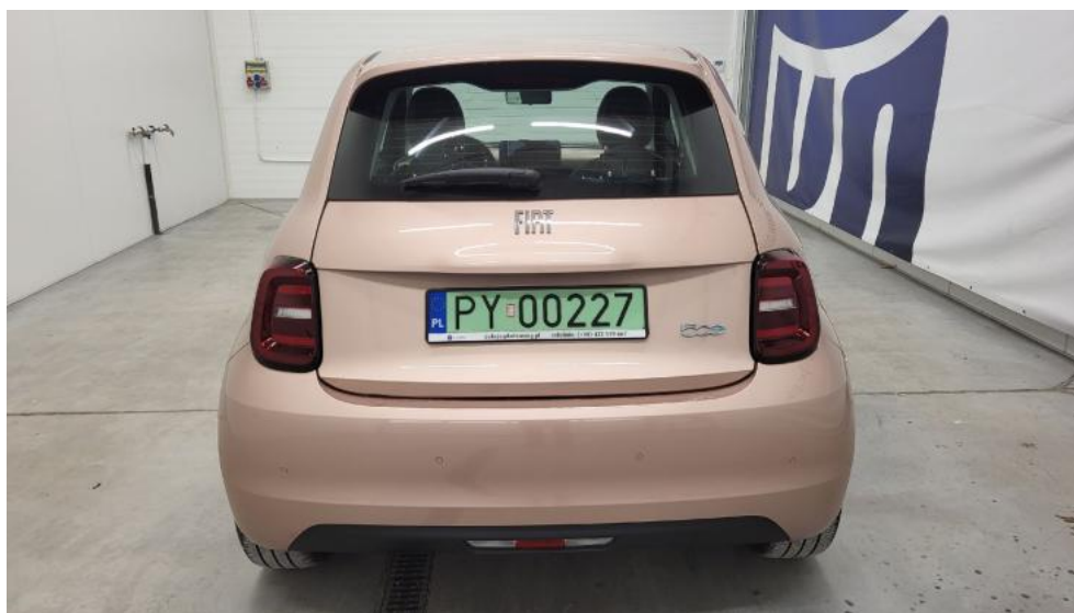
Fot. 7. Tyl