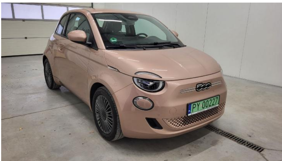
Fot. 3. Przekątna przednia prawa