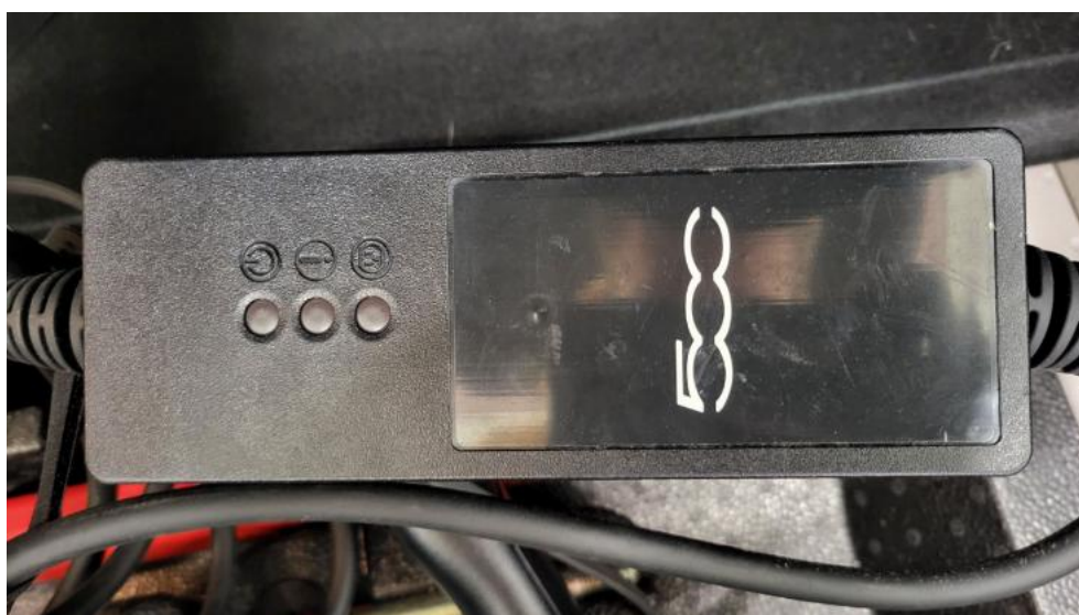
Fot. 40. Zdjęcie do protokołu