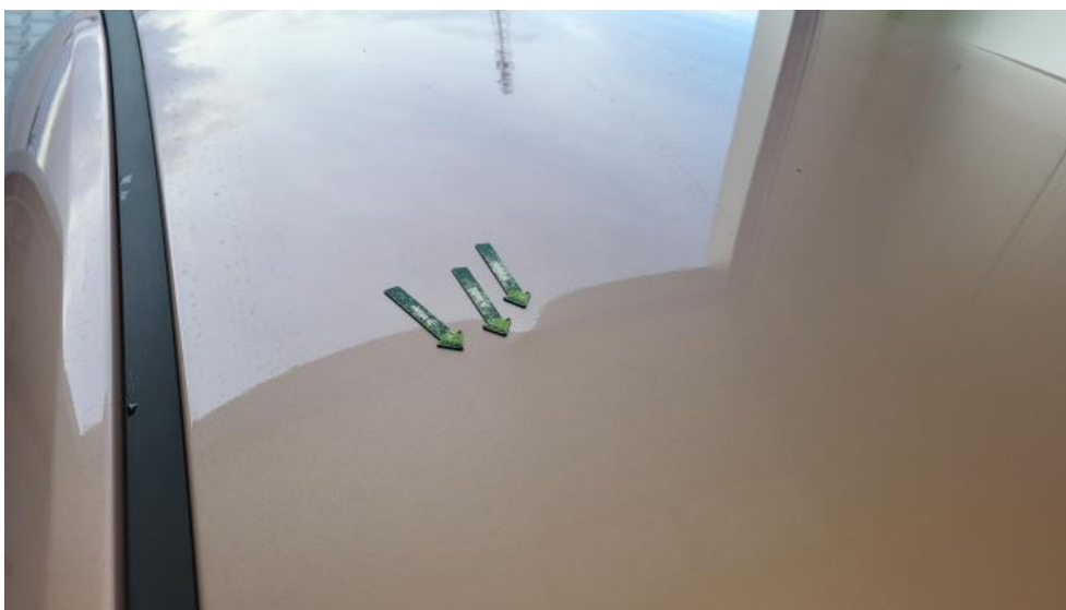
Fot. 55. Dach - Wgniecenie/odkształcenie 2