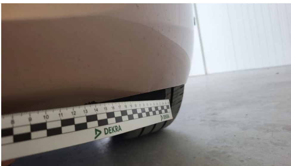
Fot. 52. Zderzak - Wgniecenie/odkształcenie 1