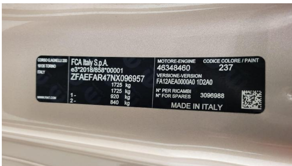
Fot. 22. Tabliczka znamionowa