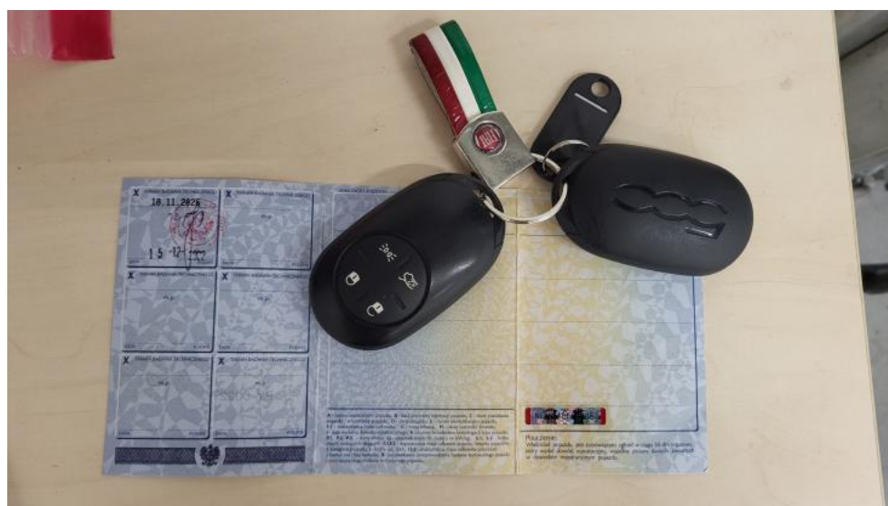
Fot. 32. Dow. Rej. Str.2 i klucze