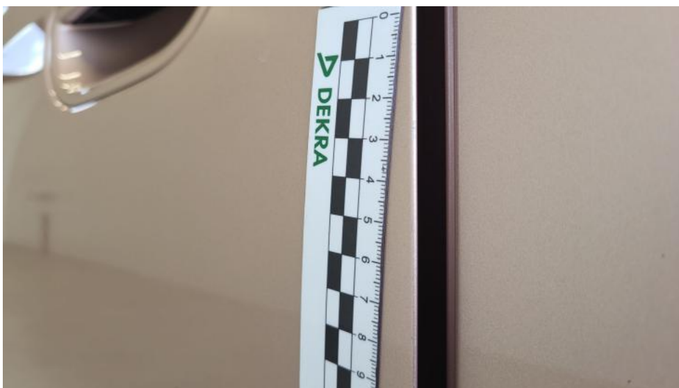
Fot. 59. Drzwi przed L - Rysa/odprysk 1