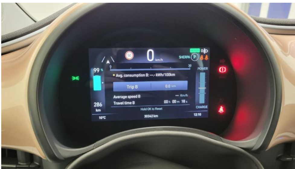
Fot. 23. Zestaw wskaźników - przebieg