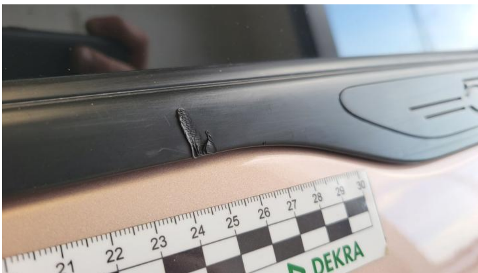
Fot. 57. Uszczelka szyby bocznej tyl L - Rysa/odprysk 1