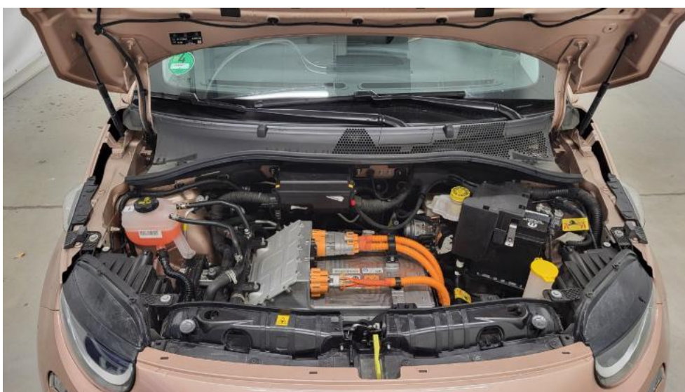
Fot. 20. Komora silnika