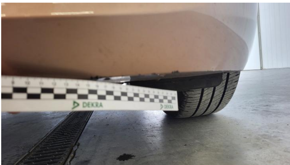
Fot. 51. Zderzak - Rysa/odprysk 2