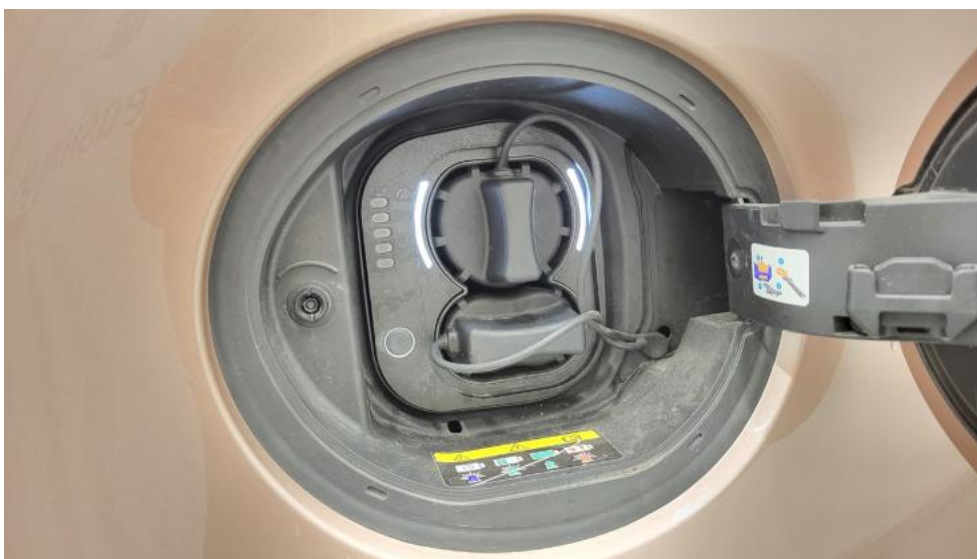
Fot. 41. Zdjęcie do protokołu