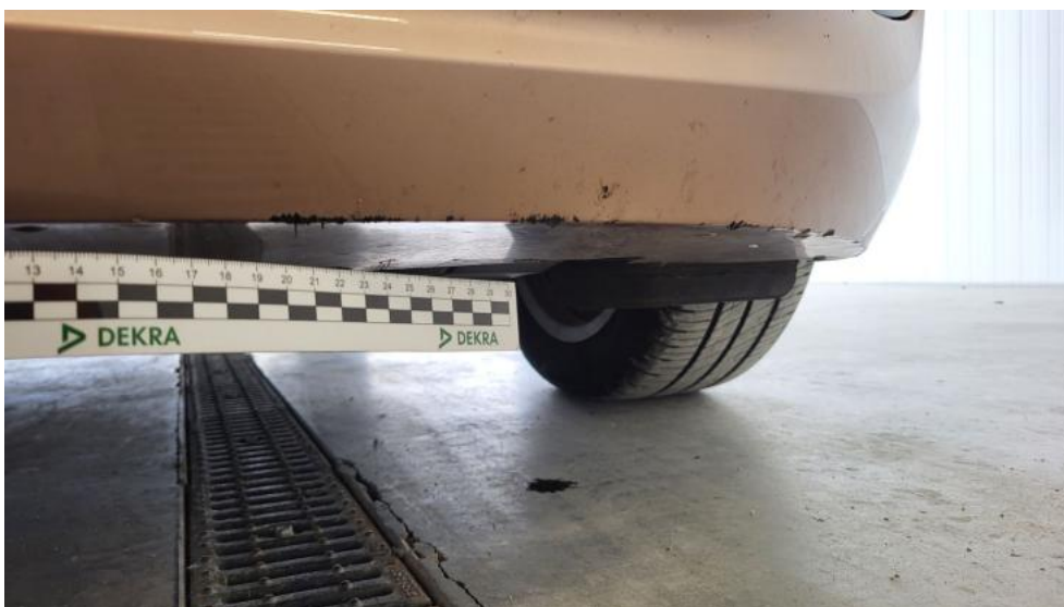
Fot. 50. Zderzak - Rysa/odprysk 1