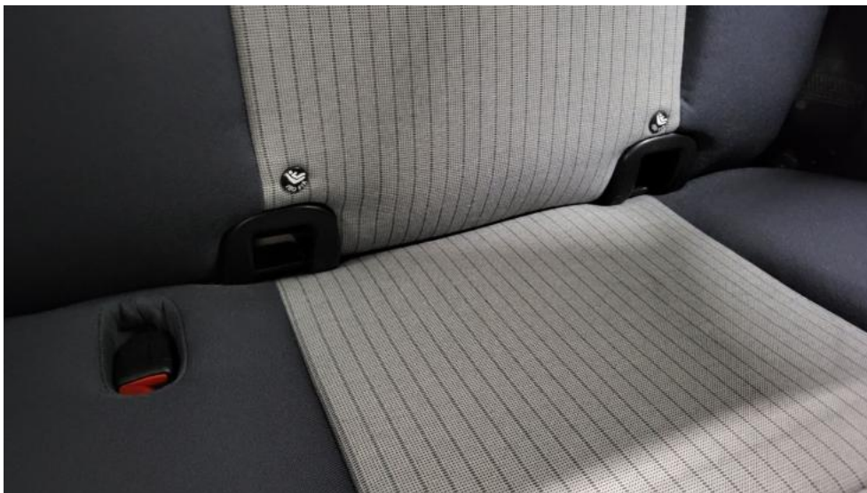
Fot. 45. Zdjęcie do protokołu