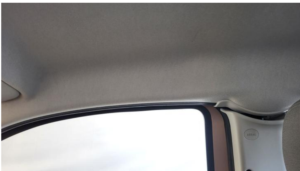
Fot. 60. Podsufitka - zdjęcie poglądowe 1