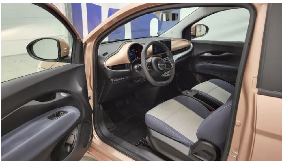
Fot. 26. Widok przez otwarte drzwi tylne lewe