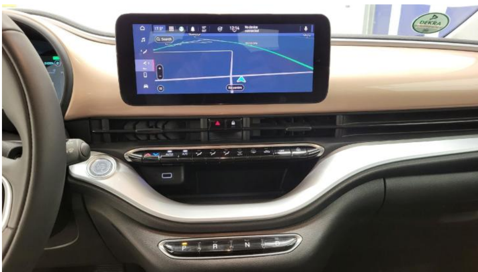
Fot. 28. Konsola środkowa