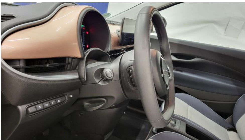
Fot. 25. Kierownica z lewej strony