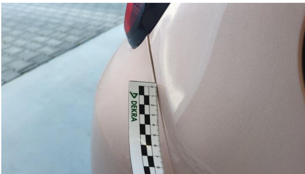
Fot. 53. Zderzak tylny - Inne 1