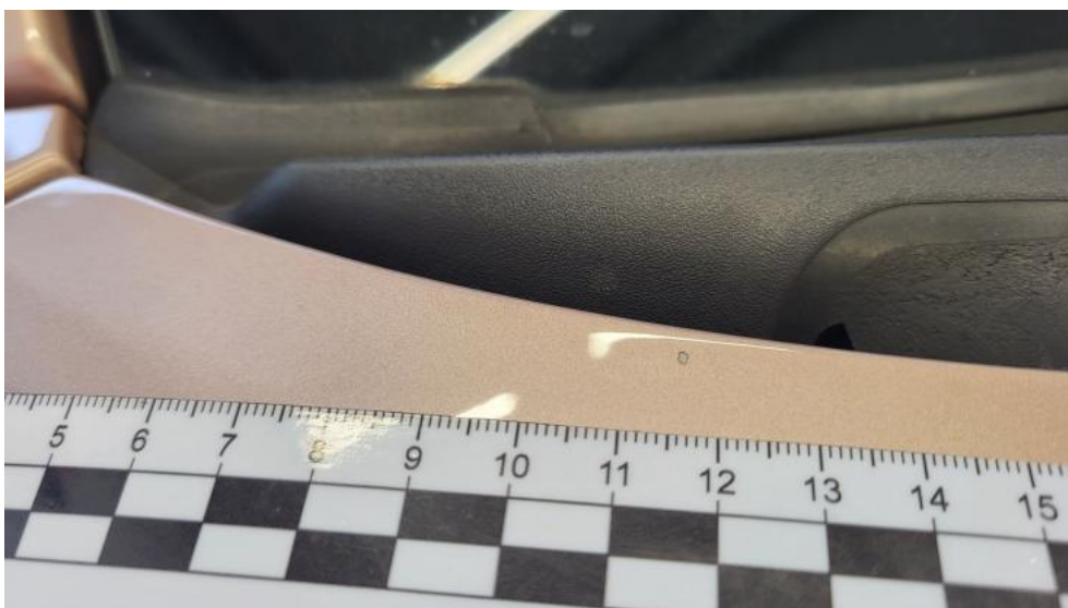
Fot. 48. Pokrywa silnika - Rysa/odprysk 1