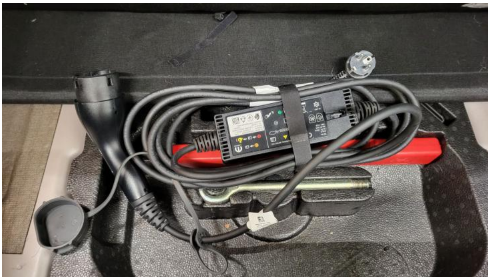
Fot. 35. Przewód ładowania baterii trakcyjnej