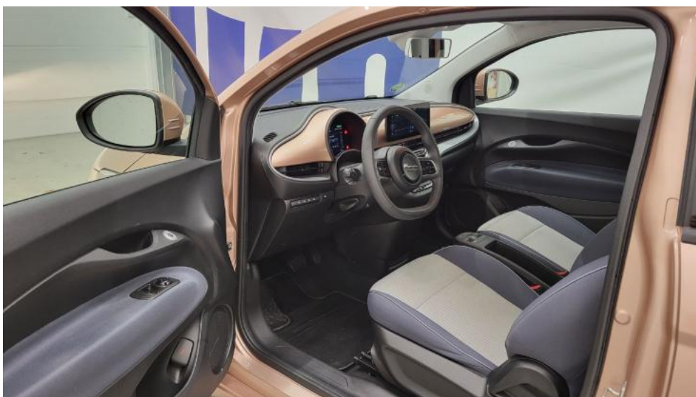
Fot. 24. Widok przez otwarte drzwi przednie lewe