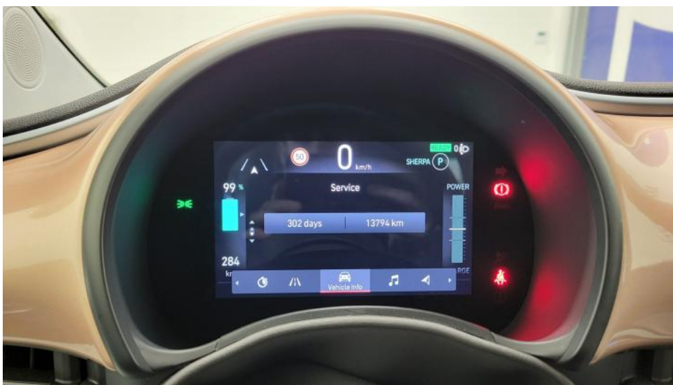
Fot. 33. Książka serwisowa – dane