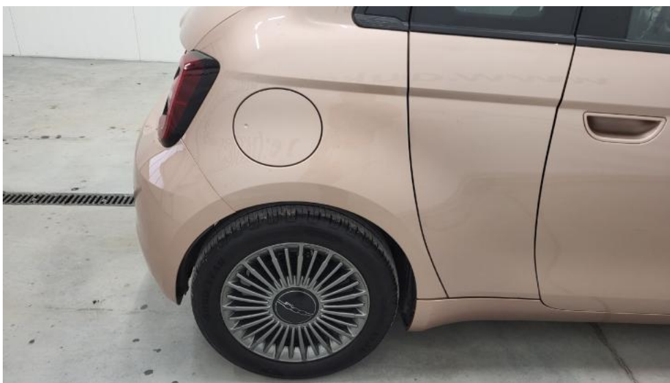
Fot. 5. Bok prawy z tyłu