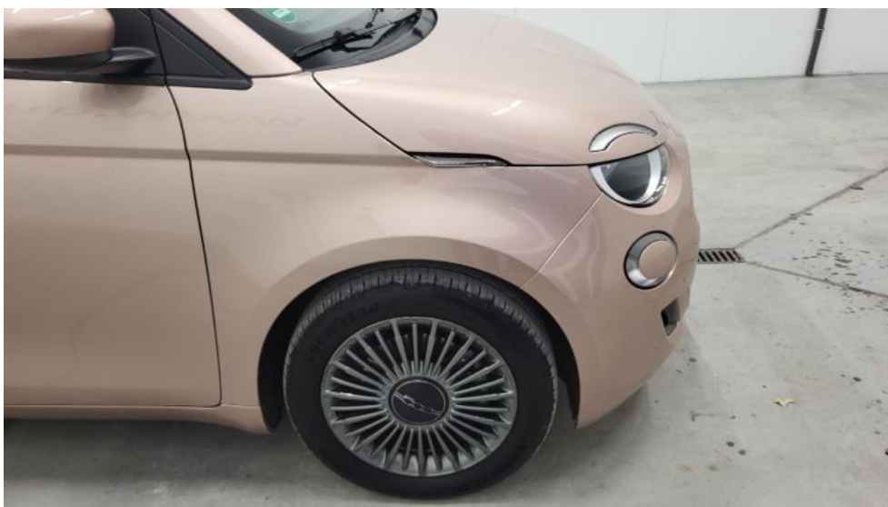
Fot. 4. Bok prawy z przodu