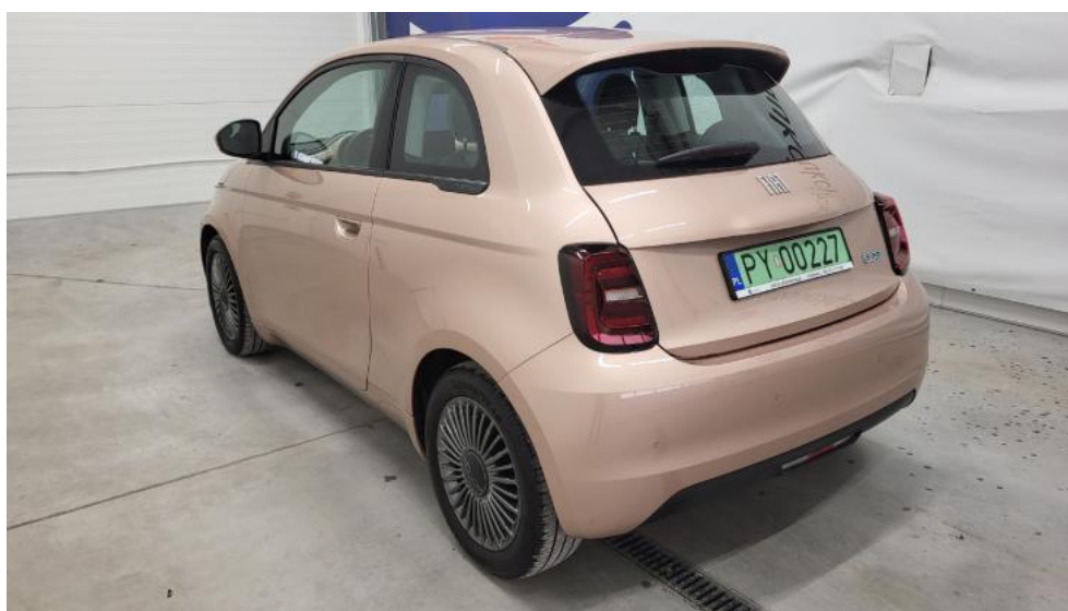
Fot. 8. Przekątna tylna lewa