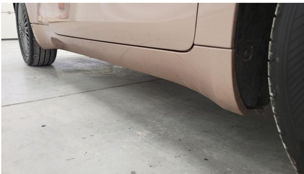
Fot. 12. Próg prawy (widok od przodu)