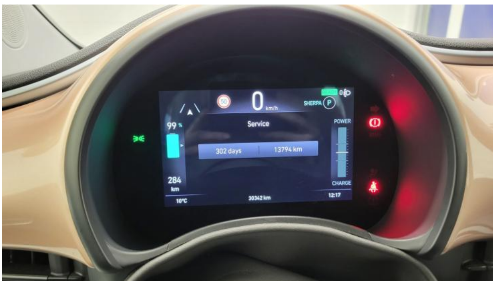
Fot. 34. Książka serwisowa – ostatni przegląd