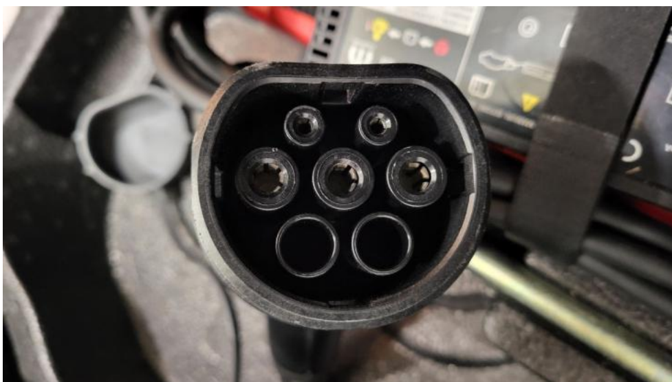
Fot. 38. Zdjęcie do protokołu