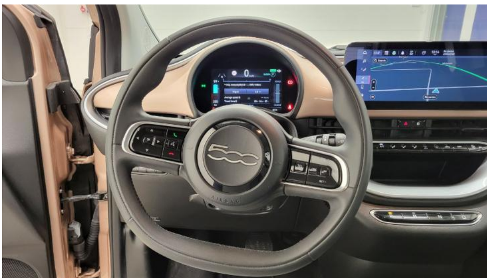
Fot. 30. Kierownica (na wprost)