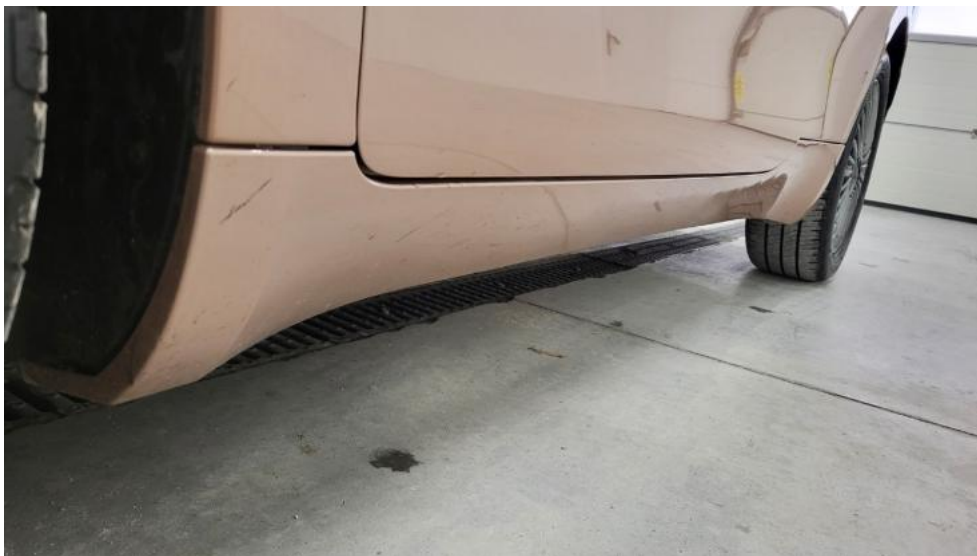
Fot. 11. Próg lewy (widok od przodu)