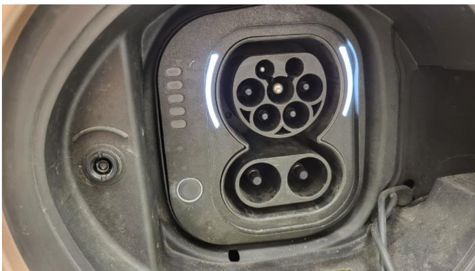
Fot. 42. Zdjęcie do protokołu