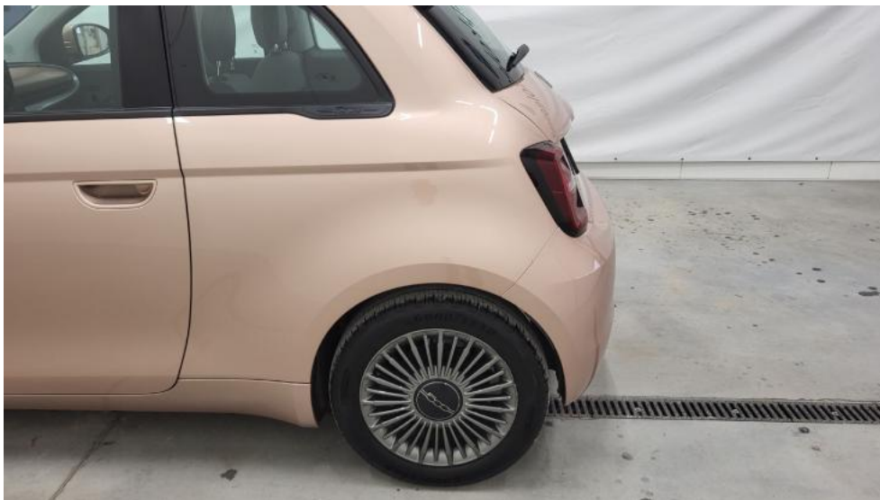
Fot. 9. Bok lewy z tyłu