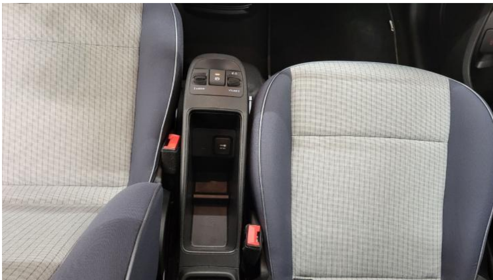
Fot. 29. Tunel środkowy