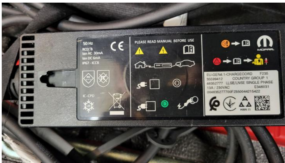
Fot. 39. Zdjęcie do protokołu