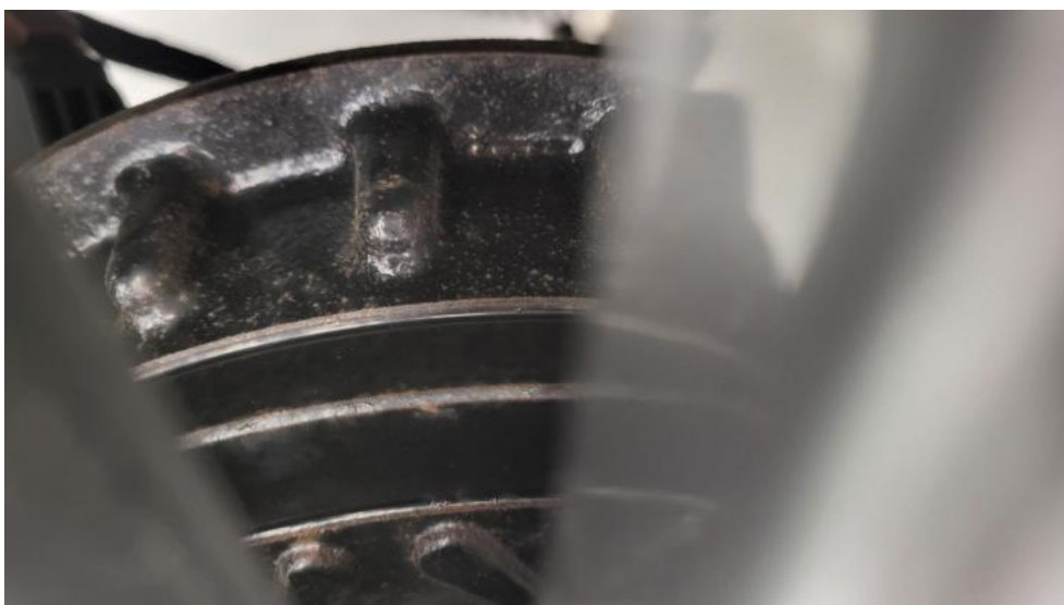
Fot. 16. Tarcza hamulcowa tylna prawa