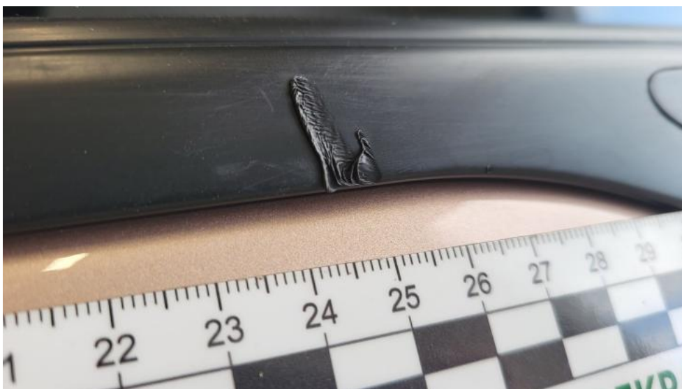
Fot. 58. Uszczelka szyby bocznej tyl L - Wgniecenie/odkształcenie 1