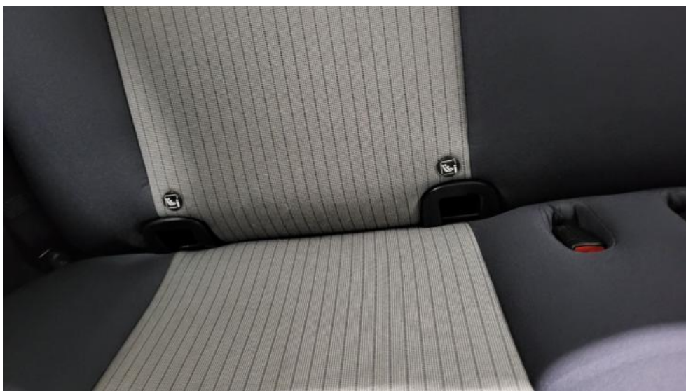
Fot. 44. Zdjęcie do protokołu