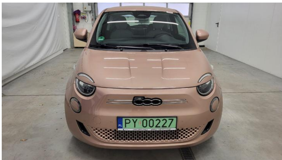
Fot. 2. Przód