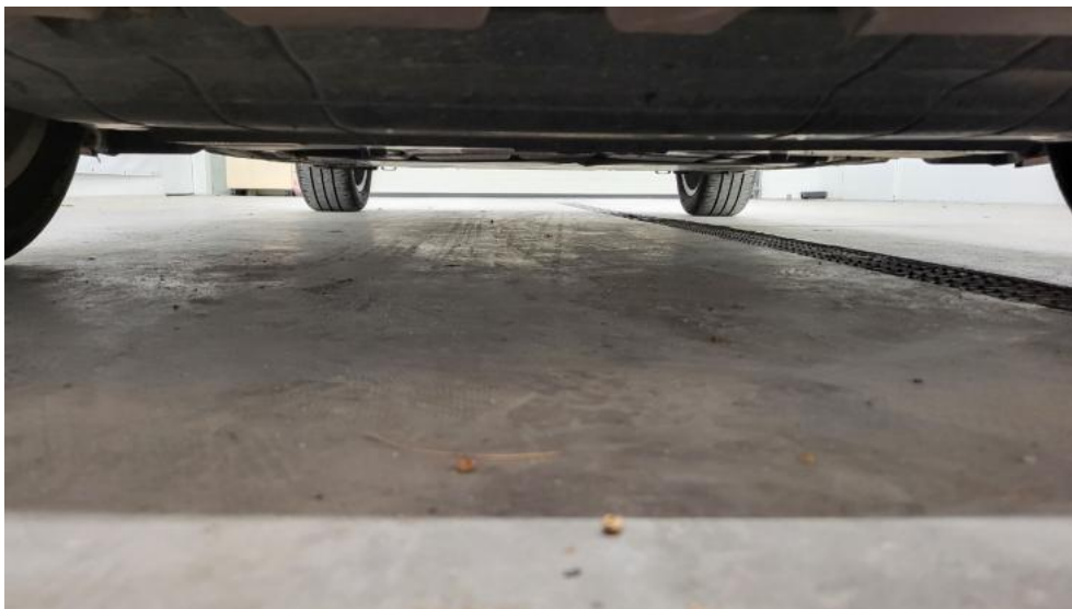
Fot. 13. Spód pojazdu przód