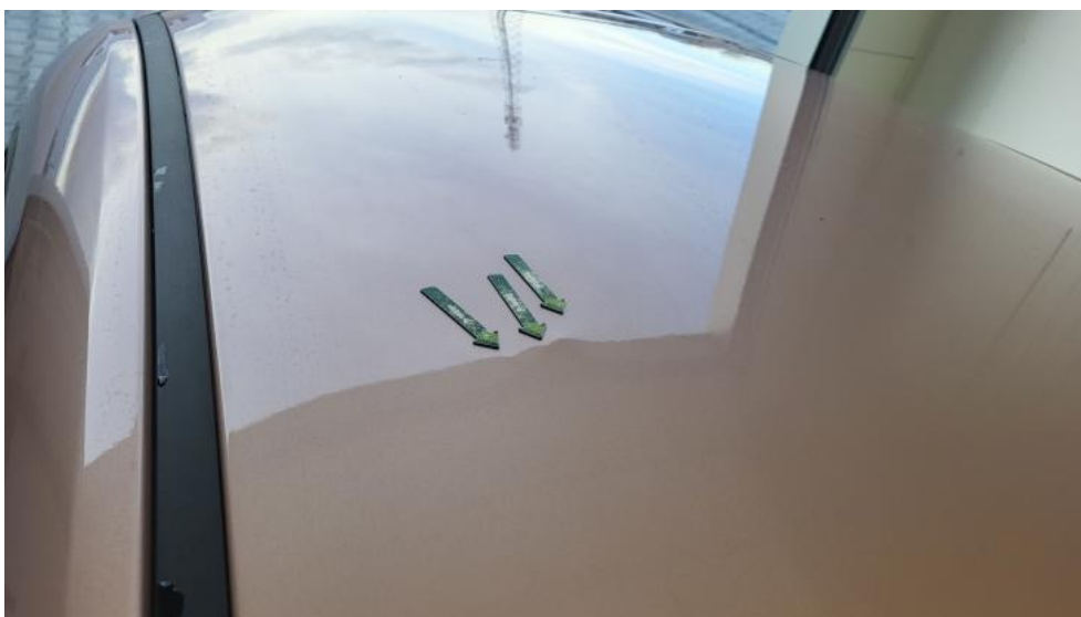
Fot. 54. Dach - Wgniecenie/odkształcenie 1