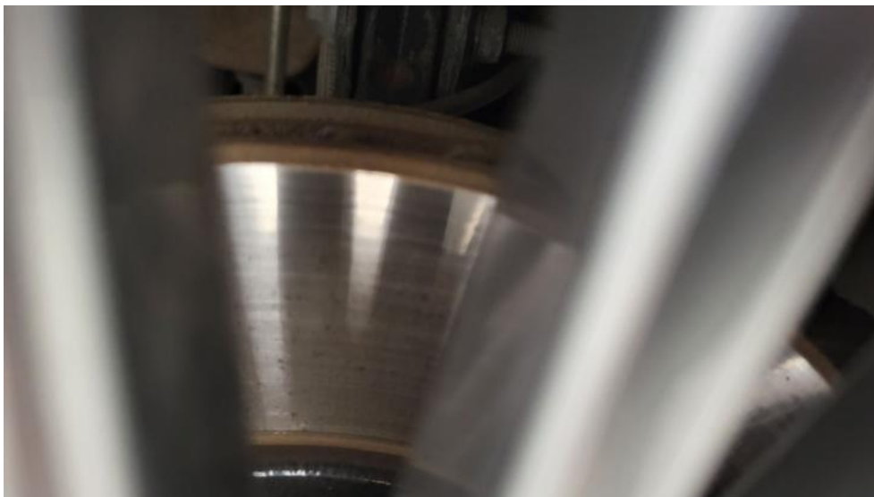
Fot. 15. Tarcza hamulcowa przednia prawa