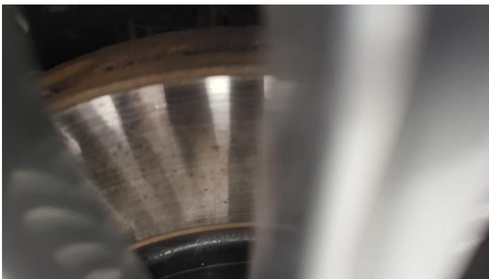
Fot. 18. Tarcza hamulcowa przednia lewa