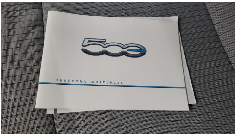
Fot. 36. Instrukcje