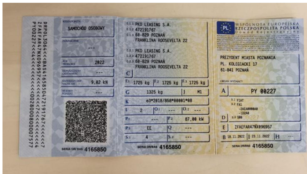
Fot. 31. Dowód rej. Str. 1