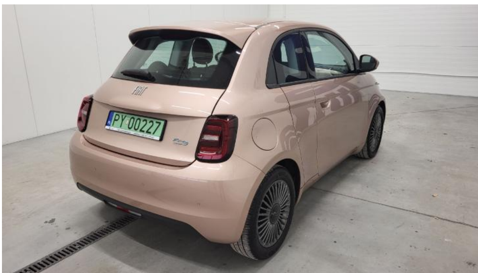
Fot. 6. Przekątna tylna prawa