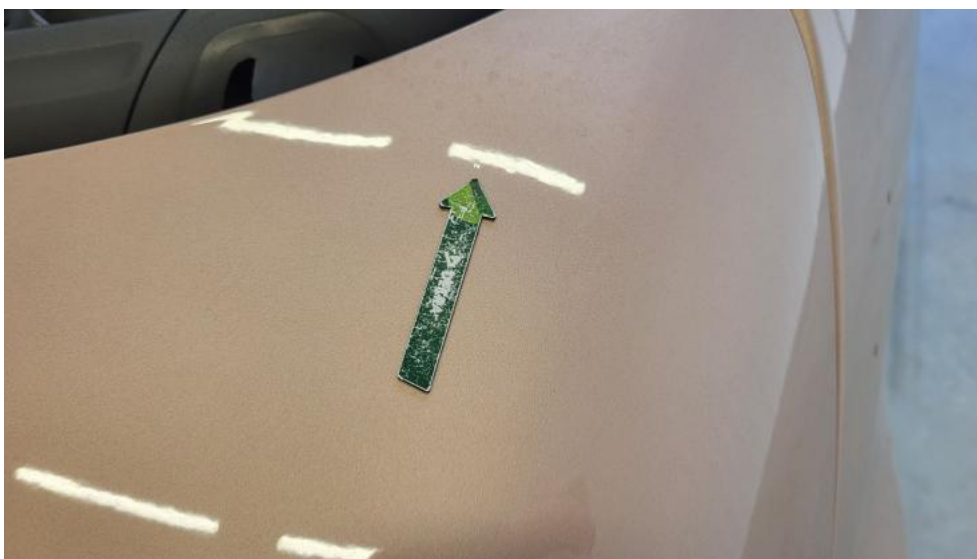
Fot. 49. Pokrywa silnika - Wgniecenie/odkształcenie 1