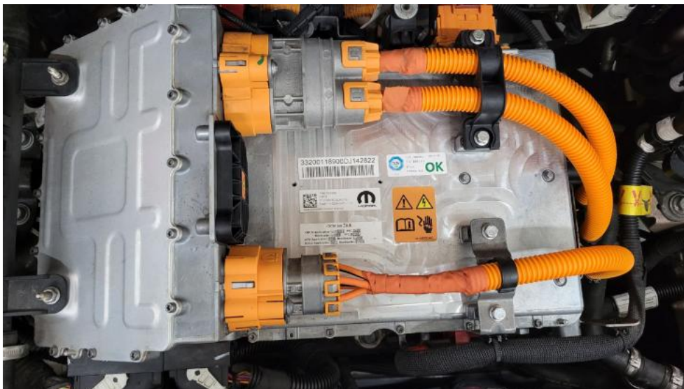
Fot. 37. Zdjęcie do protokołu