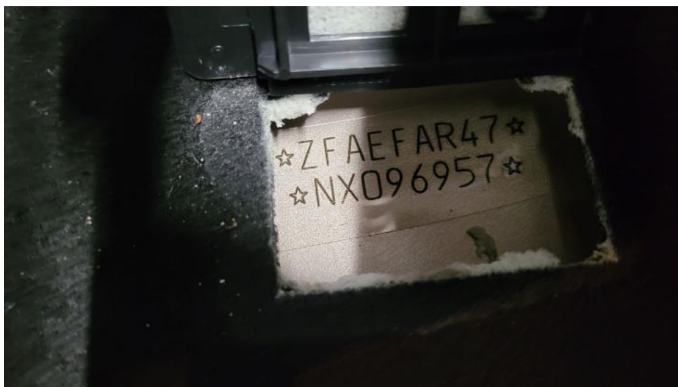
Fot. 21. Numer identyfikacyjny