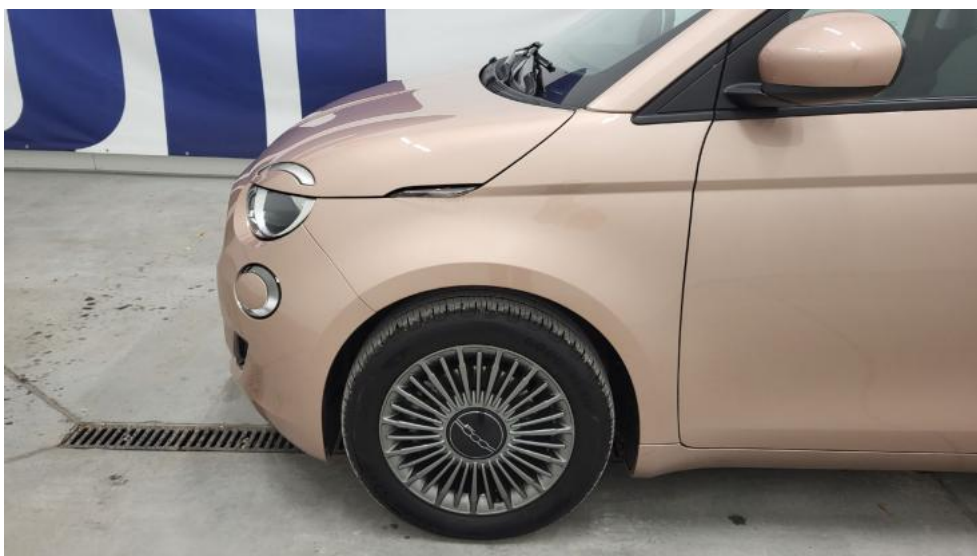
Fot. 10. Bok lewy z przodu