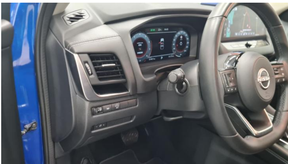
Fot. 26. Kierownica z lewej strony