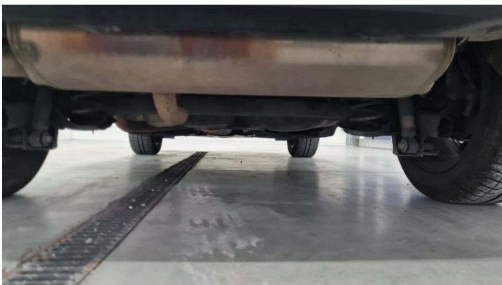
Fot. 14. Spód pojazdu tył