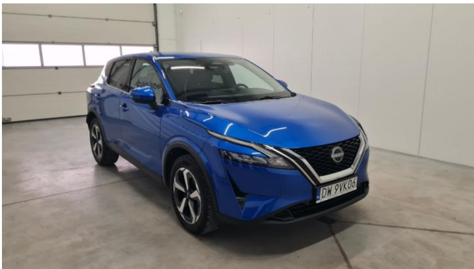
Fot. 3. Przekątna przednia prawa