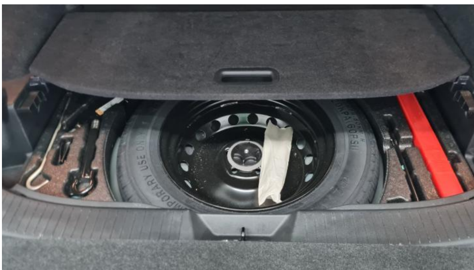
Fot. 20. Koło zapasowe