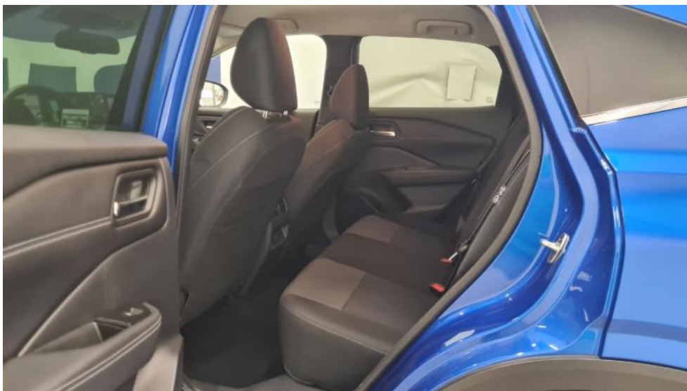
Fot. 27. Widok przez otwarte drzwi tylne lewe