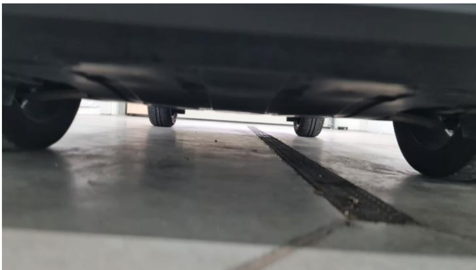
Fot. 13. Spód pojazdu przód