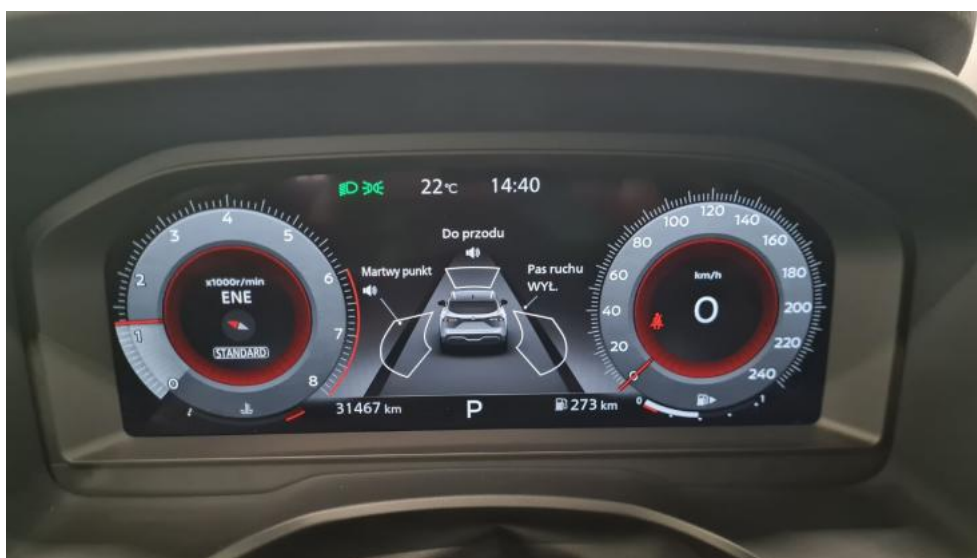
Fot. 24. Zestaw wskaźników - przebieg