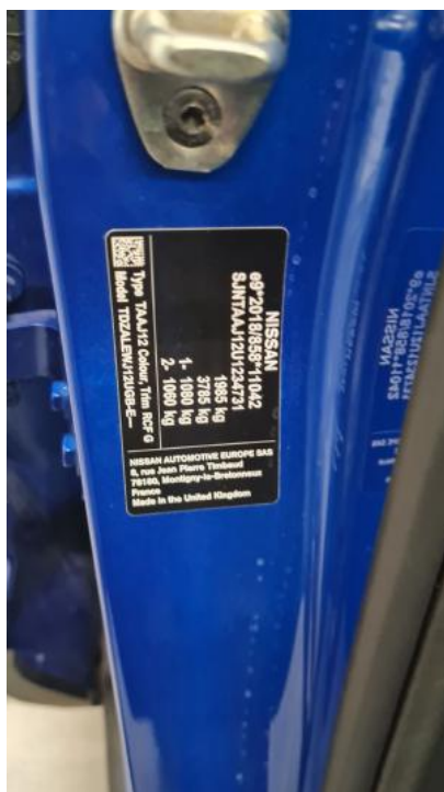
Fot. 23. Tabliczka znamionowa