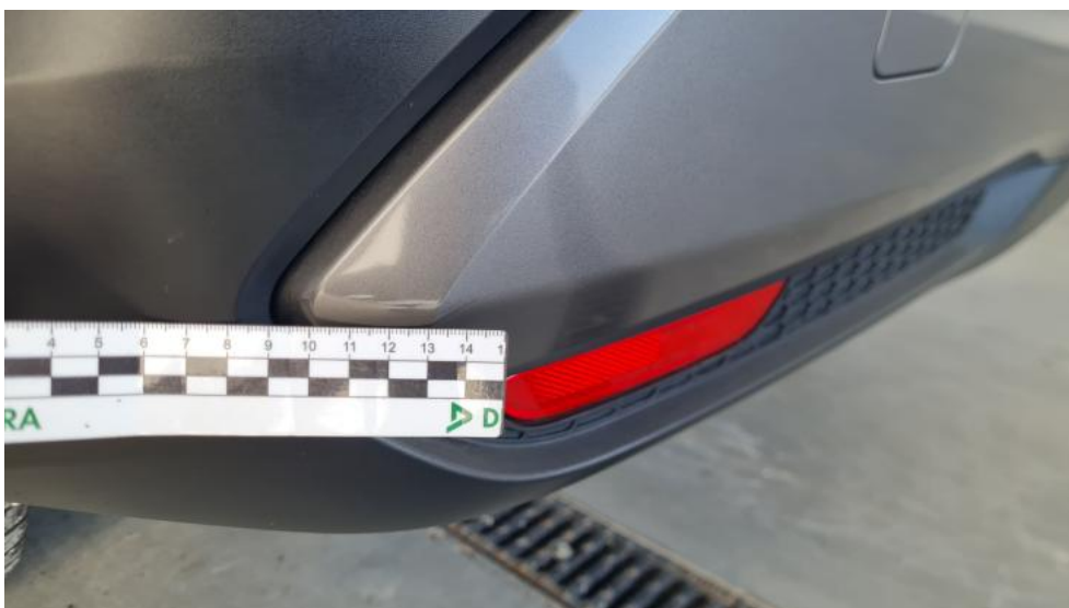
Fot. 36. Spojler zderzaka tylnego - Rysa/odprysk 1