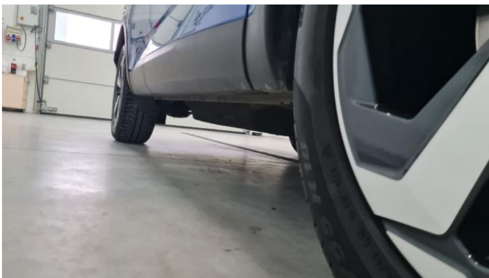
Fot. 12. Próg prawy (widok od przodu)