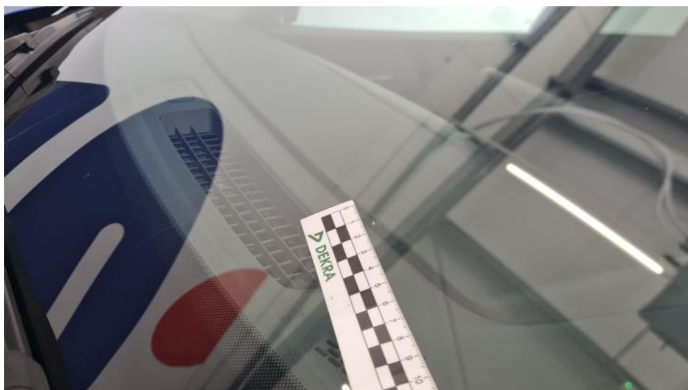
Fot. 34. Szyba czołowa - Rysa/odprysk 1