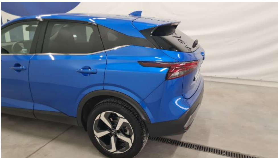
Fot. 9. Bok lewy z tyłu