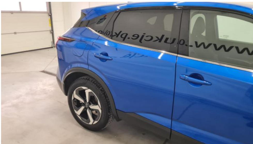
Fot. 5. Bok prawy z tyłu