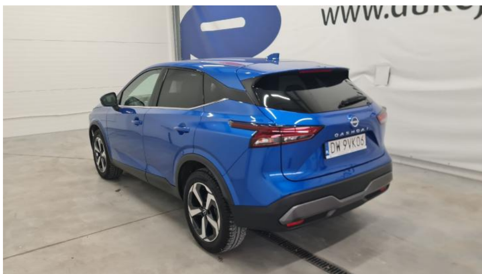
Fot. 8. Przekątna tylna lewa