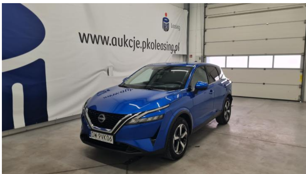
Fot. 1. Przekątna przednia lewa