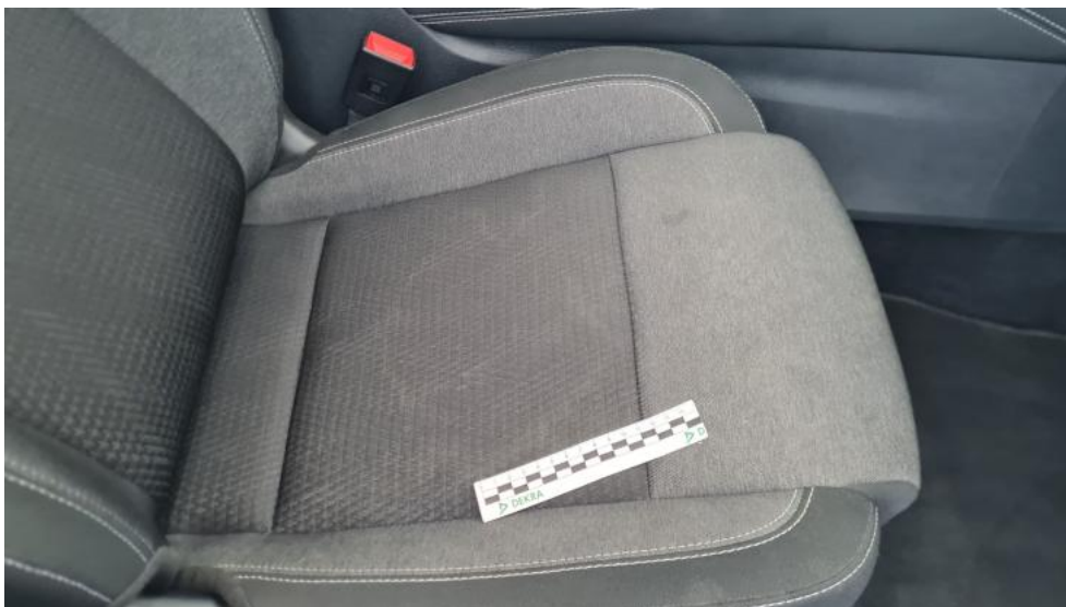
Fot. 41. Fotel prz. praw. - Inne 1