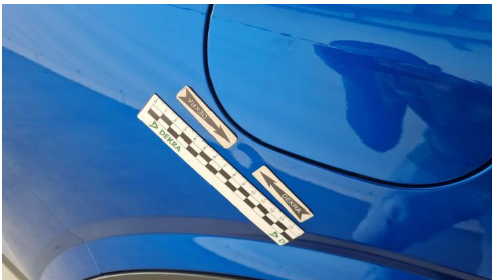
Fot. 35. Błotnik tylny P / Ściana boczna P - Wgniecenie/odkształcenie 1