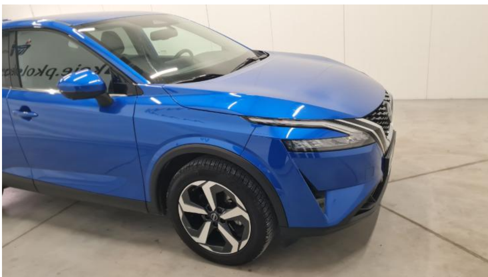
Fot. 4. Bok prawy z przodu