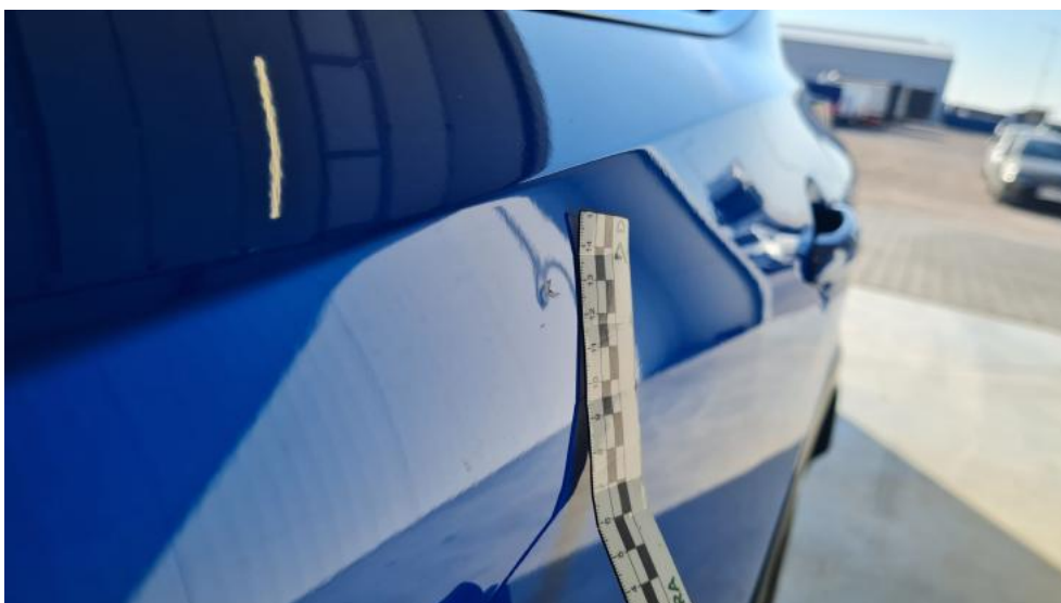
Fot. 40. Drzwi tylne L - Wgniecenie/odkształcenie 1