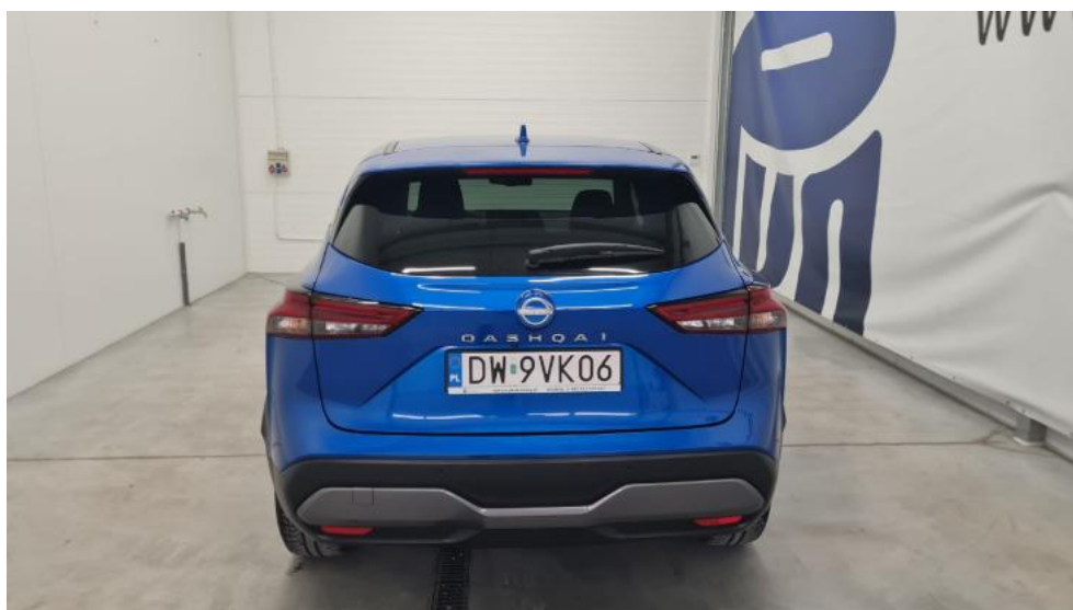
Fot. 7. Tył