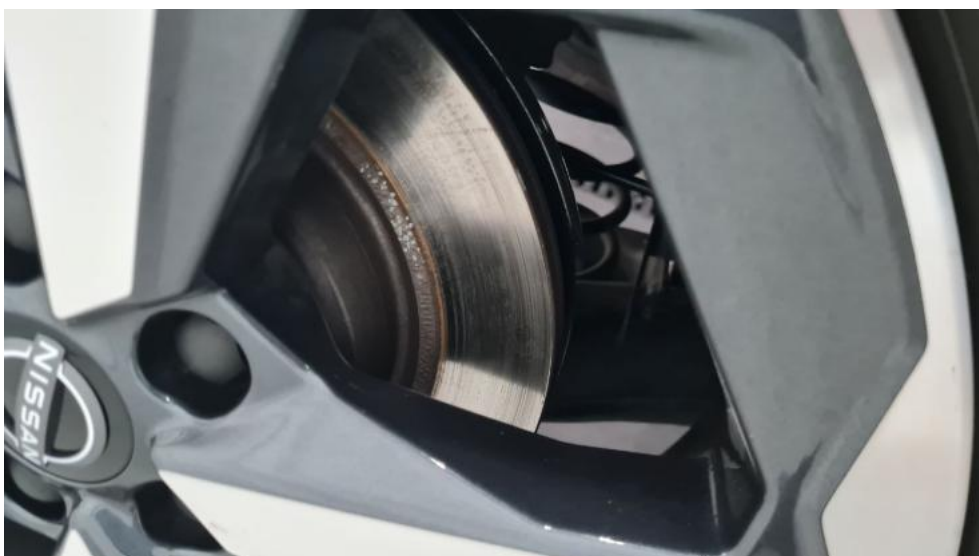
Fot. 16. Tarcza hamulcowa tylna prawa