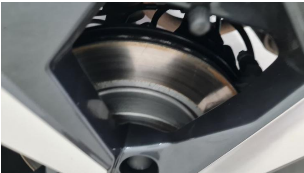
Fot. 17. Tarcza hamulcowa tylna lewa