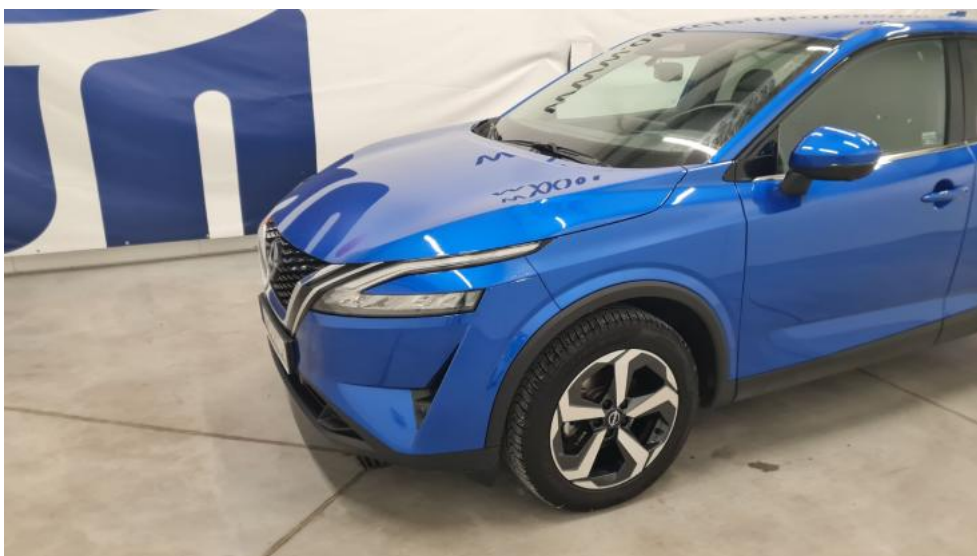
Fot. 10. Bok lewy z przodu