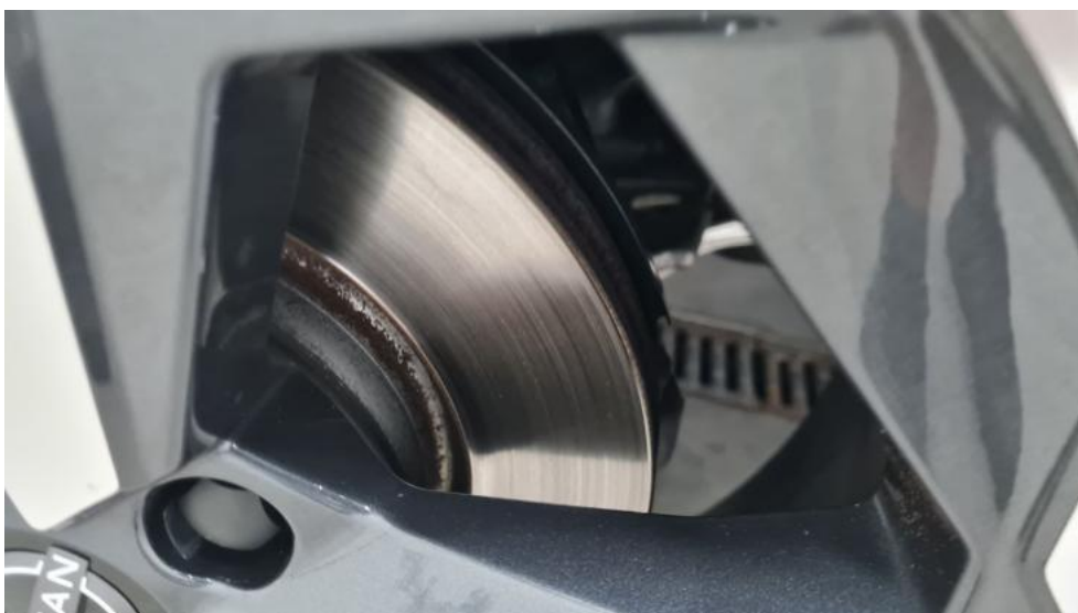
Fot. 18. Tarcza hamulcowa przednia lewa