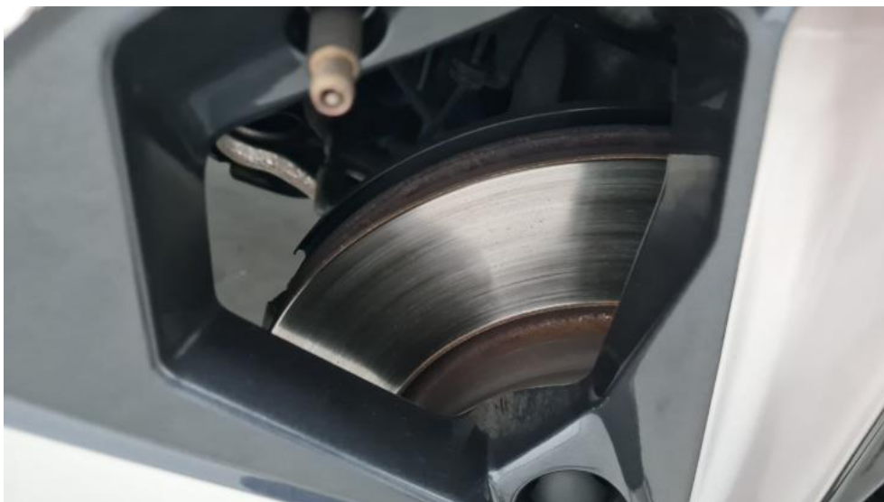
Fot. 15. Tarcza hamulcowa przednia prawa