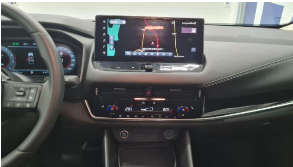
Fot. 29. Konsola środkowa