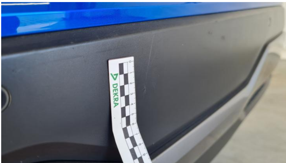
Fot. 37. Spojler zderzaka tylnego - Rysa/odprysk 2