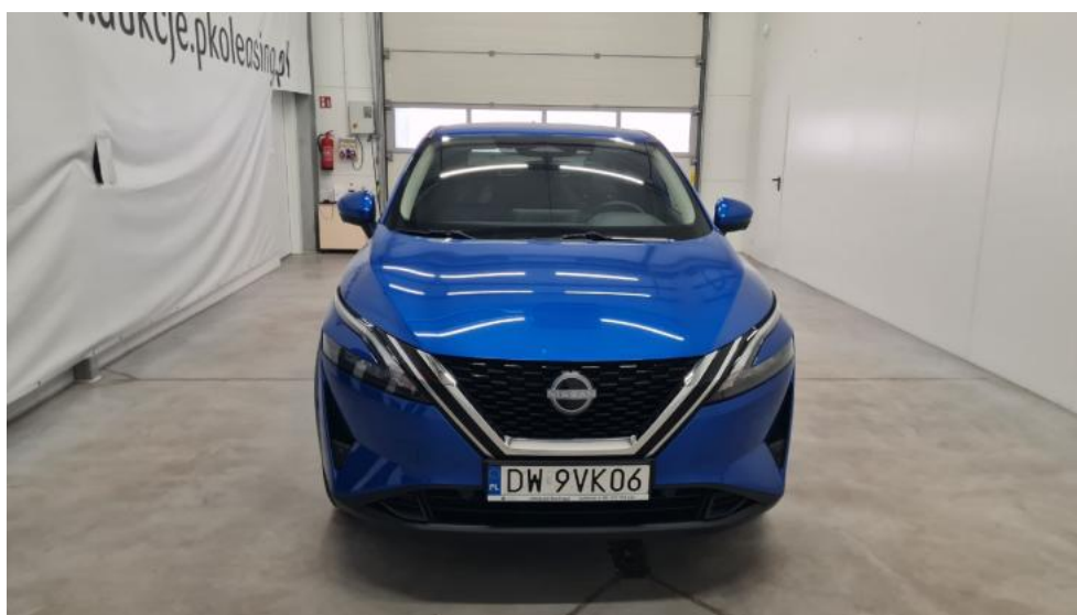
Fot. 2. Przód