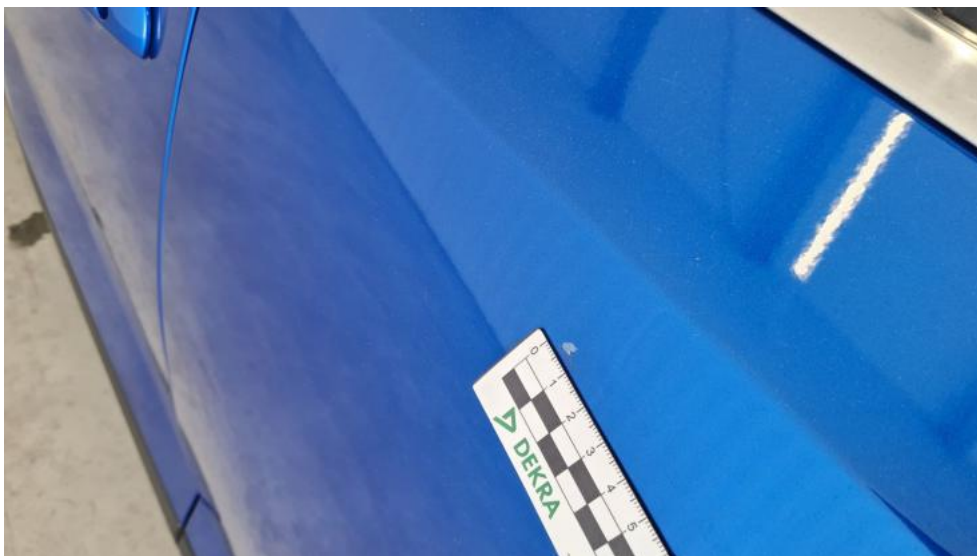
Fot. 39. Drzwi tylne L - Rysa/odprysk 1