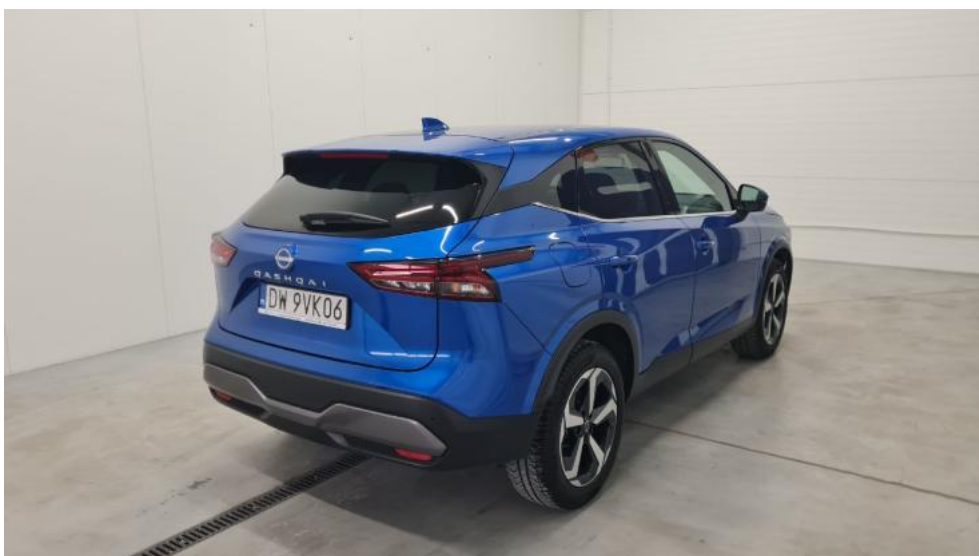
Fot. 6. Przekątna tylna prawa