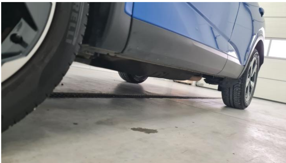
Fot. 11. Próg lewy (widok od przodu)