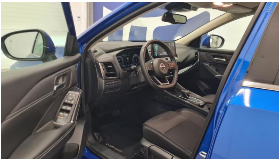
Fot. 25. Widok przez otwarte drzwi przednie lewe