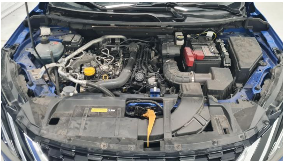
Fot. 21. Komora silnika