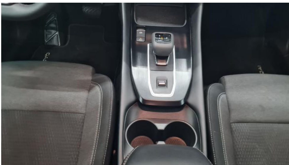
Fot. 30. Tunel środkowy