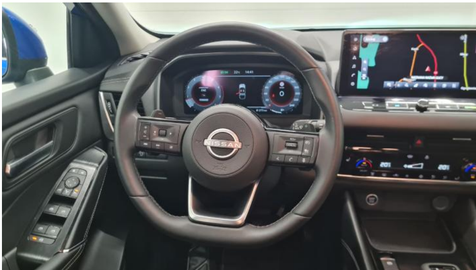
Fot. 31. Kierownica (na wprost)