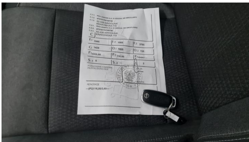
Fot. 33. Dow. Rej. tym. Str.2 i klucze