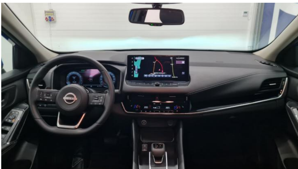
Fot. 28. Widok z tylnej kanapy na deskę rozdź.