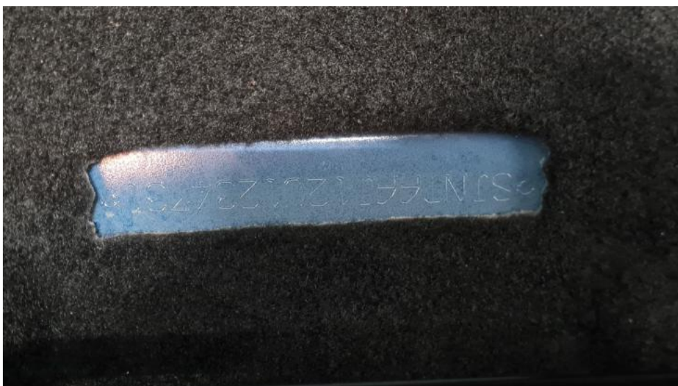
Fot. 22. Numer identyfikacyjny