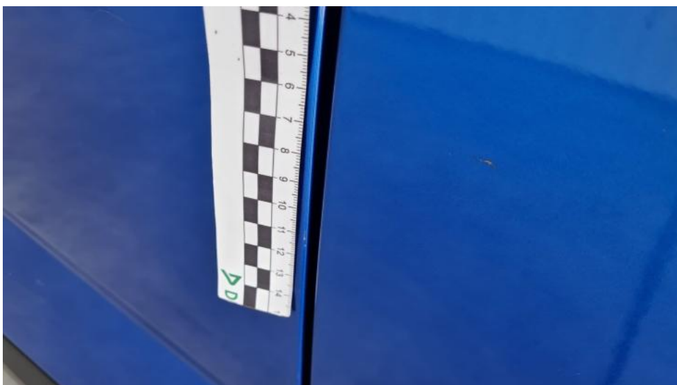
Fot. 38. Drzwi przed L - Rysa/odprysk 1