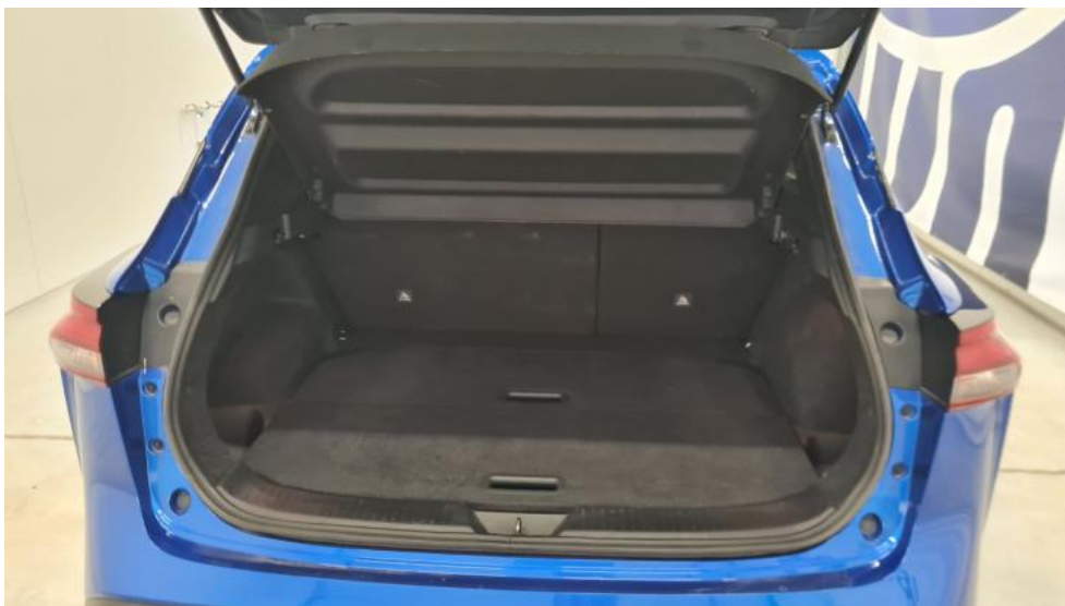
Fot. 19. Bagażnik