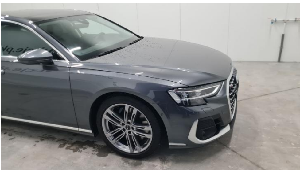
Fot. 4. Bok prawy z przodu