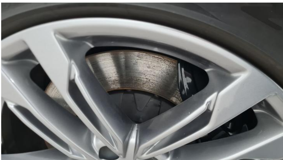
Fot. 18. Tarcza hamulcowa przednia lewa