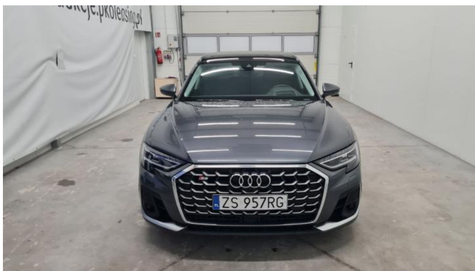
Fot. 2. Przód