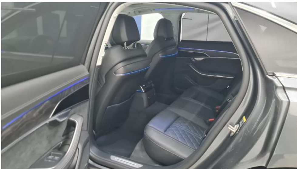
Fot. 27. Widok przez otwarte drzwi tylne lewe