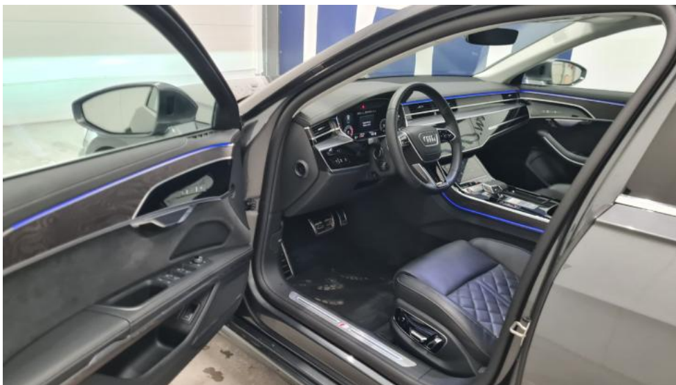
Fot. 25. Widok przez otwarte drzwi przednie lewe