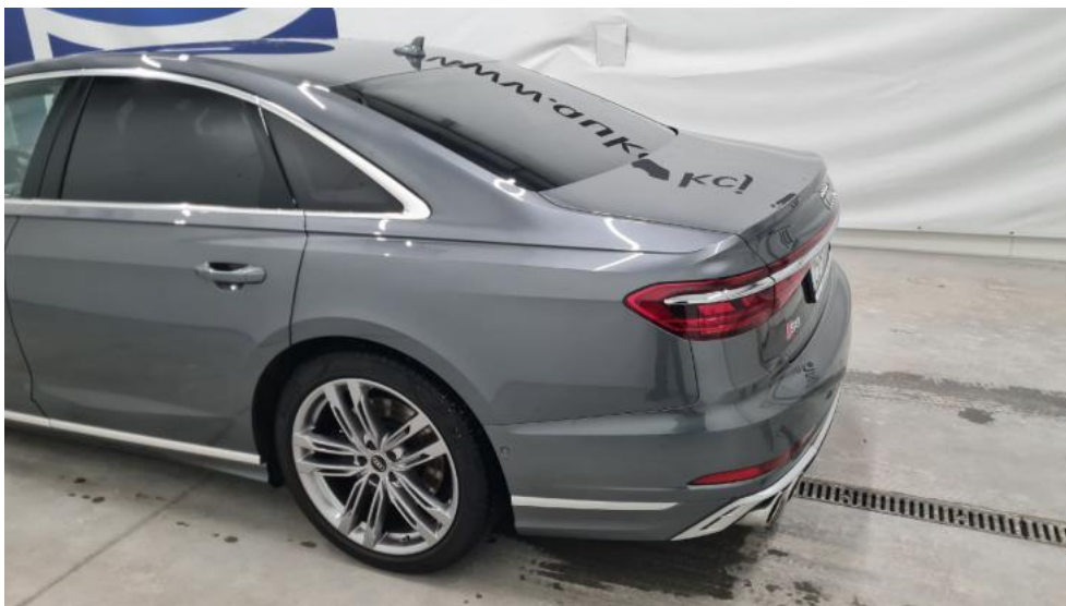
Fot. 9. Bok lewy z tyłu