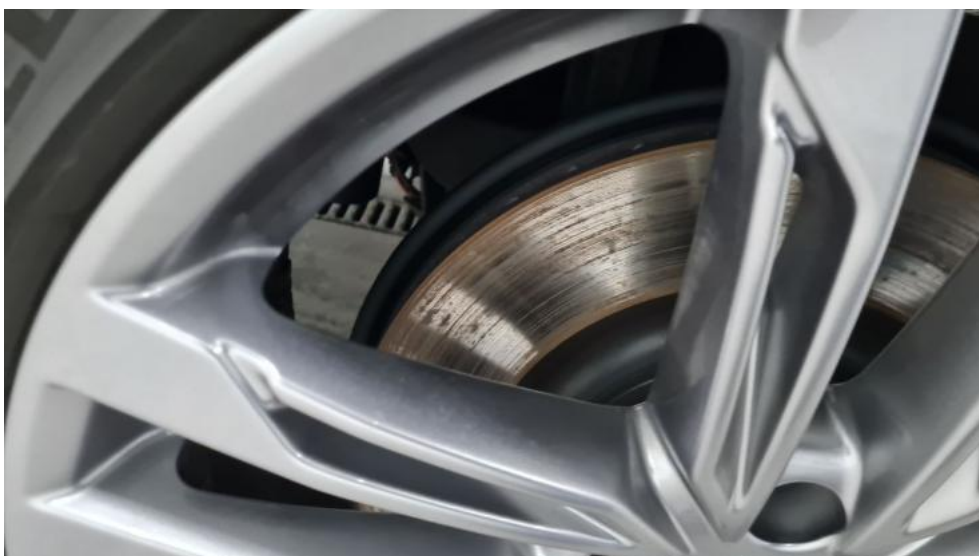
Fot. 16. Tarcza hamulcowa tylna prawa