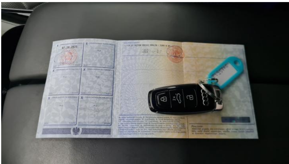
Fot. 33. Dow. Rej. Str.2 i klucze