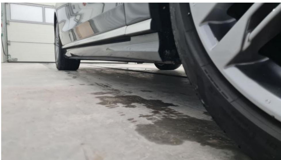
Fot. 12. Próg prawy (widok od przodu)