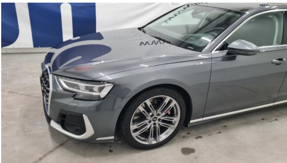
Fot. 10. Bok lewy z przodu