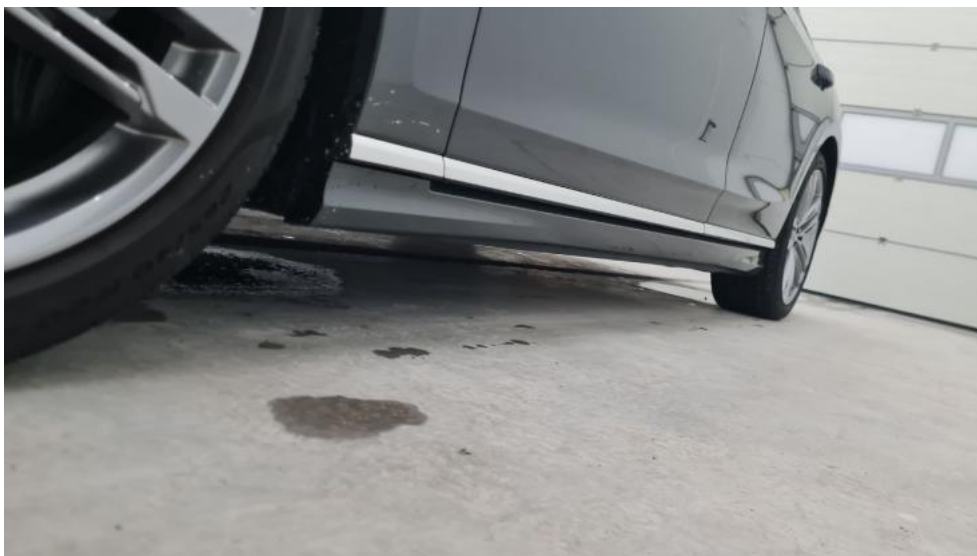
Fot. 11. Próg lewy (widok od przodu)