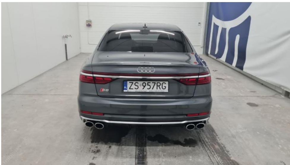
Fot. 7. Tył