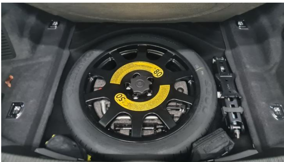
Fot. 20. Koło zapasowe