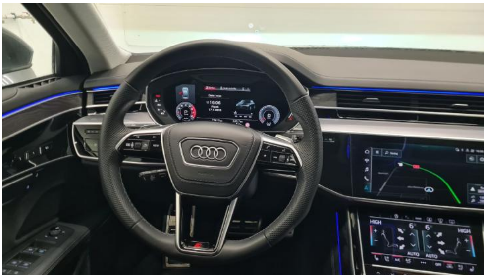
Fot. 31. Kierownica (na wprost)