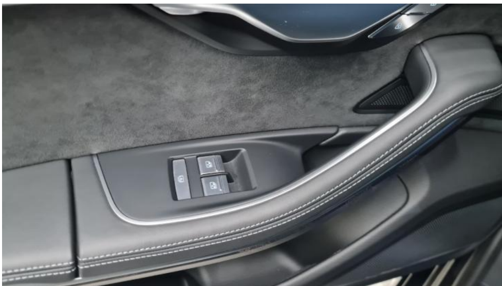
Fot. 35. Zdjęcie do protokołu