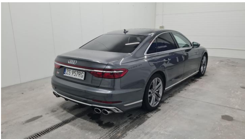
Fot. 6. Przekątna tylna prawa