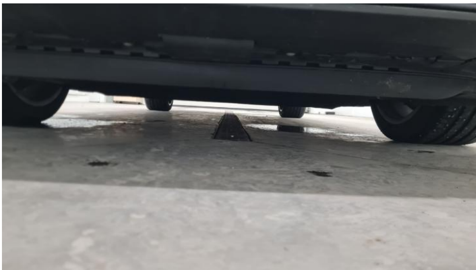
Fot. 13. Spód pojazdu przód