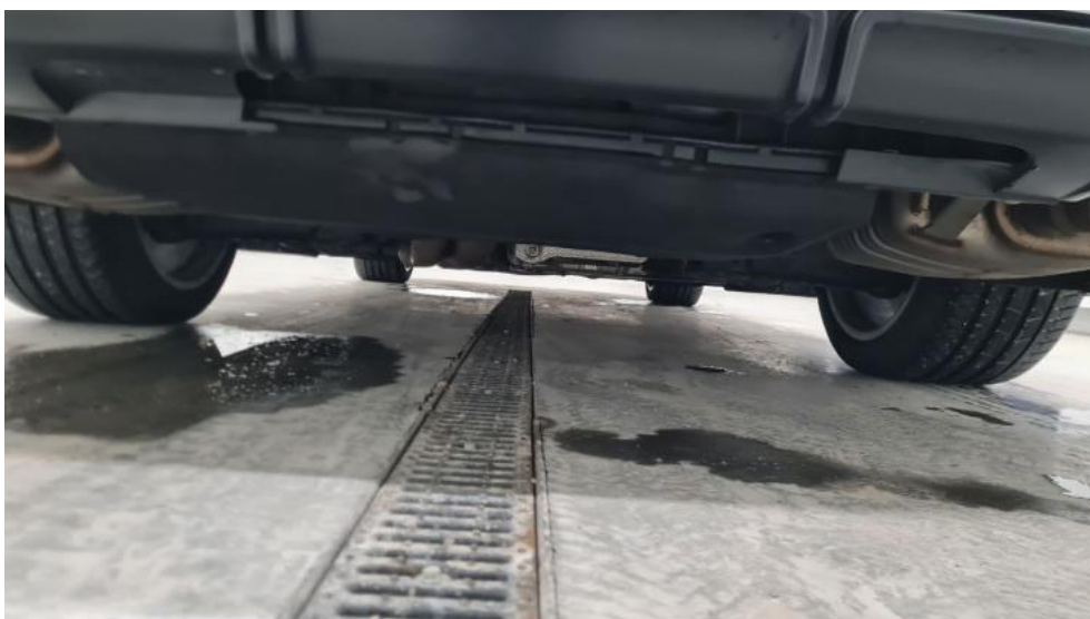
Fot. 14. Spód pojazdu tył