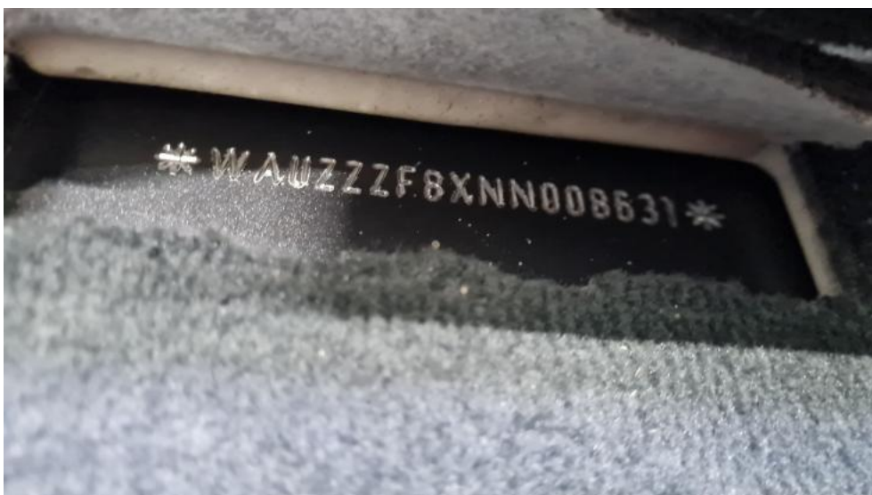
Fot. 22. Numer identyfikacyjny