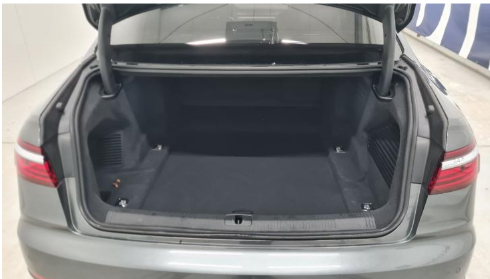
Fot. 19. Bagażnik