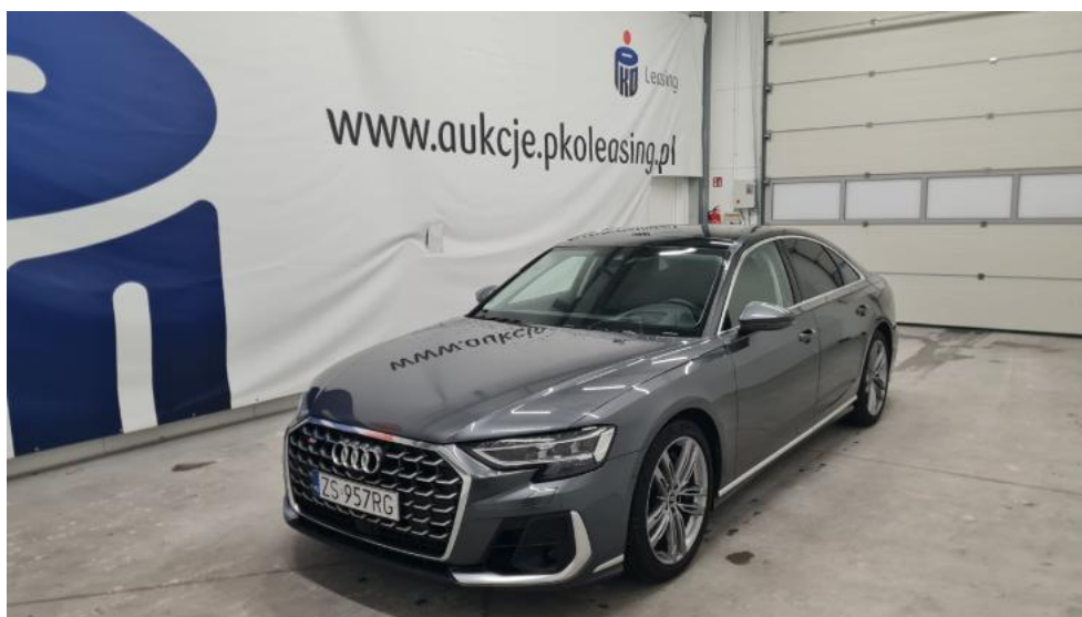
Fot. 1. Przekątna przednia lewa