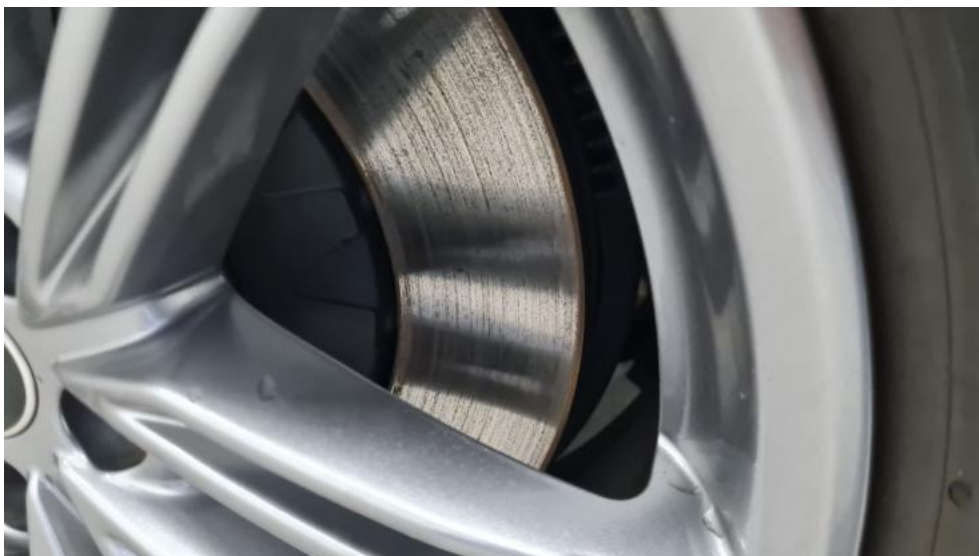
Fot. 15. Tarcza hamulcowa przednia prawa