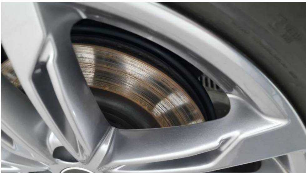
Fot. 17. Tarcza hamulcowa tylna lewa