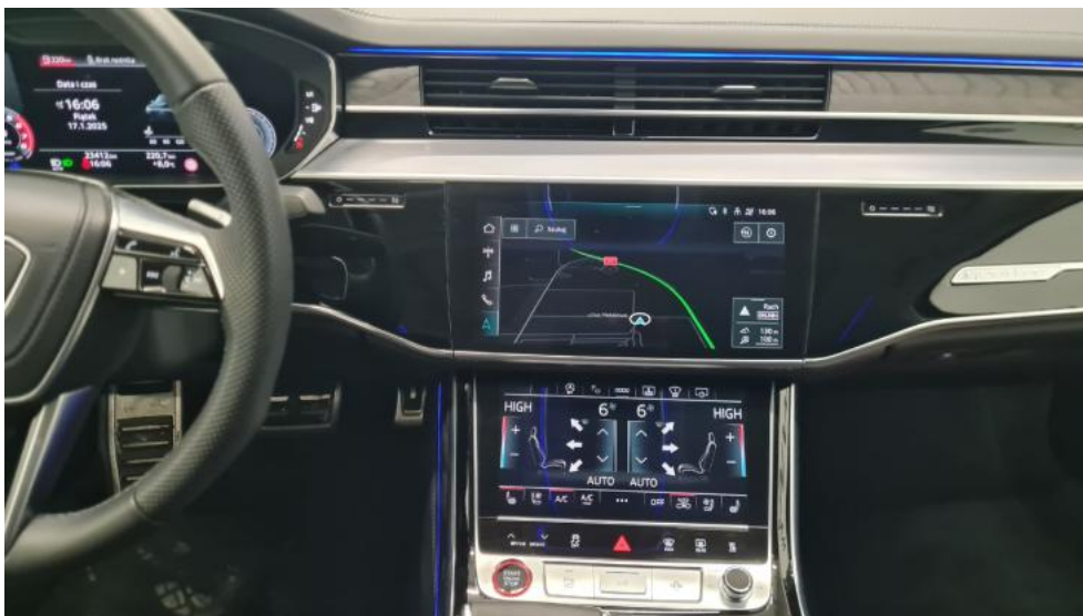
Fot. 29. Konsola środkowa