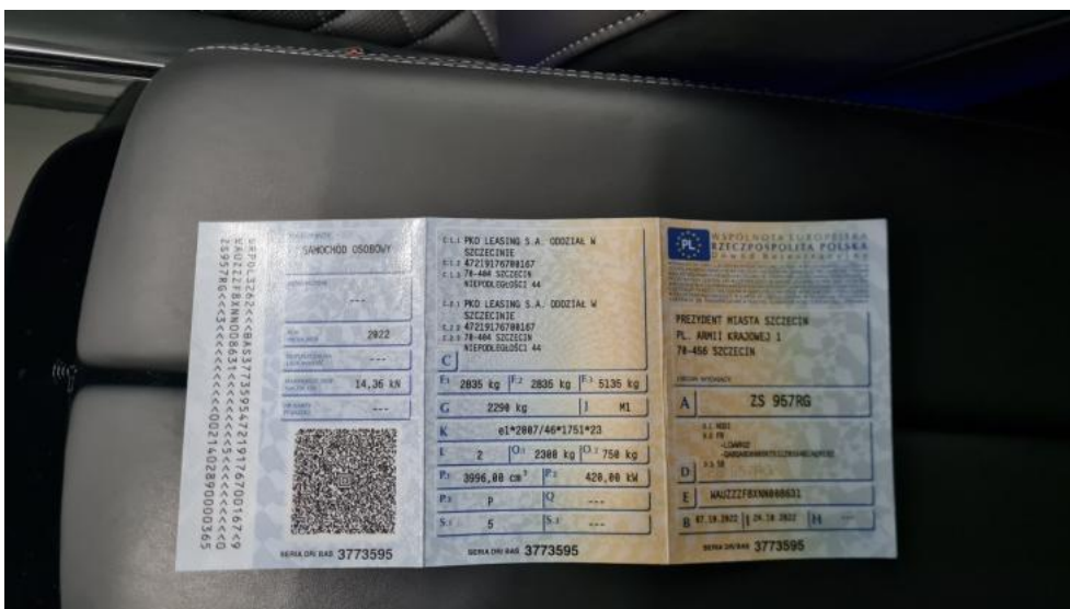
Fot. 32. Dowód rej. Str. 1