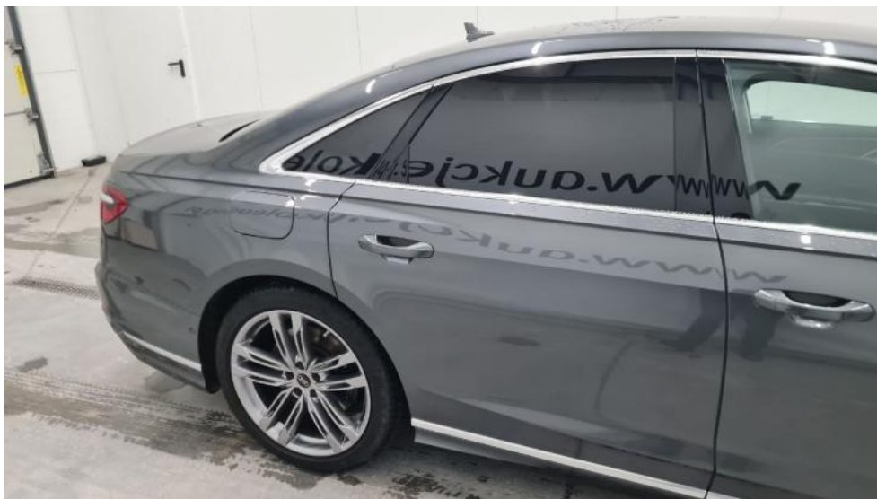
Fot. 5. Bok prawy z tyłu