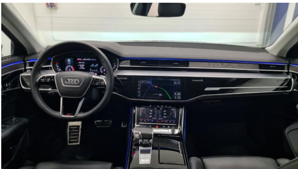
Fot. 28. Widok z tylnej kanapy na deskę rozdź.