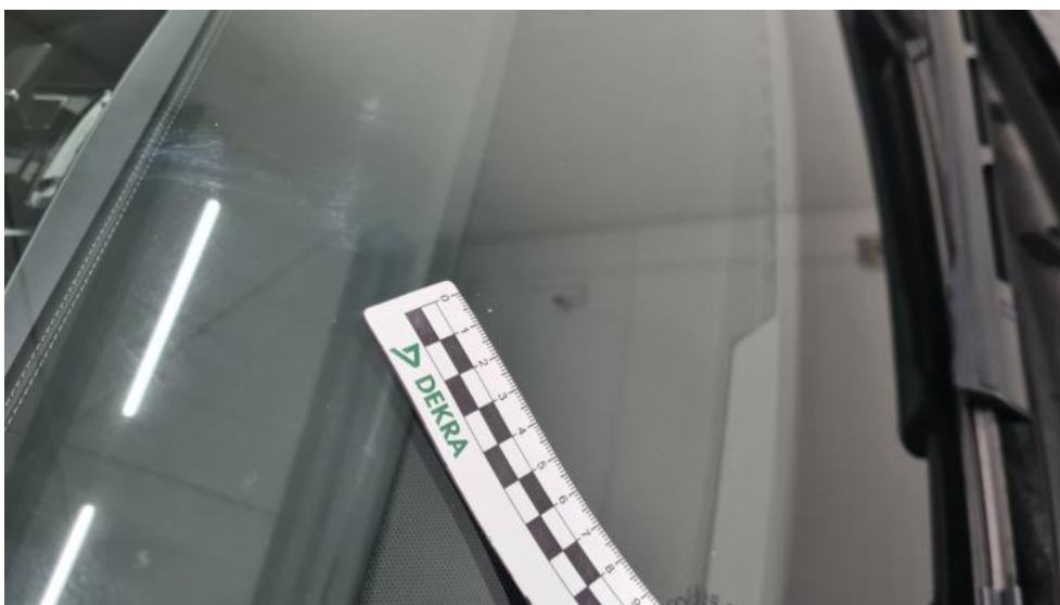
Fot. 36. Szyba czołowa - Rysa/odprysk 1