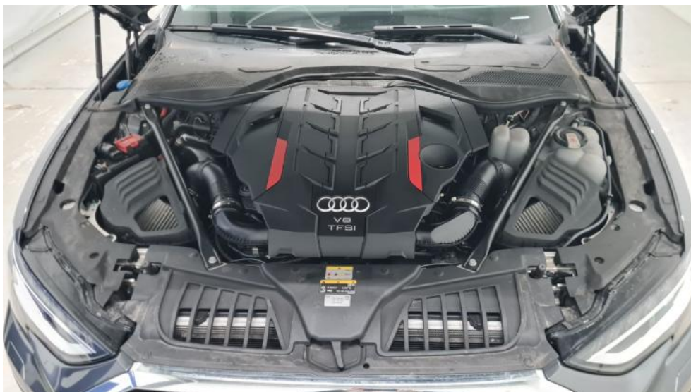
Fot. 21. Komora silnika