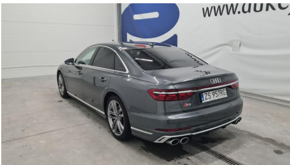
Fot. 8. Przekątna tylna lewa