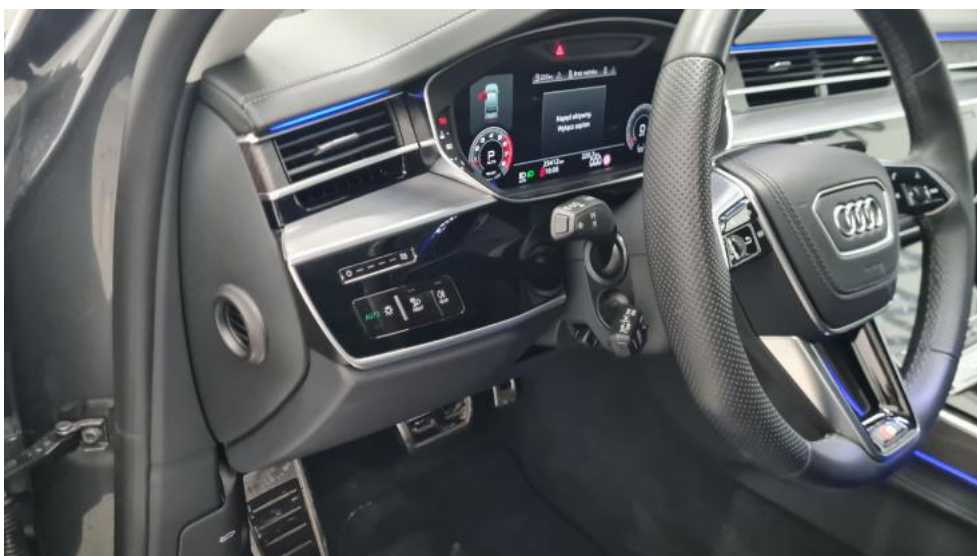
Fot. 26. Kierownica z lewej strony