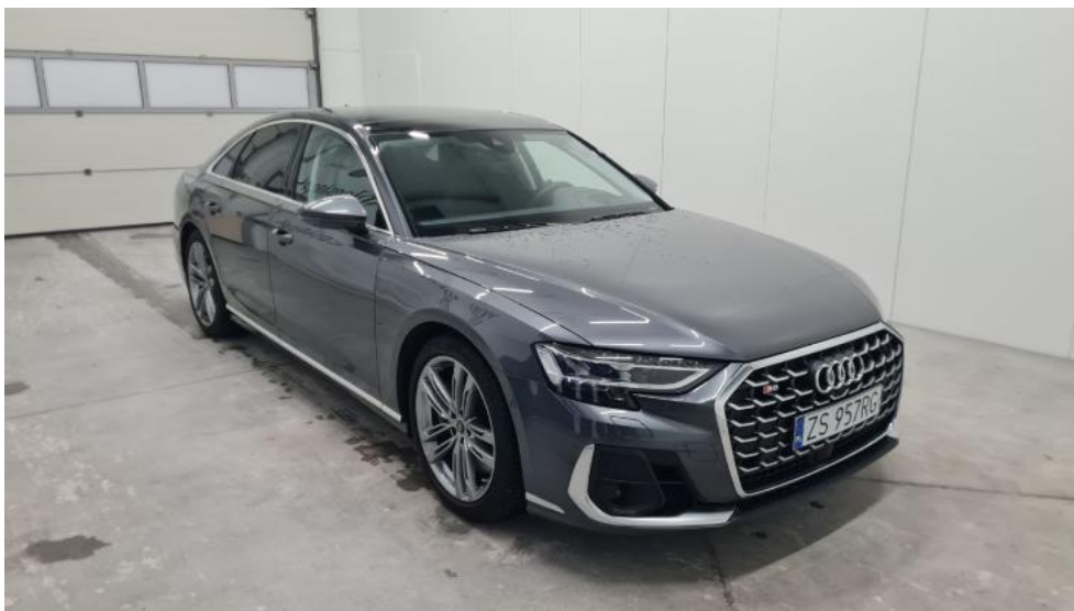
Fot. 3. Przekątna przednia prawa