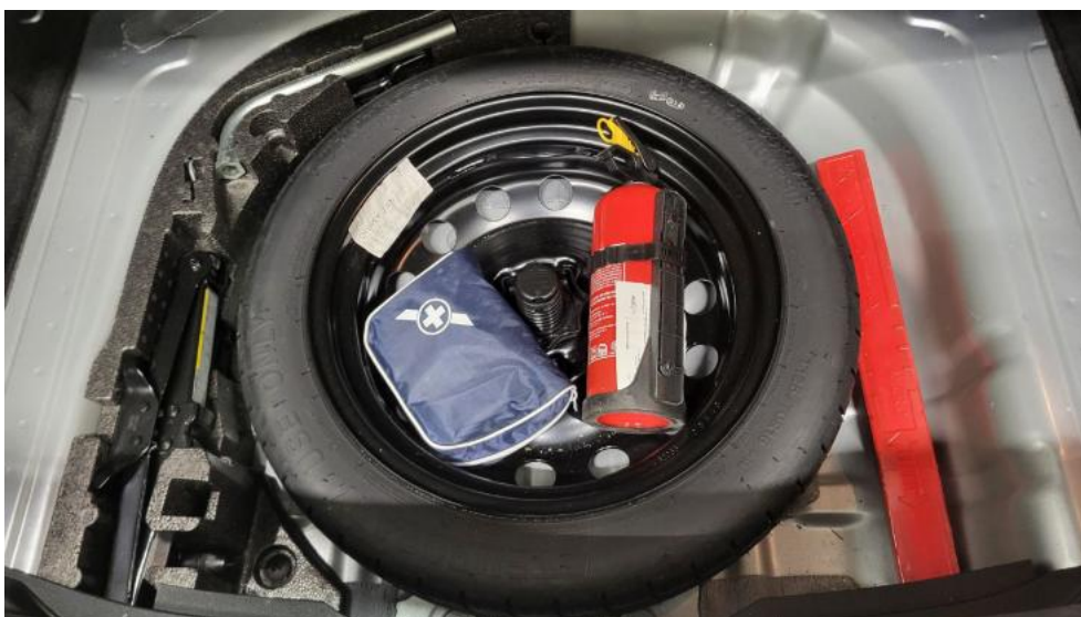
Fot. 20. Koło zapasowe