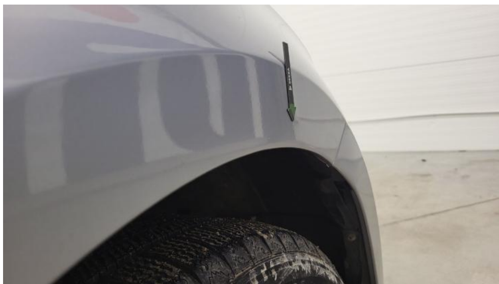
Fot. 48. Błotnik przedni P - Wgniecenie/odkształcenie 1