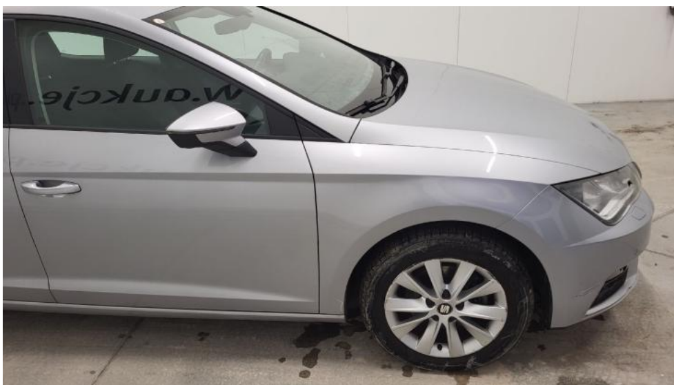
Fot. 4. Bok prawy z przodu