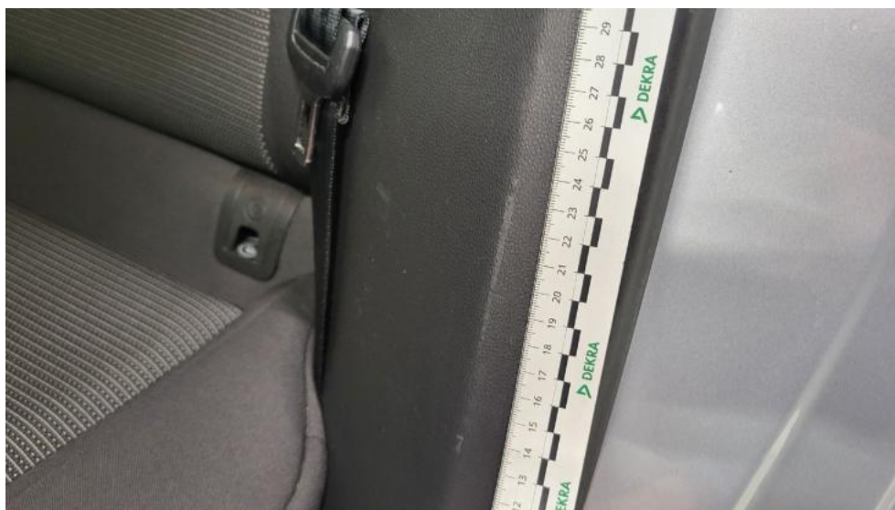
Fot. 76. Wykładzina(y) słupka tylnego L - Rysa/odprysk 1