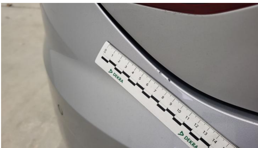
Fot. 62. Zderzak tylny() - Rysa/odprysk 3