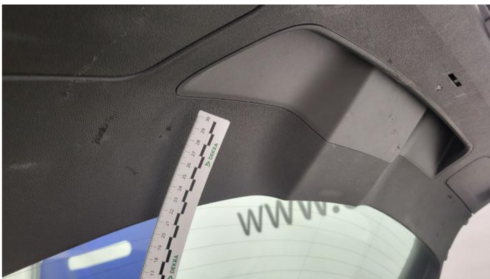
Fot. 78. Wykładzina pokrywy tylnej - Rysa/odprysk 1