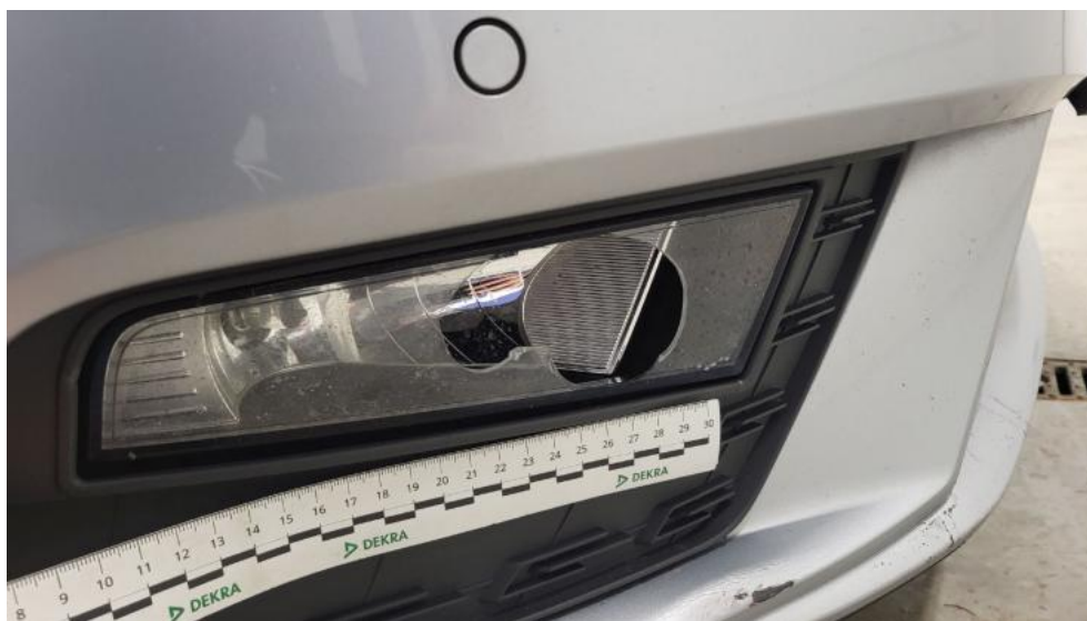
Fot. 51. Reflektor przeciwmgli P - Pęknięcie/rozerwanie 1