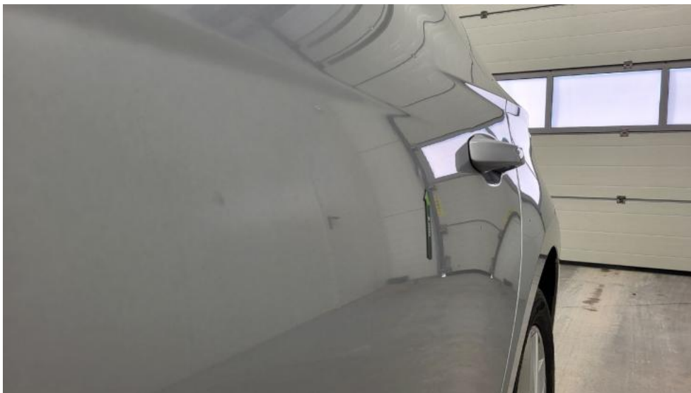
Fot. 69. Drzwi tylne L - Wgniecenie/odkształcenie 1