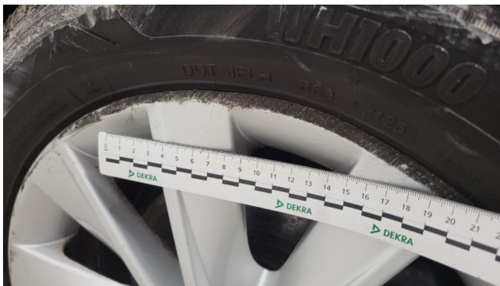
Fot. 49. Felga aluminiowa przednia P - Rysa/odprysk 1