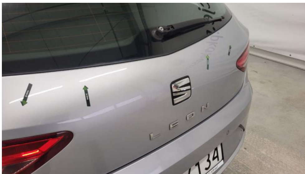
Fot. 59. Pokrywy bagażnika - Wgniecenie/odkształcenie 1