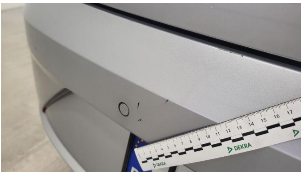
Fot. 61. Zderzak tylny - Rysa/odprysk 2