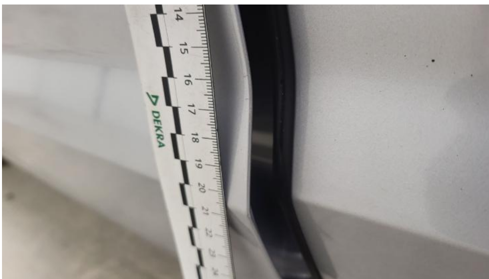
Fot. 68. Drzwi przed L - Rysa/odprysk 2