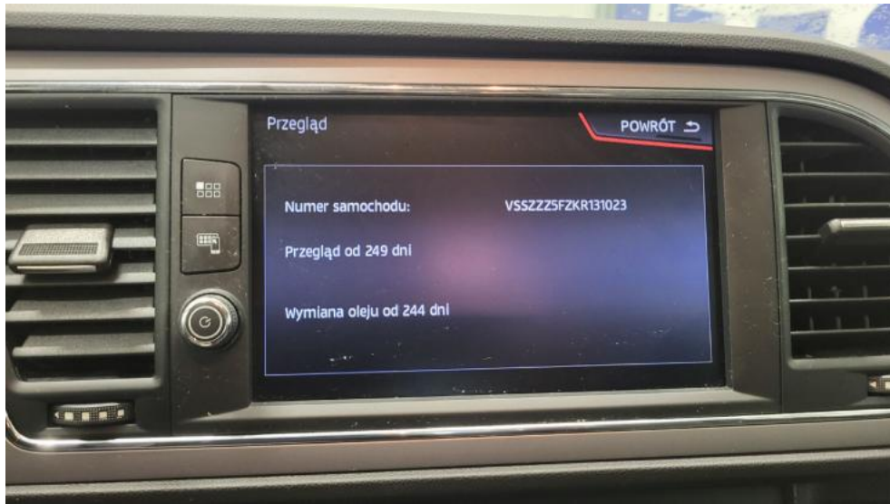
Fot. 33. Książka serwisowa – ostatni przegląd