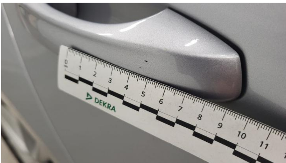
Fot. 53. Klamka drzwi tyl P - Rysa/odprysk 1