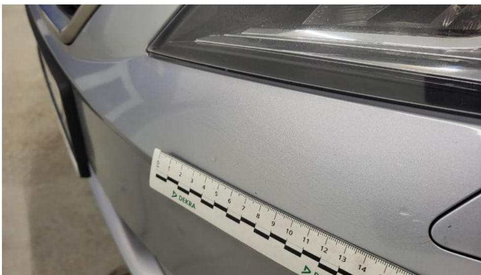
Fot. 46. Zderzak - Pęknięcie/rozerwanie 1