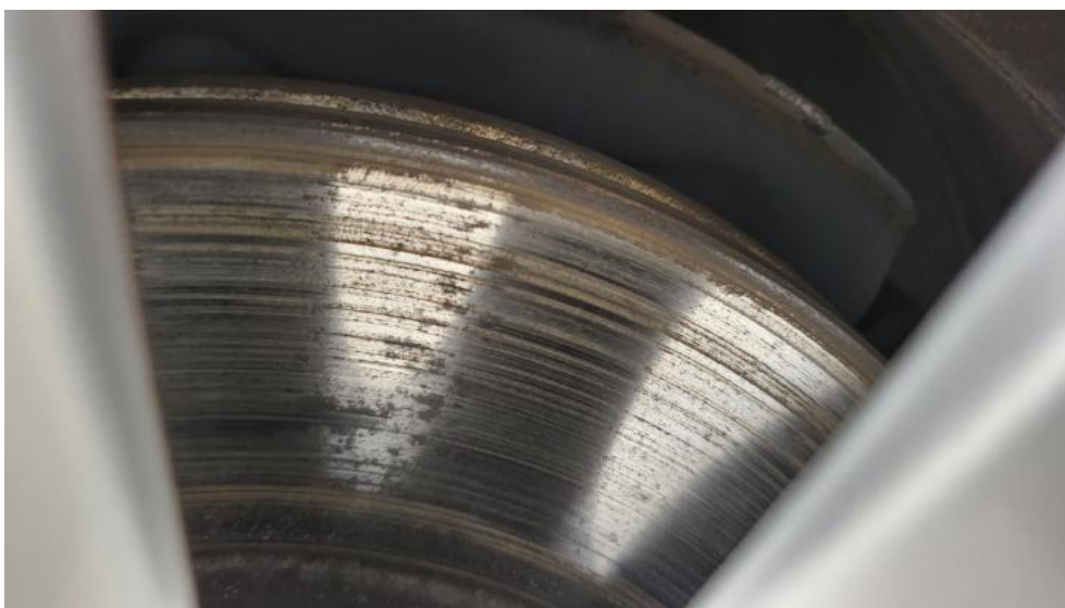
Fot. 15. Tarcza hamulcowa przednia prawa