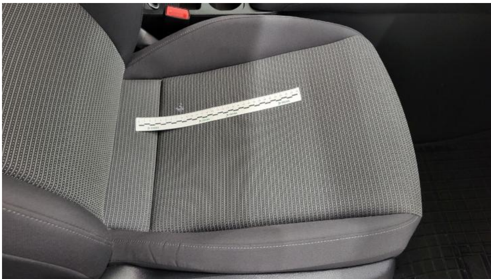
Fot. 73. Fotel prz. praw. - Inne 1