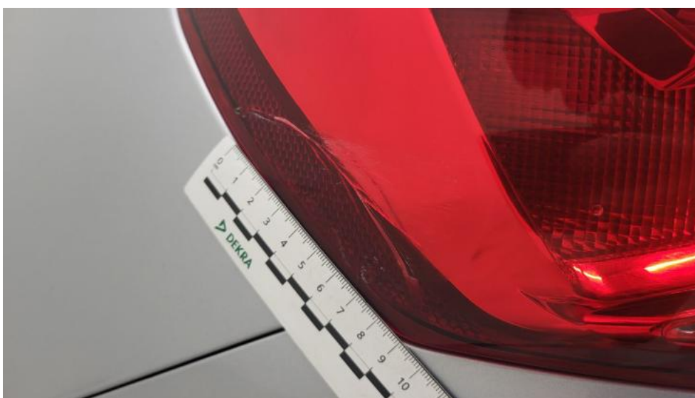
Fot. 66. Lampa tylna zew L - Pęknięcie/rozerwanie 1