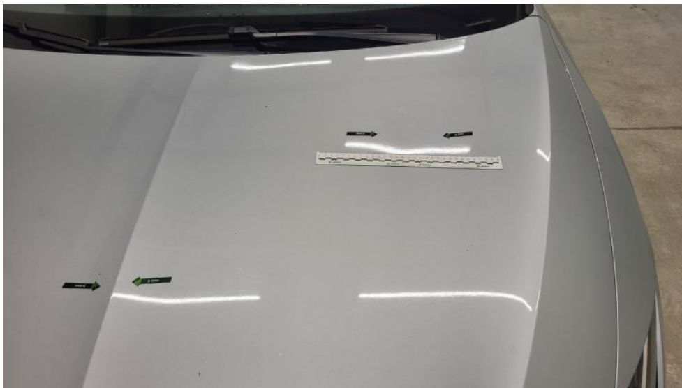
Fot. 41. Pokrywa komory silnika - Wgniecenie/odkształcenie 1