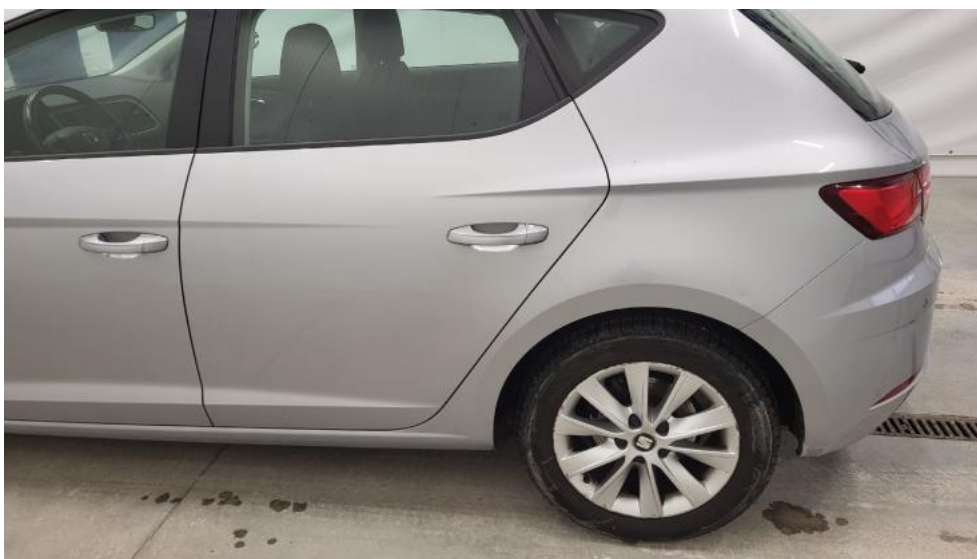
Fot. 9. Bok lewy z tyłu