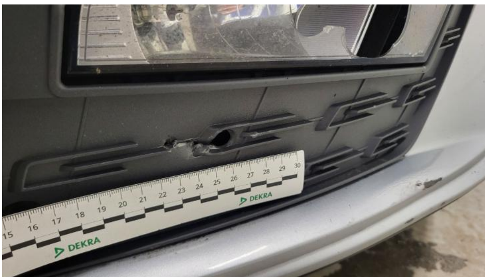
Fot. 38. Kratka/zaślepka halogenu P - Pęknięcie/rozerwanie 1