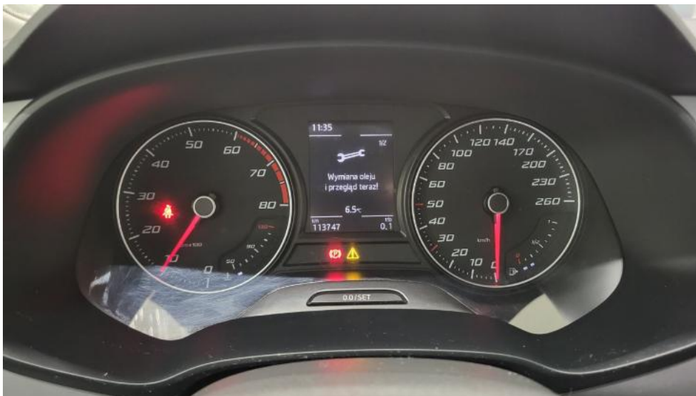
Fot. 37. Zdjęcie do protokołu