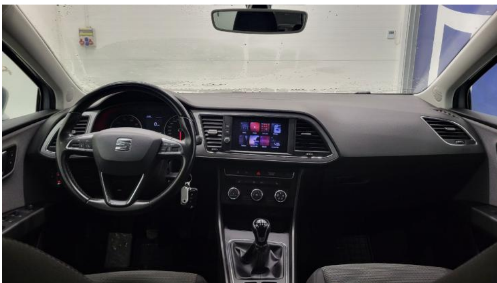
Fot. 28. Widok z tylnej kanapy na deskę rozdz.