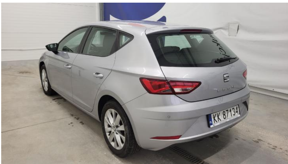
Fot. 8. Przekątna tylna lewa