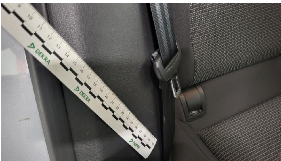
Fot. 77. Wykładzina(y) słupka tylnego P - Rysa/odprysk 1