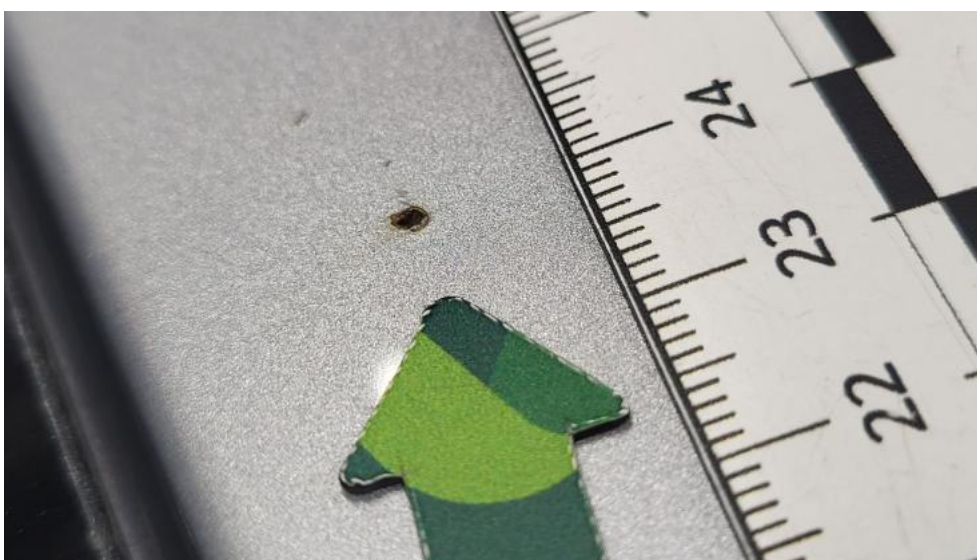
Fot. 64. Dach - Inne 1