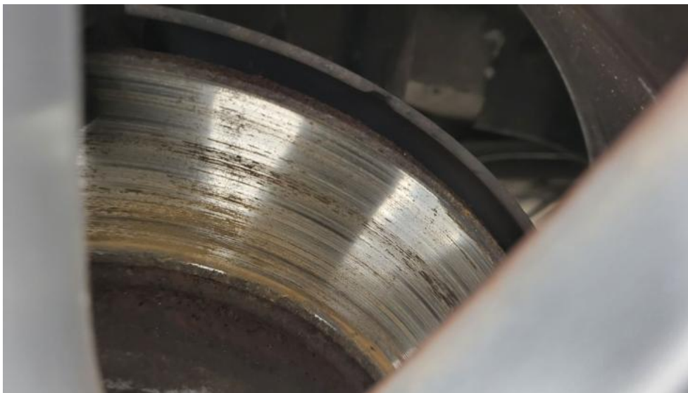
Fot. 17. Tarcza hamulcowa tylna lewa