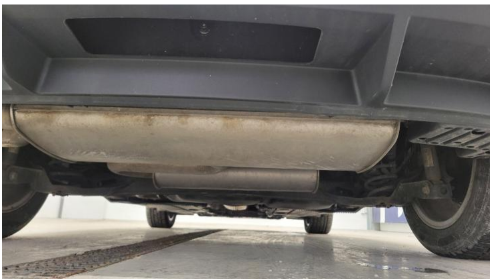
Fot. 14. Spód pojazdu tył