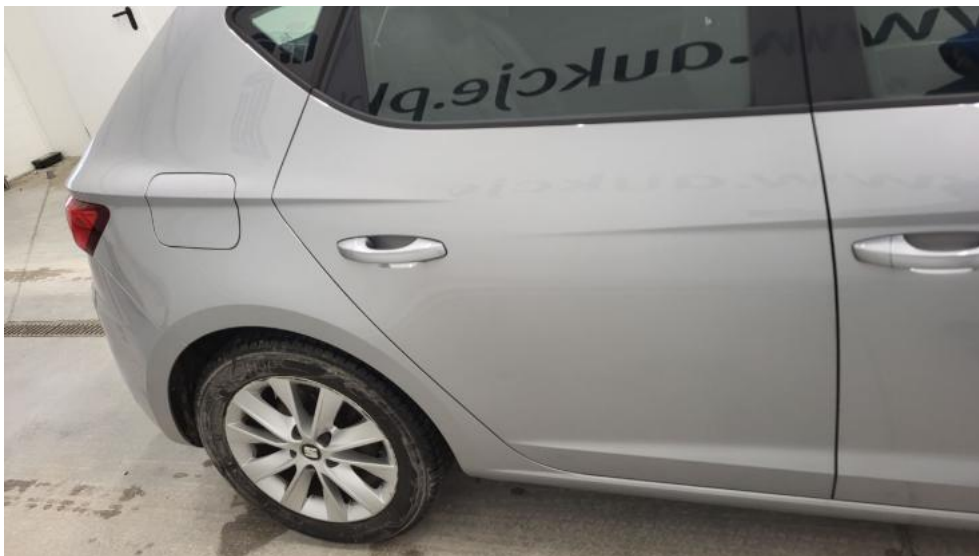
Fot. 5. Bok prawy z tyłu