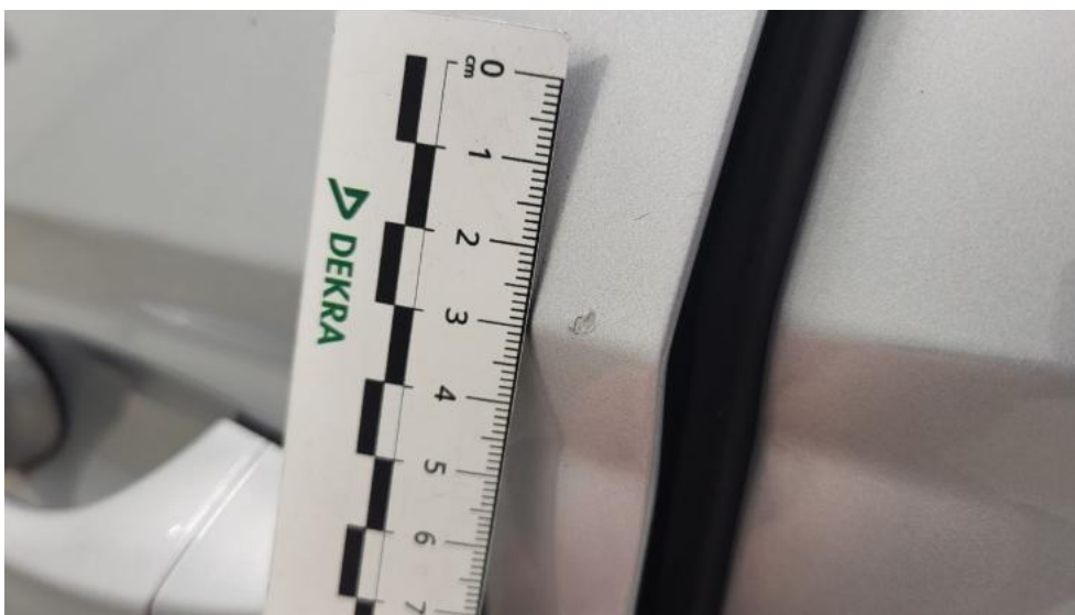
Fot. 67. Drzwi przed L - Rysa/odprysk 1