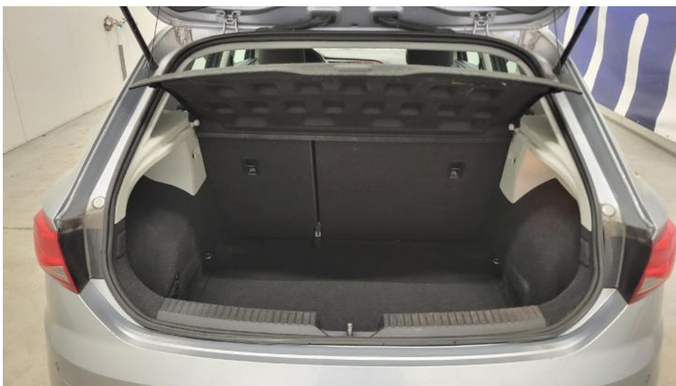
Fot. 19. Bagażnik