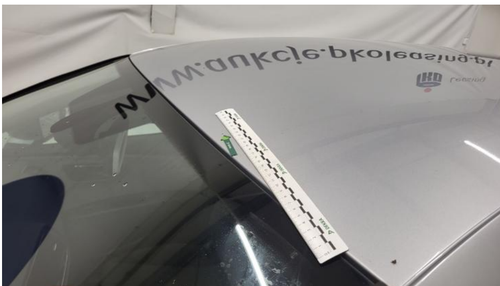
Fot. 63. Dach - zdjęcie poglądowe 1