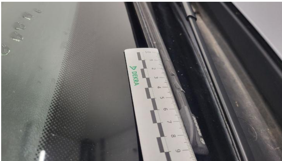
Fot. 39. Pióro wycieraczki szyby prz L - Pęknięcie/rozerwanie 1