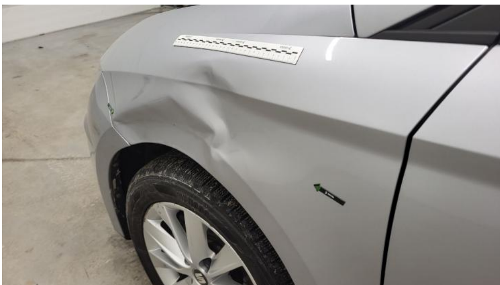
Fot. 70. Błotnik przedni L - Wgniecenie/odkształcenie 1