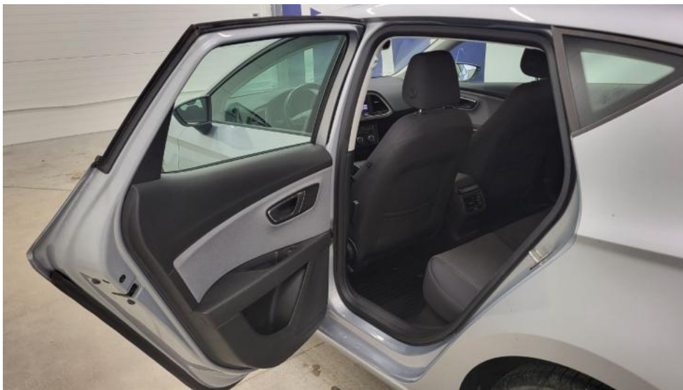
Fot. 27. Widok przez otwarte drzwi tylne lewe