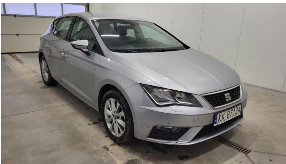
Fot. 3. Przekątna przednia prawa