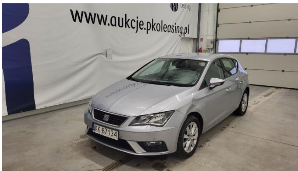
Fot. 1. Przekątna przednia lewa