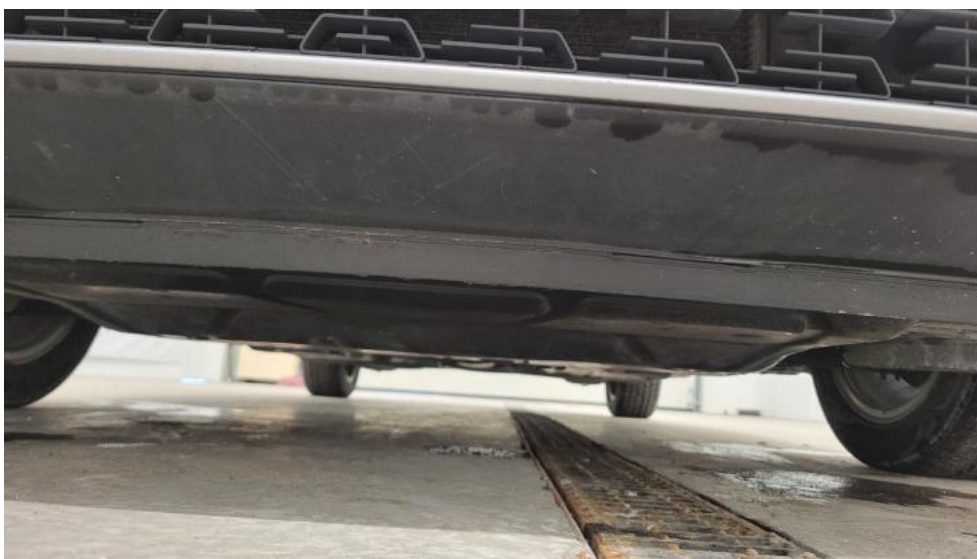
Fot. 13. Spód pojazdu przód