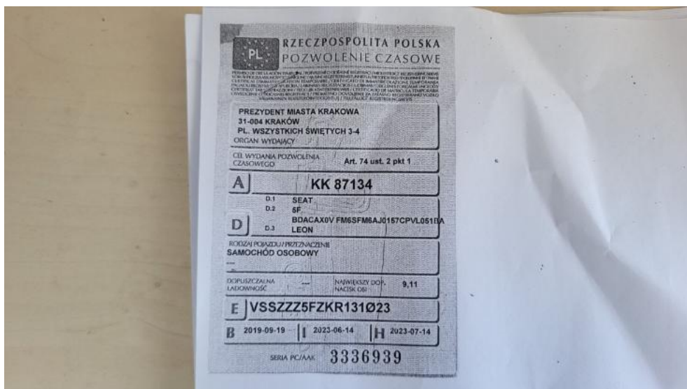
Fot. 34. Dow. rej. ksero Str. 1