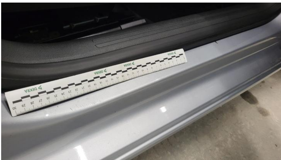
Fot. 54. Próg P - Rysa/odprysk 1