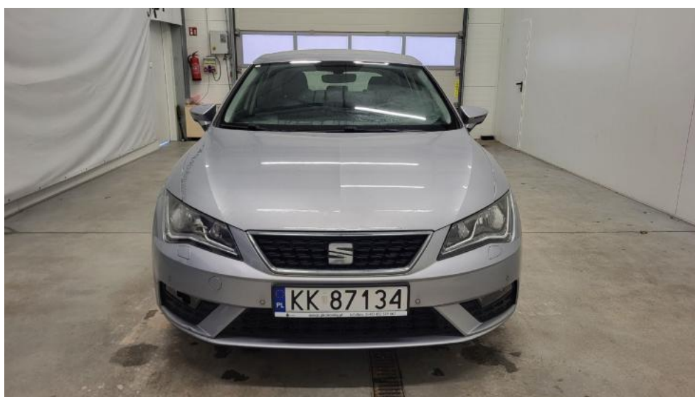
Fot. 2. Przód