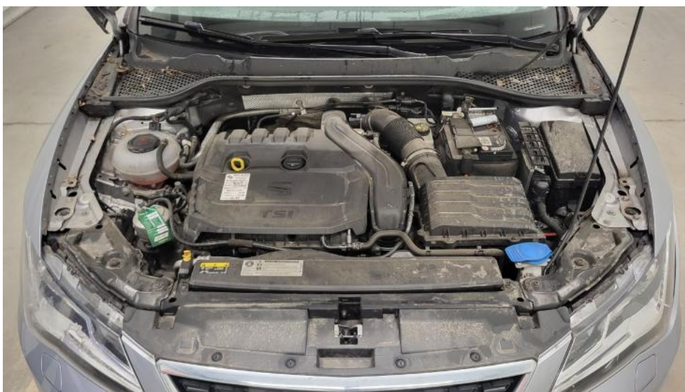
Fot. 21. Komora silnika