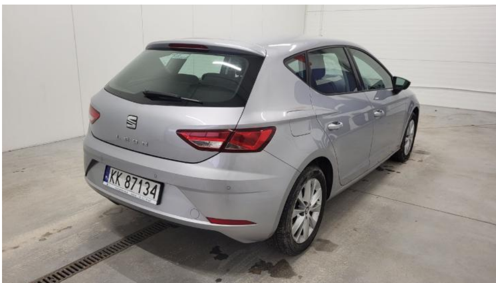
Fot. 6. Przekątna tylna prawa