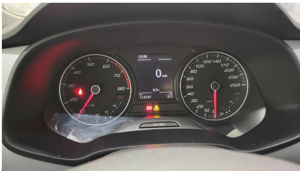
Fot. 24. Zestaw wskaźników - przebieg