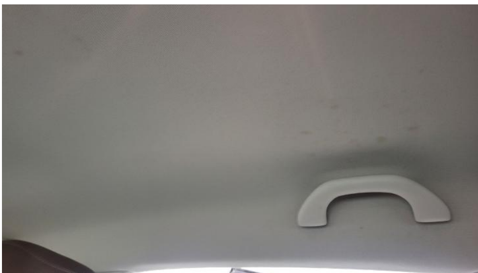
Fot. 74. Podsufitka - Inne 1