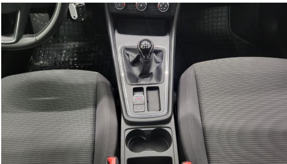
Fot. 30. Tunel środkowy