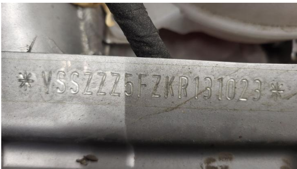
Fot. 22. Numer identyfikacyjny