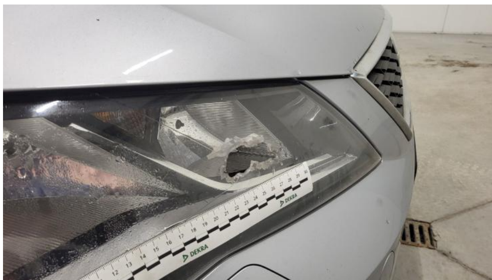
Fot. 50. Reflektor P - Pęknięcie/rozerwanie 1