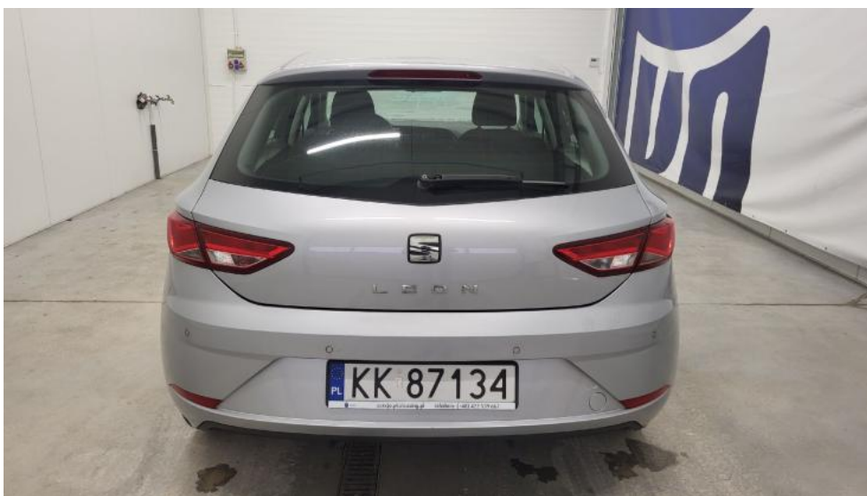
Fot. 7. Tyl