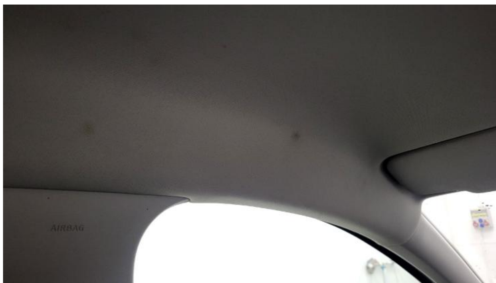
Fot. 75. Podsufitka - Inne 2