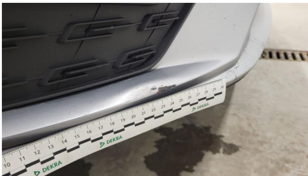
Fot. 47. Zderzak - Pęknięcie/rozerwanie 2