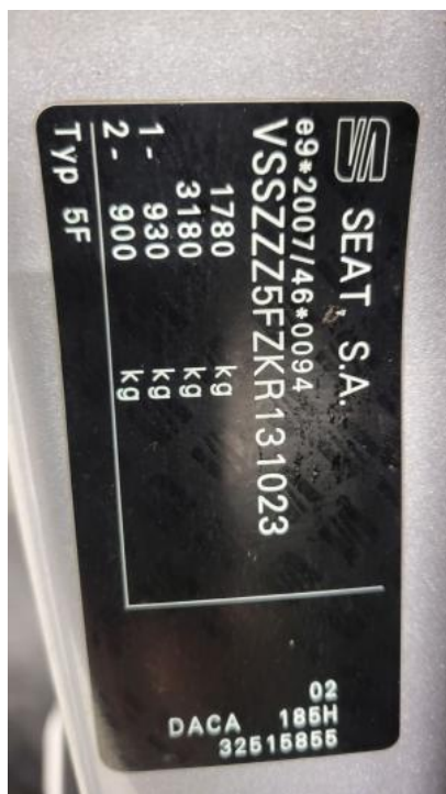
Fot. 23. Tabliczka znamionowa