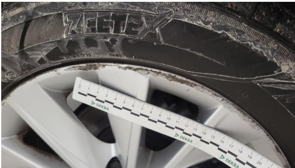
Fot. 57. Felga aluminiowa tylna P - Rysa/odprysk 1