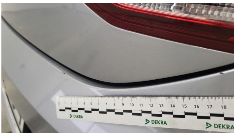
Fot. 60. Zderzak tylny - Rysa/odprysk 1