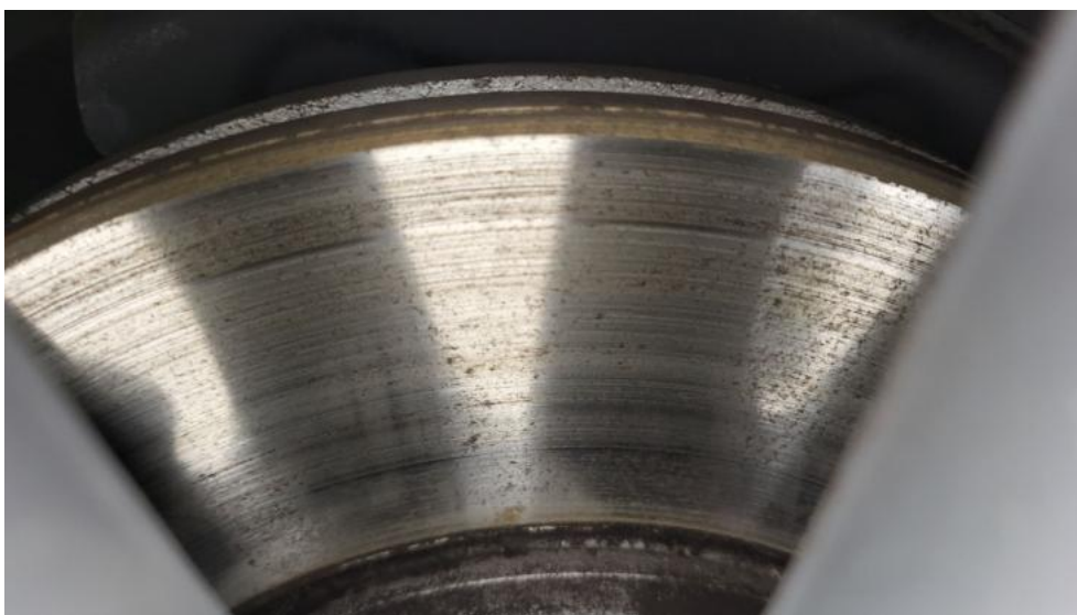
Fot. 18. Tarcza hamulcowa przednia lewa