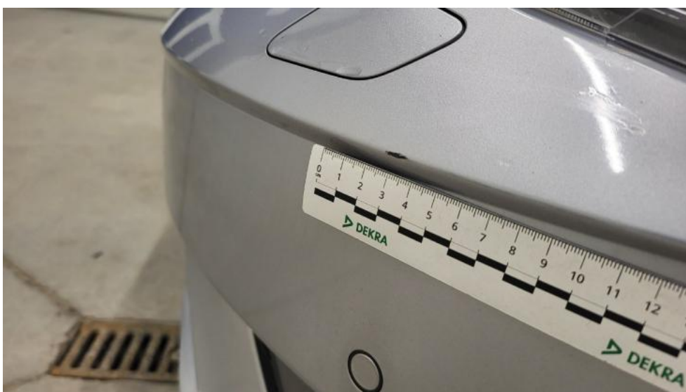
Fot. 44. Zderzak - Rysa/odprysk 1