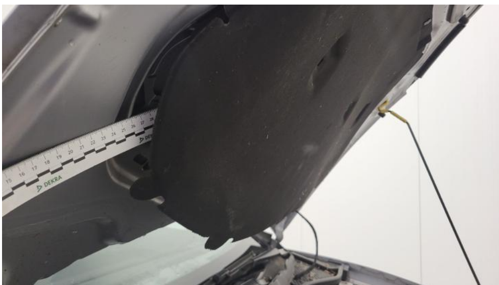
Fot. 43. Wykładzina pokrywy komory silnika - Inne 1