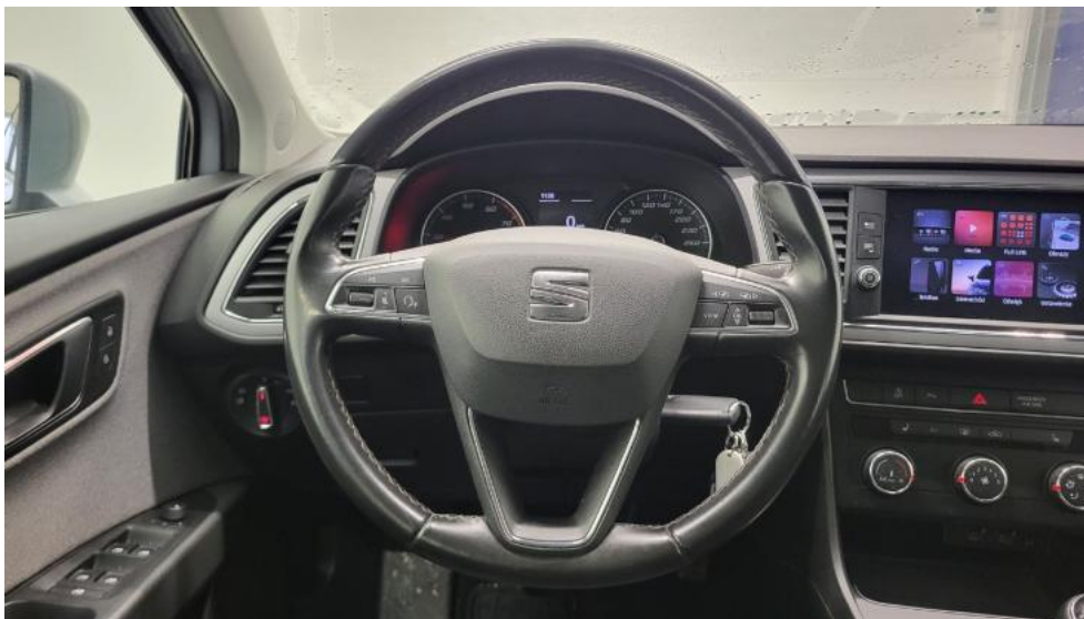
Fot. 31. Kierownica (na wprost)