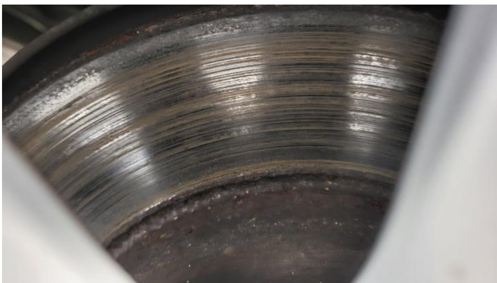
Fot. 16. Tarcza hamulcowa tylna prawa