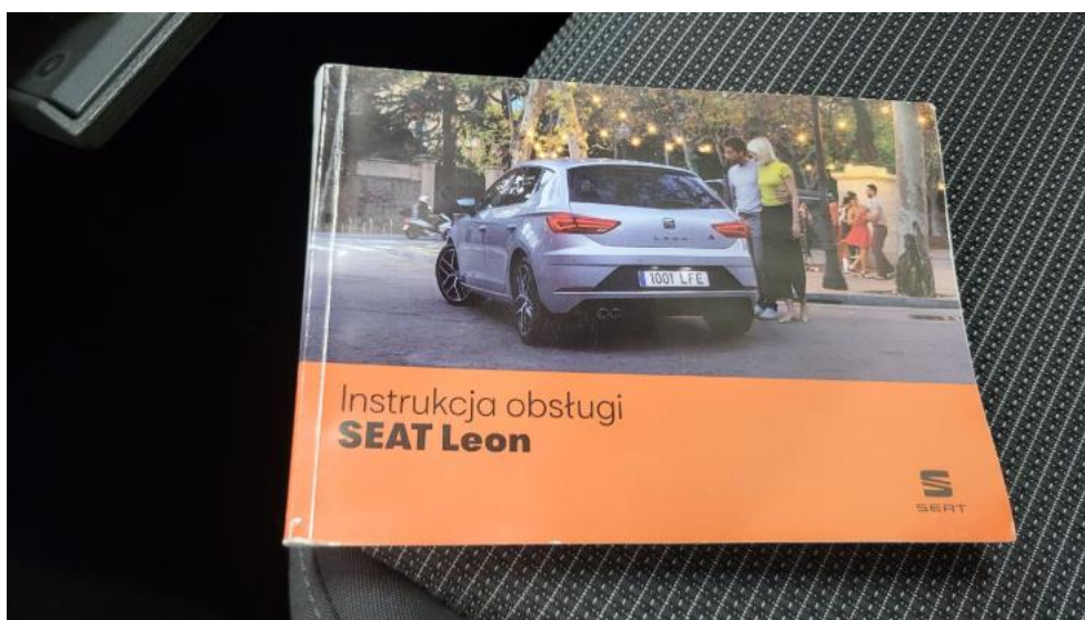
Fot. 36. Instrukcje