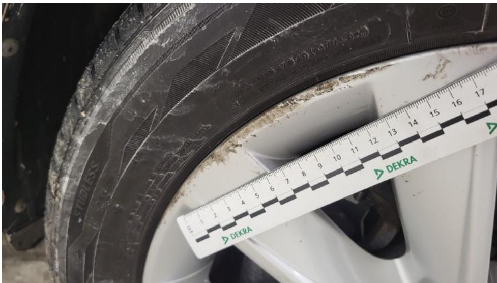
Fot. 71. Felga Aluminiowa przednia L - Rysa/odprysk 1