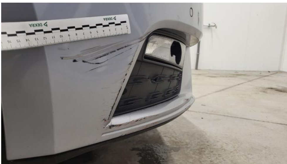
Fot. 45. Zderzak - Wgniecenie/odkształcenie 1