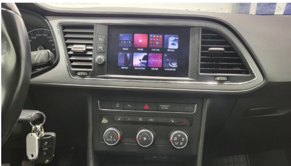
Fot. 29. Konsola środkowa