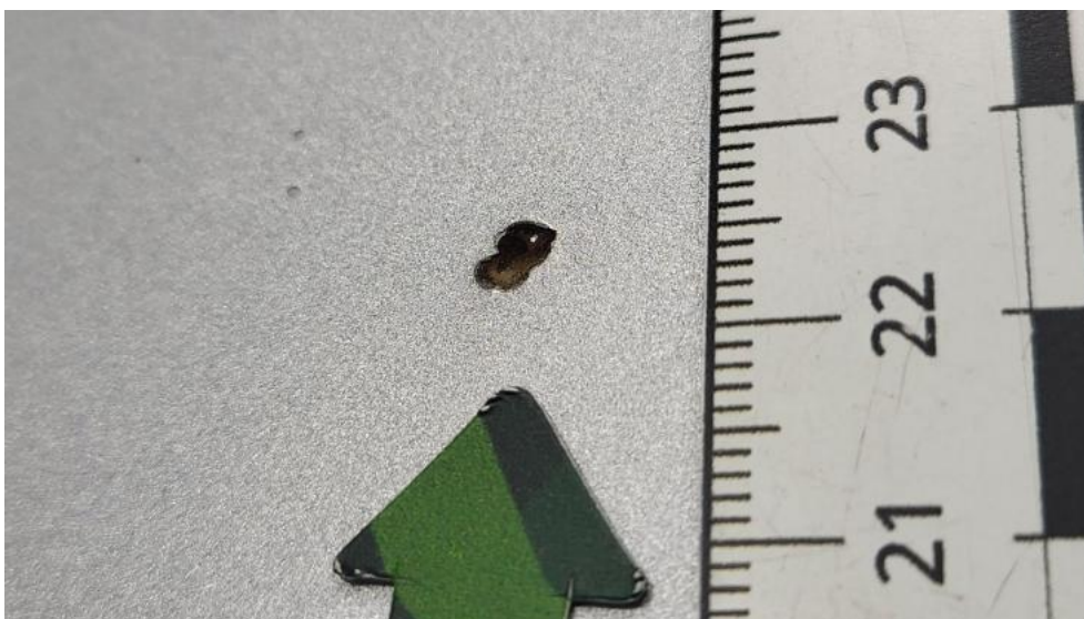
Fot. 42. Pokrywa komory silnika - Inne 1