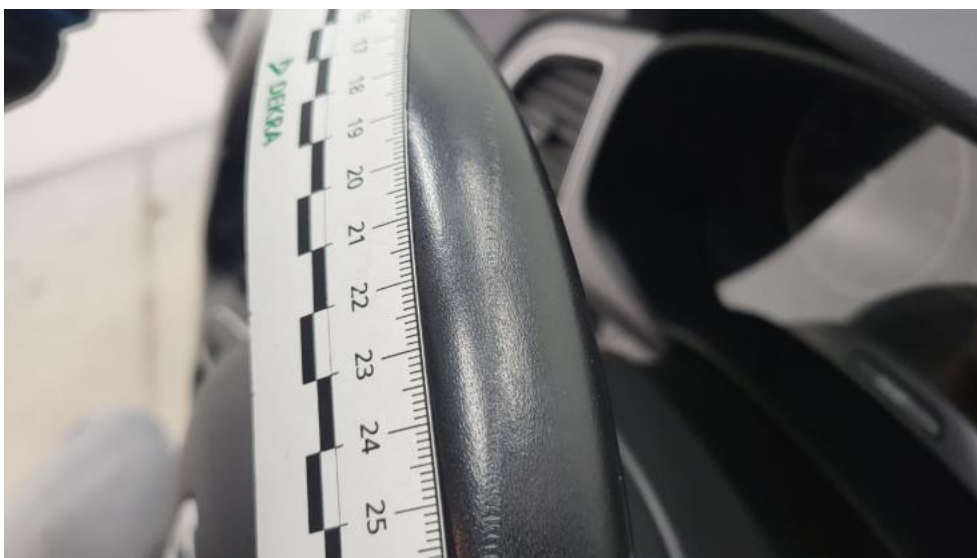
Fot. 72. Koło kierownicy - Rysa/odprysk 1