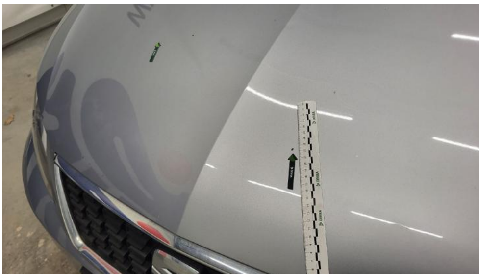
Fot. 40. Pokrywa komory silnika - zdjęcie poglądowe 1