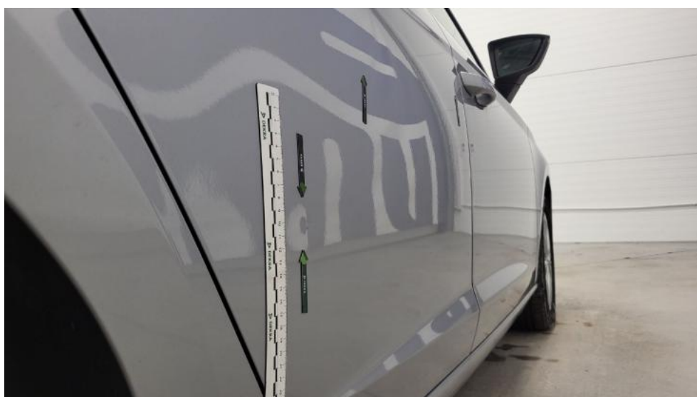
Fot. 52. Drzwi tylne P - Wgniecenie/odkształcenie 1