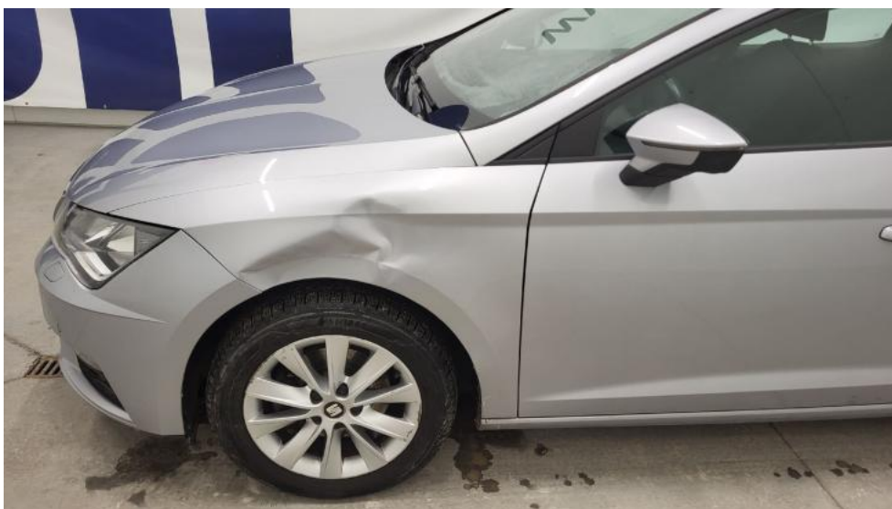
Fot. 10. Bok lewy z przodu