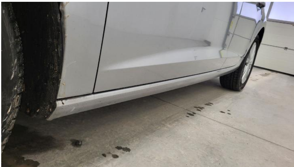
Fot. 11. Próg lewy (widok od przodu)