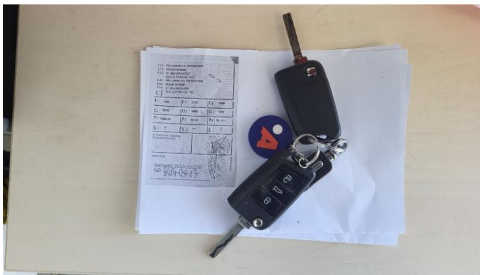
Fot. 35. Dow. Rej. ksero Str.2 i klucze