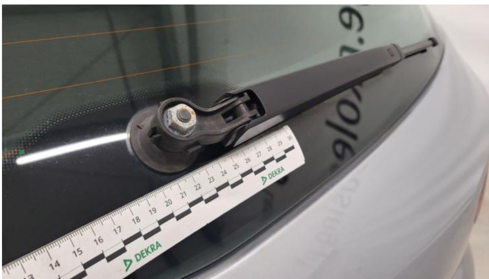
Fot. 58. Pióro wycieraczki szyby tyl - Inne 1