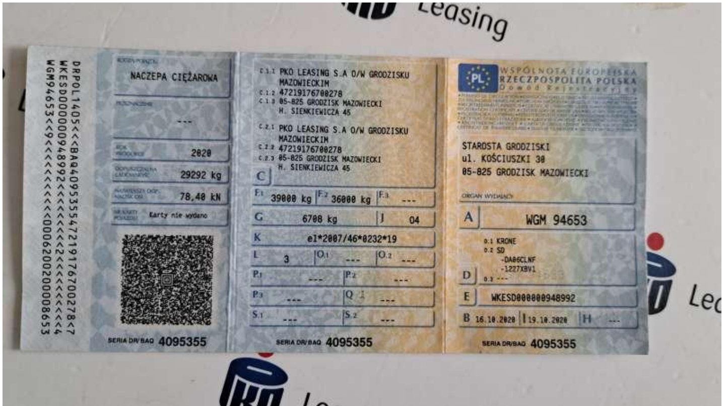
Fot. nr 53