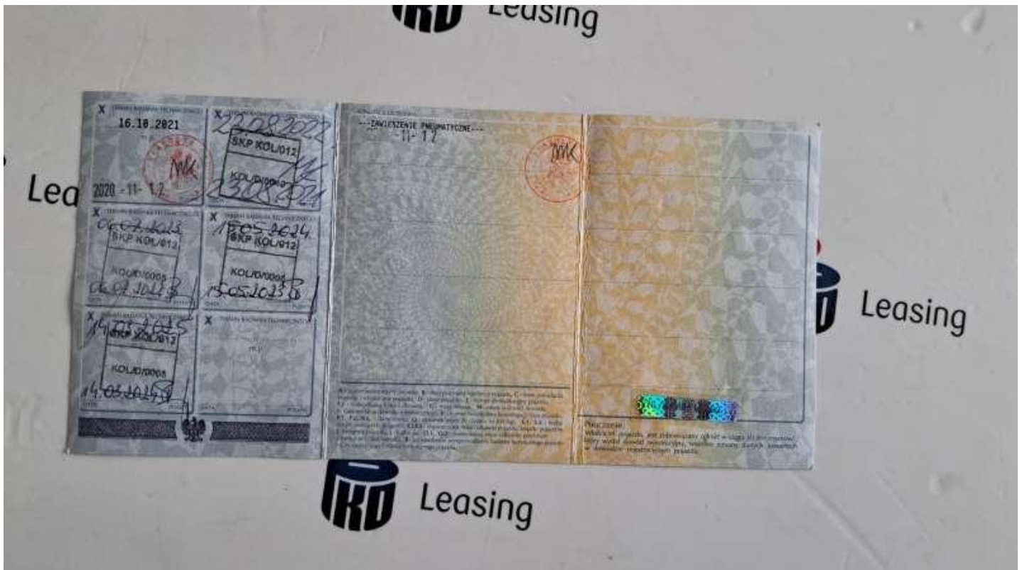
Fot. nr 54