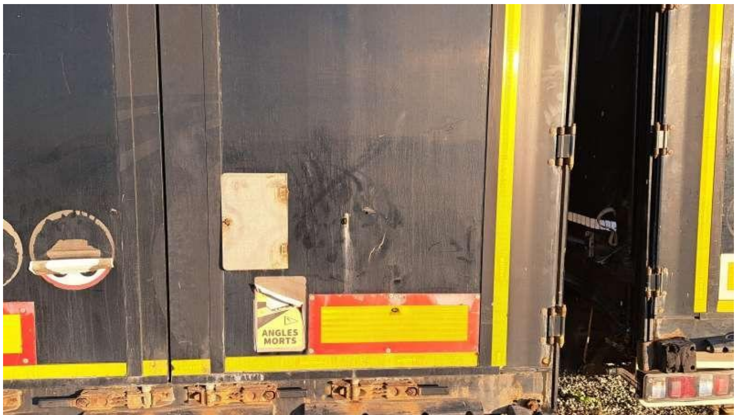
Fot. nr 48