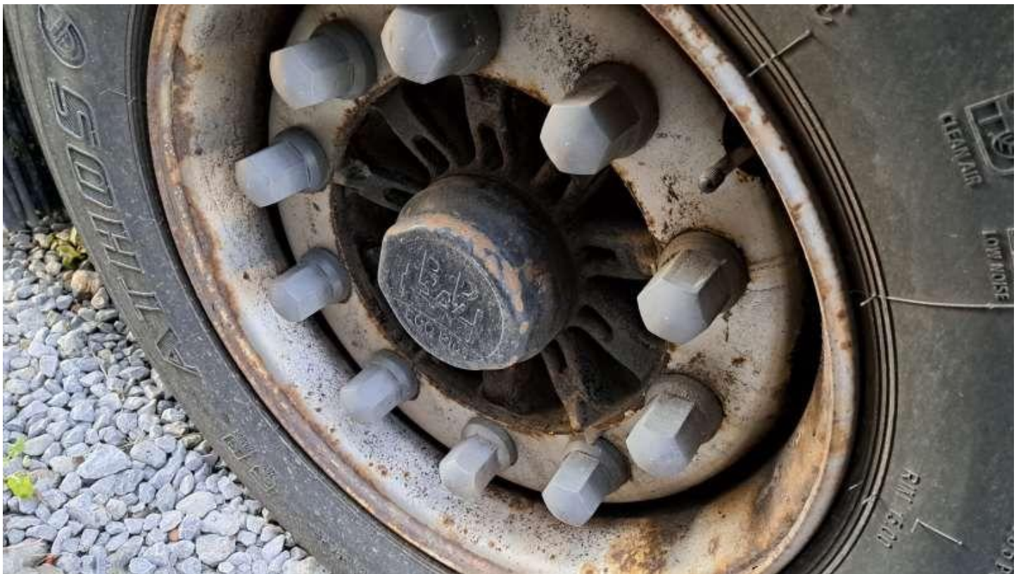
Fot. nr 26