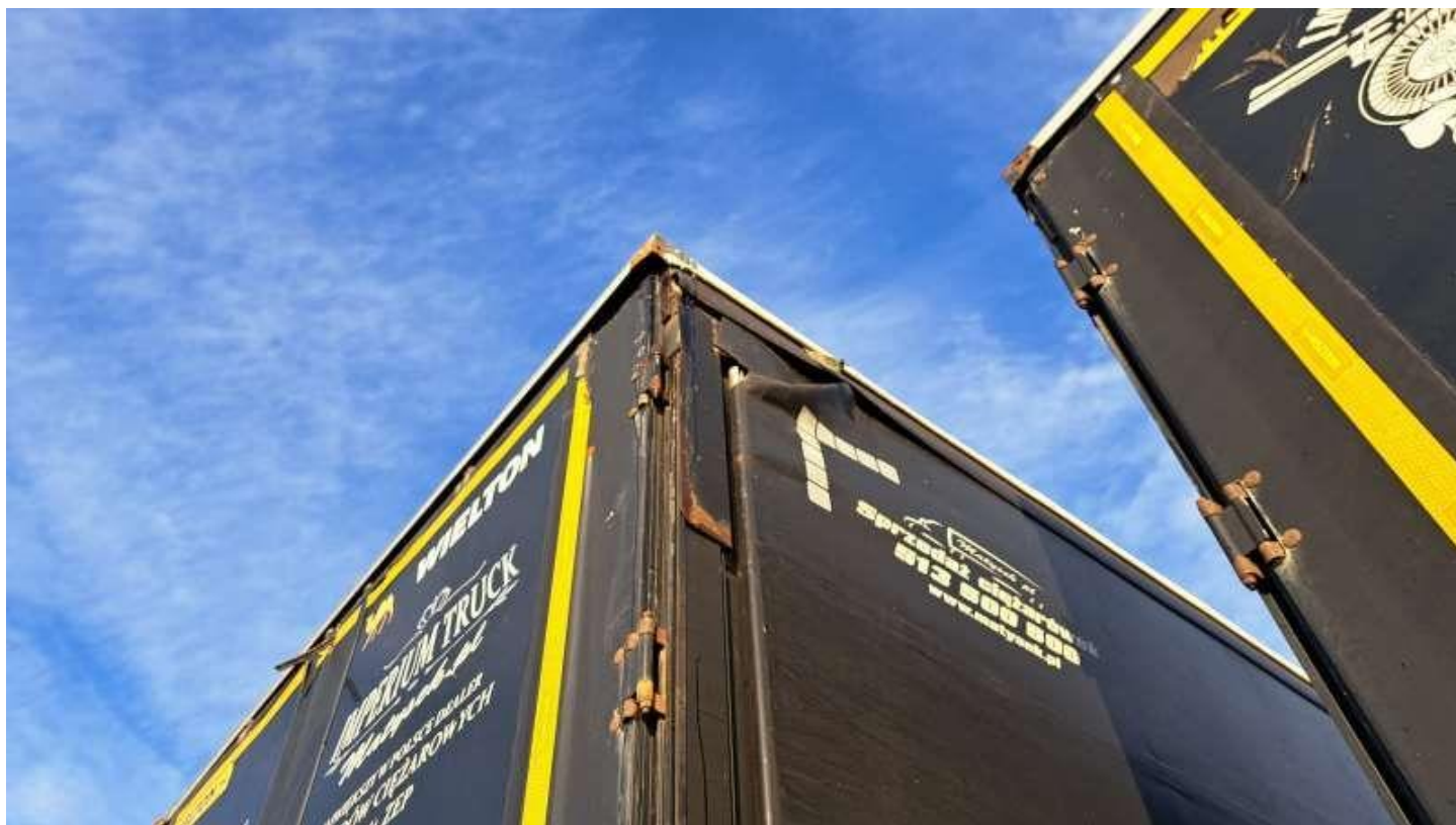
Fot. nr 36