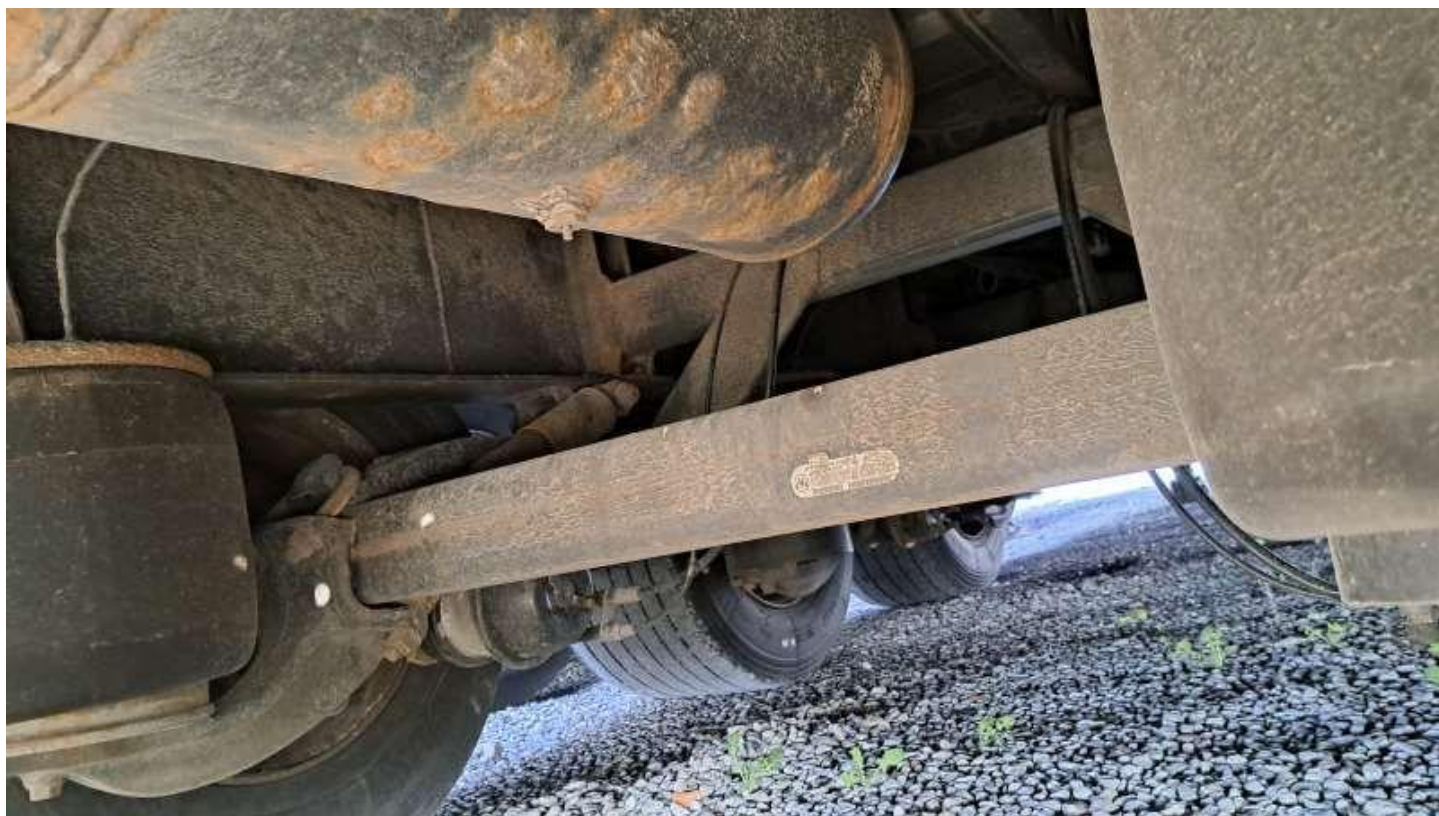
Fot. nr 30