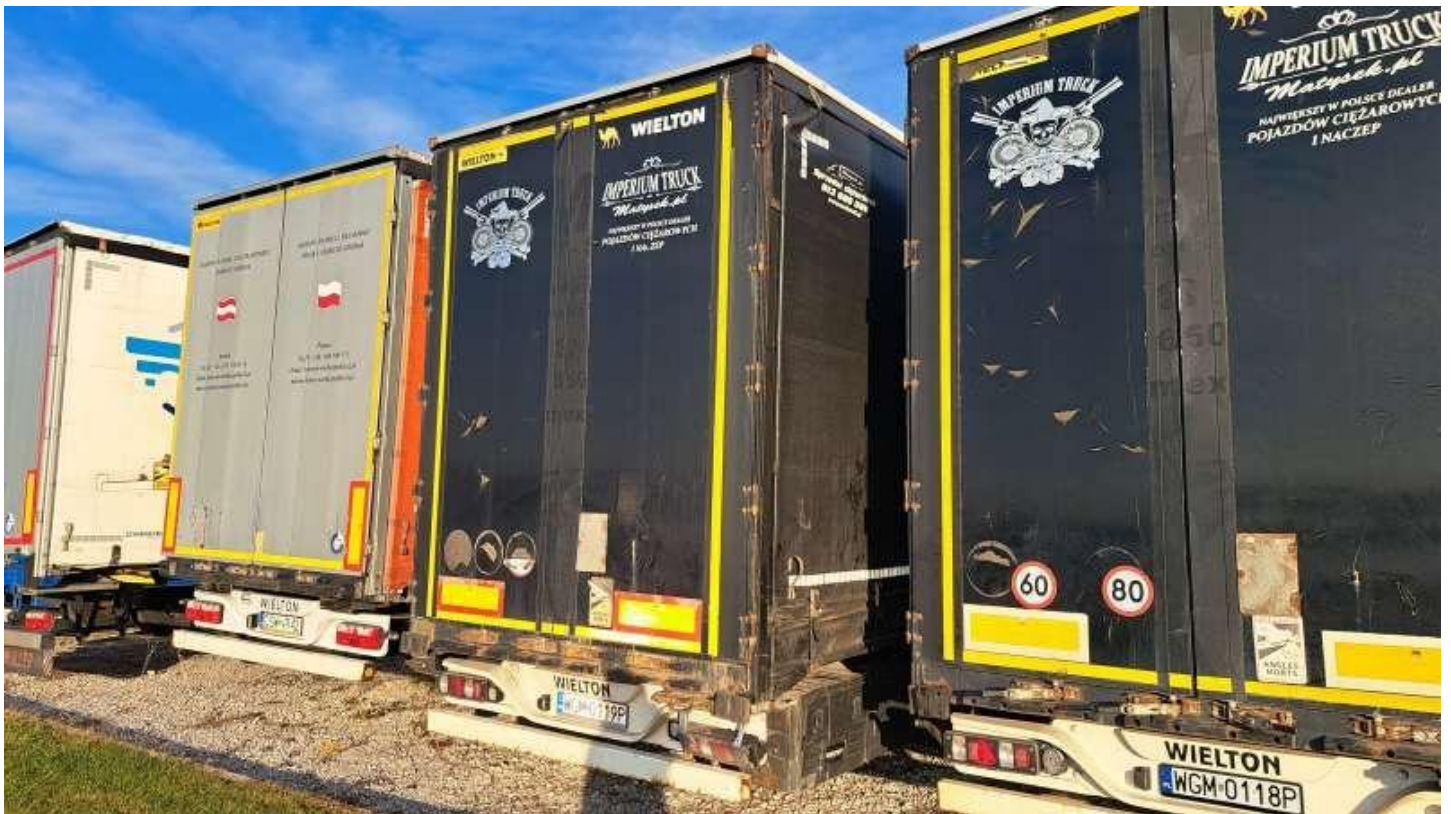
Fot. nr 4