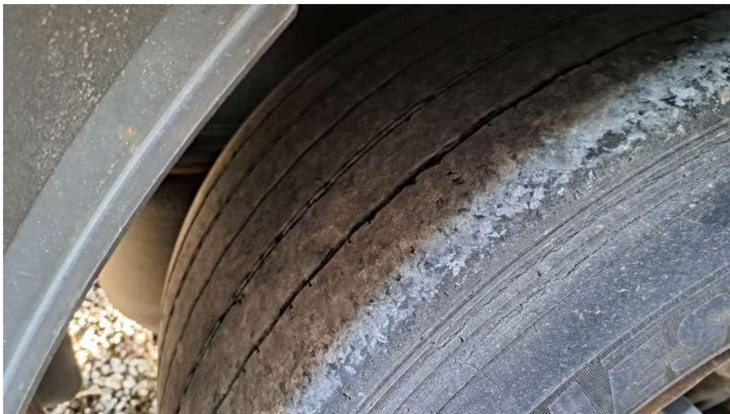
Fot. nr 80