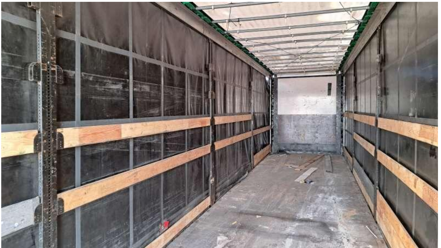
Fot. nr 66