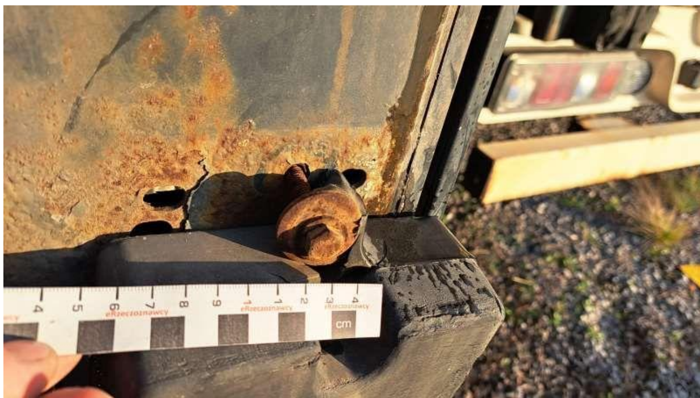
Fot. nr 38