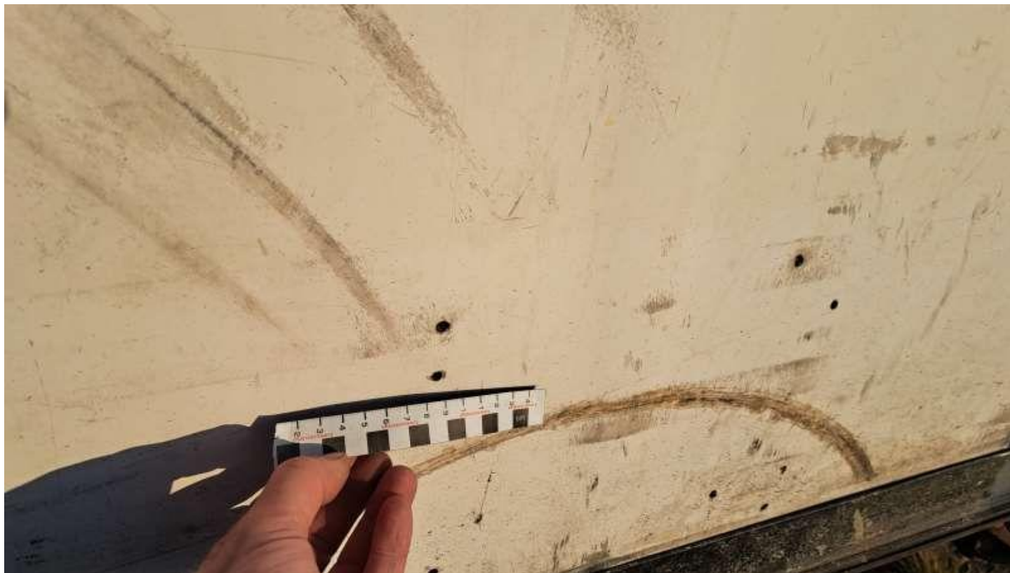
Fot. nr 74