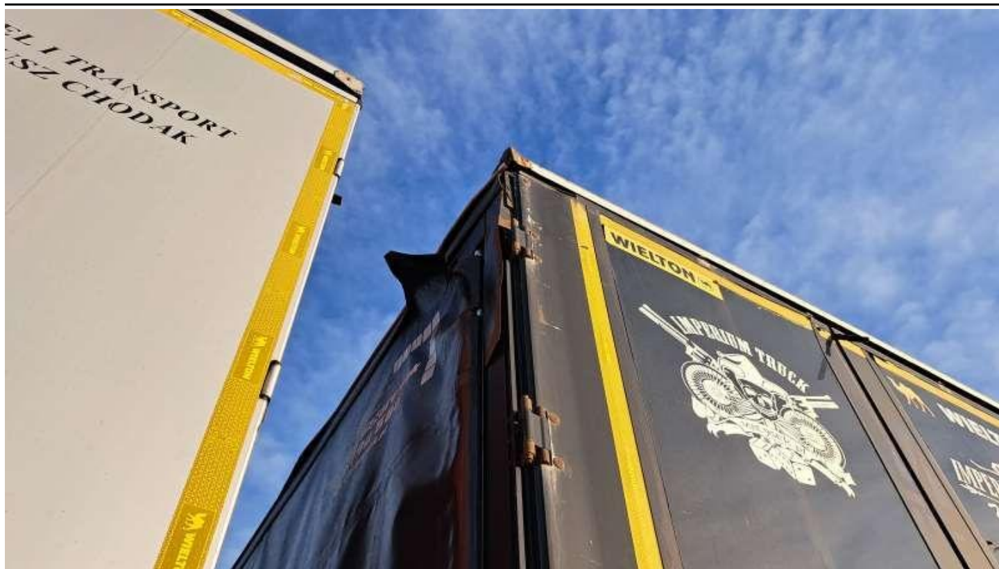
Fot. nr 53