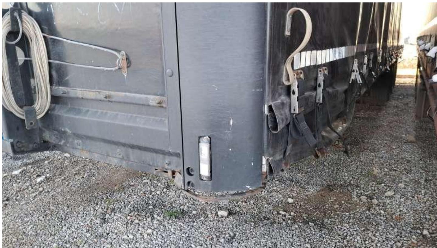
Fot. nr 14