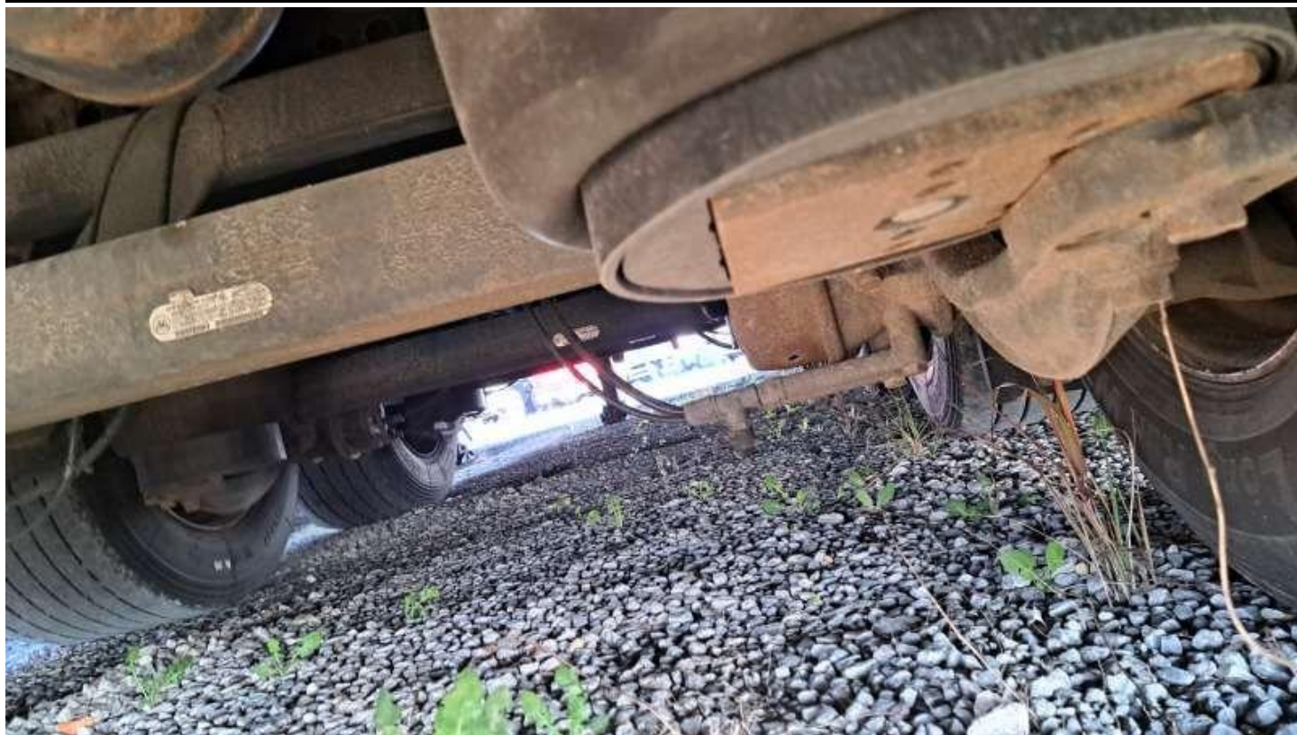
Fot. nr 31