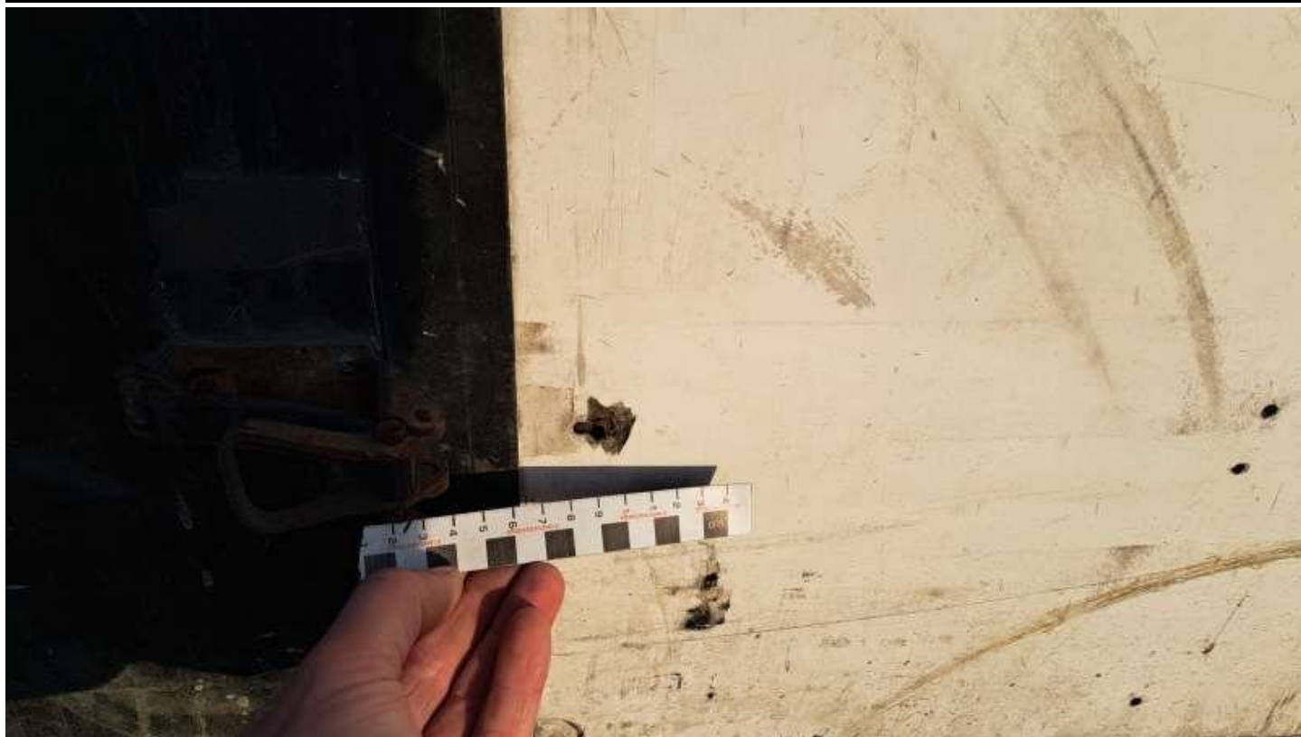
Fot. nr 73