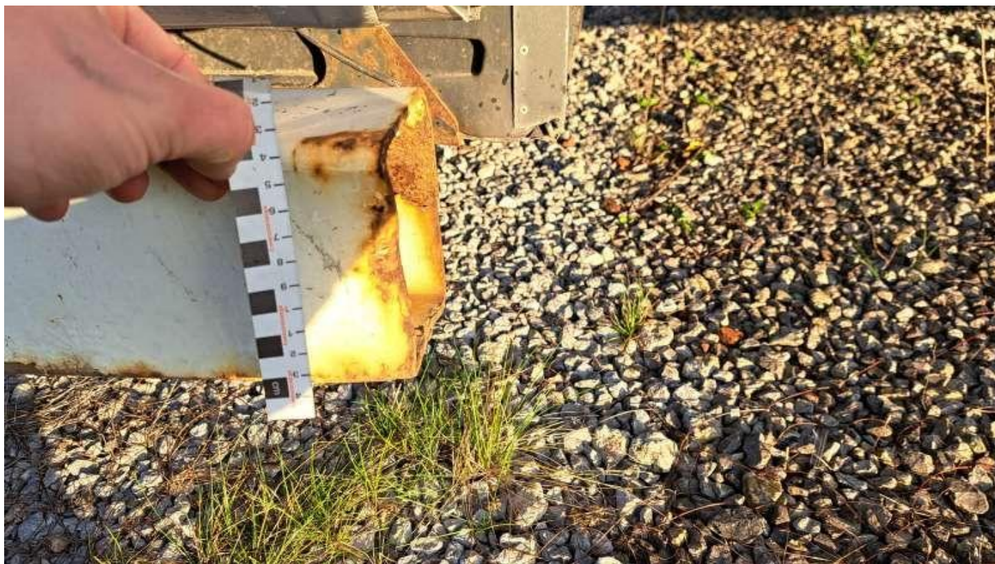
Fot. nr 42