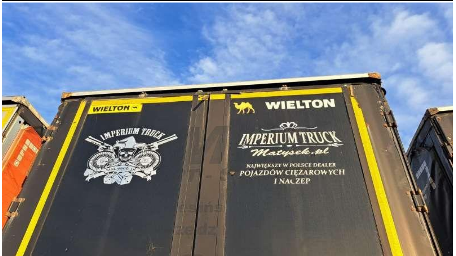
Fot. nr 47