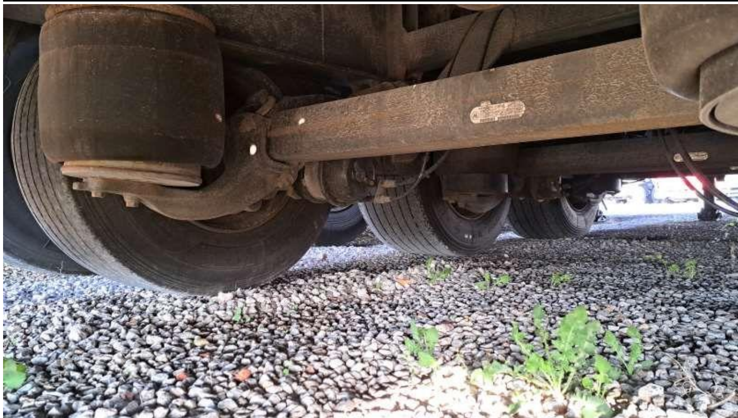
Fot. nr 29