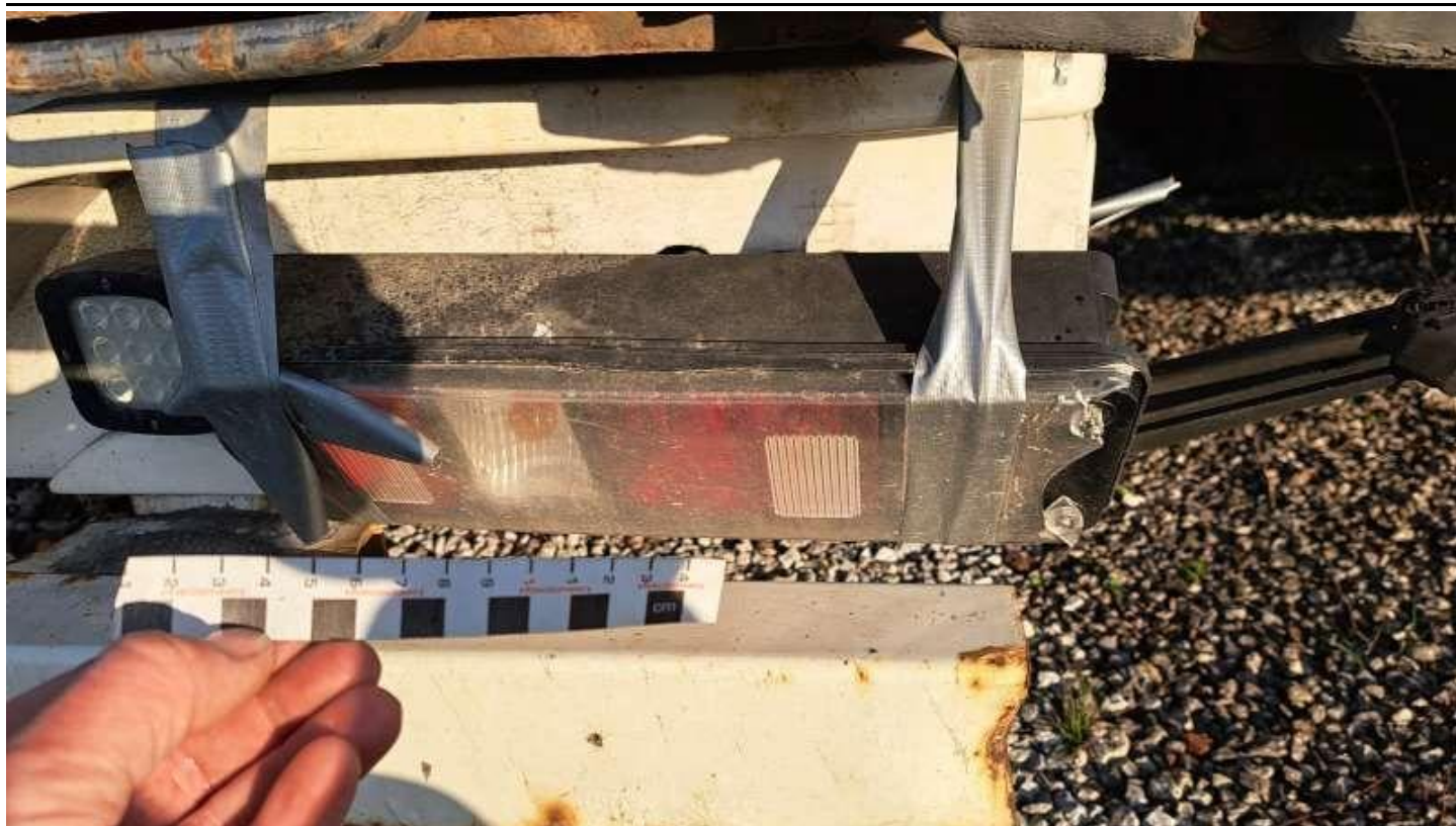
Fot. nr 39