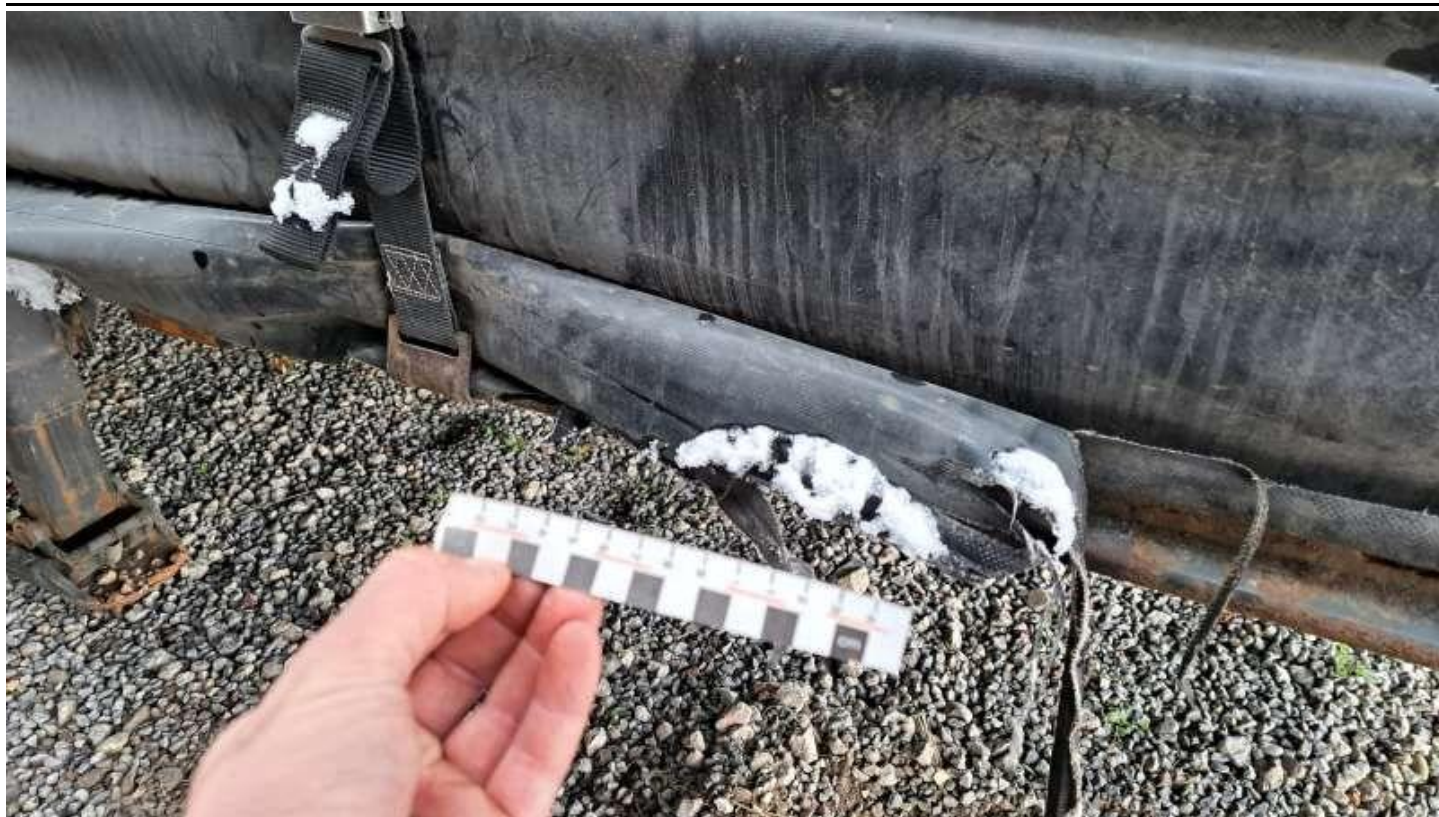
Fot. nr 21