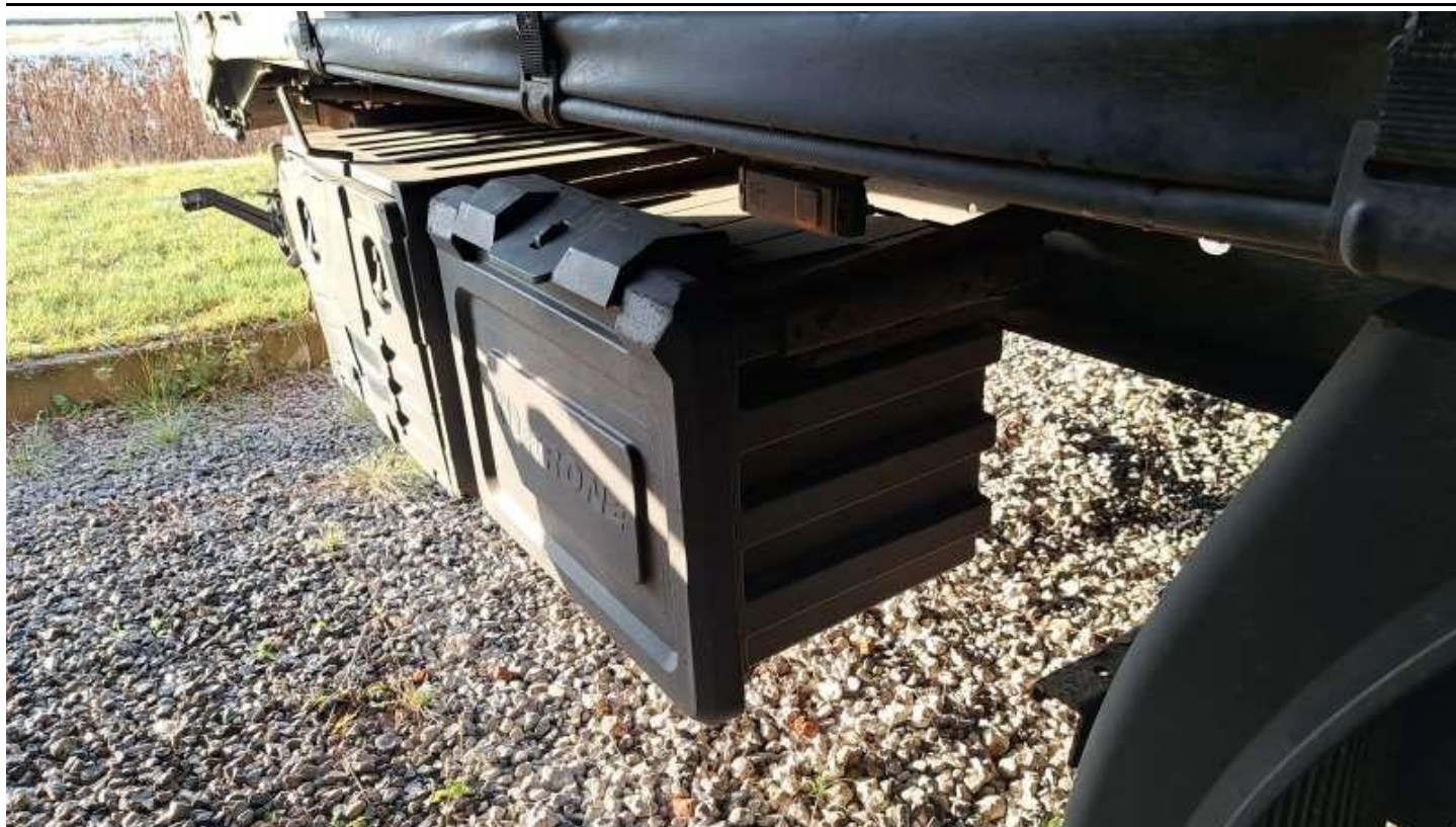
Fot. nr 27