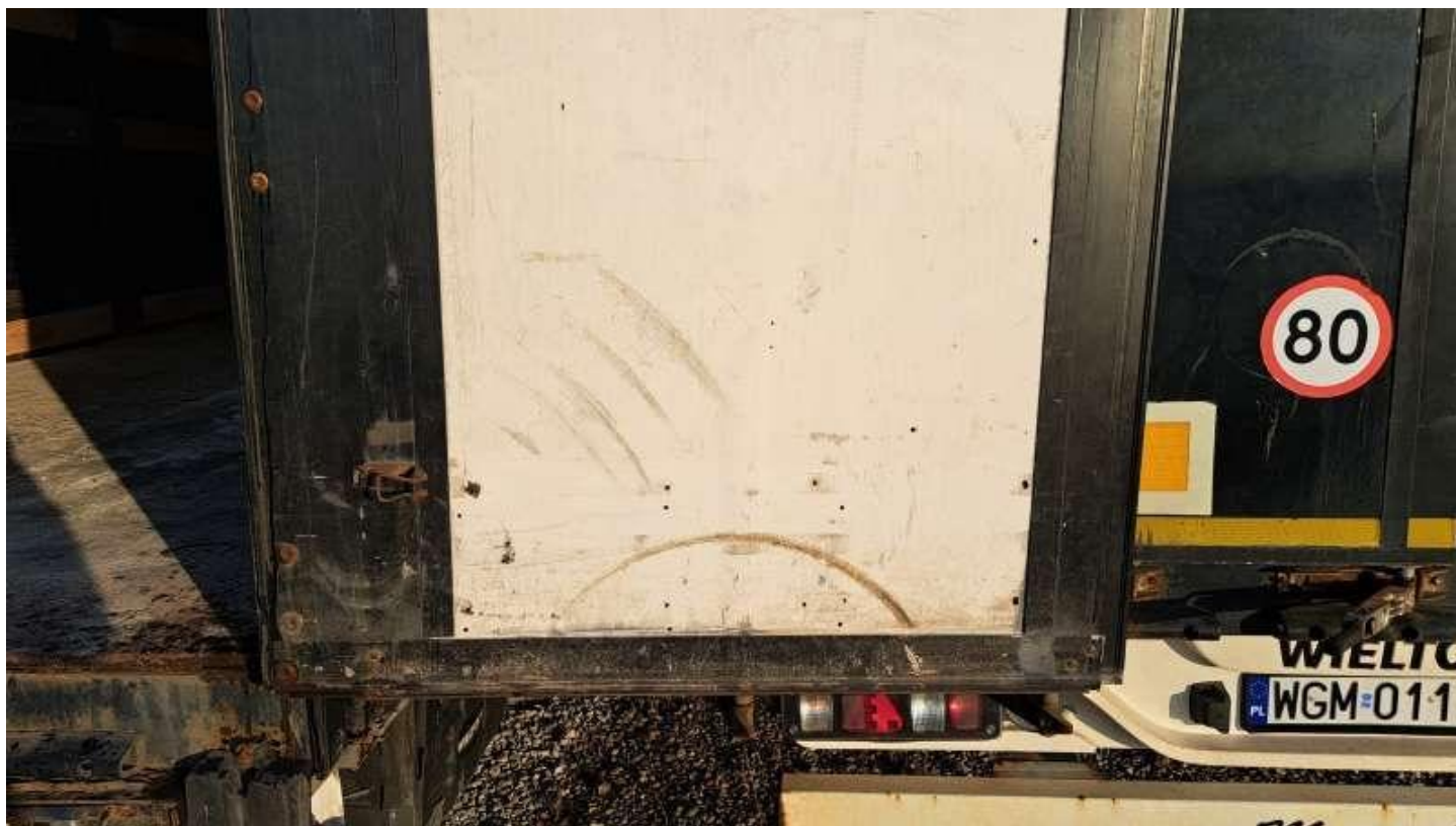
Fot. nr 72