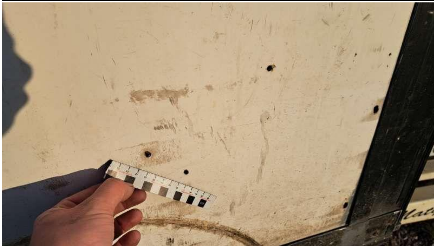
Fot. nr 75