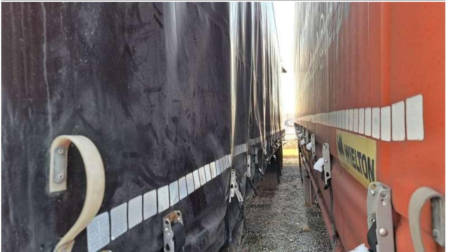
Fot. nr 17