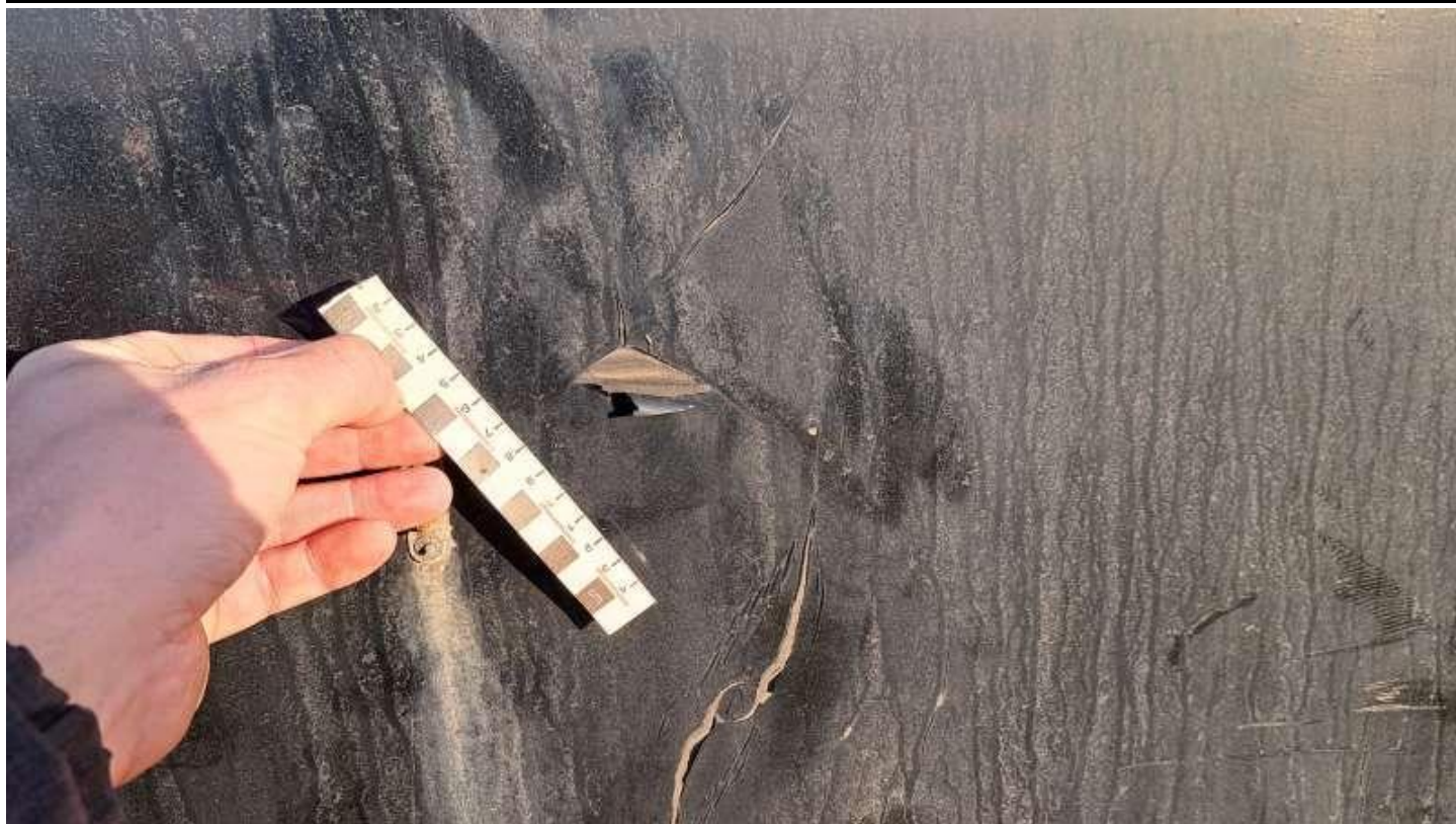
Fot. nr 49