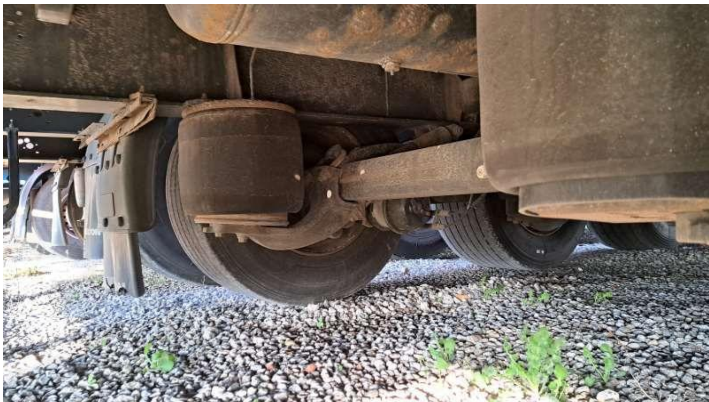
Fot. nr 28