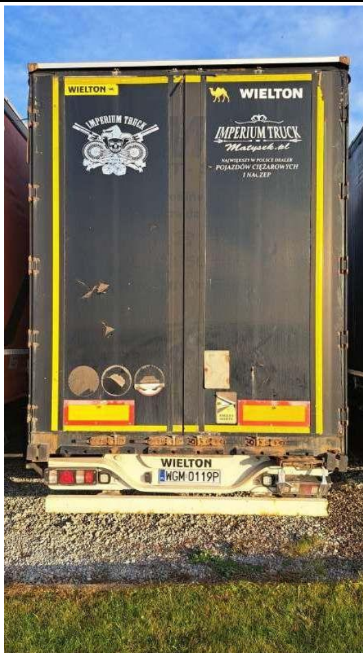
Fot. nr 5