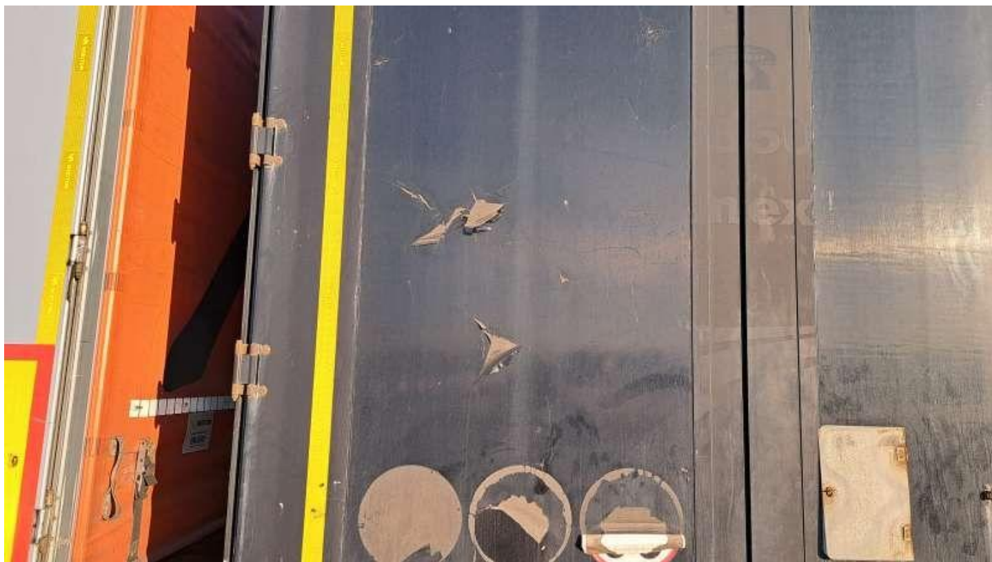
Fot. nr 50