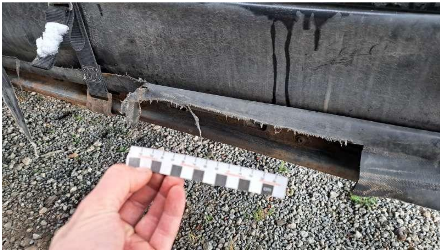
Fot. nr 20