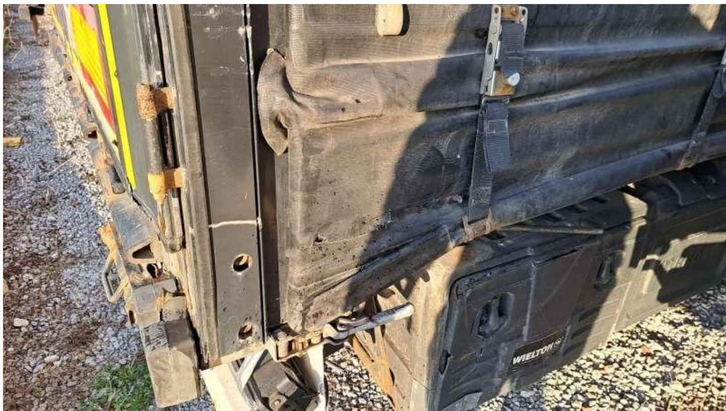
Fot. nr 34