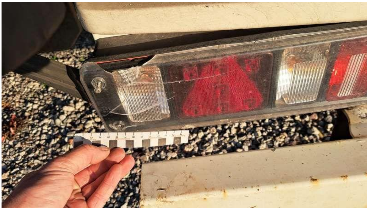
Fot. nr 44