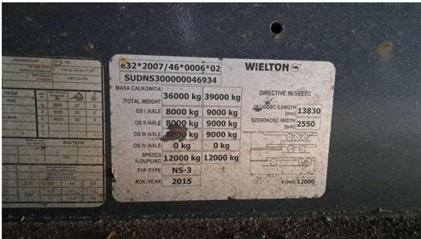
Fot. nr 8