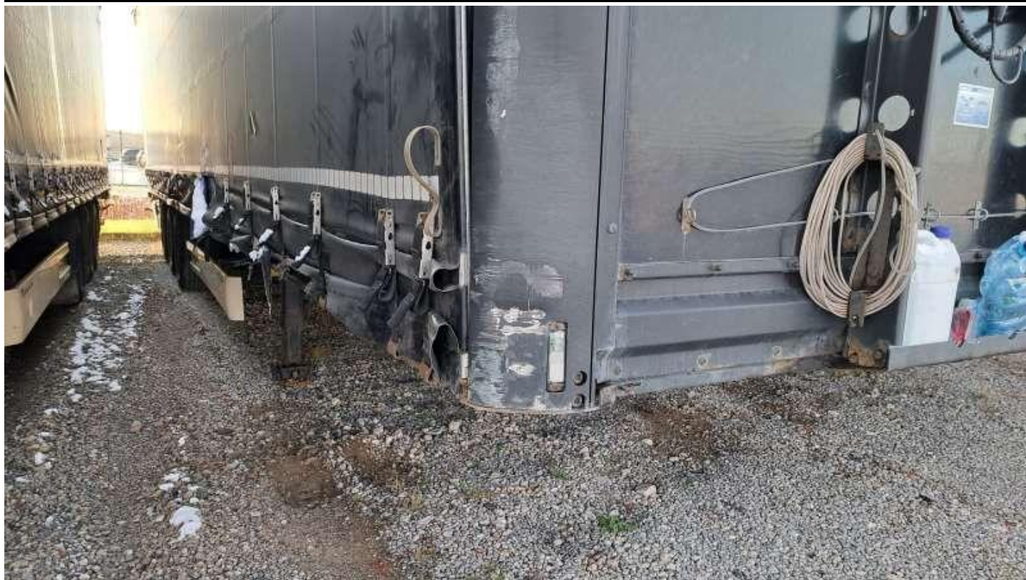
Fot. nr 11