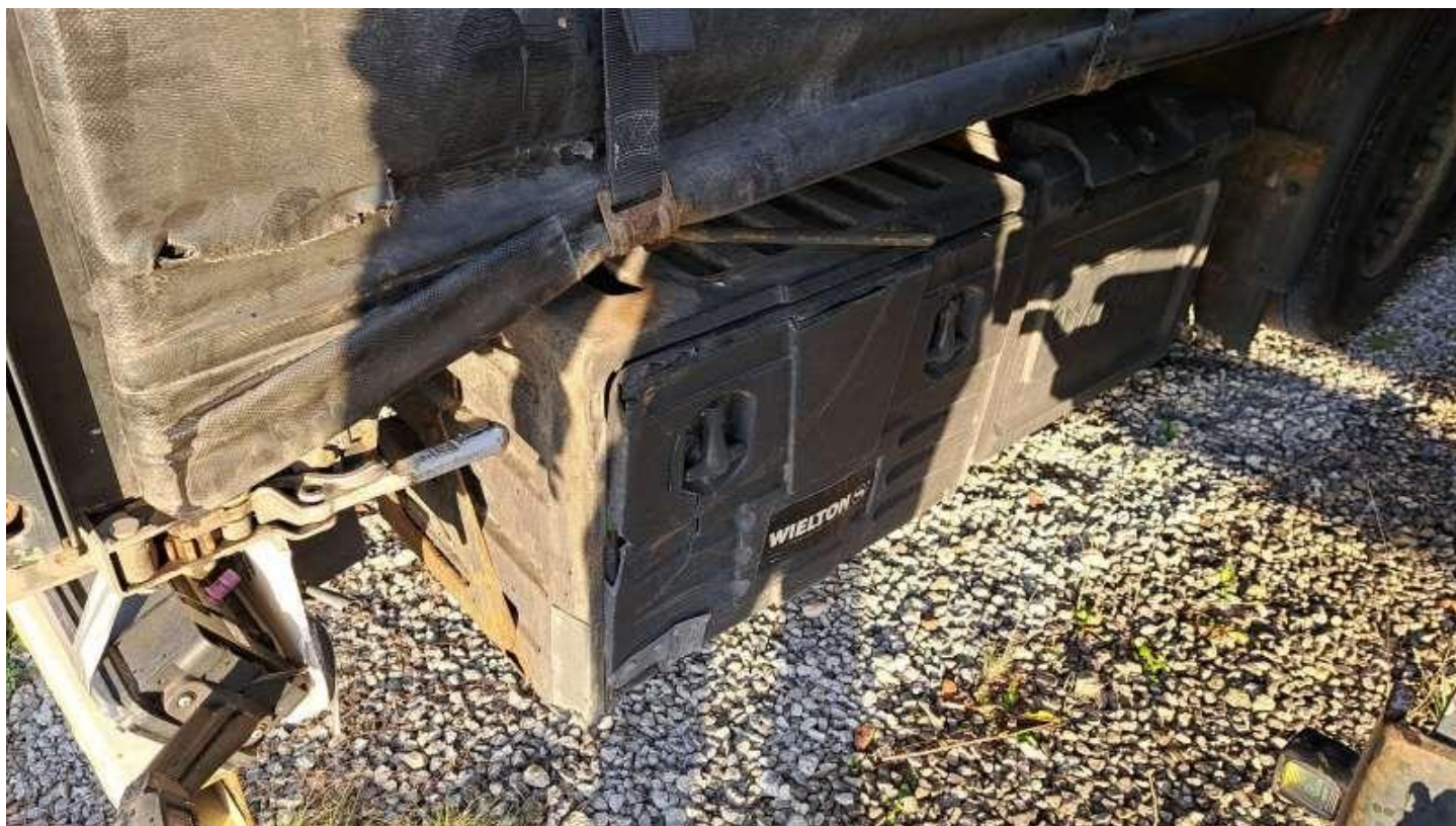
Fot. nr 32