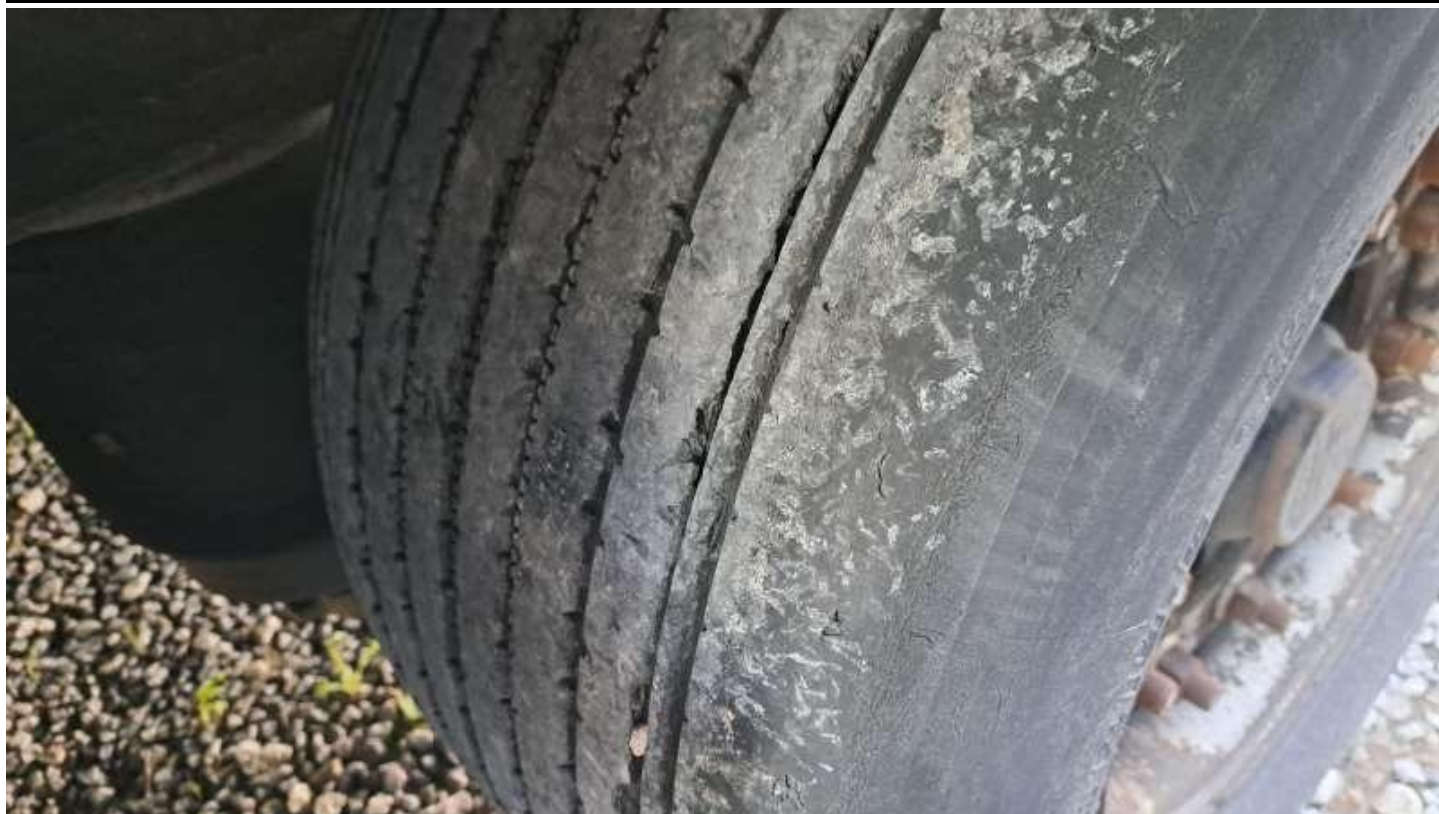
Fot. nr 81