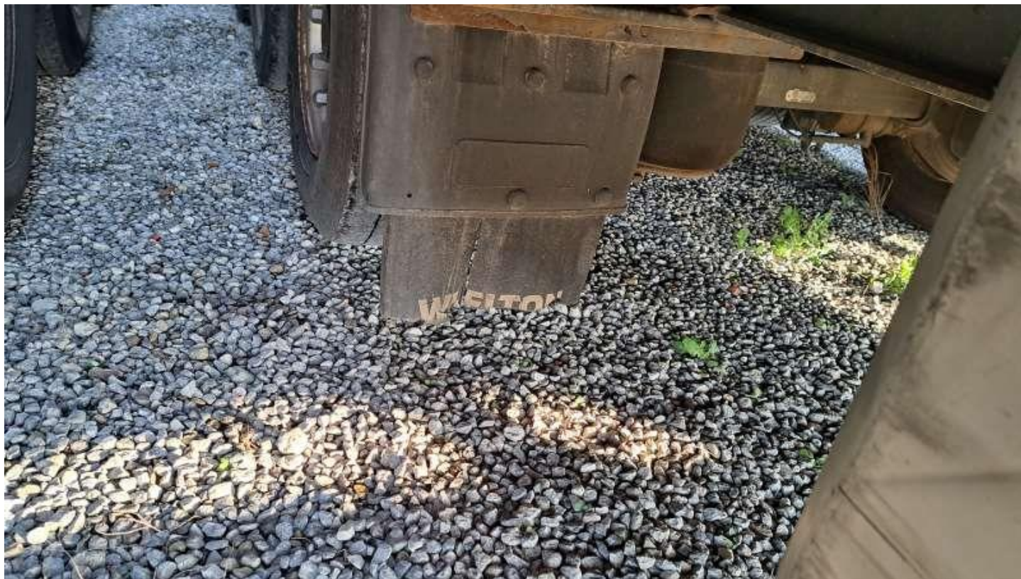
Fot. nr 56