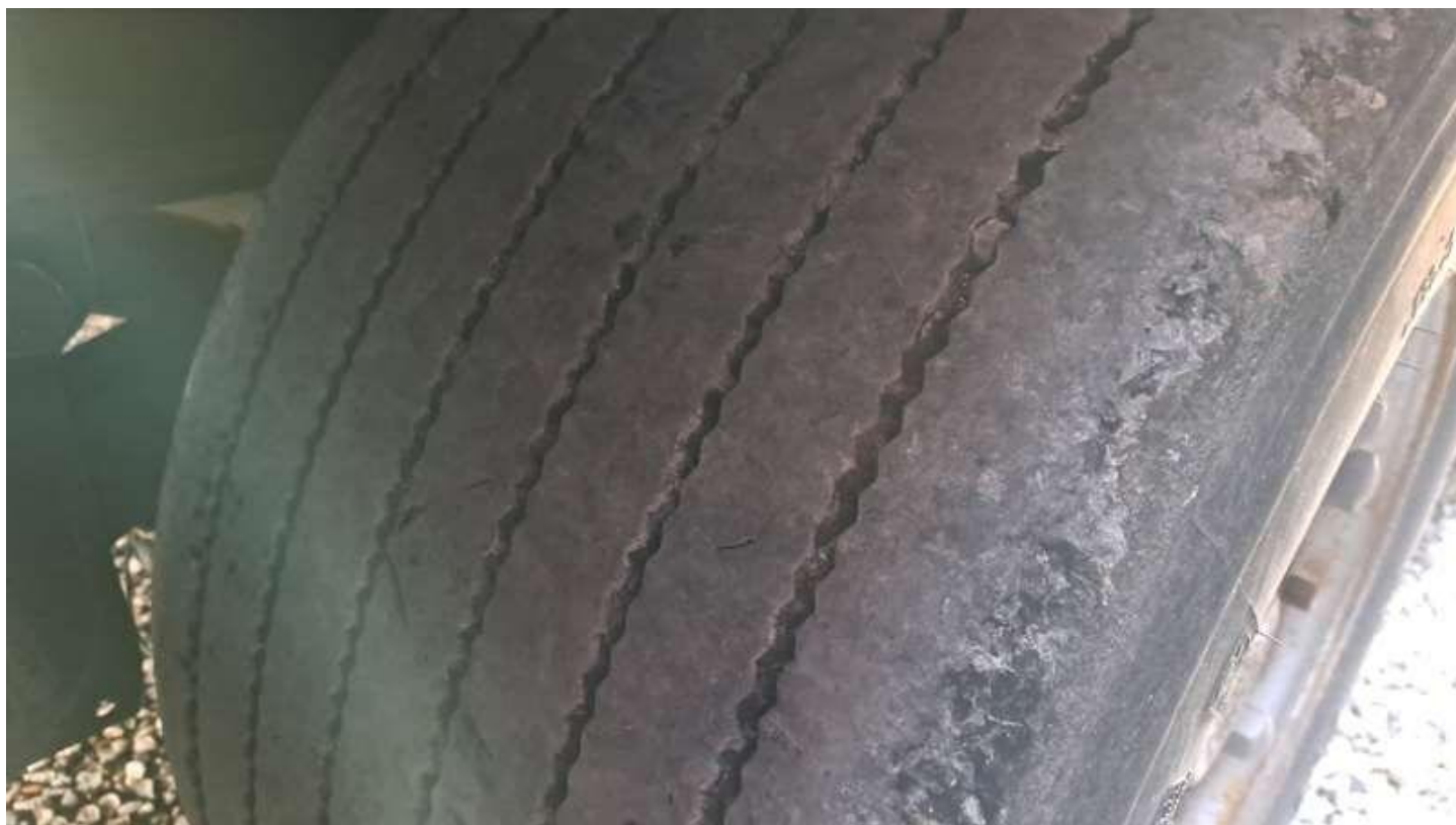
Fot. nr 78