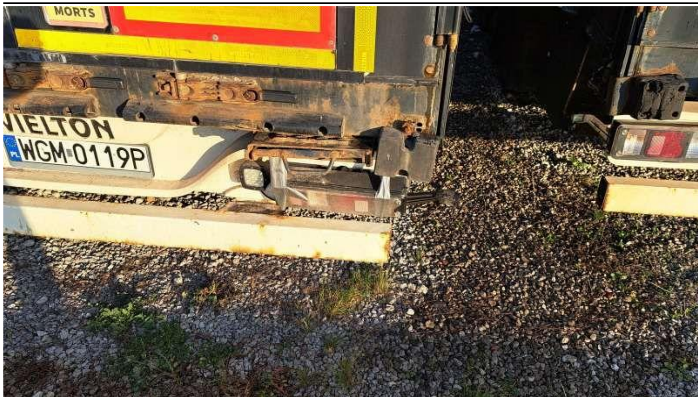
Fot. nr 37