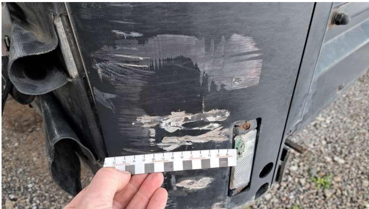
Fot. nr 12