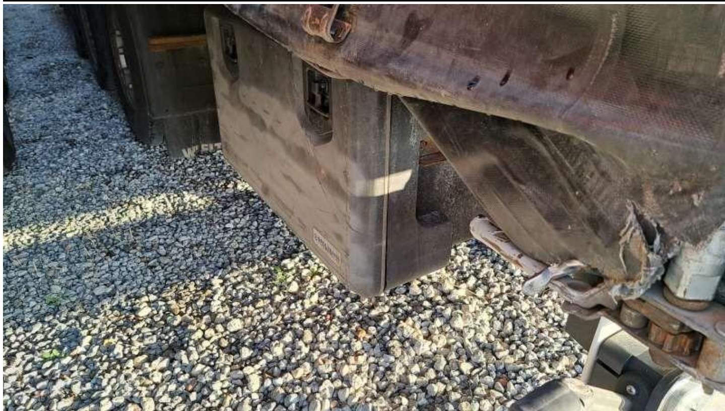
Fot. nr 55