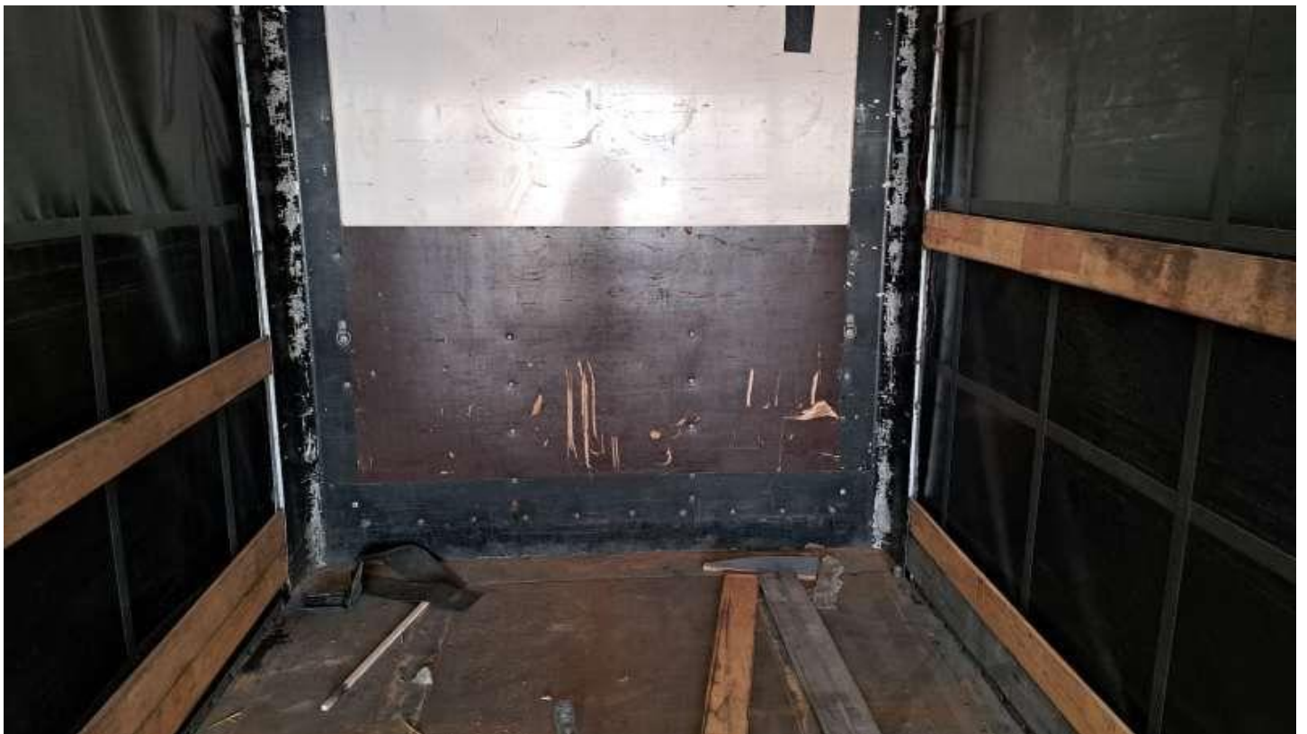
Fot. nr 70