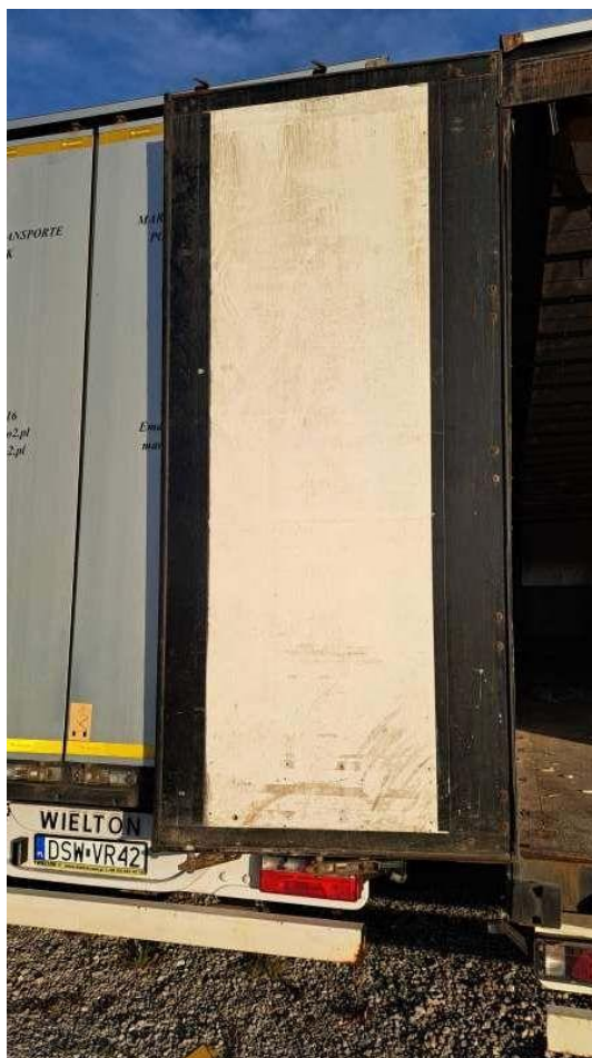
Fot. nr 60