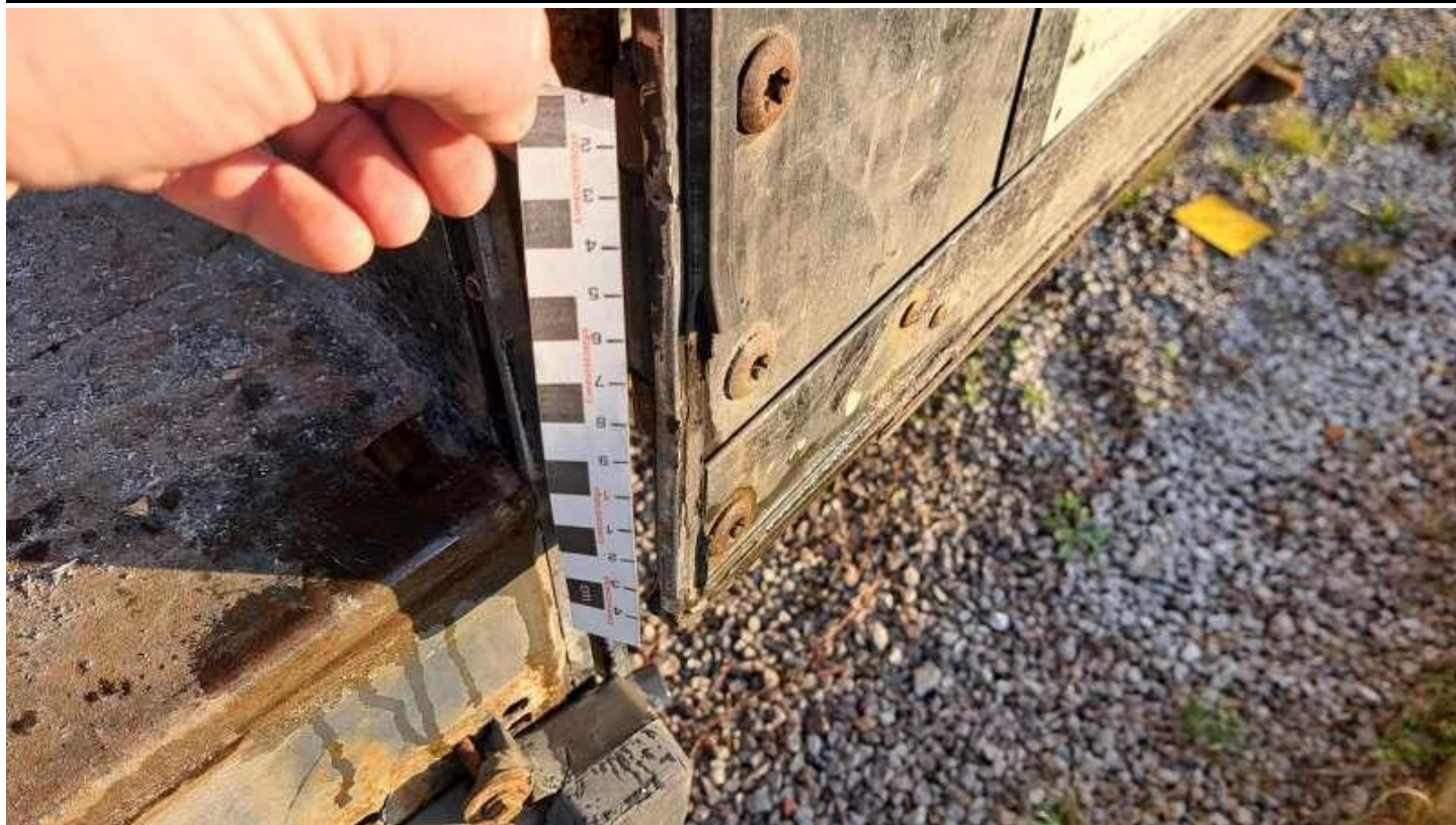
Fot. nr 59