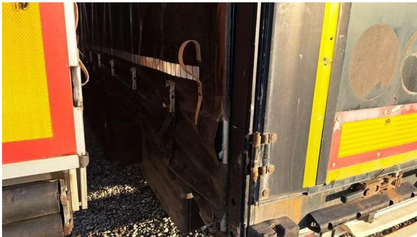
Fot. nr 54