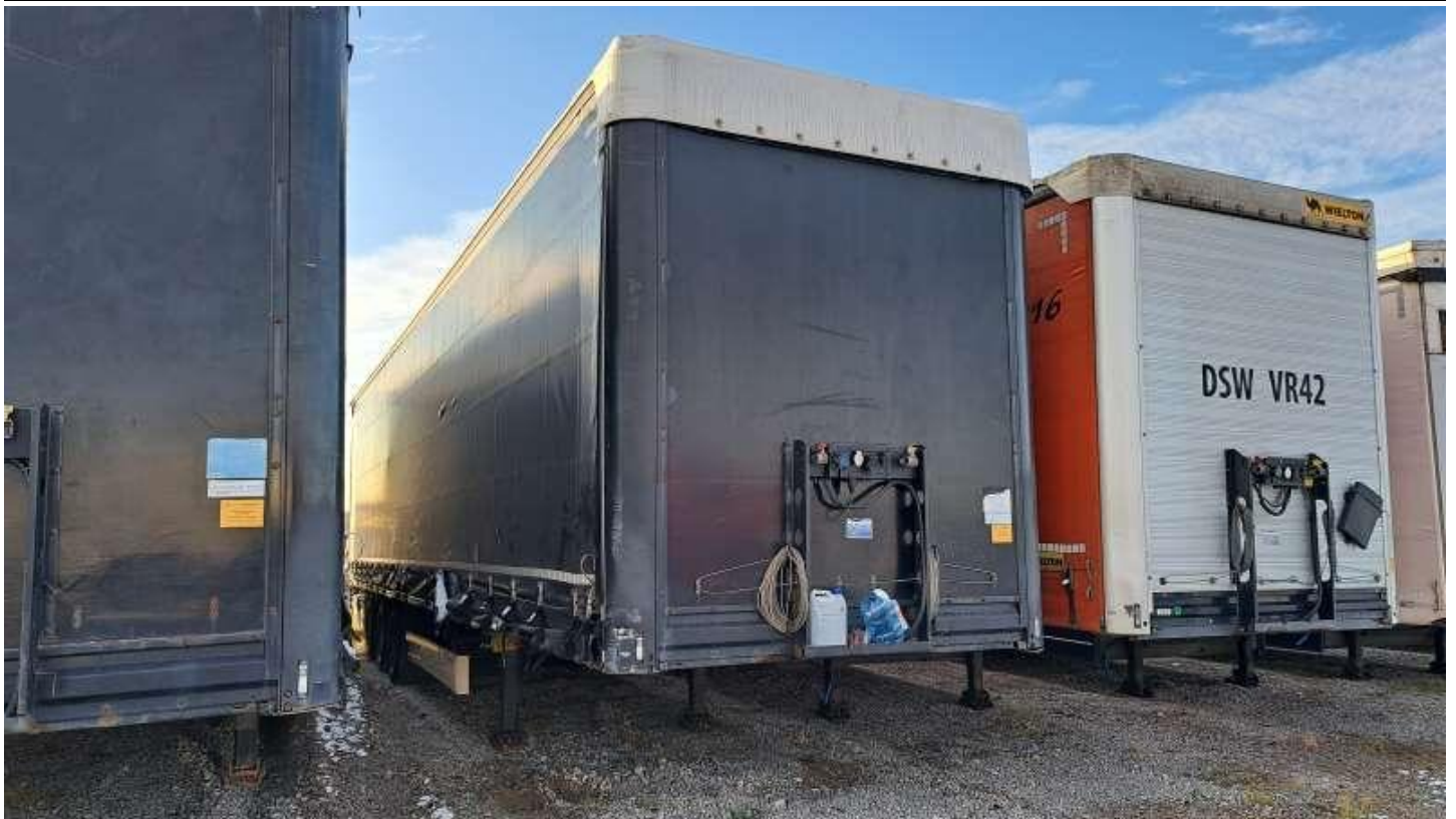
Fot. nr 3