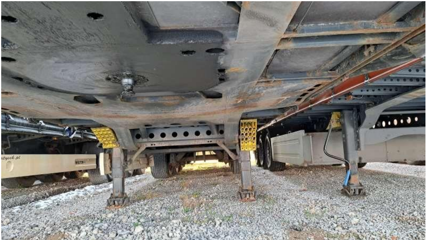
Fot. nr 18