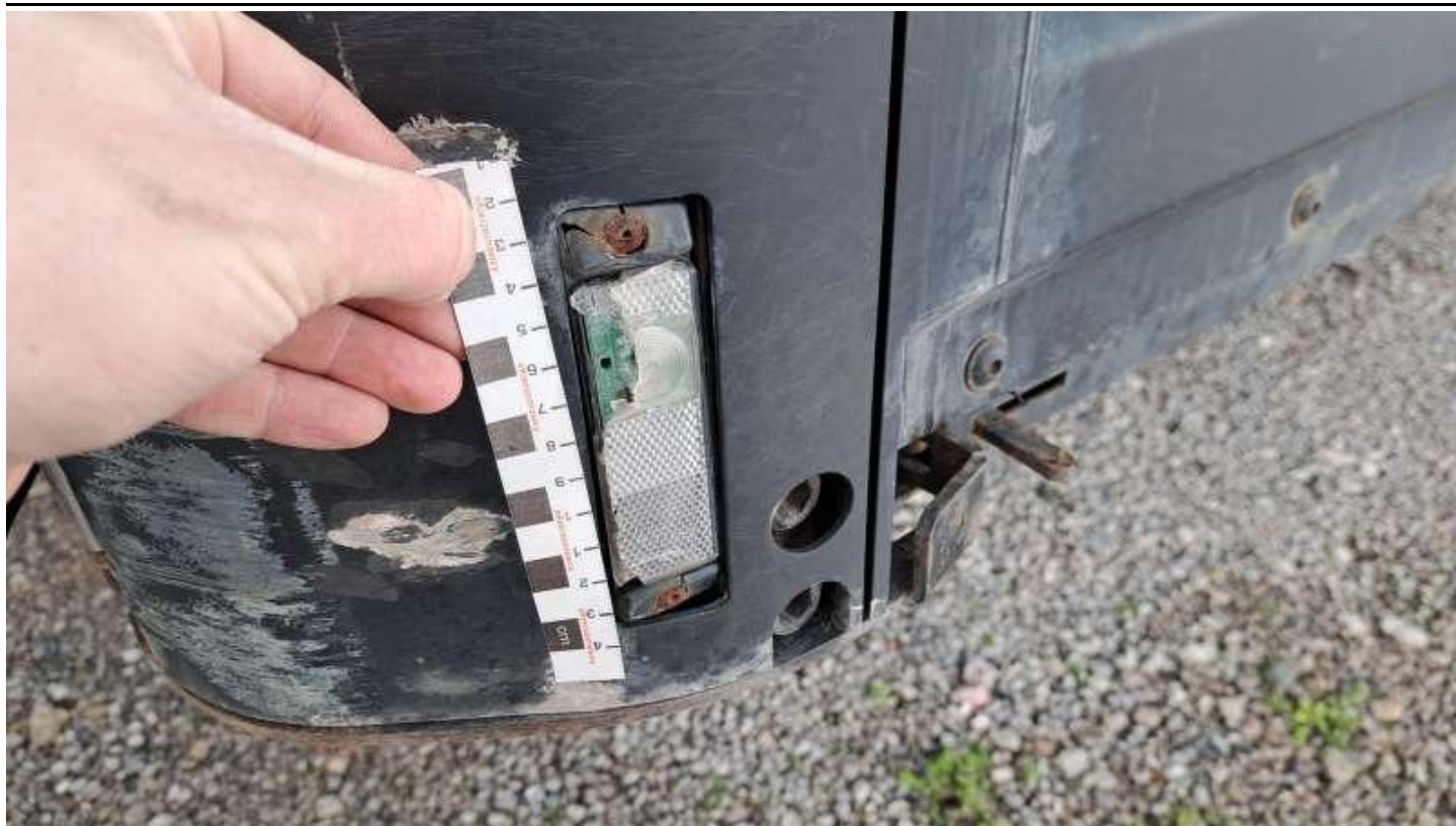
Fot. nr 13