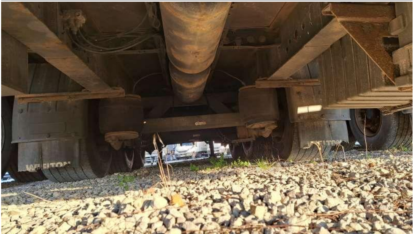
Fot. nr 57