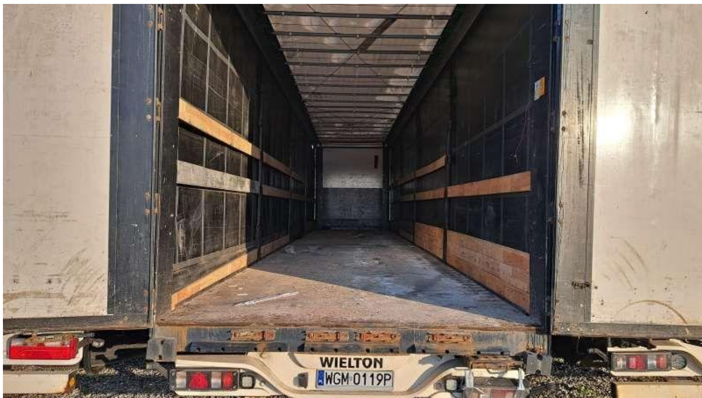
Fot. nr 62