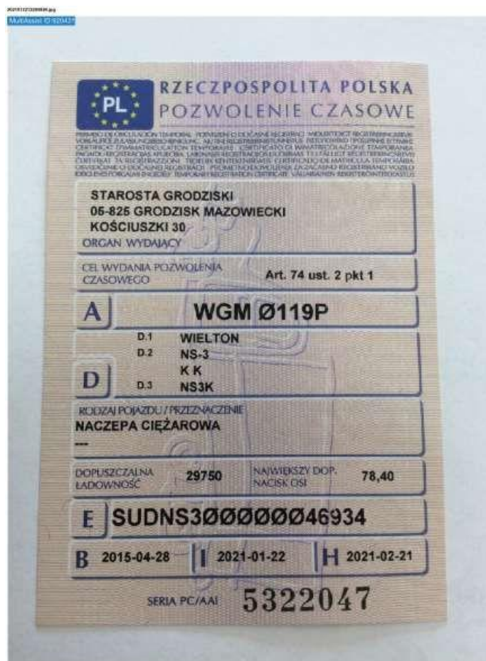
Fot. nr 82