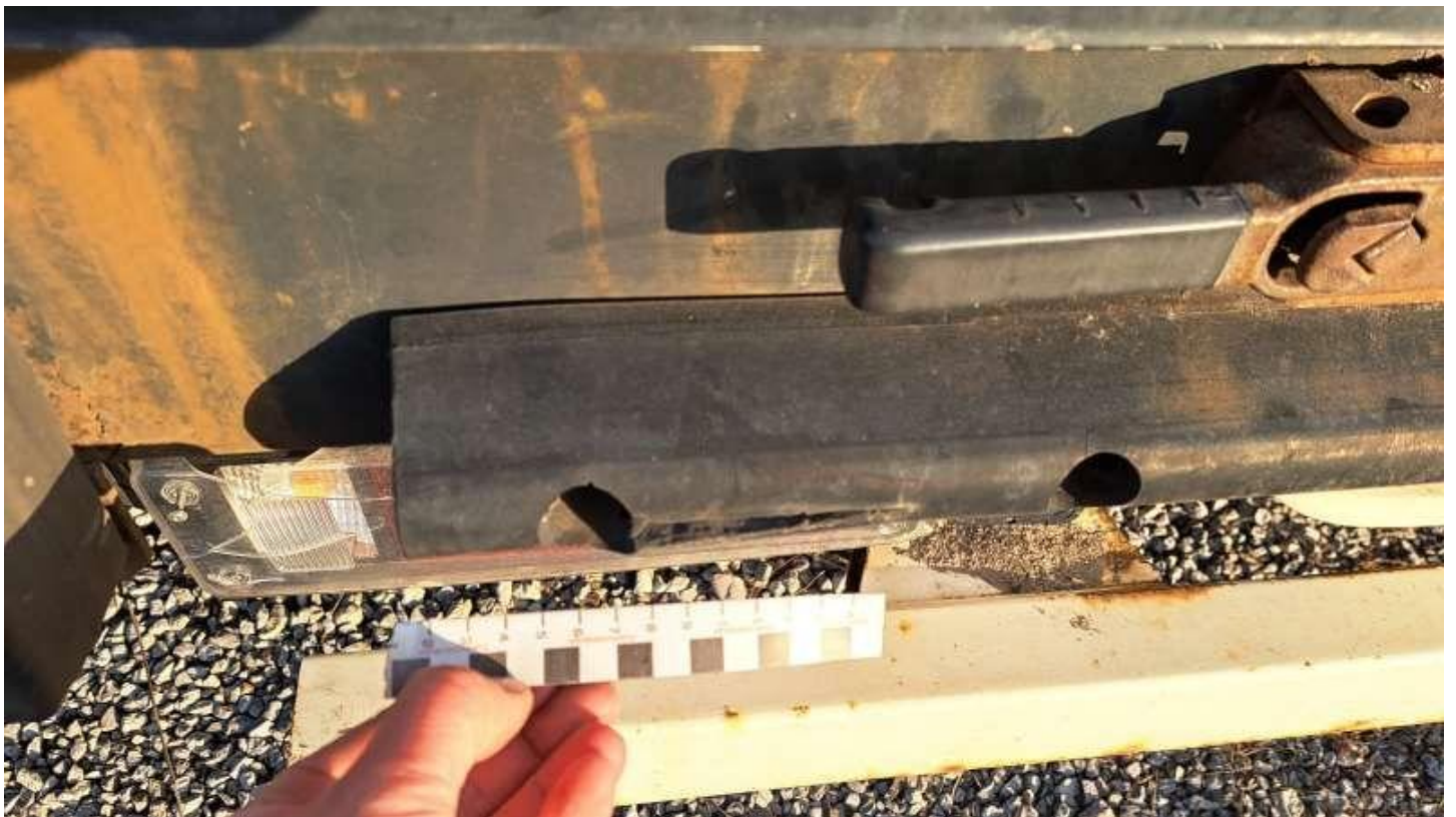
Fot. nr 46