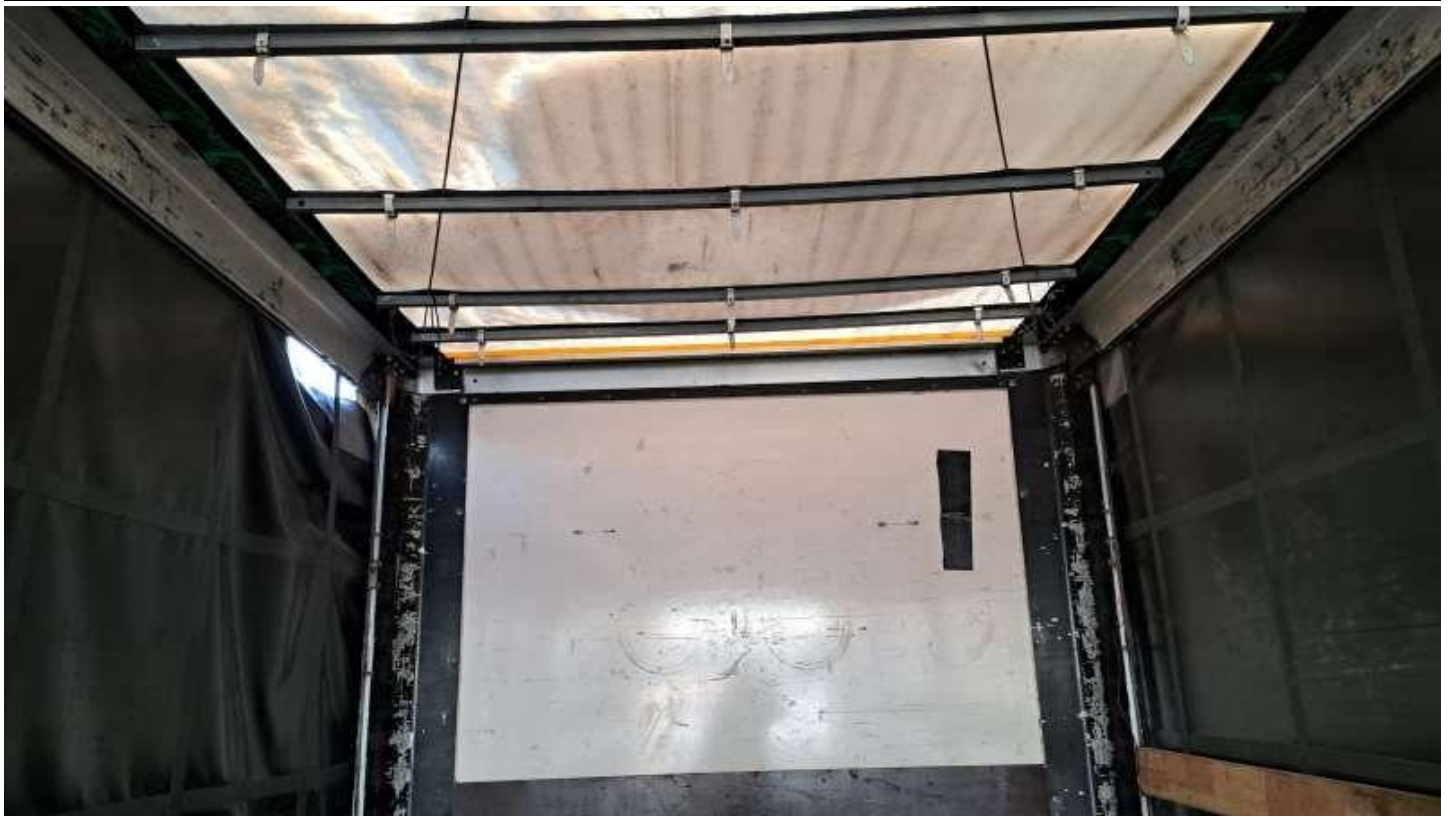
Fot. nr 69