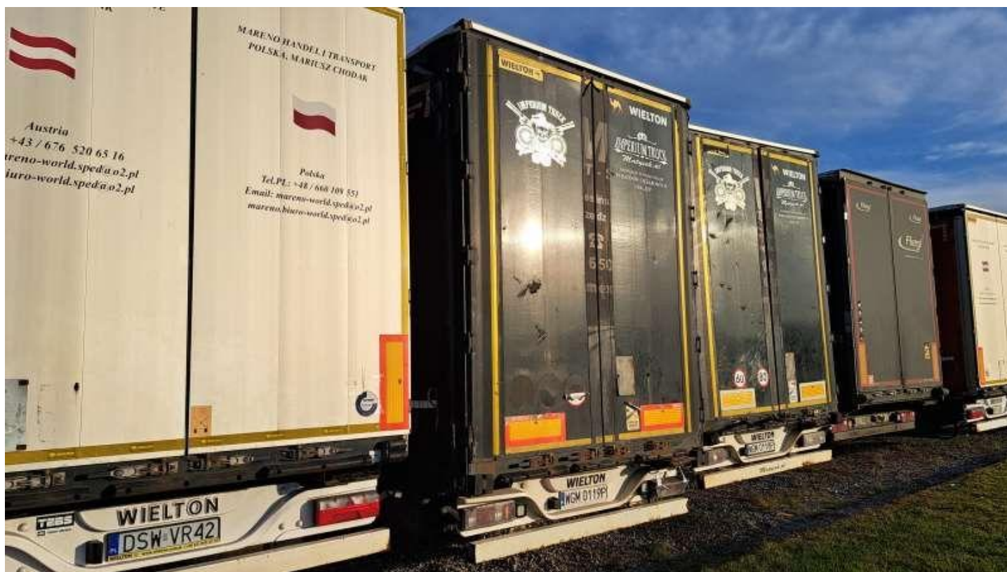
Fot. nr 6