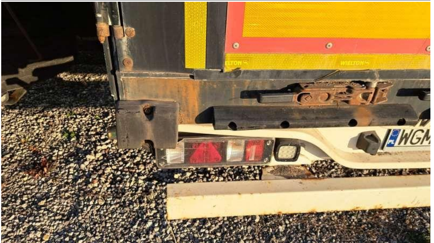
Fot. nr 45