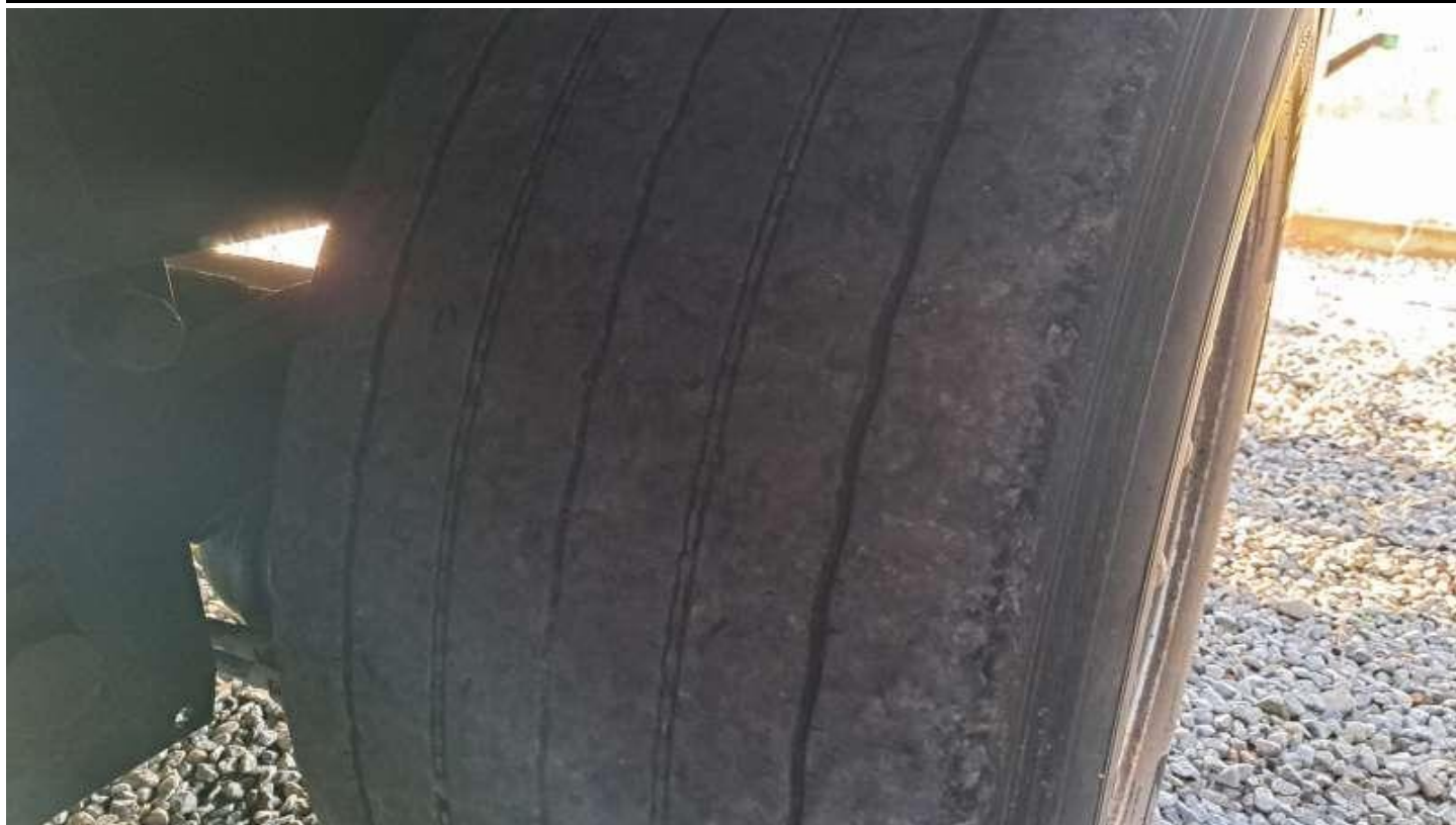
Fot. nr 79