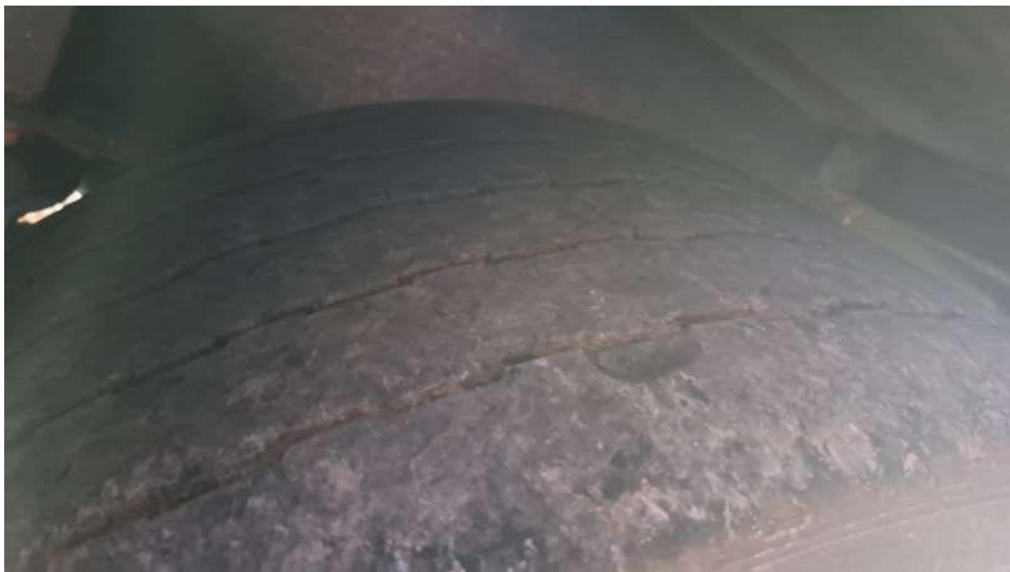
Fot. nr 76