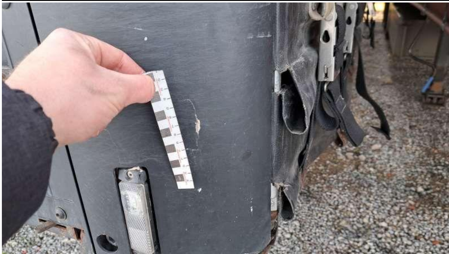
Fot. nr 15