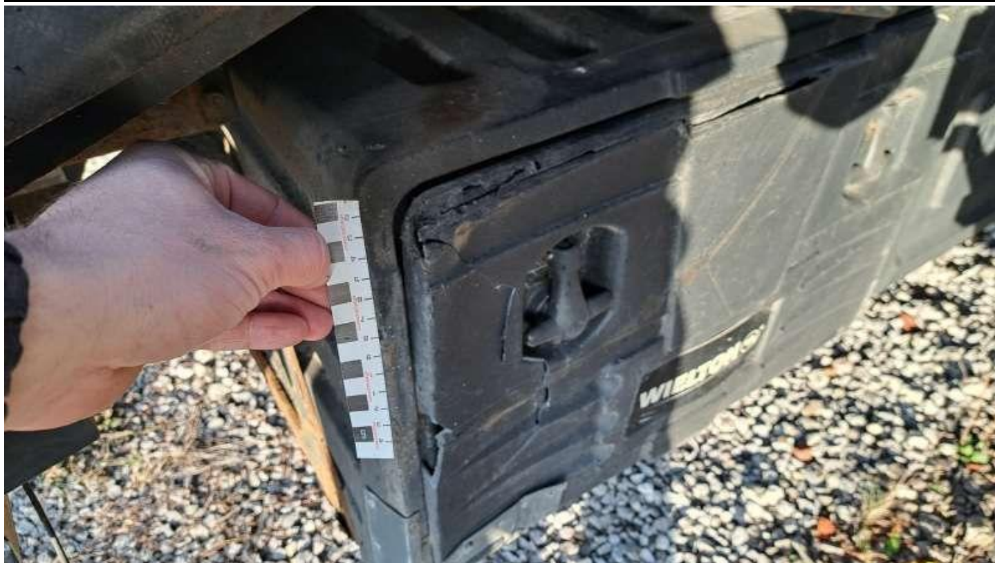
Fot. nr 33