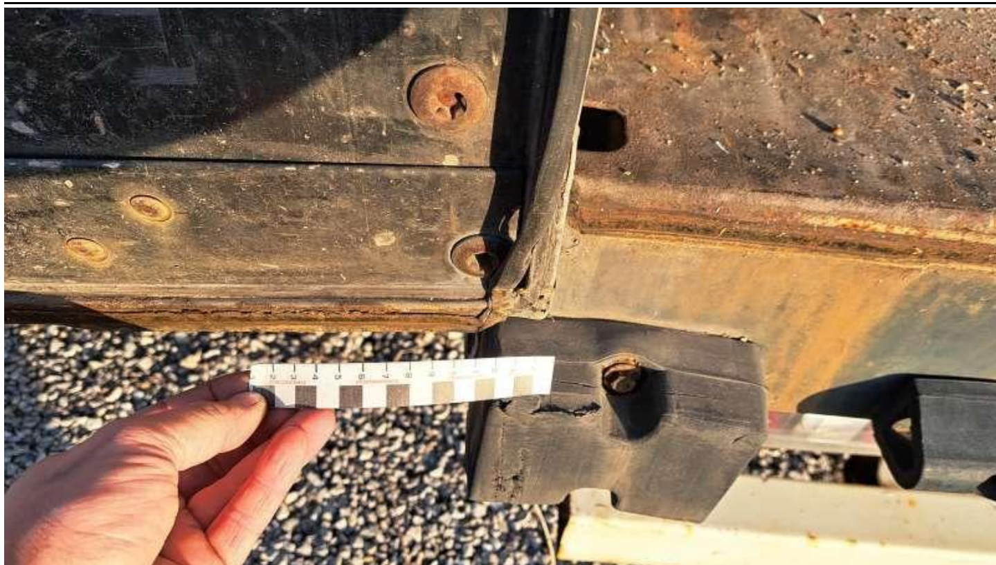
Fot. nr 61