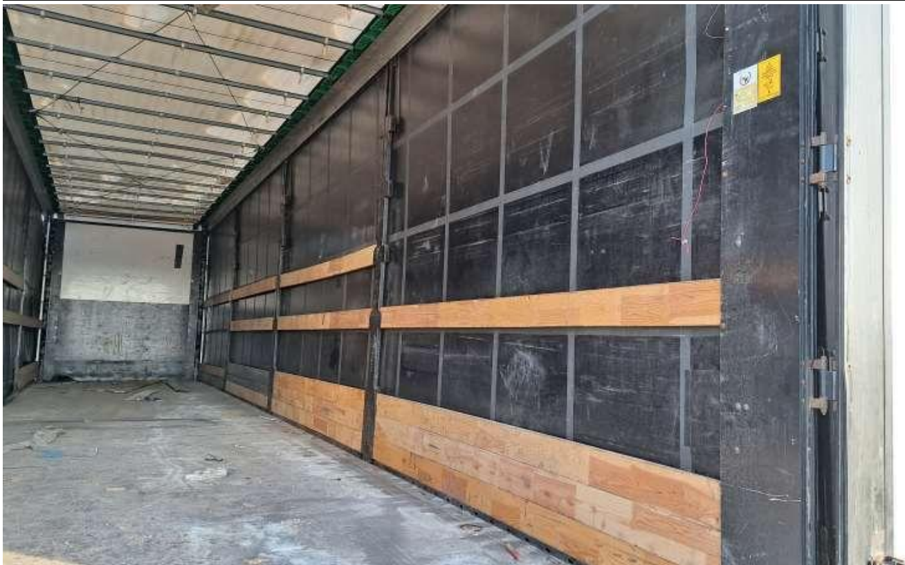
Fot. nr 65