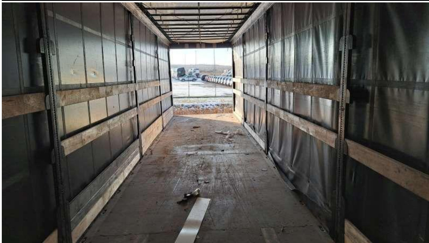
Fot. nr 71