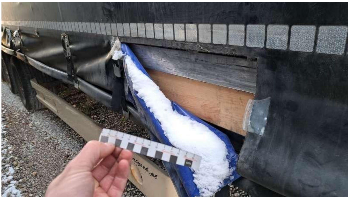
Fot. nr 22