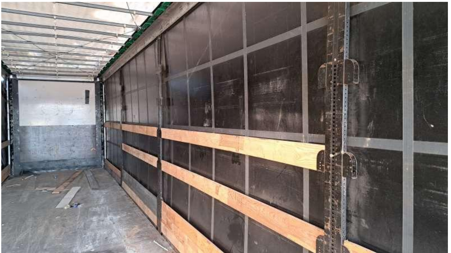
Fot. nr 68