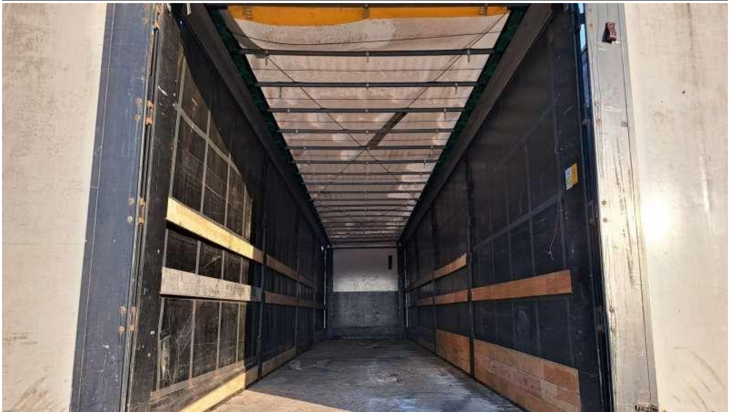
Fot. nr 63