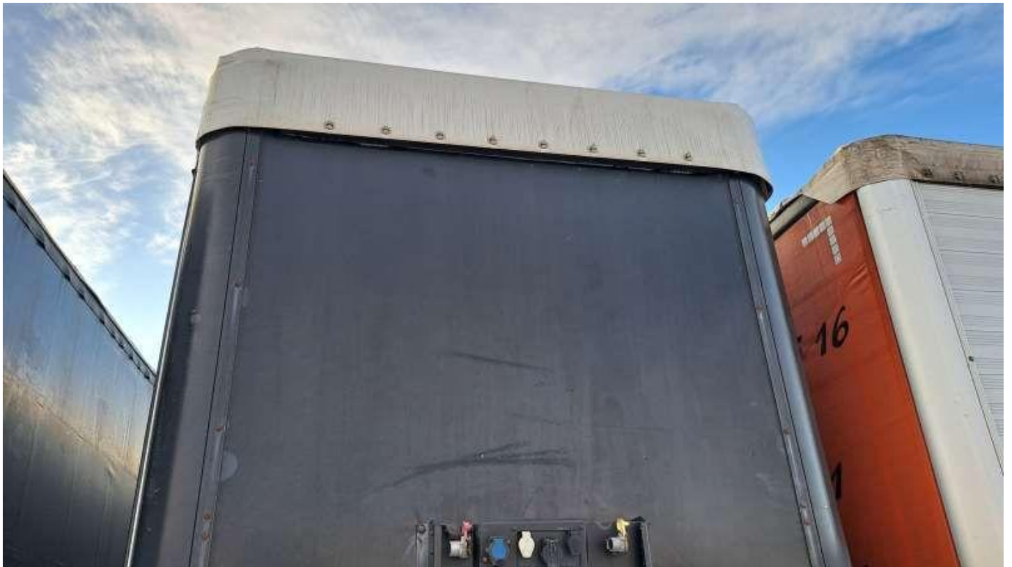
Fot. nr 10