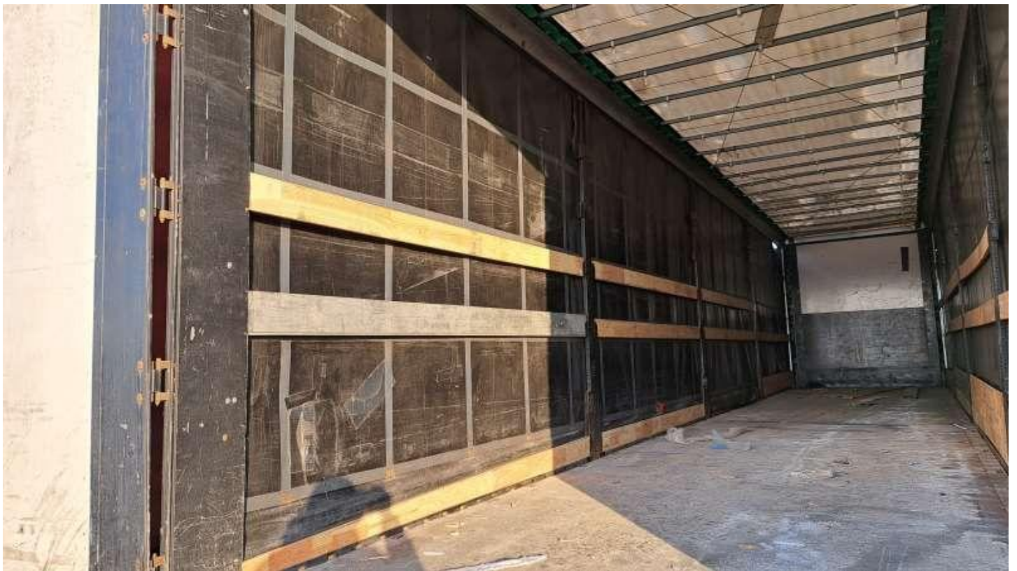
Fot. nr 64