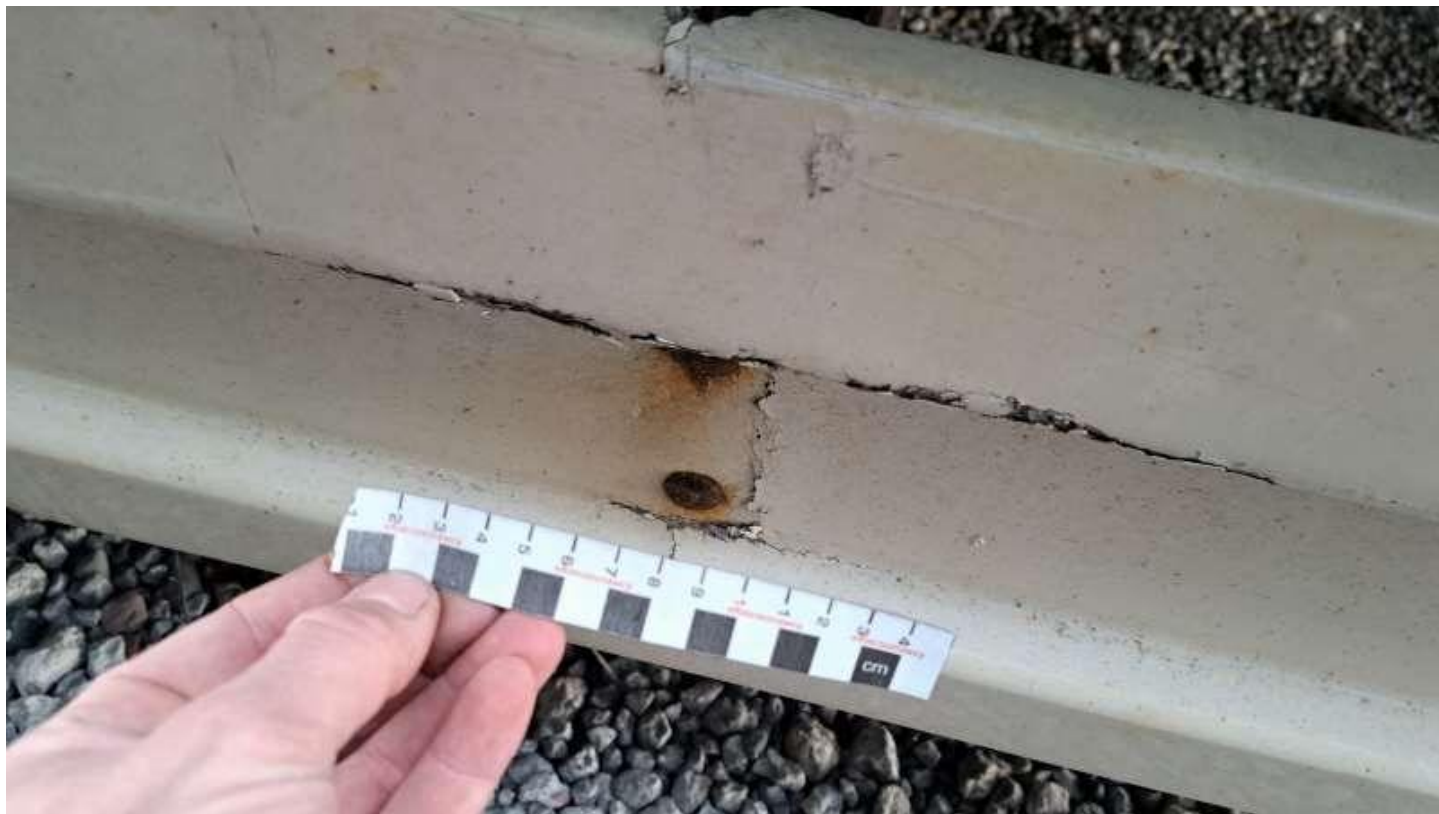
Fot. nr 24