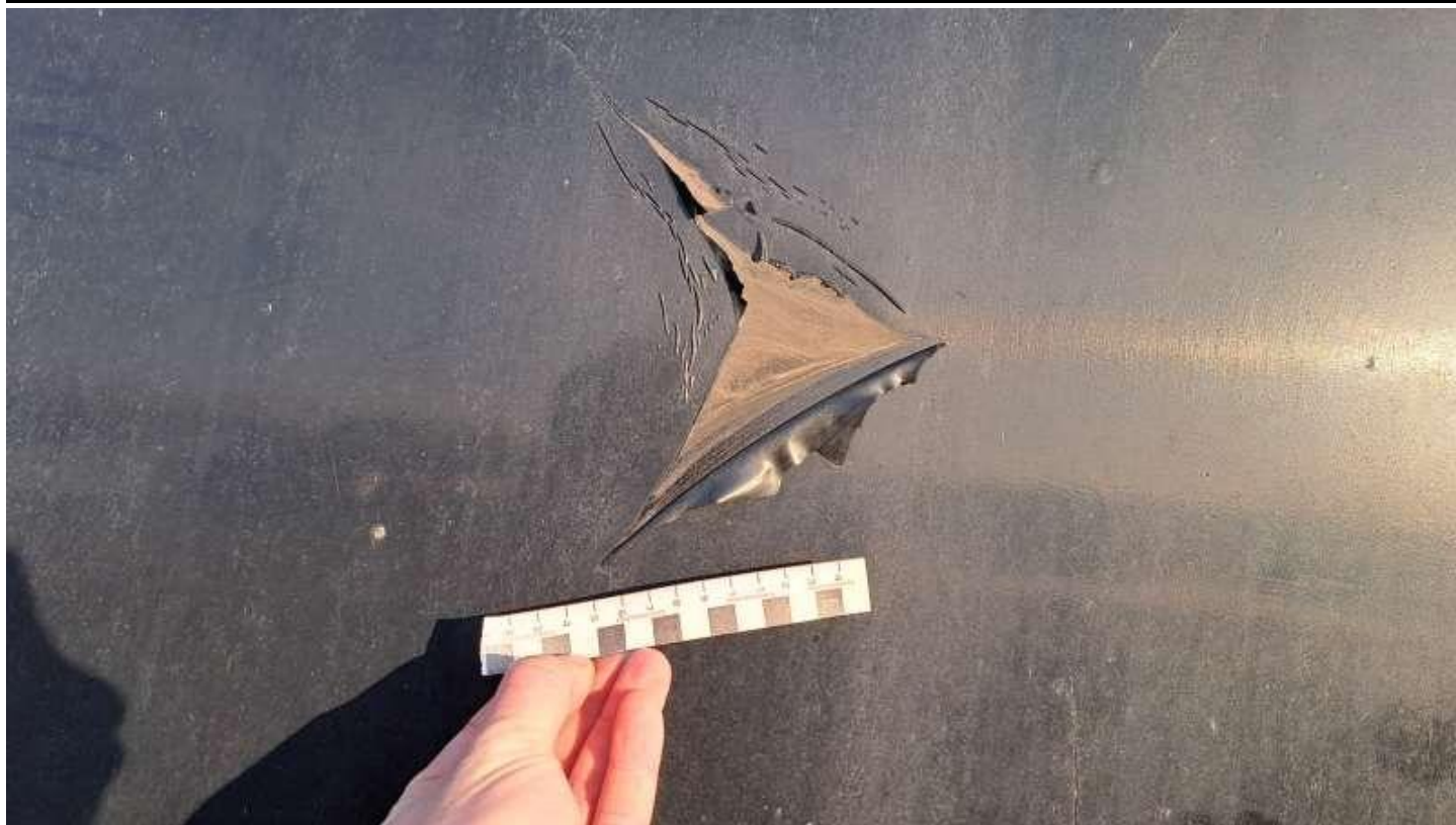
Fot. nr 51