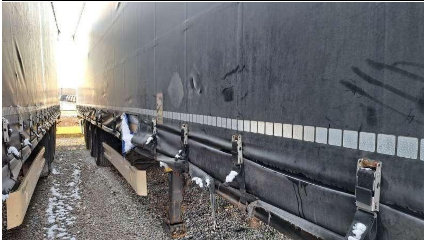
Fot. nr 19