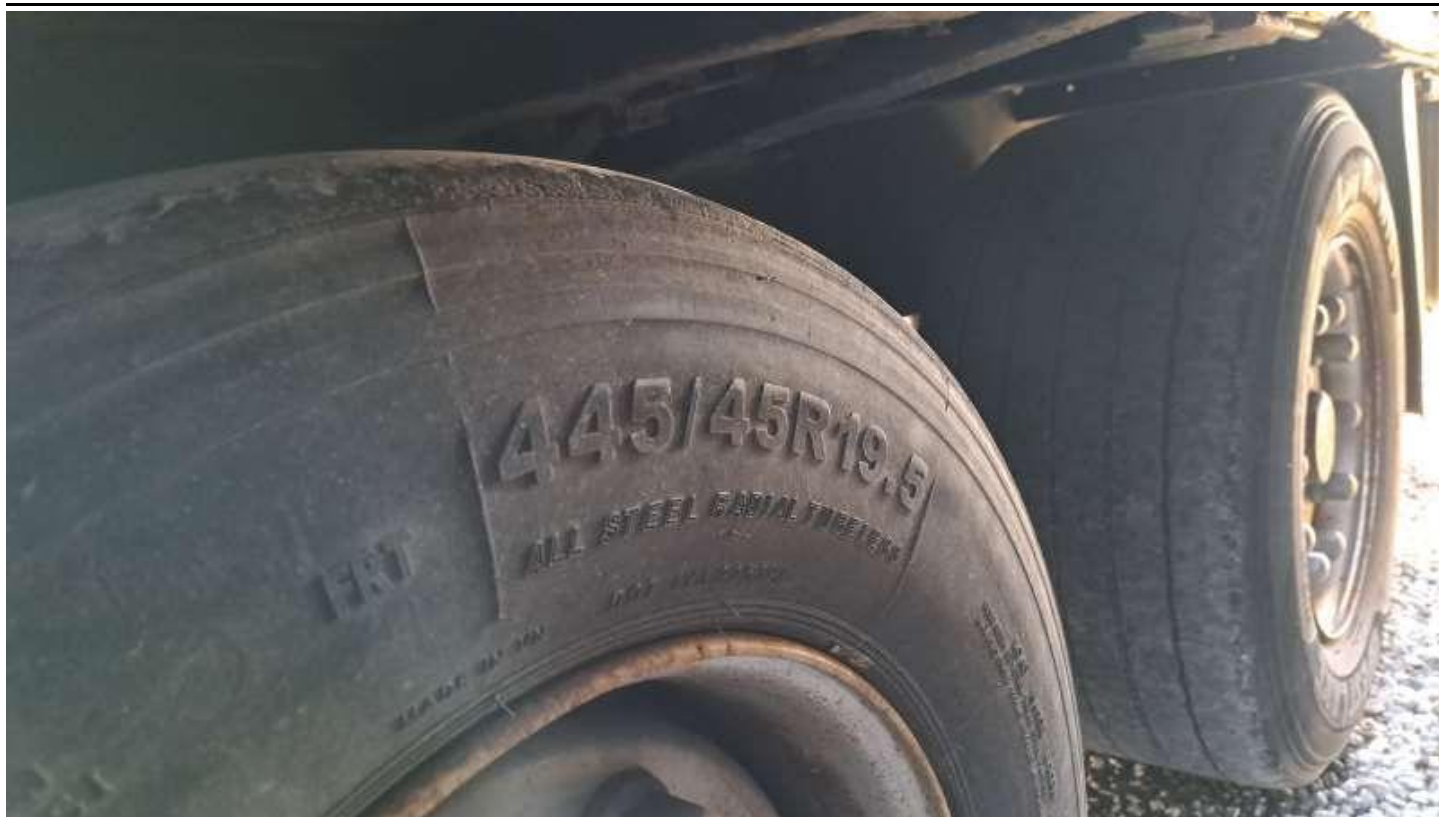
Fot. nr 77