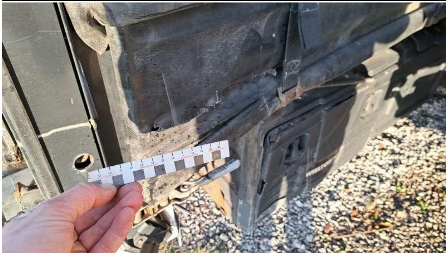
Fot. nr 35