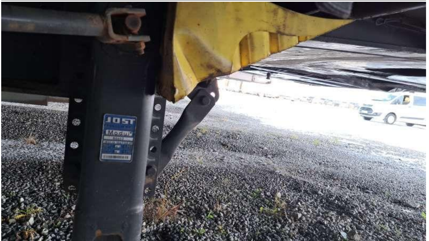
Fot. nr 25