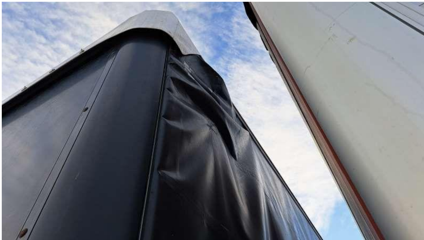
Fot. nr 16