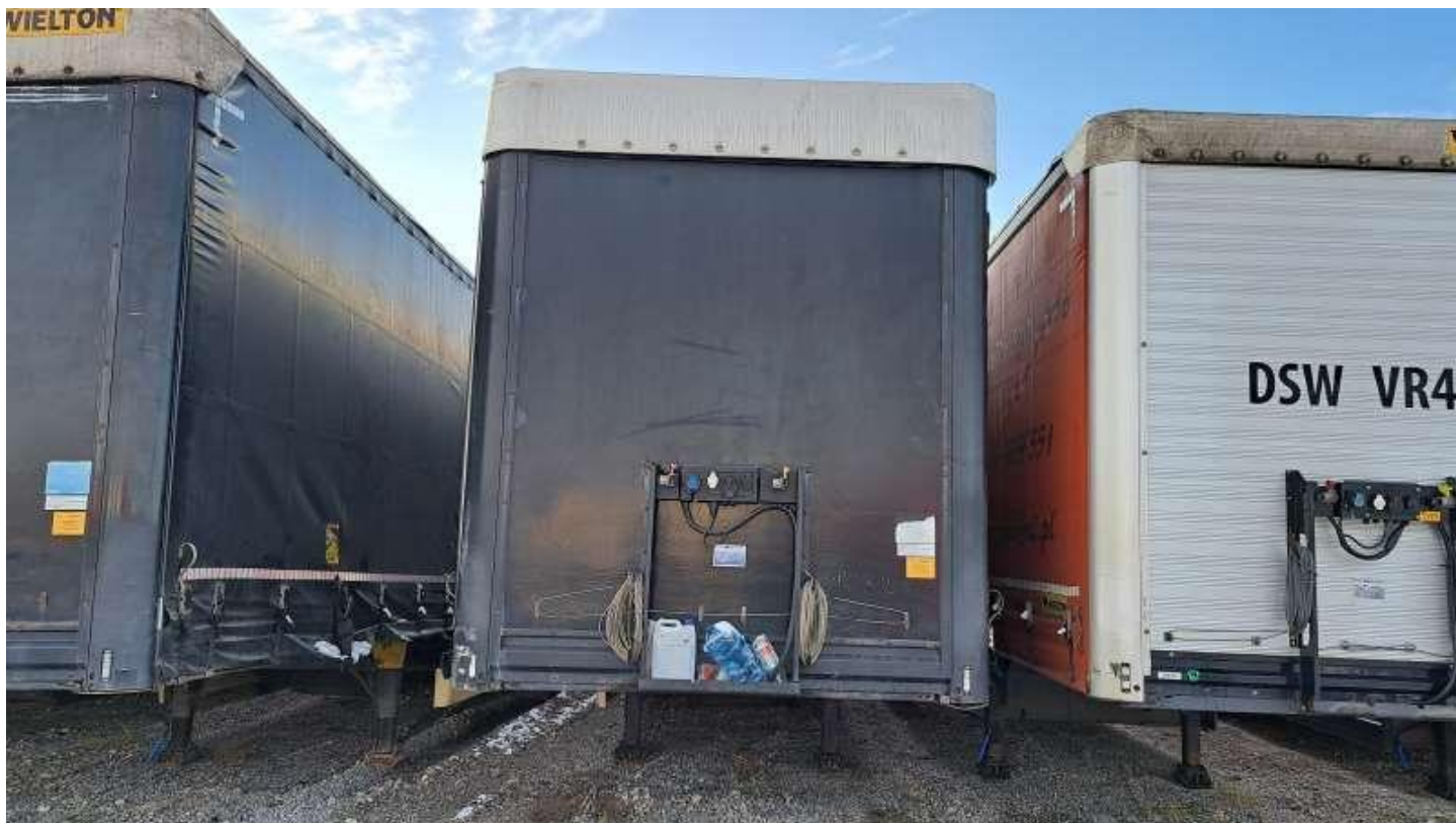
Fot. nr 2