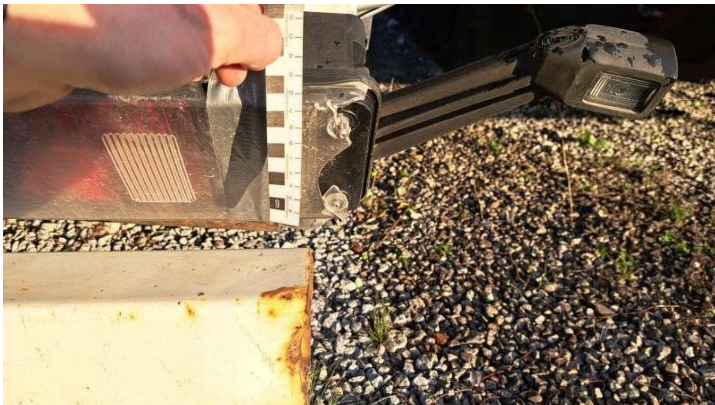
Fot. nr 40