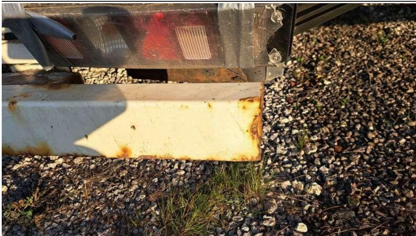
Fot. nr 41