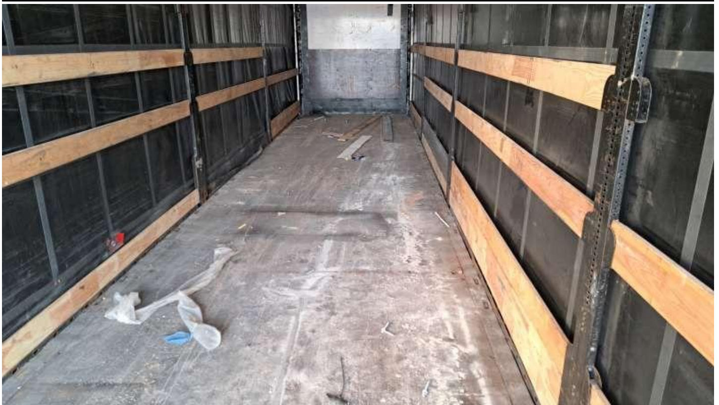
Fot. nr 67