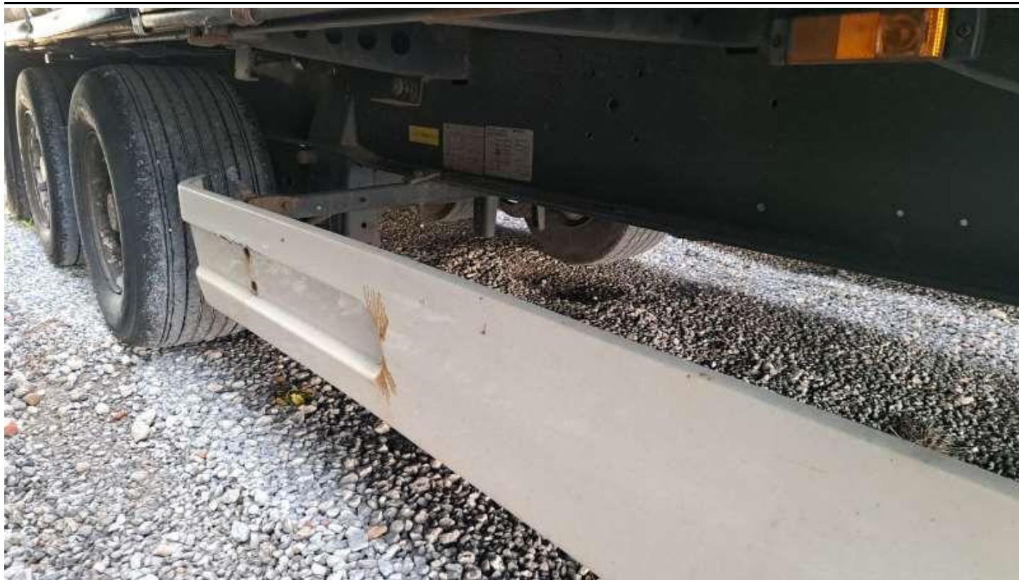
Fot. nr 23