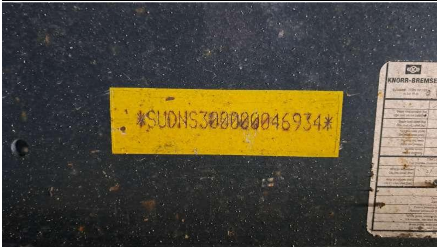
Fot. nr 7