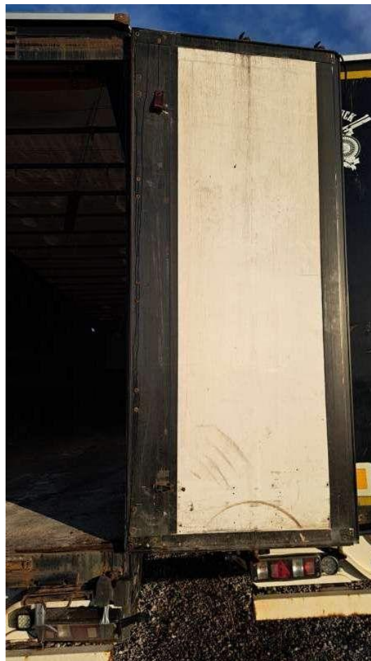
Fot. nr 58