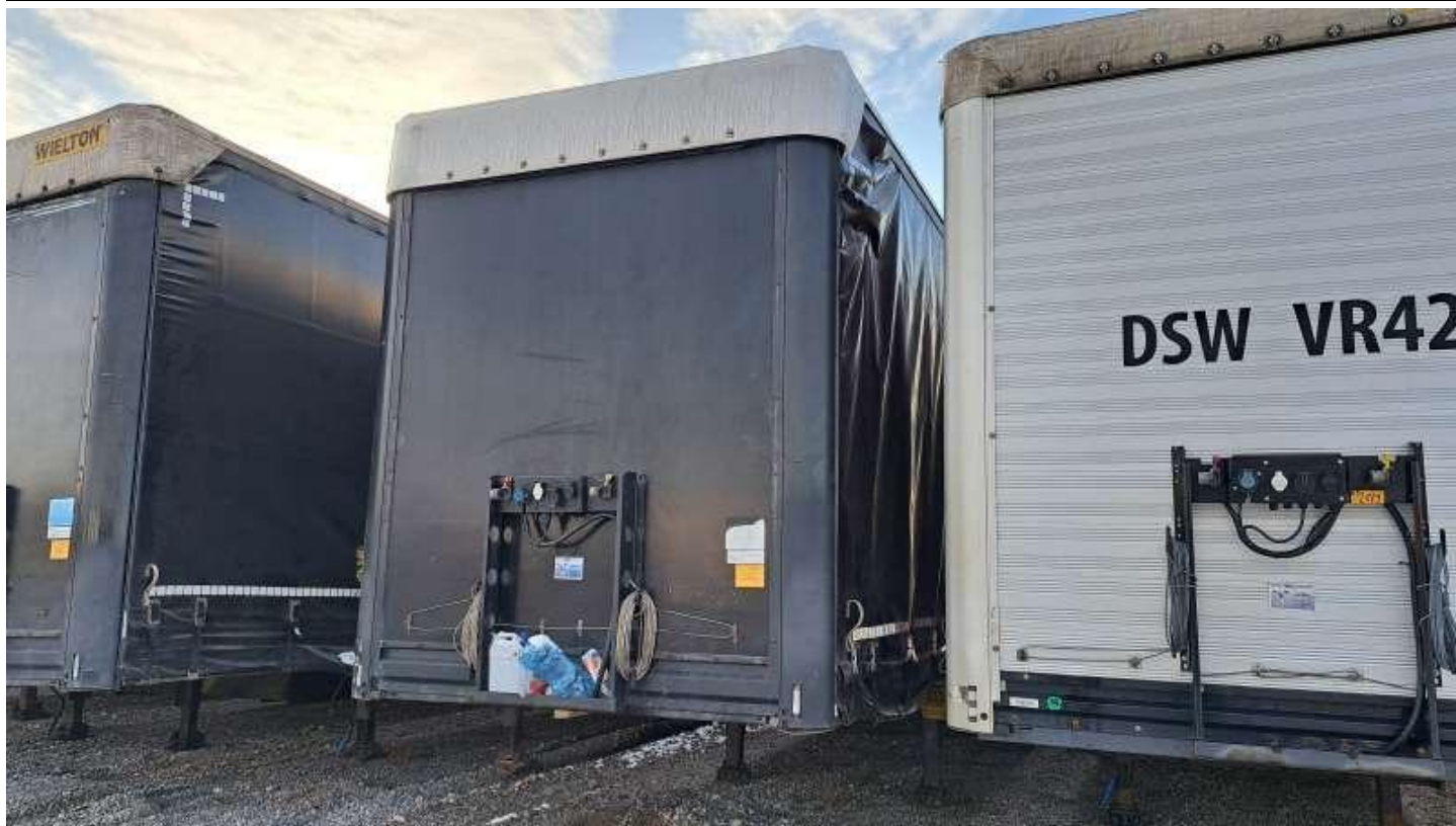
Fot. nr 1