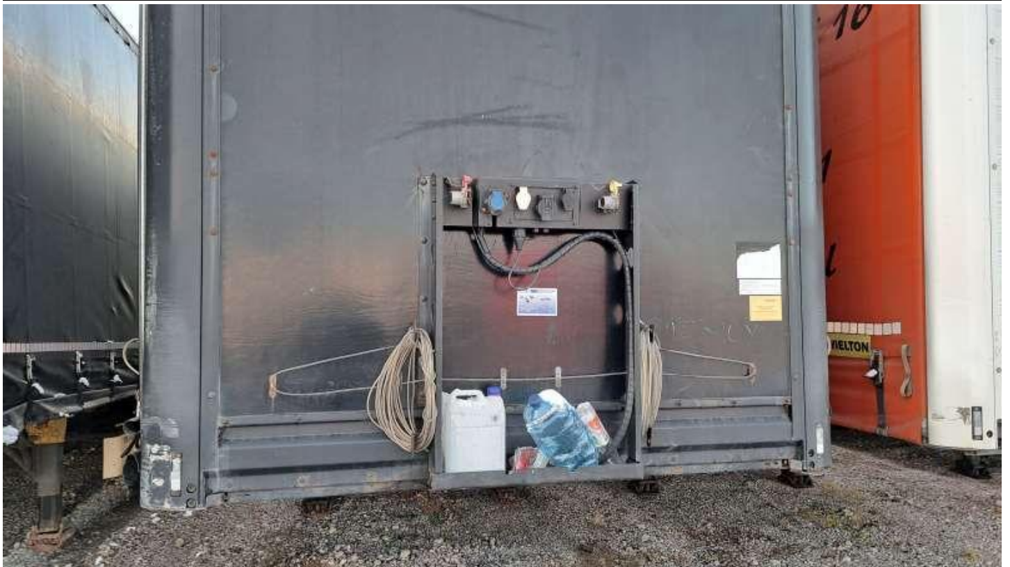
Fot. nr 9