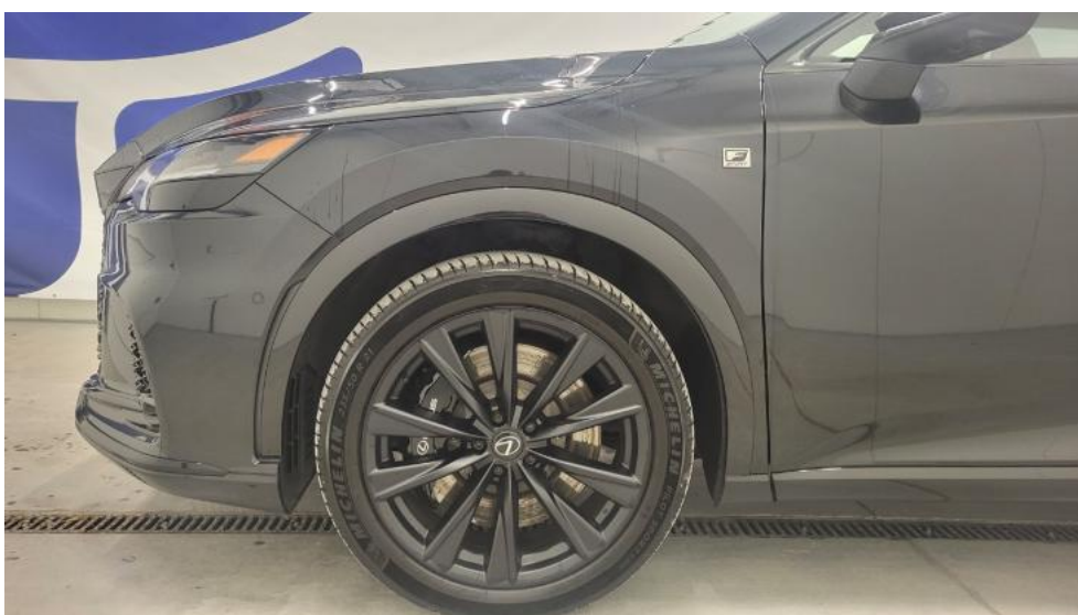
Photo 10. Bok lewy z przodu