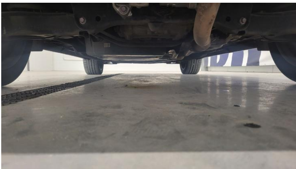
Photo 14. Spód pojazdu tył