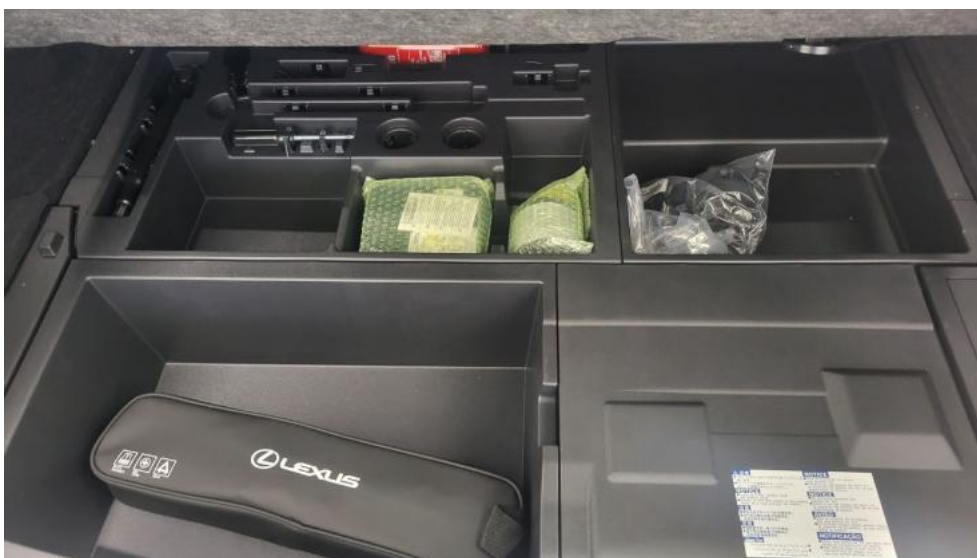
Photo 20. Koło zapasowe