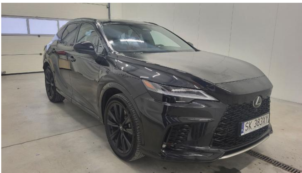
Photo 3. Przekątna przednia prawa