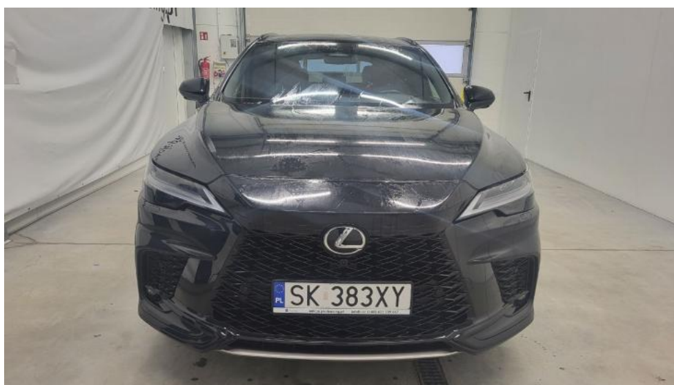
Photo 2. Przód