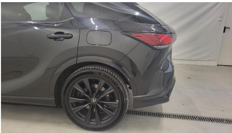
Photo 9. Bok lewy z tyłu