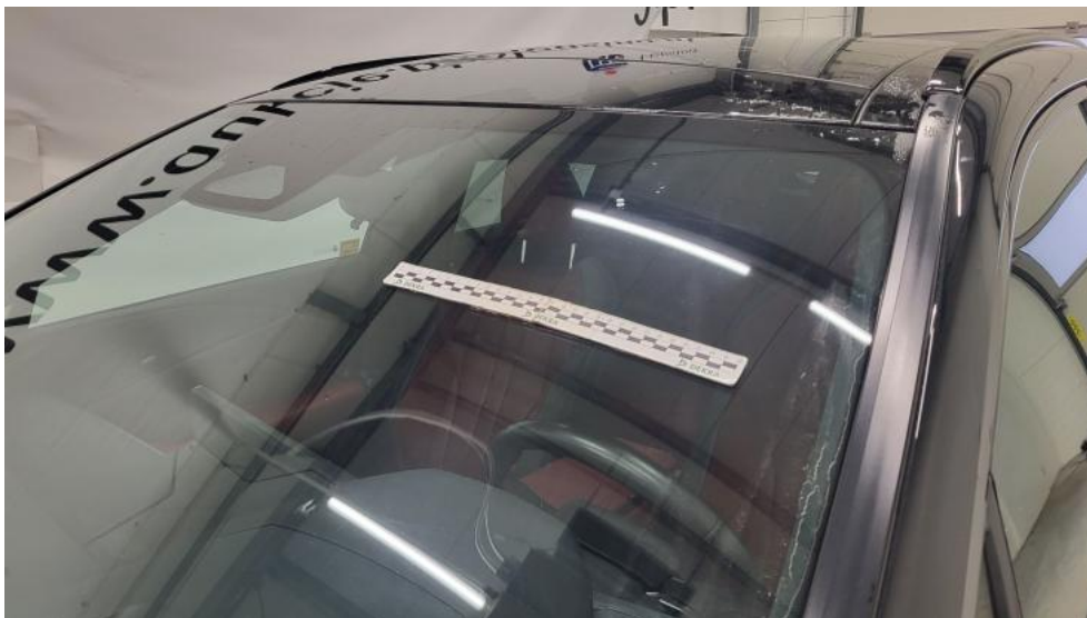
Photo 41. Szyba czołowa - zdjęcie poglądowe 1