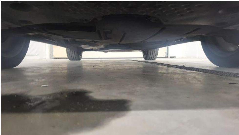
Photo 13. Spód pojazdu przód