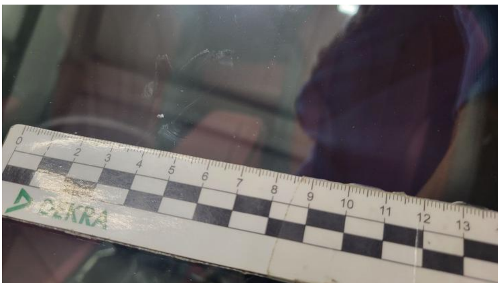
Photo 42. Szyba czołowa - Rysa/odprysk 1