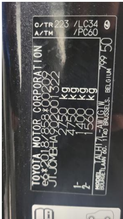
Photo 23. Tabliczka znamionowa