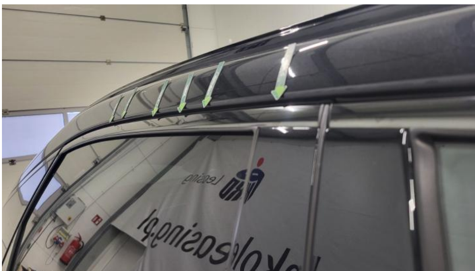
Photo 50. Drzwi tylne P - Wgniecenie/odkształcenie 2