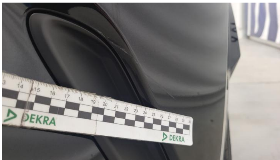
Photo 53. Zderzak tylny - Rysa/odprysk 2