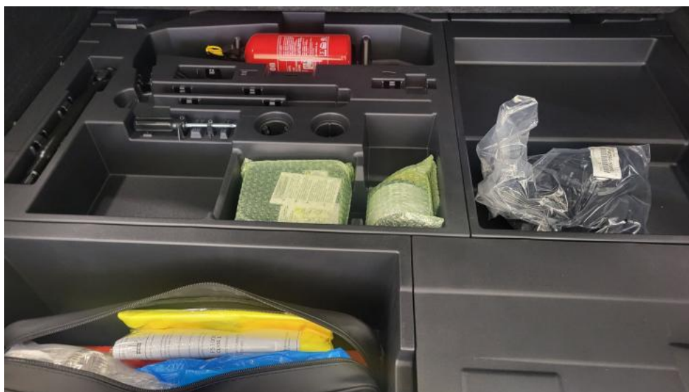
Photo 34. Zestaw naprawy koła