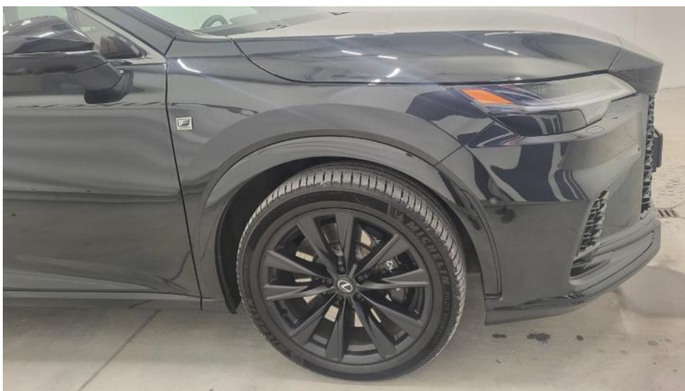
Photo 4. Bok prawy z przodu