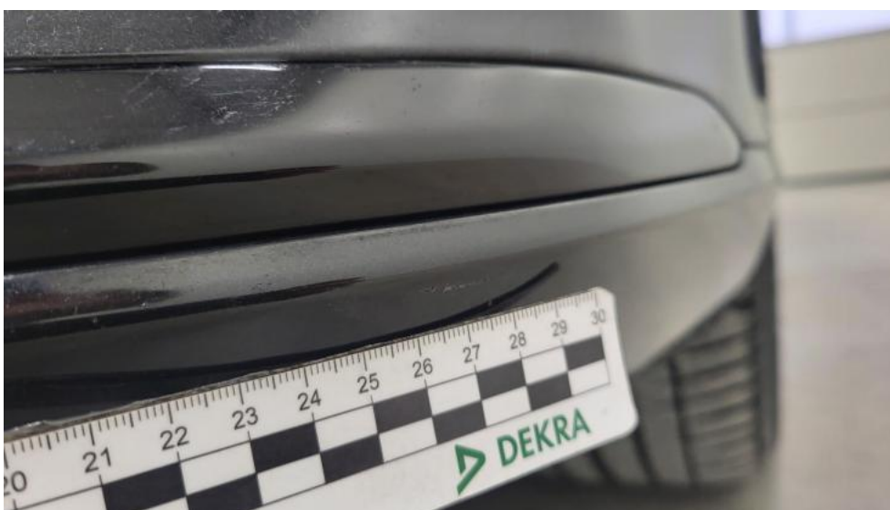
Photo 44. Zderzak - Rysa/odprysk 1