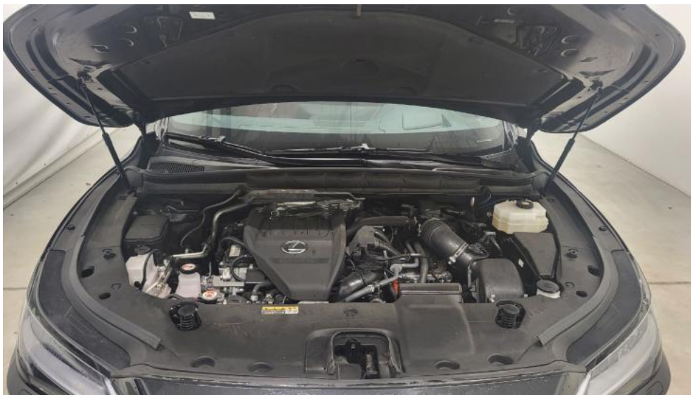
Photo 21. Komora silnika