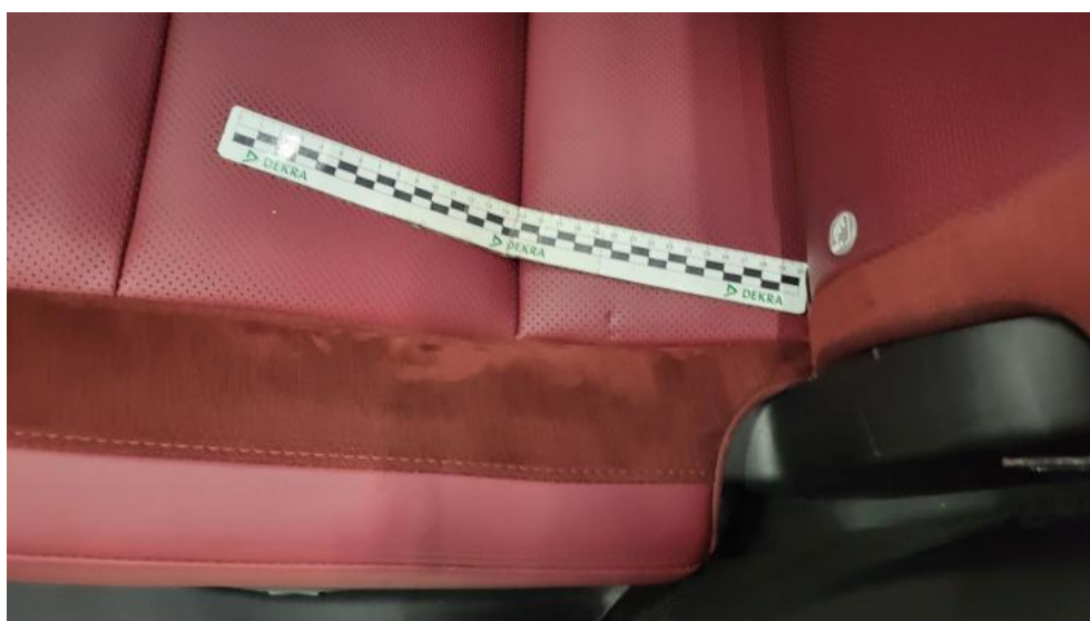
Photo 54. Kanapa tyl. - Wgniecenie/odkształcenie 1