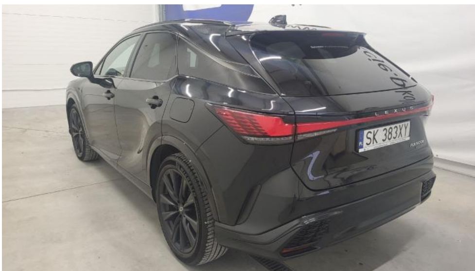
Photo 8. Przekątna tylna lewa