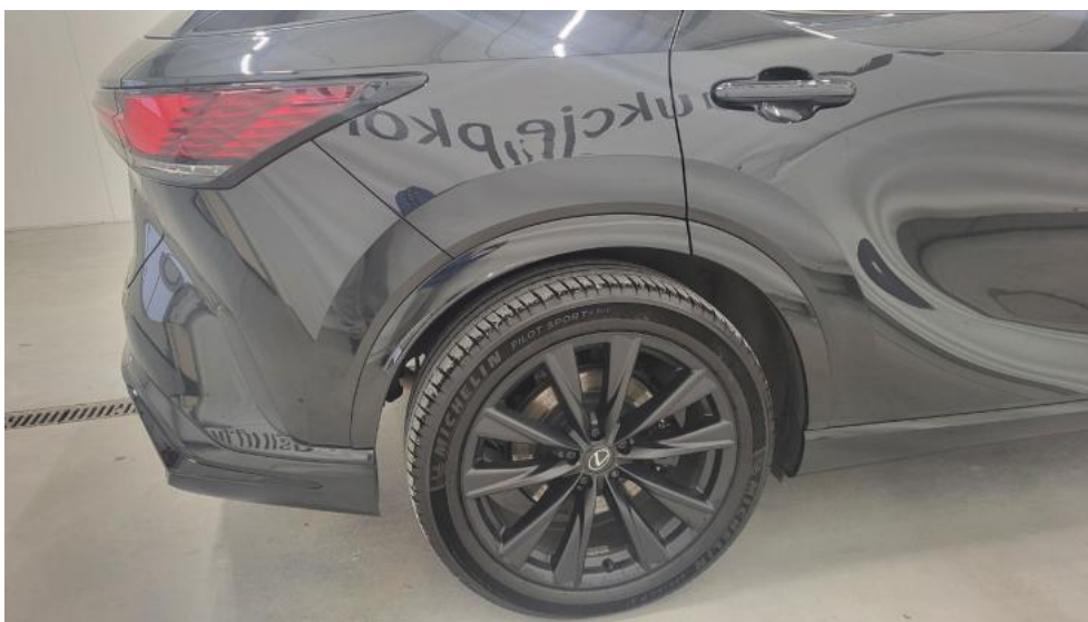
Photo 5. Bok prawy z tyłu