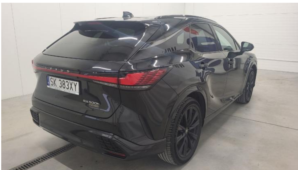
Photo 6. Przekątna tylna prawa