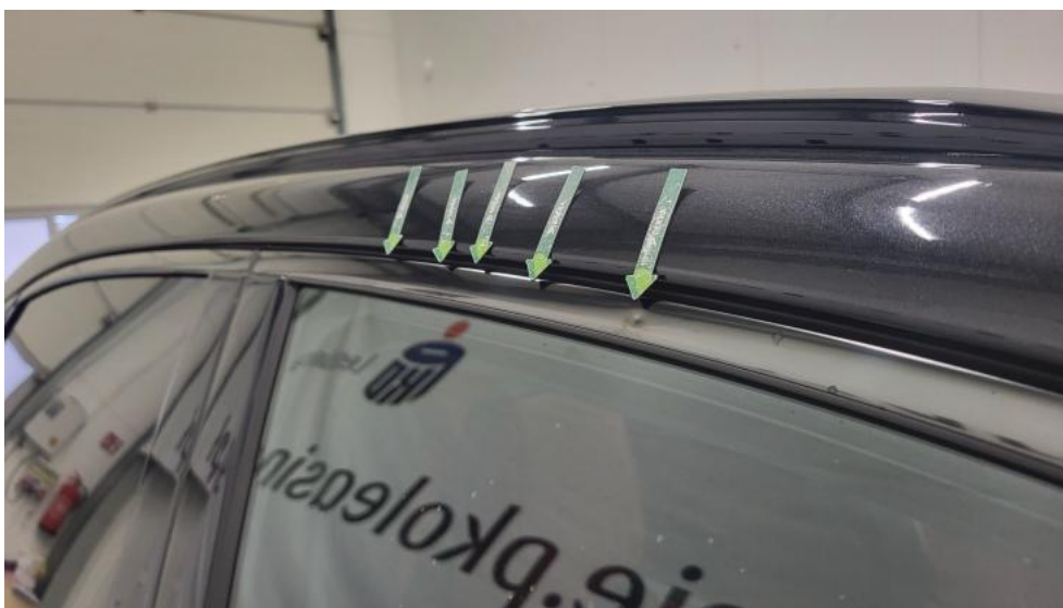
Photo 47. Drzwi przednie P - Wgniecenie/odkształcenie 2