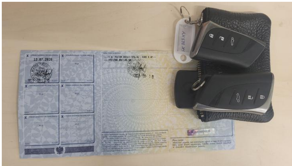
Photo 33. Dow. Rej. Str.2 i klucze