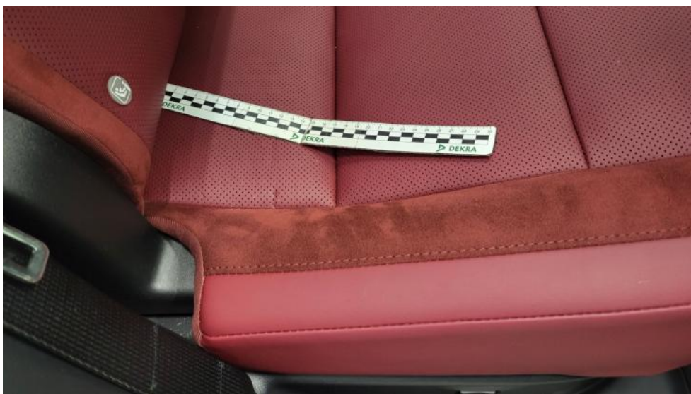
Photo 56. Kanapa tyl. - Inne 2