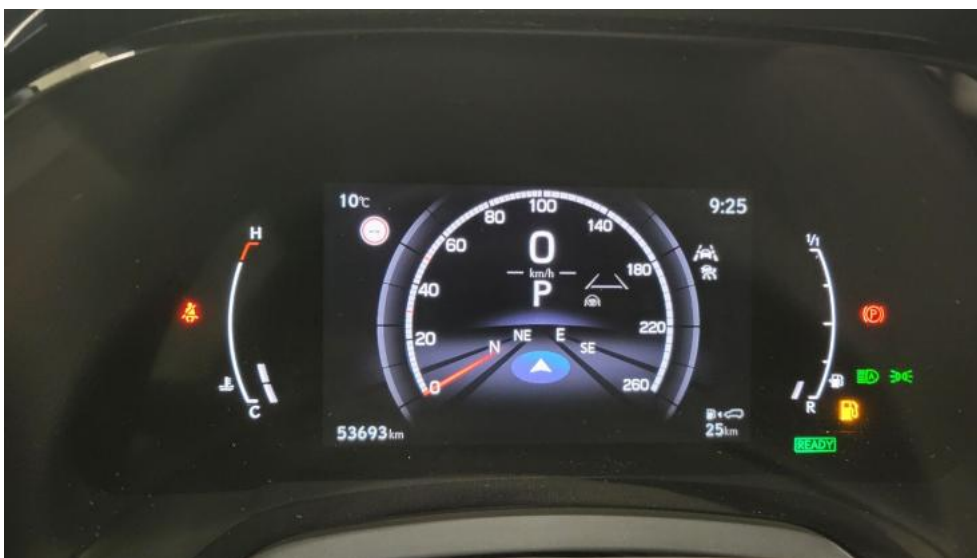
Photo 24. Zestaw wskaźników - przebieg