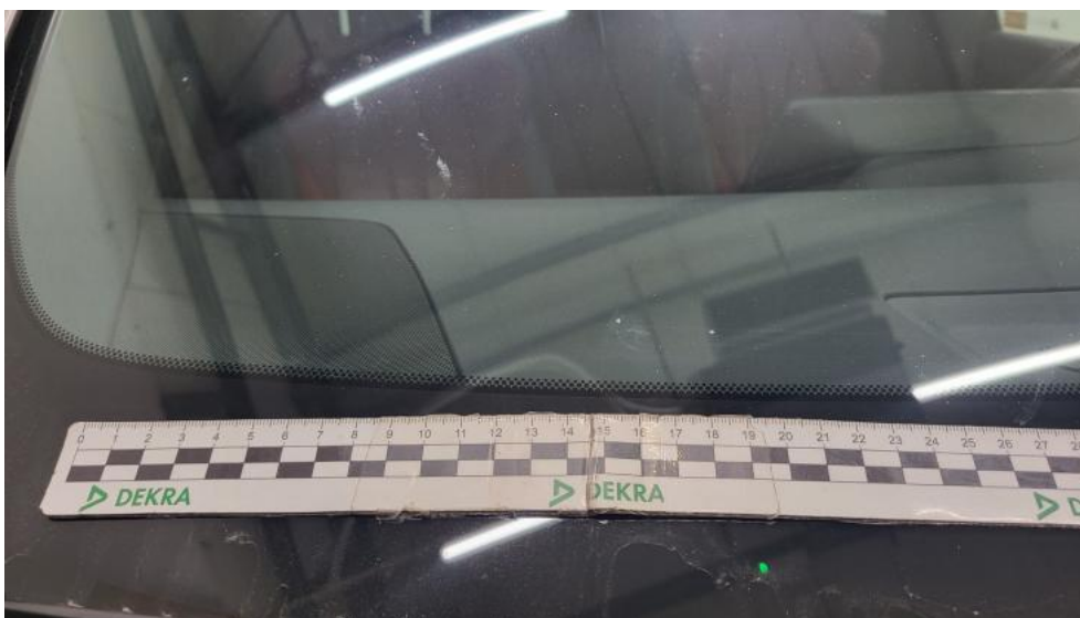
Photo 43. Szyba czołowa - Rysa/odprysk 2