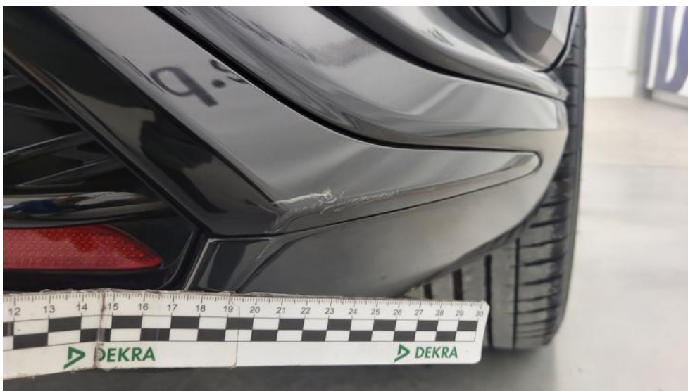
Photo 52. Zderzak tylny - Rysa/odprysk 1