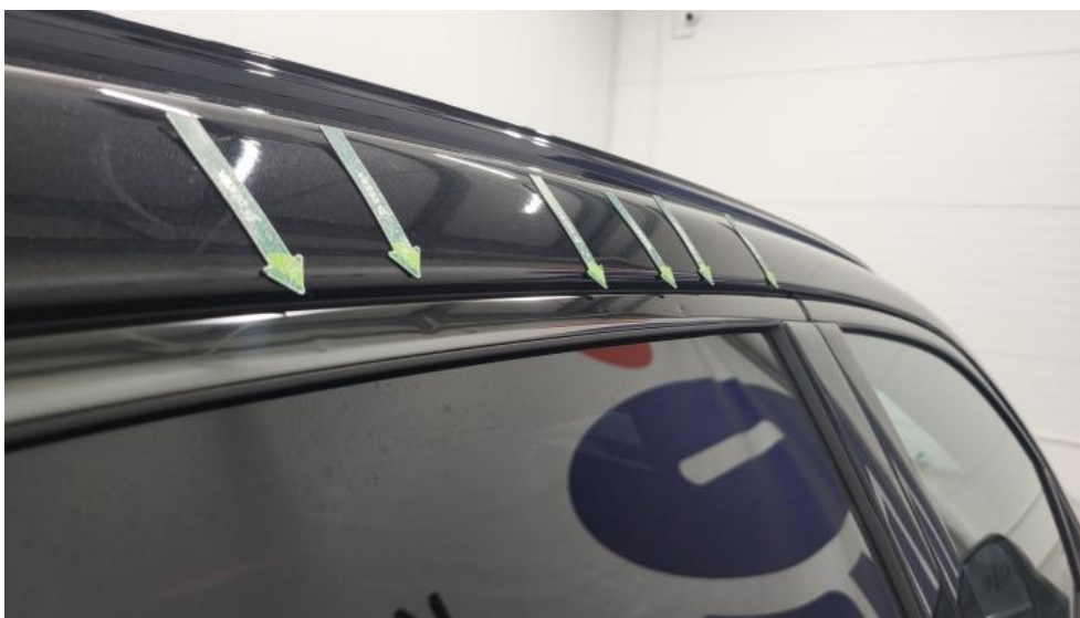
Photo 49. Drzwi tylne P - Wgniecenie/odkształcenie 1