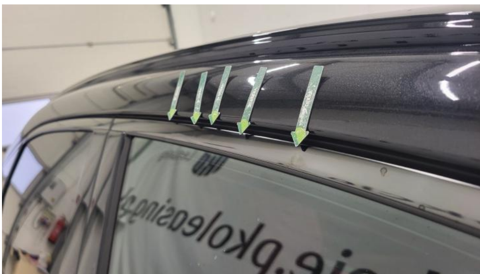
Photo 46. Drzwi przednie P - Wgniecenie/odkształcenie 1