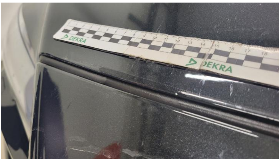
Photo 40. Pokrywa komory silnika - Rysa/odprysk 1