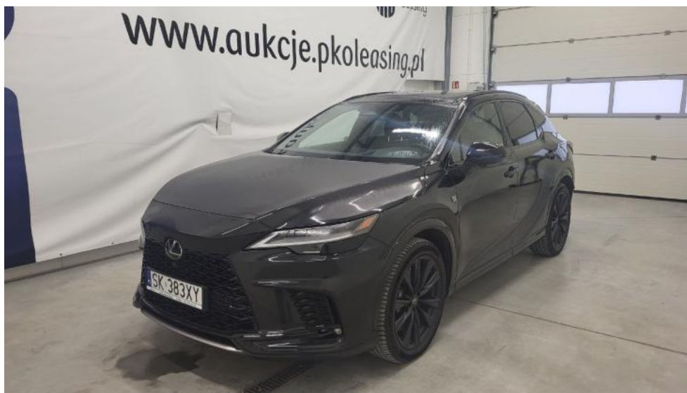
Photo 1. Przekątna przednia lewa