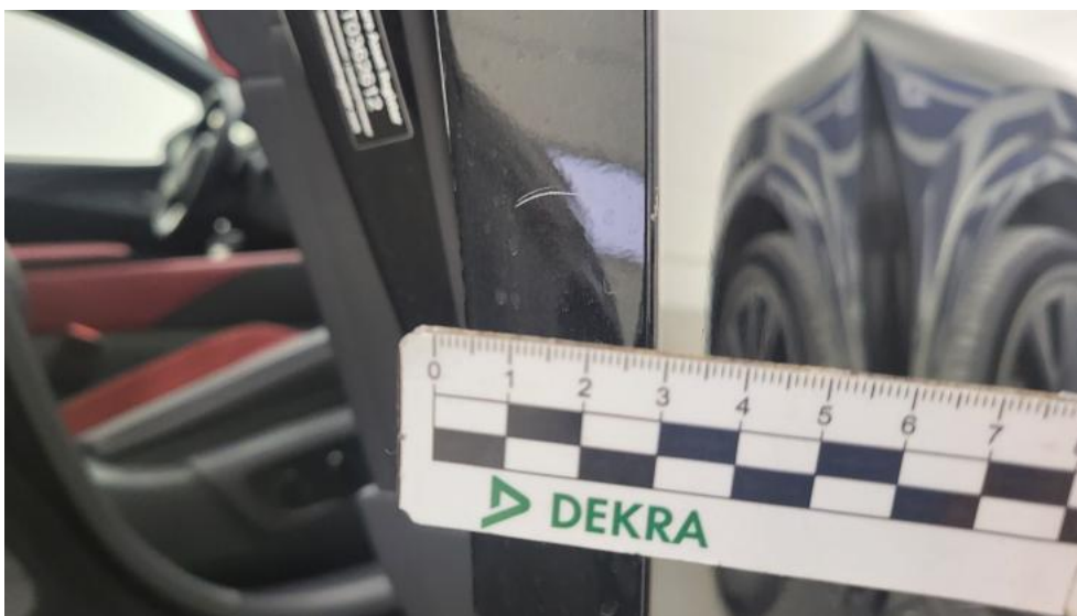
Photo 45. Drzwi przednie P - Rysa/odprysk 1