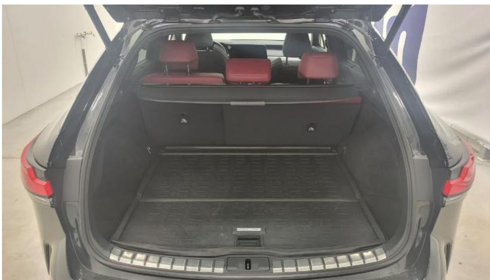
Photo 19. Bagażnik