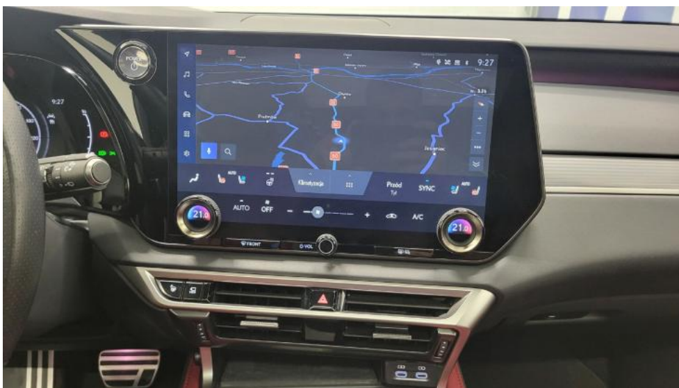
Photo 29. Konsola środkowa