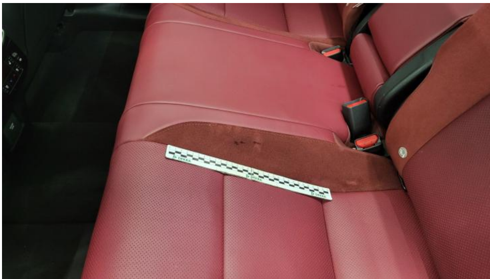
Photo 55. Kanapa tyl. - Inne 1