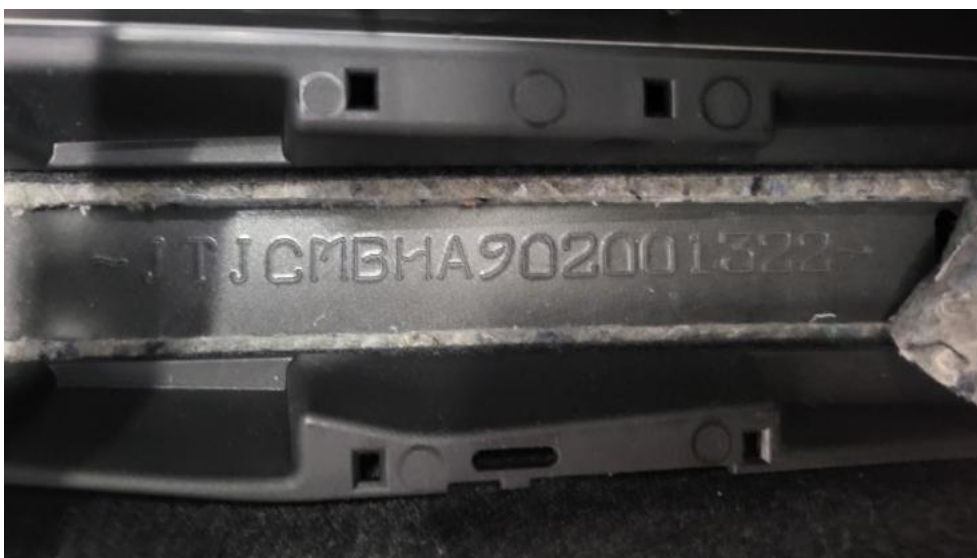
Photo 22. Numer identyfikacyjny