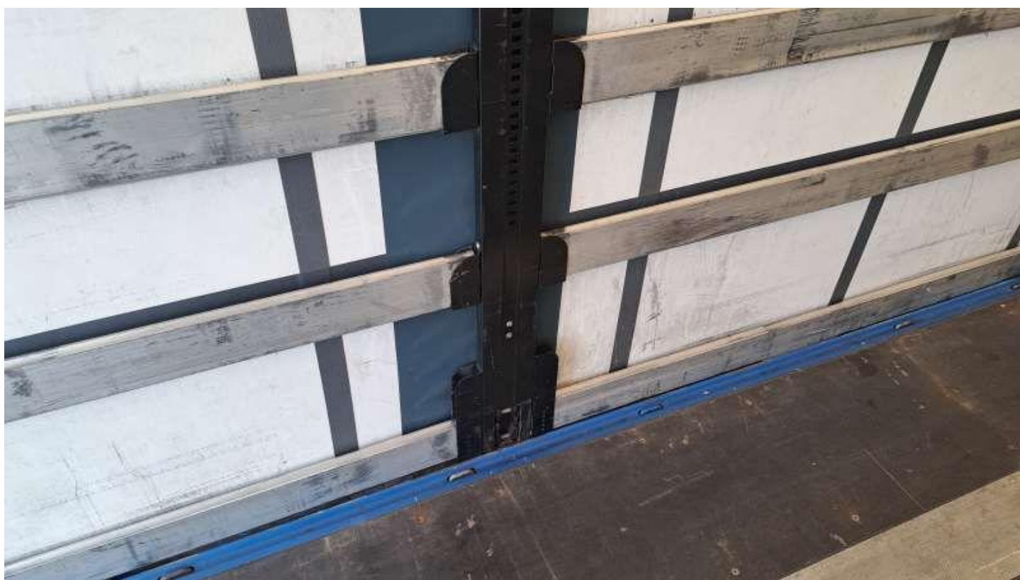
Fot. nr 44