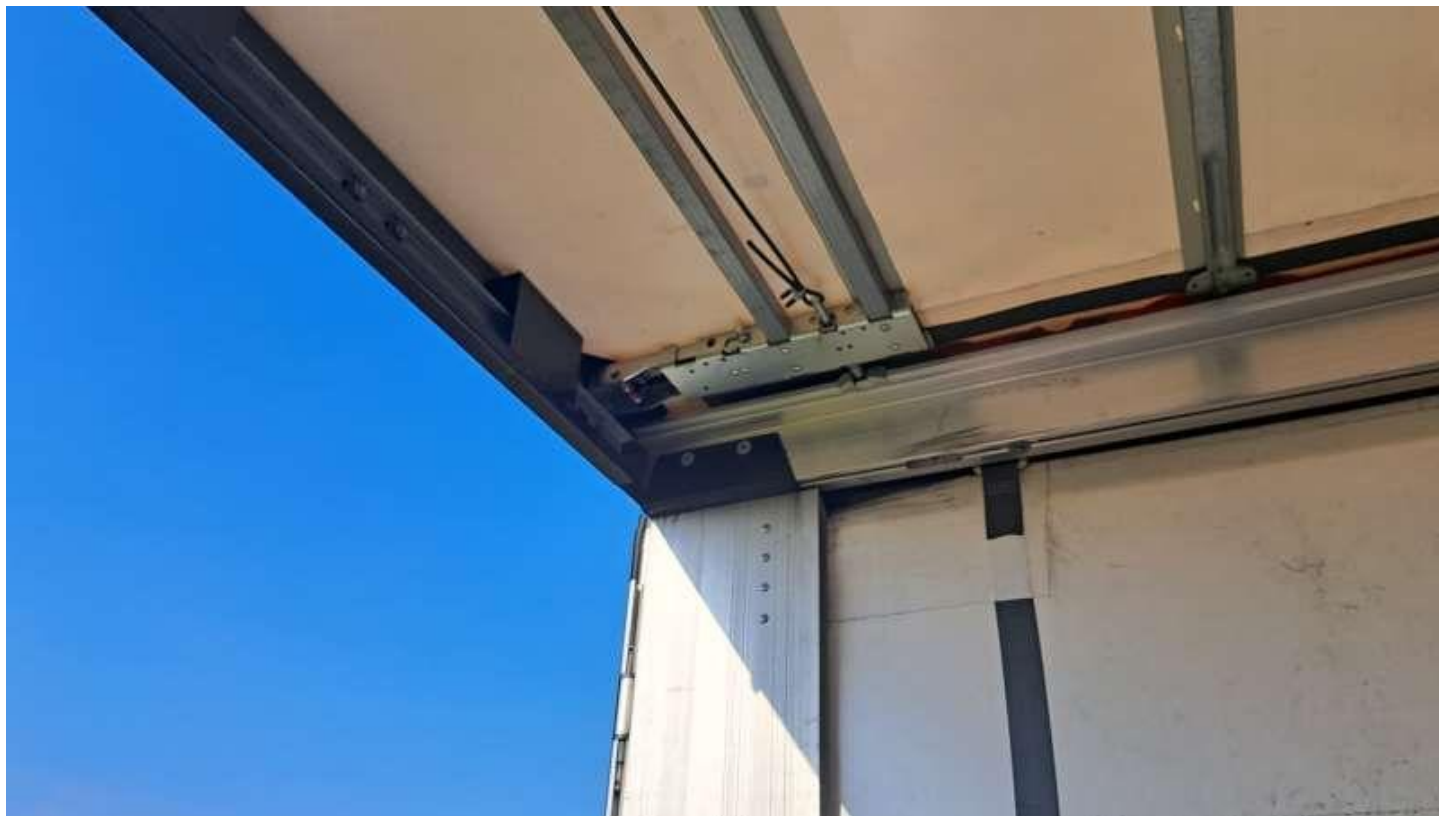
Fot. nr 42