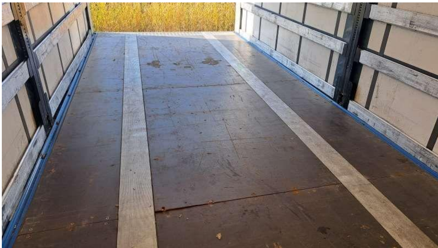
Fot. nr 50