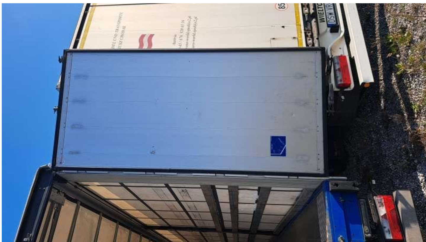
Fot. nr 34