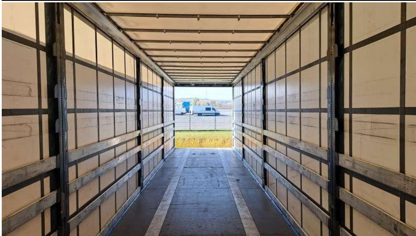
Fot. nr 49