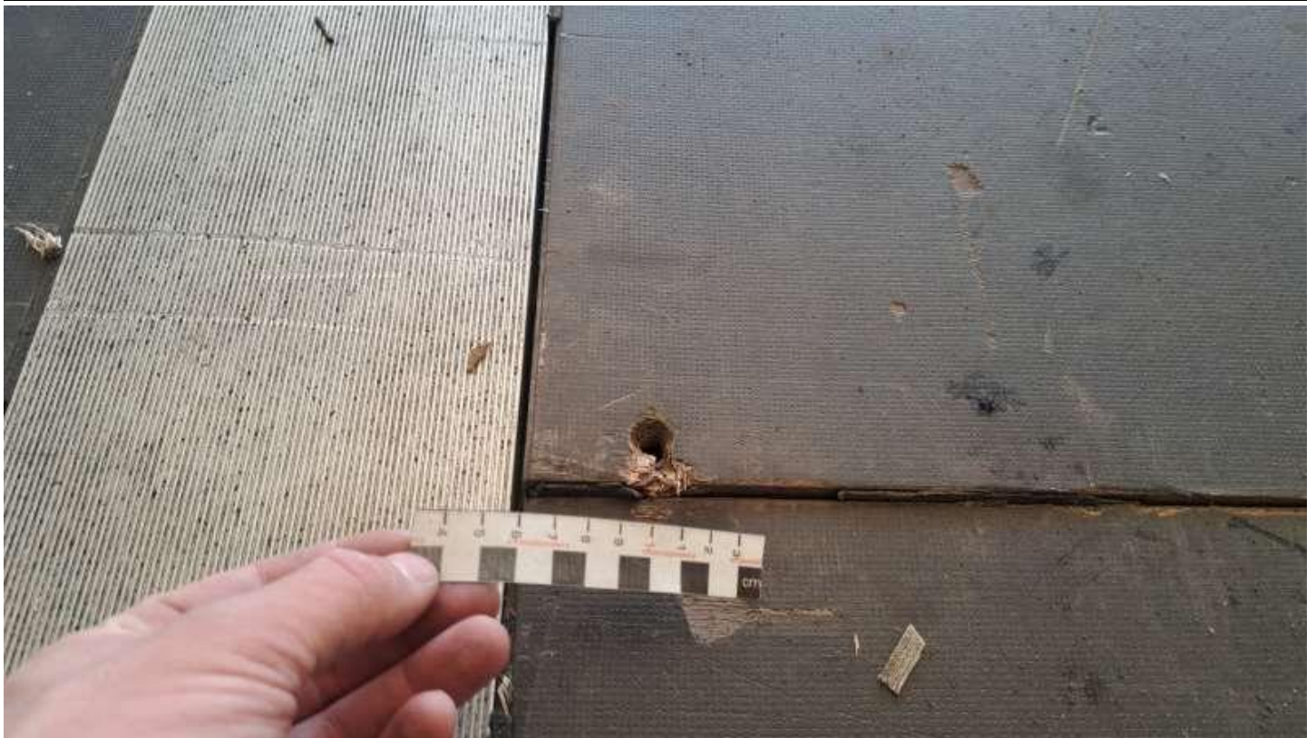
Fot. nr 51