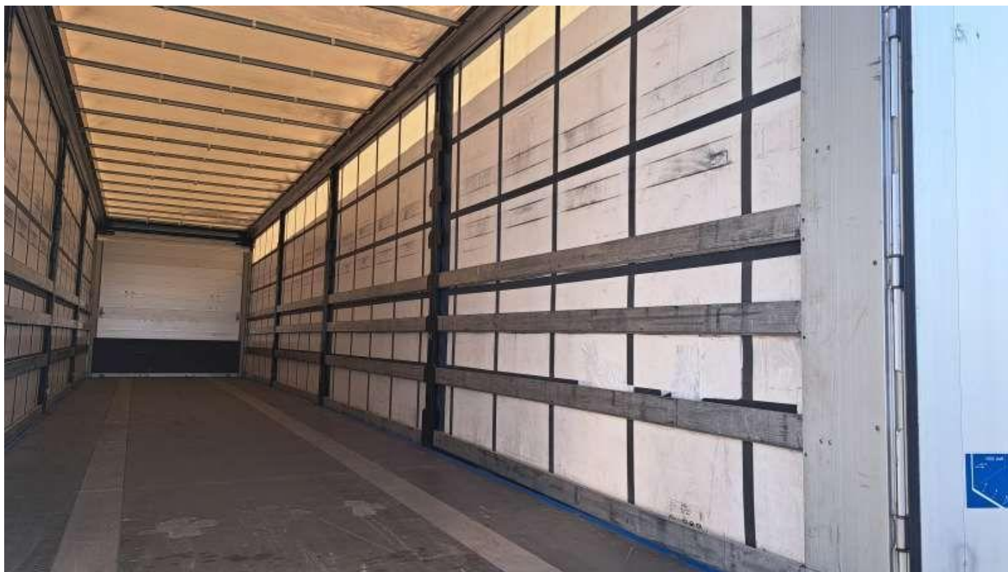
Fot. nr 38