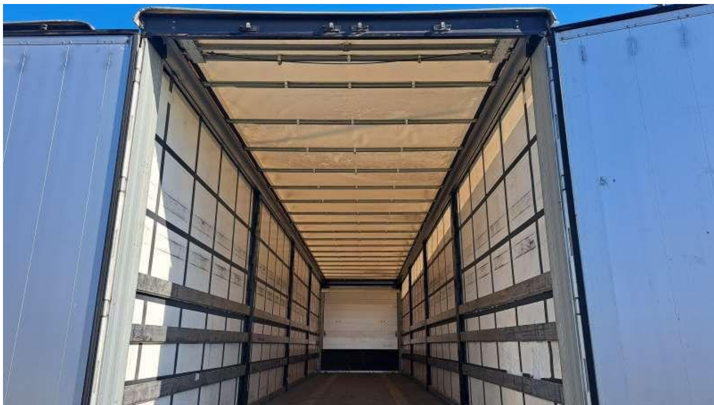
Fot. nr 36