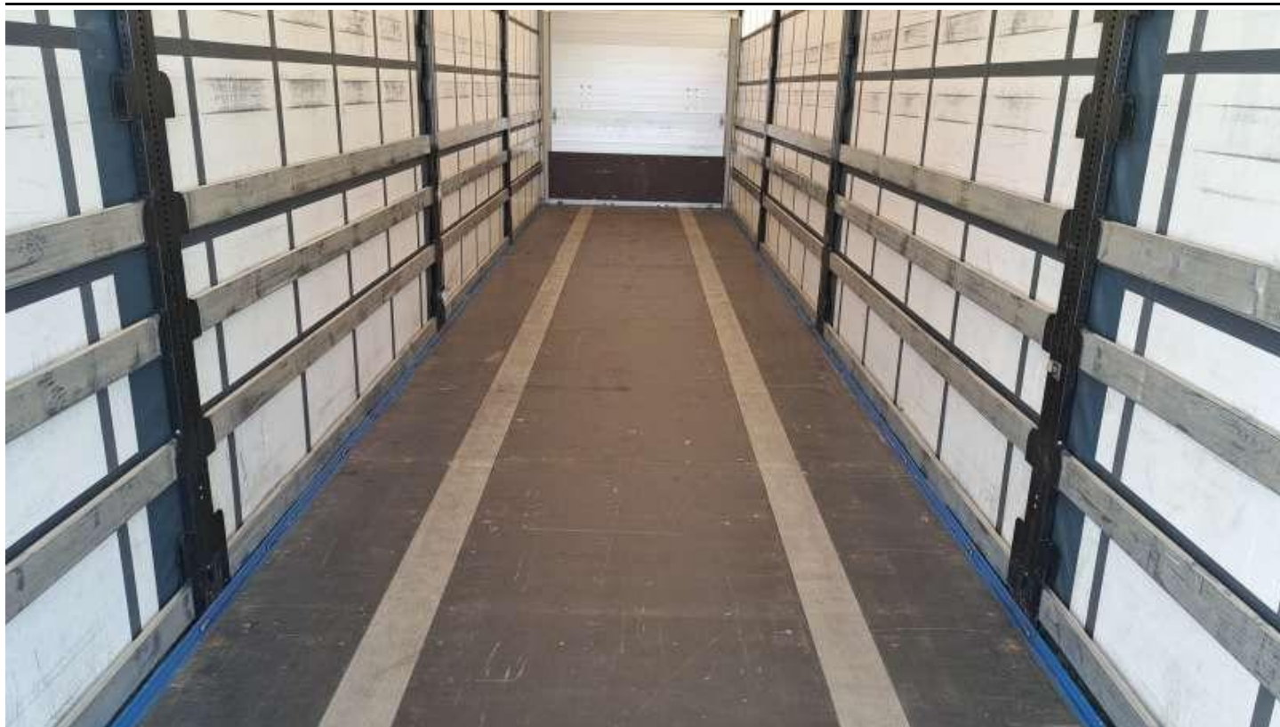
Fot. nr 39