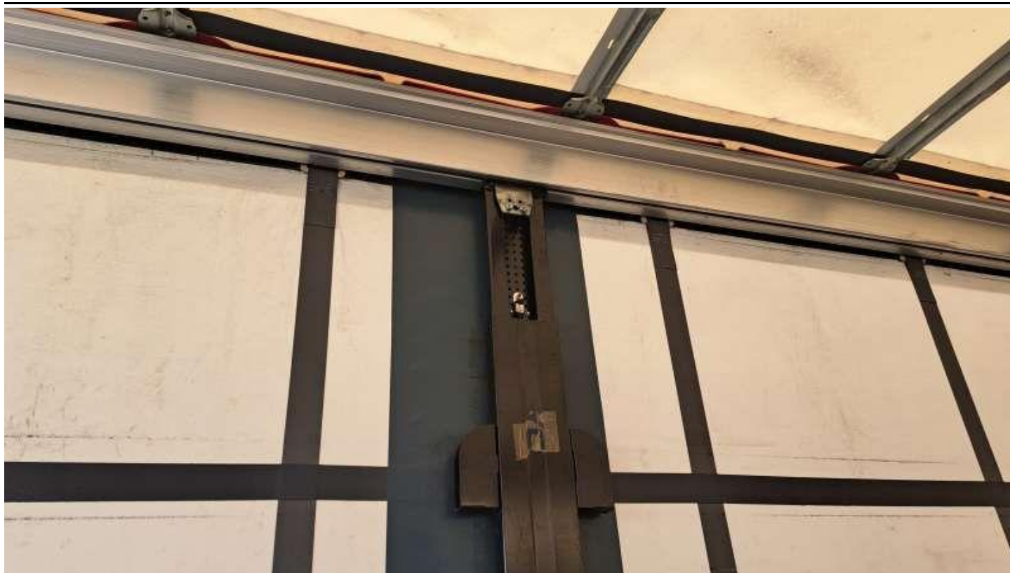
Fot. nr 43