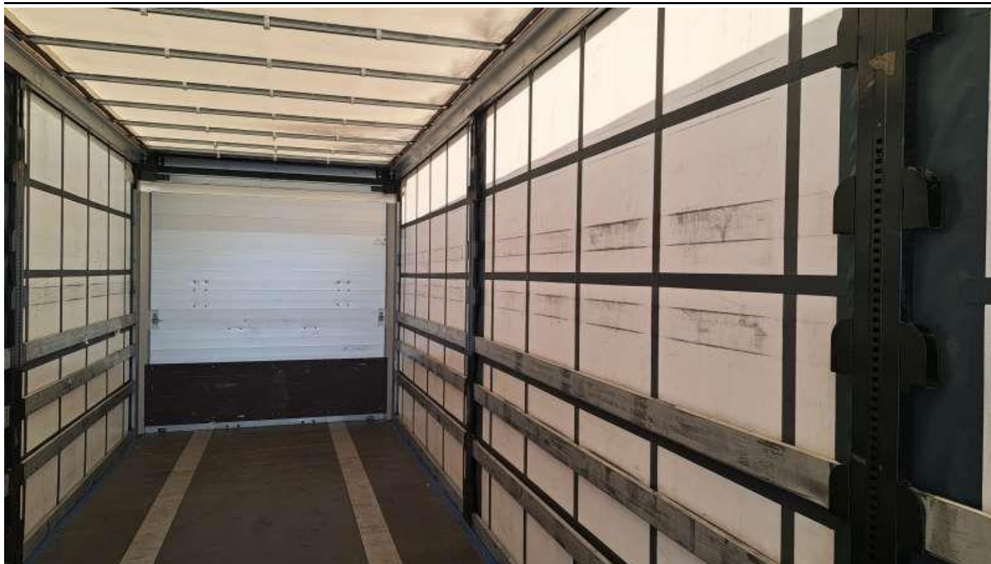
Fot. nr 47