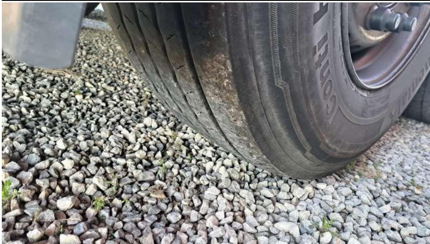
Fot. nr 55