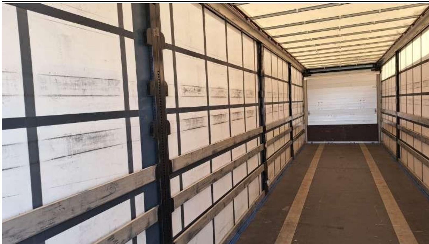
Fot. nr 41