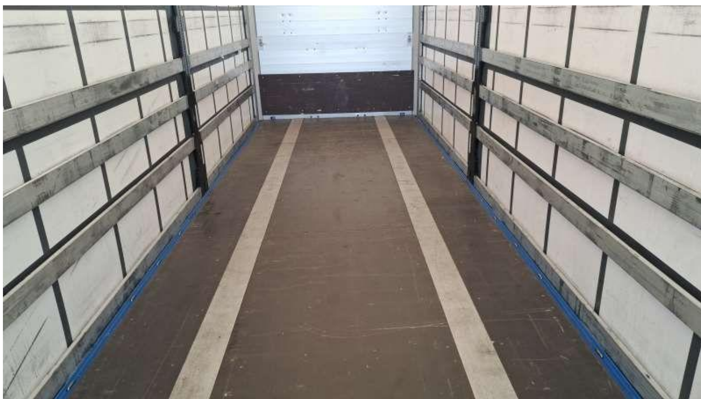
Fot. nr 46