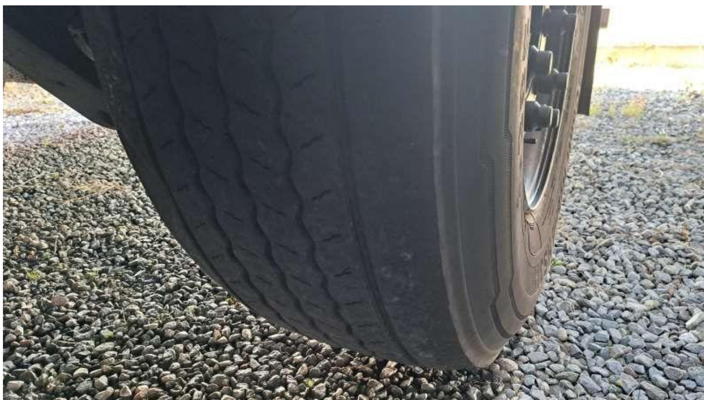
Fot. nr 54