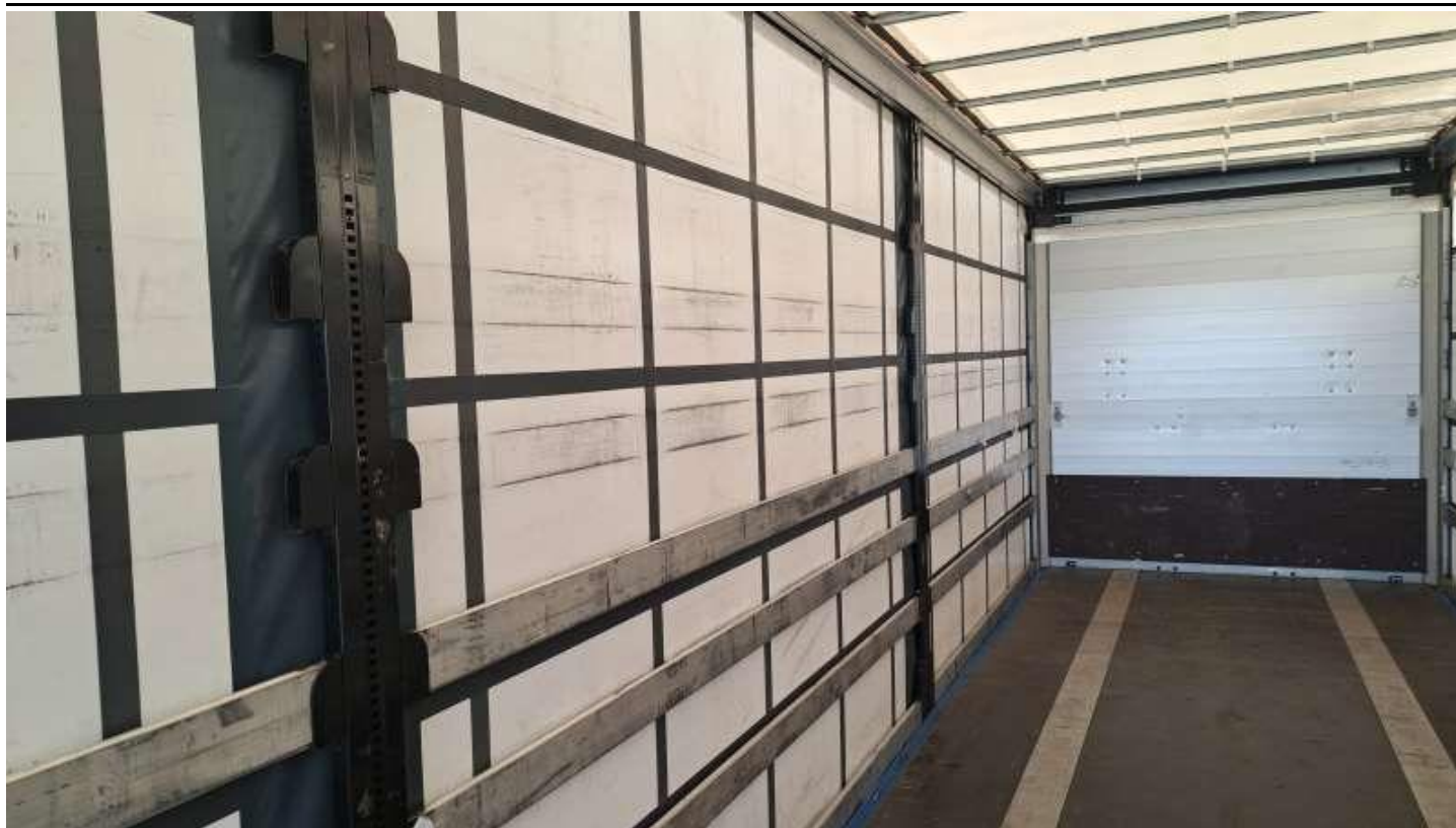
Fot. nr 45