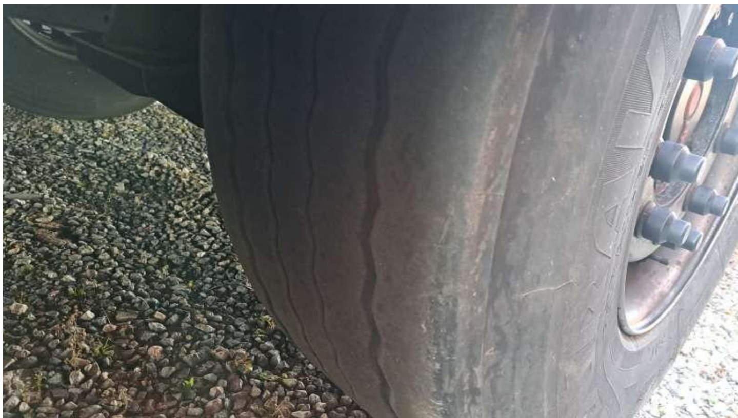
Fot. nr 56