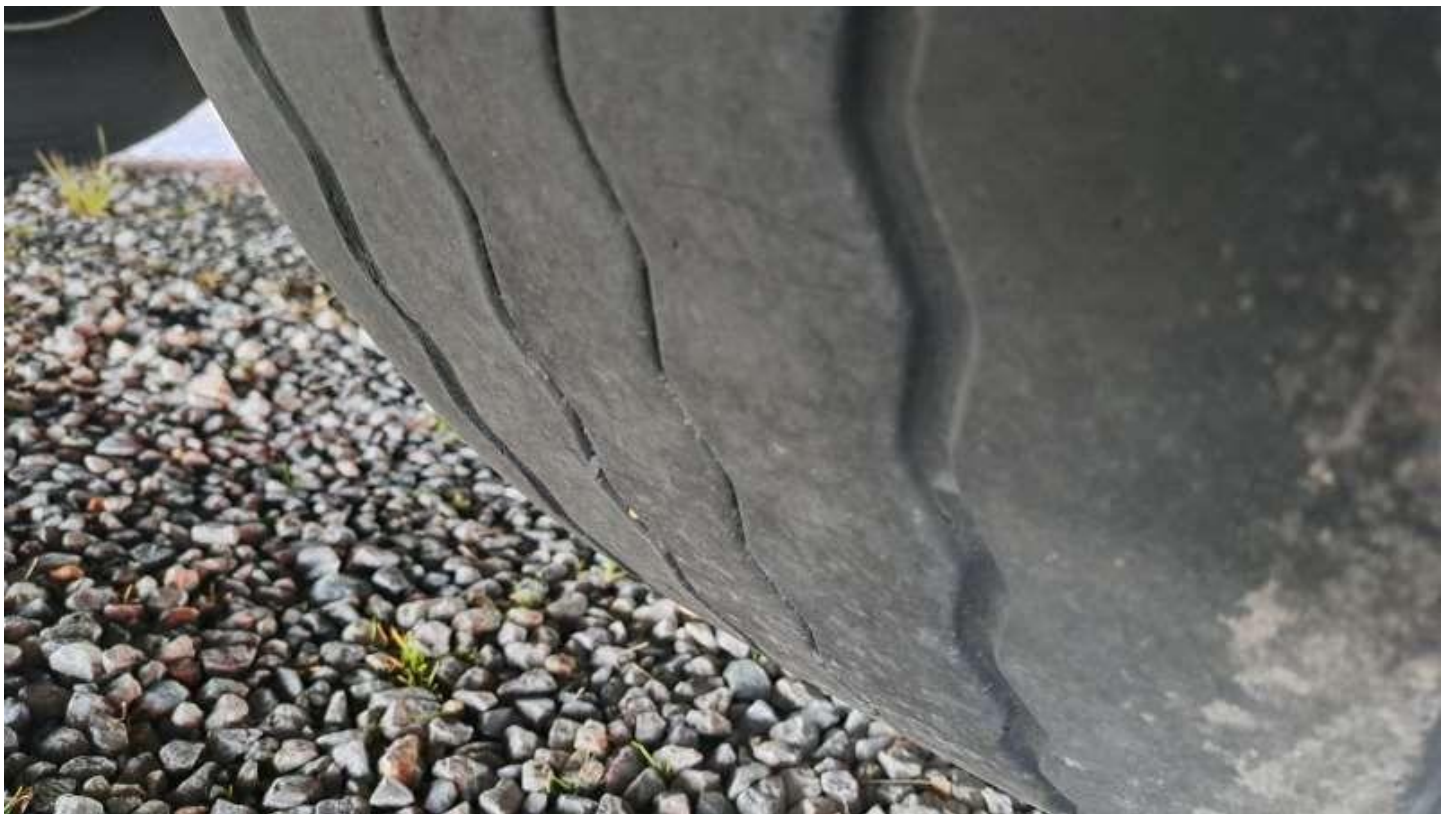
Fot. nr 52