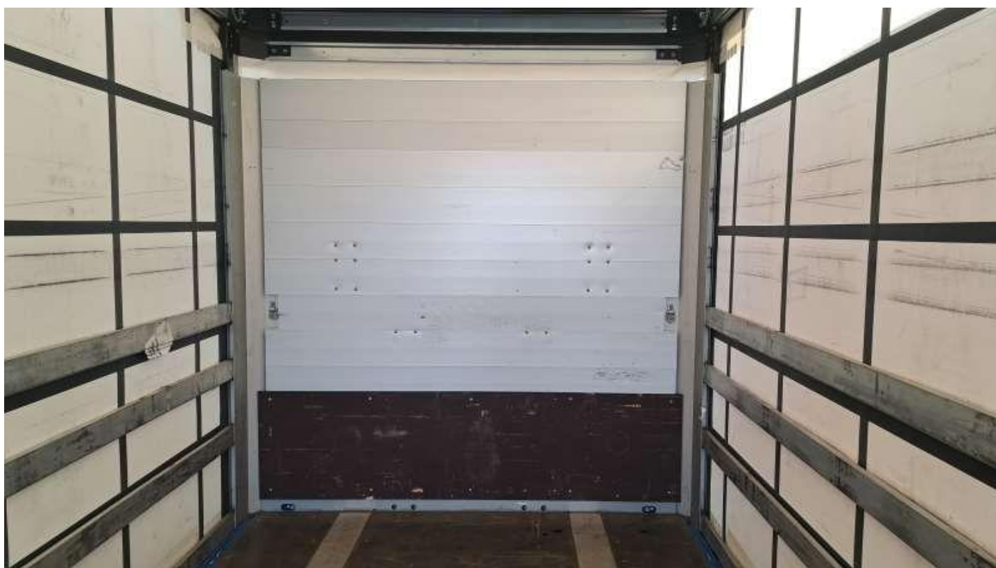
Fot. nr 48