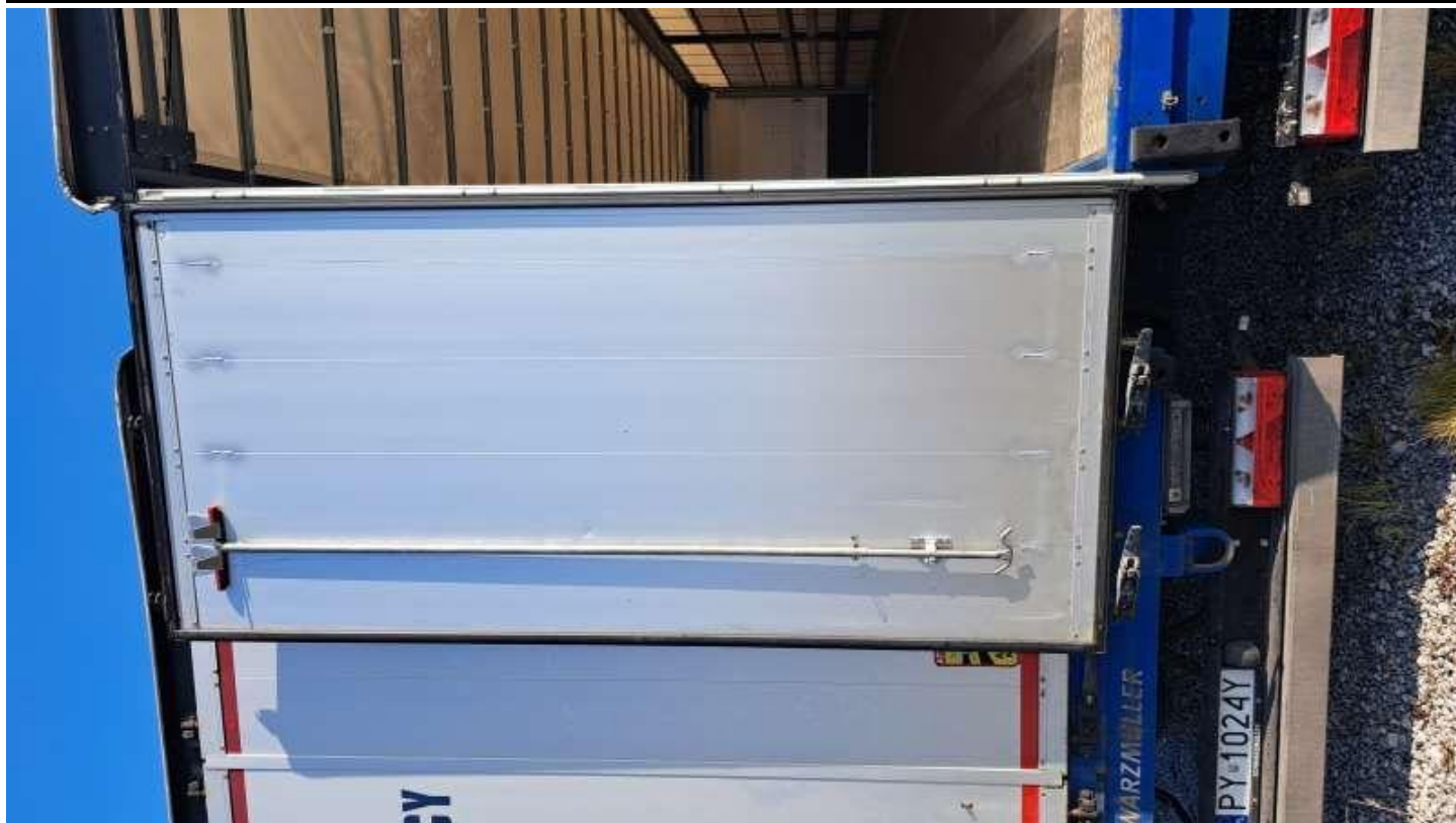
Fot. nr 33