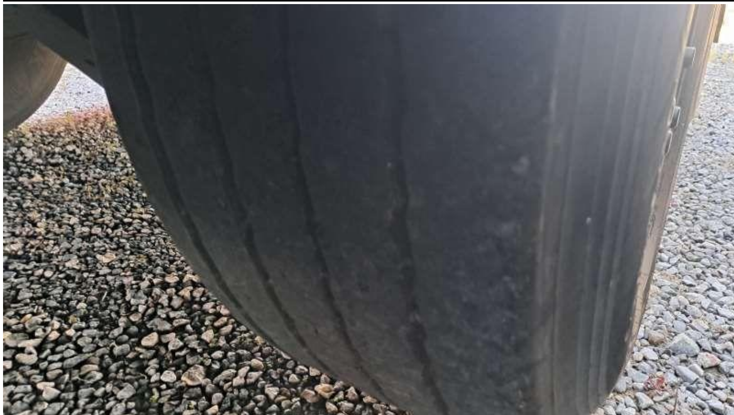
Fot. nr 53