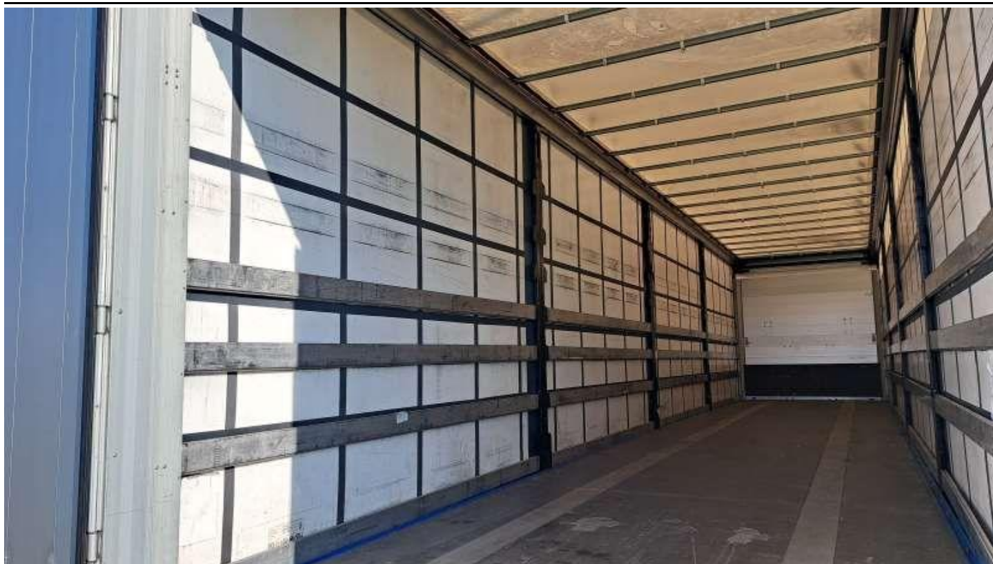
Fot. nr 37