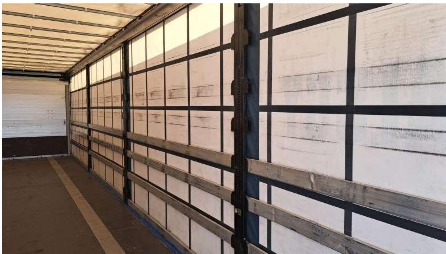
Fot. nr 40