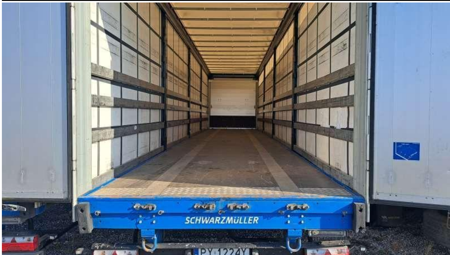
Fot. nr 35