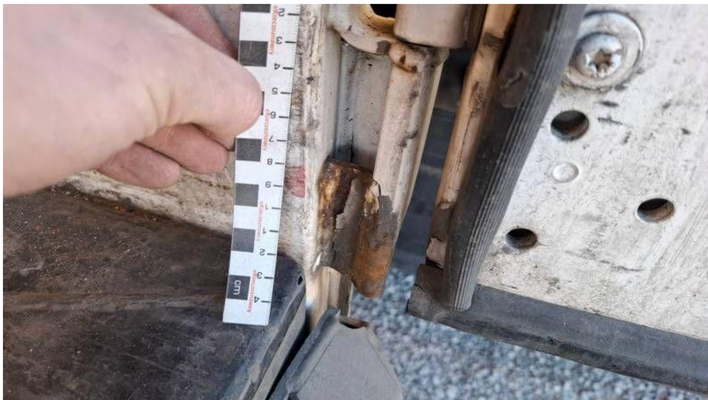
Fot. nr 32