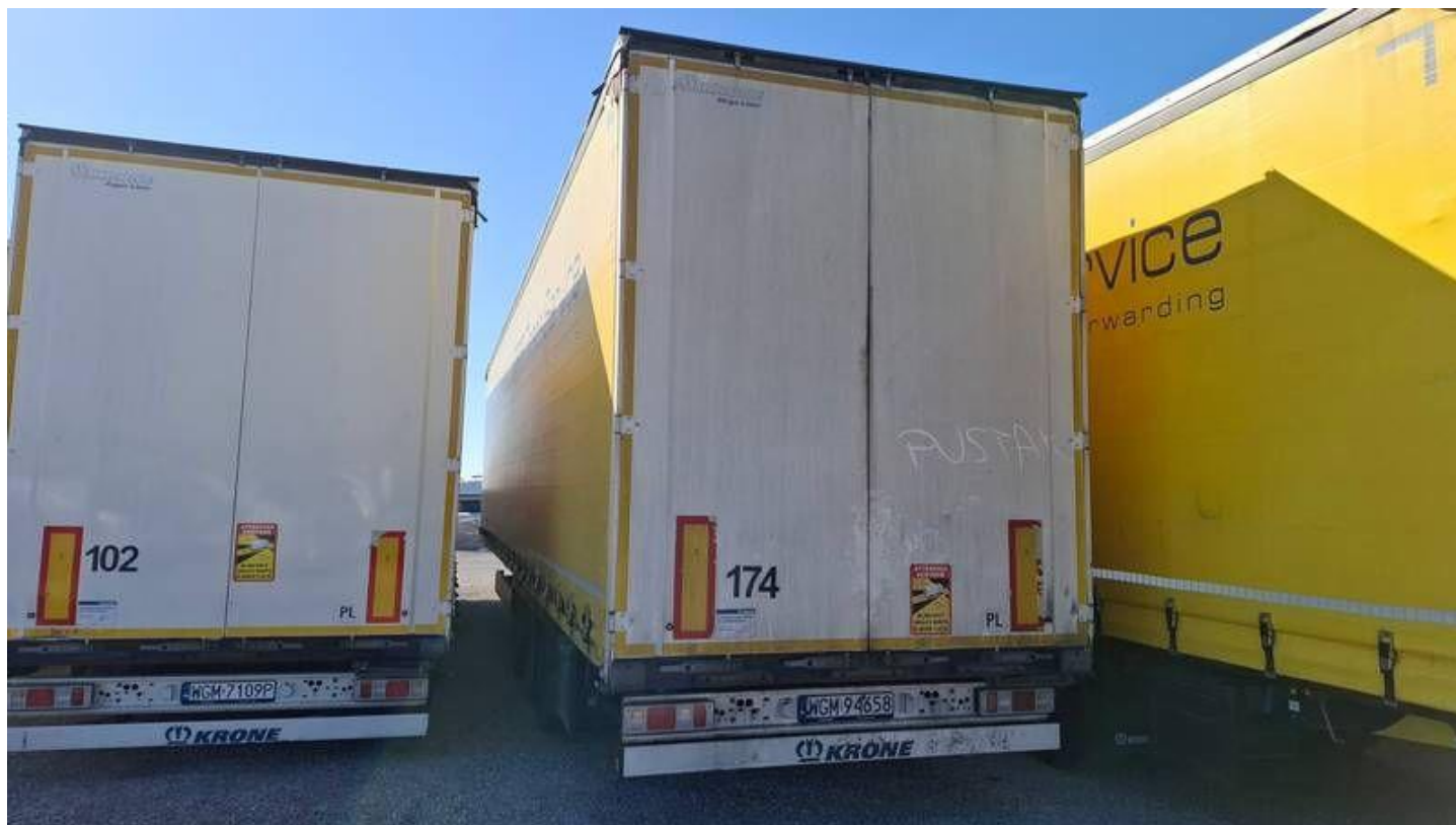
Fot. nr 6