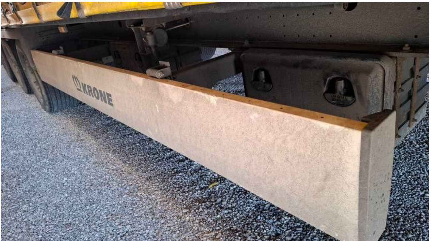
Fot. nr 14