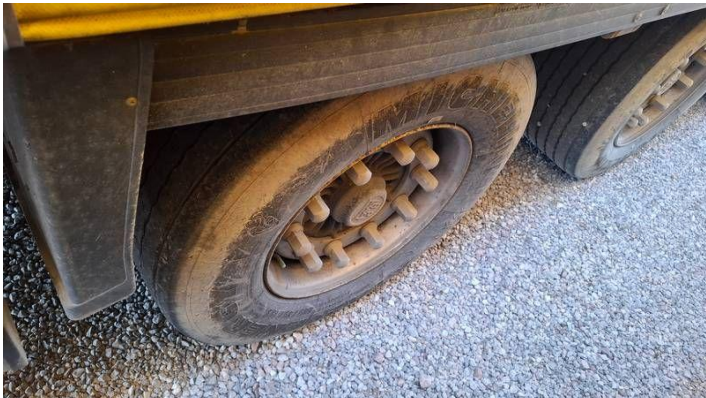
Fot. nr 42