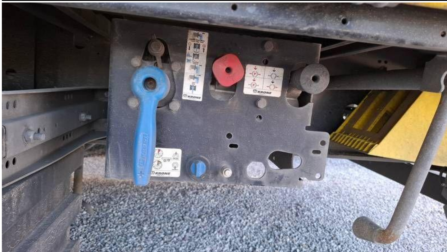
Fot. nr 19