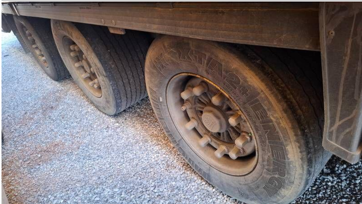
Fot. nr 15