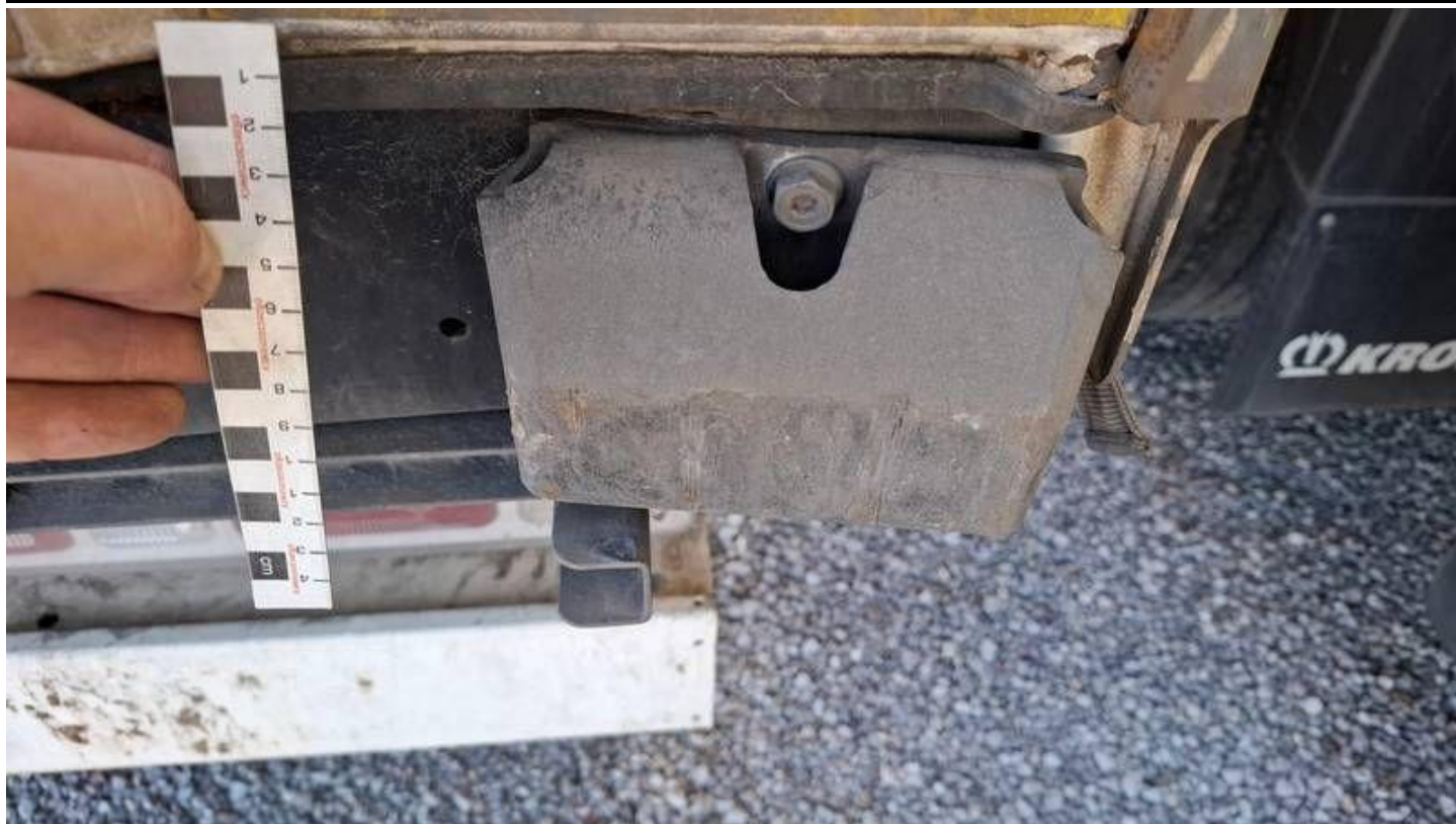
Fot. nr 29