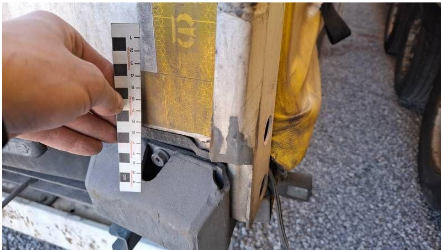
Fot. nr 22