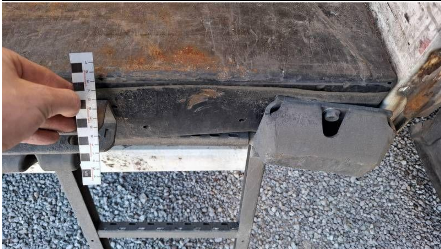
Fot. nr 33