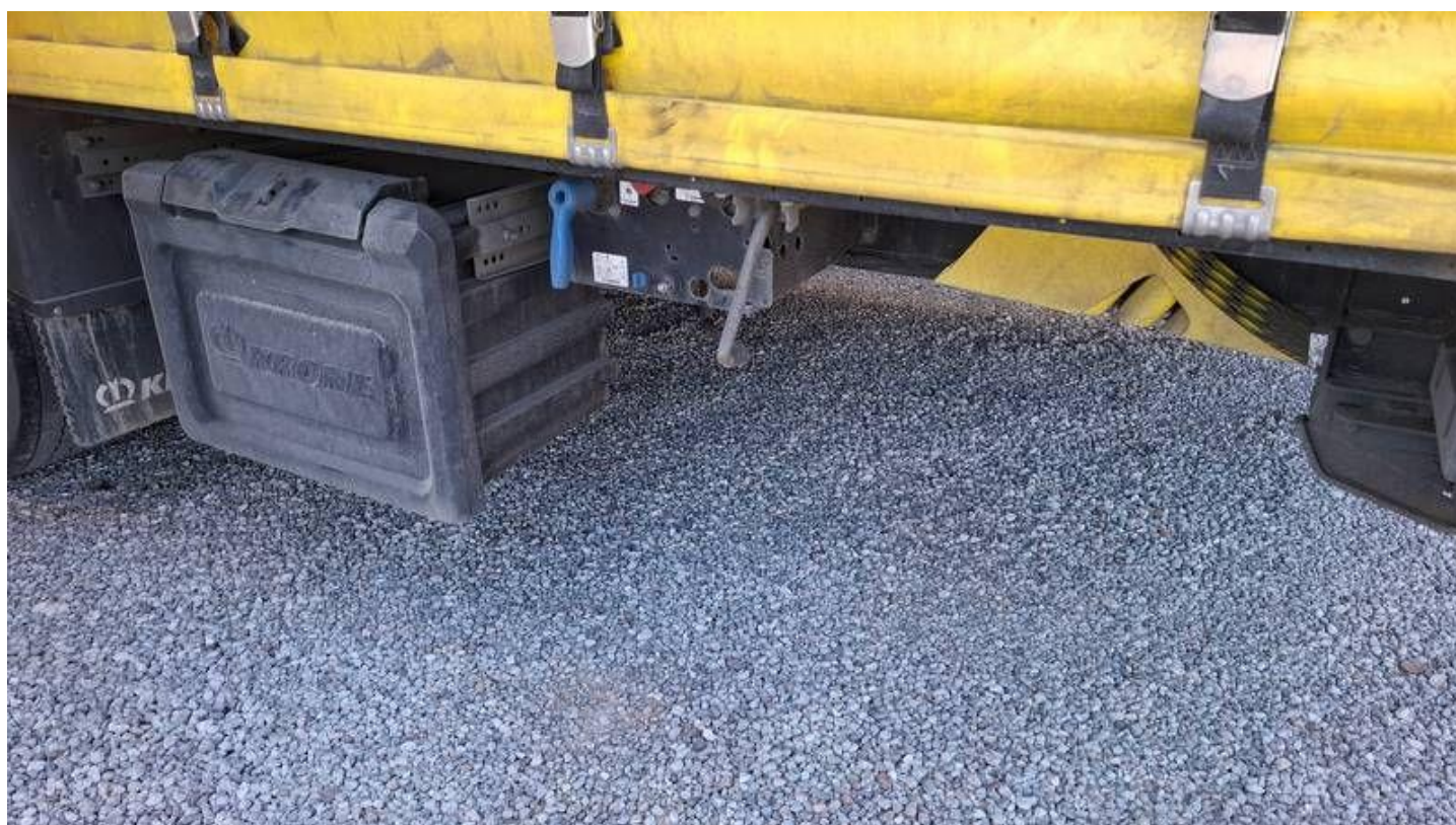
Fot. nr 18