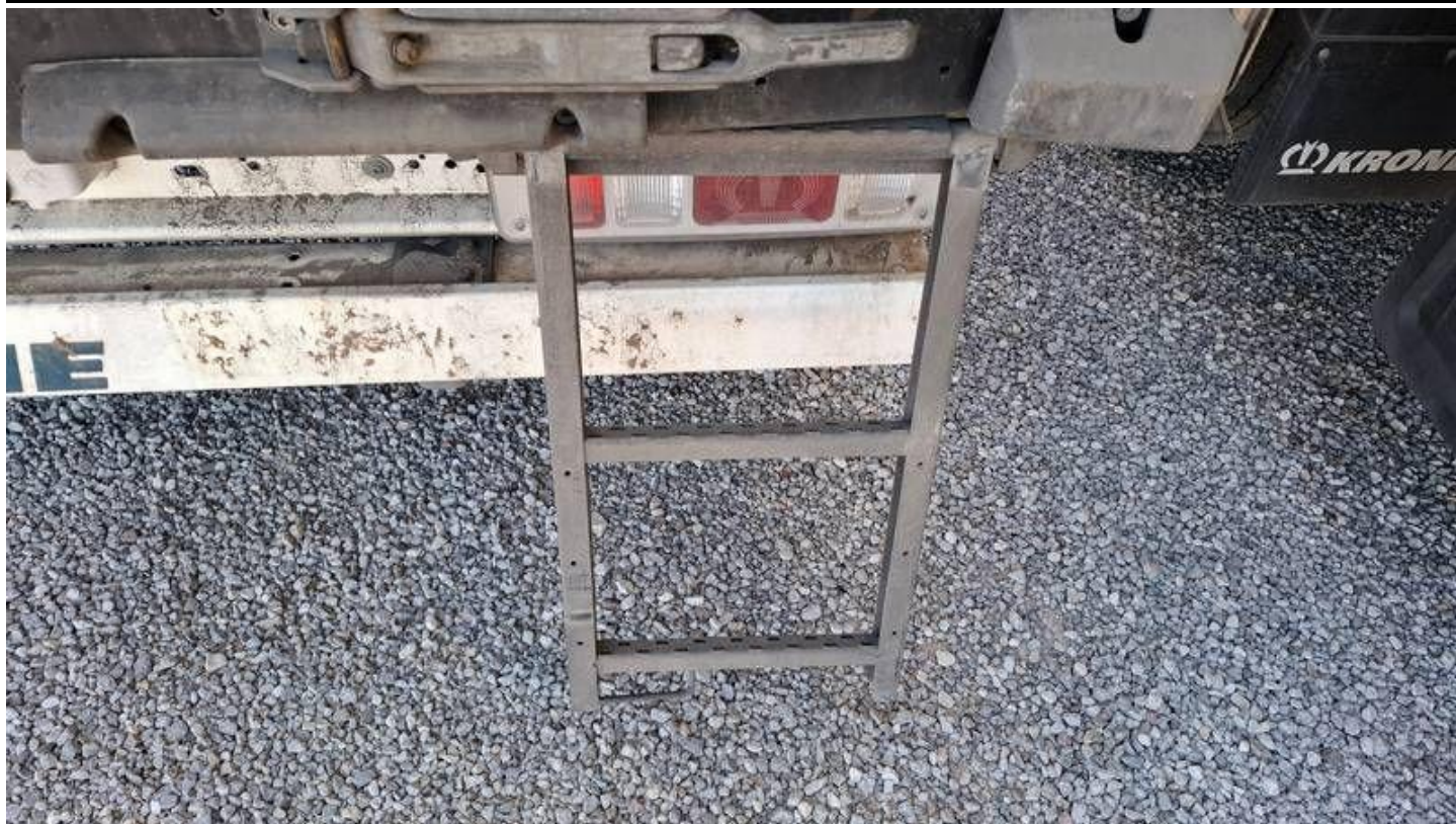
Fot. nr 31