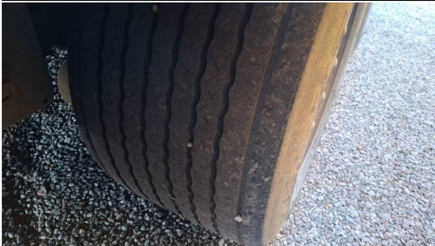
Fot. nr 45