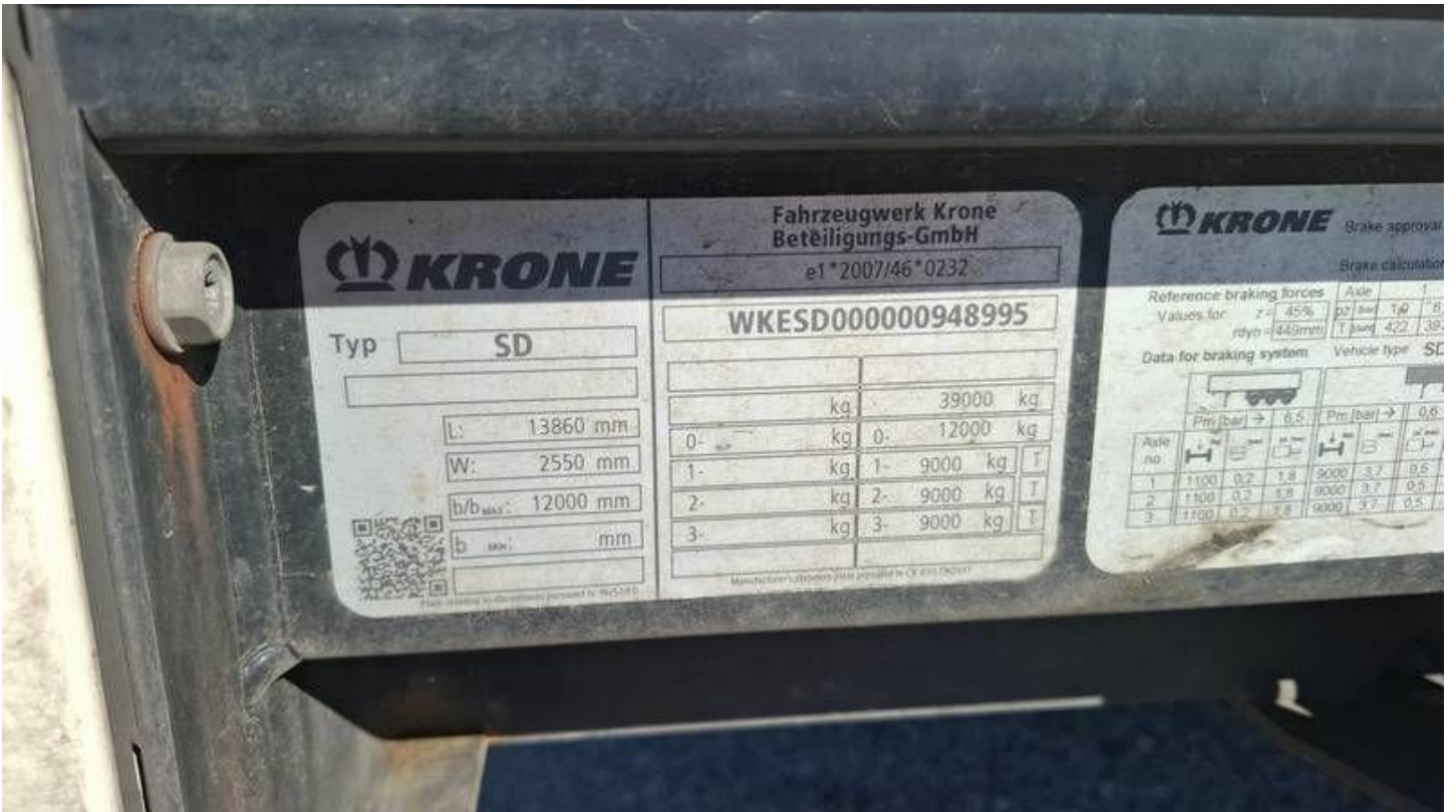
Fot. nr 8