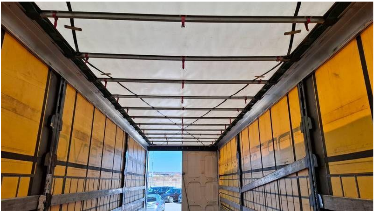
Fot. nr 39