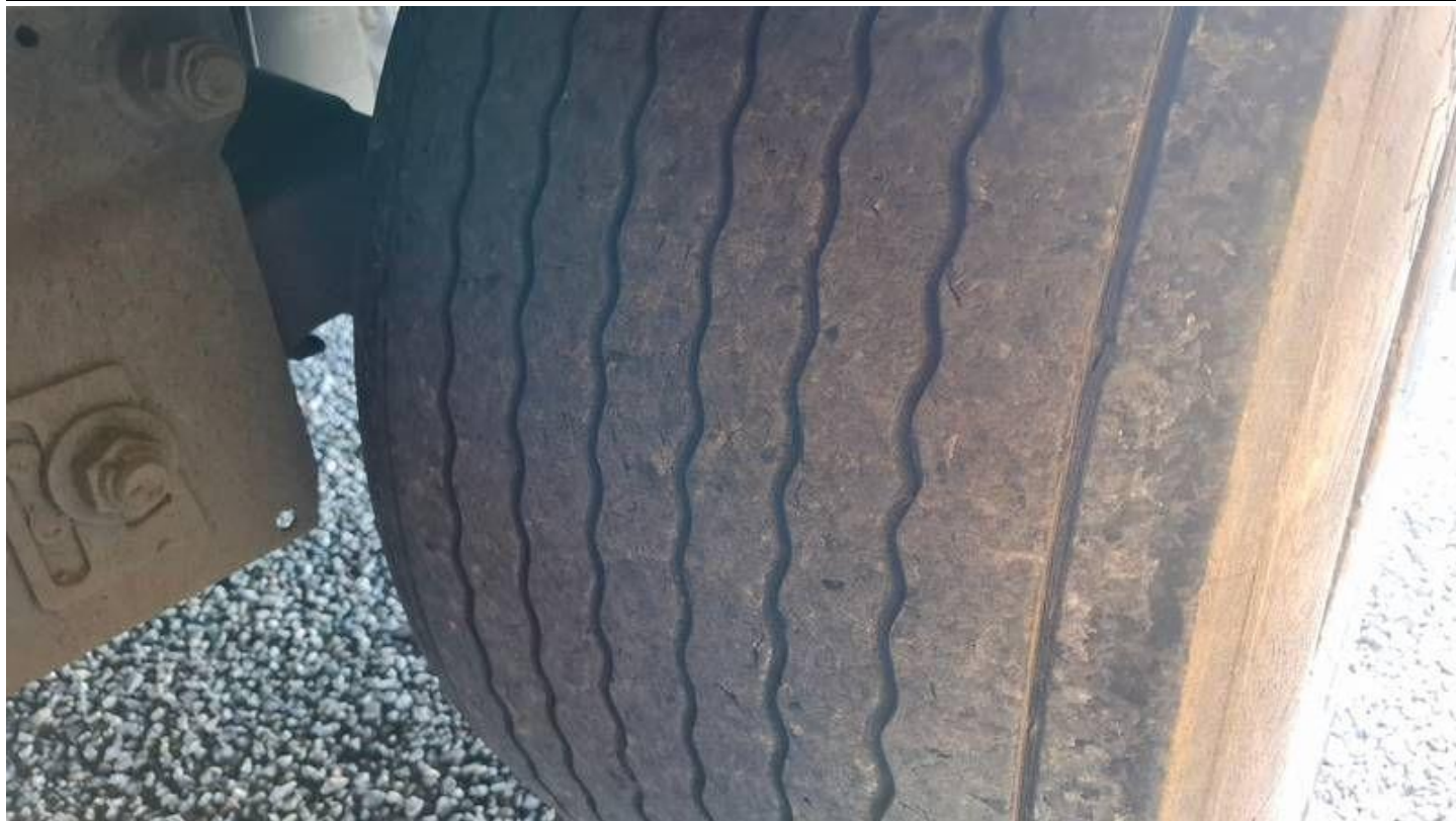
Fot. nr 47