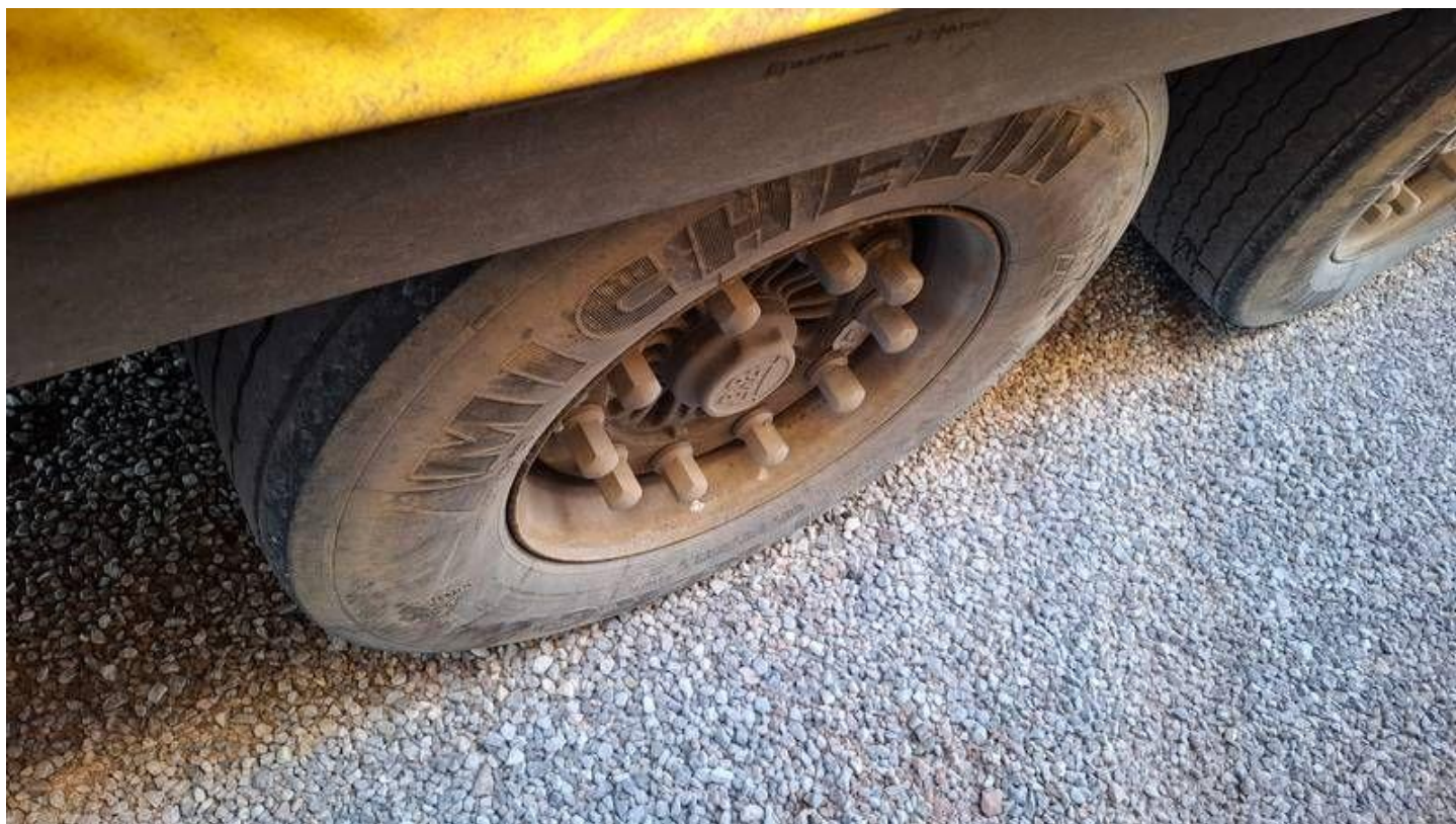
Fot. nr 50