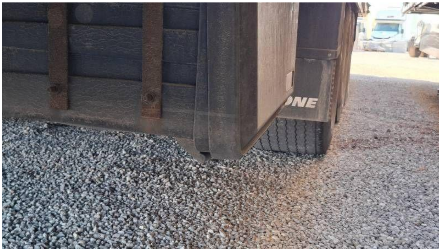
Fot. nr 24