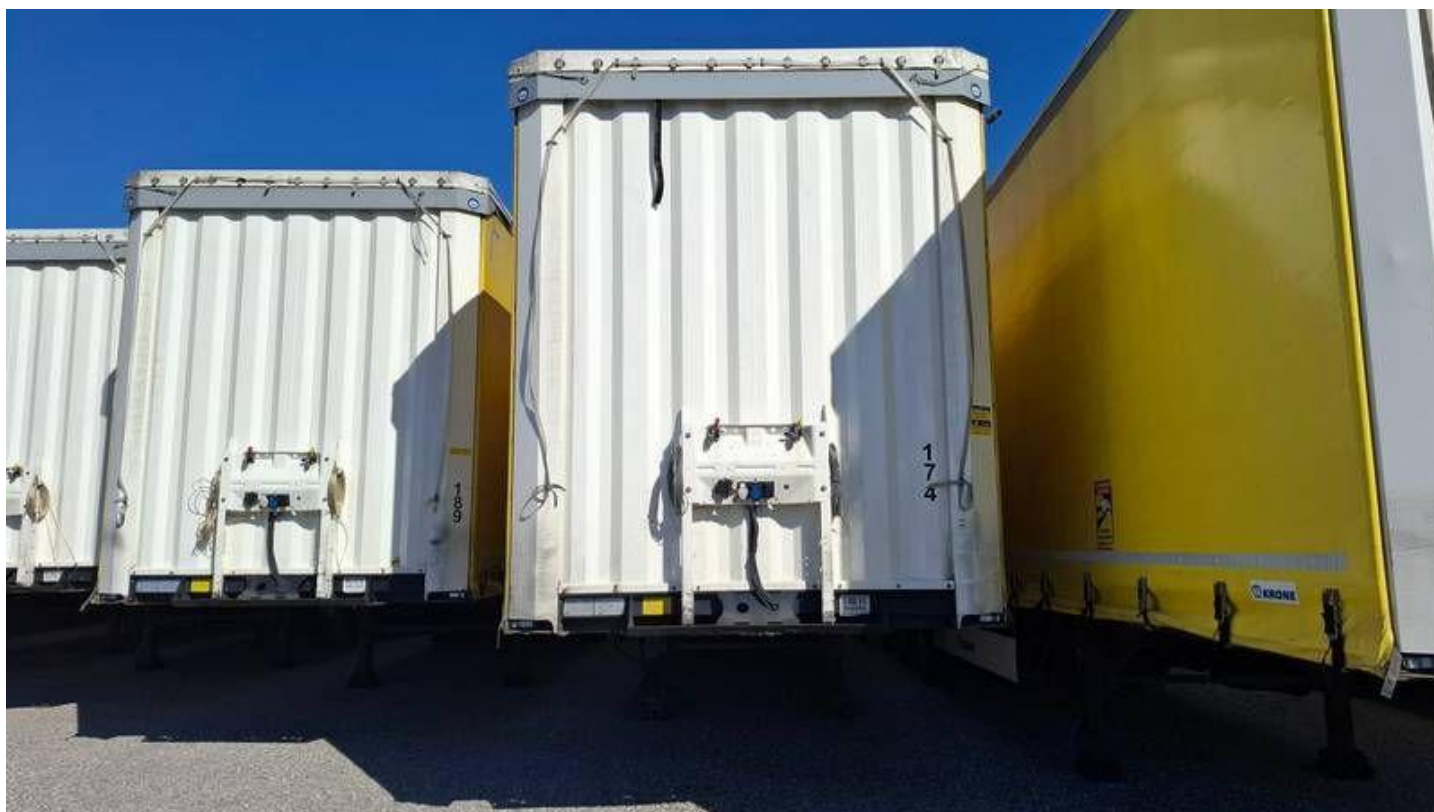
Fot. nr 2