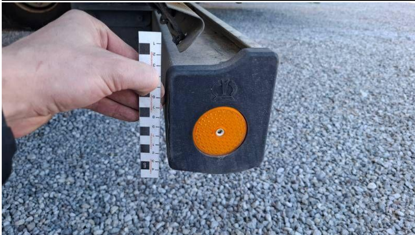
Fot. nr 27