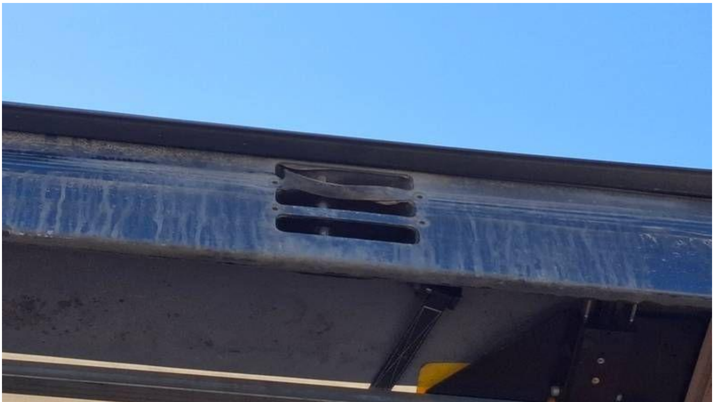
Fot. nr 40