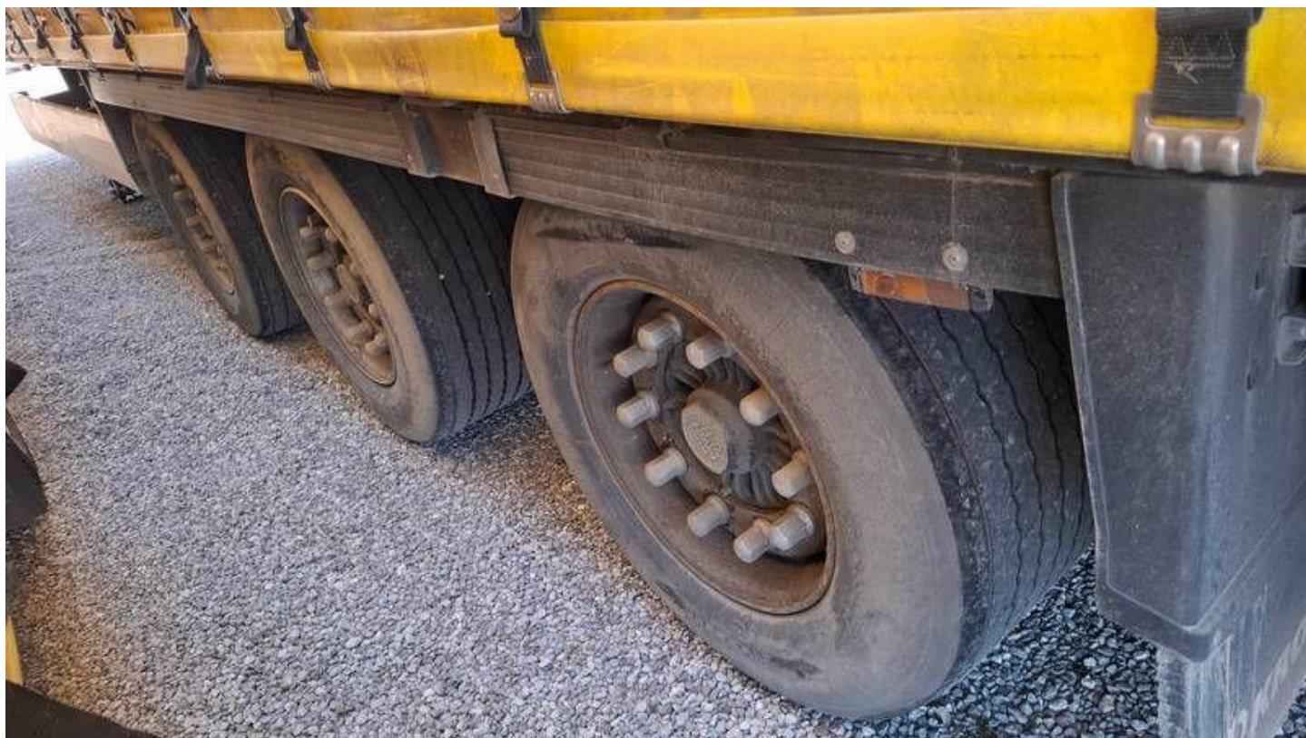
Fot. nr 20