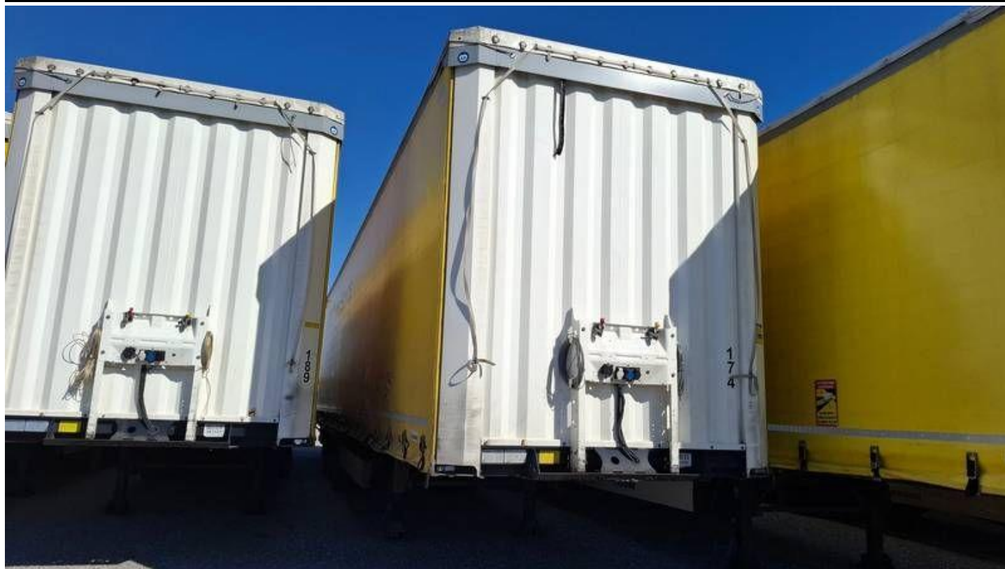
Fot. nr 3