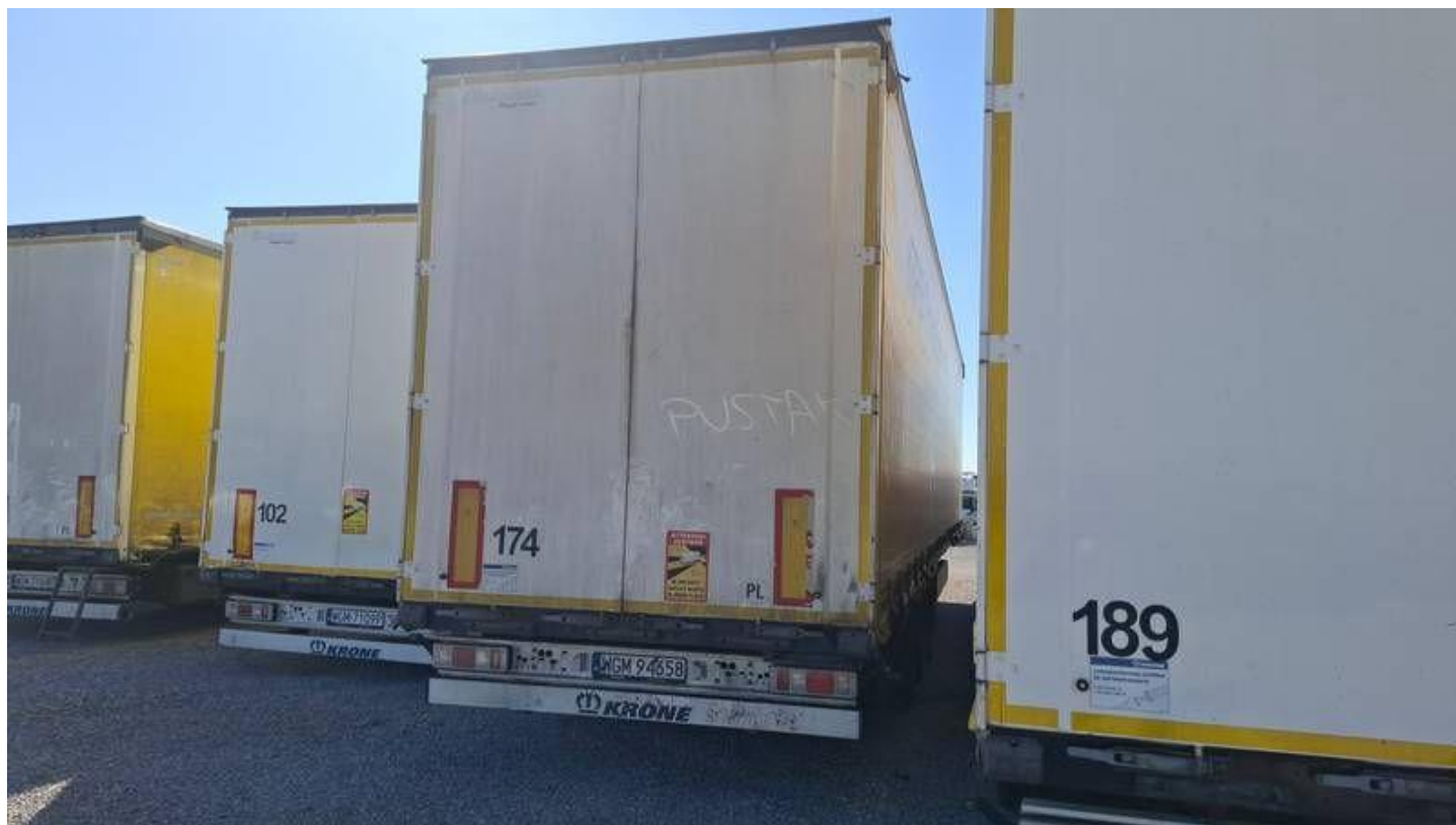
Fot. nr 4