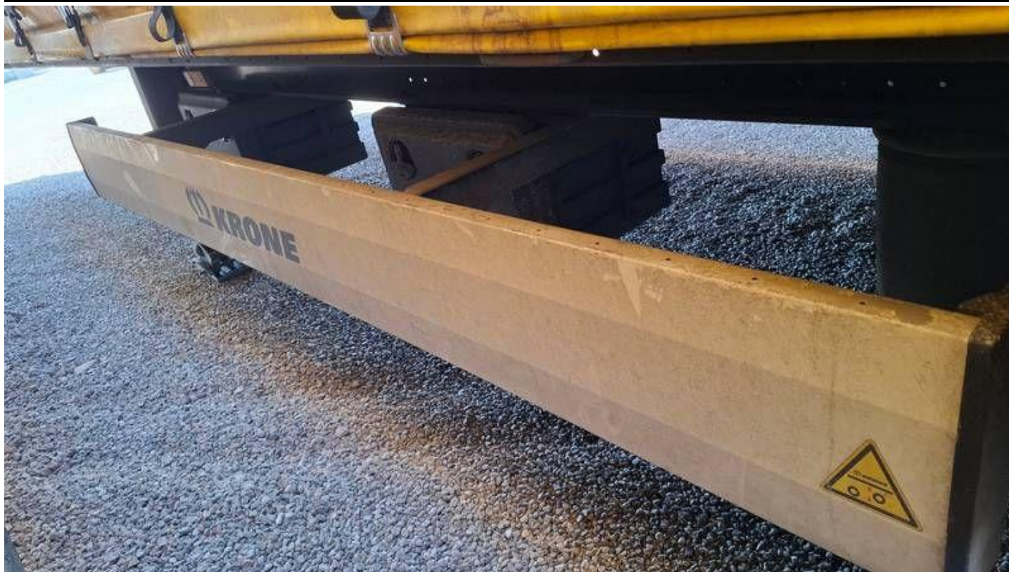
Fot. nr 21