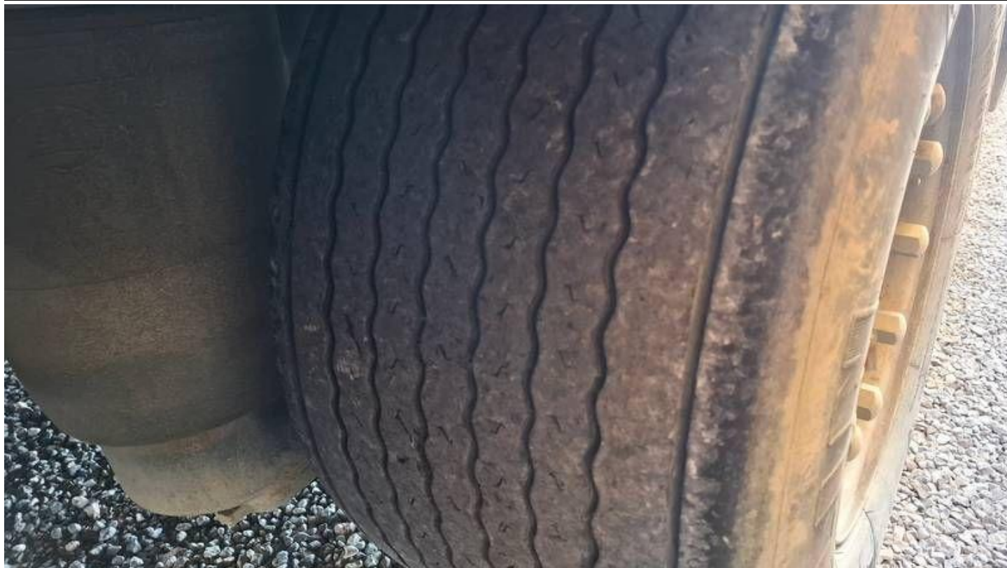
Fot. nr 49