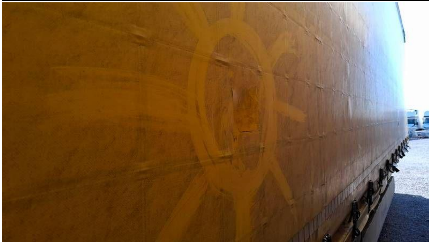
Fot. nr 25