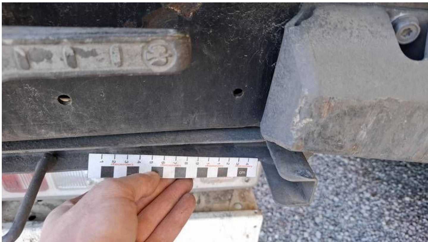
Fot. nr 30