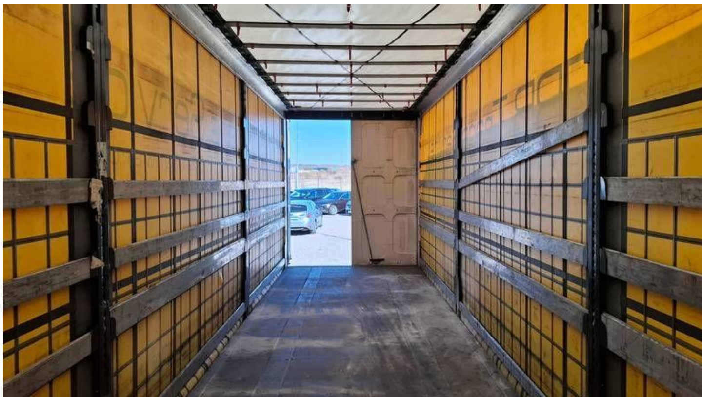
Fot. nr 38