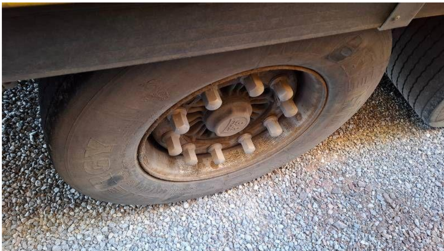
Fot. nr 52