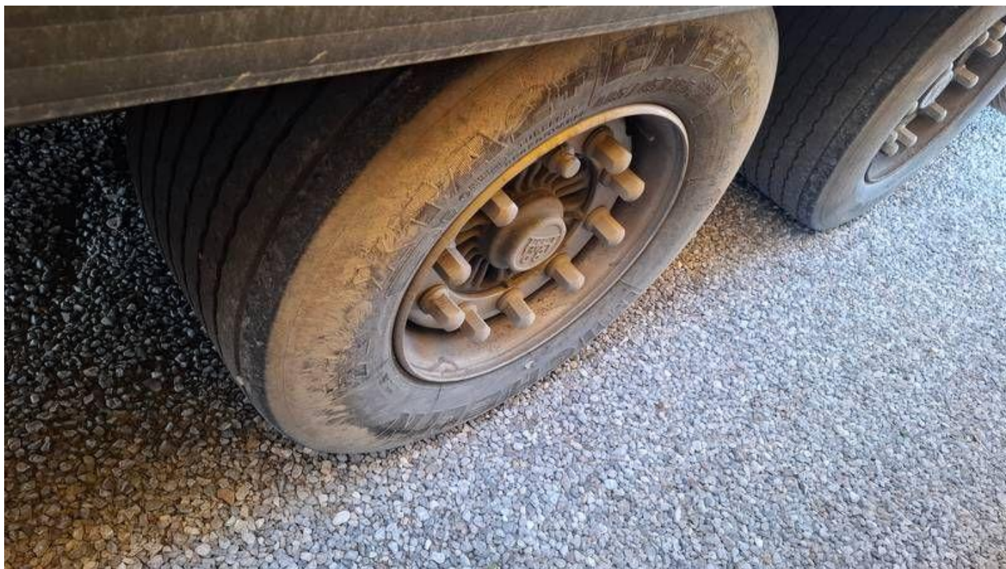
Fot. nr 44