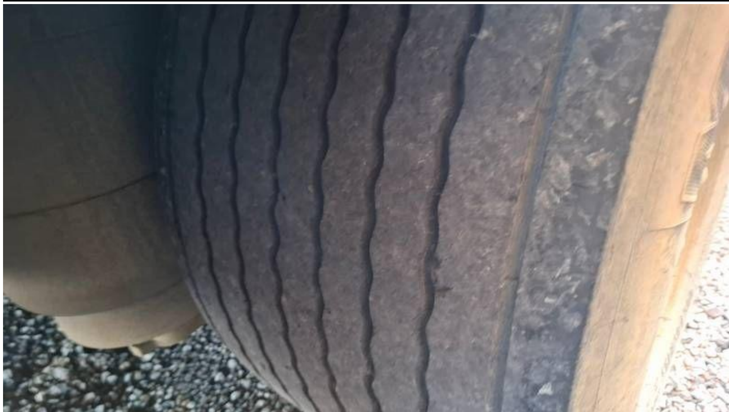
Fot. nr 51