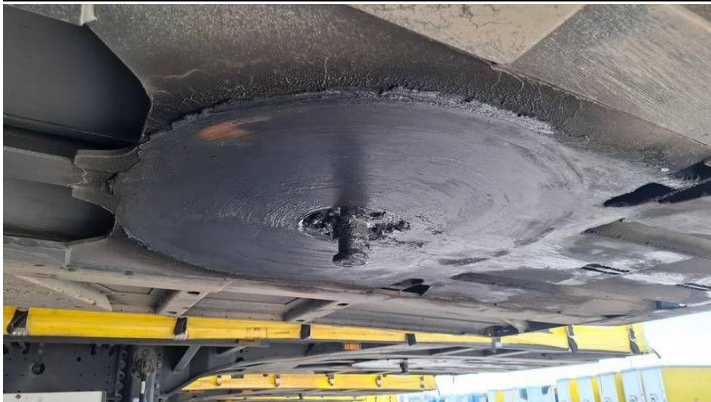
Fot. nr 11