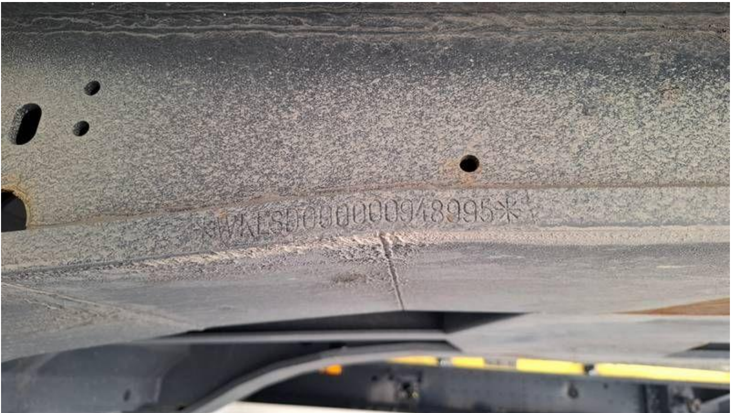
Fot. nr 7