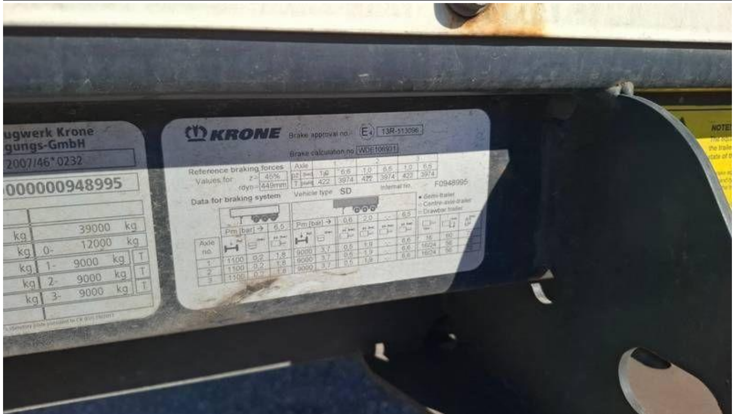
Fot. nr 9