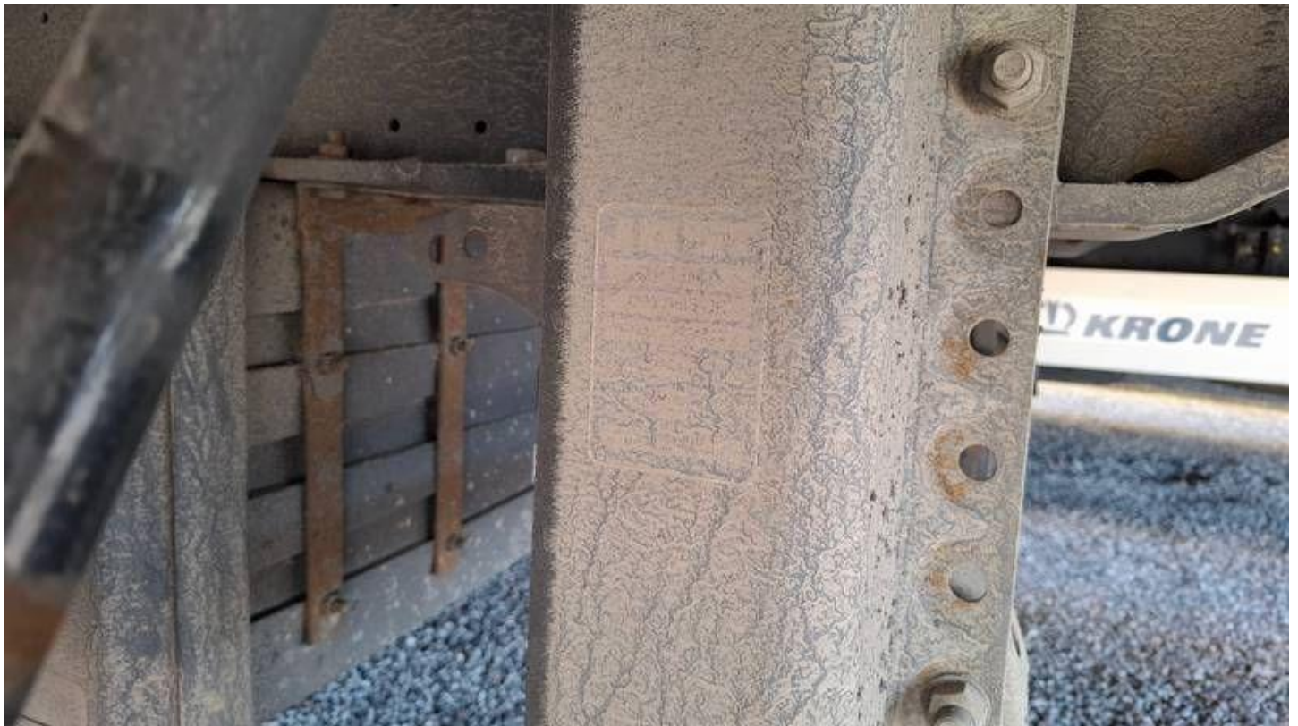
Fot. nr 13