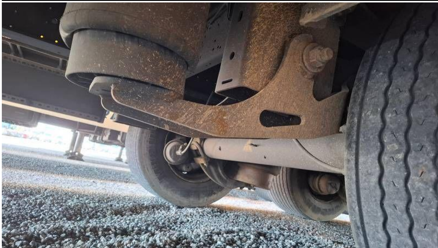
Fot. nr 41