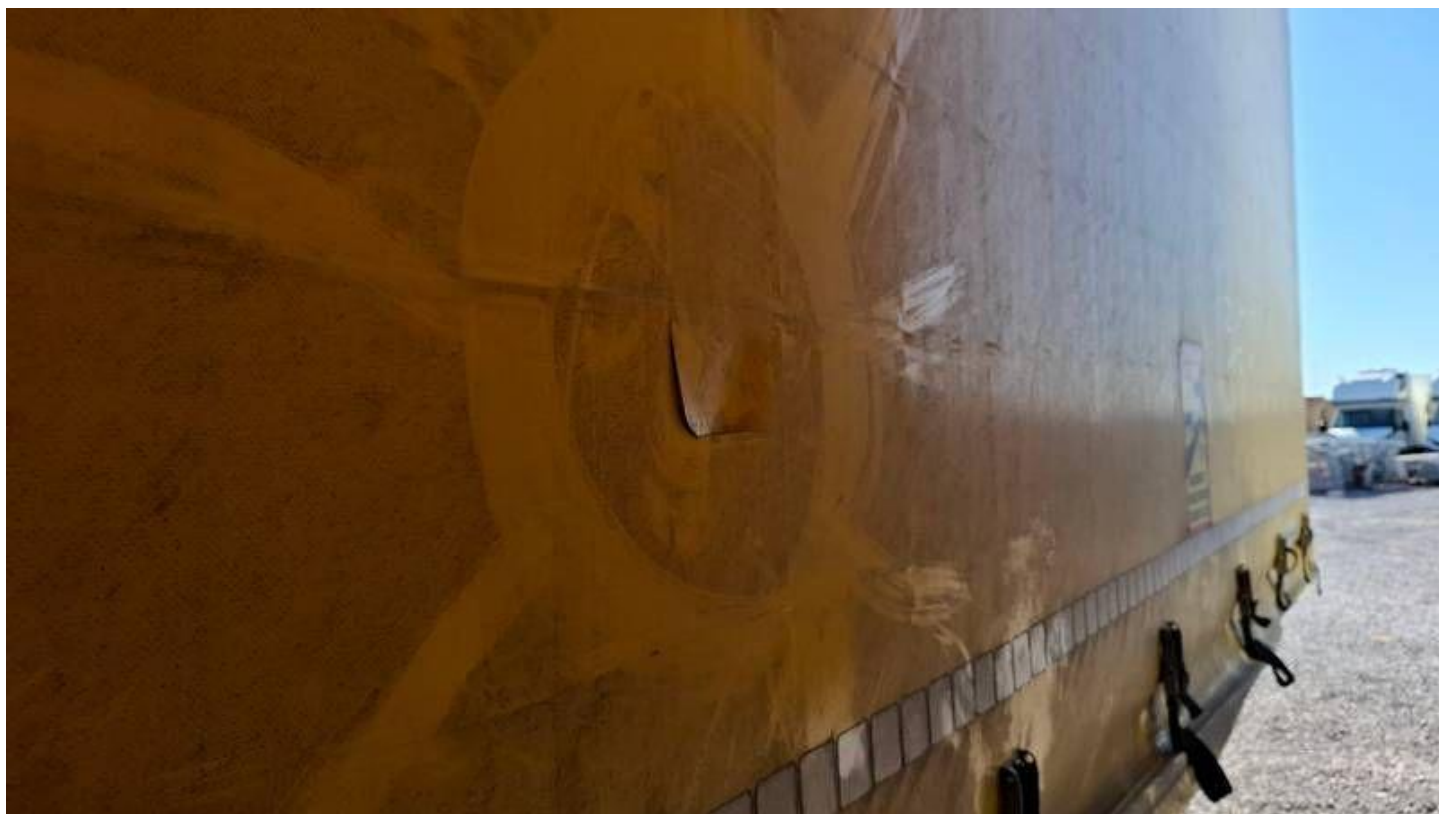
Fot. nr 26