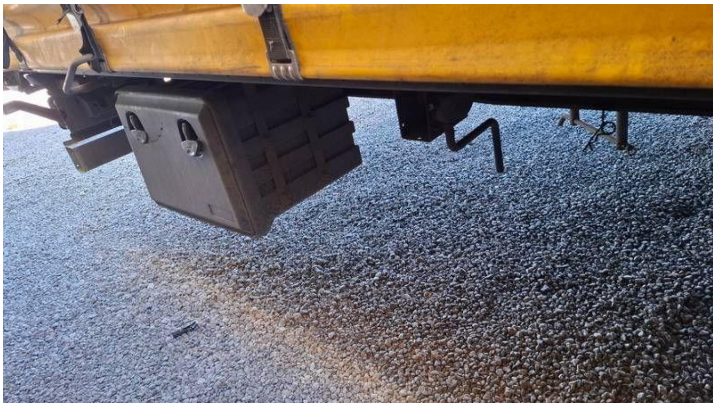
Fot. nr 16