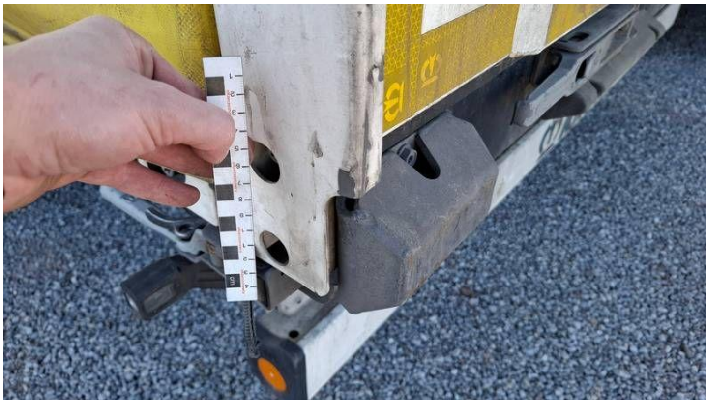
Fot. nr 28