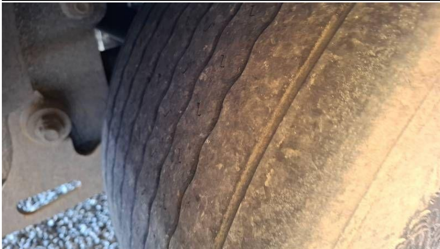
Fot. nr 43