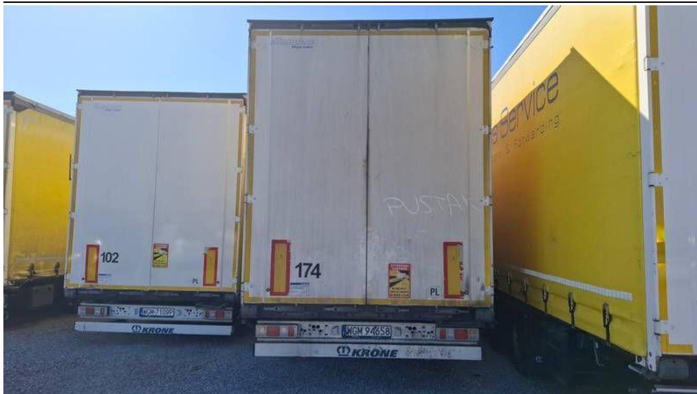
Fot. nr 5