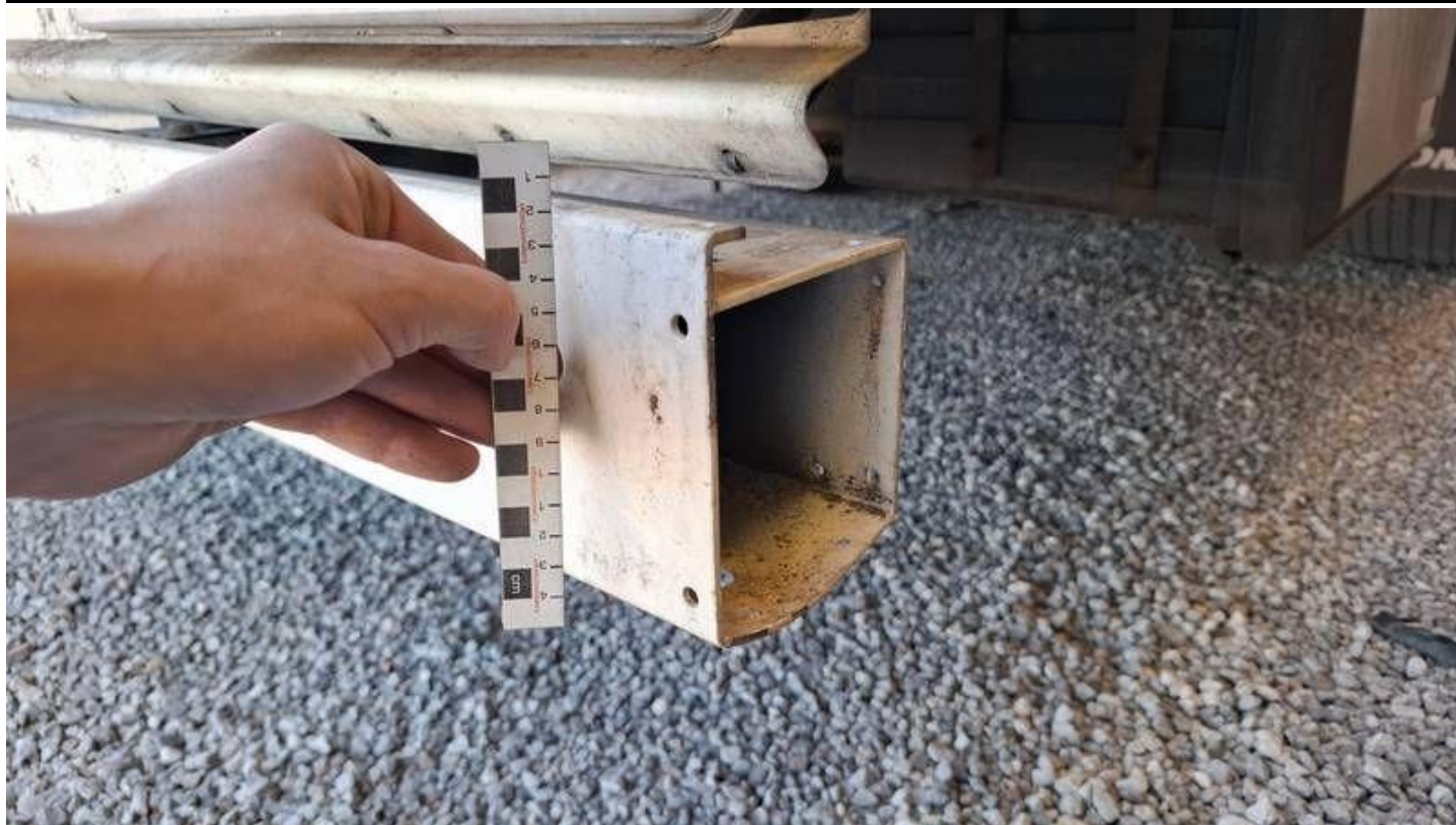
Fot. nr 23