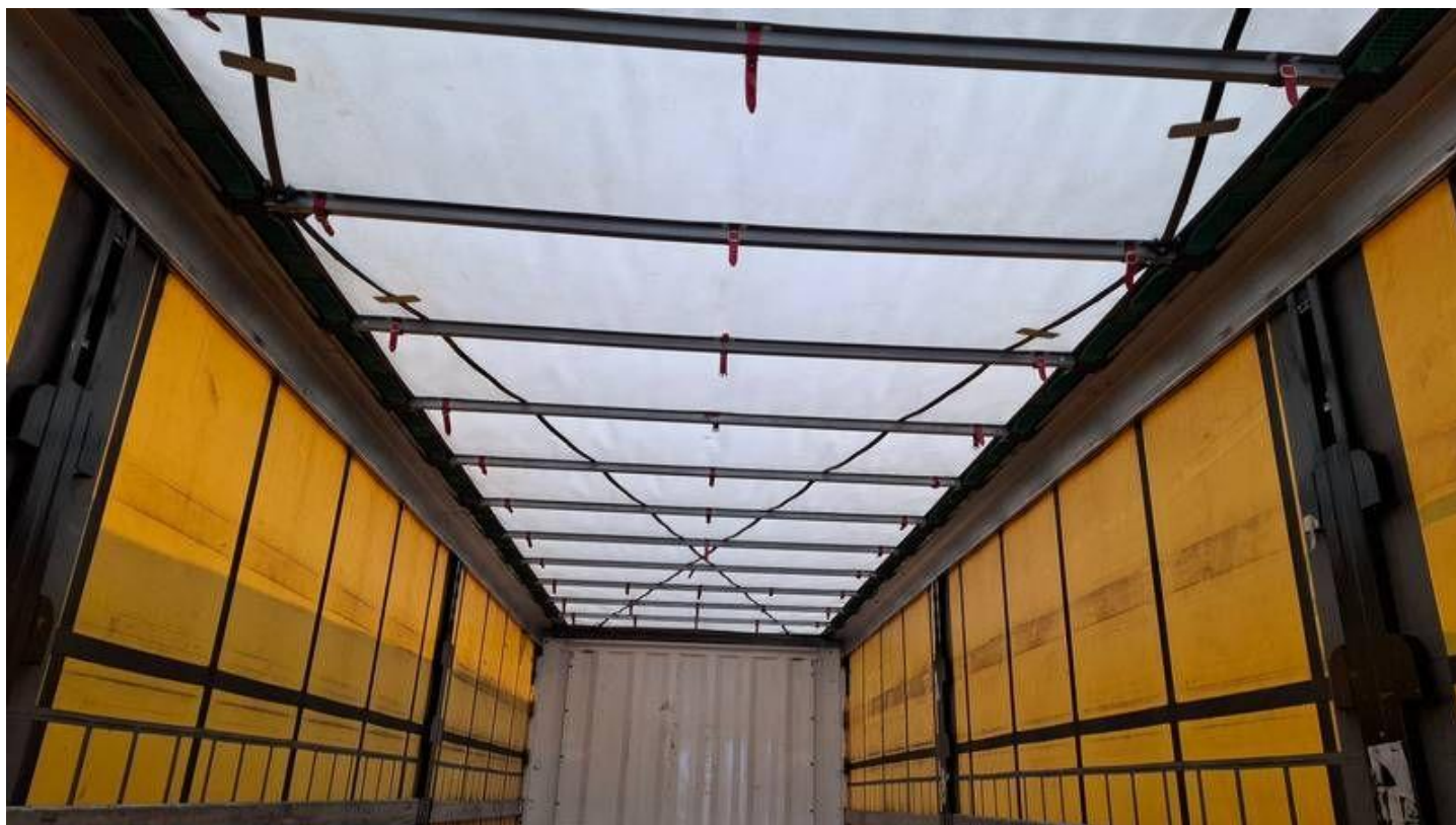
Fot. nr 36