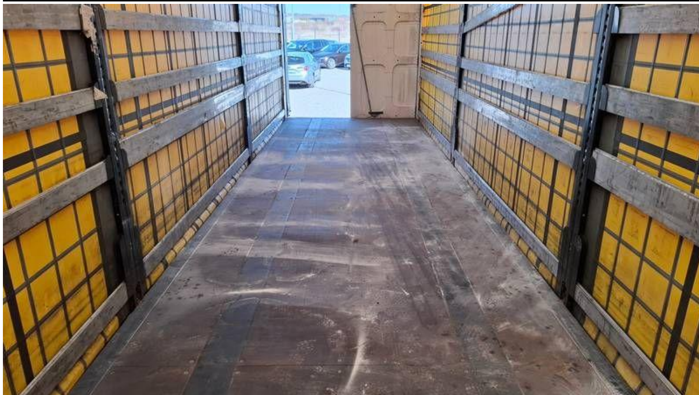
Fot. nr 37