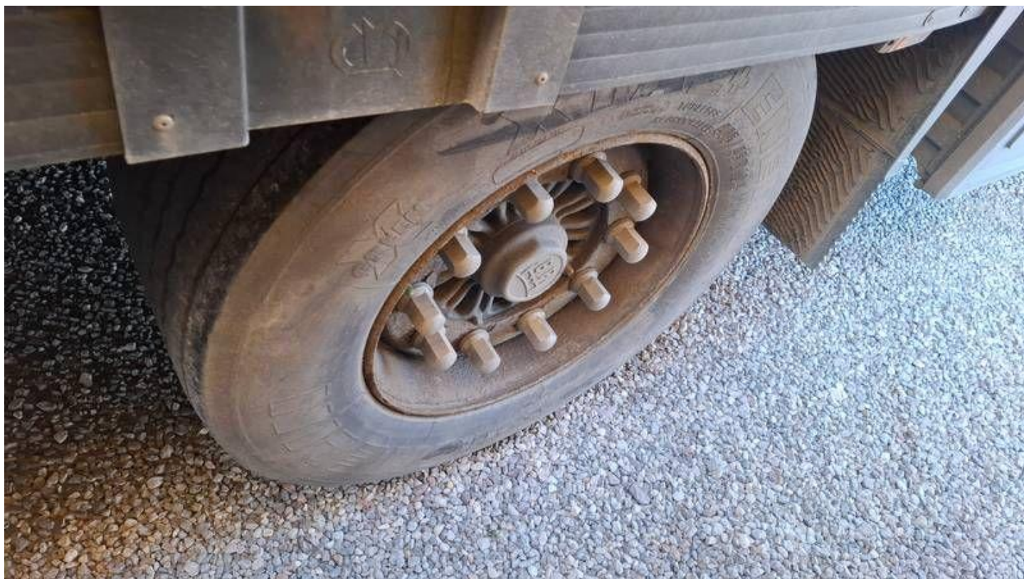
Fot. nr 46