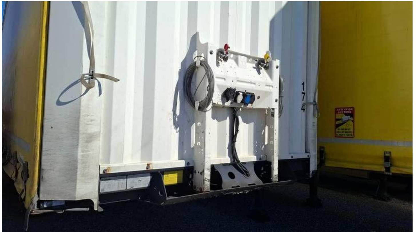
Fot. nr 10