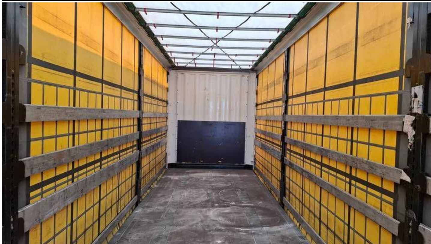
Fot. nr 35