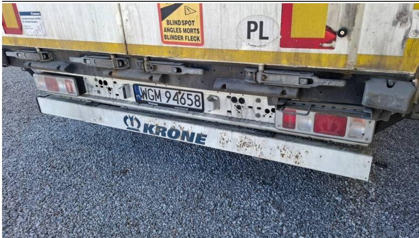
Fot. nr 17