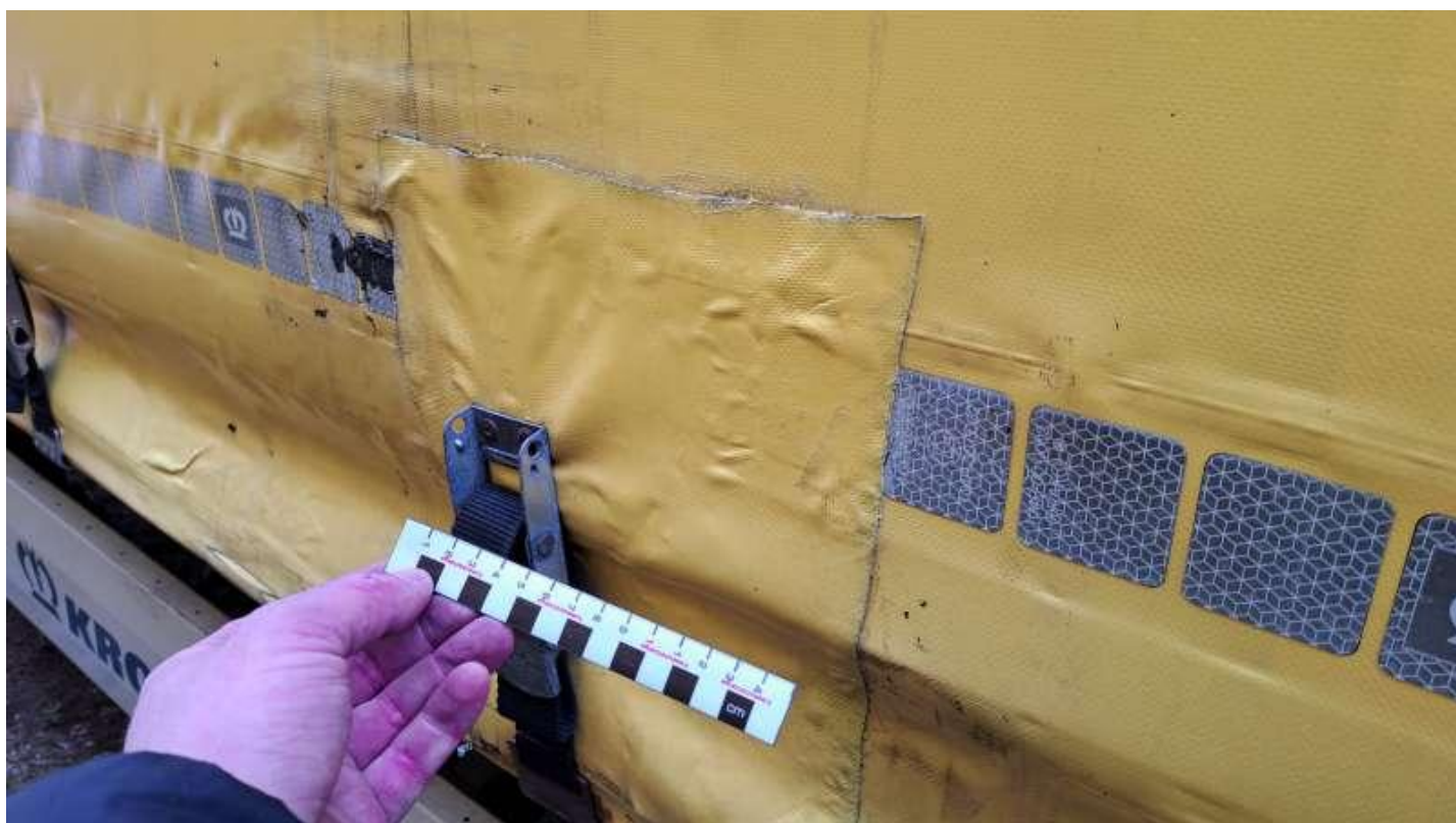
Fot. nr 37