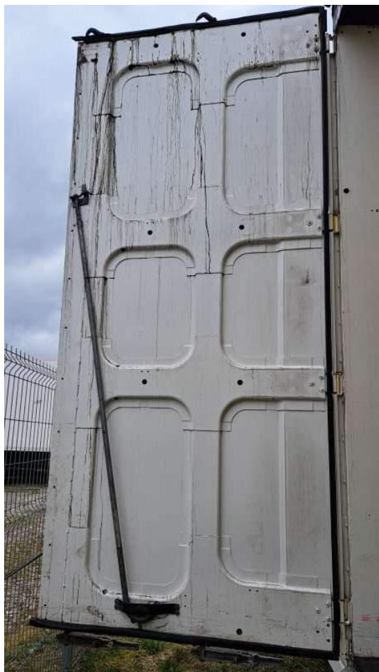
Fot. nr 41