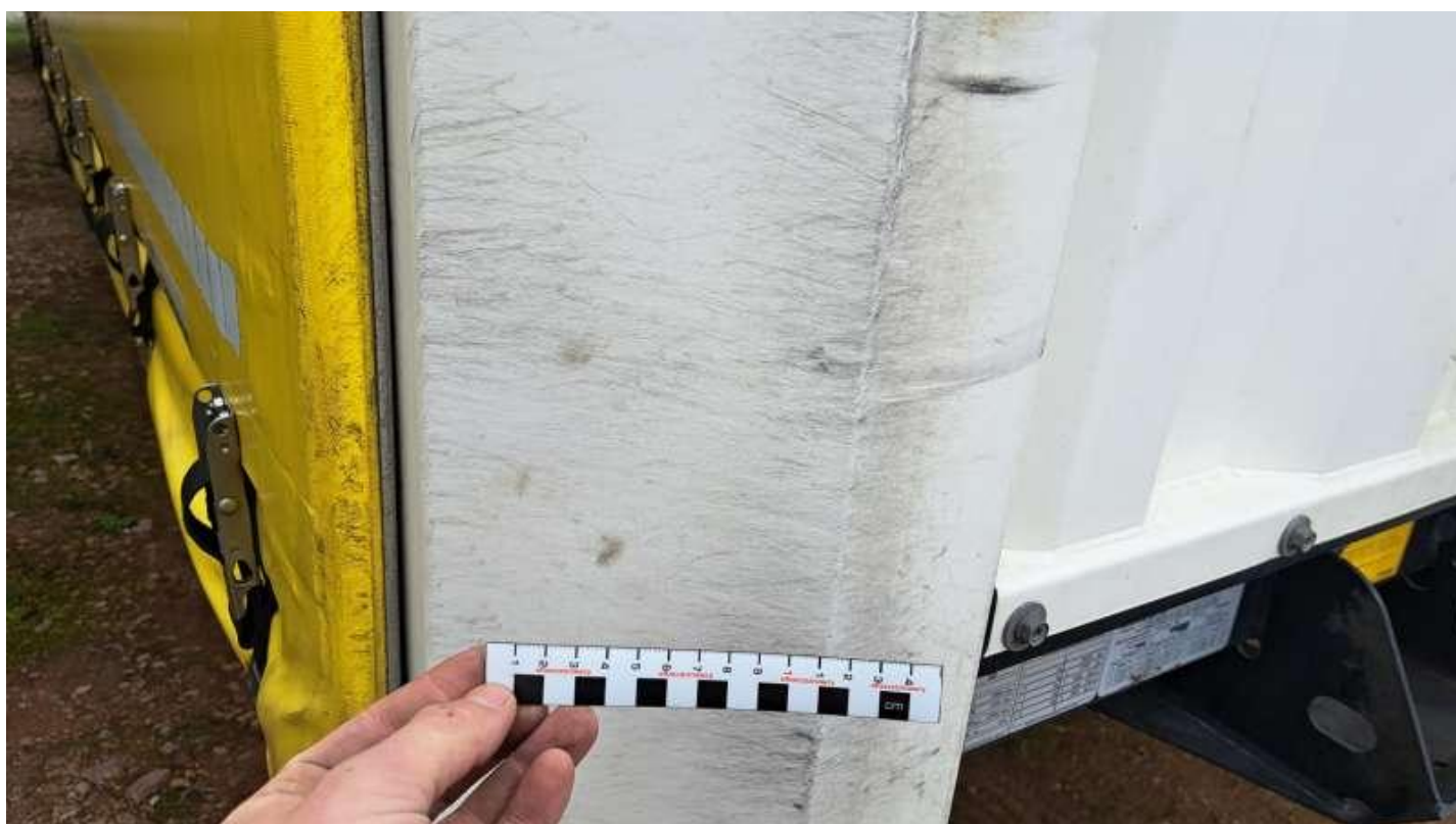
Fot. nr 16