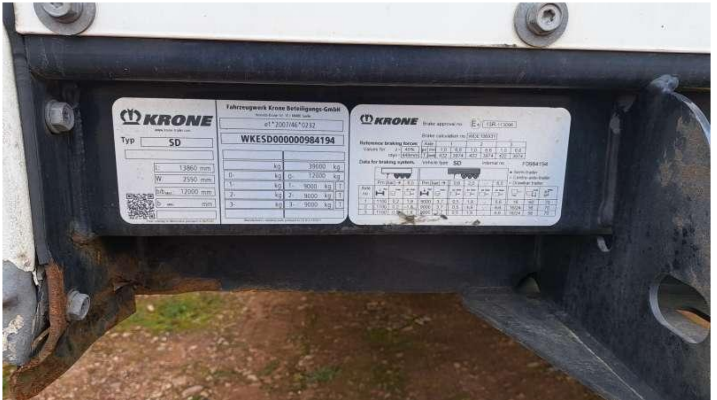
Fot. nr 7