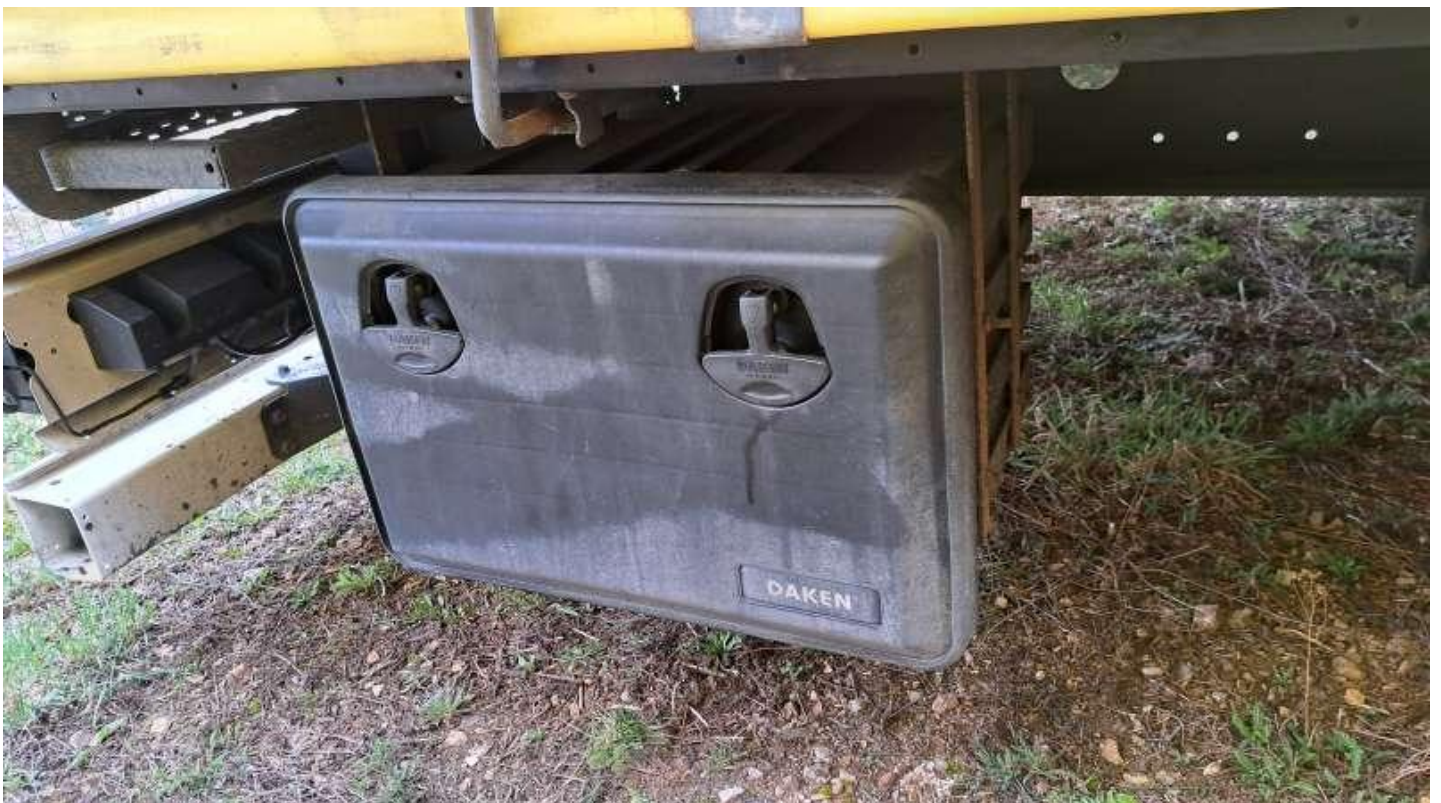
Fot. nr 24