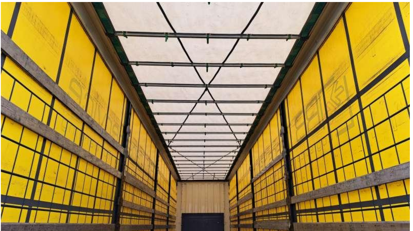
Fot. nr 44