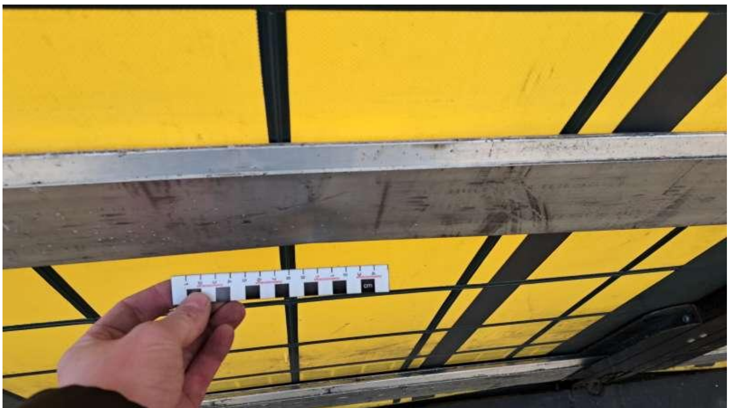
Fot. nr 50