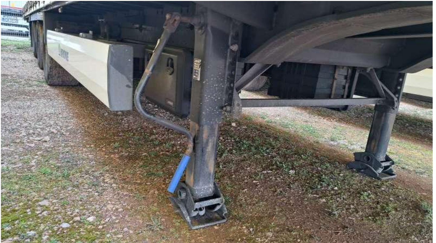
Fot. nr 17