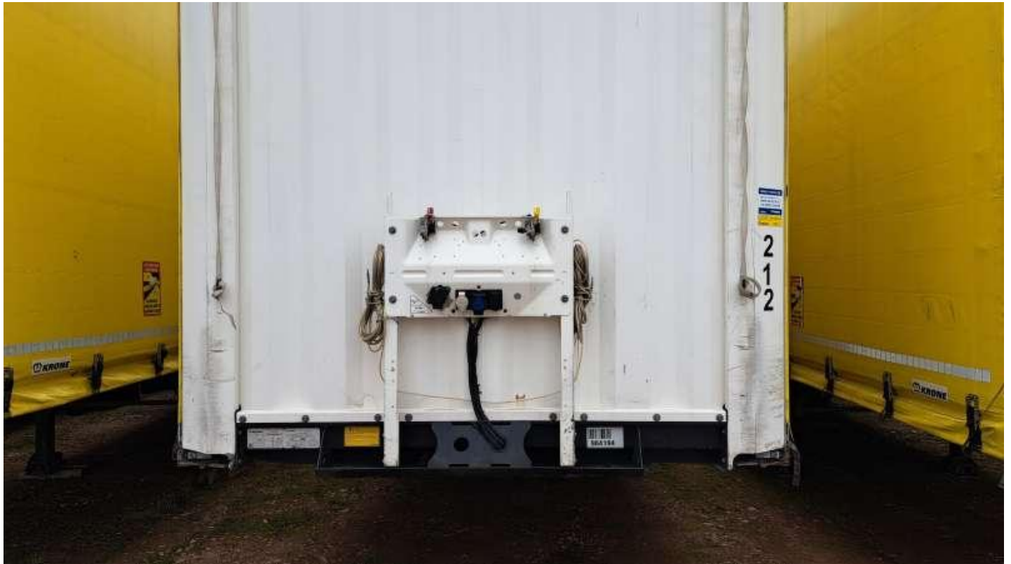
Fot. nr 9