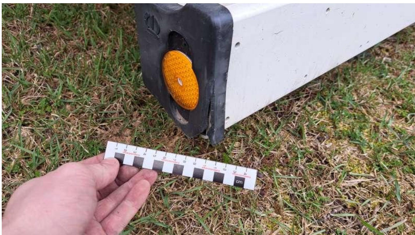
Fot. nr 30