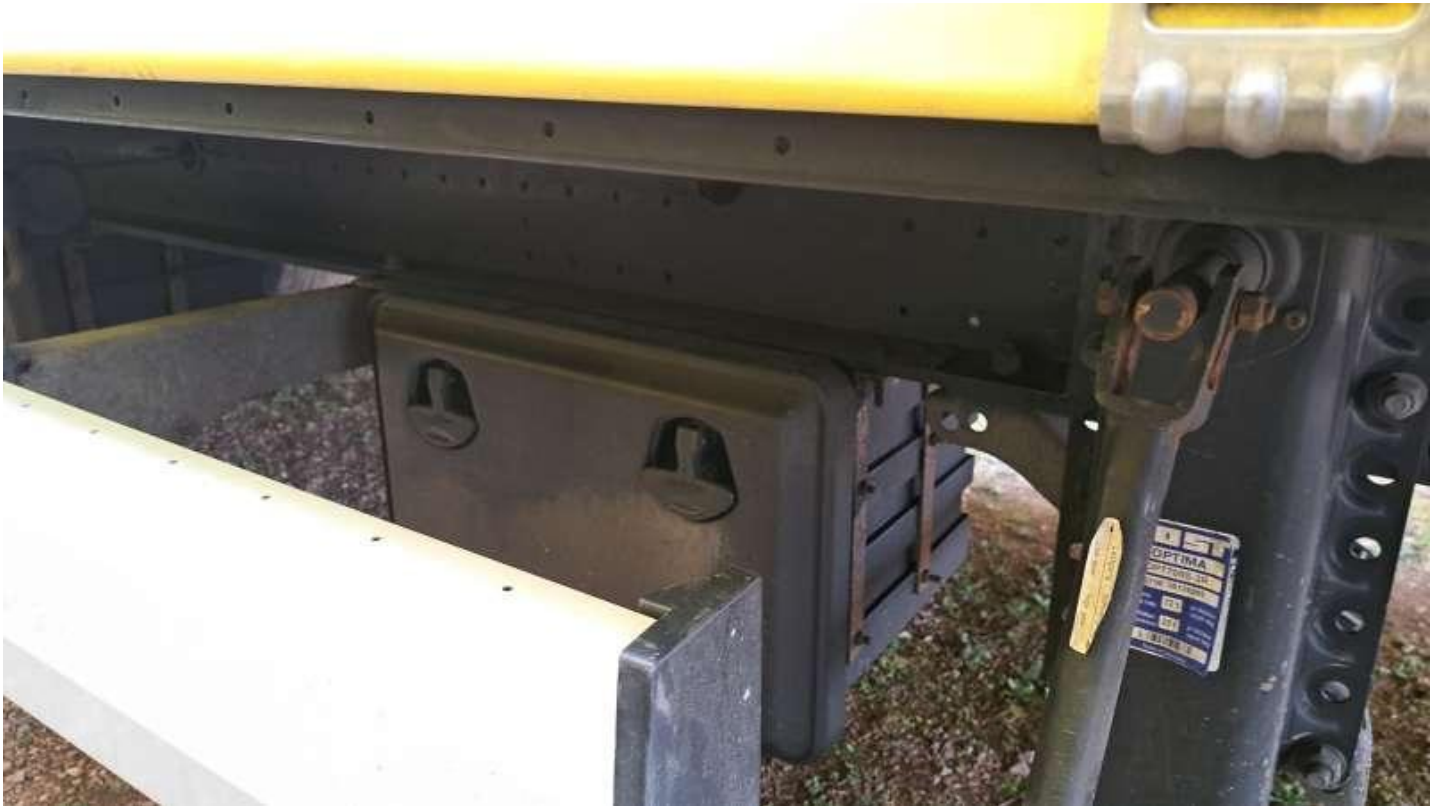
Fot. nr 19