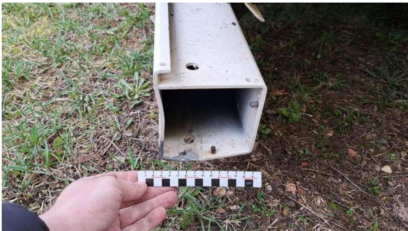
Fot. nr 28