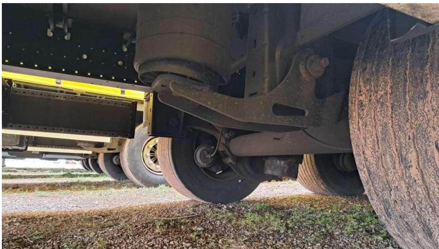
Fot. nr 35