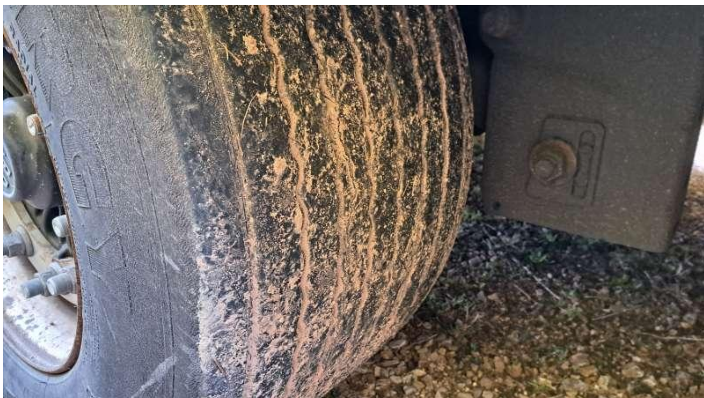
Fot. nr 57