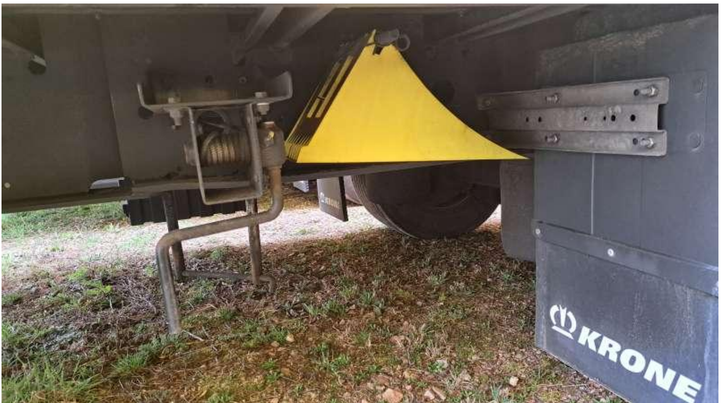
Fot. nr 22