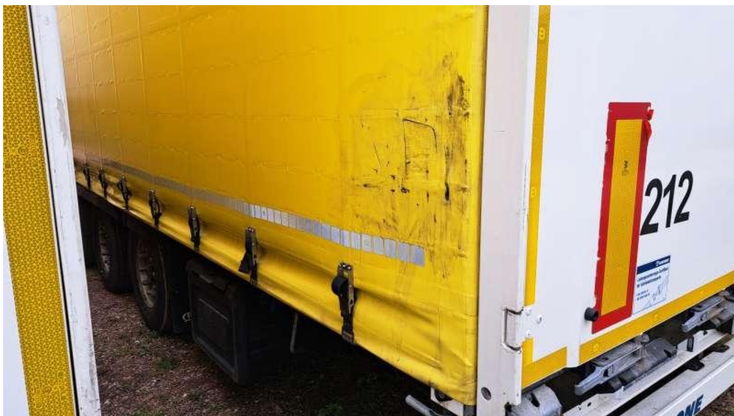
Fot. nr 31