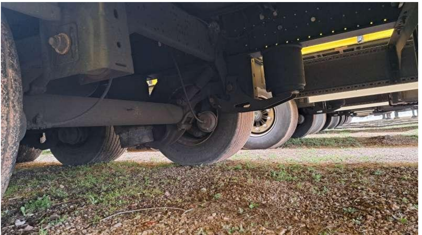
Fot. nr 20