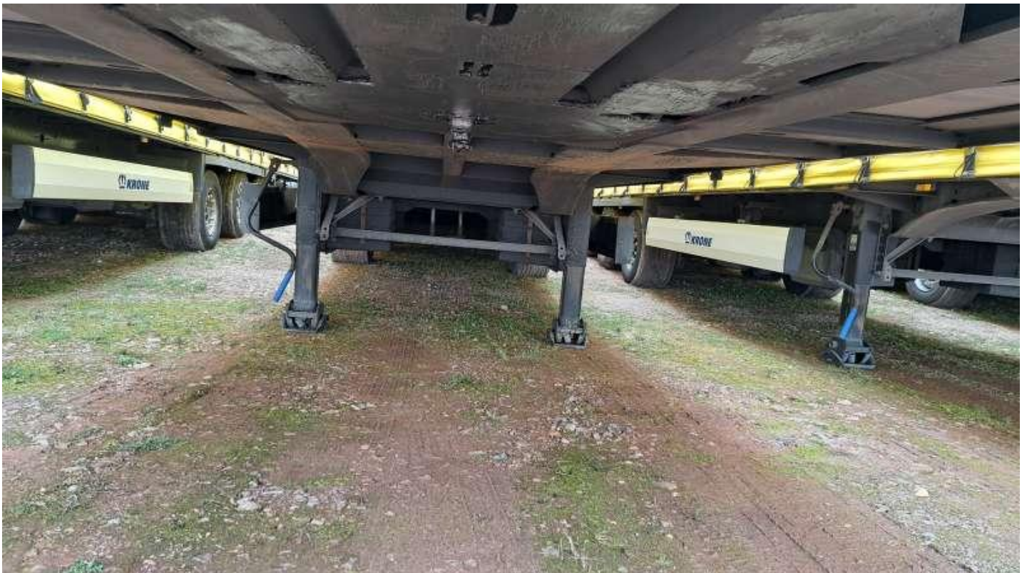
Fot. nr 12