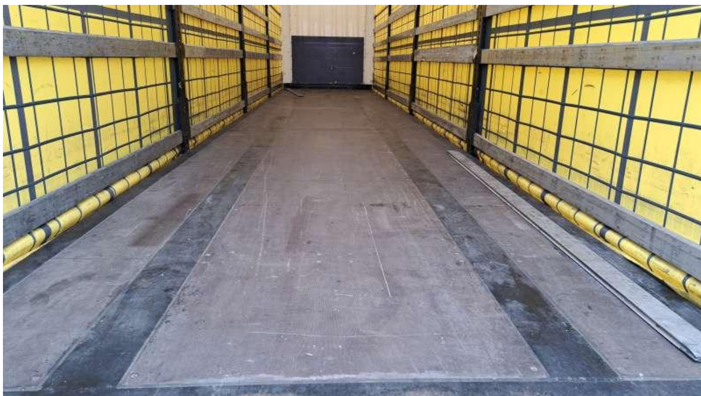
Fot. nr 47