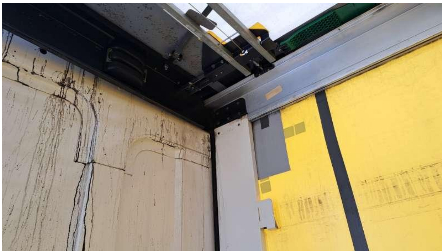
Fot. nr 53