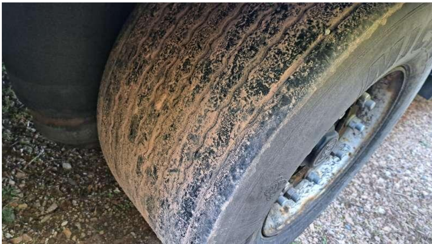
Fot. nr 59