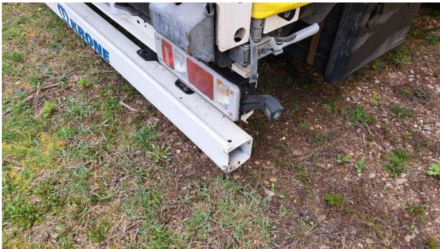
Fot. nr 27