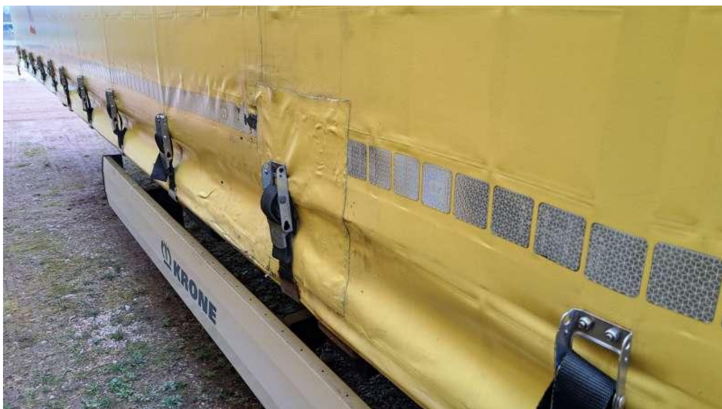
Fot. nr 36