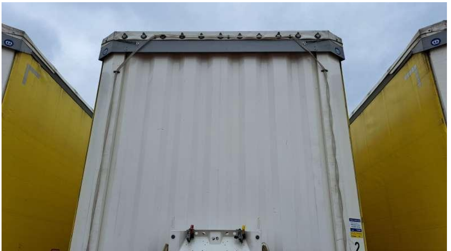
Fot. nr 8