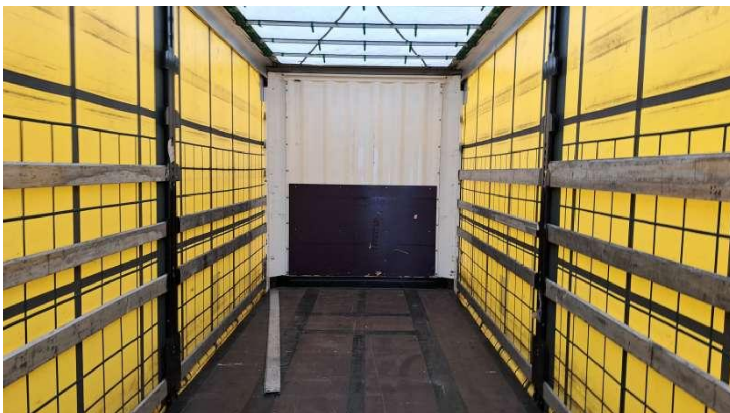
Fot. nr 48