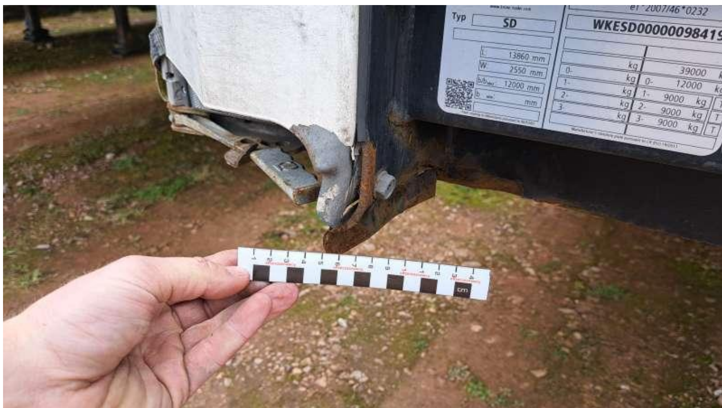
Fot. nr 15