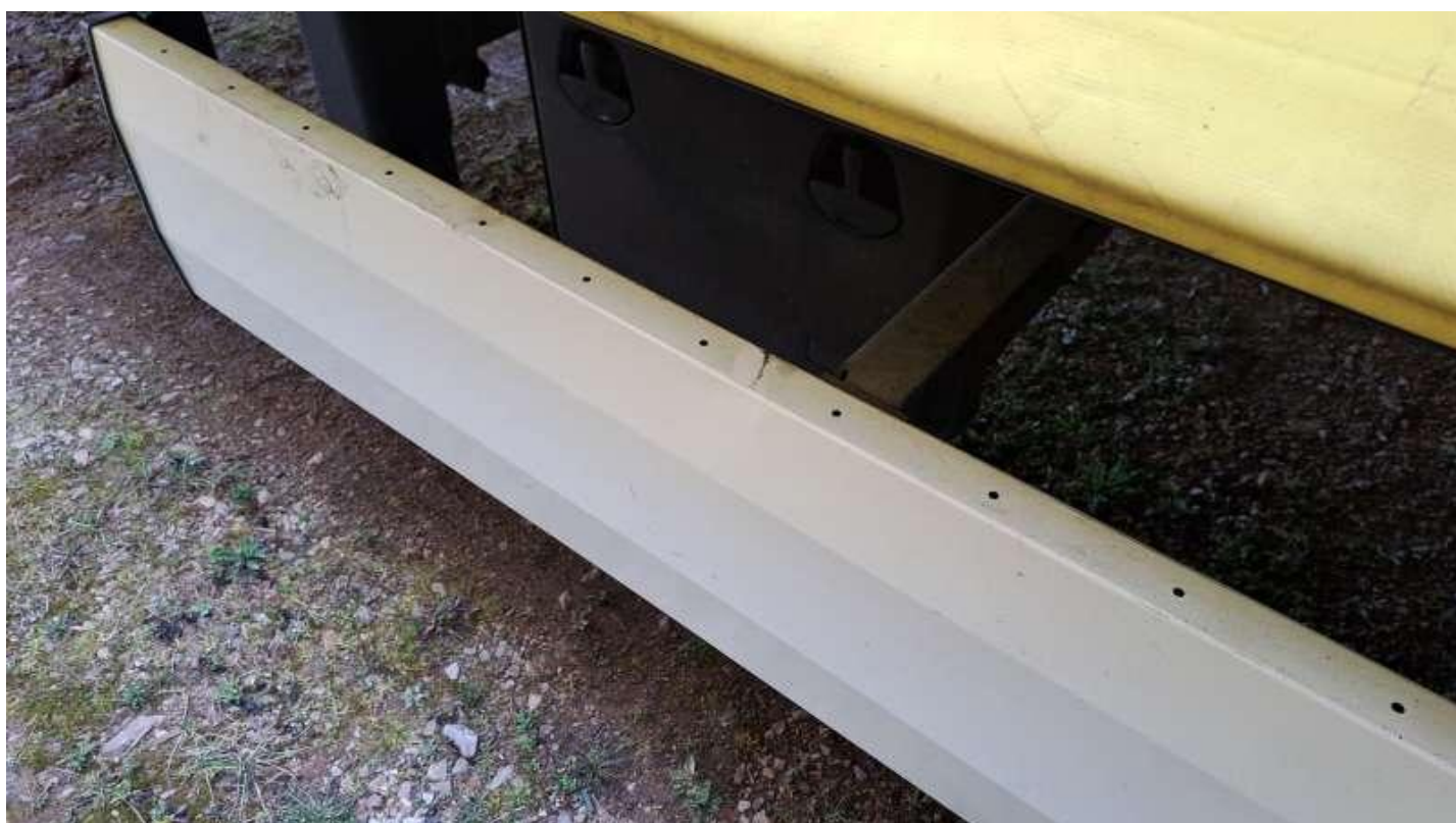
Fot. nr 38