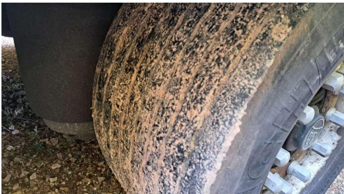
Fot. nr 58