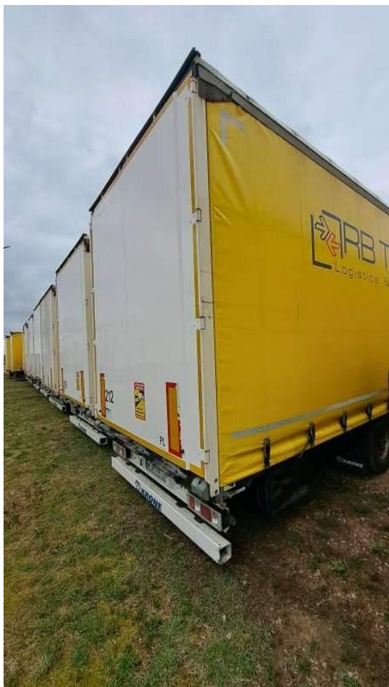
Fot. nr 4