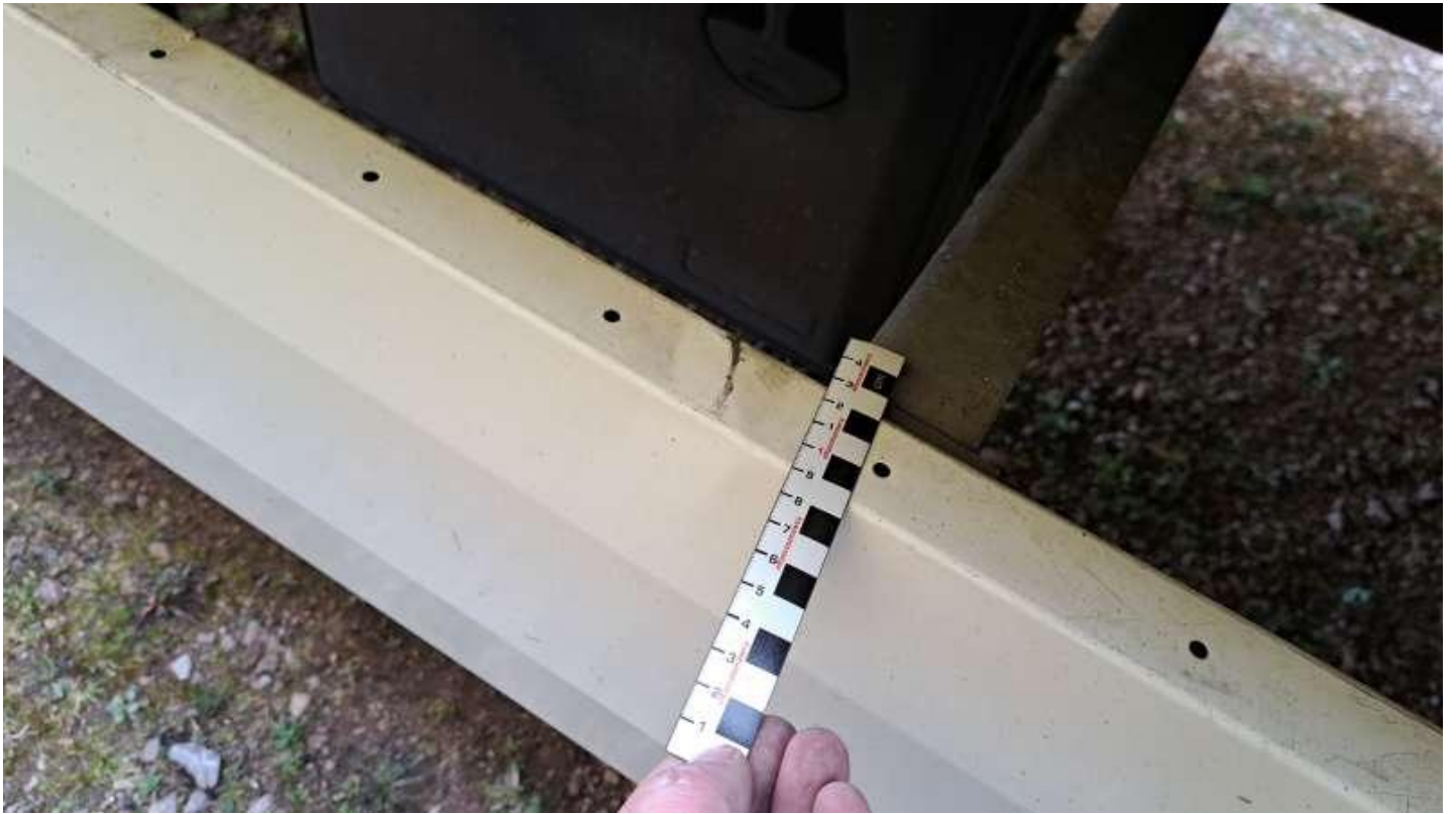
Fot. nr 39