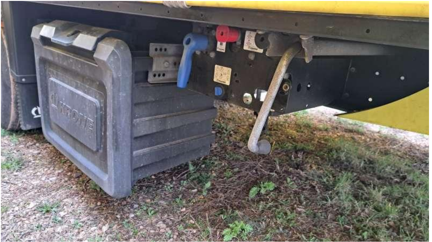
Fot. nr 33