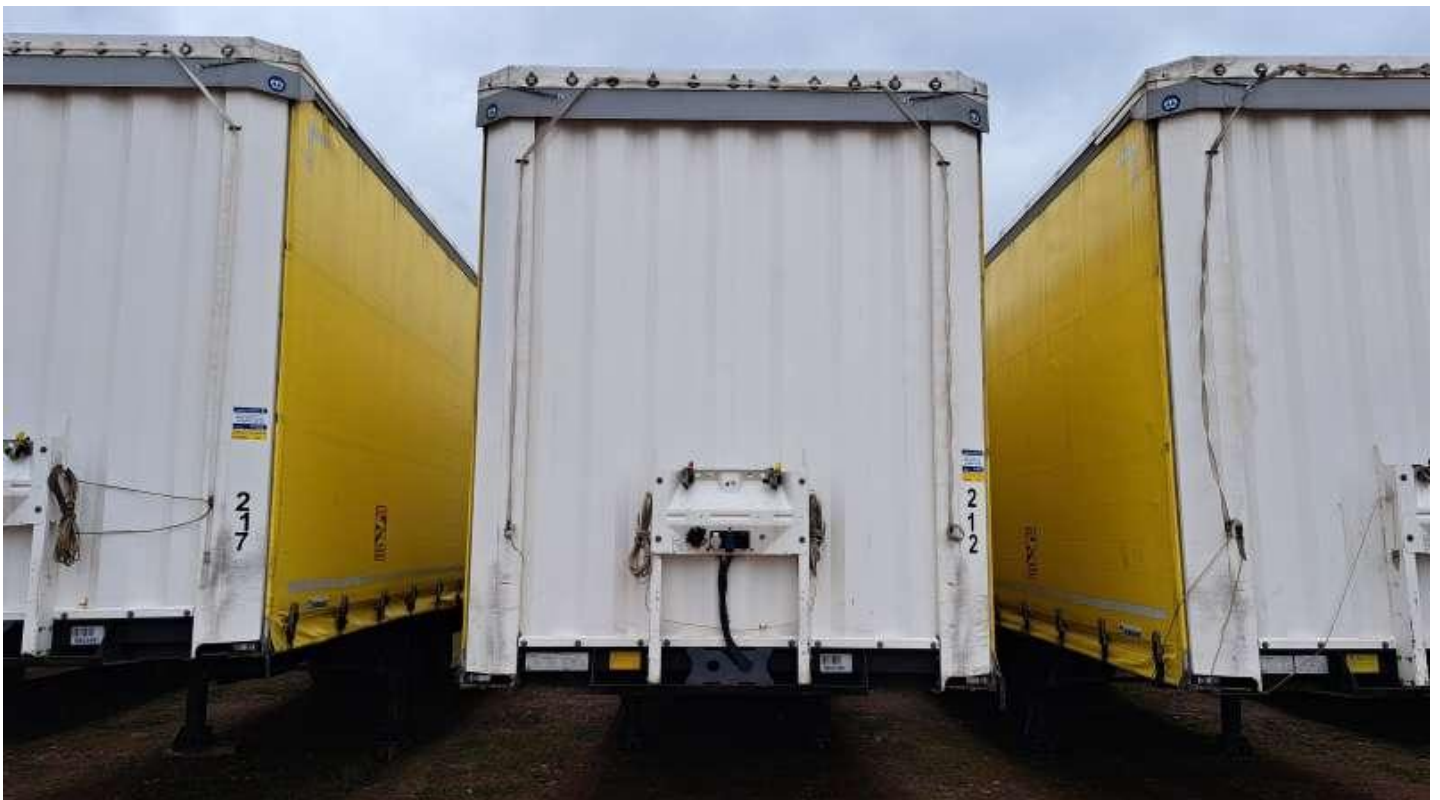
Fot. nr 2