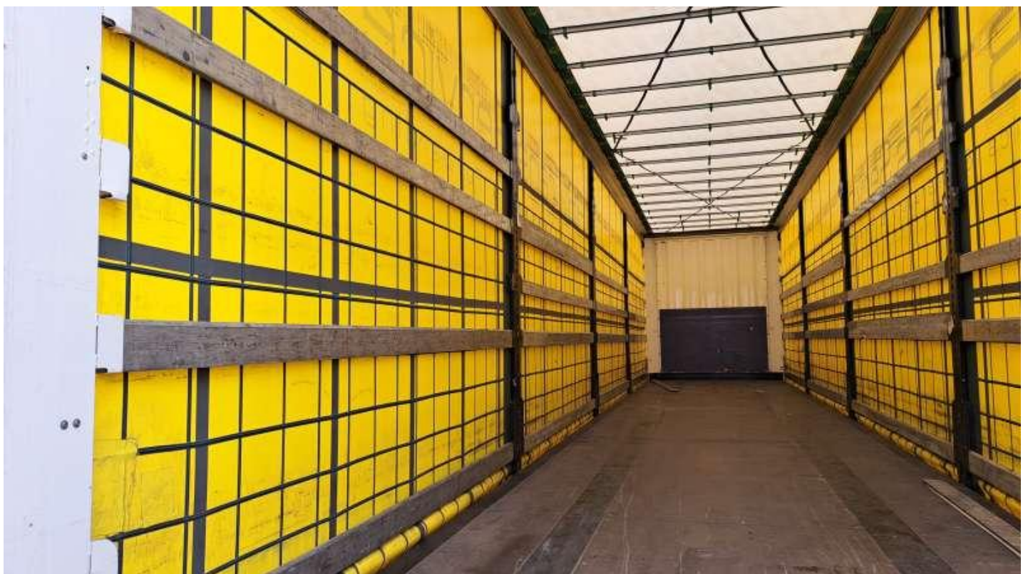
Fot. nr 46