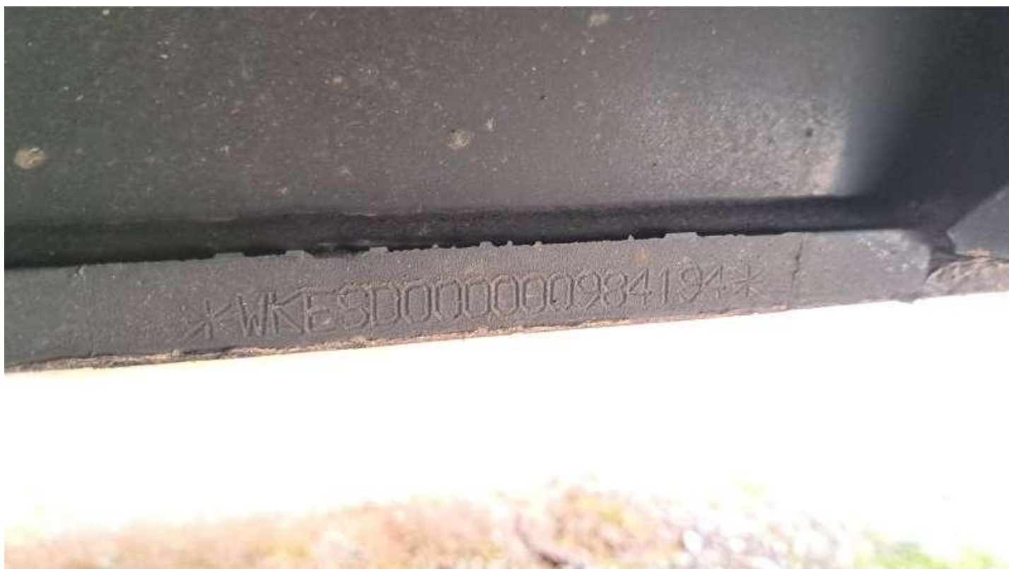
Fot. nr 6