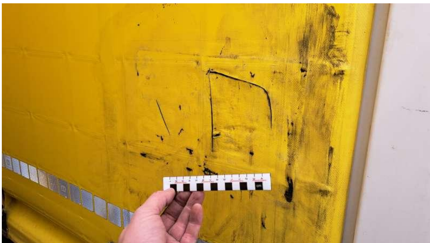
Fot. nr 32