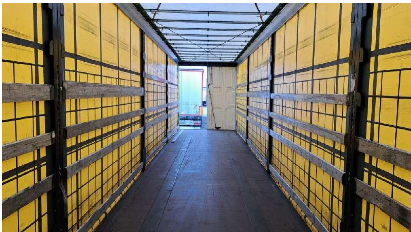
Fot. nr 52