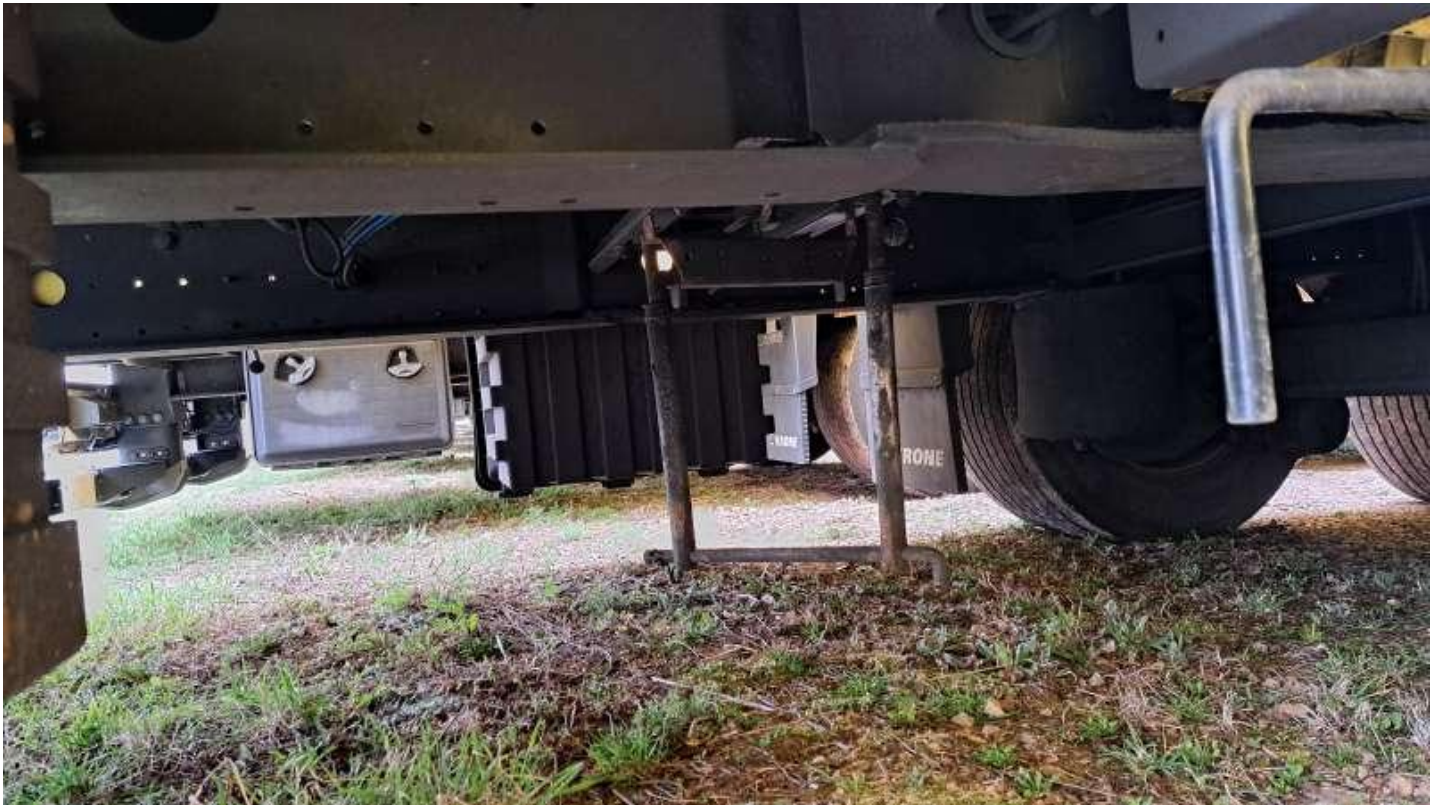
Fot. nr 23