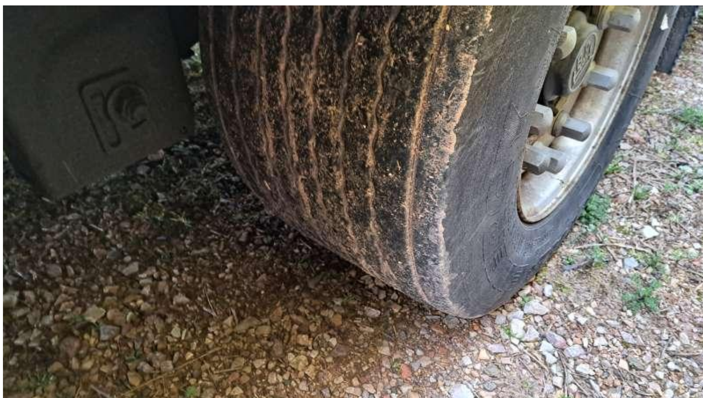
Fot. nr 56