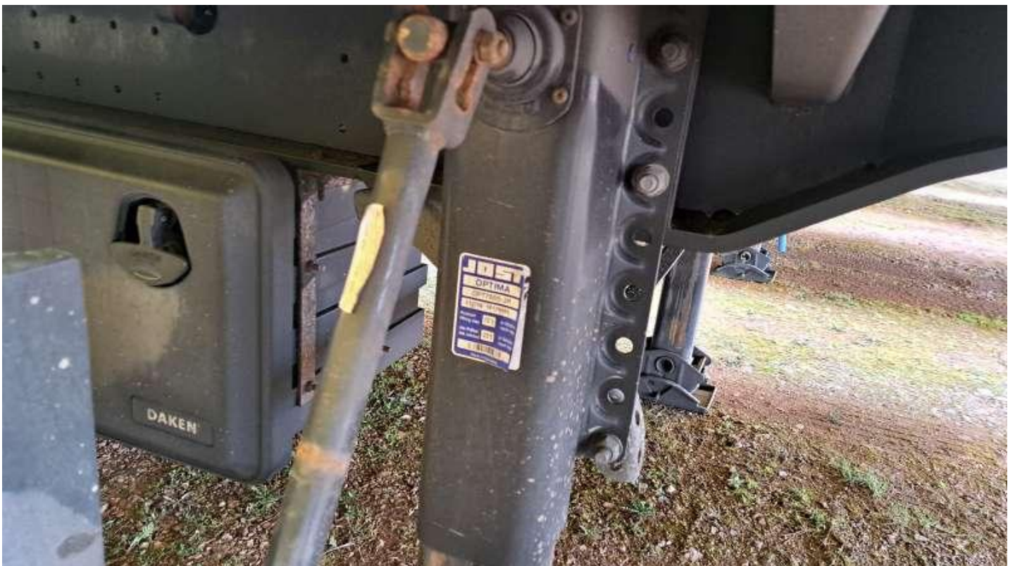
Fot. nr 18