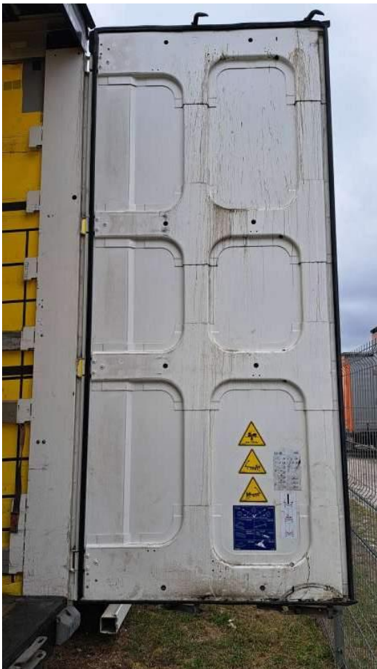
Fot. nr 40