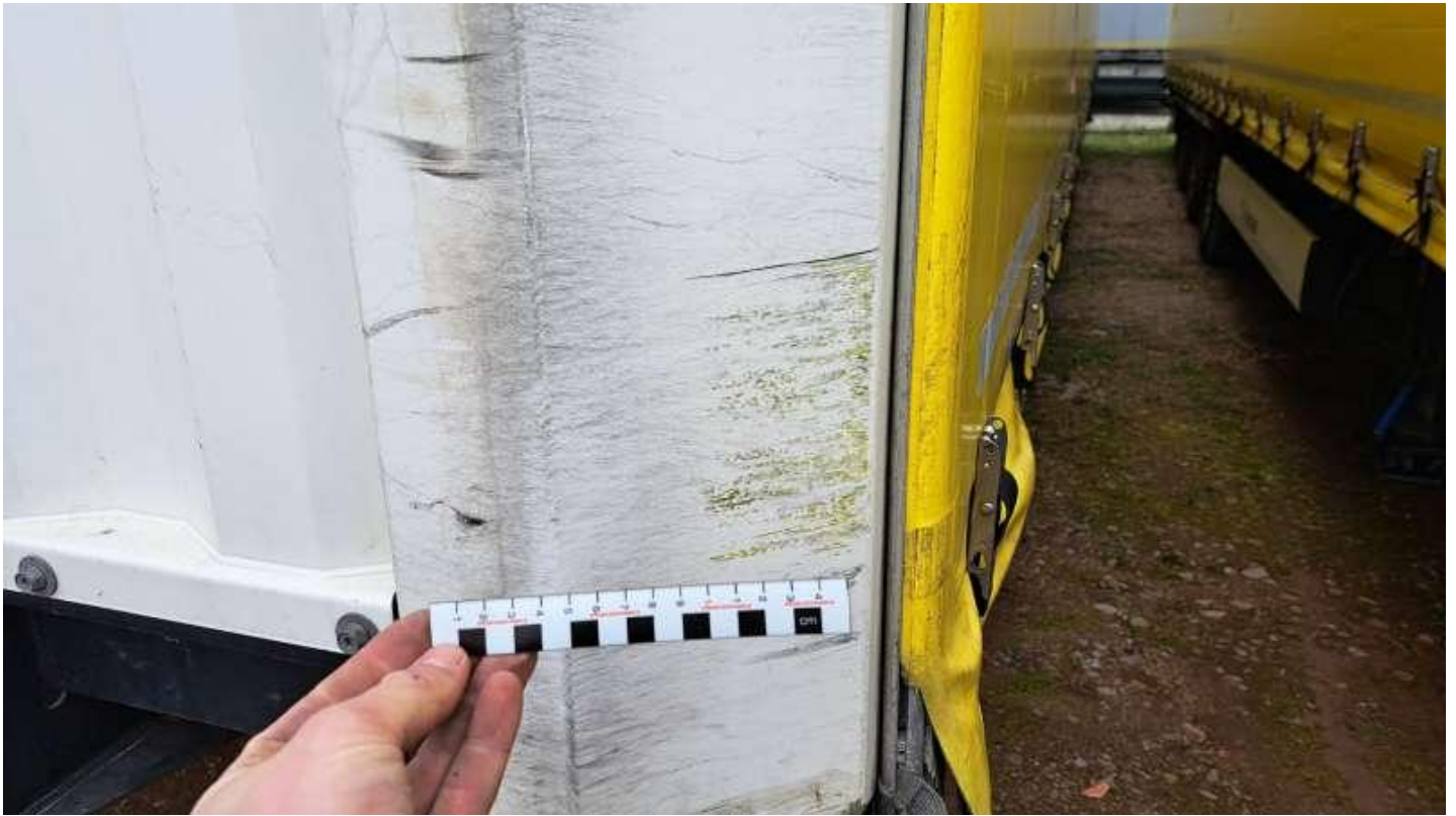
Fot. nr 11