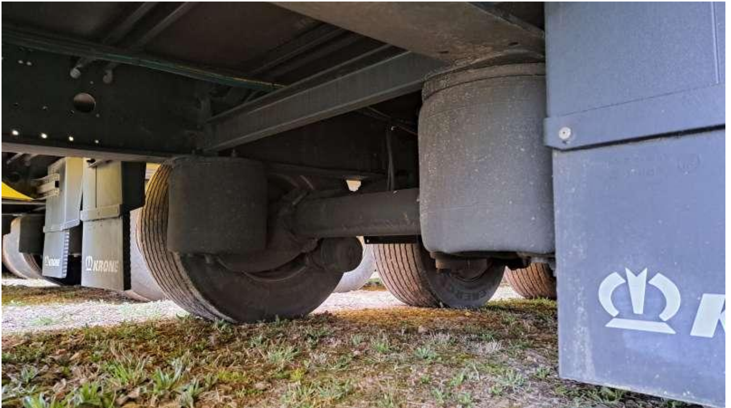
Fot. nr 21