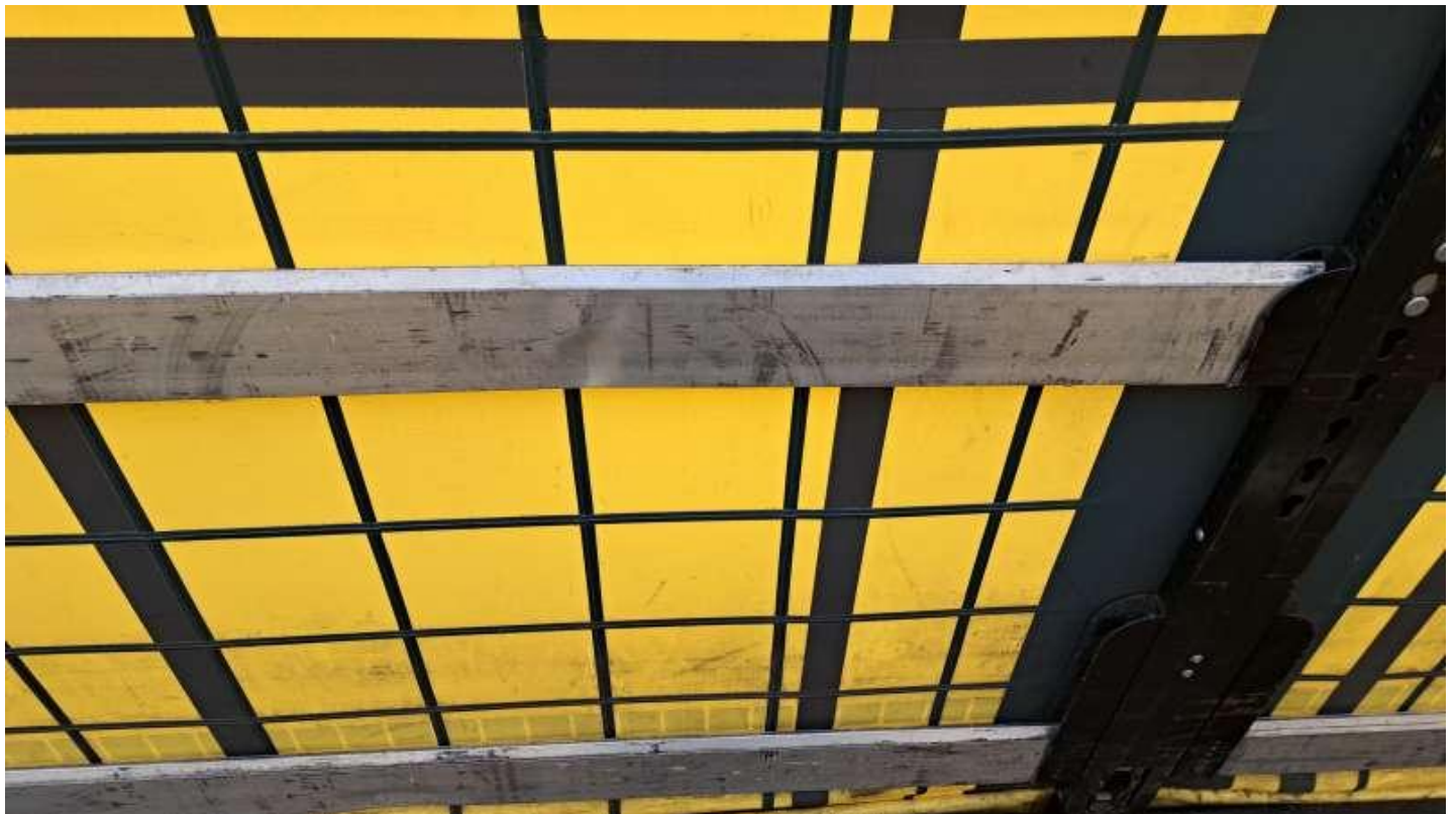
Fot. nr 49