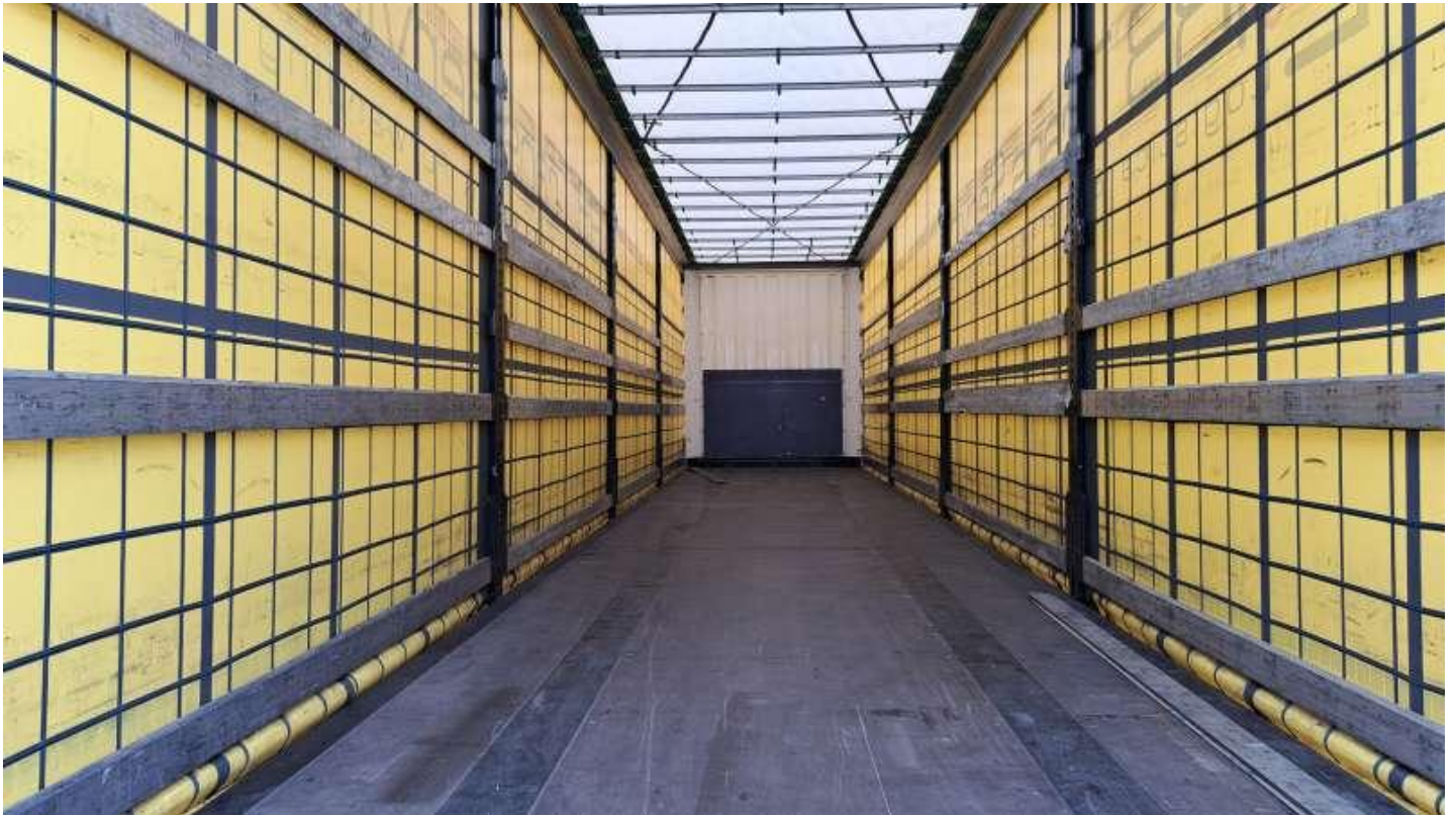
Fot. nr 43