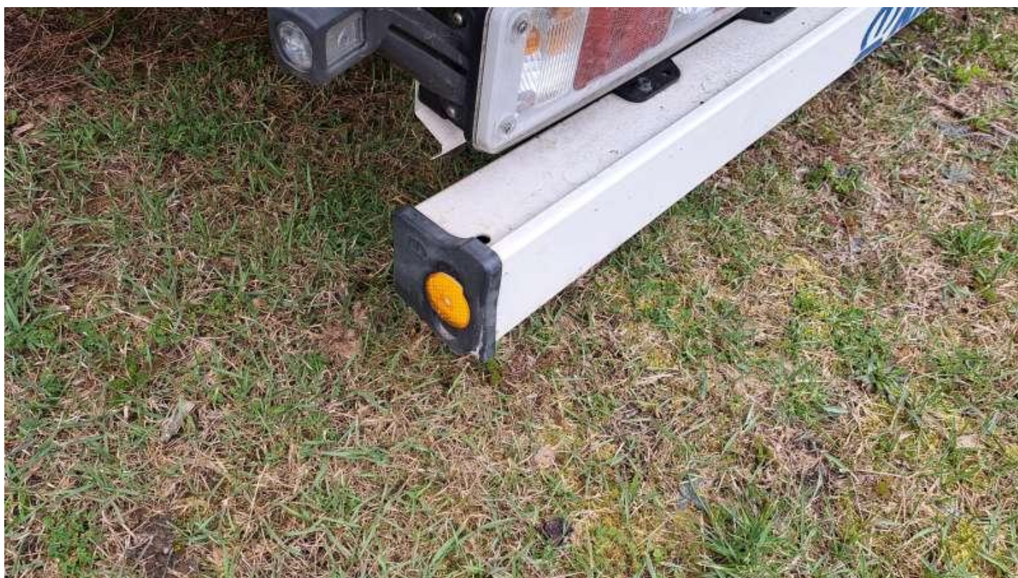
Fot. nr 29