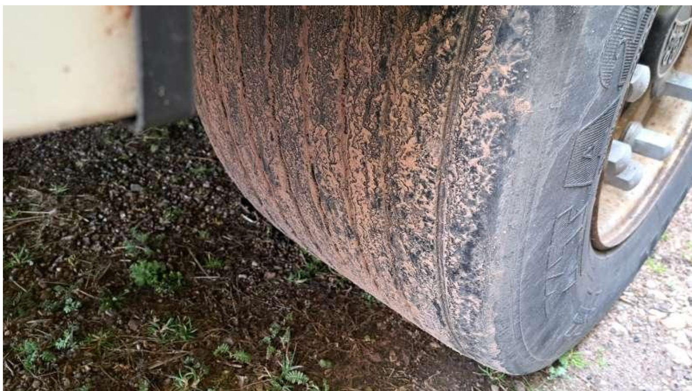
Fot. nr 54