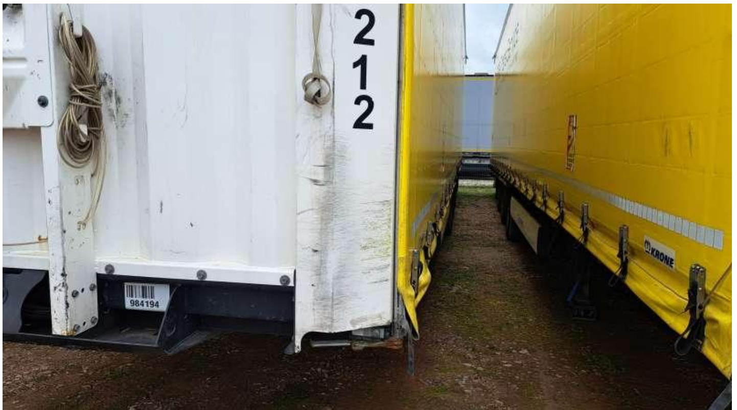
Fot. nr 10