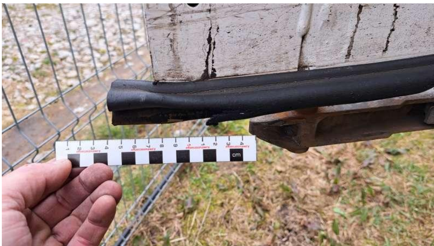
Fot. nr 42