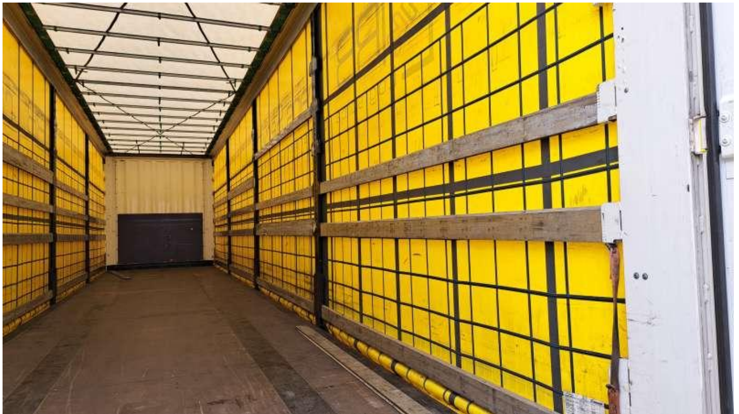
Fot. nr 45