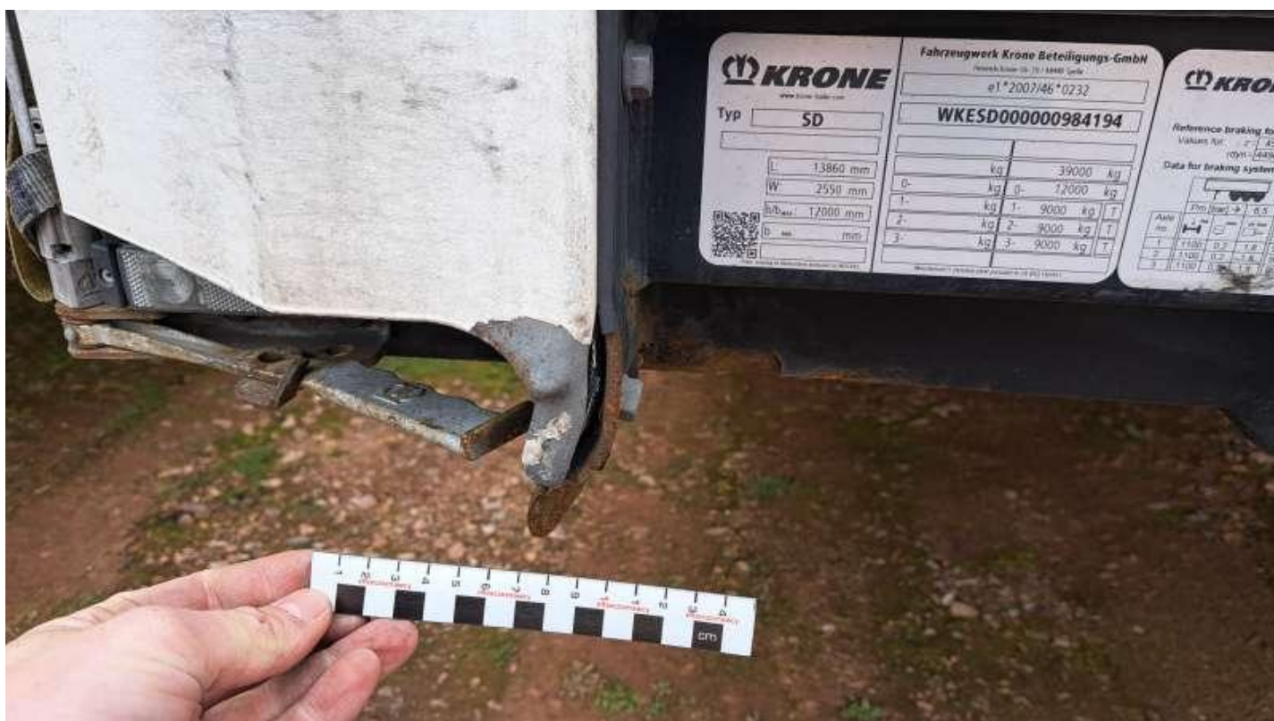
Fot. nr 14