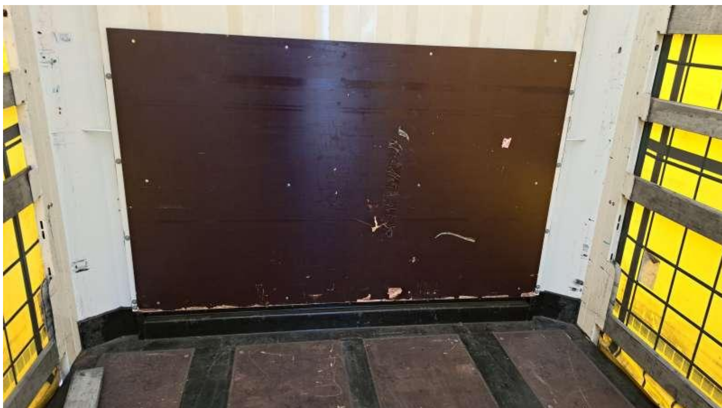
Fot. nr 51