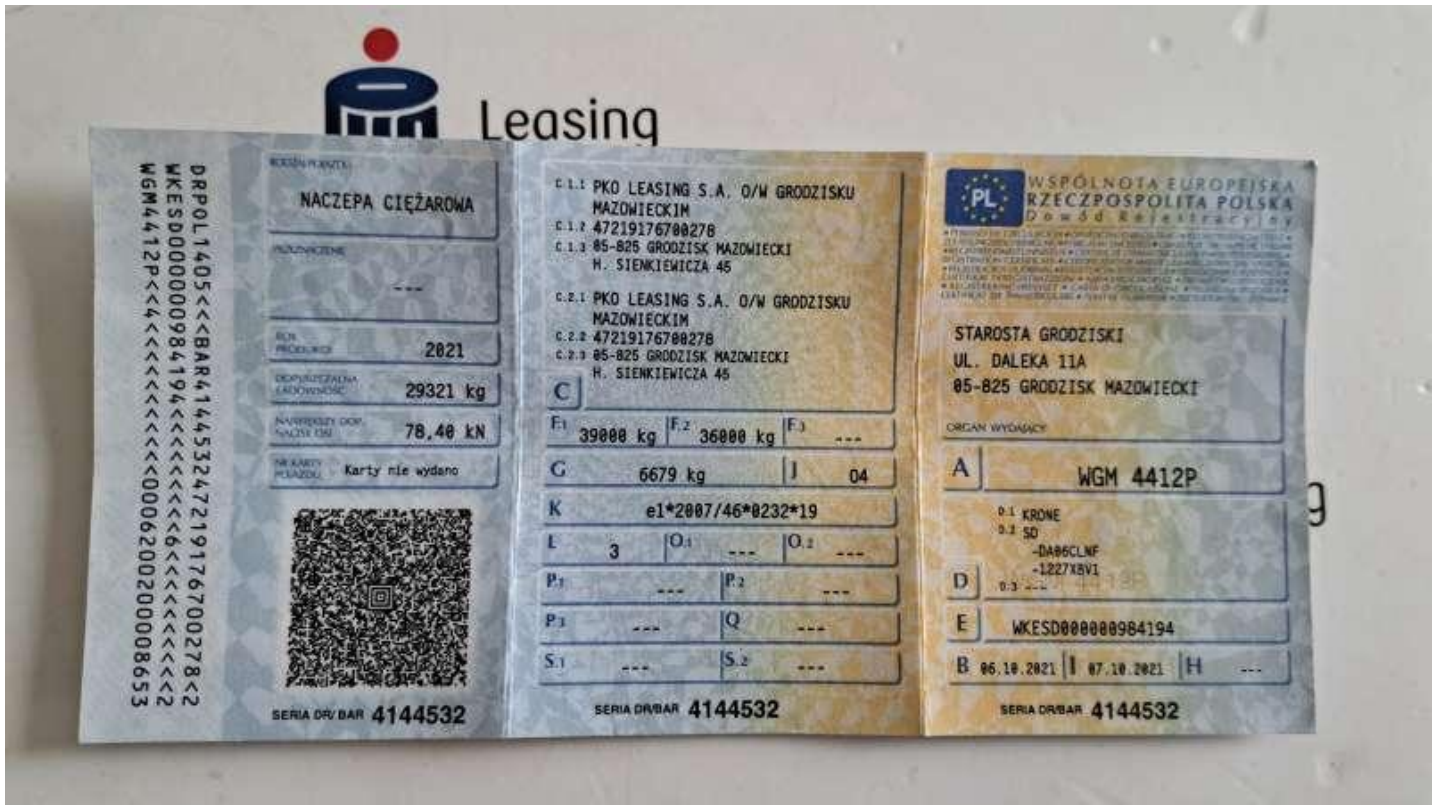
Fot. nr 61