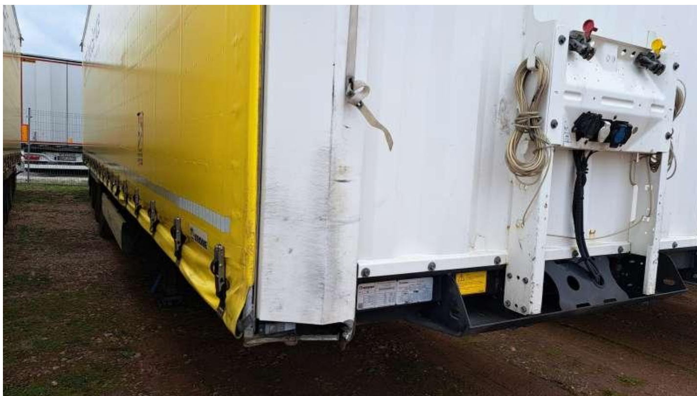
Fot. nr 13