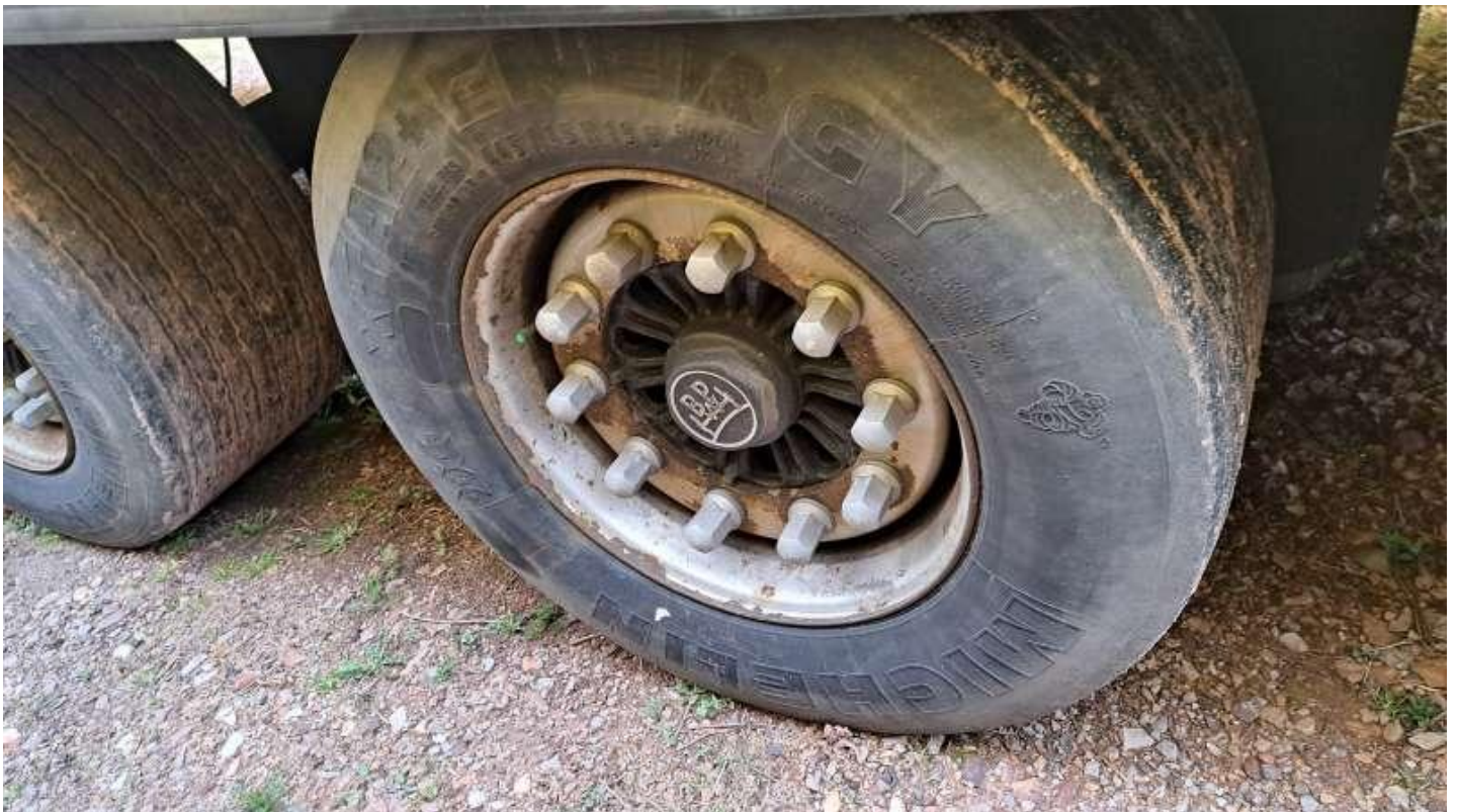
Fot. nr 34