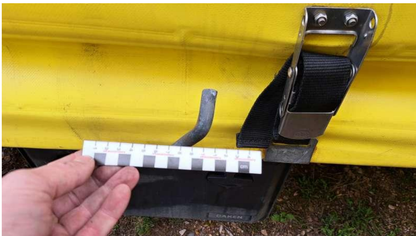
Fot. nr 26