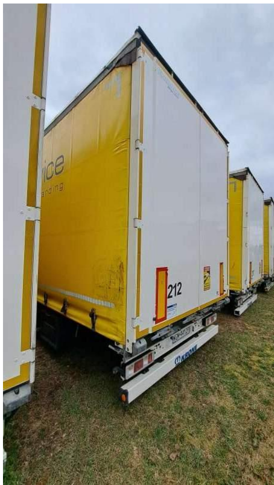
Fot. nr 5