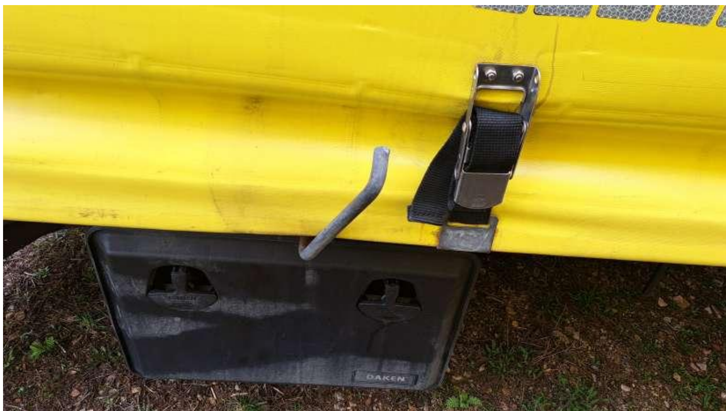
Fot. nr 25